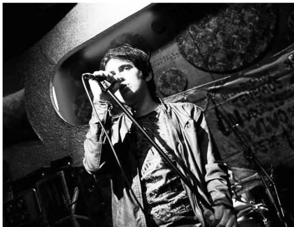
EL JOVEN CANTAUTOR se encuentra en diversos proyectos, entre esto su primer disco como solista titulado “Crudo y natural”.

componer con distintos instrumentos y pudo también conocer el valor de su pasión.