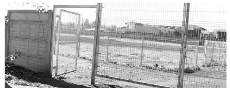
SESENTA DOSIS DE PASTA BASE fueron decomisadas en el Club Deportivo Vicuña Mackenna.

“A nivel país son dos mil puntos los que se levantan. Las metas hasta el momento han sido superar en 30% la intervención, objetivos que se han cumplido. Este año se va a ampliar el programa. El grupo MTO de la Brianco de Los Ángeles superó en el 2017 el 60% de los puntos intervenidos”, concluyó el comisario Bravo.