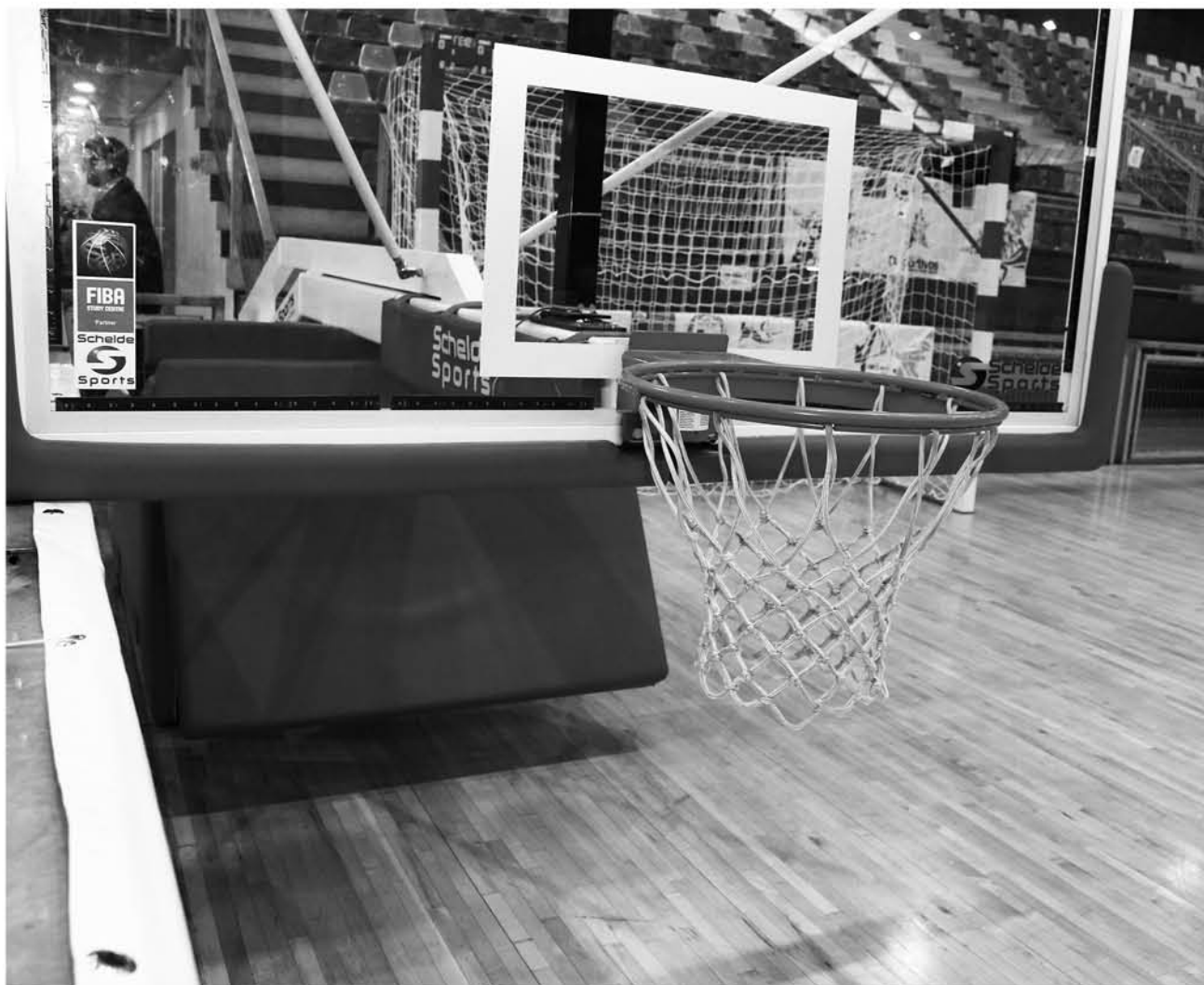
EL BÁSQUETBOL sacudido por la polémica entre los dos técnicos.

Igualmente, detalló que "luego se hará una invitación a los directores, porque nuevamente la liga hará entrega de implementación deportiva y esta vez vamos a entregar ocho equipos más de regalo, con un proyecto que ganó la liga estudiantil, entre ellos se les hará entrega al Padre Hurtado, Liceo Santa María, Colegio San Ignacio, Liceo Comercial, el Ceala y otros más, así que estamos contentos y vamos a seguir trabajando como lo hemos venido haciendo todos estos años".