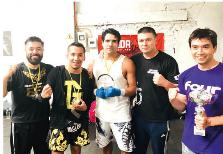
LOS REPRESENTANTES ANGELINOS ganaron sus respectivas categorías.

Cabe destacar que a pesar de sus raíces este deporte no puede ser considerado un arte marcial sino justamente un deporte de contacto o deporte de ring, ya que no posee o promulga una filosofía, o código de conducta a sus practicantes.