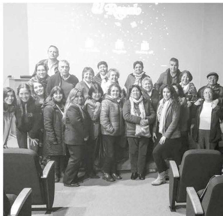
EL PROYECTO CICLO de cine se llevó a cabo en el marco del Día del Alzheimer.

La presidenta de la agrupación de Alzheimer y Demencia, comenta que a raíz de que la enfermedad está ausente del Plan Auge, y es imperiosa la necesidad de los que la padecen tener beneficios para adquirir medicamentos y terapias, se están llevando a cabo movimientos nacionales para pedirle a la autoridad sea inserta en el plan de coberturas de salud “la Corporación Profesional Alzheimer y otras demencias (Coprada) lidera una petición abierta para solicitar el beneficio, el llamado es a colaborar con ella; pueden encontrar más información en nuestro facebook Alzheimer Los Ángeles Lach donde estamos constantemente compartiendo artículos de interés al respecto”.