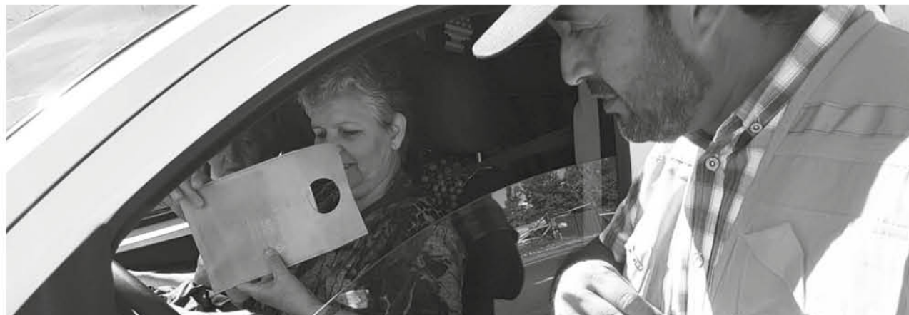
LOS FUNCIONARIOS APROVECHARON de entregar material informativo a los automovilistas que pasaron frente a la estación ferroviaria de Villa Coigüe.

Actividad tuvo como objetivo concientizar a la comunidad respecto de los riesgos que involucra hacer uso del fuego en lugares al aire libre.