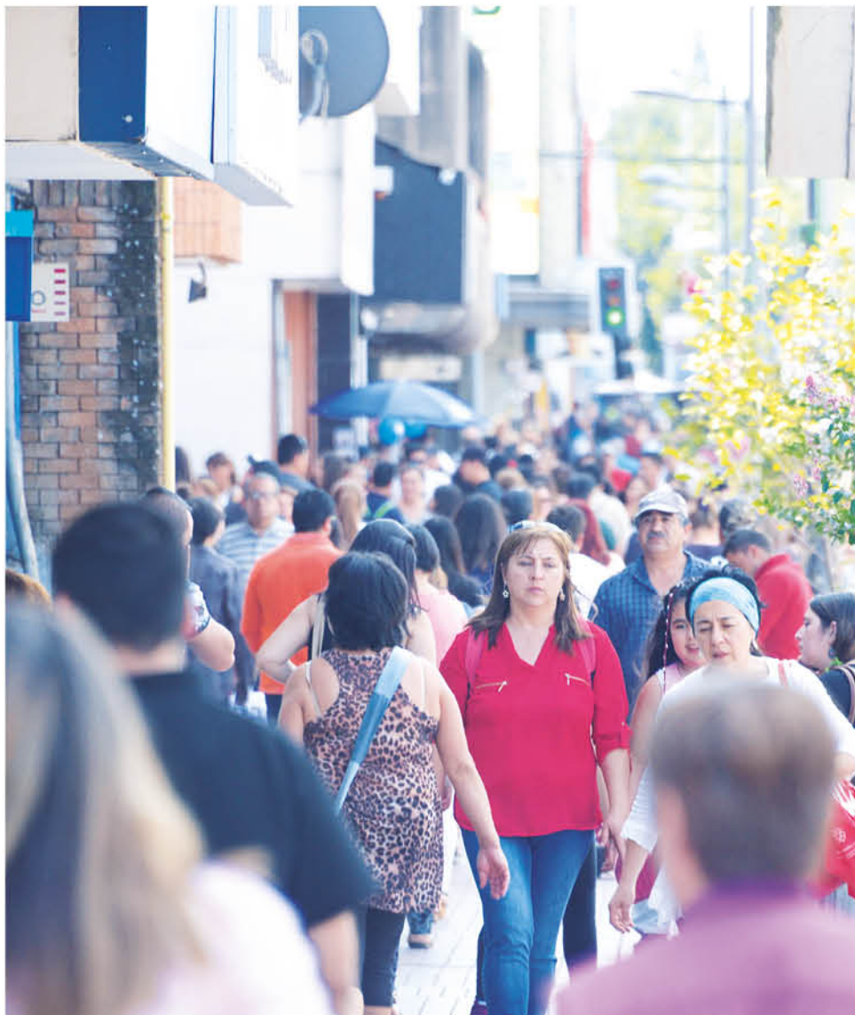
YA SE PUEDE APRECIAR en las avenidas de Los Ángeles, mayor número de ciudadanos preparándose para el regreso a la rutina.

7- Cambia tu espacio de trabajo: Una buena manera de renovarse mentalmente consiste en readecuar el entorno de trabajo. Si es posible, puedes cambiar la orientación de tu puesto de trabajo para tener una nueva perspectiva, adornarlo con nuevos elementos y sacar las cosas que consideras innecesarias.