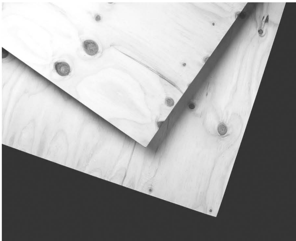
EN SUS ÚLTIMOS TRÁMITES LEGISLATIVOS se encuentra el decreto que fija requisitos de rotulación para la madera que se comercializa en el país.

En el caso del rótulo de madera para uso estructural, éste deberá contener la identificación del proveedor, país de origen, especie, terminación (dimensionado o cepillado), dimensión (NCh 2824 o NCh 174). También incluye la escuadría de la pieza de madera, expresada como denominación comercial, acompañada por su dimensión -en madera seca- en milímetros (mm) y largo en metros (m). Asimismo, debe informar el contenido de humedad, grado estructural y preservación. De ser requerido, se debe comunicar el tipo de preservante y la clase de riesgo, de acuerdo con la NCh 819.