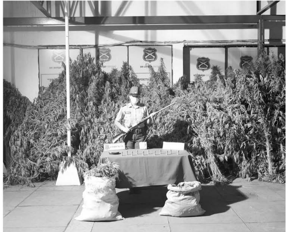
CARABINEROS DEL OS7 de Los Ángeles incautó 48 plantas de marihuana en Mulchén.

Debido a que la plantación se encontraba en la ribera del río Renaico, el Juzgado de Garantía de Mulchén resolvió que en el Tribunal de Collipulli deberá continuar la causa cuya investigación está ahora a cargo del Ministerio Público de la región de La Araucanía.