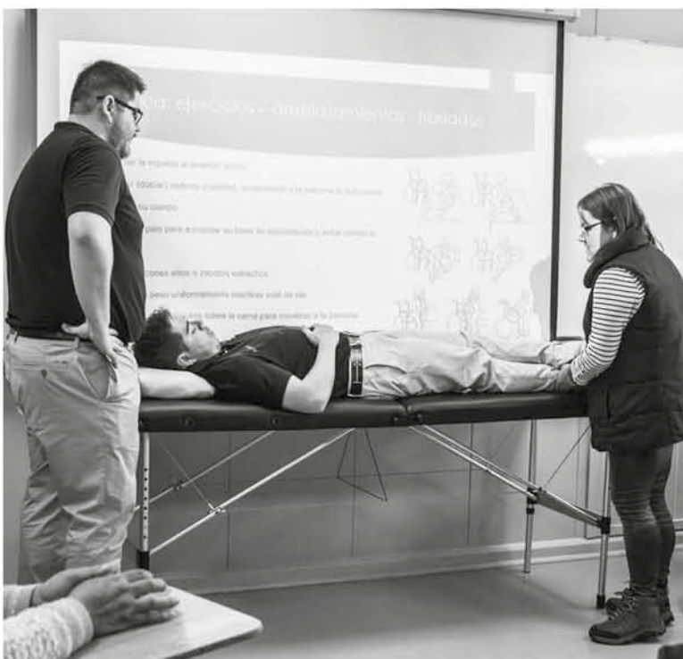
SE REALIZAN MENSUALMENTE talleres en forma gratuita dirigidos a los cuidadores, con profesionales altamente capacitados.