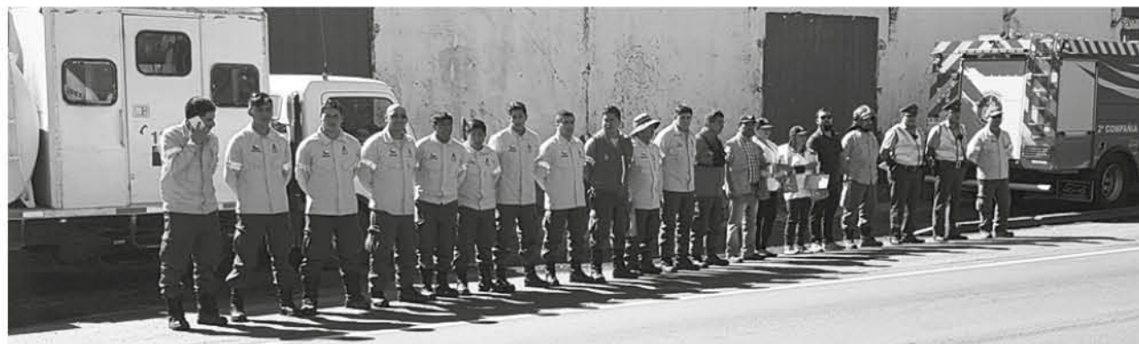
BRIGADISTAS DE CONAF y Bomberos tomaron parte de este operativo de prevención en Negrete.