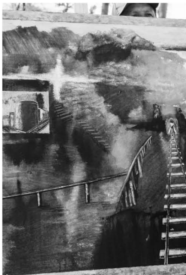
LAS 20 OBRAS serán presentadas en una pinacoteca municipal y de manera posterior recorrerán distintas regiones del país.

Las pinturas elaboradas este domingo conformarán la presentación municipal y serán parte de una gira nacional durante este 2018.