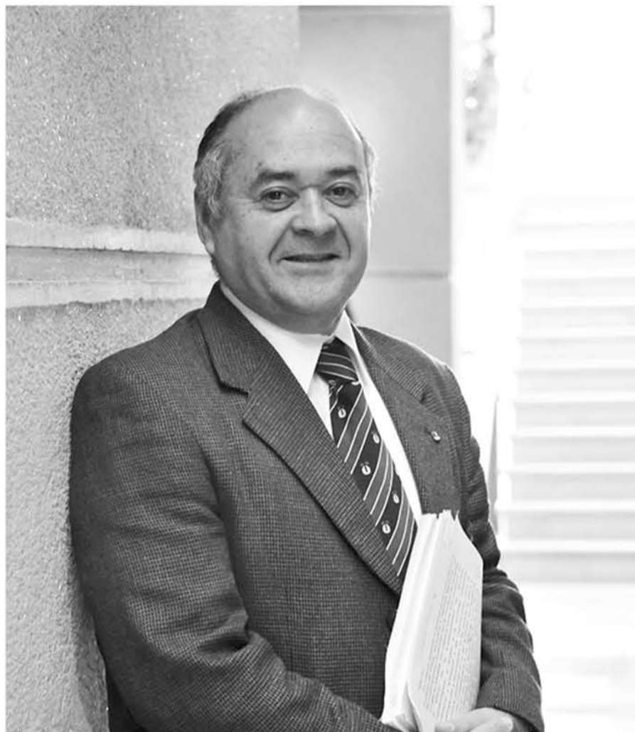
EL DESIGNADO INTENDENTE del Biobío, Jorge Ulloa, destacó la presencia energética que tiene Biobío a nivel nacional.

Finalmente fue consultado si es que su designación puede considerarse como el punto de partida para una eventual futura candidatura a gobernador regional el 2020, frente a lo cual contestó que “no tengo ninguna posibilidad de proyectarme, porque todavía ni siquiera comienzo”, comentó.