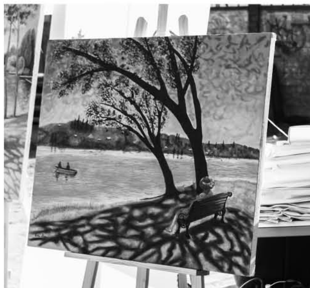
ESTAS PIEZAS DE ARTE tienen la particularidad de plasmar el entorno de la laguna La Señoraza.

Laja, donde distintos exponentes realizaron obras del paisaje natural, sus trabajos serán presentados en una