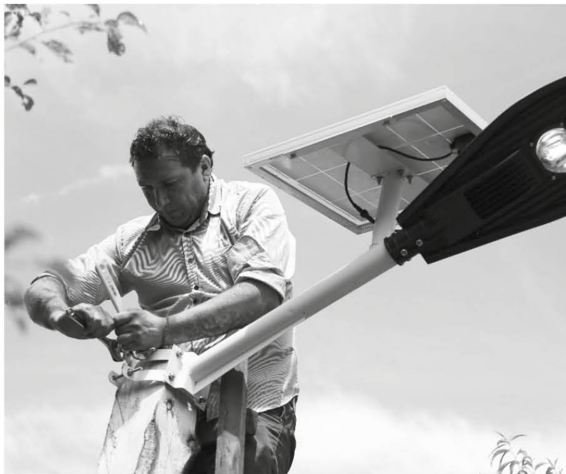
VECINOS DEL SECTOR LAS MALVINAS valoraron el hecho que ahora podrán desarrollar actividades de noche.

Cabe señalar que esta iniciativa pionera por parte de la empresa ORAZUL está siendo la base para expandirla a otras localidades rurales de la Provincia que también carecen de este servicio básico como es el de contar con alumbrado público.