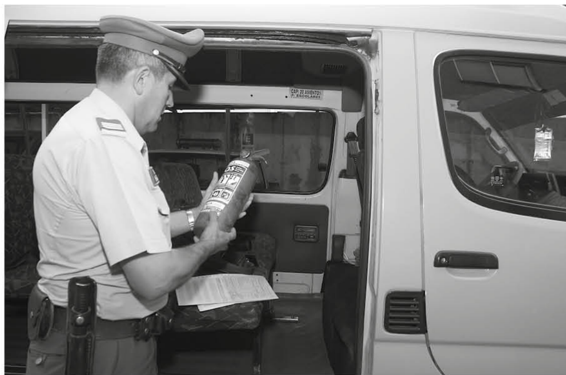
LAS FISCALIZACIONES masivas son voluntarias para los transportistas.

Se consultó la situación al Colegio Padre Hurtado, quienes indicaron que los buses que transportan a sus alumnos tienen una capacidad de