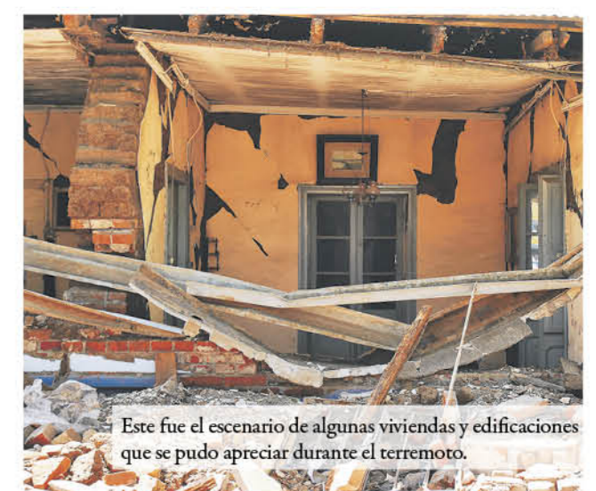
Este fue el escenario de algunas viviendas y edificaciones que se pudo apreciar durante el terremoto.