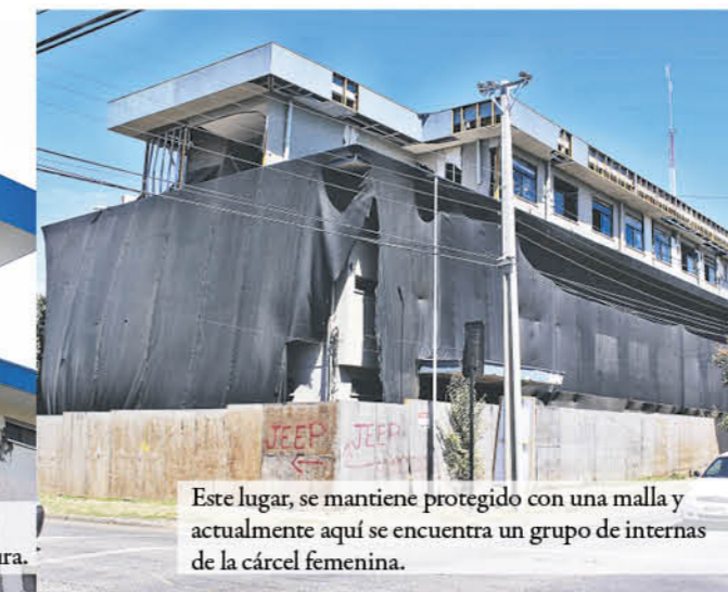
Este lugar, se mantiene protegido con una malla y actualmente aquí se encuentra un grupo de internas de la cárcel femenina.