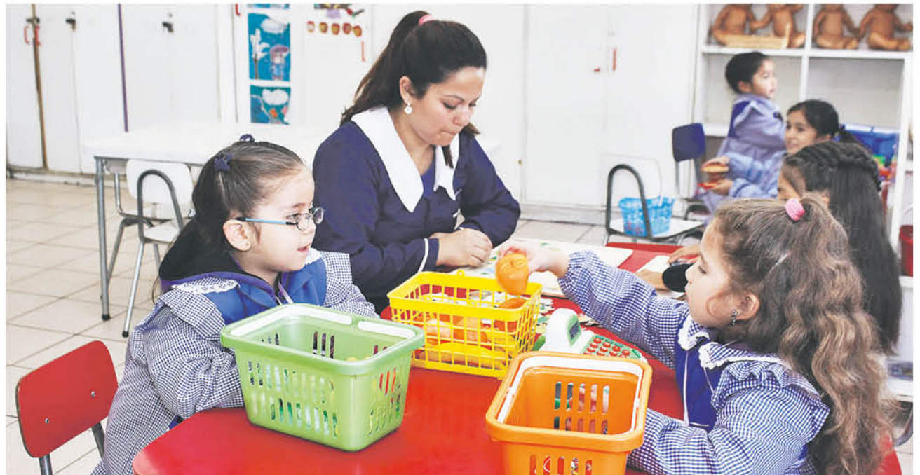
ESTAS ACTIVIDADES se van a llevar a cabo, desde el 5 de marzo en el colegio Luis Martínez, donde los niños de 6 a 13 años pueden aprender distintas acciones, posteriores a sus actividades académicas.

lugar su hija ha hecho grandes amigos y ha aprendido diferentes actividades recreativas, ya que no sólo los pequeños se dedican a estudiar, sino también aprenden materias como arte y deporte entre otras opciones.