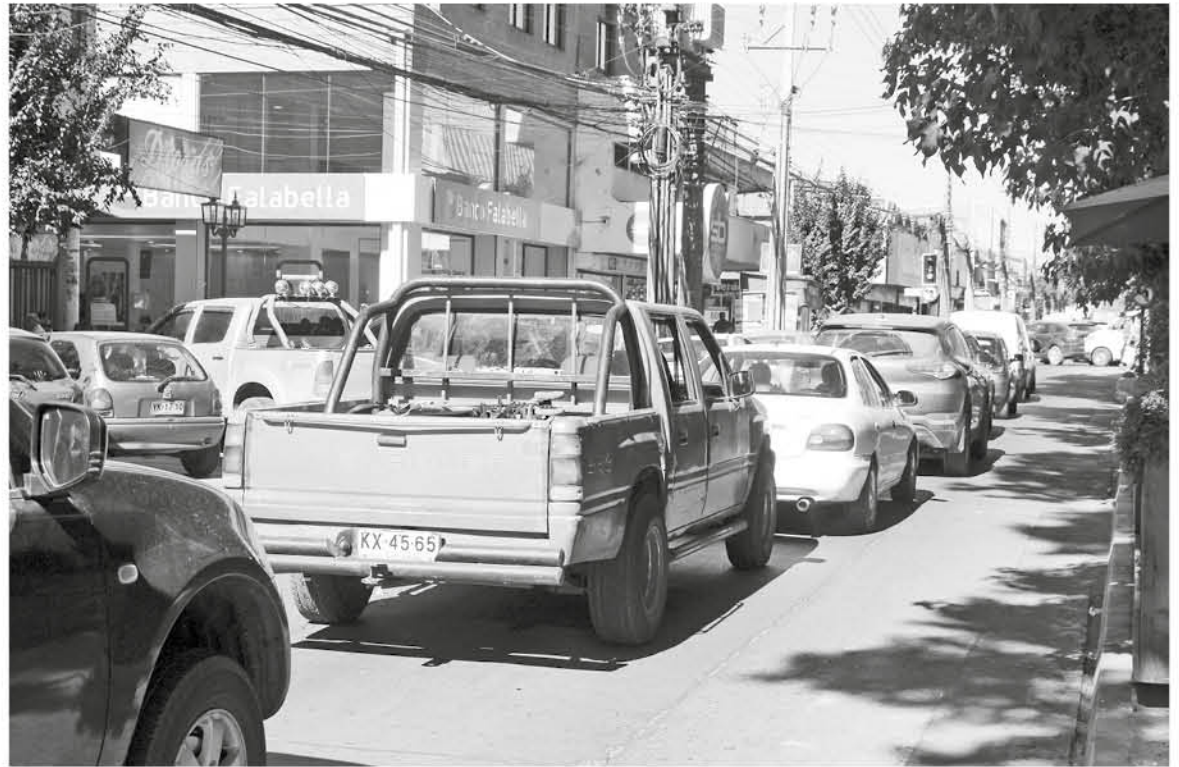
MÁS DE 50 MIL VEHÍCULOS circulan en las calles de Los Ángeles diariamente.

Éste no opera cuando los siniestros son causados en carreras de automóviles, fuera del territorio nacional