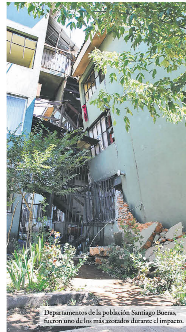
Departamentos de la población Santiago Bueras, fueron uno de los más azotados durante el impacto.

Todo esto llevó a una organización, que a ocho años no se ha erradicado de la memoria de millones de personas quienes con pesar, recuerdan esa madrugada de verano, donde fueron testigos de la fuerza de la madre naturaleza, la que a pesar de su magnitud hace que una vez más estemos de pie.