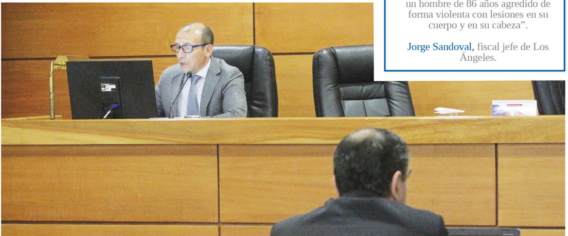
EL MAGISTRADO COMUNICÓ la decisión de castigar a uno de ellos a 20 años y a otro a 15 años y un día.