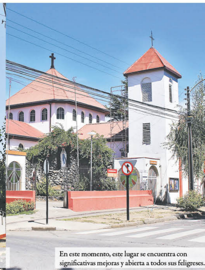
En este momento, este lugar se encuentra con significativas mejoras y abierta a todos sus feligreses.