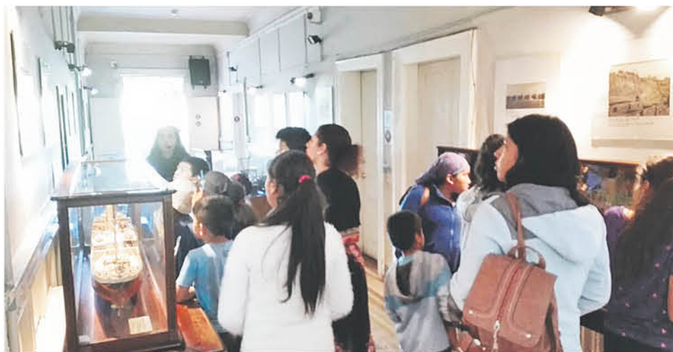
ESTA INSTANCIA se realiza por tercer año consecutivo en Tucapel.

Cabe explicar, que a la fecha quedan seis cupos y las interesadas pueden postular dirigiéndose a las oficinas de Dideco, realizando las inscripciones necesarias abiertas a toda la comunidad.