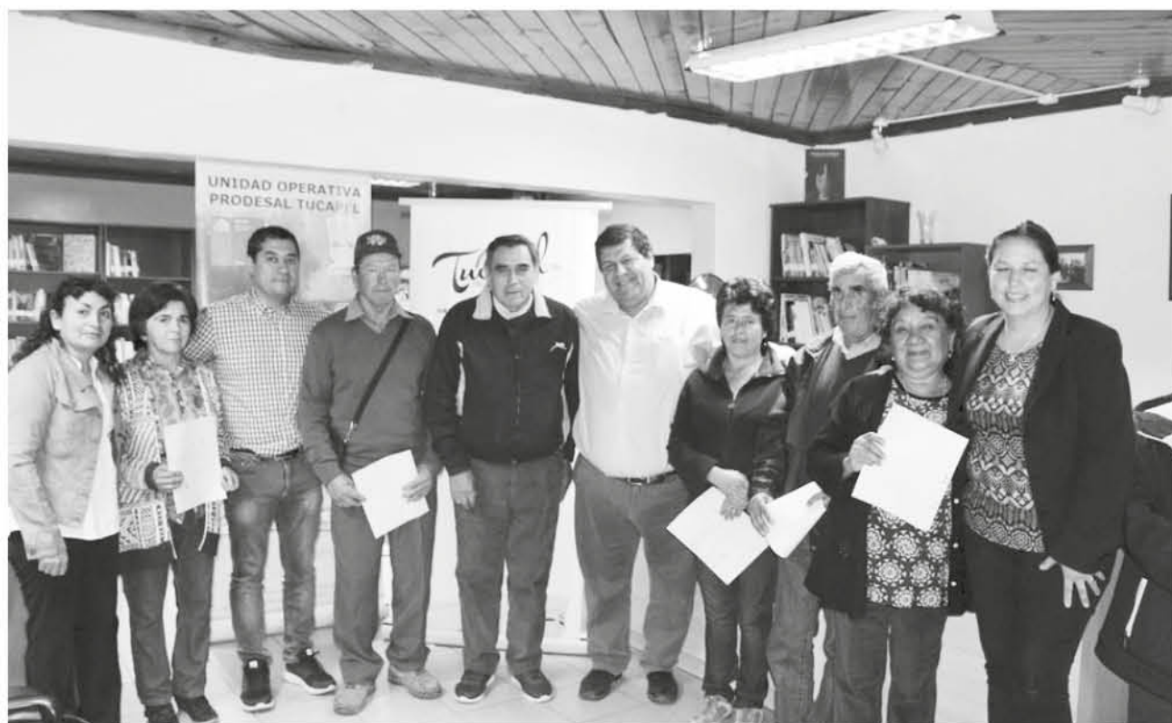
EL ALCALDE VELOSO encabezó esta entrega de incentivos a 44 usuarios Prodesal de su comuna.

Mediante esta ayuda los campesinos favorecidos podrán adquirir herramientas tales como equipos de riego, monocultivadores y desmalezadoras, entre otras.