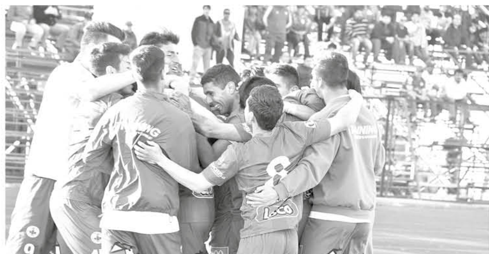
IBERIA TUVO UNA buena victoria en Coronel. (Imagen de contexto)

Se espera que puedan concretarse partidos amistosos en la previa al inicio del certamen.