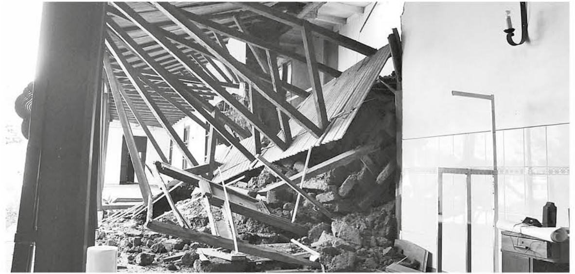
“EL EFECTO PSICOLÓGICO que provoca una catástrofe natural tan grande como la que nosotros vivimos, en muchas personas deja una huella súper marcada”.

En otros casos, para una inmensa mayoría fue su primer terremoto, por lo tanto el efecto en este grupo de personas es doblemente mayor a cualquier tipo de evento catastrófico-natural, indicó el psicólogo “porque psicológicamente el suelo es un soporte también emocional, y que algo te mueva todo el suelo ejerce un potente descontrol emocional ya que gatilla el miedo, porque ese hecho escapa a tu control”.