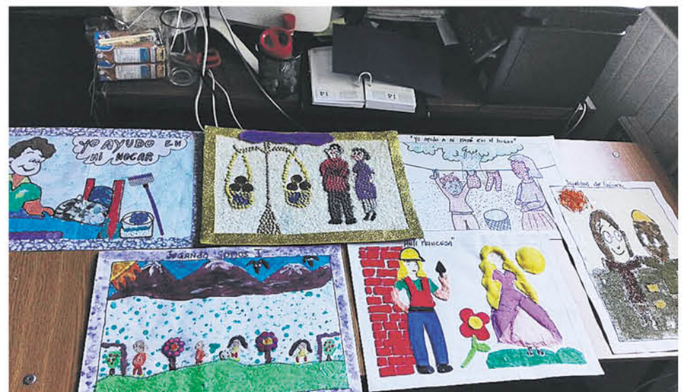
EL PROGRAMA VA DIRIGIDO a aquellas mujeres que se quieran desarrollar en el ámbito laboral o académico.