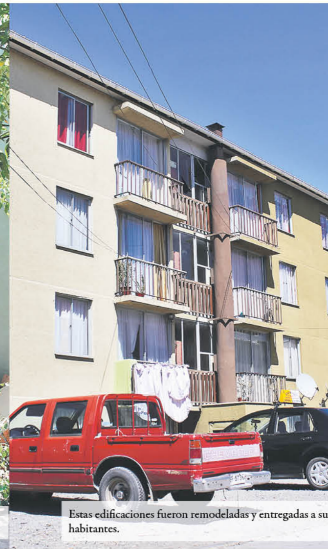
Estas edificaciones fueron remodeladas y entregadas a sus habitantes.