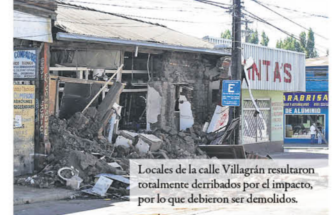
Locales de la calle Villagrán resultaron totalmente derribados por el impacto, por lo que debieron ser demolidos.