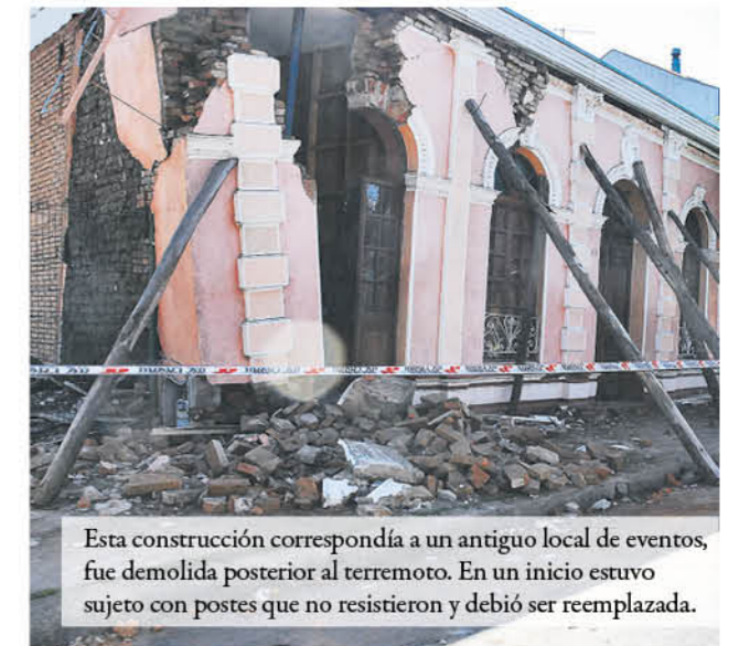
Esta construcción correspondía a un antiguo local de eventos, fue demolida posterior al terremoto. En un inicio estuvo sujeto con postes que no resistieron y debió ser reemplazada.