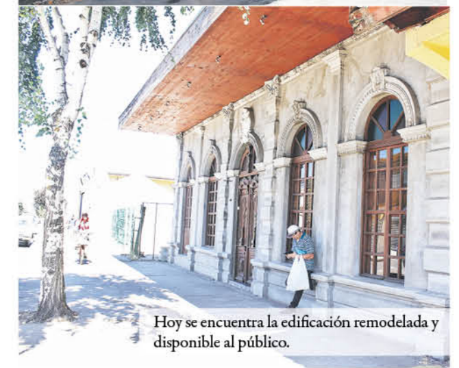
Hoy se encuentra la edificación remodelada y disponible al público.