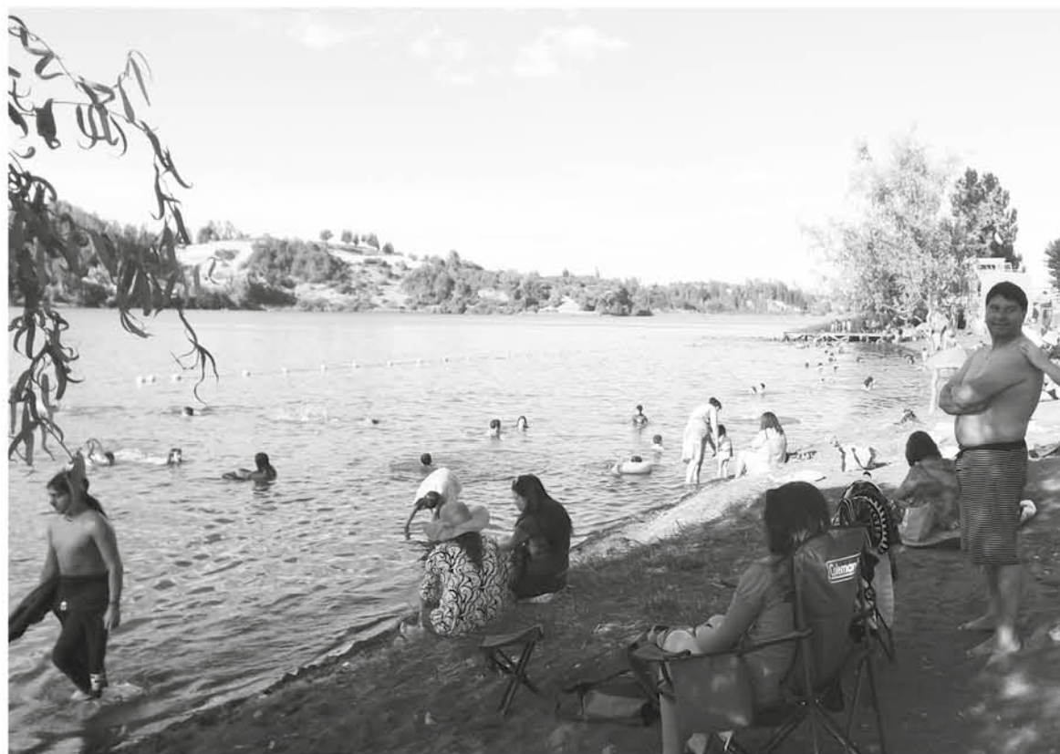
A RAÍZ DE ESTE CASO las autoridades reiteraron que la laguna Señoraza se encuentra apta para el baño y libre de contaminación.

obligación de resguardar la salud de nuestra comunidad, y en base a esa prioridad es que antes de iniciar nuestro periodo estival, es decir en el mes de noviembre, solicitamos un estudio de las aguas de nuestra laguna la cual arrojó resultados negativos, es decir