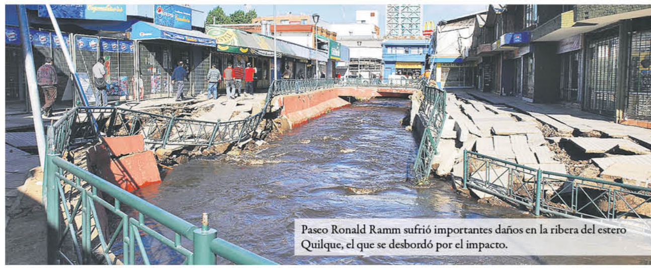
Paseo Ronald Ramm sufrió importantes daños en la ribera del estero Quilque, el que se desbordó por el impacto.

Entre los hechos que marcaron la pauta provincial, se encuadra