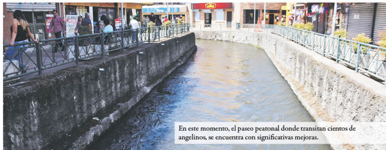
En este momento, el paseo peatonal donde transitan cientos de angelinos, se encuentra con significativas mejoras.

la pérdida de más de 35 mil millones de pesos en daños materiales que se registraron dentro de Los Ángeles, donde resultaron cerca de 30 mil ciudadanos damnificados, quienes clamaban por soluciones habitacionales, la que debieron ser gestionadas por medio de distintas operaciones.