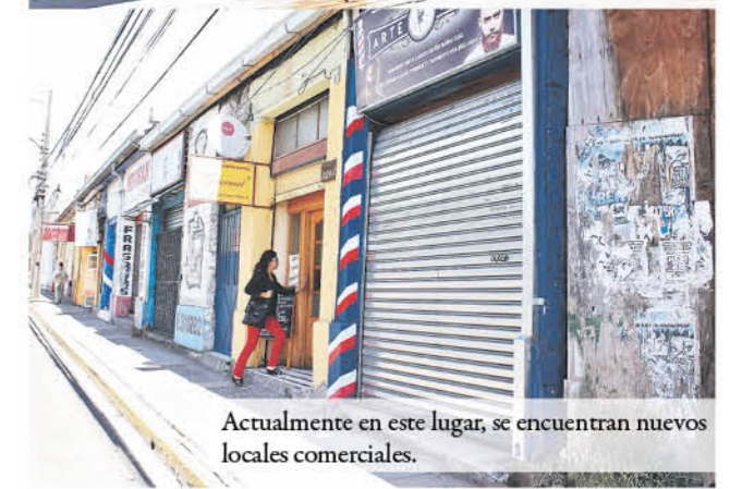
Actualmente en este lugar, se encuentran nuevos locales comerciales.