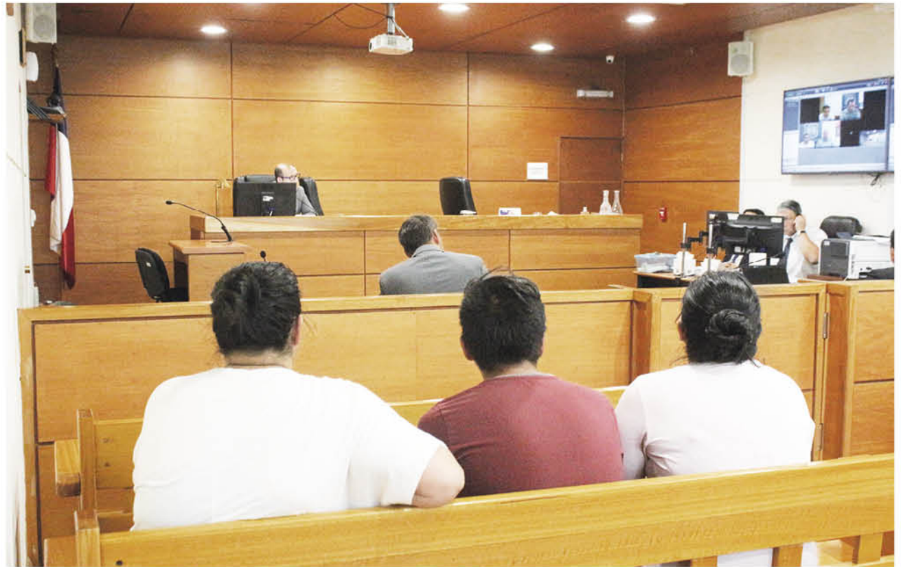
FAMILIARES DE UNO DE LOS IMPUTADOS estuvieron presentes en la lectura de sentencia.

Sin embargo, esto fue desestimado por los magistrados