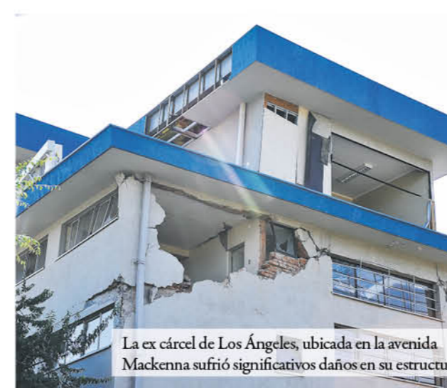
La ex cárcel de Los Ángeles, ubicada en la avenida Mackenna sufrió significativos daños en su estructura.