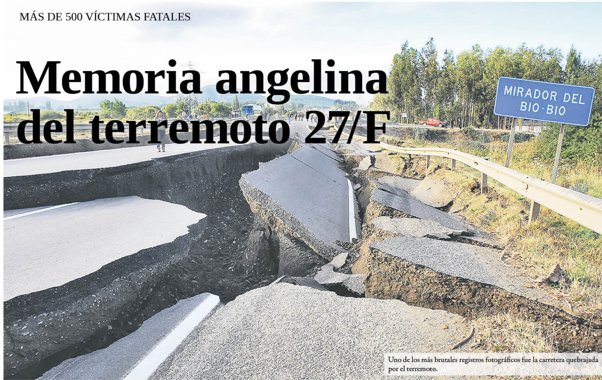
Uno de los más brutales registros fotográficos fue la carretera quebrada por el terremoto.

Por medio de un registro fotográfico, La Tribuna recordó los ocho años de este suceso que marco la historia a nivel provincial.