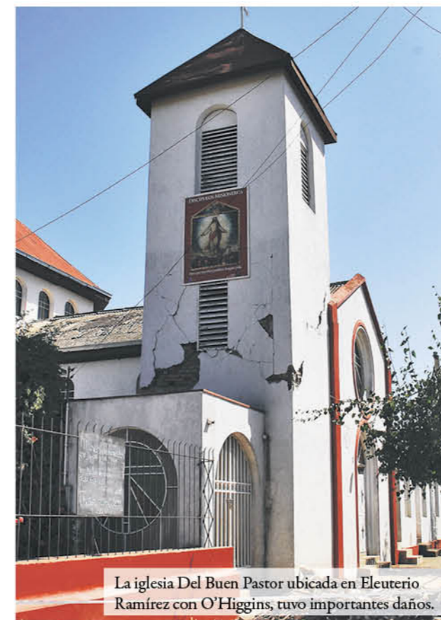
La iglesia Del Buen Pastor ubicada en Eleuterio Ramírez con O'Higgins, tuvo importantes daños.