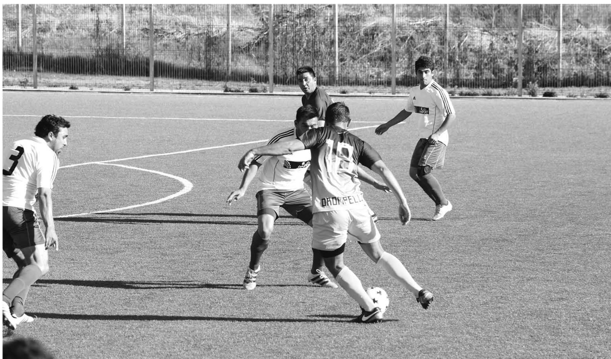
EN UN GRAN PARTIDO bastante pobre, el elenco "Oro y cielo", consiguió un importante empate sobre la hora.