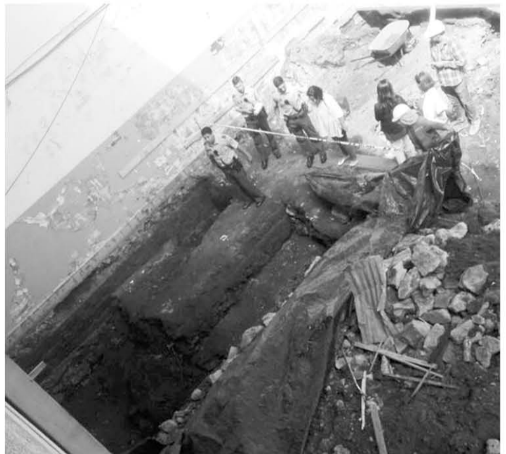
EL HALLAZGO lo hicieron trabajadores de las obras de edificación del próximo centro cultural de Los Ángeles.