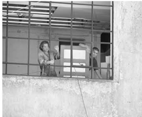
TRABAJADORES MIRABAN atentos mientras la PDI periciaba las osamentas.

De acuerdo al trabajo investigativo de la brigada se pudo establecer que el hecho de que los trabajadores hayan estado excavando con palas y no con maquinaria, permitió que las osamentas pudieran ser encontradas con mayor facilidad.