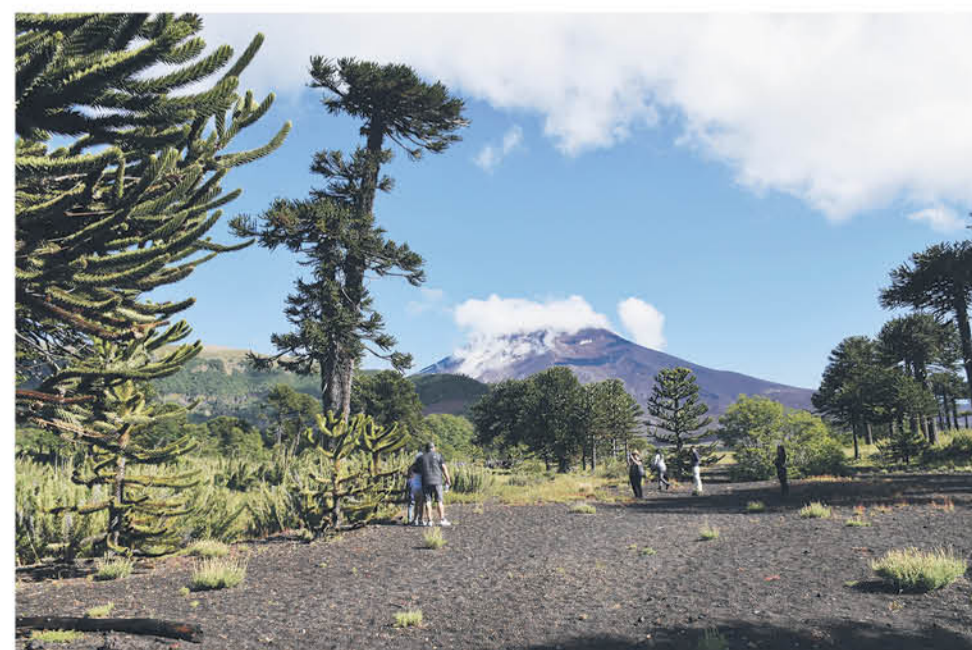
NUESTRO PAÍS, ganador del World Travel Awards, por presentar una serie de maravillas naturales.

Aquí, además de actividades recreacionales en el ámbito deportivo, el servicio se extiende a una alta gama de spa, donde las personas pueden obtener un merecido relaxo -alejado de la rutina-, entre los servicios de piscinas temperadas (2), jacuzzi, sauna y masajes, entre los que están: relajantes, drenajes linfáticos, descontracturantes, con piedras calientes y de otra índole, enfocados en todas las personas que buscan, además, entregar un cuidado corporal a su cuerpo, luego de todo el esfuerzo diario y funcional. Estos son atendidos por destacadas masajistas y se ha transformado en una de las