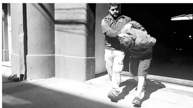
LOS HOMBRES FUERON ARRESTADOS mientras realizaban una transacción entre proveedor y distribuidor.

drogas en el Tribunal de Garantía de Concepción. El juez decretó un plazo de tres meses para la investigación.