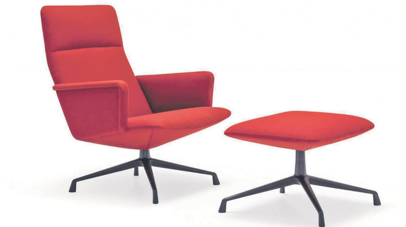
Su concepción funcional hace que nos olvidemos de que una silla "refleja un momento histórico". Diseño de Piergio Cazzaniga.

¿Prestamos atención en dónde nos sentamos? "Sí, claro. Sobre todo porque si no aciertas en la elección y te duele la espalda, y por la inversión que supone comprar una silla", apunta Anatxu Zabalbeascoa.