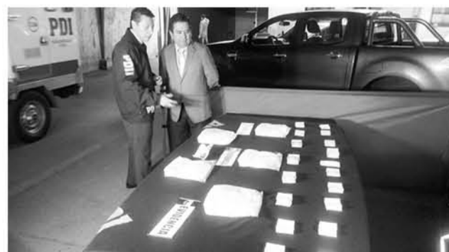
FUERON INCAUTADOS 5 KILOS de pasta base avaluados en cerca de 80 millones de pesos.