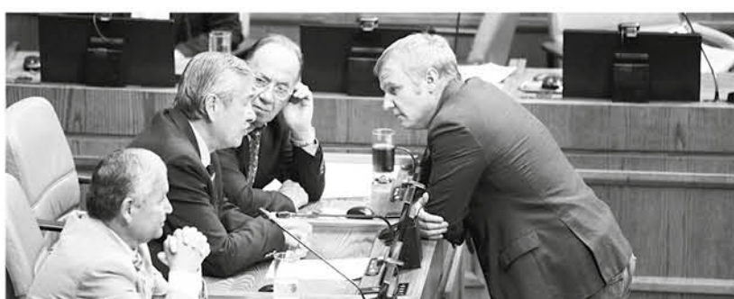
LAS MEDIDAS EN FAVOR de los honorarios del sector público fueron aprobadas en la Cámara Baja por 71 votos a favor y 19 abstenciones.

Resolución enviada a la Presidenta solicita una prórroga a la cotización previsional obligatoria para este sector y la creación de una cartera de seguros colectivos de renta vitalicia, entre otras medidas.