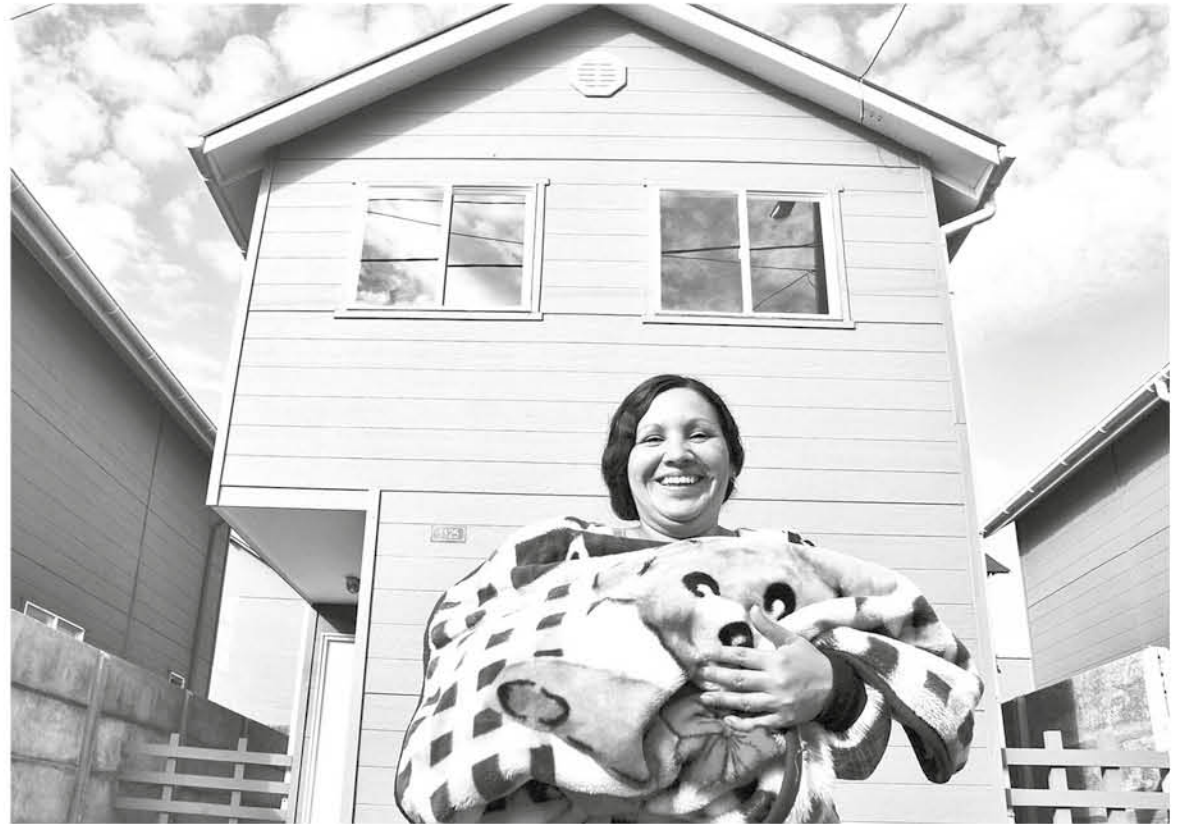
SUBSIDIO PARA CLASE media permite a los beneficiarios obtener dinero para comprar una vivienda nueva o usada.

Otro de los requisitos para este subsidio habitacional es poseer un monto de ahorro mínimo según los títulos. El tramo I exige un monto mínimo de ahorro de 30 UF en una cuenta de ahorro con al menos 12 meses de antigüedad. Las viviendas que se deseen adquirir en este tramo no deben sobrepasar el monto máximo de 1000 UF. Para el tramo II es neces-