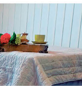
Ilwen Sabores del Campo.

El restorán está abierto todos los días del año y hasta el 15 de marzo está presente también con un stand en la playa pública de Quilaco, donde es posible adquirir pastel de choclo, sándwich con salsas caseras, mote con huesillo y jugos naturales, entre otros.