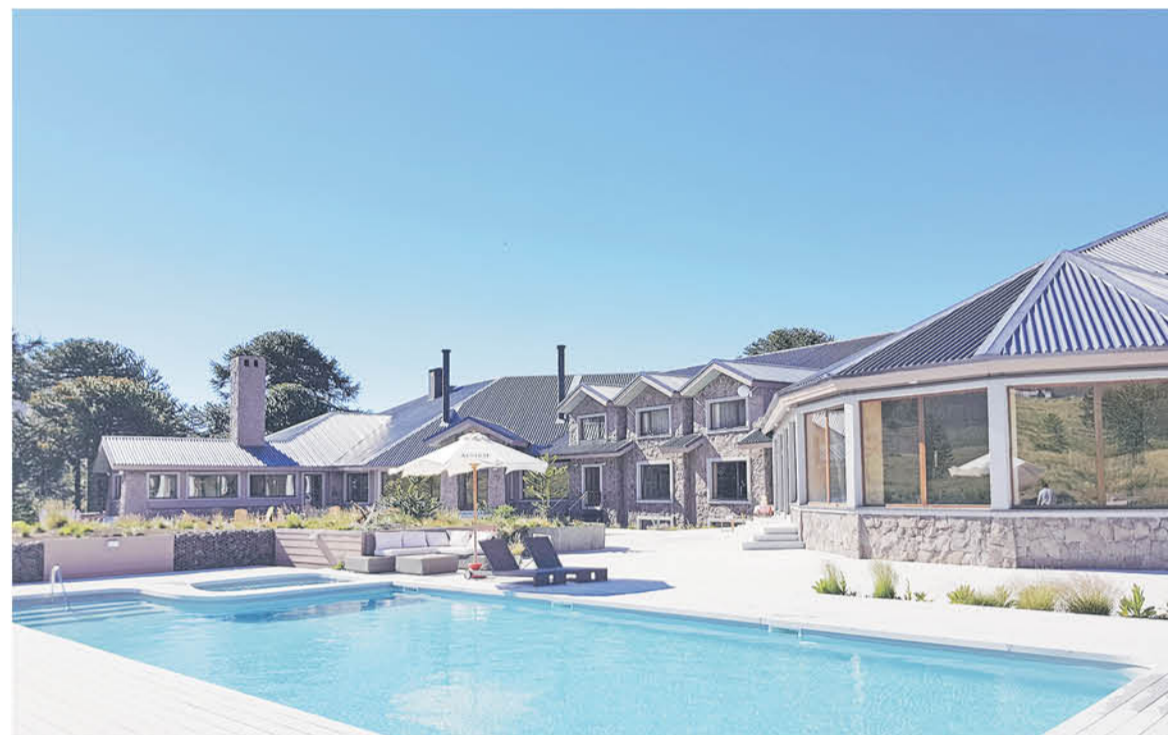
ADÉMÁS DE LA IMPORTANCIA de las iniciativas de relaxo, este centro potencia las actividades de difusión en medio de la flora de la novena Región.

Los turistas explicaron que llegar a este lugar significa conocer la naturaleza en su plenitud, y eso es lo que más buscan, alejándose de la rutina diaria y del paso del tiempo que ha dejado consigo la modernidad, alejados de las raíces que fundan la vida cotidiana.