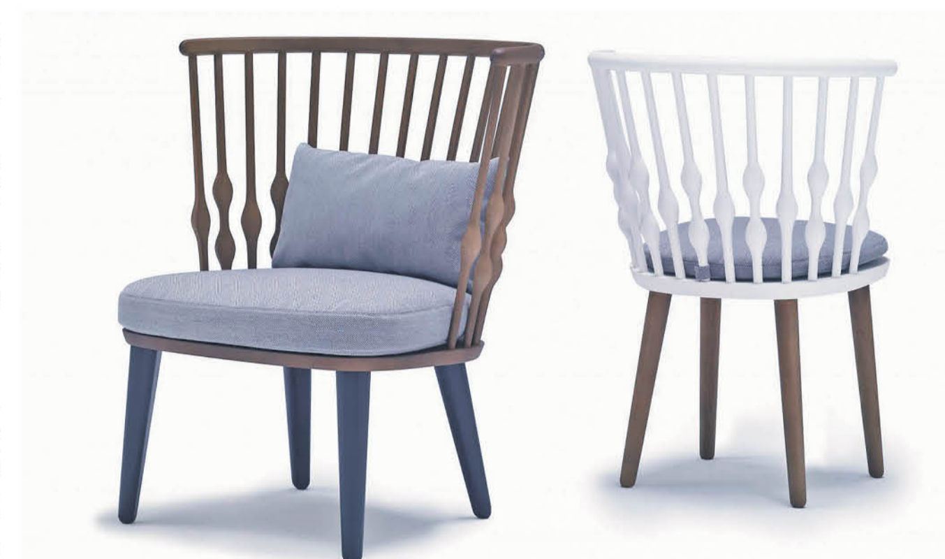
Diseño de Patricia Urquiola.

Sillas, piezas que están en casa y en también en museos. "El problema del diseño es que está a la vez en los supermercados y los museos, momento en el que se puede llegar a perder su concepto", resume la especialista.