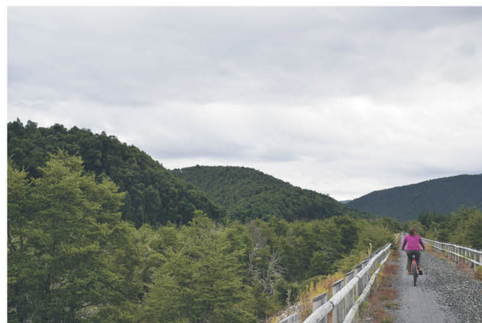
ESTE CENTRO PRESENTA una serie de actividades para todo el año, entre verano e invierno.