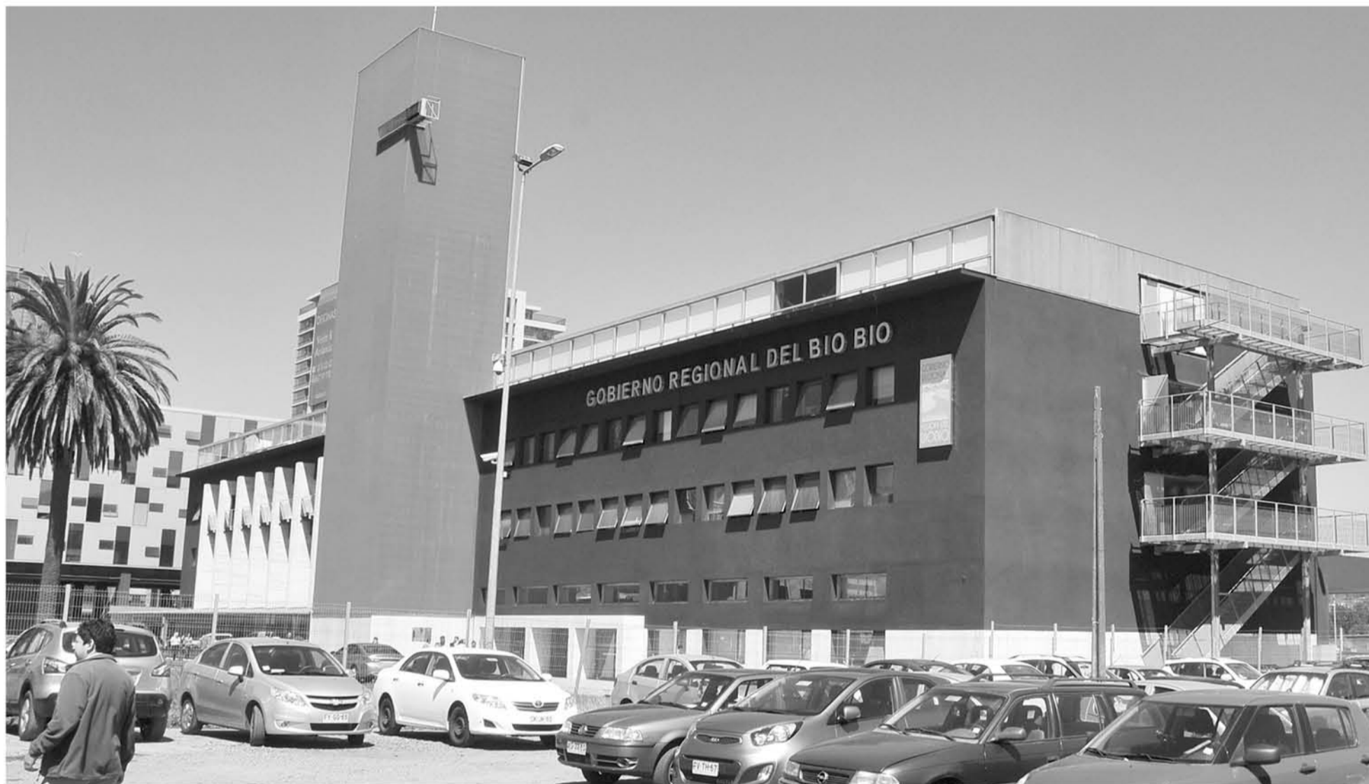
LA PRÓXIMA SEMANA se sabría quién será el futuro intendente del Biobío.

El core gremialista Luis Santibáñez sostuvo que el futuro jefe del Gobierno Regional que designe Piñera debe ser una persona que se proyecte con miras a las elecciones de gobernadores regionales del 2020.