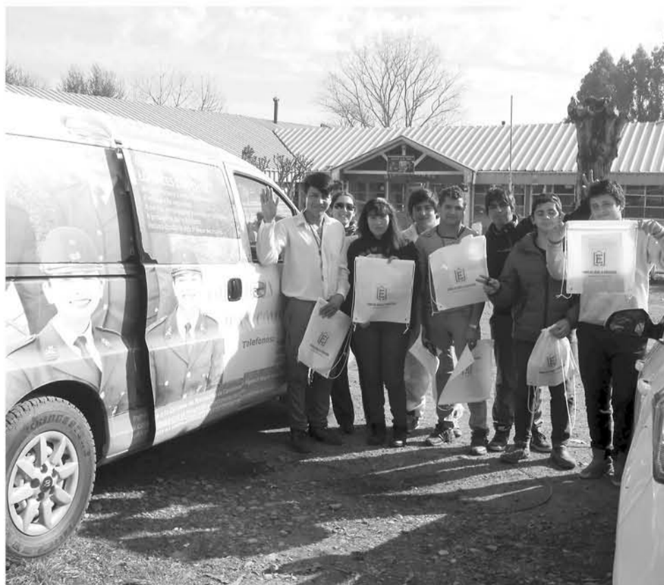
LAS POSTULACIONES para la Escuela de Formación de Carabineros están abiertas durante todo el año.

En el Biobío, Los Ángeles es la comuna que aporta con más postulantes para la institución. Le siguen Mulchén, Tucapel y Nacimiento.