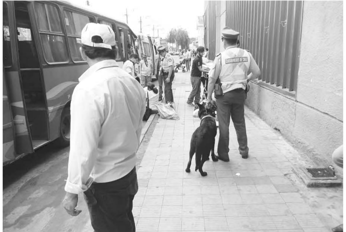
EL ACCIDENTE OCURRIÓ en Lientur y Villagrán mientras los abuelitos intentaban subir a un bus.

El relato de testigos y del propio conductor permitió conocer que debido a la oportuna reacción del chofer se logró evitar un suceso de