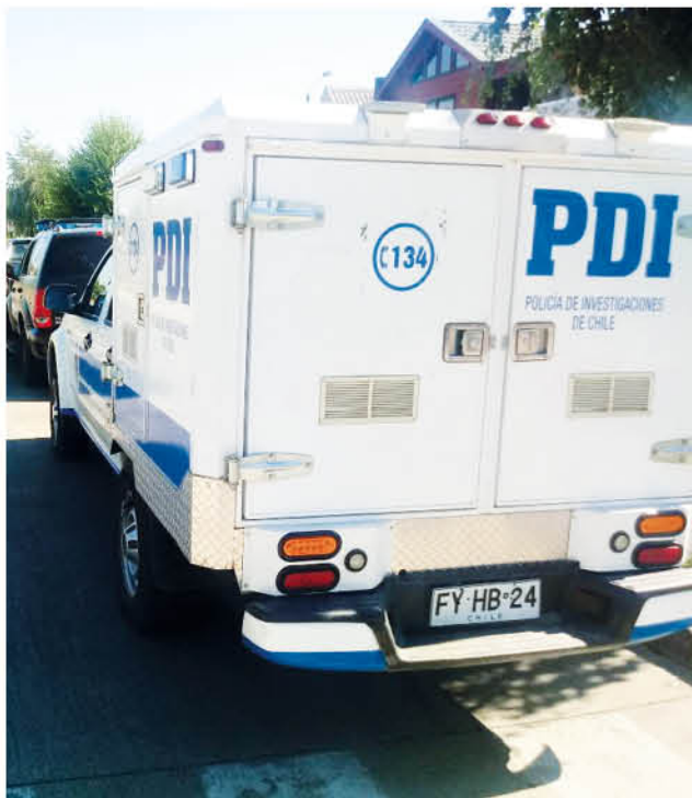
EN UN DOMICILIO DE VILLA GALILEA se decomisaron cerca de 5 kilos de pasta base.