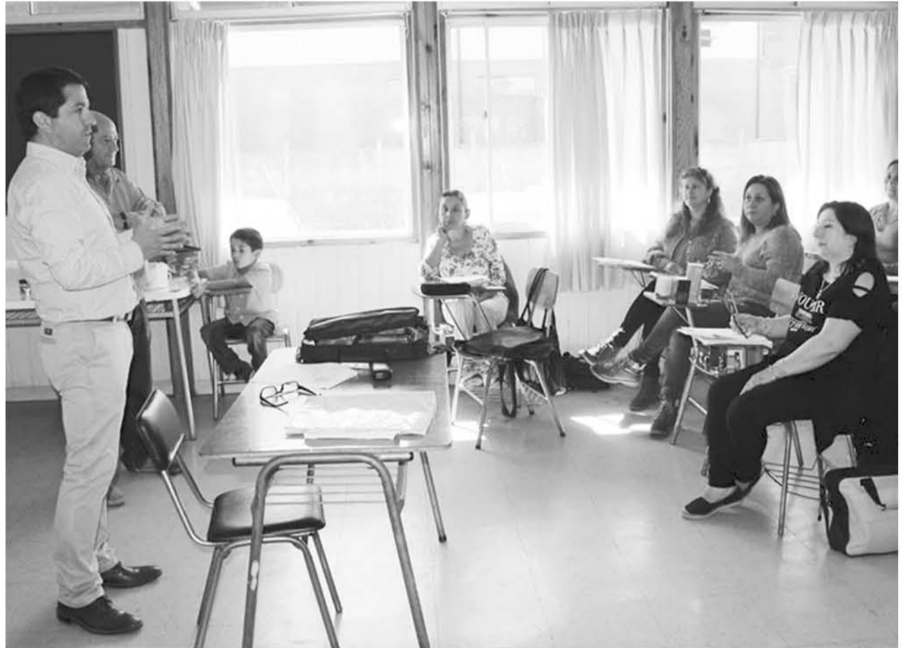
EL ALCALDE MARIO GIERKE visitó a las alumnas en su penúltima clase.

El alcalde Gierke estimuló a las alumnas a perseverar en su emprendimiento y manifestó el apoyo y compromiso de su gestión con todas ellas. Al mismo tiempo, destacó el trabajo efectuado por el PMJH, que se encarga de coordinar diversos cursos para mujeres de nuestra comuna, y que tiene sus postulaciones abiertas hasta el 29 de marzo.