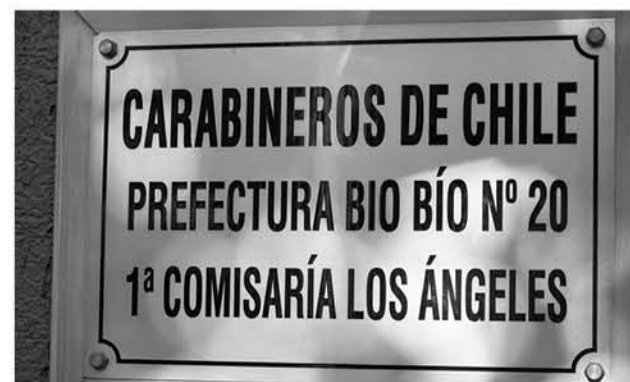
LA OFICINA DE POSTULACIÓN en Los Ángeles está ubicada en la Prefectura de Carabineros, en calle Ricardo Vicuña 405.

Las postulaciones a la Escuela están abiertas durante todo el año y quienes se inscriban en estos meses podrán postular para su ingreso en el mes de junio próximo o, en su defecto, para enero del 2018.