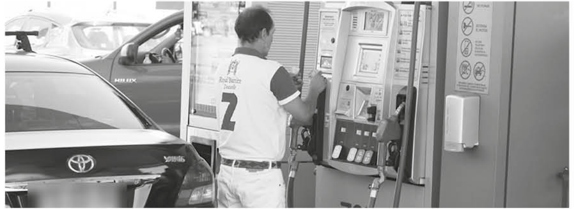
BENCINAS DISMINUYERON su precio esta semana.

Distinto es el caso del gas licuado de petróleo que se anotó un alza de 1,6 pesos por litro, quedando en $227,3 referencial.