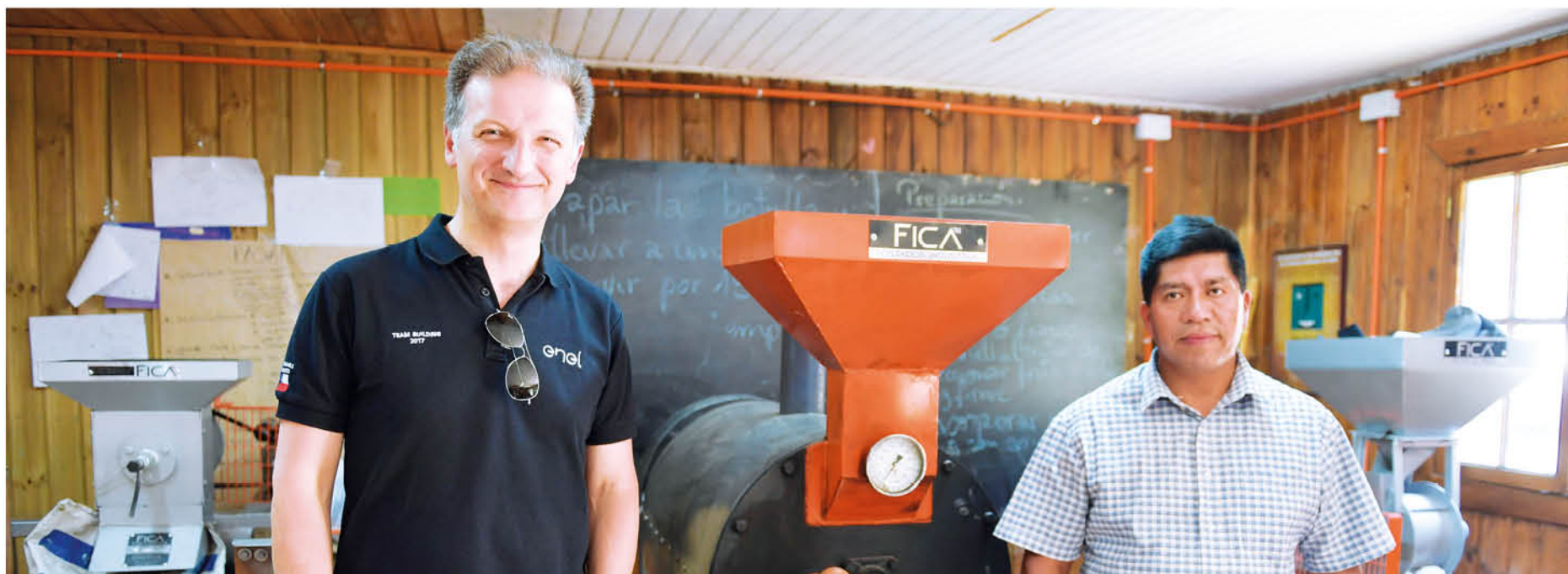
LA BASE DE ESTE TRABAJO es la avellana, pero el acento está en los productos derivados que se pueden elaborar a partir de este fruto y en el modelo de negocio que se puede implementar.

Son varias las fases que se han cumplido en este programa, que partió en 2016, con las primeras jornadas de capacitación y la construcción de un plan de comercialización. En abril de este año la comunidad recibió maquinaria para ayudar en el proceso de la avellana, así como en la instrucción para operarla. Luego, las familias postularon proyectos, que se adjudicaron en septiembre pasado.