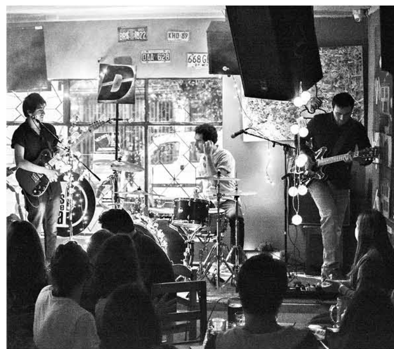
ESTA BANDA LLEVA cerca de dos años en el mercado y se ha presentado en diferentes escenarios, ganándose el cariño de todo el público local.

Su inicio fue bastante rápido recordaron, ya que una serie de presentaciones los llevaron a unos