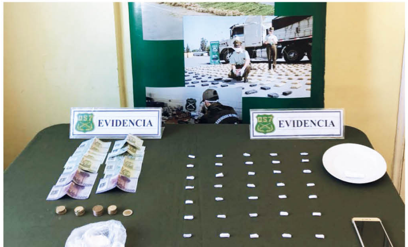
EL OPERATIVO SE REALIZÓ en un negocio de abarrotes en villa Los Profesores. Sesenta dosis de pasta base fueron decomisadas.

Carabineros de Chile y la sección OS7 de Los Ángeles desarrolla de manera permanente, estrategias para anular los focos de microtráfico y el consumo de drogas para que los vecinos vuelvan a sentirse seguros en sus barrios.