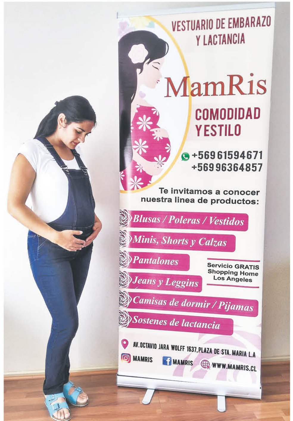
MAMRIS ES UN PROYECTO de una pareja de angelinos, que busca ropa única para mujeres embarazadas.

Mientras que en las proyecciones de Roberto hay un objetivo bien claro, ya que busca postular a un capital semilla que les permita