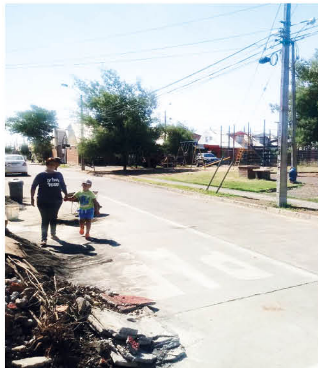
A LA HORA DEL DECOMISO, vecinos limpiaban sus jardines y niños se divertían en los juegos.

El hombre de 42 años proveía a otra persona que distribuía la sustancia ilícita en el puerto de Talcahuano en la provincia penquista.