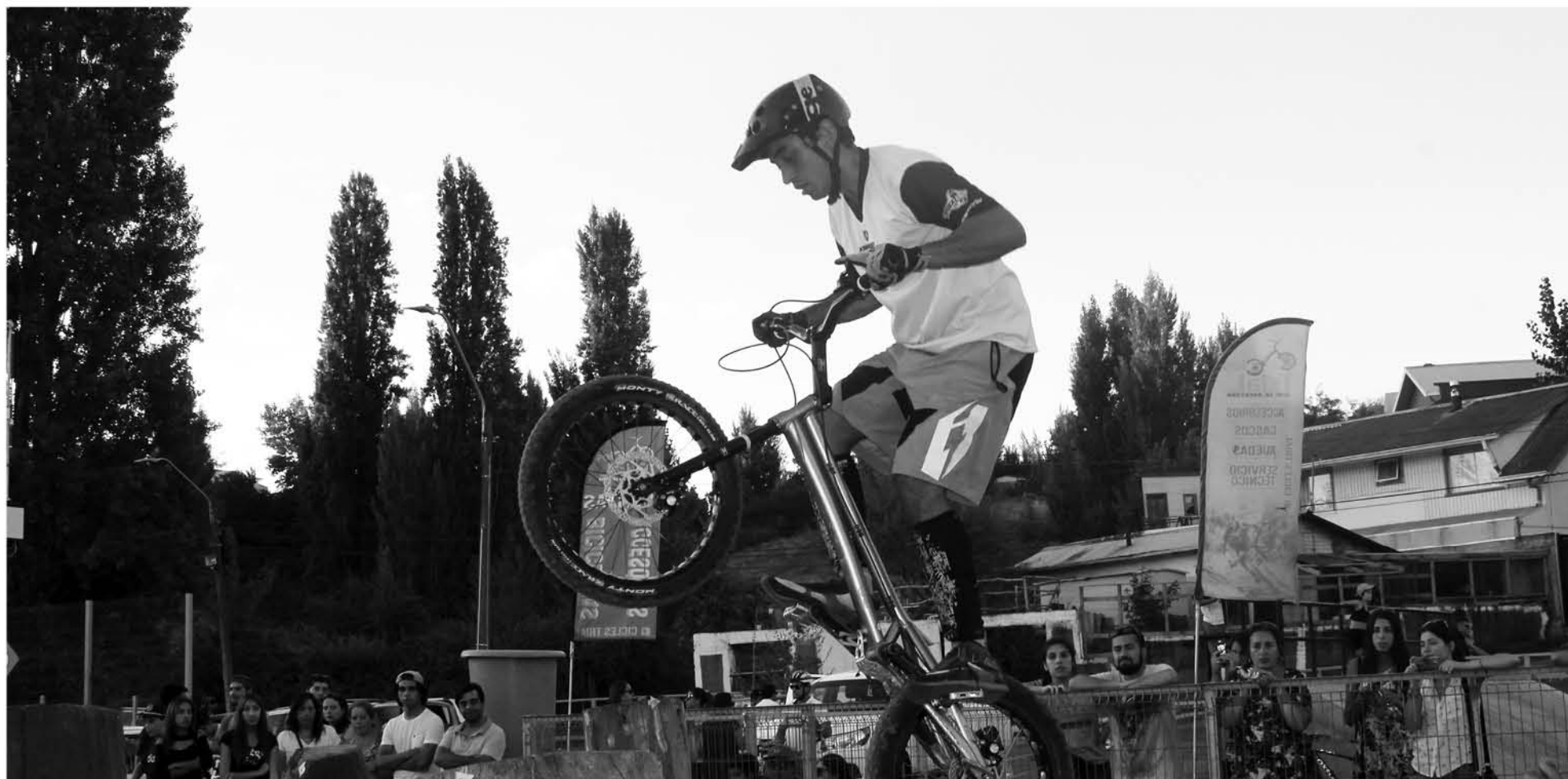
LAJA volverá a ser el epicentro de esta disciplina a nivel nacional.

Laja alberga nuevamente un evento de esta magnitud, a donde llegarán exponentes de Chillán, Temuco, Puerto Montt, Isla Negra, Santiago, Antofagasta y Calama.