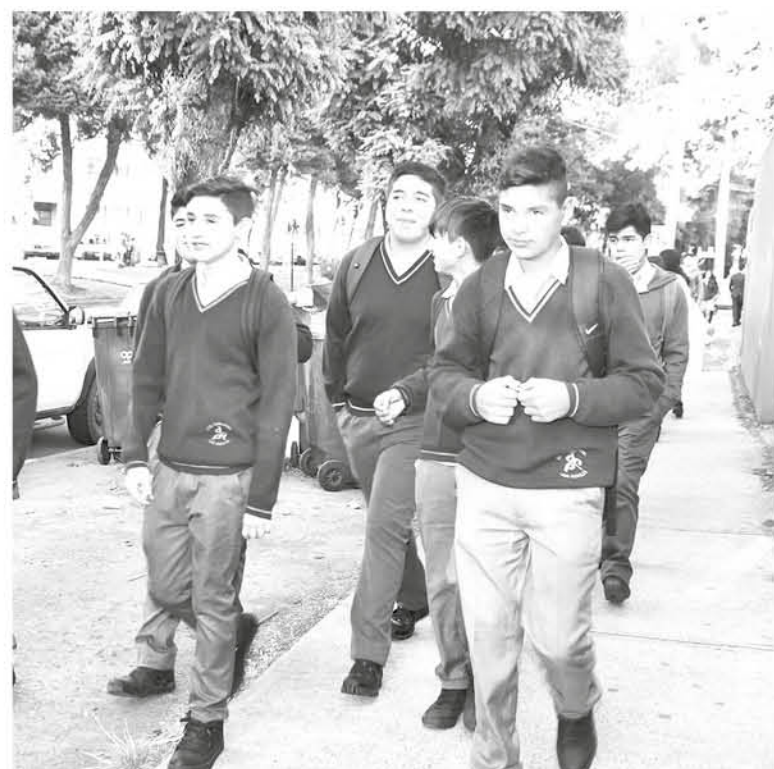
SÓLO DOS ESTABLECIMIENTOS comienzan antes el año escolar, el resto se apegó al calendario oficial.

Hasta el 2017 la oficina provincial contaba con 92.013 matrículas, pudiendo este número variar hasta finales de marzo de este año, cuando se obtenga el último reporte.