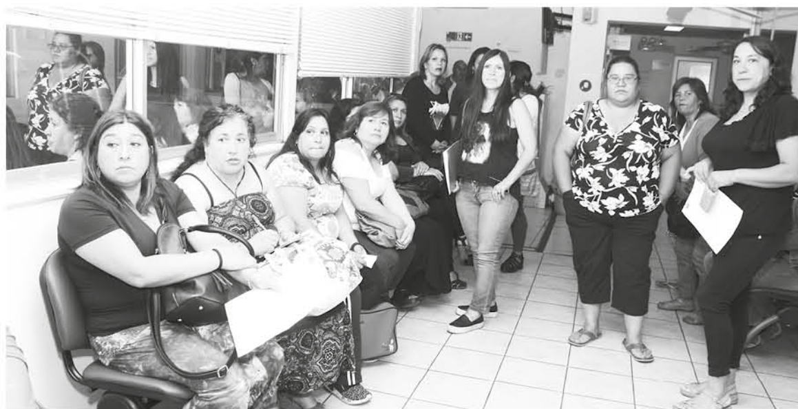
ESTE 28 DE DICIEMBRE este grupo de trabajadoras deberían haber cobrado sus sueldos y finiquitos pendientes.

Tras una audiencia de conciliación, la empresa, si bien reconoció la deuda, decidió no pagar, por lo que la Inspección del Trabajo debió cursar las multas correspondientes, por lo que ahora es la municipalidad la que debe cancelar esos valores con cargo a la garantía que tiene por contrato.