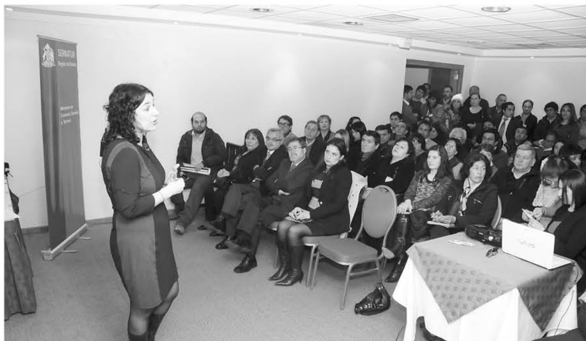
EL TURISMO de reuniones ha ido creciendo en los últimos años en el país.

Un total de 25 congresos internacionales ganados el 2017, el primer Encuentro Nacional de Turismo MICE y un programa de embajadores internacionales para el turismo de reuniones avalan el trabajo desarrollado para potenciar el turismo de negocios en el país.