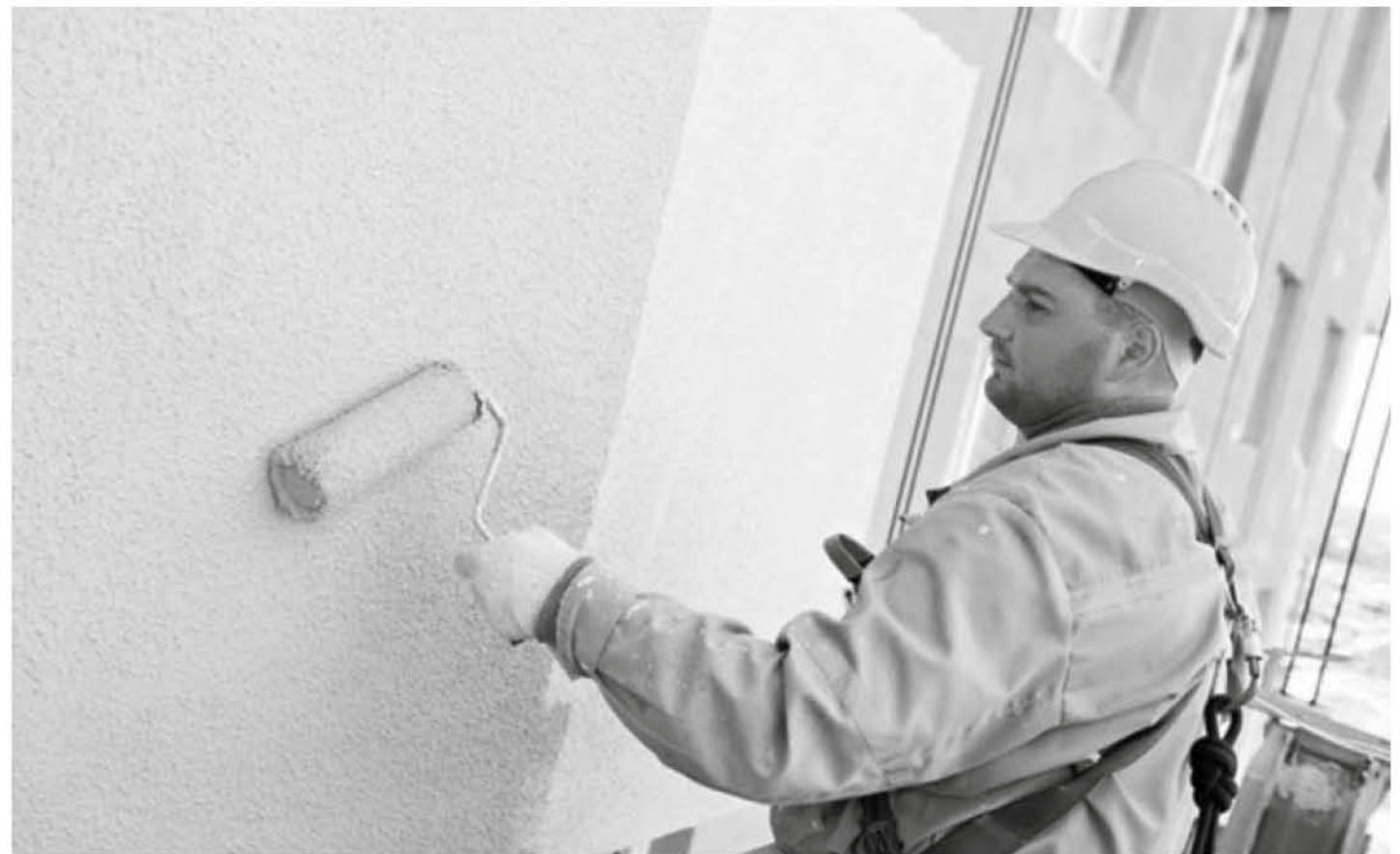
SERVICIOS DE PINTURAS, es una de las especialidades de la construcción, que desde ahora estarán sujetas al pago de IVA.