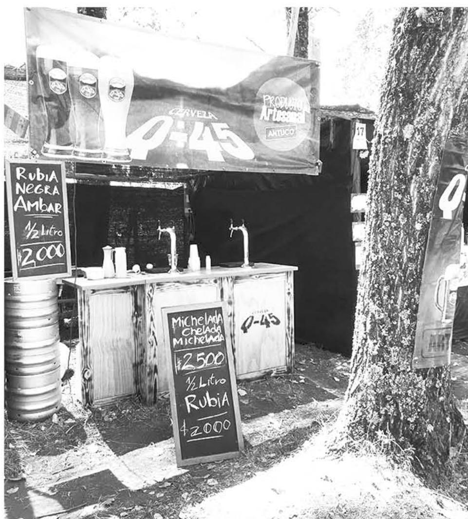
ESTA ACTIVIDAD se va a llevar a cabo este sábado 24 de febrero, donde llegarán distintos exponentes cerveceros.

En esta comuna, podrá deleitarse con un gran entorno, rodeado de naturaleza y podrá probar, una gran variedad de productos, entre ella a la reina de la jornada, además podrá acompañarla de una serie de platos típicos que se van a presentar en esta velada única para este bello sector.