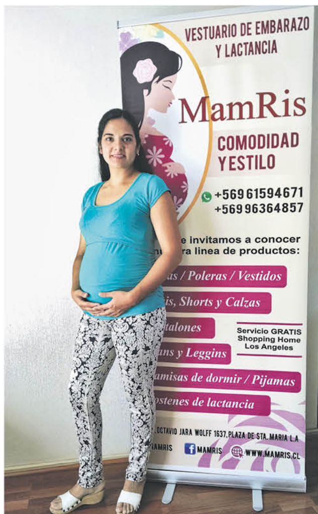
SUS DISEÑOS son originales ya que se basan en una búsqueda de distintos diseñadores del país.

dijo que actualmente tienen muchas facilidades de pago para sus clientas y las puertas están abiertas físicamente y en Facebook: Mamris ropa para embarazadas y en su página web, para todas aquellas que quieran sentirse lindas, durante la dulce espera.