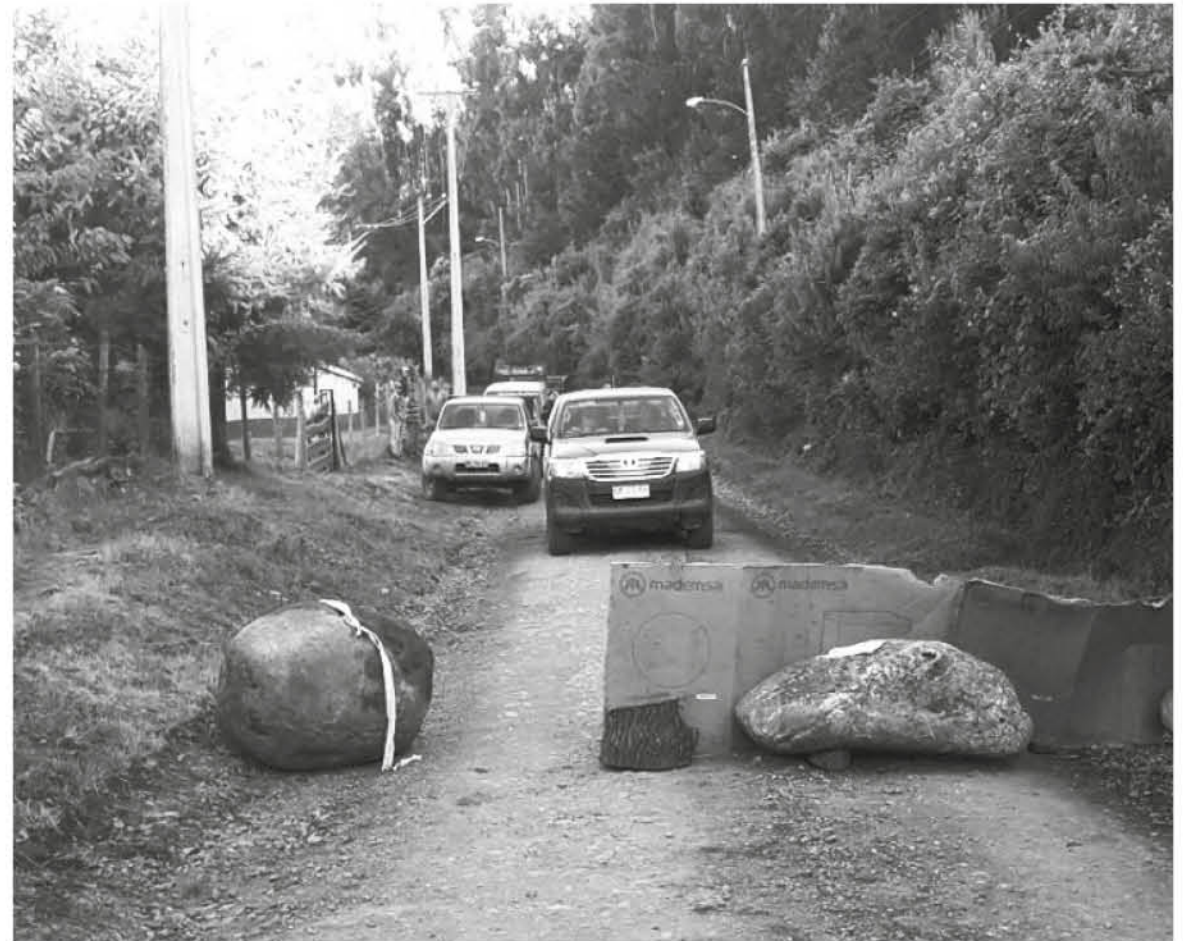
POR ALGUNOS MINUTOS el tránsito estuvo cortado en la ruta que une Quilleco con el sector Las Malvinas.

que mojar el camino para que no haya tanto polvo en suspensión”, concluyó.