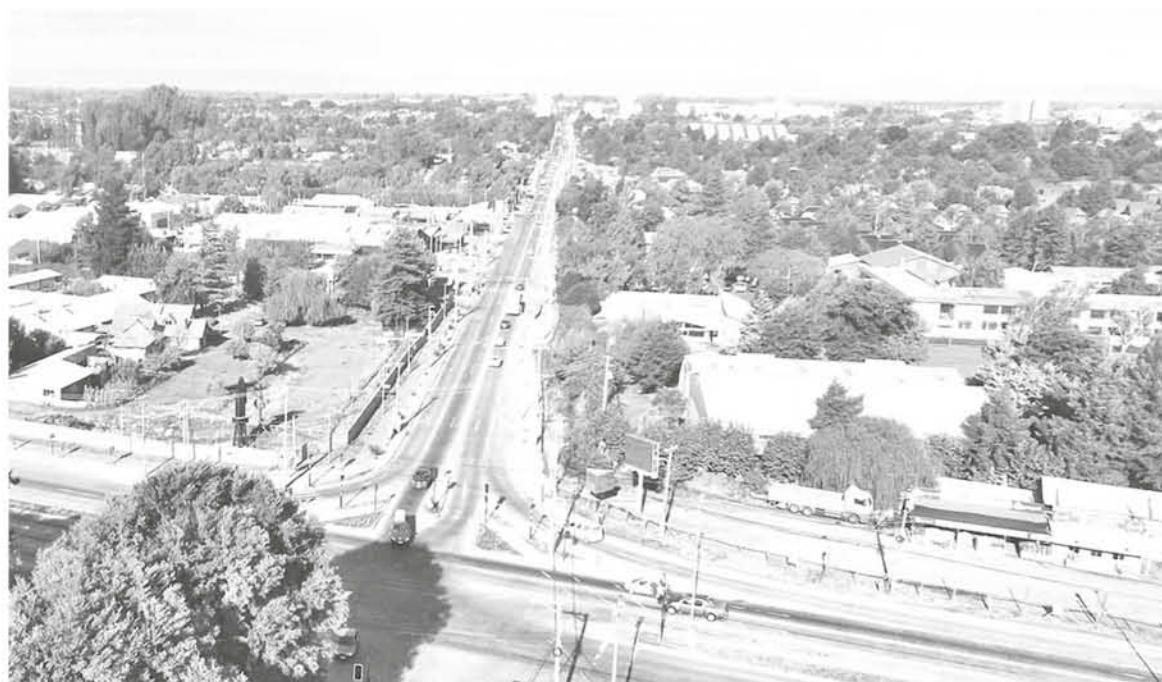
UNO DE LOS PUNTOS donde se genera congestión vehicular es el cruce de la avenida Gabriela Mistral.

En el caso de presenciarse alguna falta el uniformado indica que el procedimiento es tomar la patente del vehículo e interponer una denuncia en el primer Juzgado de policía local o llamar al 133.