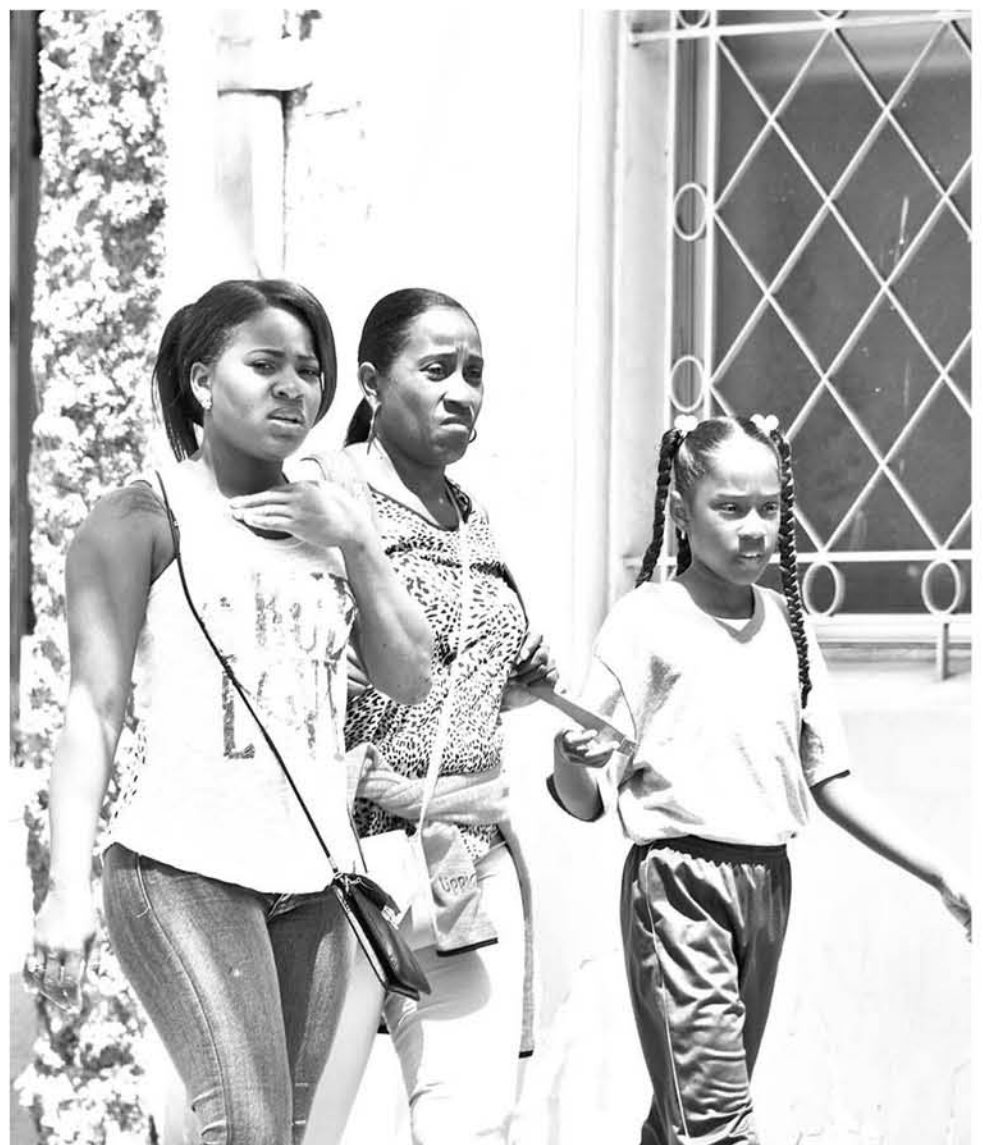
MUCHAS FAMILIAS extranjeras cuentan con el derecho a matrícula escolar.