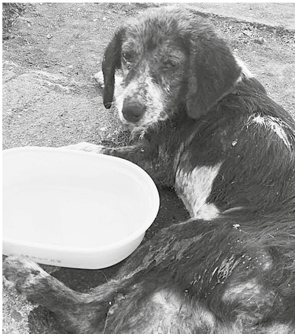
AL CAN SE LE DIO agua mientras esperaba atención de un veterinario. Horas más tarde, murió.

La reacción de grupos animalistas de la provincia de Biobío no se hizo esperar una vez conocido el episodio de maltrato. Lis Chávez, coordinadora de la ONG Noticiero Animal dijo que han visto "y vivido muchos casos, de animales abandonados en basureros, o botados en saco en ríos y los últimos casos que han sido en los incendios forestales, que las personas dejan los animales en la casa, con el pensamiento de que ellos se salvarán. Pues el resultado no es así, ellos se quedan esperando en casa, esperando a su amado dueño".