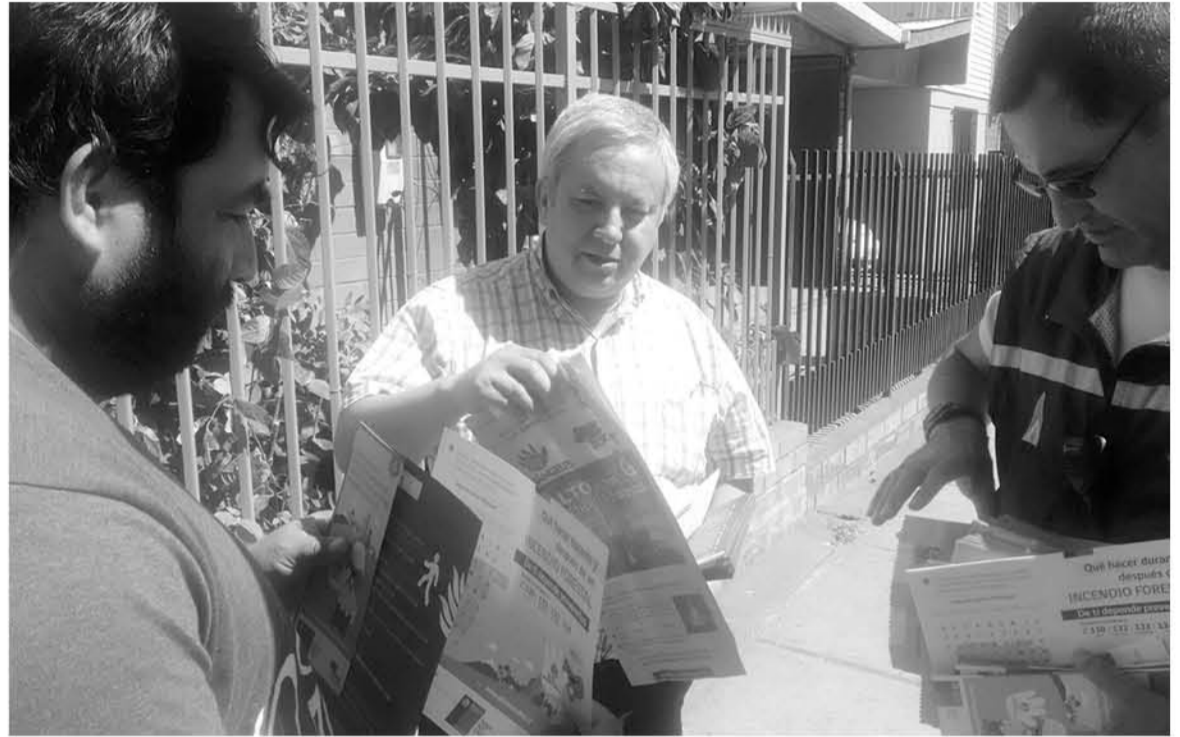
EL TRABAJO de estos brigadistas comienza con la prevención de incendios, durante todo el año, luego prosigue la preparación en terreno.

Su lugar de trabajo se vive en los llamados "campamentos forestales" donde realizan su jornada laboral - en el caso de esta empresa se vive en un periodo llamado "10x5"-