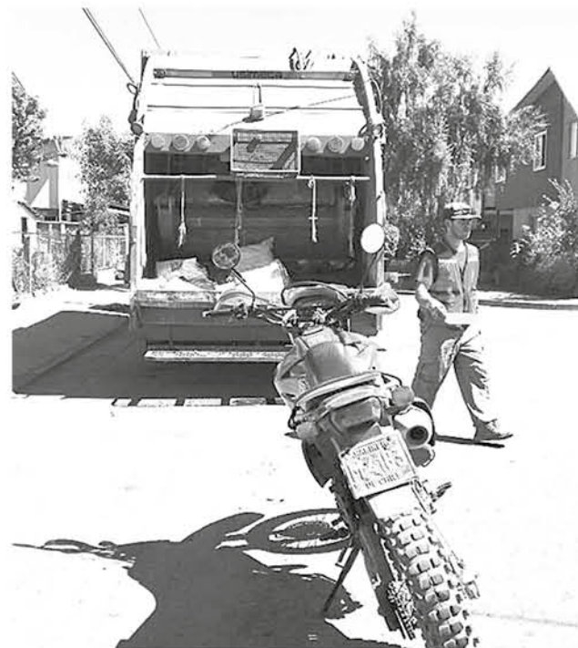
TRABAJADORES DE LA RECOLECCIÓN de basura encontraron a un perro amarrado en un saco.

cia responsable de mascotas la municipalidad de Tucapel tiene como objetivo además que hechos como el ocurrido el pasado martes no se repitan.