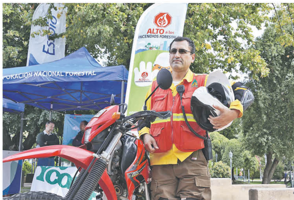
PERSONAL DE BRIGADAS forestales mantienen una preparación constante para las catástrofes naturales, por lo que se encuentran durante todo el año con actualizaciones.

Entre los avances anuales de estos “combatientes del fuego”, se suman cuatro nuevas brigadas para las zonas de interfaz -donde dos de ellas operan de manera mecanizada-, mientras que otras cinco corresponden a personal nocturno.