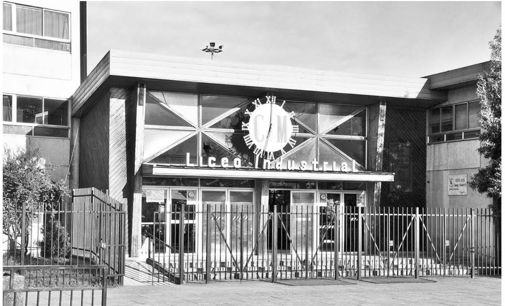
ESTABLECIMIENTOS SUBVENCIONADOS concentran mayor cantidad de alumnos.

Frente a la pregunta del arribo de haitianos a la zona, subrayando la dificultad del idioma, Camus indica que "hemos advertido que en los establecimientos de la provincia de Biobío se ha incrementado la presencia de migrantes haitianos, lo que obliga al