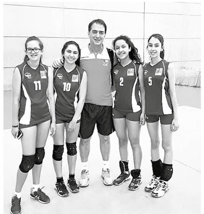
LAS JUGADORAS angelinas ya entrenan en Santiago.

"El objetivo es empezar a trabajar con este grupo de jugadoras. Ten-