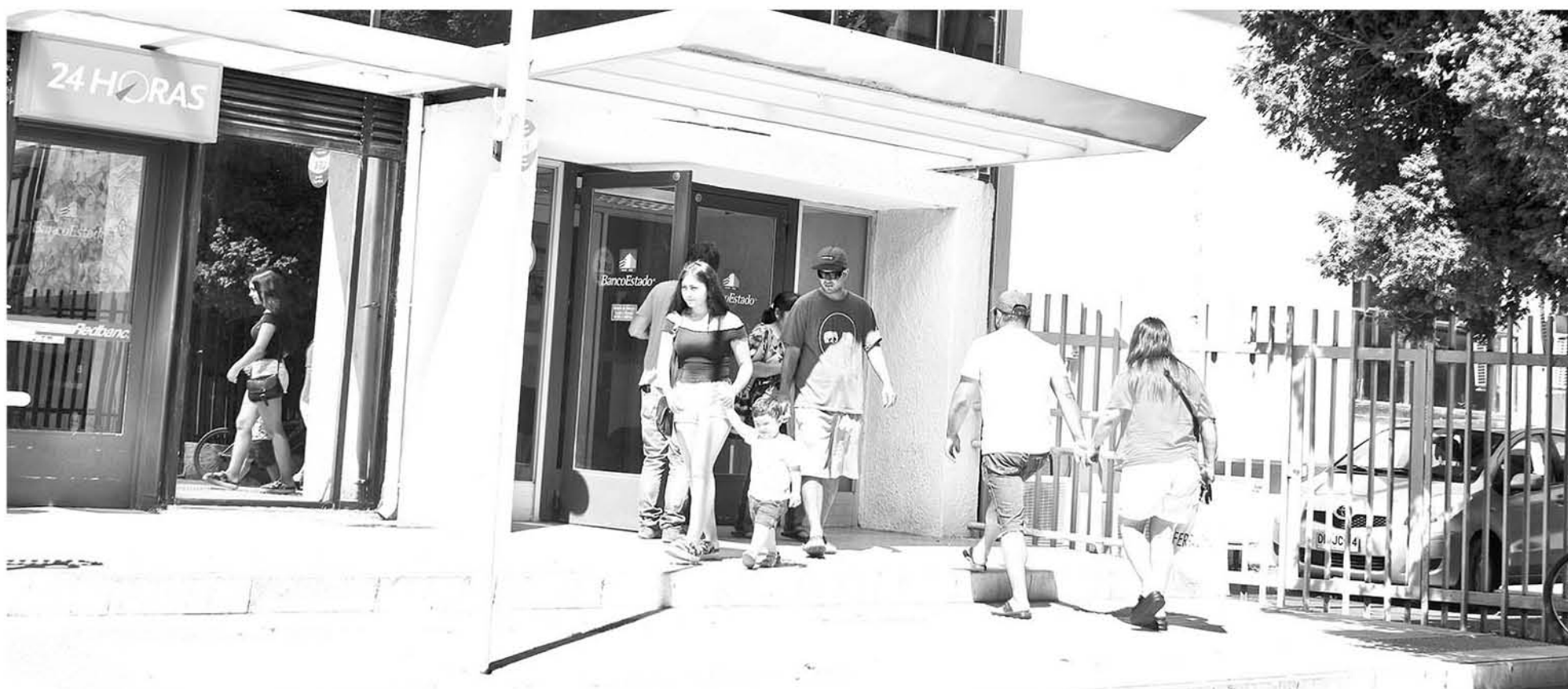
SE RECOMIENDA EVALUAR un crédito de consumo en un banco.