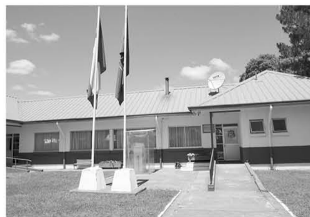
LA SIP de Santa Bárbara detuvo a dos delincuentes habituales.

Dos adultos con un amplio prontuario policial por diferentes delitos fueron detenidos por Carabineros de la SIP de la Cuarta Comisaría.