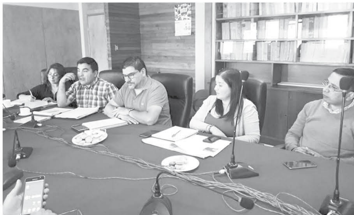
POR SEXTA VEZ se reunió la mesa forestal en Quilaco, instancia creada para abordar las problemáticas que afectan a los vecinos de esta comuna.

Entre las soluciones propuestas, figura la aplicación de líquido matapolvo en distintos puntos de la comuna.