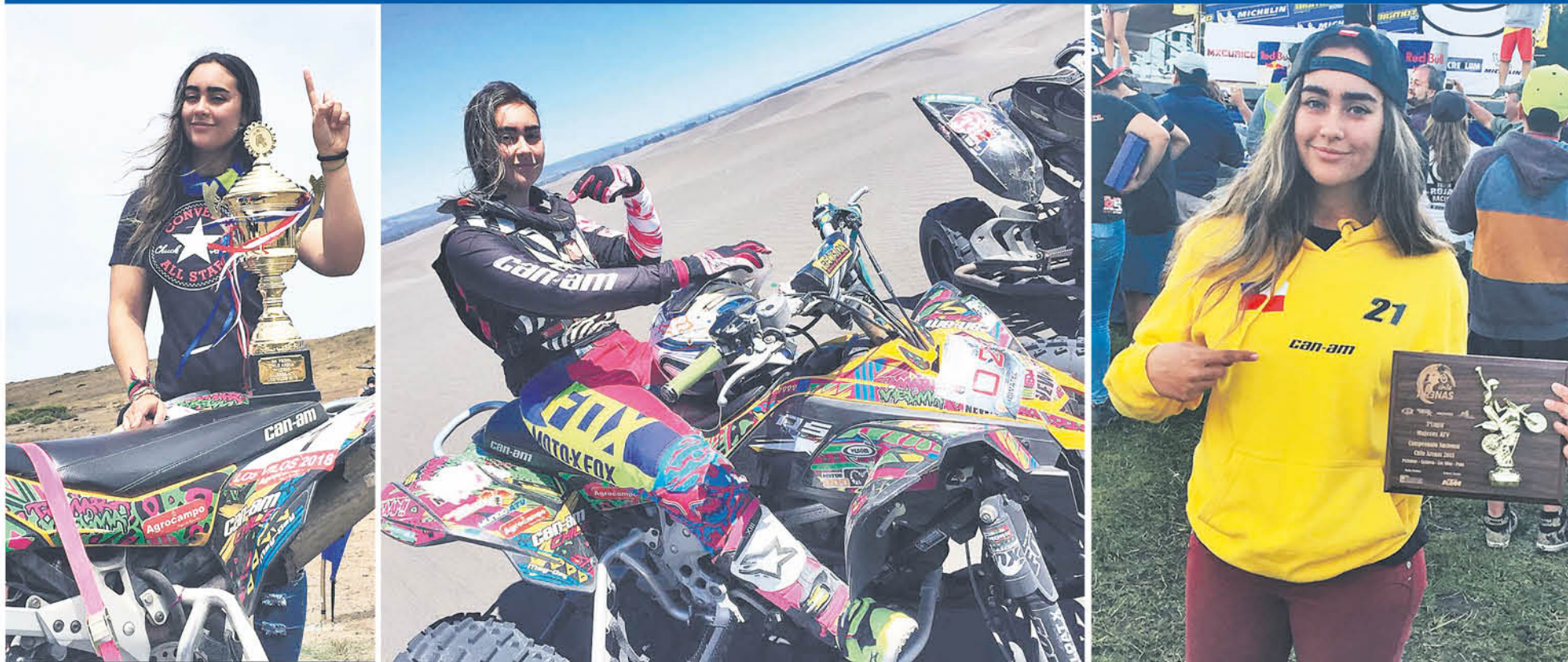
CON DESTACADAS ACTUACIONES en el país, las carreras acá le quedaron chicas, por lo que competirá en Argentina.