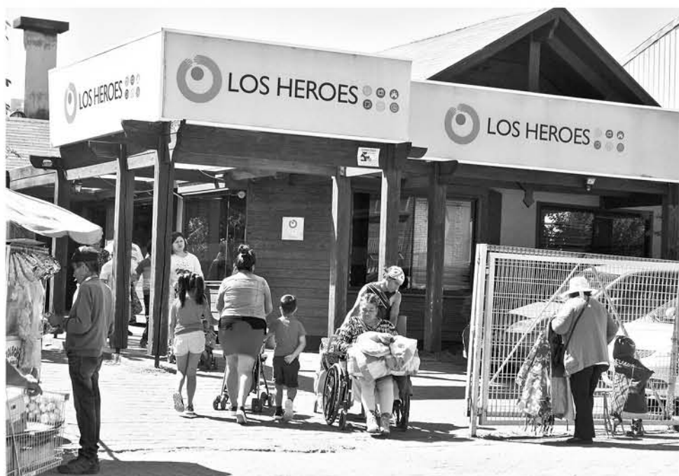
AUTORIDADES PIDEN revisar el CAE de las opciones crediticias.

en los intereses. "Cuáles son las tasas de interés, la carga anual equivalente los costos que están asociados a los créditos, el famoso CAE", indicó Valenzuela. "Todas las instituciones financieras, cuando una persona se va a endeudar debe por obligación entregarle toda la información, si esto último no sucede deben hacer los reclamos respectivos al Servicio Nacional del Consumidor Sernac a través del portal web de la institución o a su teléfono de contacto" finalizó la autoridad.