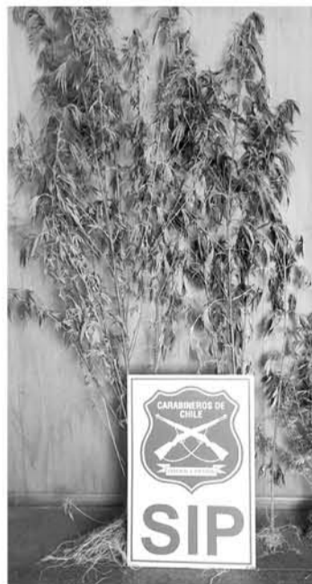
LA SIP de la Segunda Comisaría de Mulchén decomisó marihuana en el sector Tres Vientos.

Una semana después, de este último hecho consignado, funcionarios policiales de la misma sección investigativa arrestó a un joven de 26 años en la población O'Higgins por la plantación de dos matas de cannabis sativa de dos metros cada una.