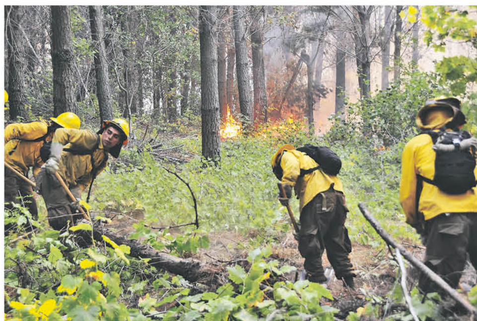
ESTOS HOMBRES SE DESARROLLAN generalmente en sus zonas de residencia por lo que muchas veces luchan con su vida por mantener el resguardo.