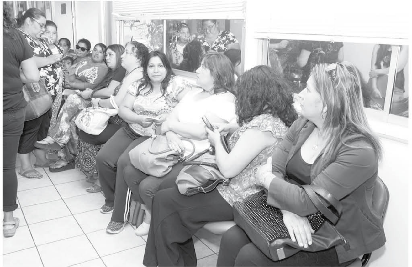
ESTE JUEVES las afectadas acudieron a una audiencia de conciliación en la Inspección Provincial del Trabajo.

Para conocer la situación en la que quedaron estas auxiliares de aseo, Diario La Tri-