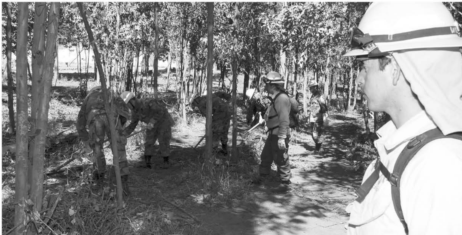
EN LA PROVINCIA se han mantenido las campañas preventivas por el número de focos que se han presentado en la temporada.

Cabe señalar que en el caso de prolongaciones incendiarias, deben arribar más brigadas y las funciones quedarán a cargo de quienes tengan las competencias, conocimiento y habilidades cualquiera sea su jerarquía y trabajo habitual dentro de la institución o entidad.