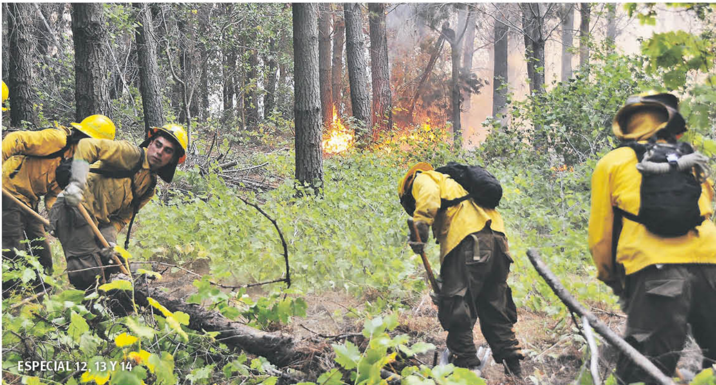
ESPECIAL 12, 13 Y 14

En la provincia de Biobío, que frecuentemente está bajo alerta, se encuentra un gran contingente de estas brigadas de emergencia, quienes hoy homenajean a los 13 caídos en el Maule en 2009.