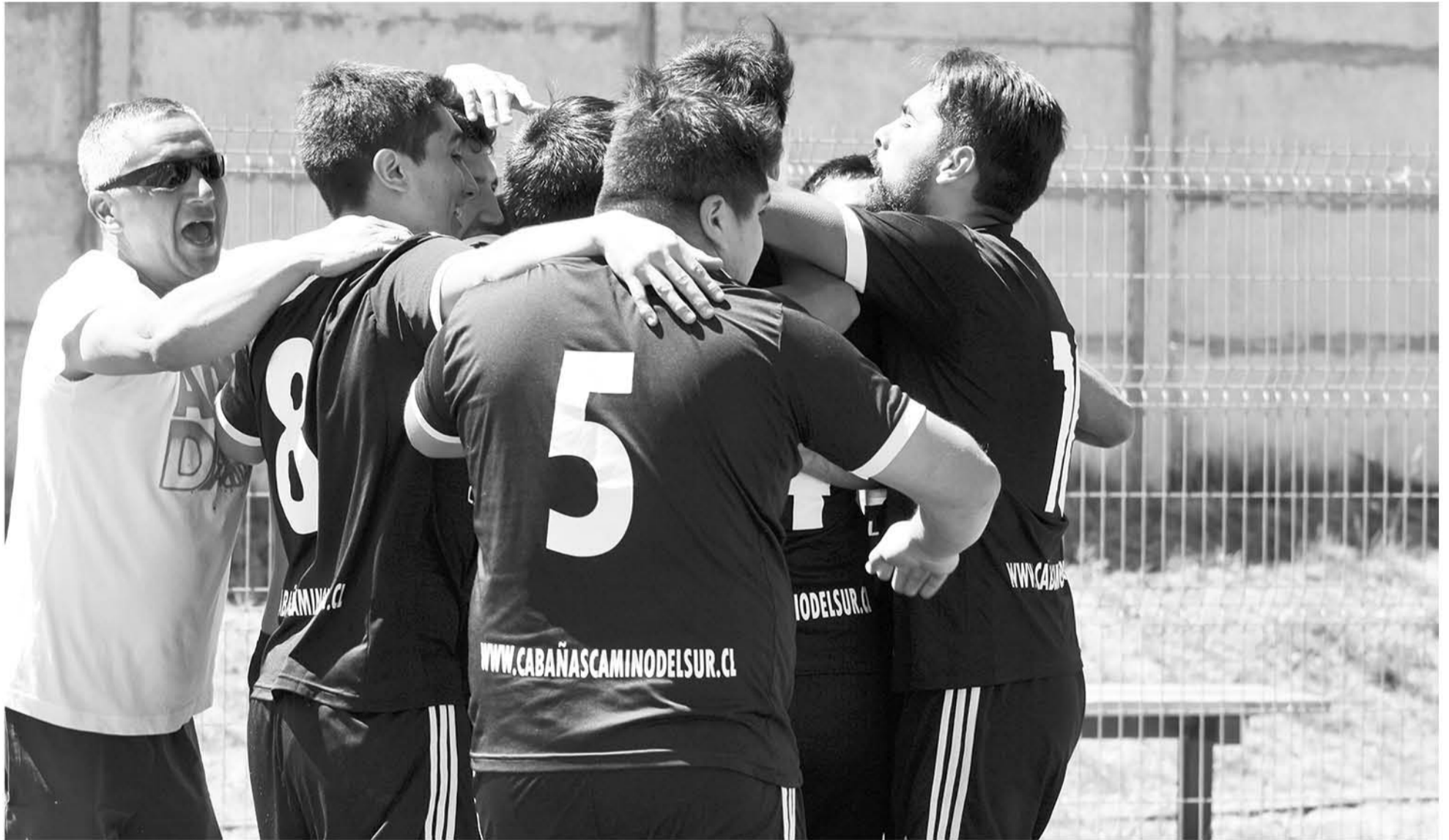
VICUÑA MACKENNA entró con todo en el segundo tiempo y se quedó con el clásico.

En un partidazo el equipo negro se impuso por 4 a 1 y clasificó como líder de su grupo a la fase siguiente de la copa veraniega de fútbol.