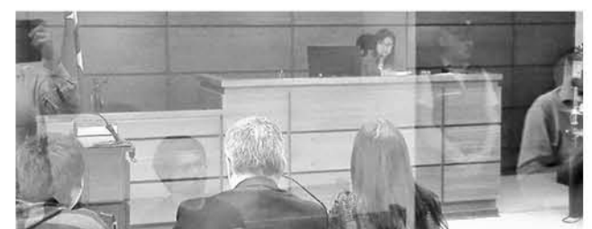
EL ÚNICO imputado por el ataque incendiario ya no será investigado por el Ministerio Público.

La defensa estimó la petición luego de que el Ministerio Público informara que no seguirá con la investigación en