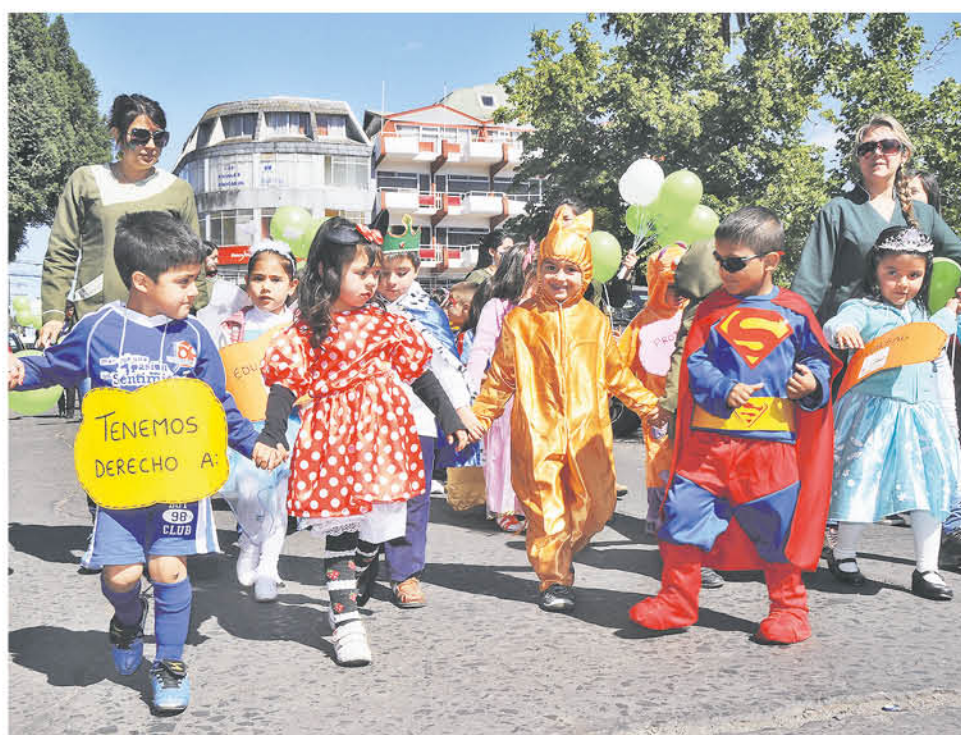
EL NUEVO PROTOCOLO aprobado por Junji cumple con el propósito de velar por la protección y el bienestar de niñas y niños.

Asimismo, es clave resaltar la creación de la Unidad de Promoción de Ambientes Bien Tratantes durante la presente administración, que releva la protección y cuidado de la niñez y de nuestros funcionarios y funcionarias para cumplir así con el bienestar integral y entrega de educación parvularia de calidad.