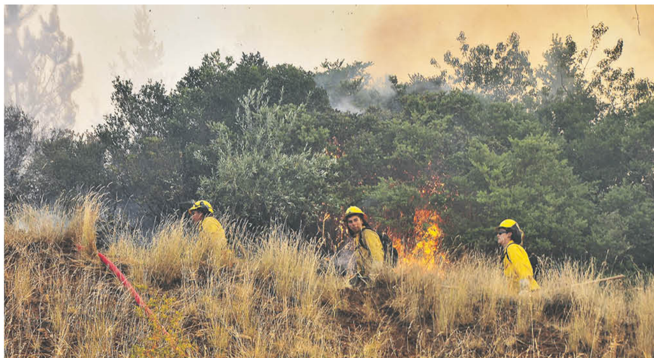
EL DÍA DEL BRIGADISTA fue reconocido a nivel nacional luego que nueve personas fallecieron en una catástrofe incendiaria durante el 2009.

“TODOS LOS BRIGADISTAS SON PERSONAS QUE ACTÚAN CON MUCHA PROFESIÓN Y EN SU PROCEDER, casi siempre sucede que operan en los lugares donde residen, por lo que su trabajo es un acto de mucho rigor y protección”.