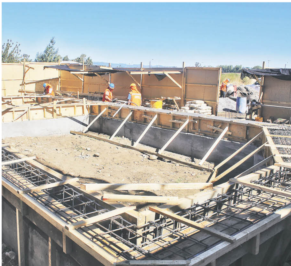
LAS DOS OBRAS VISITADAS por el alcalde de Negrete corresponden a proyectos financiados con fondos FRILL.

Estos proyectos se enmarcan en una línea de trabajo impulsada por el alcalde en materia de sedes sociales, y se unen a la construida Sede 'Agrupación Compromiso' y tres nuevos proyectos ya adjudicados, y que prontamente iniciarán sus obras: sector 'El Consuelo', 'Villa las Estrellas' y población 'Luis Salamanca'.