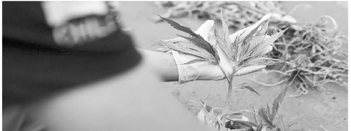
LA BRIANCO de la PDI de Los Ángeles incautó 106 plantas de marihuana en El Rosal.

La droga fue incautada para continuar con la investigación que permita descubrir a las personas responsables del gran cultivo. Preliminarmente se trataría de personas desconocidas que ingresaron sin autorización al predio para realizar la plantación.