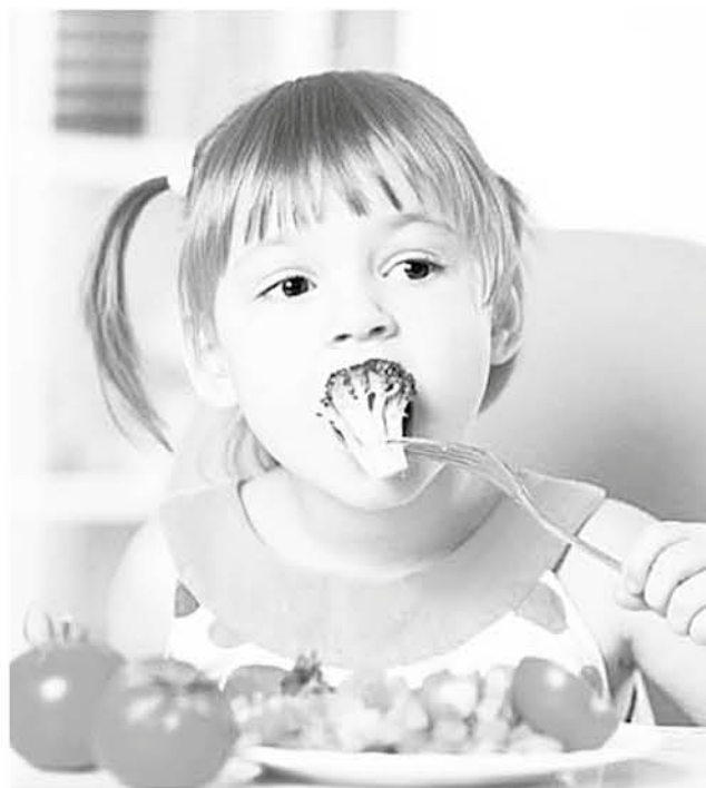
CUANTOS MÁS ALIMENTOS conozca en la primera etapa de su vida, menos le costará adaptarse. Es importante variar.

La dificultad de alimentar así a los más pequeños de la casa siempre está, por lo que es necesario algunas técnicas para lograrlo.