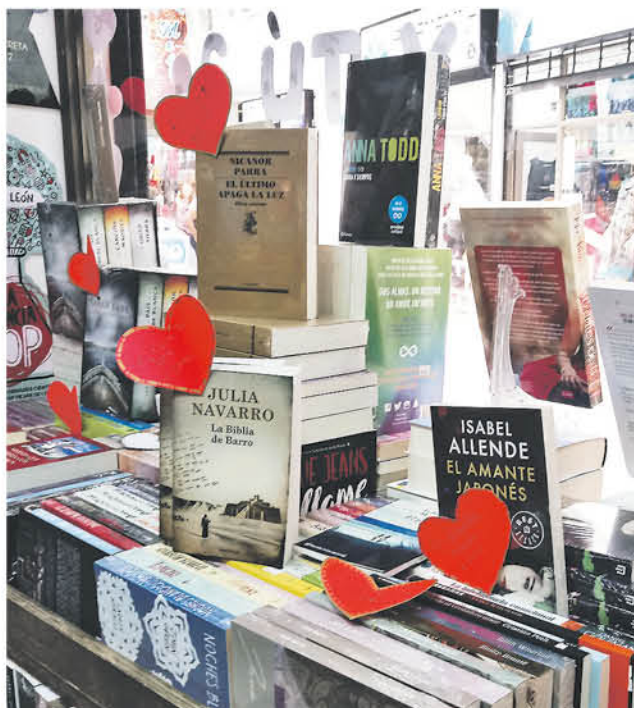
OTRA OPCIÓN son los presentes literarios, algunos de los textos

Esta mujer señaló que espera con los brazos abiertos a sus clientes, quienes como cada año esperan seguir entregando amor en esta fecha de gran importancia para las parejas.