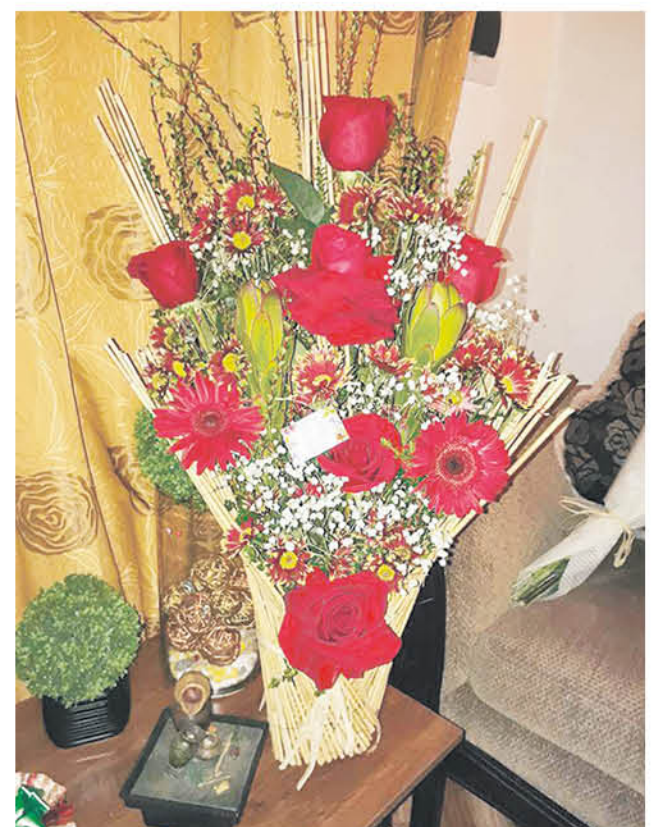
LA FLORERÍA “Jardín El Encanto” se especializa hace más de 35 años en la venta de arreglos florales para esta temporada.

“En nuestro local nos especializamos por la venta de diversos arreglos y muchos de nuestros clientes nos prefieren en esta temporada, así