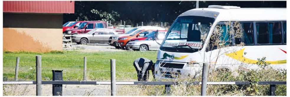
EL ACCIDENTE OCURRIÓ en el patio del terminal de buses Islajacoop.

Hasta el cierre de la presente edición el joven se mantenía en estado grave en la Unidad de Cuidados Intensivos del Complejo Asistencial Dr. Víctor Ríos Ruiz.