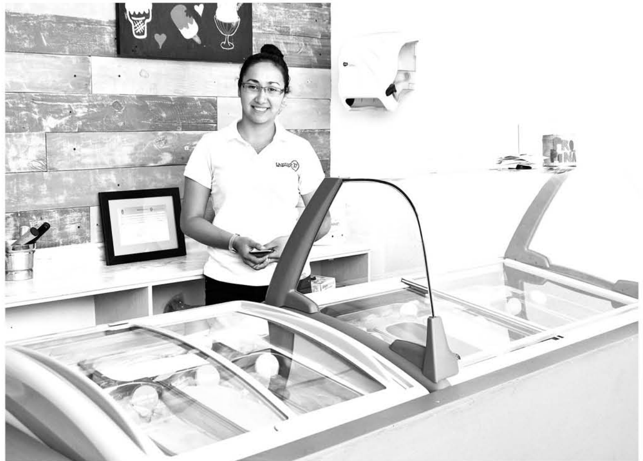
HELADERÍA LATITUD 37 trae sus productos desde Concepción.

En materia de saneamiento y prevención de riesgos se controla abastecimiento de agua potable, receptáculos de fácil limpieza para acumulación de desechos, área de mantención de plaguicidas y otras sustancias tóxicas separada de zona de elaboración y almacenamiento a alimentos, sistema eficaz de evacuación de aguas residuales, protección contra vectores, entre otros requisitos; mientras que en ámbito de competencia de salud ocupacional, se