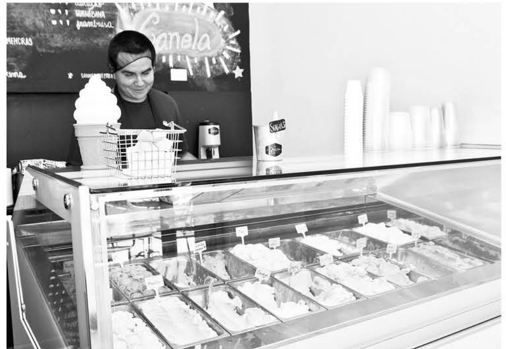
LOCALES EXCLUSIVOS de ventas de helados.

Otro caso son las heladerías, locales donde sólo se venden estos productos en forma exclusiva y que también cuentan con todas las normas sanitarias en regla.