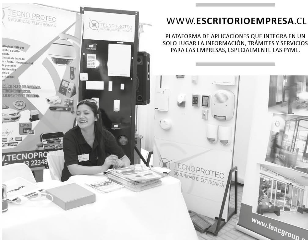
SE CREARON más de mil empresas en Biobío.

El seremi invitó a los futuros emprendedores a utilizar esta opción "aparte de simplificar los trámites a realizar, baja los costos de lo que implica crear su empresa y también cuenta con un soporte que permite seguir creciendo", señaló.