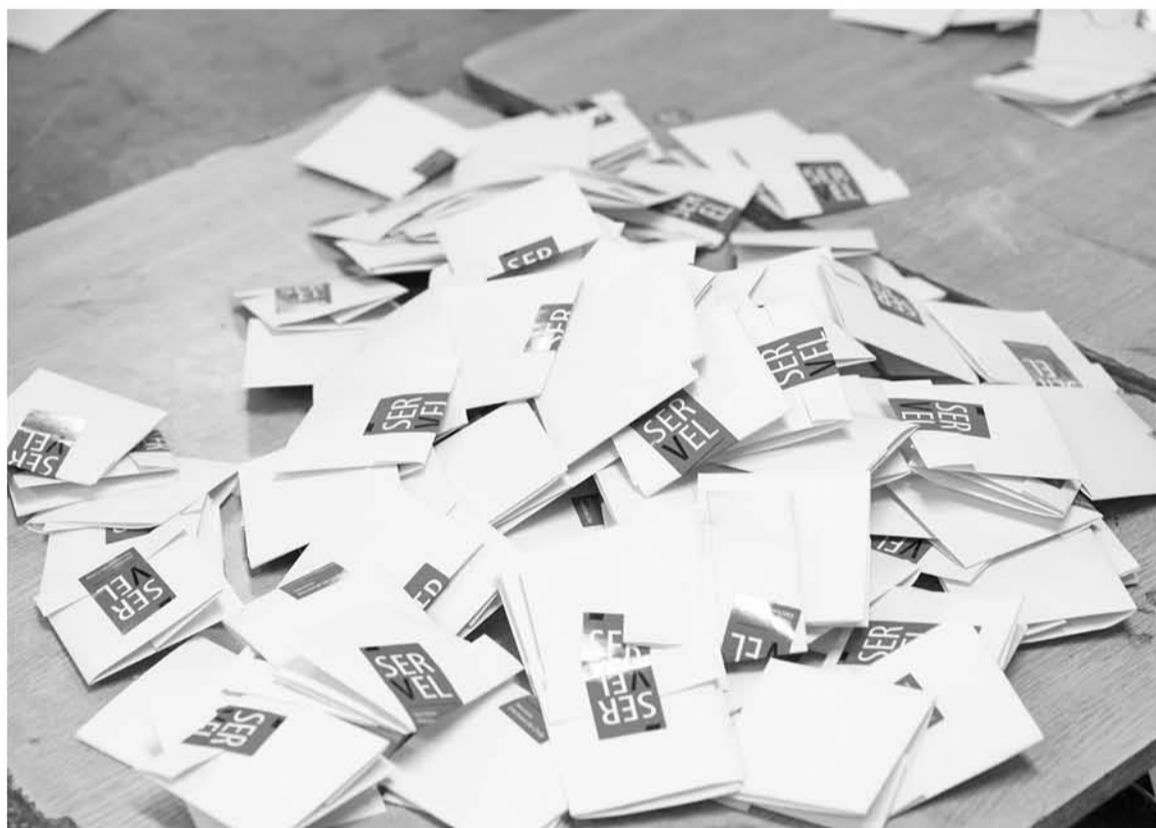
UN TOTAL DE 41 mujeres fueron elegidas diputadas a nivel nacional en las pasadas elecciones de noviembre de 2017.

Estas medidas, que se aplican en las elecciones parlamentarias de 2017, 2021, 2025 y 2029, tienen como propósito incentivar la presencia de mujeres en el ámbito legislativo.