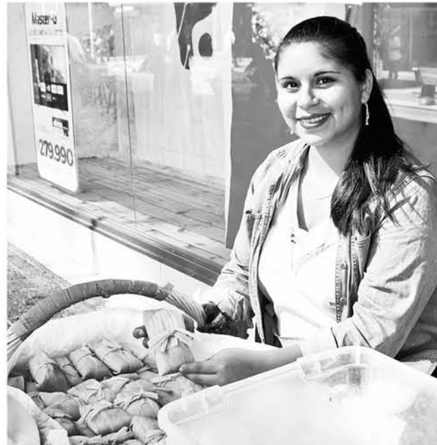
LAS MUJERES TRABAJAN para tener ingresos durante la temporada de invierno.