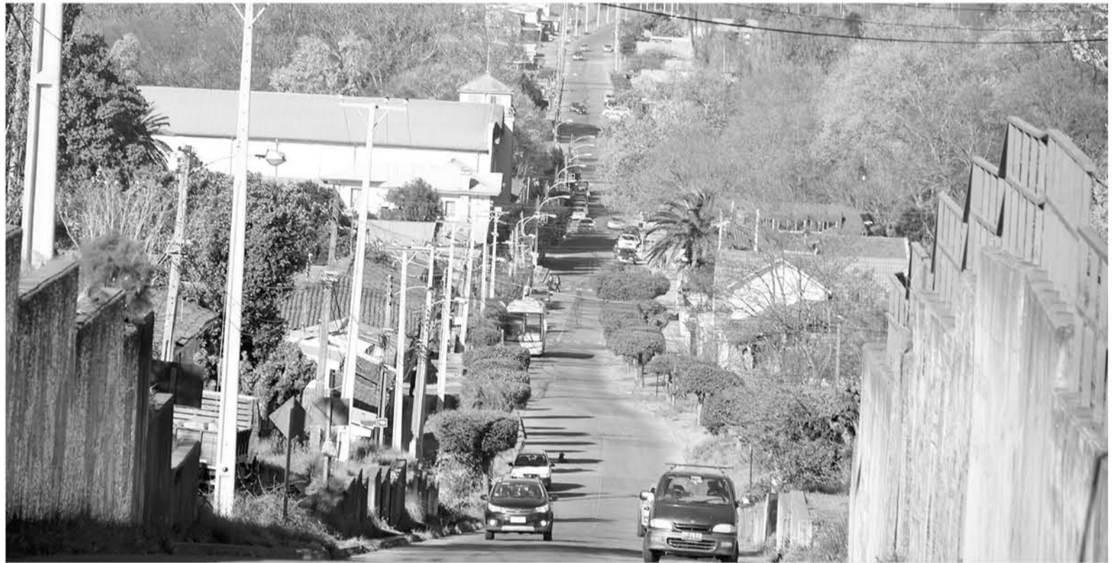
EL BARRIO HÉCTOR DÁVILA baja desde el sector Parque La Virgen hacia el centro de Yumbel. (Foto de contexto)

Ella comentó que una de las obras por la que han venido luchando por años es por la pavimentación de la calle Valdivia que baja desde la Virgen hacia el centro de la ciudad.