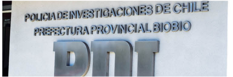
LA BRIGADA DE HOMICIDIOS de la PDI angelina sigue con las diligencias para esclarecer cómo ocurrió el accidente.