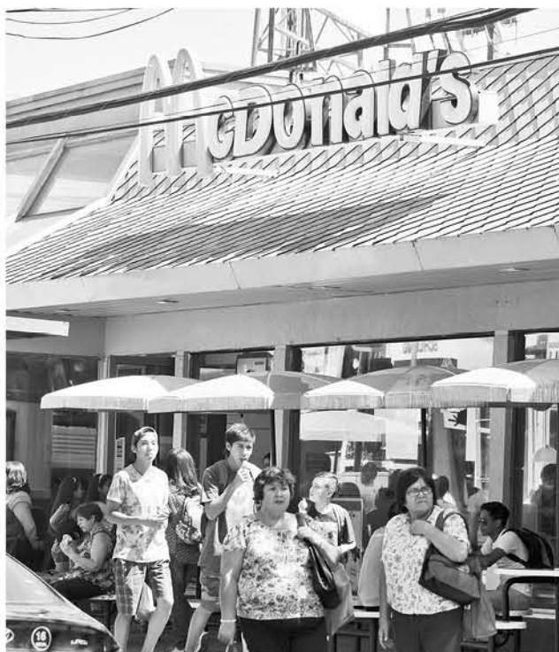
LA PREFERENCIA son los helados soft.