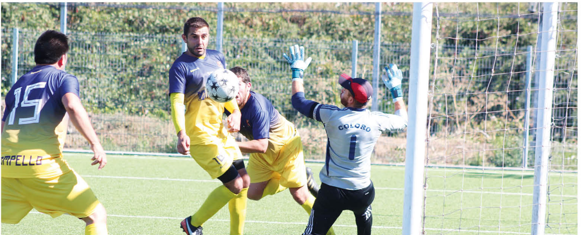
PESE AL ESFUERZO, el equipo angelino debió conformarse con un empate, luego de ir ganando en tres ocasiones.

La escuadra angelina no pudo mantener la ventaja que tuvo en tres ocasiones y sólo firmó un empate. Ahora deberán conseguir un buen resultado en tierras yumbelinas este fin de semana.