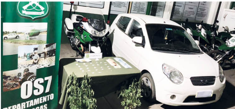
CARABINEROS DEL OS7 de Los Ángeles incautó marihuana, cocaína y dinero en efectivo.

Carabineros del OS7 de Los Ángeles incautó dinero en efectivo, un vehículo, cocaína y cuatro matas de cannabis sativa.