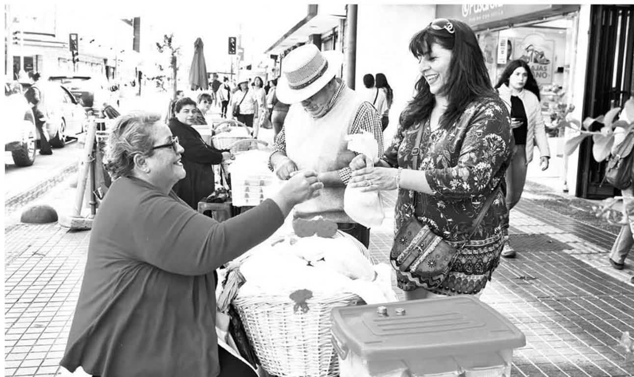
EL PROCESO DE ELABORACIÓN comienza a las 4 de la madrugada con el fin de tener productos altamente frescos.

Flor agregó que esta es su labor de vida y “lo bueno de este trabajo, es que la gente reconoce los buenos produc-