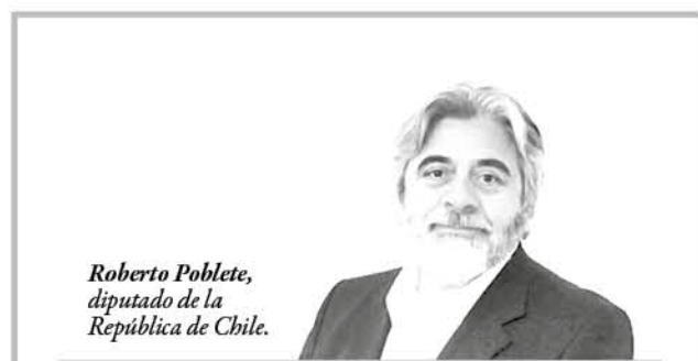
Roberto Poblete, diputado de la República de Chile.

"En este medio siglo, hoy Chile tiene menos pobres que hace 50 años?". La respuesta es claramente, sí tiene menos pobres. La interrogante que continúa, "¿en este medio siglo en que en moneda de hoy, el Estado ha contado con 25 billones, trescientos mil millones de pesos anuales, ha sido capaz de invertirlo adecuadamente para eliminar a pobreza?". Esa es la duda. Algunos sostienen que, "más bien el recurso social aumenta los ingresos de las ONG y otras instituciones o simplemente el porcentaje de los que quieren ser pobres, es más que el 2% del ejemplo comentado". La respuesta de esta interrogante, servirá para que, en palabras de un líder DC, dicho partido encuentre el camino que se esfumó.