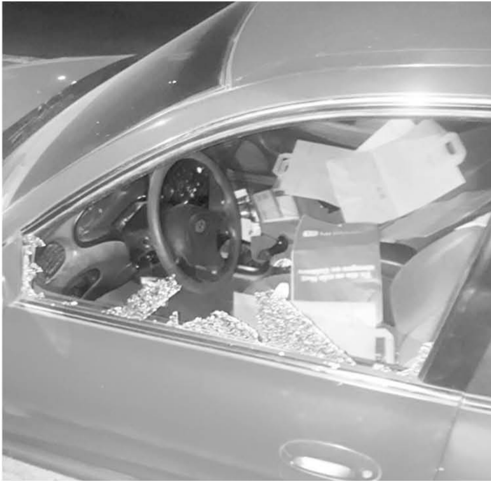
A LAS 22:15 HORAS se produjo la detención y recuperación de todos los objetos sustraídos.

Efectivos de la Sección de Intervención Policial de la prefectura Biobío detuvieron a un hombre que sustrajo artículos de un automóvil. El sujeto tiene antecedentes por diferentes delitos.