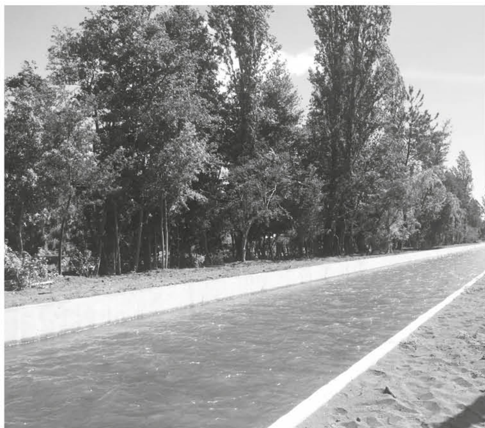
CNR ESTÁ EJECUTANDO un programa sobre calidad de aguas en la provincia del Biobío.

Dicen que existe equilibrio en la repartición de dineros para en el primer concurso de riego del año 2018.