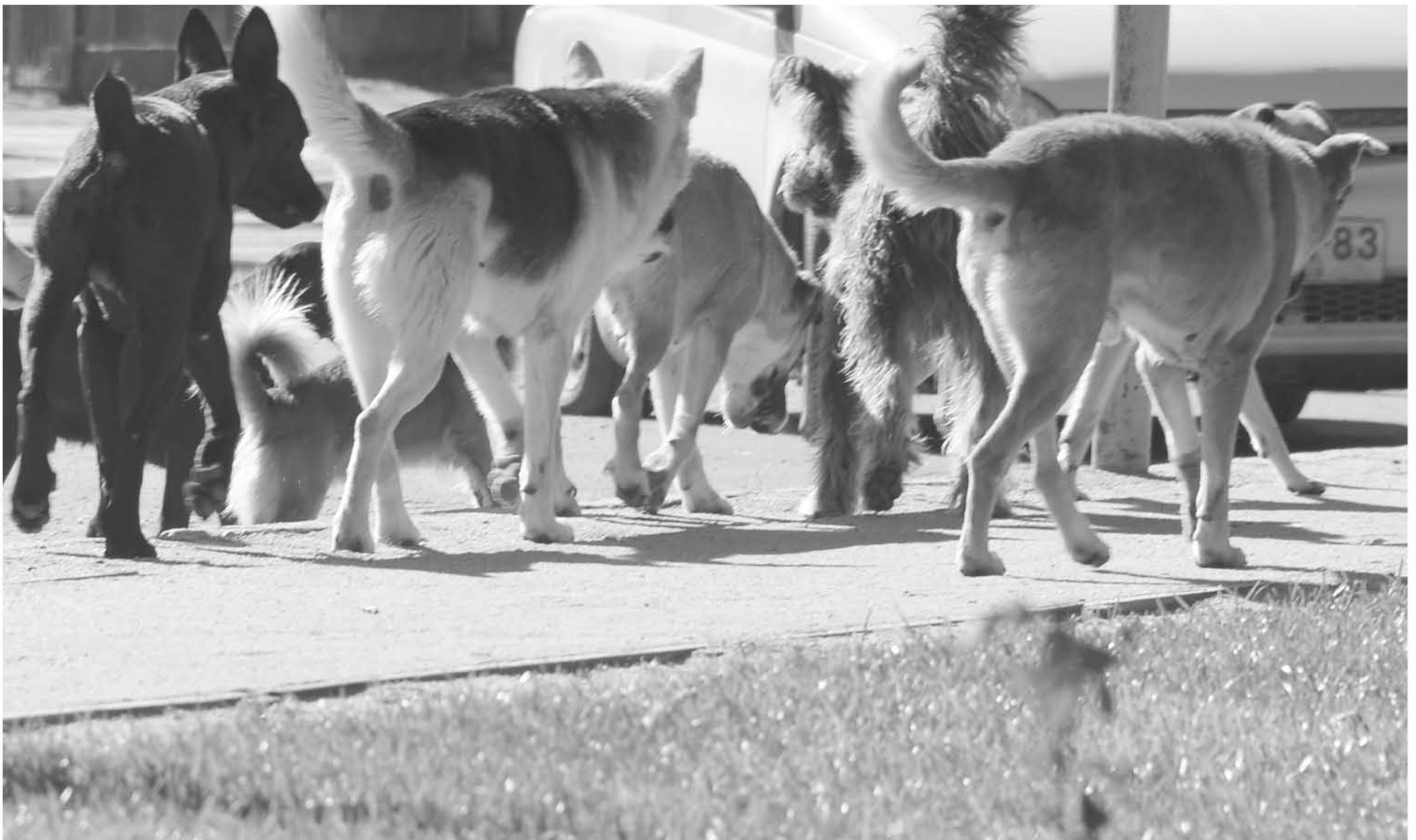
DESDE EL HOSPITAL reconocieron que la presencia de perros vagos en su perímetro es un problema que ha obligado a adoptar acciones. (Foto contexto)