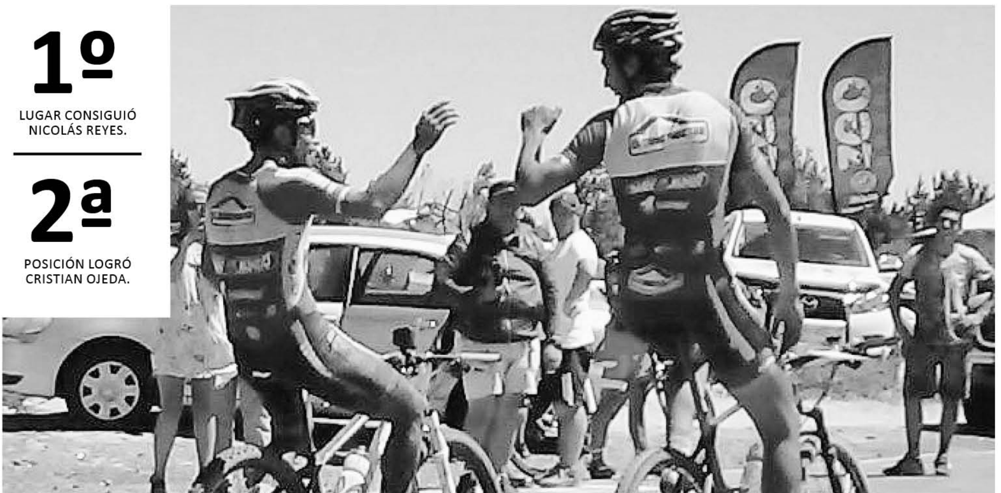
LOS DEPORTISTAS no ocultaron su felicidad por el gran resultado obtenido.