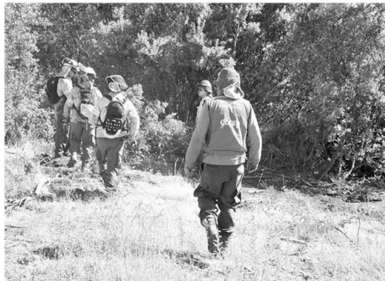
EN NEGRETE y Mulchén la emergencia ya fue controlada.

Loma Verde, sector de Mulchén, 0,01 hectáreas fue el saldo de los efectos del incendio. En tanto que en el sector noroeste de Negrete el resultado fue la misma superficie damnificada.