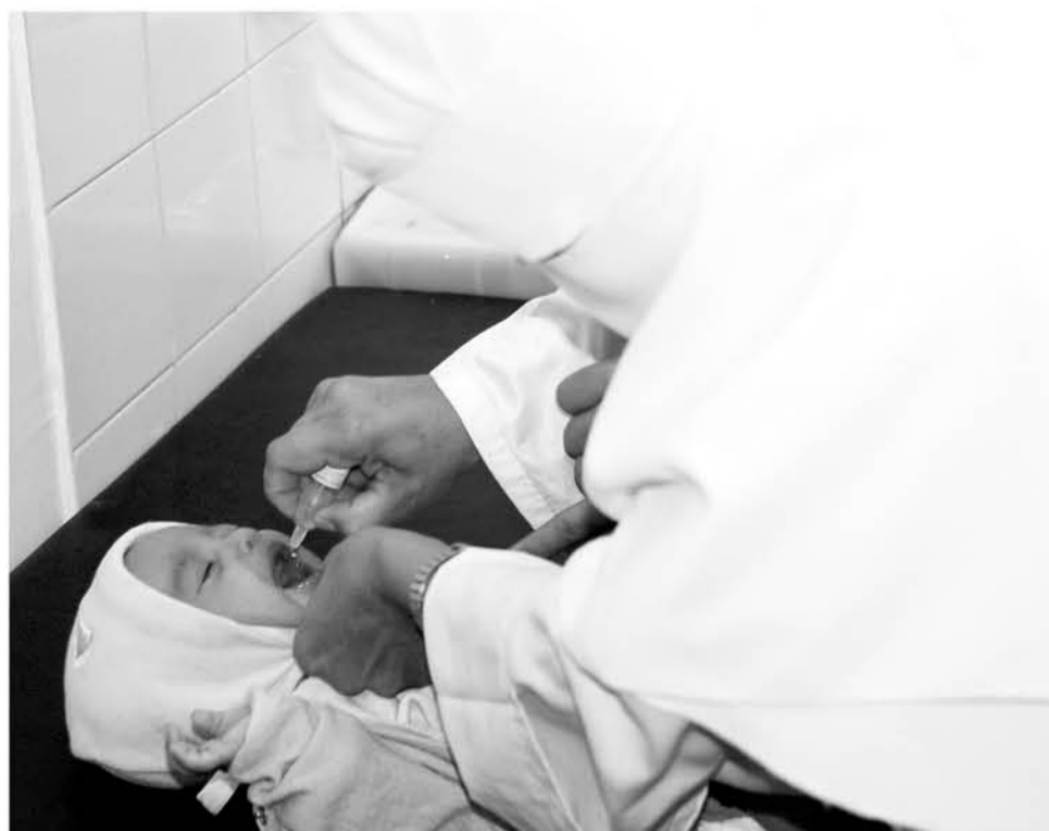
EL PROGRAMA CERO prioriza la atención bucal de menores desde los seis meses de vida. (Foto de contexto)

El Servicio de Salud Biobío realizó la derivación en el marco del Programa Cero, cuyo objetivo principal es dar atención inmediata y medidas de prevención a niños desde los 6 meses de edad.