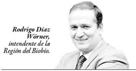
Rodrigo Díaz Wörner, Intendente de la Región del Biobío.

Otro punto es la violencia en la pareja, hechos que todos los chilenos debemos estar en alerta para identificar y denunciar a tiempo. Y para erradicar los abusos es que hemos extendido una red de atención, protección y reparación, sumando un total de 4 casas de acogidas (Chillán, Los Ángeles, Chiguayante y Cañete; y con recursos para tener una nueva en Talcahuano), e inauguramos un Centro de la Mujer en Santa Bárbara, sumando 15 en la Región; asimis-