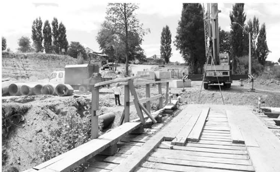
HASTA FINES de febrero estará cortado el tránsito tanto para vehículos como para personas por este sector de Nacimiento.

Al corte de la vía para la circulación de vehículos, hasta fines de febrero habrá prohibición del tránsito peatonal, ya que el antiguo viaducto de madera será totalmente desmantelado.