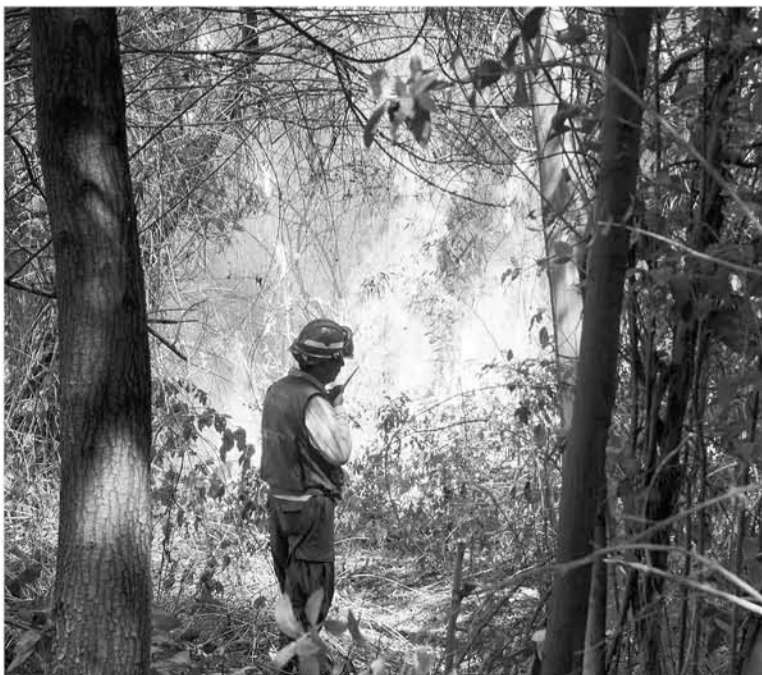
EN LOS CHENQUES 20 hectáreas de superficie han quedado afectadas por las llamas.

Dos focos se mantuvieron activos hasta la tarde de este martes. Brigadas de la Conaf trabajaron en faenas de control con grupos terrestres y aéreos.