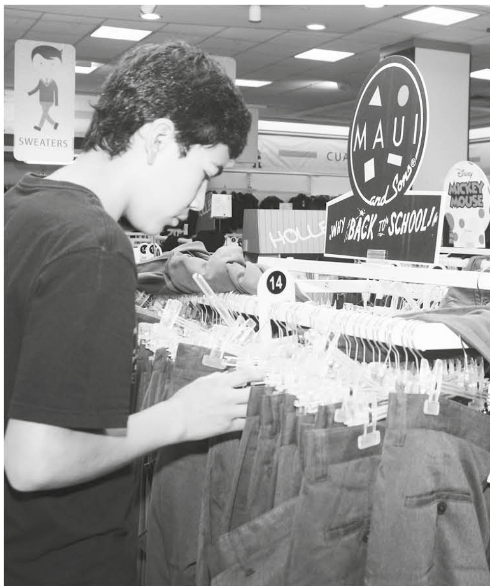
ÚLTIMAS SEMANAS de vacaciones antes de iniciar el período escolar.

La recomendación de la autoridad educacional es comparar entre por lo menos tres tiendas, poner cuidado con los intereses que se genera comprar a plazos y revisar cuidadosamente los requerimientos de cada colegio o escuela para no infringir el derecho a la educación igualitaria.