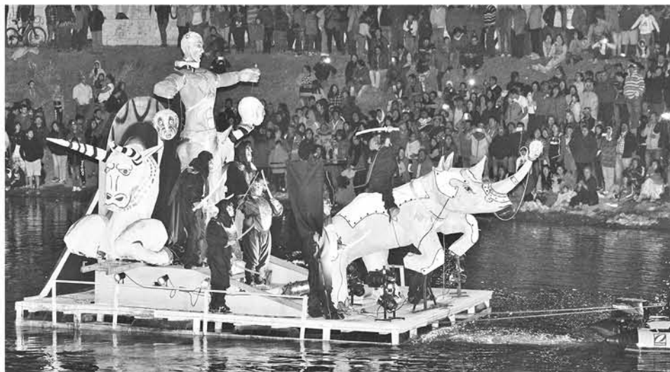
LA PELÍCULA 300 fue parte también del espectáculo.

El segundo lugar fue obtenido por personal de Bomberos, quienes revivieron la película "Brigada 49" con una dinámica del bomberil. Estos explicaron sentirse alegres por este lugar ya que dedicaron tiempo a las diversas