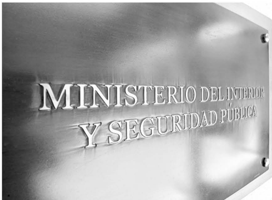
EL MINISTERIO DEL Interior presentará un recurso de queja y apelación.

“Siendo de incumbencia exclusiva del Ministerio Público ponderar el mérito de valor de la investigación realizada, se rechazan las solicitudes del interviniente Intendencia Regional y se tiene por comunicada la decisión de no perseverar en la investigación promovida por el Ministerio Público, quedando sin efecto la formalización de la investigación, respecto de cada uno de los imputados y por los delitos que le fueran atribuidos”.