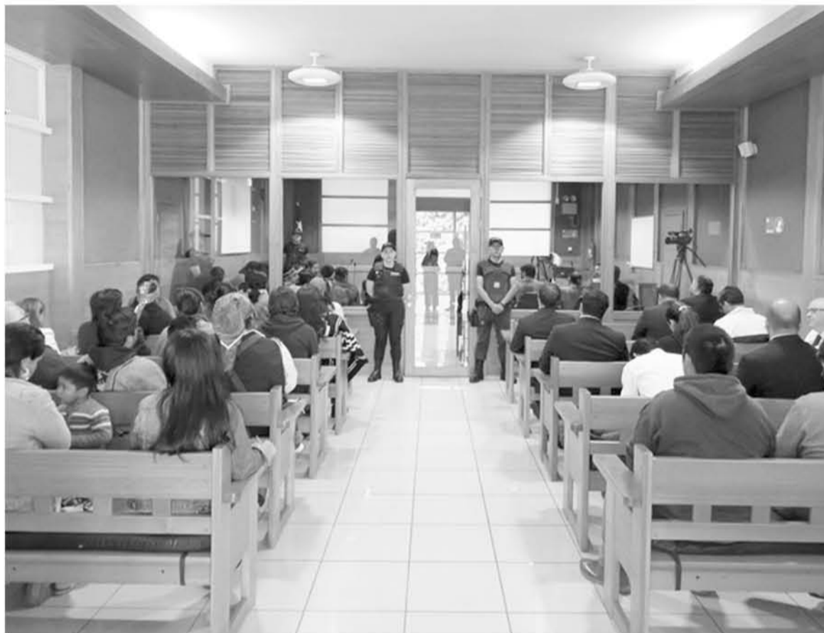
EN EL JUZGADO de Garantía de Temuco se sobreseyó a los comuneros mapuches imputados.

El Ministerio del Interior y Seguridad Pública presentará un recurso de queja y apelación al sobreseimiento definitivo en la