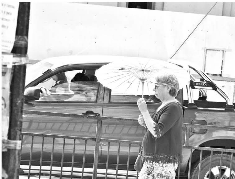
CON LOS ADULTOS mayores hay que tener cuidado ya que en algunos casos ellos pierden la sensación de sed por lo tanto es complejo medir la deshidratación en ellos.

más aún lactantes lo mejor es seguir lactancia materna e impulsar la técnica. En el caso de los preescolares recomendando consumir mucha agua, pero con los adultos mayores hay que tener cuidado ya que en algunos casos ellos pierden la sensación de sed por lo tanto es complejo medir la deshidratación en ellos y más aún si atienden a casos de enfermedades donde hay que medir el consumo del agua”.