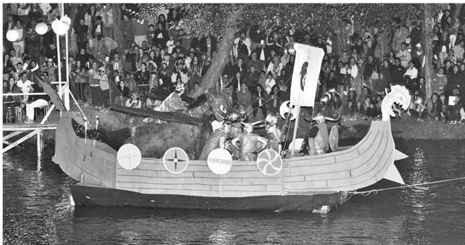
PERSONAL MUNICIPAL participó de la instancia con distintos carros alegóricos que animaron la jornada.

emergencias que han tenido que enfrentar en este periodo y además de la edificación de la puesta en escena.