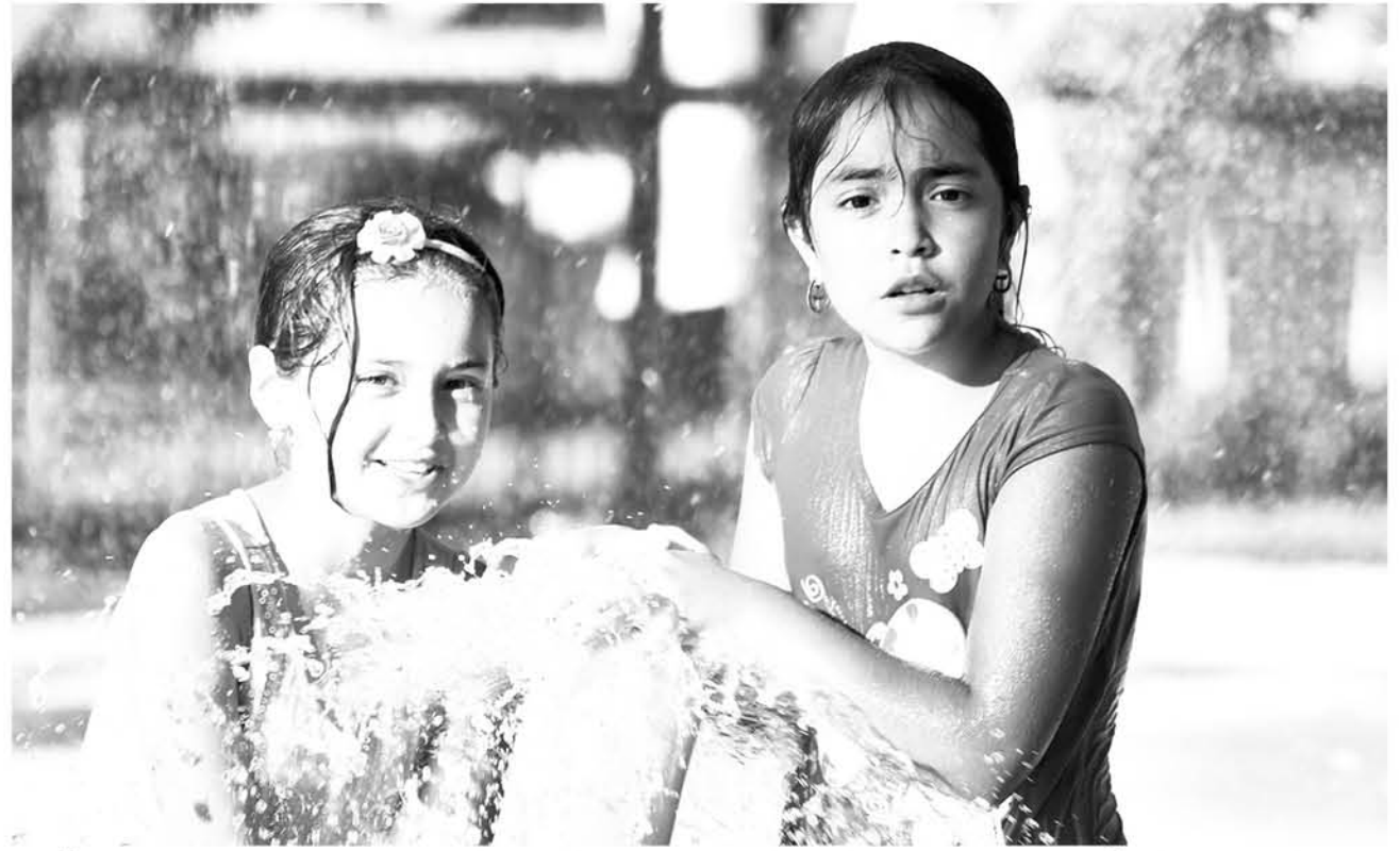
ESTÁ VIGENTE UNA ALERTA que para la zona del interior superará el umbral, específicamente en Los Ángeles superarán los 33 grados.

La profesional de la salud también recomienda usar gorro, poleras que no dejen áreas de cuerpo expuestas, si