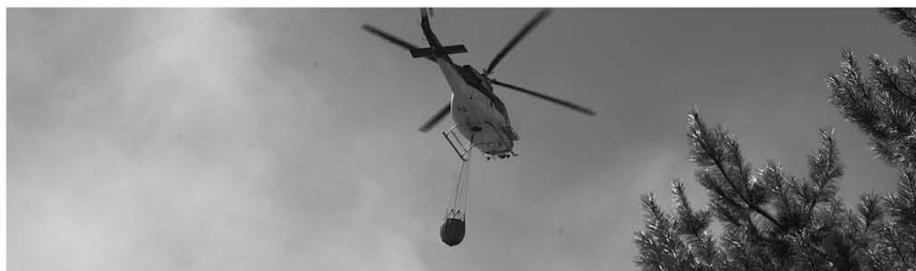
CONAF ha debido utilizar recursos aéreos para combatir los distintos focos de incendios forestales que se han presentando en la provincia.

En lo que va de esta temporada 2017-2018, en la Región del Biobío tanto Conaf como las empresas forestales han combatido 1.294 incendios forestales, un 9 por ciento menos que el período 2016-2017. En cuanto a la superficie, hasta la fecha se han visto afectadas 3.777 hectáreas, un 97 por ciento menos que la temporada anterior.