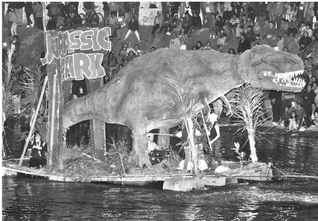
LOS TRIUNFADORES de esta velada fueron los jóvenes de la agrupación "Jupach" con la dinámica Jurassic Park.