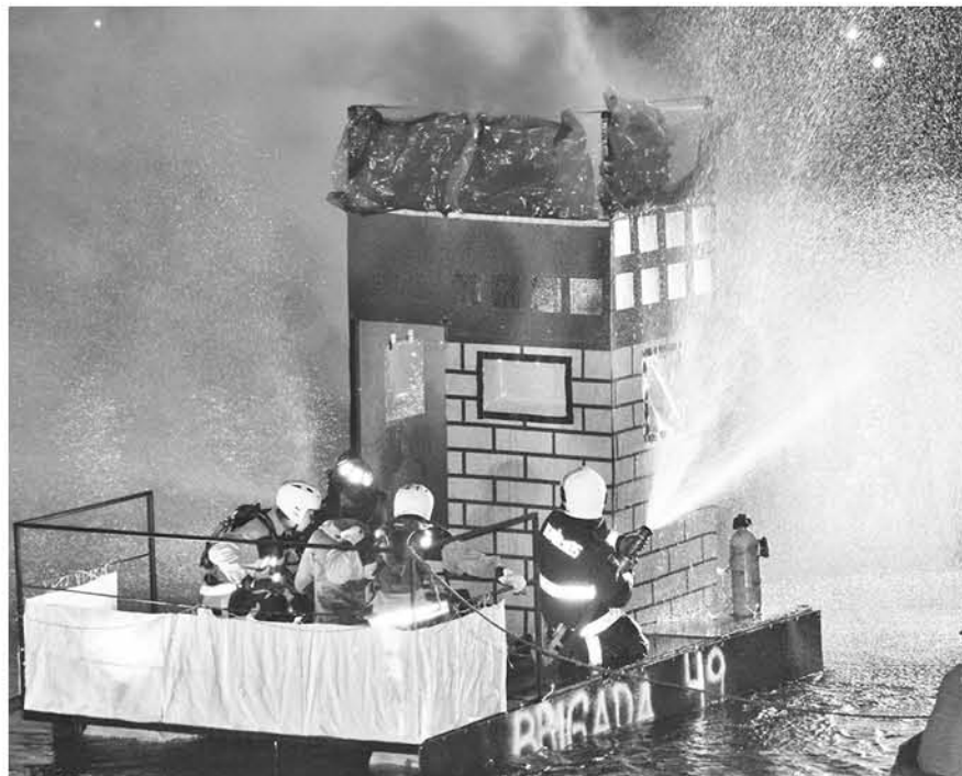
EL SEGUNDO LUGAR lo obtuvo personal de Bomberos, quienes señalaron que el premio será para distintos implementos de necesidad de los voluntarios.