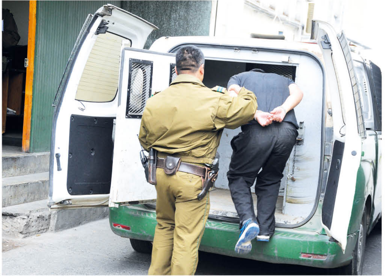
EL DETECTOR DE HUELLA utilizado por Carabineros permitió a la víctima comprobar la propiedad del celular recuperado. Fotografía de contexto.

La detención del imputado se produjo en calle Calbuco esquina volcán Miño, quedando a disposición de tribunales para su control de detención respectivo.