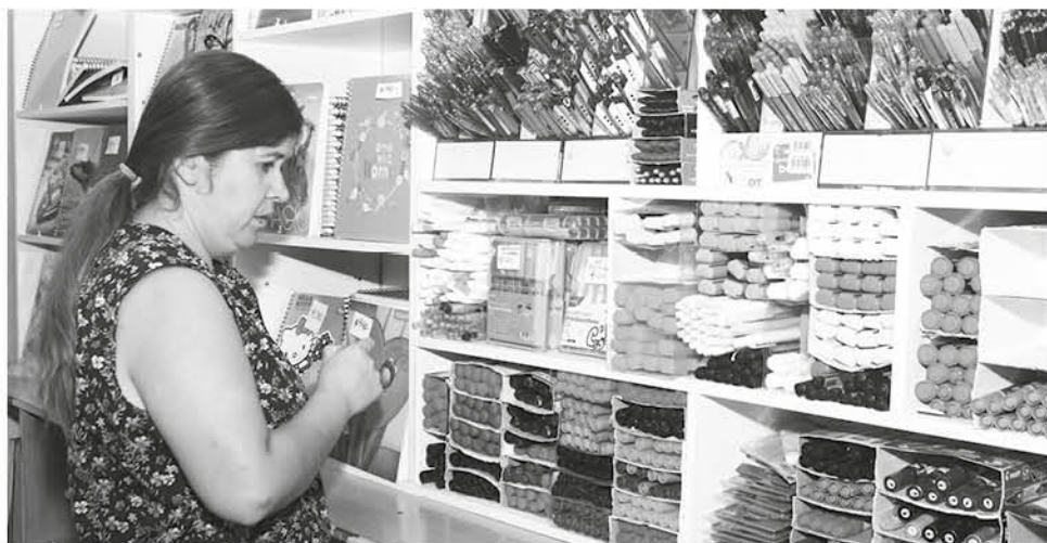
RETAIL implementa mayor facilidad en sus pagos para asegurar sus clientes.