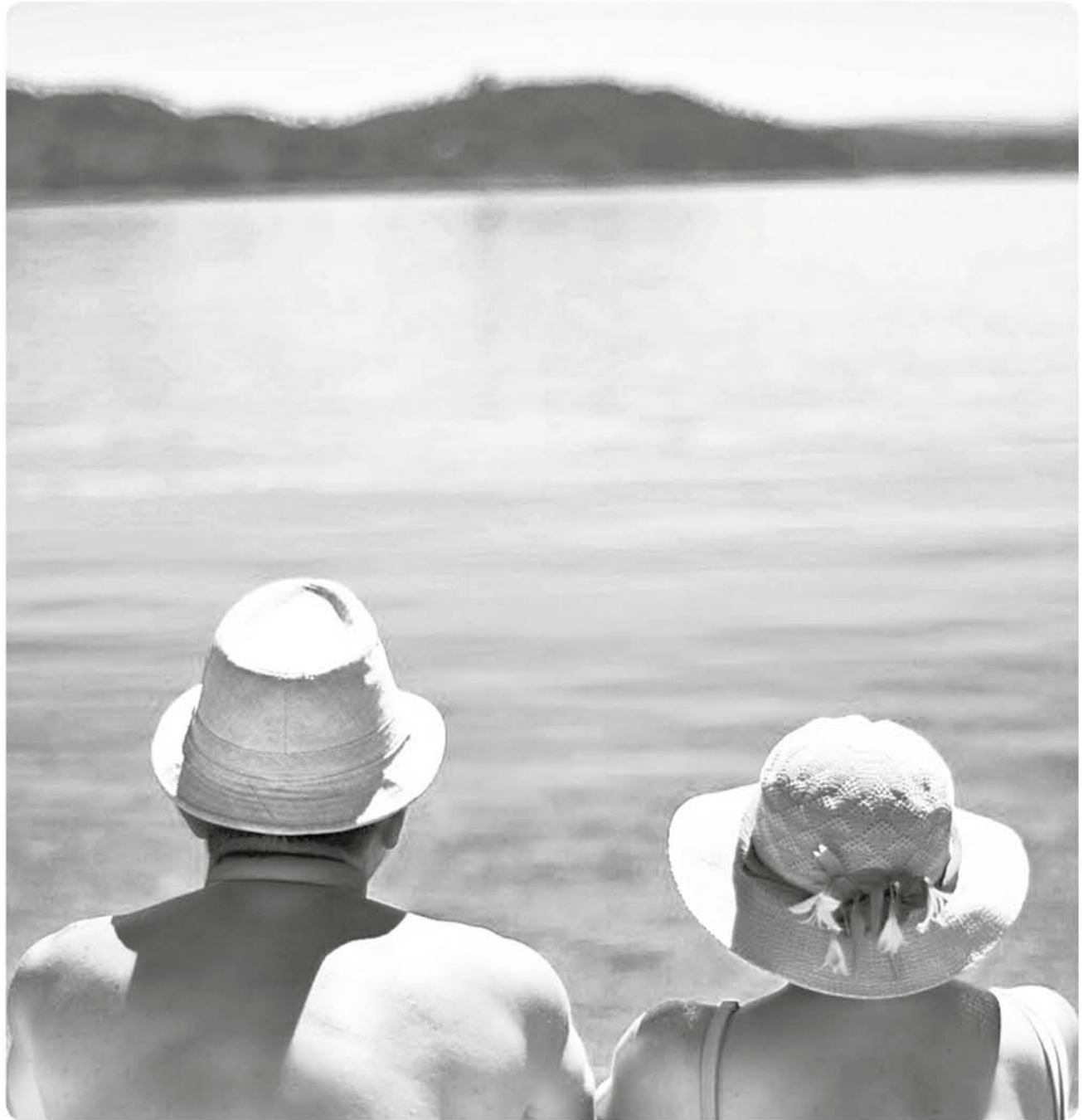
Fotografía: Gonzalo Espinoza S. Fotografía tomada a mis padres a orillas del lago Panguipulli.