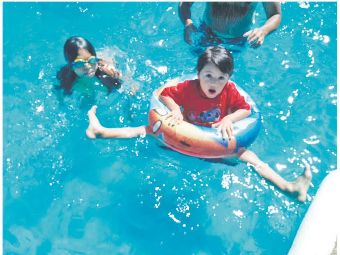
SÓLO EN LA ÚLTIMA semana se han registrado dos incidentes donde menores han fallecido en piscinas.

En tanto, sobre el cuidado de menores explicó que “siempre es vital que, en primer lugar, los niños estén en vista de los padres. Ellos no pueden ingresar a recintos con agua solos y tiene que