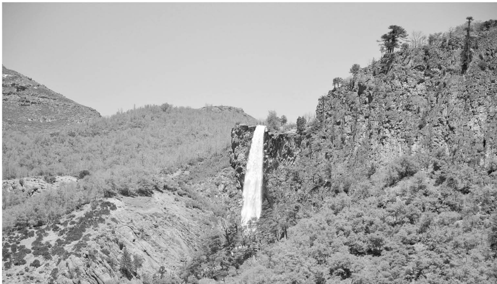
TRAS ESTE INFORME, Chile se comprometió plantar 100 mil hectáreas y recuperar 100 mil hectáreas de bosques nativos.

La Estrategia Nacional de Cambio Climático y Recursos Vegetacionales permite al país dar cumplimientos a los compromisos internacionales de reducción de emisión de gases efecto invernadero (GEI).