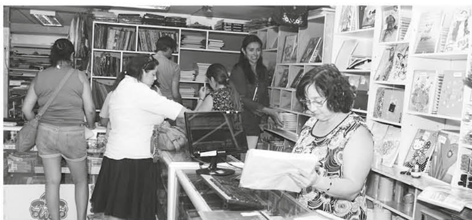
SUPERINTENDENCIA DE EDUCACIÓN recomienda cotizar en diferentes tiendas antes de comprar.