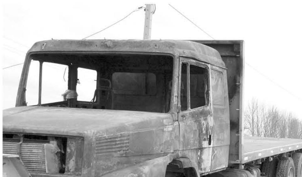
LA ASOCIACIÓN DE Contratistas Forestales es uno de los gremios que ve con preocupación el aumento de ataques incendiarios a camiones en la zona de conflicto.

Mediante un comunicado la Asociación de Contratistas Forestales reiteró críticas al Ejecutivo por la falta de condiciones de seguridad para los trabajadores del área dentro de la denominada zona del conflicto mapuche.