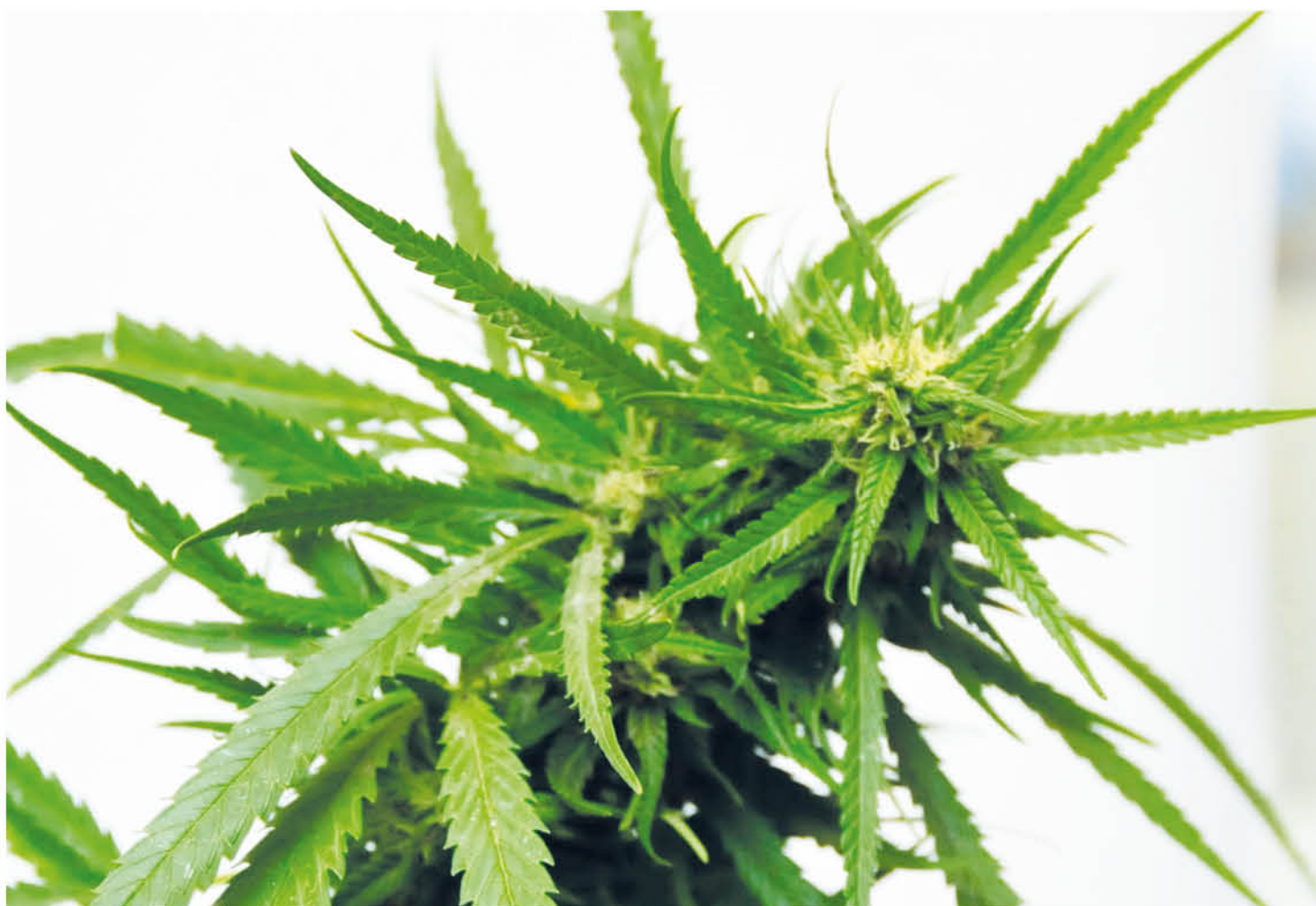
DOS HOMBRES FUERON APREHENDIDOS por infracción a la ley 20.000. (Fotografía de contexto)

Ambos quedaron a la espera del respectivo control de detención. El operativo policial fue realizado por funcionarios del Retén Centinela.