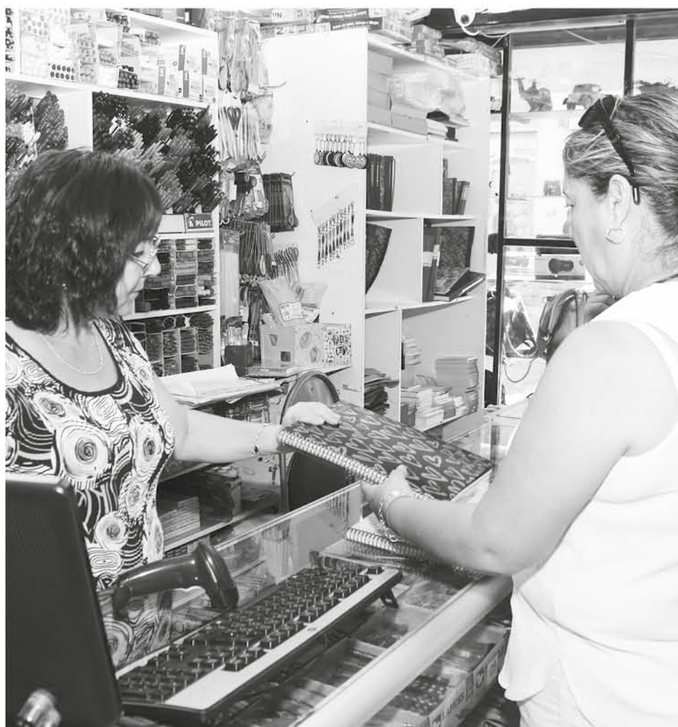
LA TENDENCIA de los consumidores es preferir el comercio local.