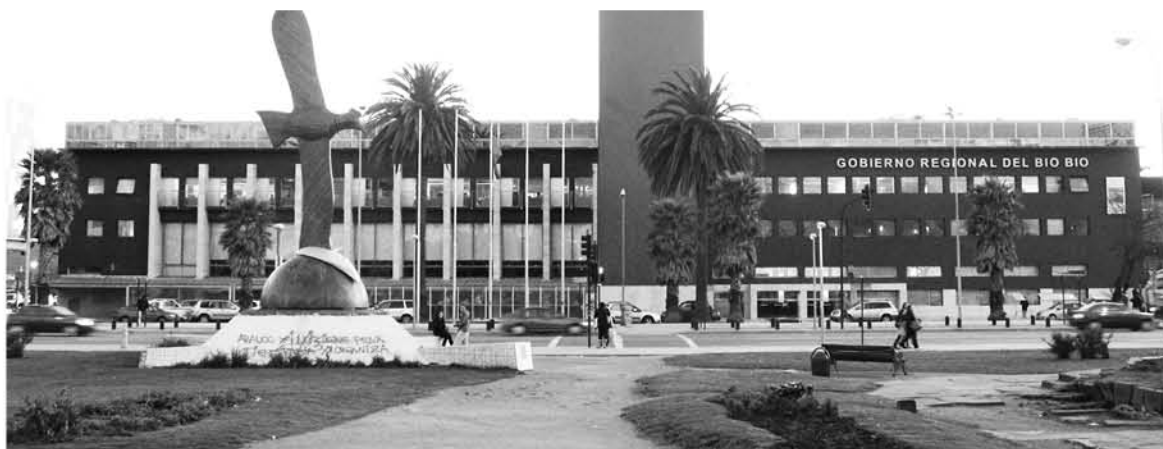
EL LUNES 19 DE FEBRERO Sebastián Piñera revelaría el nombre del nuevo intendente del Biobío.

Sólo queda esperar, estimándose que el lunes 19 de febrero Sebastián Piñera dará a conocer el nombre de sus futuros subsecretarios e intendentes.