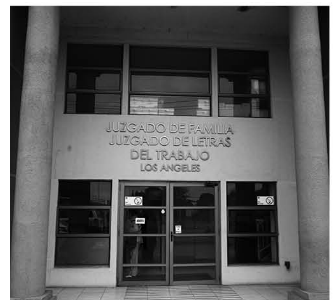
EL PRIMERO DE LOS TRES JUICIOS comienza el 15 de febrero en el Juzgado de Letras del Trabajo.

Sin embargo el fallo aún no está firme y ejecutoriado pues se encuentran vigentes los plazos para la impugnación del mismo.