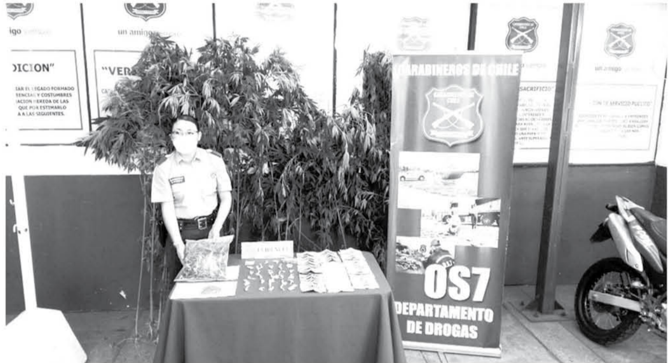
LA INVESTIGACIÓN fue realizada en colaboración entre el OS7 y el Ministerio Público.

Tras el operativo, los cuatro detenidos fueron puestos a disposición del Juzgado de Garantía de Los Ángeles para la audiencia de Control de detención efectuada durante la jornada del día domingo.