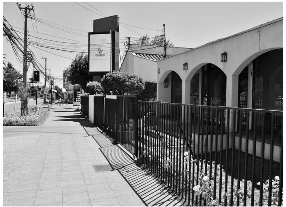
RESTA POR CONOCER la contestación de la demanda realizada por la periodista del DAEM.

Desde la municipalidad argumentaron en contra de lo dicho por el demandante.