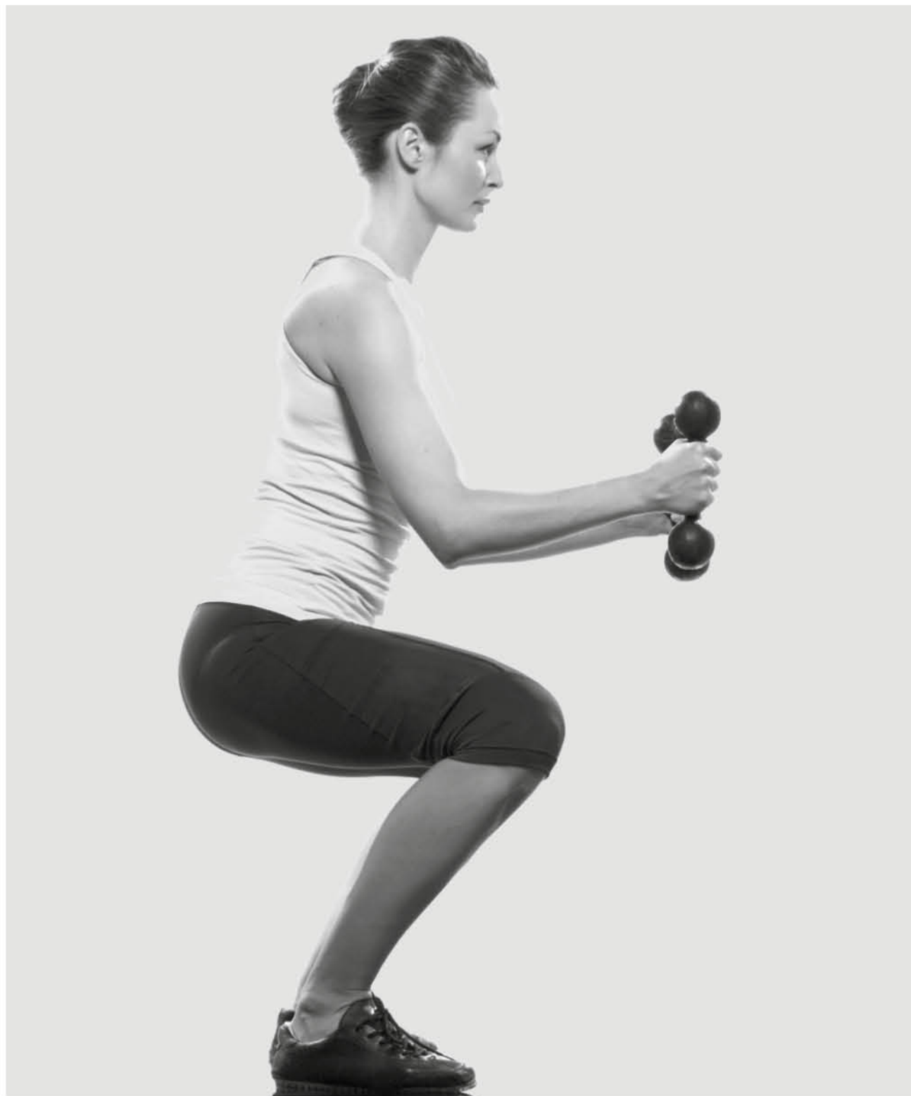
LAS SENTADILLAS, sin duda, son el ejercicio más conocido por su efectividad comprobada.

Haz diez repeticiones, descansa y vuelve a empezar. Una variante a este ejercicio es colocar una pesa redonda en el abdomen.