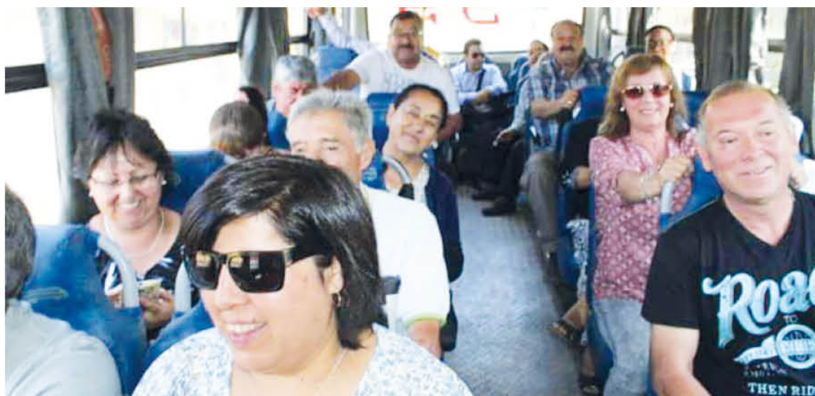
LA ALEGRÍA de los vecinos de los sectores rurales, era evidente en el primer recorrido.

Cabe destacar que las condiciones del servicio fueron consensuadas con representantes de la comunidad, el municipio y la Seremi de Transportes, concretándose este importante beneficio para cientos