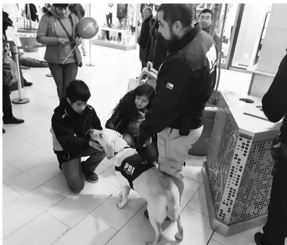
EL ACERCAMIENTO con los más pequeños es fundamental para prevenir el consumo.