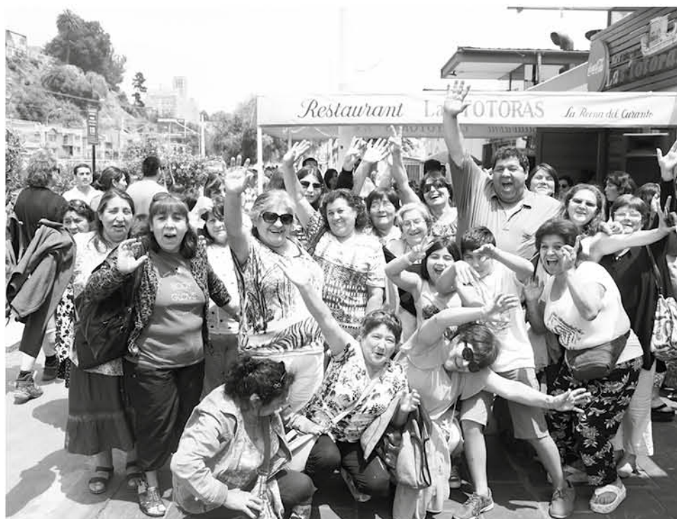
LAS BONDADES CULINARIAS de la famosa Caleta Portales pudieron ser conocidos por el grupo de la Provincia de Biobío.