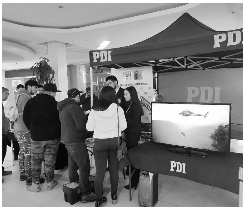
LA LEY 20.000 prohíbe un listado amplio de drogas que se van actualizando periódicamente.

Además, aclaró que las intervenciones en distintos establecimientos y organizaciones sociales de la provincia están siempre dirigidas a todo público aunque con los más jóvenes se establece una comunicación especial: “Si bien a los 18 años se es joven todavía, ya hay mayoría de edad. Es posible que haga lo que quiera con su vida, pero no es la idea. Como están los jóvenes o los niños en una etapa de formación es la mejor edad para darles a conocer lo bueno y lo malo de las drogas”.