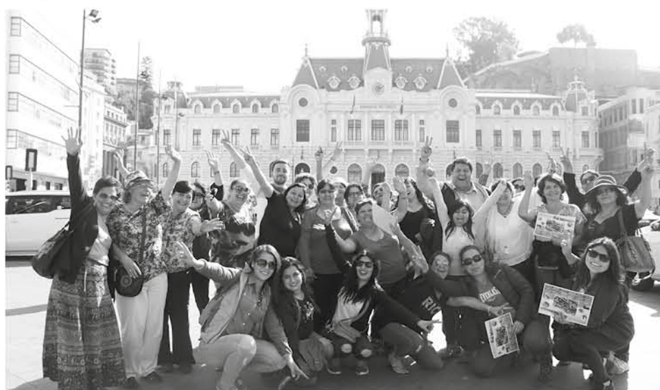
EN VALPARAÍSO, las mujeres también pudieron recorrer todo el casco histórico de la ciudad Puerto.