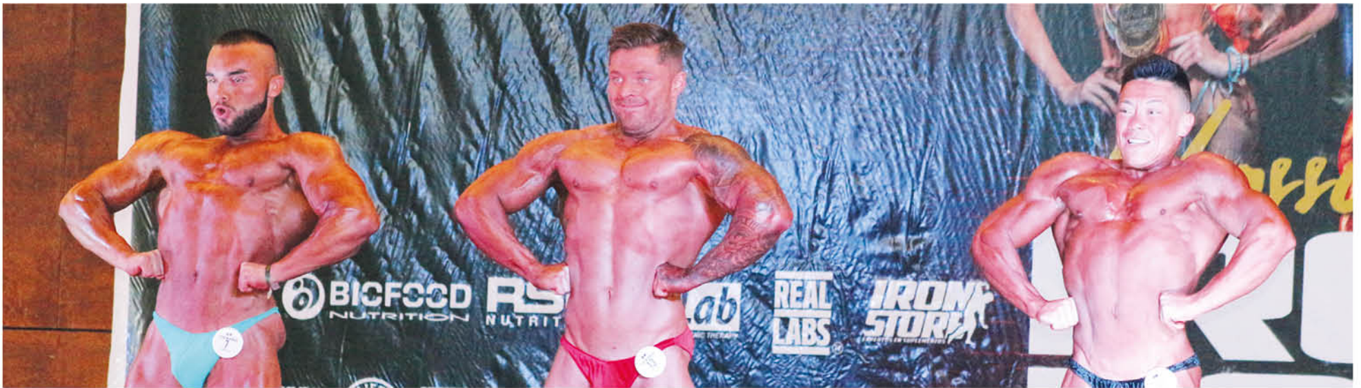
EL NIVEL DESTACÓ y pone al evento dentro de los mejores de Chile.

El evento, que fue presenciado, entre otras personas, por dos destacados deportistas nacionales, destacó por su gran nivel de competición.