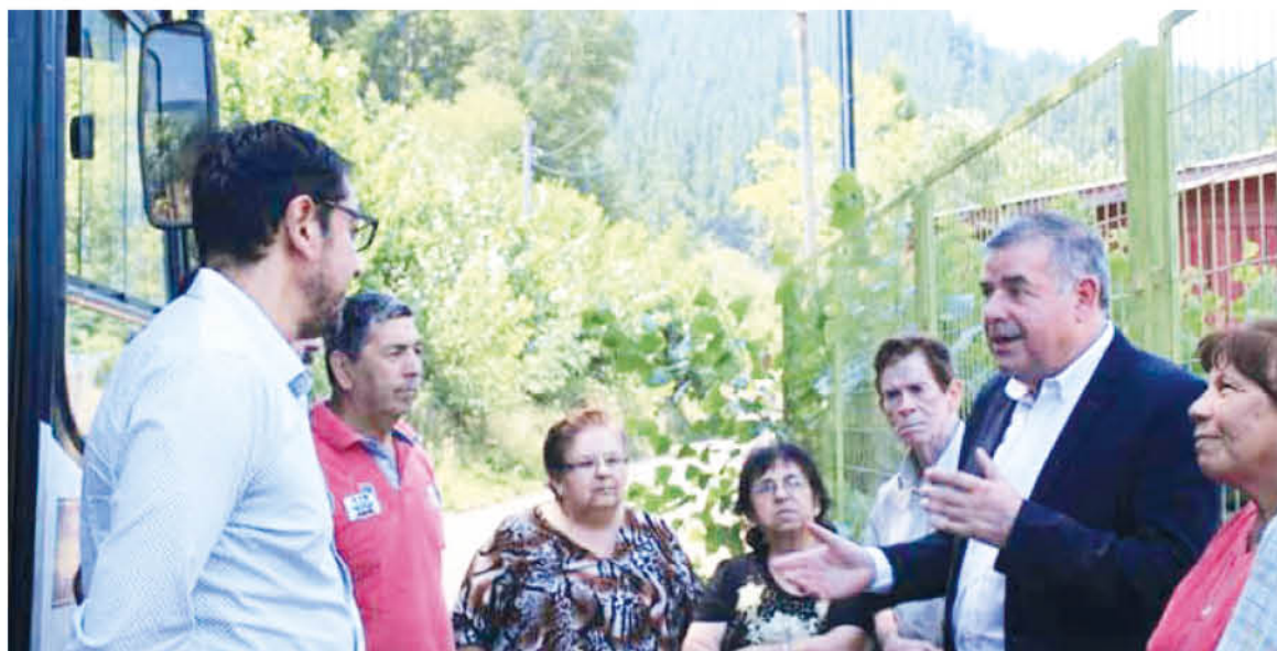
EL ALCALDE junto al Seremi de Transporte realizan el primer viaje del recorrido.

Gracias al subsidio conseguido, las tarifas para el público oscilarán entre los 300 y 600 pesos, de acuerdo al tramo recorrido; los estudiantes de educación básica y menores de 7 años tendrán tarifa liberada; los estudiantes de educación media y superior deberán pagar el equivalente al 33 por ciento del pasaje adulto; y los adultos mayores y personas con discapacidad tendrán una rebaja del 50 por ciento de la tarifa adulta.