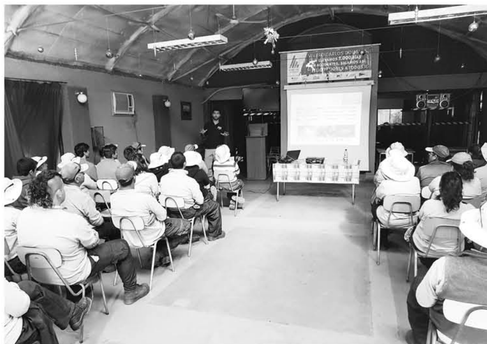
DETECTIVES DE LA BRIGADA Antinarcóticos de Los Ángeles realizan constantes jornadas educativas.

La mencionada norma estipula no solo prohibiciones con