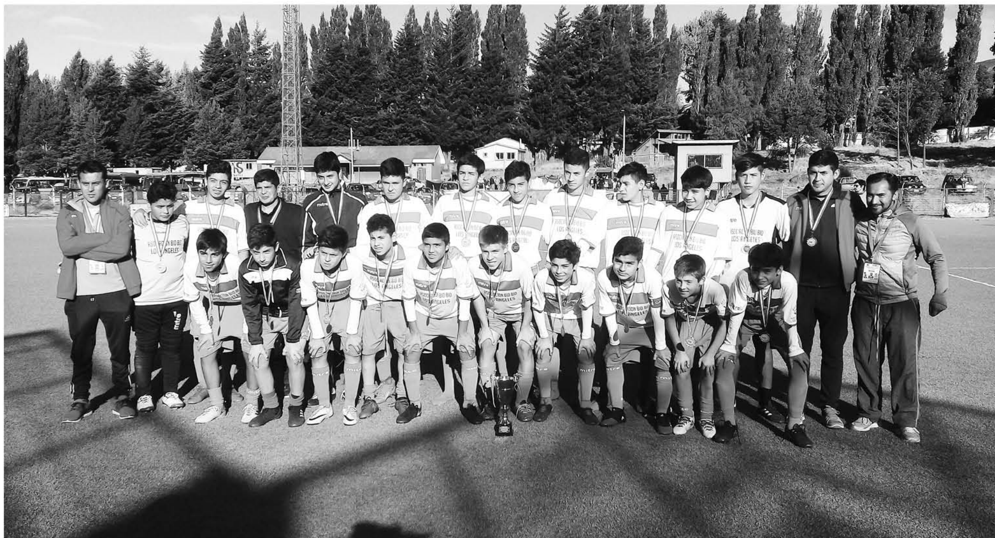
PESE A CAER EN LOS ÚLTIMOS DOS ENCUENTROS, los de la provincia de Biobío destacaron en el campeonato nacional.

LUGAR QUEDARON LOS ANGELINOS QUE REPRESENTABAN A LA REGIÓN DEL BIOBÍO.