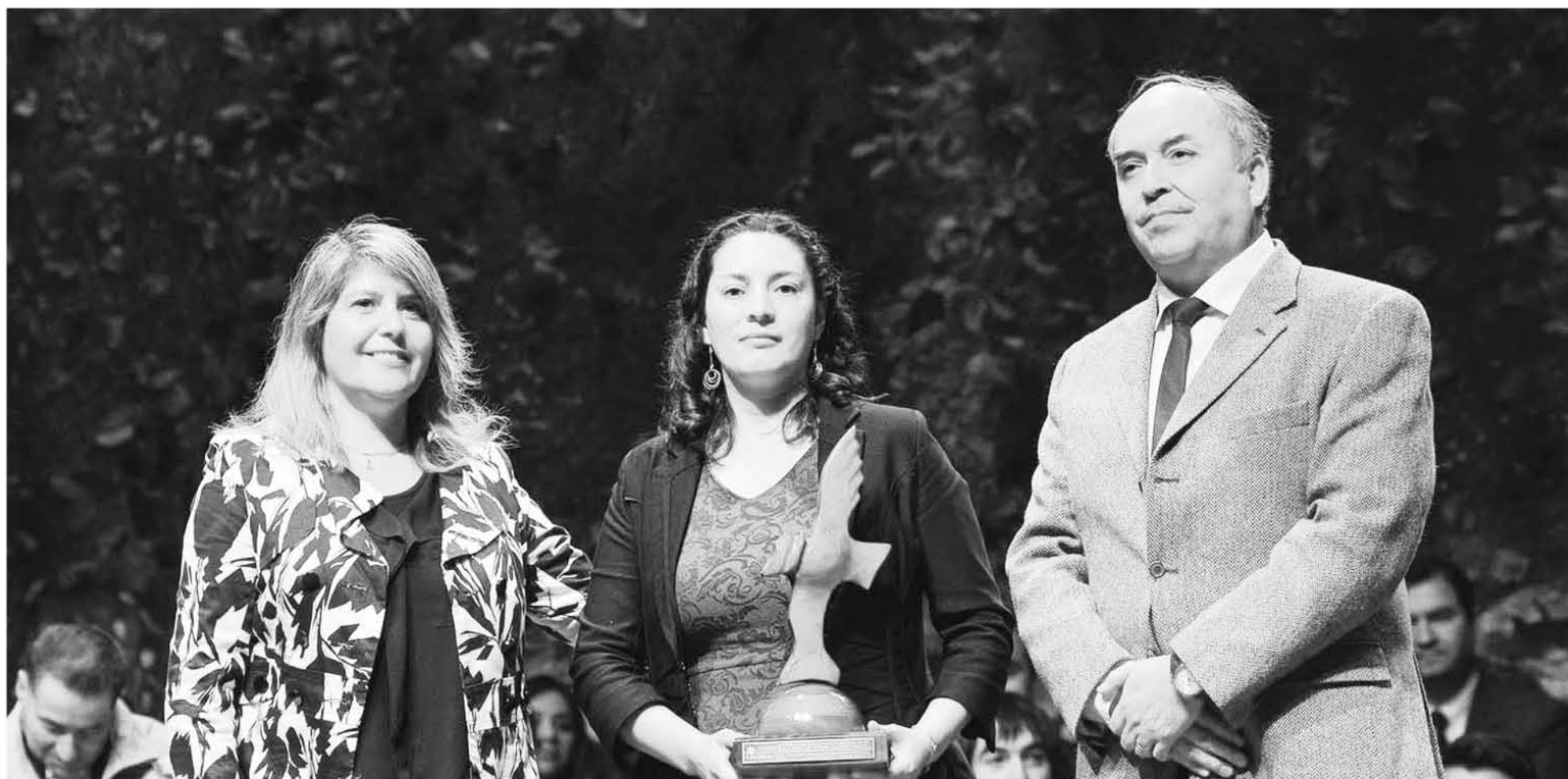
ESTA MUJER POR SU ESFUERZO y personalidad fue distinguida con el premio CORMA 2017.

a los mejores trabajadores forestales. Ella asegura que el mérito de este reconocimiento es de su esposo y sus jefes en CMPC que apostaron por ella y la convencieron de que tenía habilidades para el puesto.