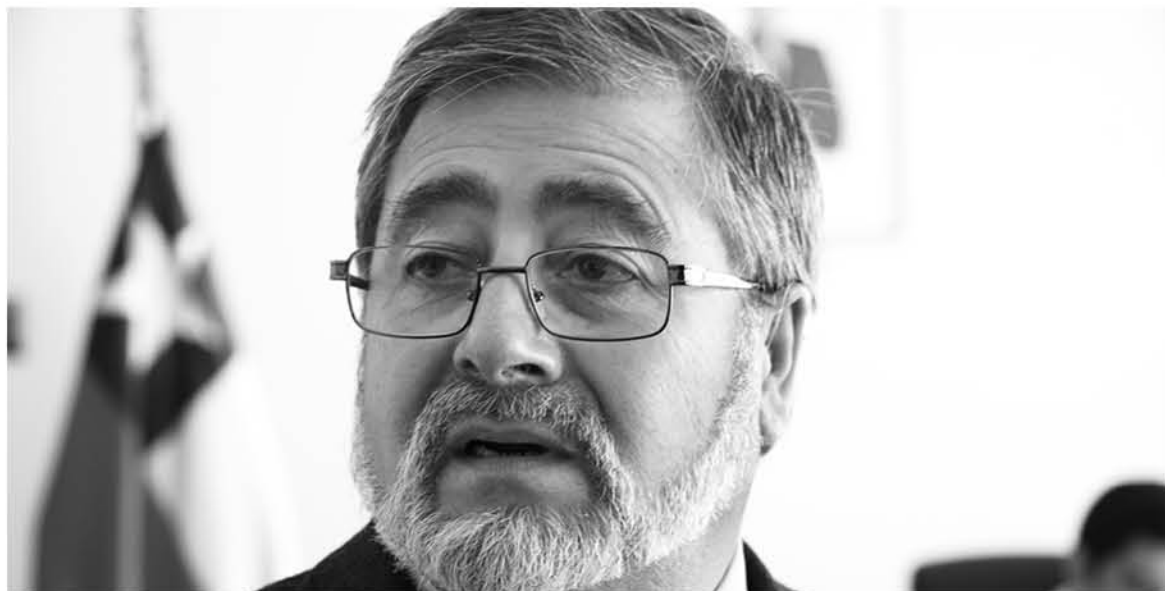
EL GOBERNADOR DESTACÓ la toma de conciencia por parte de los habitantes de los sectores rurales y aledaños.

En la reunión, también se hizo presente la Superintendencia de Servicios Eléctricos la que dio a conocer una nueva ordenanza respecto a temas de poda y manejos de residuos forestales que puedan provocar incendios, ordenanza que entró en vigencia a mediados de enero.