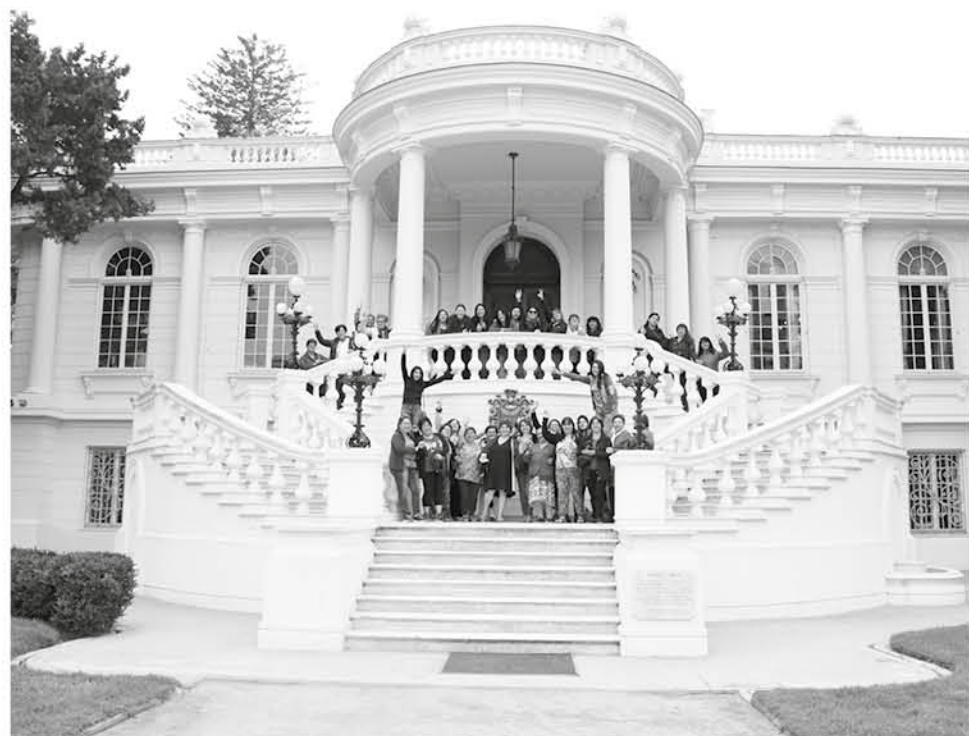
LOS MUSEOS DE LA QUINTA REGIÓN fueron parte del itinerario de los viajantes.