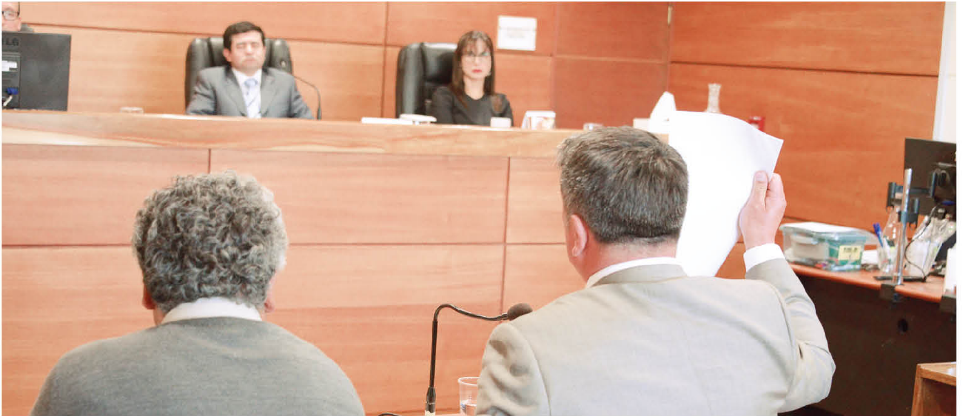
LA LECTURA DE SENTENCIA para conocer la pena de cárcel se realizará el próximo lunes 5 de febrero.

Por decisión unánime de los magistrados del Tribunal Oral en lo Penal de Los Ángeles, un hombre de 50 años fue condenado como culpable del delito de abuso sexual reiterado.