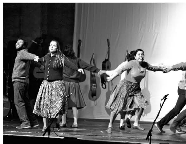
LA DIRECTORA de este centro, explicó a La Tribuna que el centro actualmente recibe cerca de 3 mil personas en las diferentes ramas artísticas.

Este proyecto, contempla en su edificación una variedad de espacios que den cabida a todas las actividades que aquí se llevan a cabo y esperan por ser inauguradas durante el mes