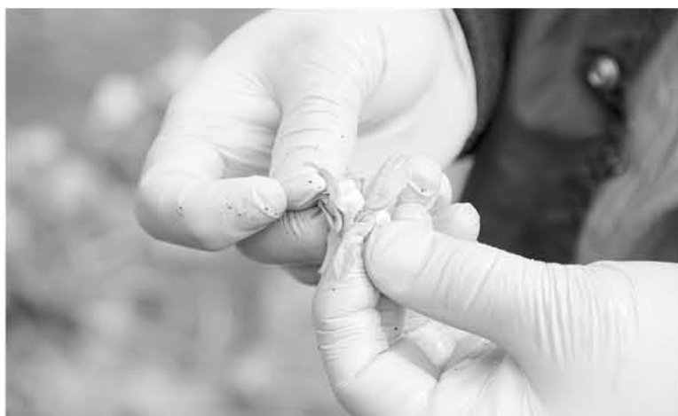
LAS EXPORTACIONES al año 2015 de productos forestales no madereros alcanzaron los 83 millones de dólares.

Cada vez toma más relevancia la recolección de especies vegetales que provienen de los bosques. Cada vez son más los habitantes que viven en sectores aledaños que tienen su fuente de ingresos en un oficio que proviene desde los pueblos originarios.