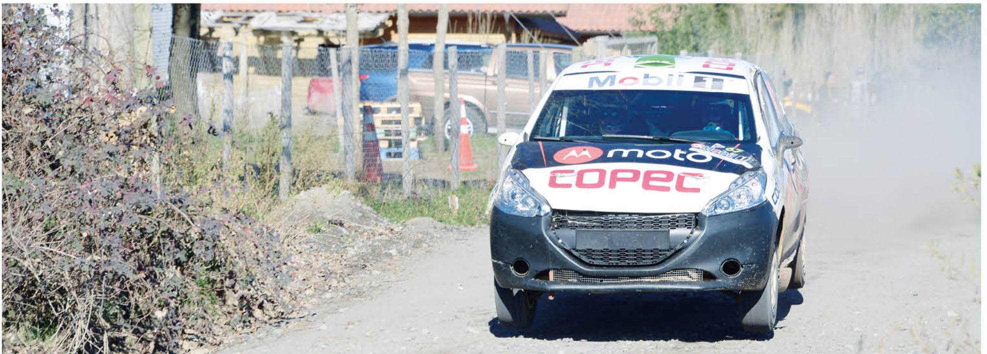
LA MÁXIMA CITA DEL AUTOMOVILISMO chileno promete volver a romperla en Los Ángeles en marzo próximo.

La capital de la provincia de Biobío será la primera ciudad en albergar la nueva categoría R5 de forma competitiva.