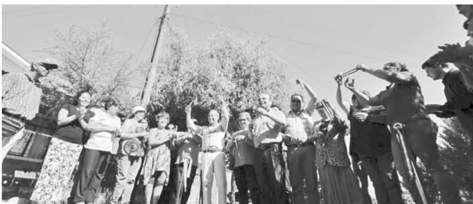
VECINOS, AUTORIDADES Y REPRESENTANTES de empresa que colaboró para la materialización de estos trabajos participaron de esta segunda entrega de luminarias.

JUNTA DE VECINOS SANTA LUCÍA BAJO, solicita conforme arts. 41 y 171 Código Aguas, autorización de modificación de cauces naturales del proyecto denominado “Puente Santa Lucía” que contempla unir ambas riberas del río Cholguán en la localidad de Santa Lucía Bajo, provincias del Biobío y de Ñuble, Región del Biobío, con el objeto de proveer acceso vehicular a la ribera sur y con esto mejorar la conectividad, facilitando el acceso a vehículos de emergencia y potenciando la actividad económica de las localidades en dicha ribera. El Proyecto estará emplazado entre las coordenadas UTM Este 262.752,127 y Norte 5.886.277,414 en la ribera norte, y Este 262.784,814 y Norte 5.886.201,093 en la ribera sur, ambas referidas al Datum WGS 84, Huso 19. El Proyecto está constituido por los siguientes componentes: a) Infraestructura: Estribos y Cepa, b) Superestructura y c) Terraplén. Demás antecedentes se encuentran en solicitud extractada.