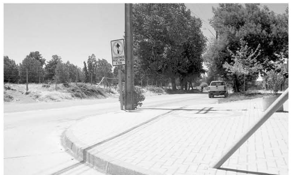
EL ROBO ocurrió en la intersección de las calles Padre Hurtado y Las Flores en la comuna de Cabrero.