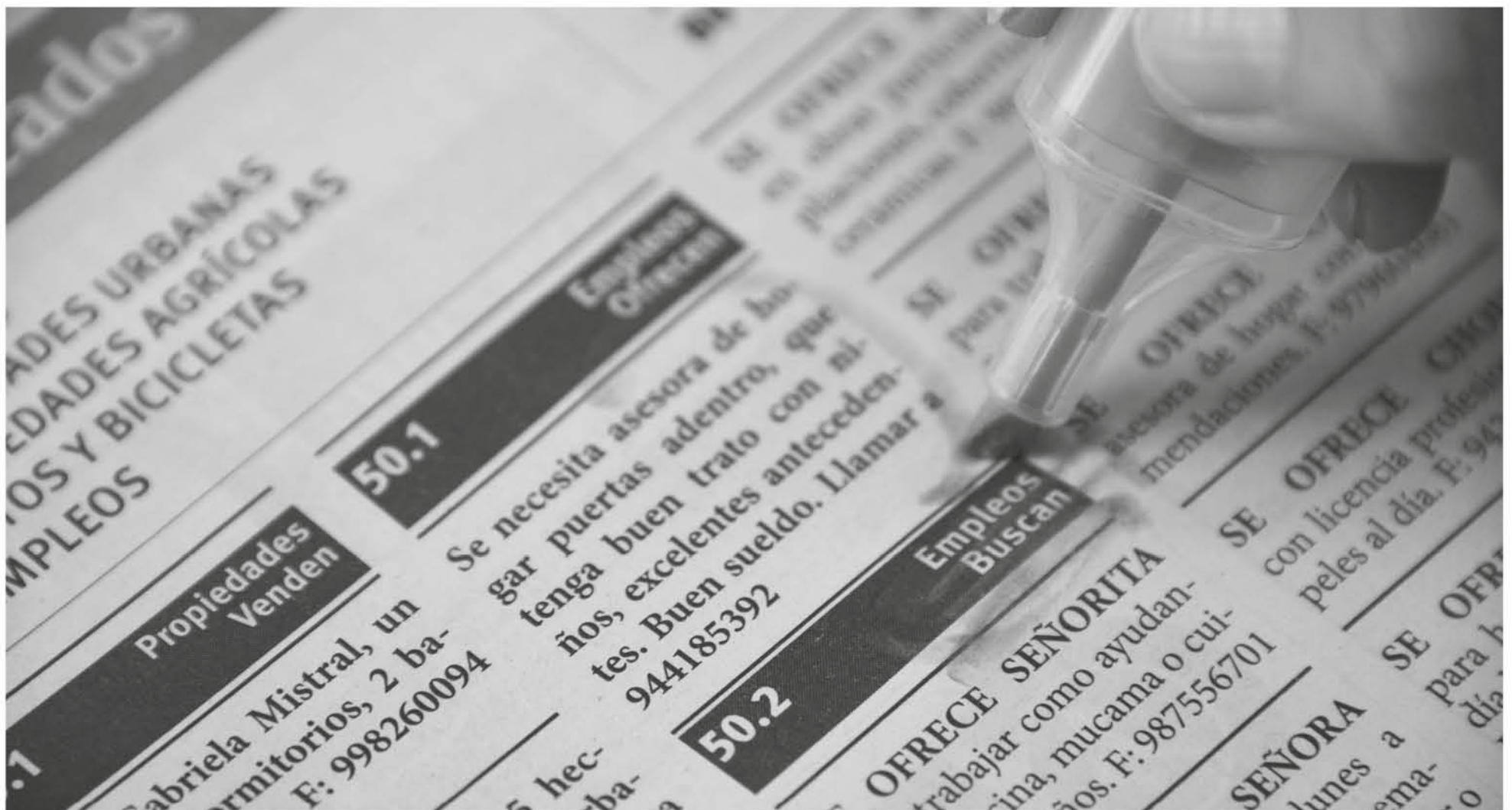
LAS PRINCIPALES ACTIVIDADES que incidieron positivamente en la ocupación fueron transporte, enseñanza, alojamiento y servicio de comidas.