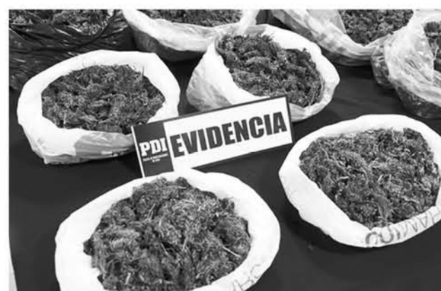
EL OPERATIVO fue efectuado por la Brianco de Los Ángeles.

El avalúo de la droga es cercano al millón de pesos. El detenido fue llevado hasta el Juzgado de Garantía de Los Ángeles para el control de detención y formalización.