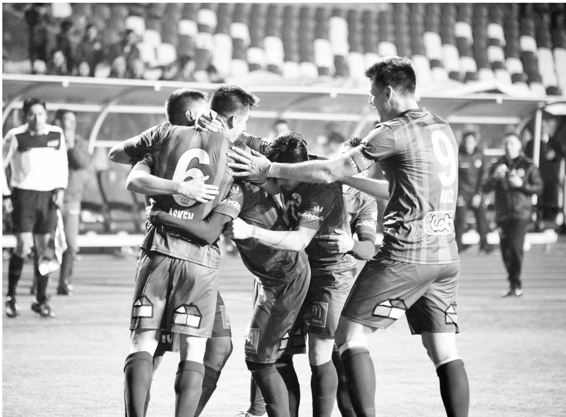
PARA TRANQUILIDAD de los hinchas, Iberia por fin tiene nuevo técnico.

El estratega penquista es el hombre llamado a liderar la "operación retorno" a Primera "B".