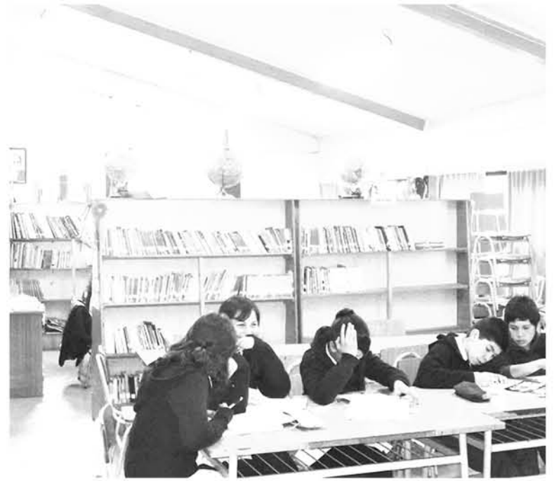
AUTORIDAD SANITARIA recomienda adoptar medidas de prevención, con énfasis en uso de repelente con un 20% a 30% de componente DEET.

"Tenemos un tiempo, esperamos antes de junio para proveer la infraestructura necesaria y se nos reconozca la subvención, de no ser así, el muni-