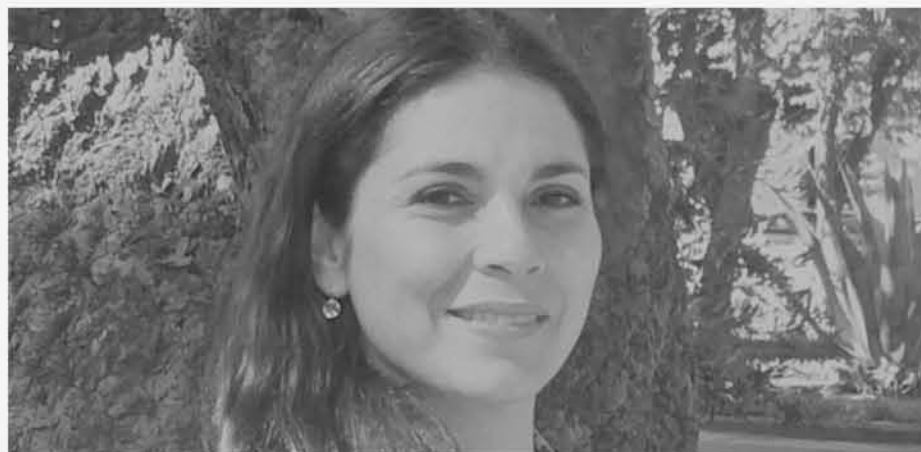
A TRAVÉS DEL SITIO web de la Municipalidad el alcalde Krause hizo oficial el nombramiento de una nueva profesional al mando de la Dirección de Medioambiente

las dos funcionarias aludidas existiera una mala evaluación. “No es efectivo, lo que siempre hay es un permanente cambio respecto de las acciones que uno pueda realizar en un determinado momento”, declaró.