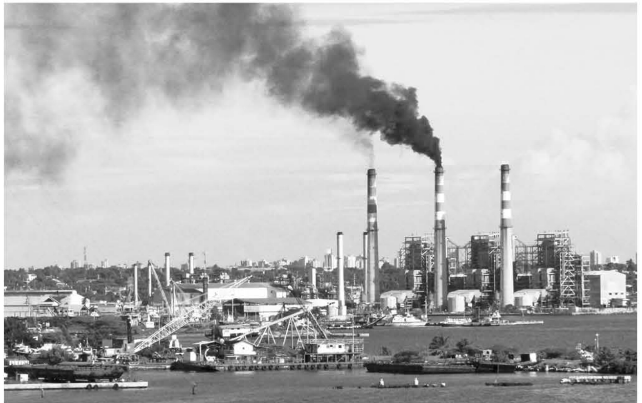
EL ACUERDO APUNTA a reducir las emisiones contaminantes locales generadas por las generadoras a carbón.

Además, acordaron que se creará un Grupo de Trabajo para que analice, en el contexto de los objetivos de la Política Energética 2050, los elementos tecnológicos, ambientales, sociales, económicos, de seguridad y de suficiencia de cada planta y del