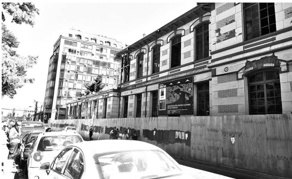
LAS OBRAS PARA ESTE importante centro cultural, se encuentran con un 30% de avance hasta la fecha.

Cabe señalar que muchos de los integrantes que participan en las diferentes actividades, se ven enfrentados