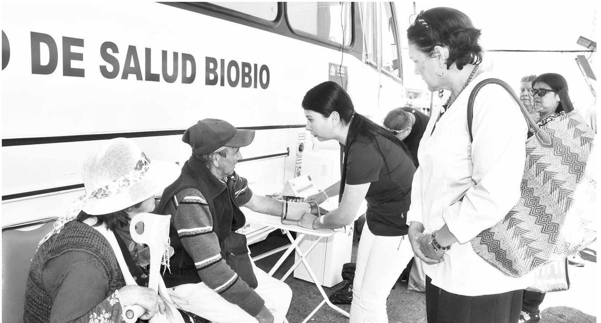
ANTES DEL MEDIODÍA había más de 50 personas inscritas para tomarse sus exámenes preventivos.