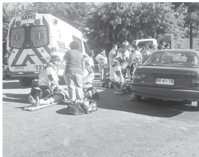
LOS HERIDOS fueron trasladados al hospital Víctor Ríos Ruiz.

Por causas que se investigan, dos automóviles colisionaron de manera frontal, dejando como saldo, tres personas lesionadas. Según los primeros antecedentes se trataría de un hombre y dos mujeres involucradas.