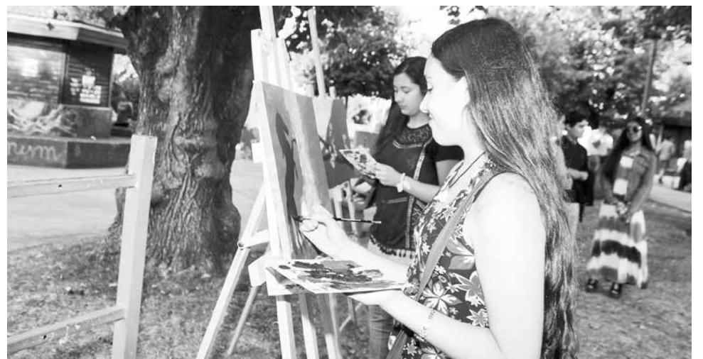
PODRÁN CONCURSAR TODOS aquellos niños que tengan el interés, las ganas y la motivación por participar de esta actividad.

El soporte único a utilizar es un bastidor de 40x40 cm, cualquier otro formato quedará automáticamente descalificado. En cuanto a la técnica, esta será de libre