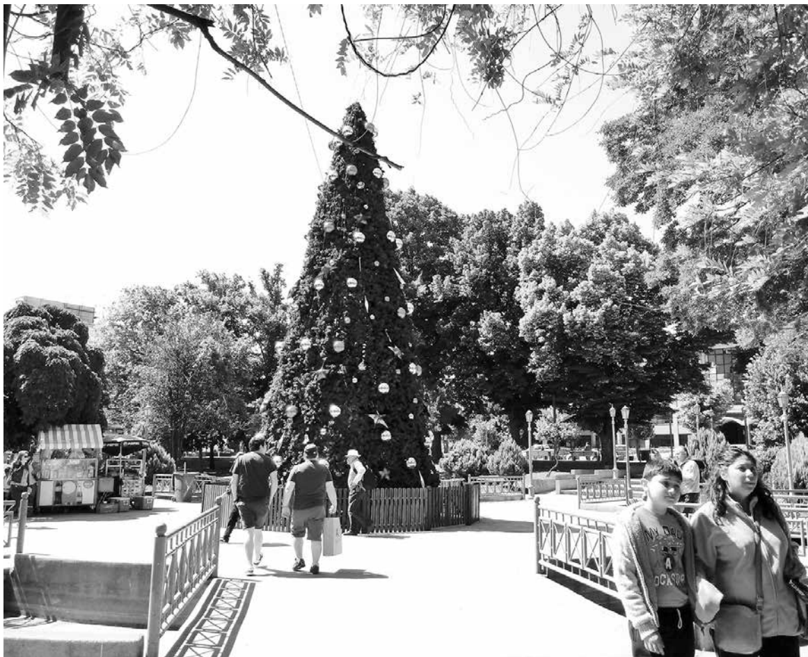
LOS ADORNOS SUSTRÁIDOS fueron devueltos a personal municipal y se integraron nuevamente a la decoración.

Sobre los hechos, personal de la municipalidad, no se ha referido al respecto y sobre los individuos, se encuentran en calidad de imputados por robo de bienes nacionales de uso público.