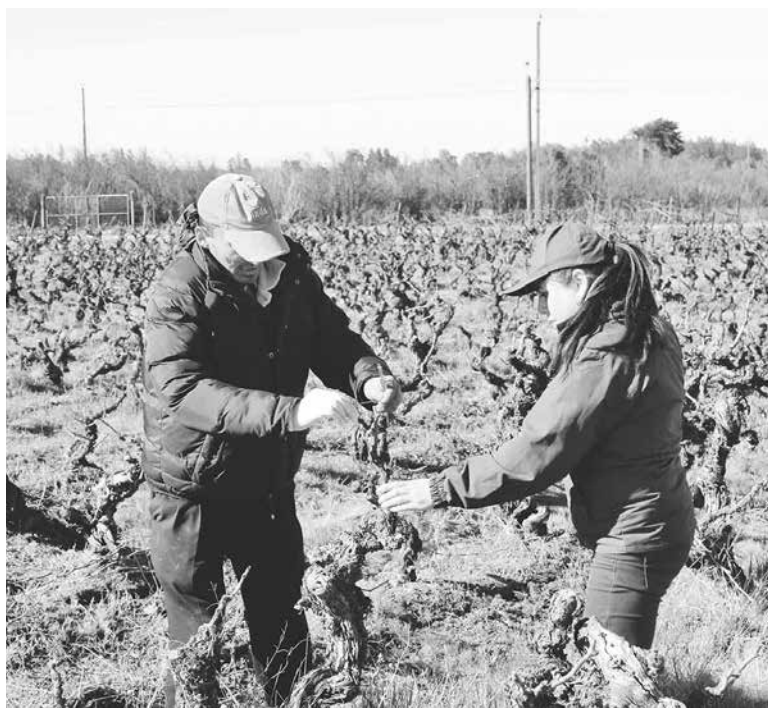
FUERON CUATRO los sectores rurales de la provincia de Biobío donde fue levantada la alerta por la presencia de esta plaga.

El SAG adoptó esta decisión para los sectores El Cortijo, en Los Ángeles; Quinel y Paso Hondo, en las comunas de Cabrero y Yumbel, además de Villa Mercedes en la comuna de Quilleco.