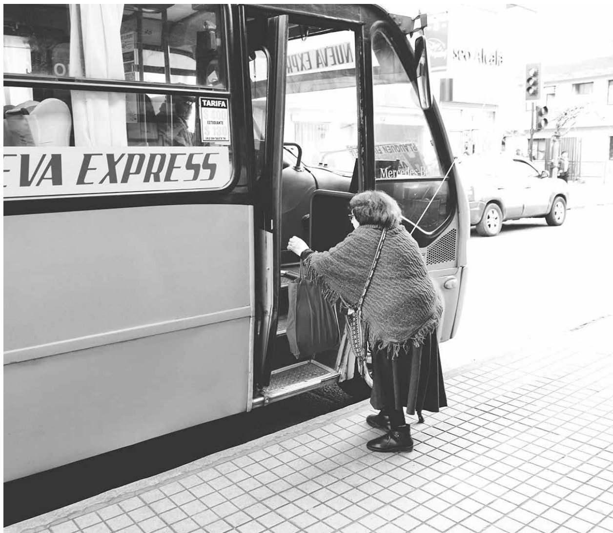
PESE A LO INFORMADO desde el Ministerio de Transportes, en la Provincia aún no se implementa un subsidio a la locomoción.

El subsecretario de Transportes, Carlos Melo, afirmó que: “los subsidios al transporte público, basados en los fondos espejos del Transantiago para regiones, fueron implementados como política pública desde el 2009 y han sido apoyados transversalmente por todos los gobiernos. Entendemos nuestra tarea desde el MTT como un motor para mejorar la calidad de vida de millones de chilenos”.