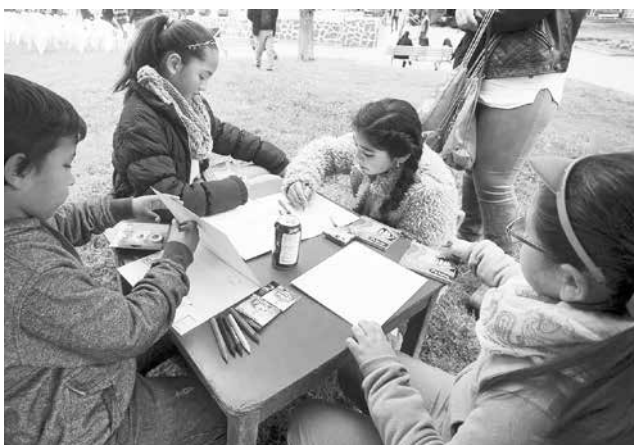
LAS CATEGORÍAS de los participantes incluyen a niñas y niños de entre 5 a 8 años y de 9 a 13.

culturales dirigidas a niños y jóvenes con interés por las artes visuales. Este se realizará entre los días 9 y 10 de diciembre de 2017. En esta edición de La Tribuna presentamos las bases de este concurso para que los más pequeños de la familia puedan hacerse parte de este evento: