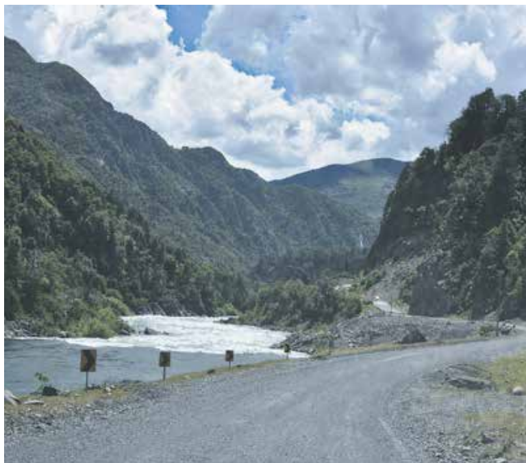
ESTE FIN DE SEMANA, en Alto Biobío, se realizarán talleres de kayak, canyoning, permacultura, rafting y montaña.