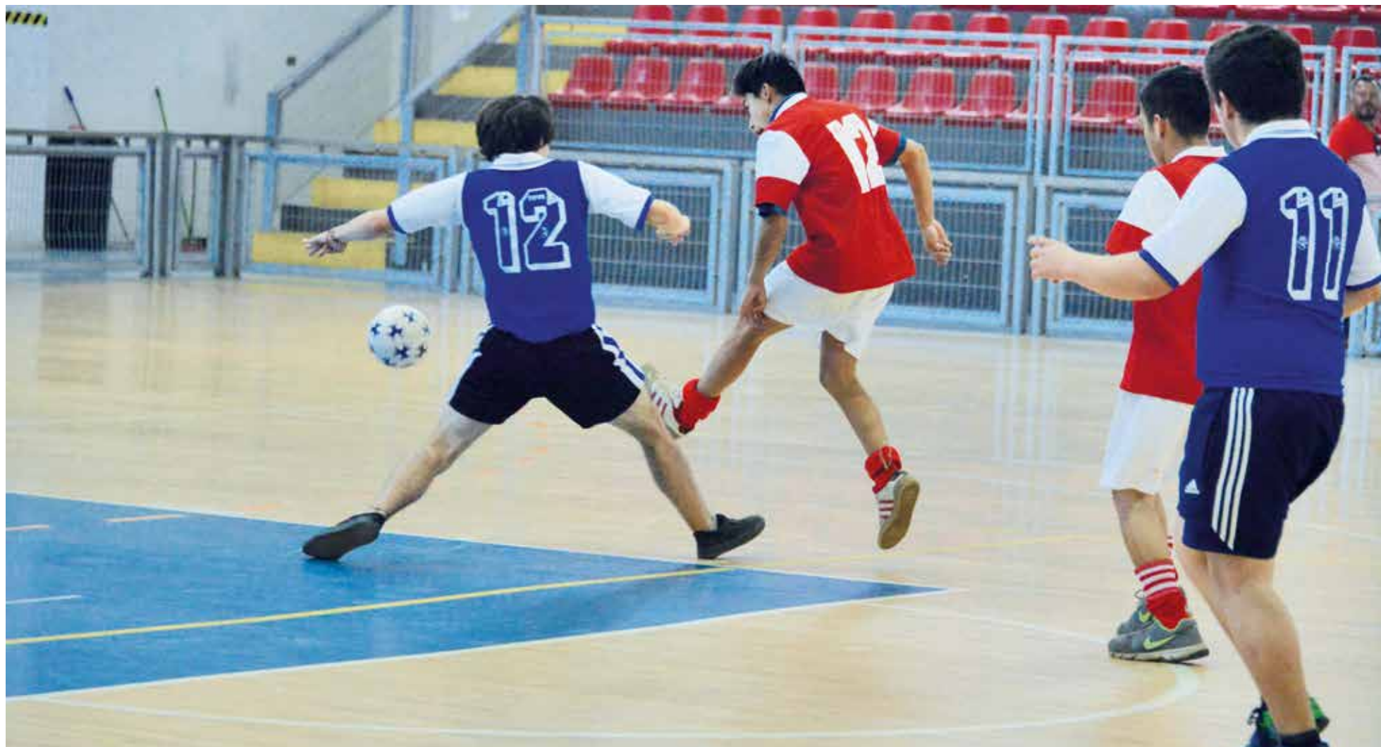
ESCUELA ESPERANZA (Azul) y Escuela Arcoíris (Rojo) se enfrentaron en el partido inaugural.

El cuadrangular final se llevó a cabo en el Polideportivo de Los Ángeles el miércoles, luego de optarse por ese sistema en desmedro de una semifinal y final. El análisis fue más que positivo.