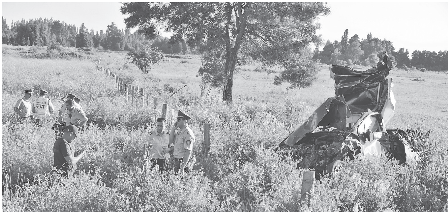
EL TENIENTE llevaba más de 25 años en la institución.