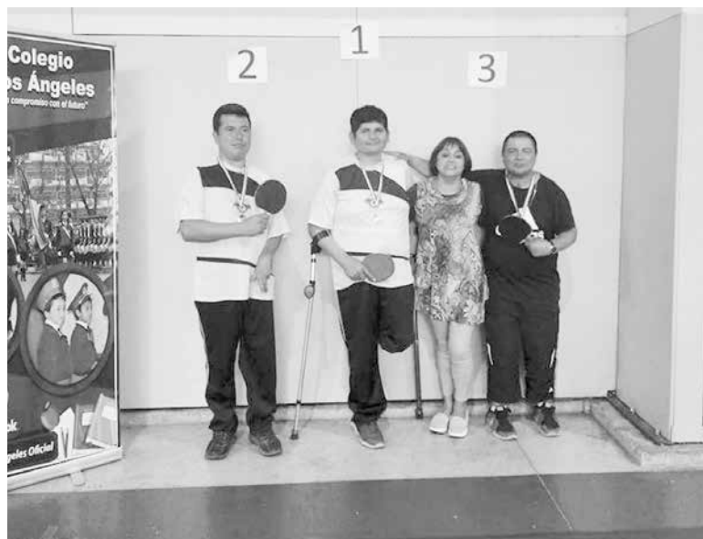
LA CATEGORÍA para personas en situación de discapacidad, se robó las miradas en el evento.

"Copa Profesor Jesús Rodríguez", tuvo una gran nueva versión, que contó por primera vez en Los Ángeles con la participación de personas con dificultades para desplazarse