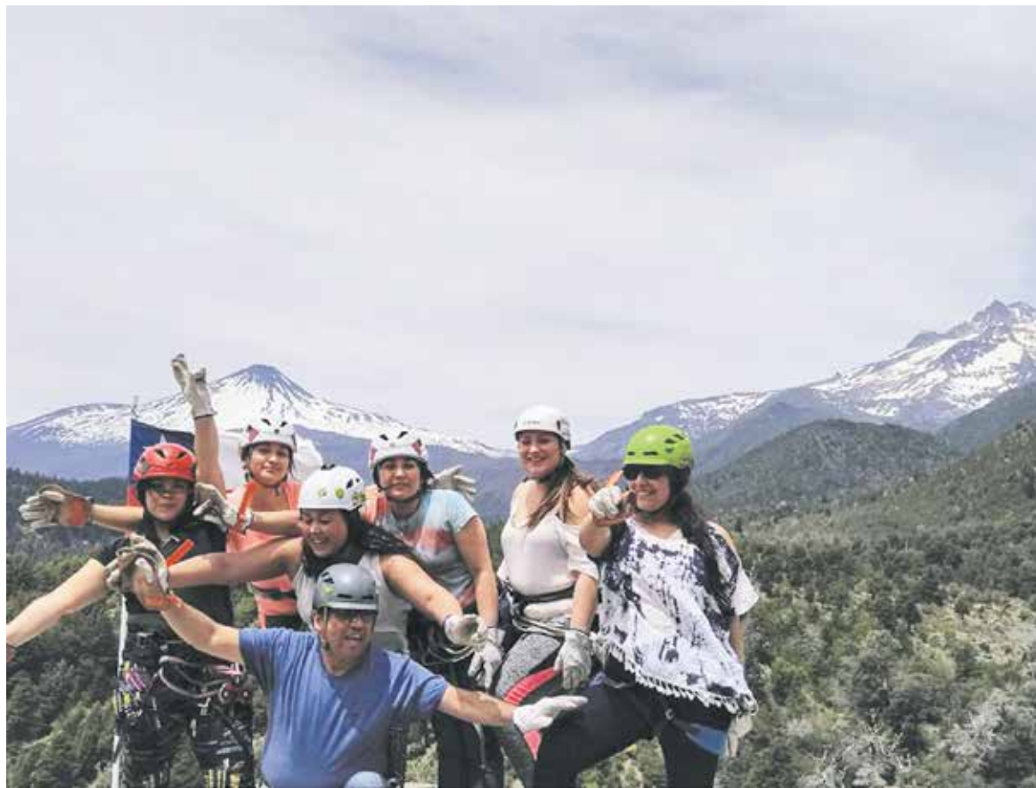
ALTOS DE MALALCURA ofrece una variada gama de actividades al aire libre en Antuco.

Una de las aventuras que se pueden vivir en ese lugar es lanzarse en canopy, que consiste en un desplazamiento aéreo por cables de acero por sobre y entre copas de árboles del bosque nativo, con alturas que