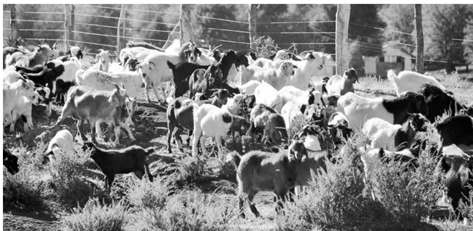
LA ACTIVIDAD principal de los habitantes de Alto Biobío es el ganado, por lo que este problema genera grandes pérdidas para su ingreso económico.

El reglamento fijará condiciones de tenencia especiales respecto de estos animales, tales como la prohibición de adiestramiento para la agresión, obligación de mantener a los animales en un espacio dotado de cerco seguro y adecuado a sus características fisiológicas y etológicas, contratación de un seguro de responsabilidad civil, esterilización obligatoria y, en caso de ser necesario, evaluaciones psicológicas de los dueños de dichos animales, con el fin de determinar si la tenencia pudiera representar un riesgo para la seguridad de las personas o el bienestar de los animales.