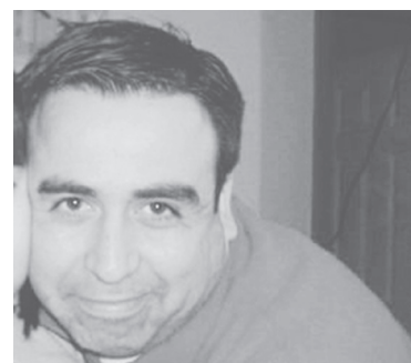
EL CUERPO salió eyectado y fue encontrado a más de 30 metros del auto.

Finalmente indicó que el alcaide del CDT de Angol "llevaba más de 25 años en la institución y deja a su esposa y dos hijos, por lo cual lamentamos mucho la situación, estamos muy apenados.