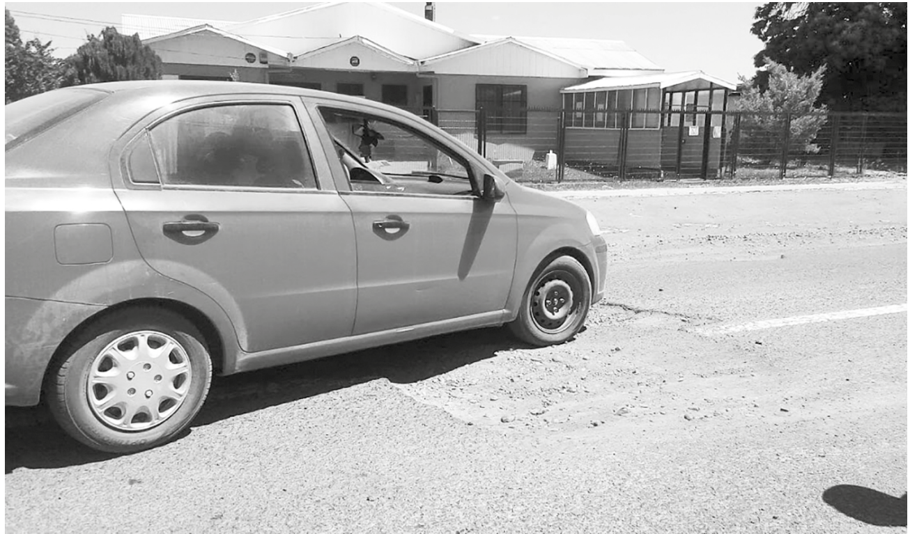
ACTUALMENTE el tramo de ruta que pasa por Chacayal Sur se encuentra en deplorables condiciones.

“En el corto plazo se hará una evaluación de cuánto cuesta una reparación urgente para tapar hoyos, restituir las líneas exteriores de lo que es la pavimentación, porque hay partes donde ya no existen (...) Lo segundo es que se va a hacer una evaluación para