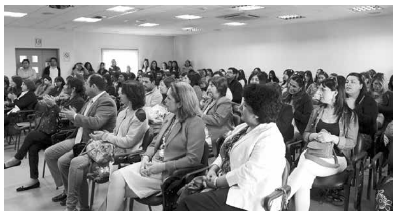
EN LA CEREMONIA se reconoció el trabajo de los profesionales y se destacaron los años de servicio.

Ceremonia homenajeó a los profesionales de la salud destacando el trabajo de quienes ya cumplieron 15 y 20 años de servicio.