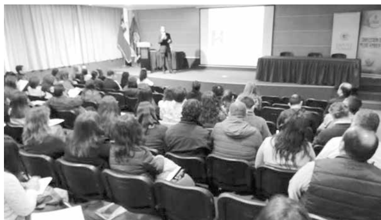
LA CAPACITACIÓN tuvo lugar en el auditorio de la Universidad Santo Tomás sede Los Ángeles ubicada en la avenida Ricardo Vicuña.

La capacitación, organizada por la Universidad Santo Tomás y la Municipalidad de Los Ángeles, convocó a funcionarios y colaboradores de distintos Centros de Salud de Biobío.