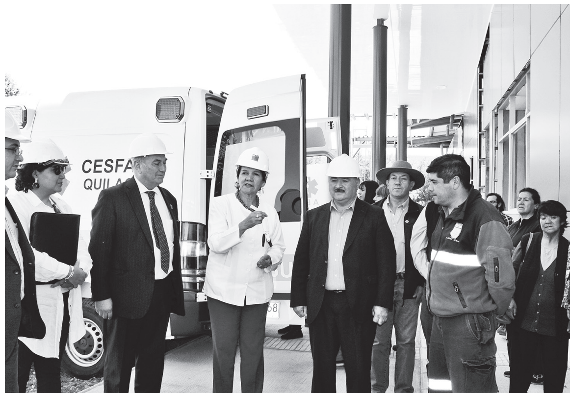
EL SEREMI DE SALUD DEL BIOBÍO, la directora del Servicio de Salud Biobío y el alcalde de Quilaco encabezaron el recorrido por las obras.