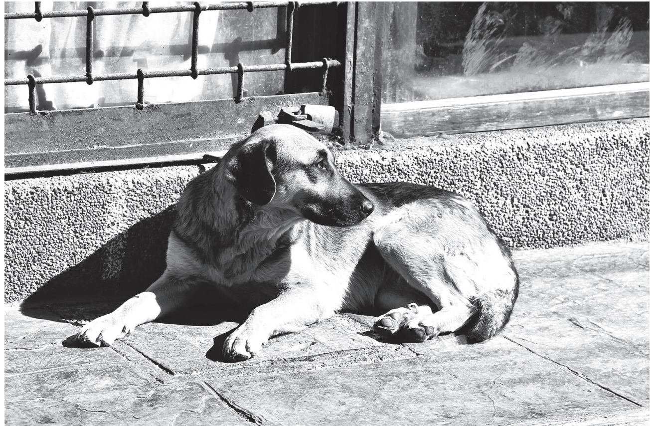
EL ACTUAL ESPACIO que el municipio ocupa como canil en Los Ángeles atiende a 35 perros en situación de abandono.

espacio que posibilite invitar a nuestros vecinos y vecinas a que lo conozcan, que puedan interesarse en adoptar un animal, que puedan llevarse para la casa, es decir, un canil