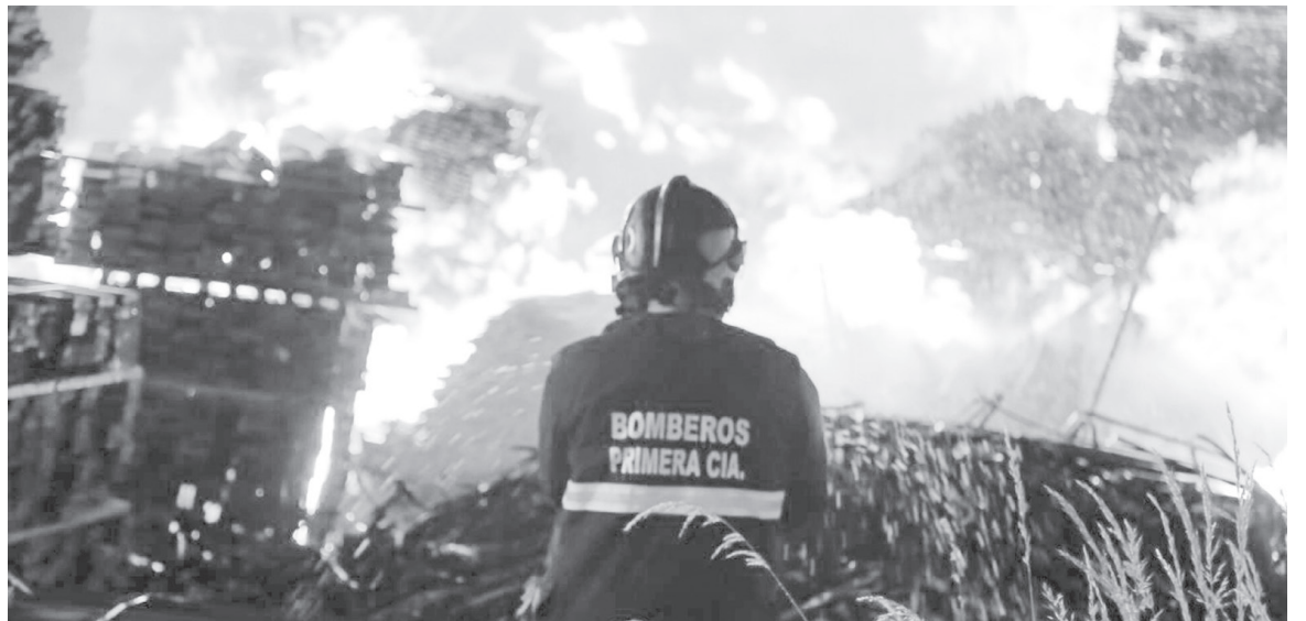
BOMBEROS DEBIÓ TRABAJAR durante toda la madrugada del domingo para controlar las llamas.

El fuego comenzó cerca de las 2 de la madrugada, relató el comandante del Cuerpo de Bomberos de Los Ángeles, Raúl Márquez.