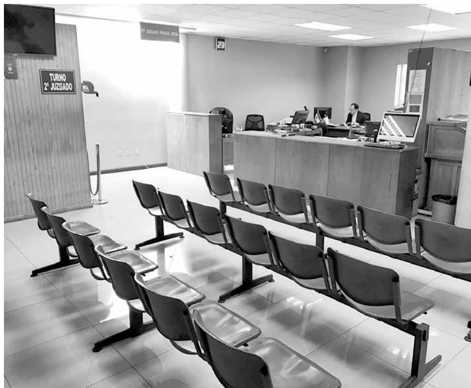
DE ESTA MANERA estaba el día jueves, a la misma hora.