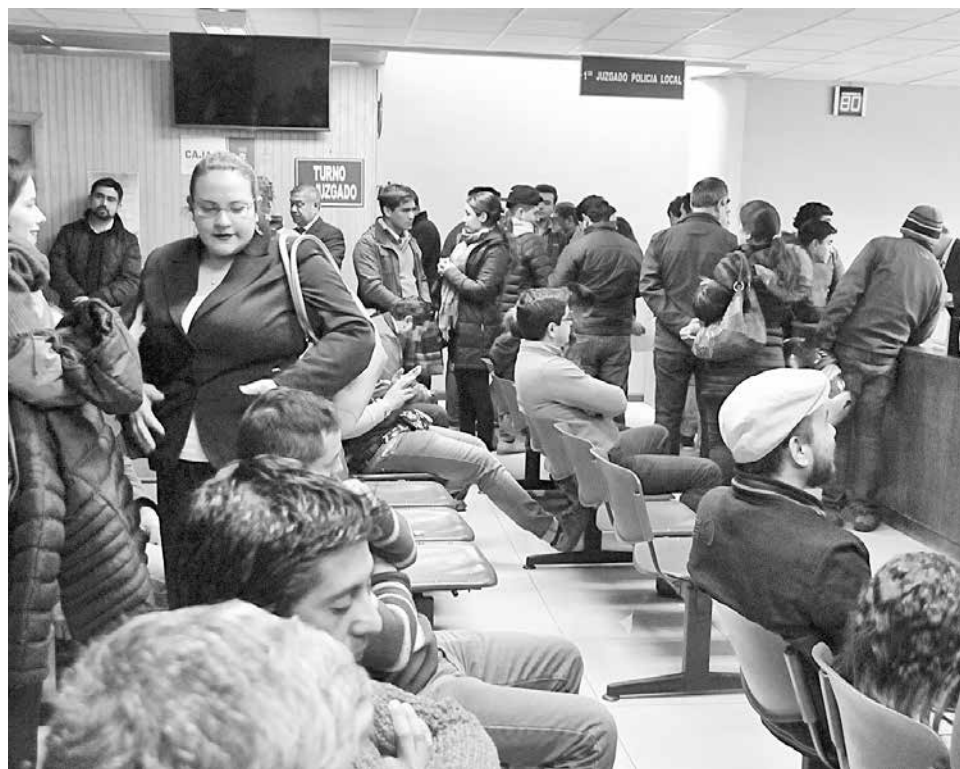
ASÍ ES COMO se ve la oficina del Juzgado de Policía Local en un día normal.

Es la caída general de infracciones, en medio de los rumores.