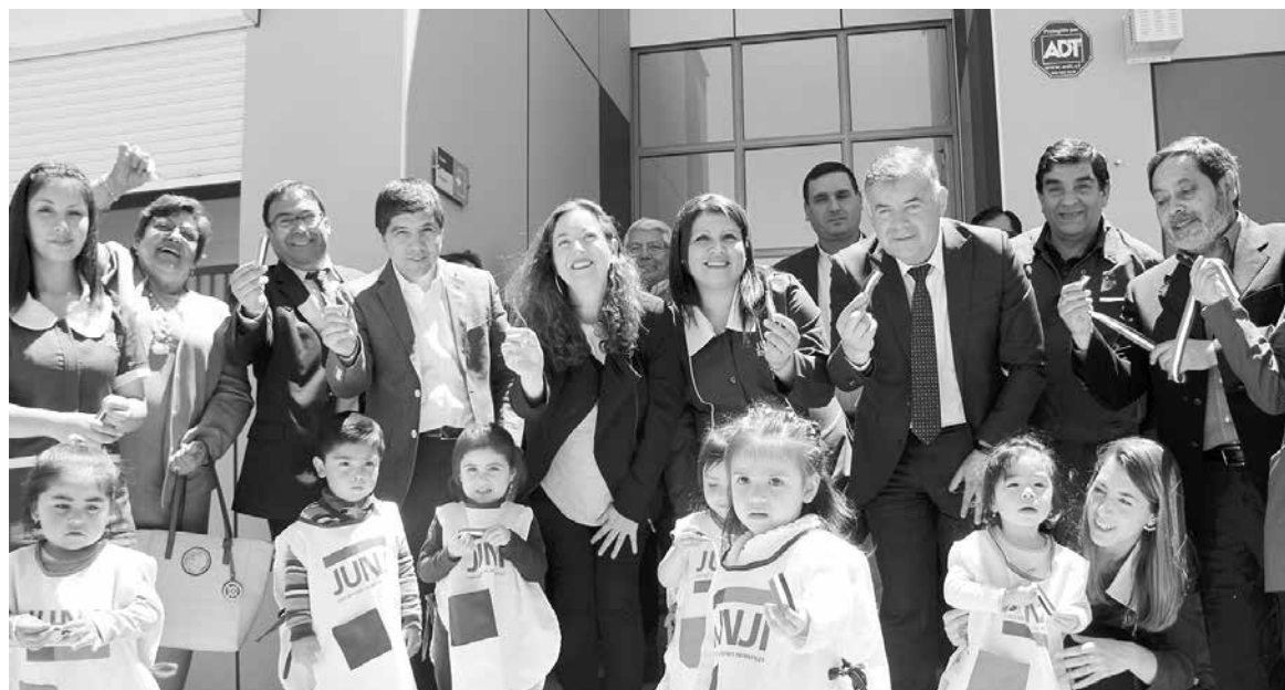
LAS AUTORIDADES LOCALES y de Junji entregaron a la comunidad el Nuevo Jardín Infantil "Eluney".