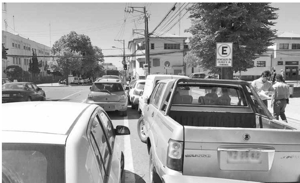
UNA DE LAS RAZONES de la presunta molestia en Carabineros sería el exceso de autos en tránsito y el poco espacio en el corralón.