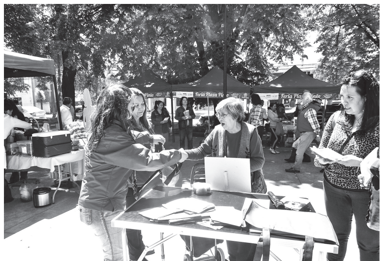
LOS TRANSEÚNTES que pasaron por el lugar se mostraron interesados en la labor que cumple el Centro de la Mujer en Los Ángeles.

El Centro de la Mujer instaló afiches informativos sobre los últimos femicidios en Chile, para así honrar a las víctimas en el día internacional de la no violencia contra la mujer.