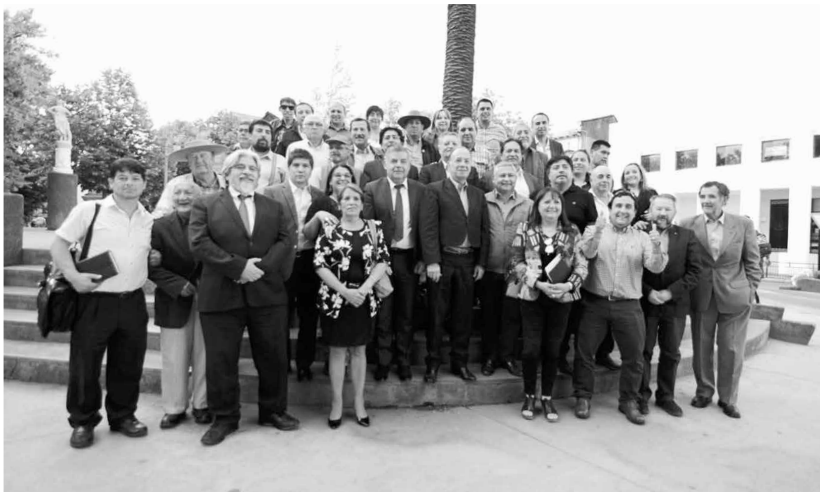
EN LA PLAZA DE ARMAS de Los Ángeles se reunieron las autoridades y representante de la Nueva Mayoría para manifestar su apoyo al candidato Alejandro Guillier.

Cabe destacar que, este lunes, el equipo programático de Alejandro Guillier dará a conocer algunos puntos de acercamiento con los programas de las ex candidatas presidenciales Beatriz Sánchez y Carolina Goic, con el fin de llegar al electorado que las prefirió en primera vuelta.