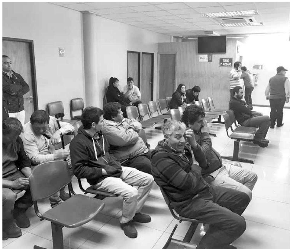
ASÍ ESTABA el pasado miércoles, temprano por la mañana.