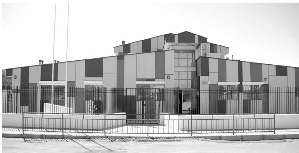
EL CENTRO cuenta con 1.154 metros cuadrados.

principio lo marcó. "Fue difícil traer a mi hija al jardín infantil pero desde que entré me impactó la infraestructura. El jardín infantil, nos ayuda