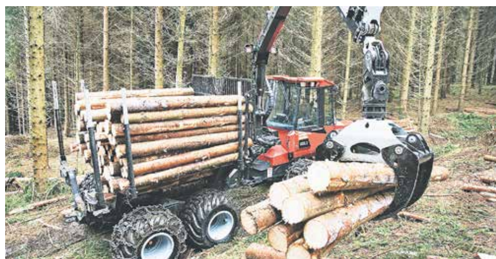
EL PLAN APUNTA A DESPEJAR de todo tipo de maleza y árboles a aquellos sectores de mayor riesgo y donde hay presencia de viviendas.