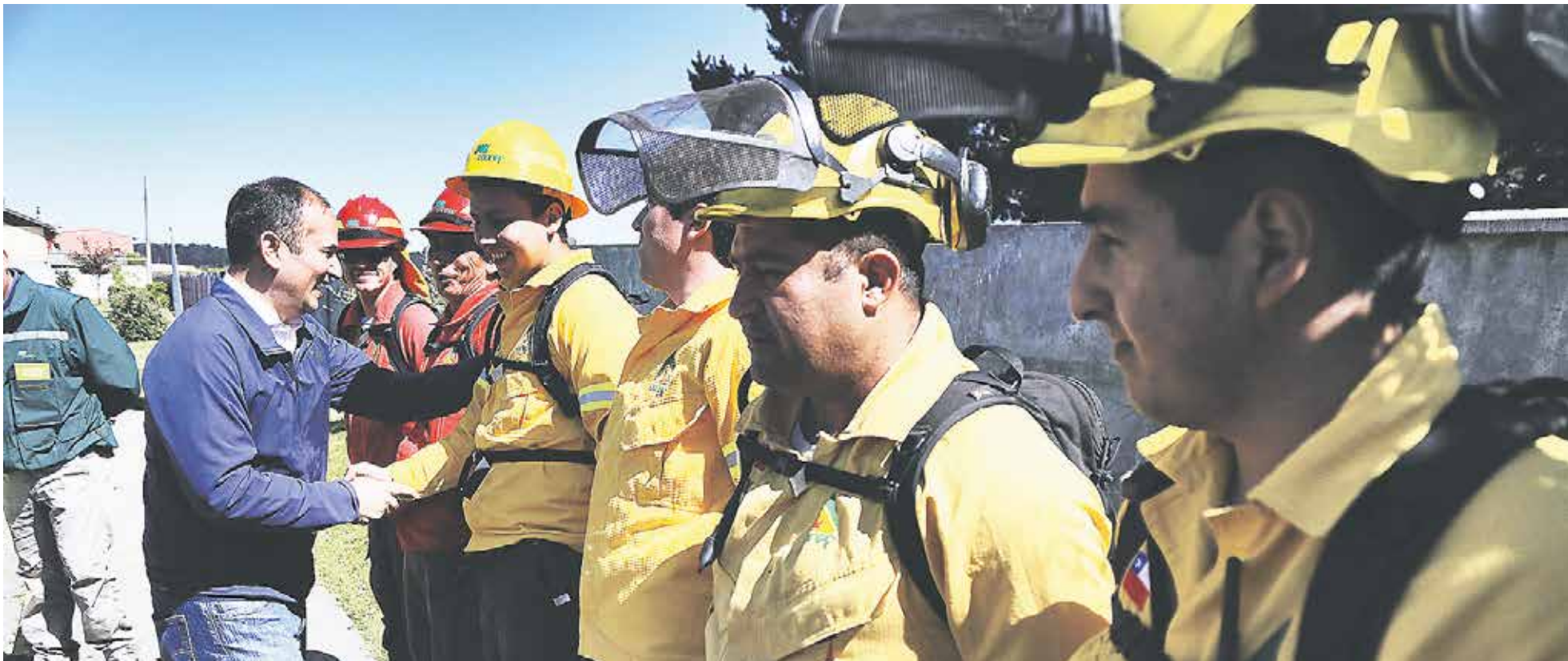
EL INTENDENTE DÍAZ saluda a brigadista de Conaf que trabajan en la construcción de cortafuegos en la Región.