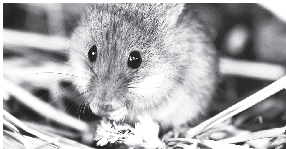
EL RATÓN DE COLA LARGA es el principal agente trasmisor del virus hanta.

La ministra de Salud, Carmen Castillo, reiteró las recomendaciones para prevenir el contagio del virus hanta. La secretaria de Estado recordó que "todos quienes viajen a zonas campestres deben tomar ciertas medidas, evitando, por ejemplo, acampar en lugares donde haya maleza; guardar bien los alimentos y, si tenemos basura, cubrirla adecuadamente para evitar que los ratones vayan a acceder a estos desechos".