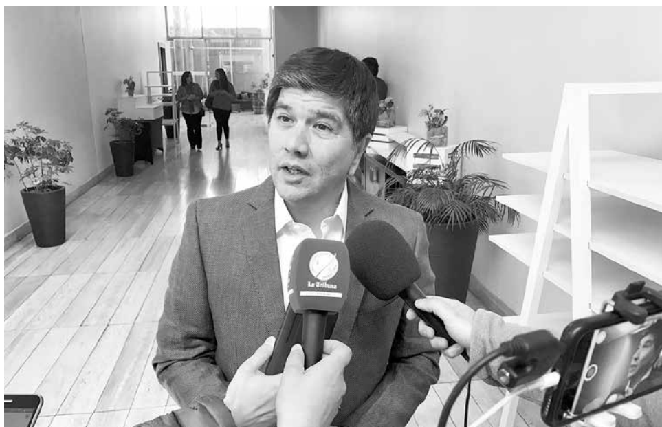
EL DIPUTADO SOCIALISTA Manuel Monsalve aseguró que su partido no admitirá a nadie que esté vinculado a hechos de violencia contra las mujeres en la campaña de Guillier.

El reelecto parlamentario del PS por el distrito 21 sostuvo que su partido no tolerará a nadie que esté vinculado a hechos de violencia contra las mujeres en la campaña presidencial.