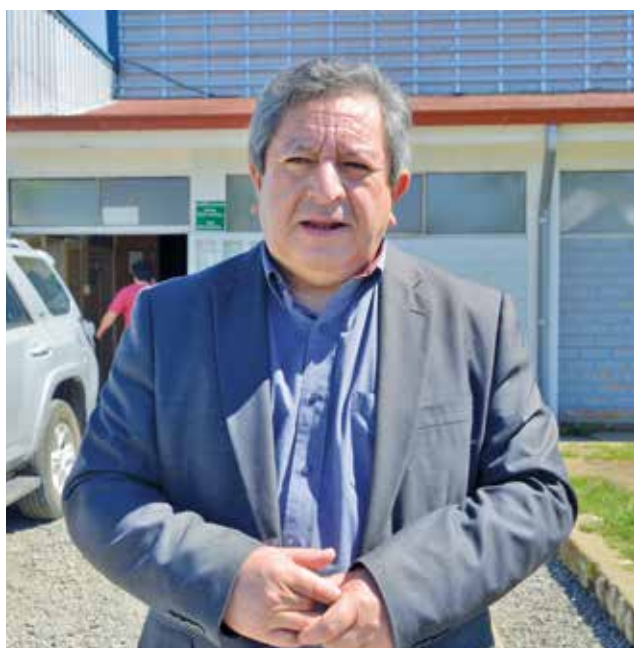
ALCALDE DE SANTA BÁRBARA indicó que tal vez un examen toxicológico hubiese entregado una respuesta más precisa.

todos esos sectores se fueron encontrando especies muertas, las cuales son jilgueros todas, según lo que informó el SAG”. “Esto quedó en manos de ellos y se enviaron a Santiago para determinar la causa de esta mortandad de aves que nos tiene a todos sorprendidos por la extensión geográfica que abarca esta cantidad de aves muertas”, decía el alcalde antes de que La Tribuna obtuviera los resultados del SAG que preliminarmente no pudieron obtener la causa de esta tragedia ecológica.