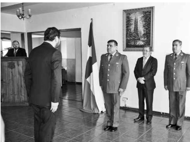
BARCELÓ destacó la labor de Carabineros, recalando la importancia de la seguridad en el país.

Dentro del discurso que dio Barceló mencionó el caso ocurrido en Antuco, donde un conductor de una ambulancia vendía droga. Respecto a ello, el gobernador destacó que “no voy a opinar mucho, porque hay que esperar el veredicto de la justicia, como sea tenemos que decir que la policía tiene puestos sus ojos en cualquier persona y cualquiera sea la institución en la que trabaje”.