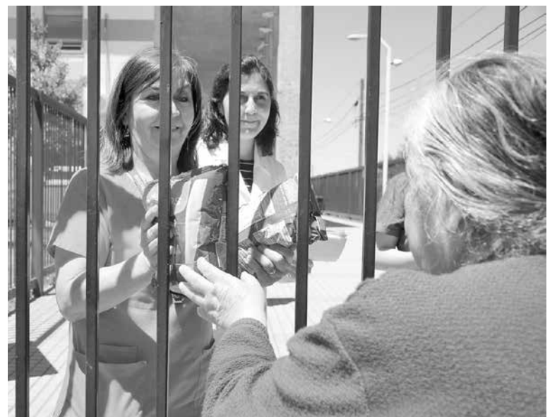
PESE AL PARO, este miércoles, los usuarios sí recibieron sus alimentos y medicamentos.

En tanto, el SAR Santa Fe lo hará entre las 17:15 y 22:00 horas y el SAR Norte de las 17:15 hasta las 8:00 horas del día siguiente.