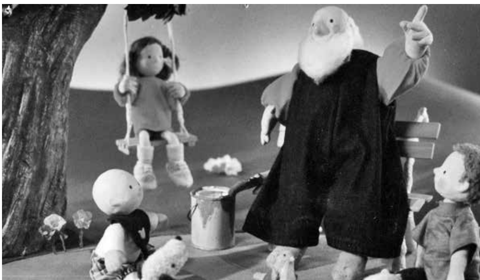
LOS ÁNGELES celebrará el día del Cine chileno.

La cita es para el 24 de noviembre en la Corporación Cultural Municipal de Los Ángeles y cuya entrada es totalmente liberada.