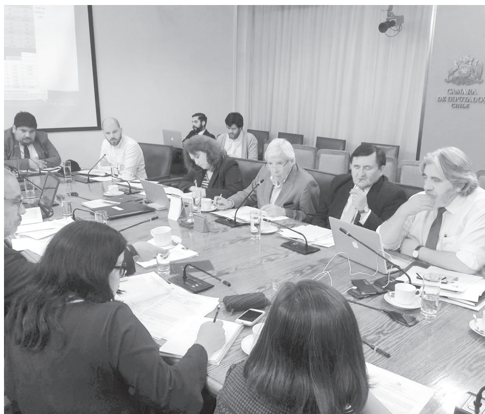
ASOCIACIÓN DE FUNCIONARIOS Docentes de la Educación Municipal de Los Ángeles impulsó junto con el diputado Poblete la presentación de este proyecto de ley.

La moción persigue otorgarles 45 minutos a los docentes para que puedan almorzar y así corregir una situación que no se encontraba del todo regulada.