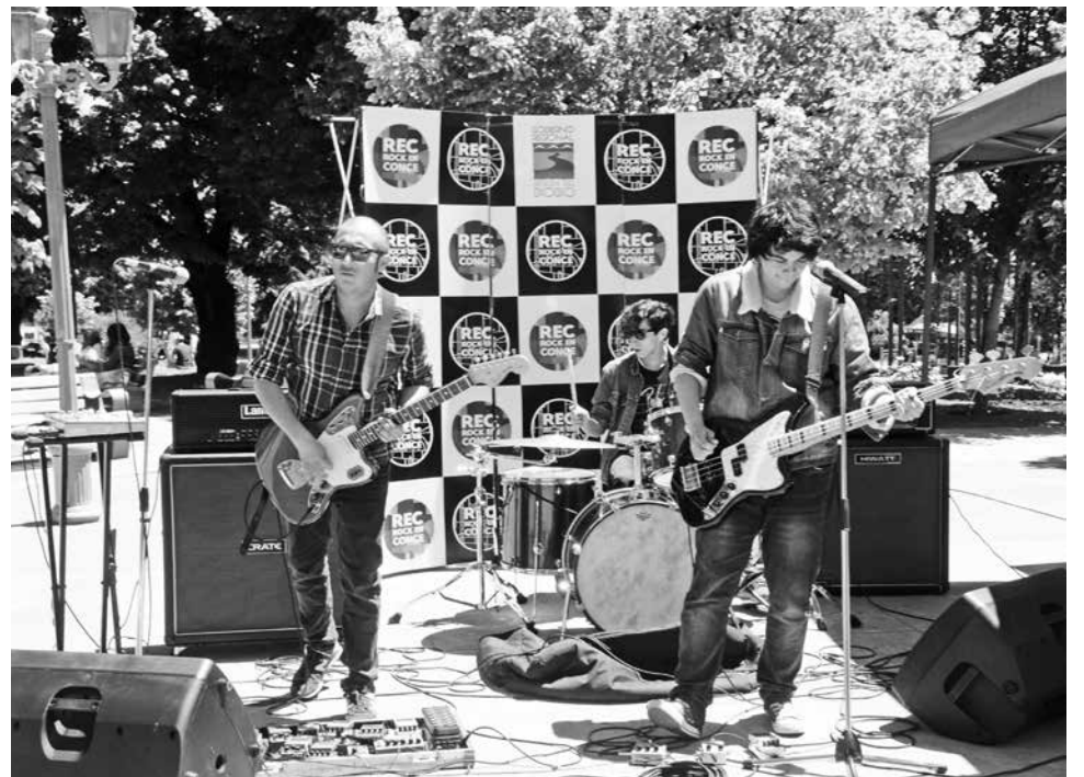
LA BANDA ANGELINA ULTRANOISE presentó el evento antucano en Los Ángeles en la antesala de lo que será su estreno en la comuna cordillerana este sábado, en donde compartirán escenario con Gepe.