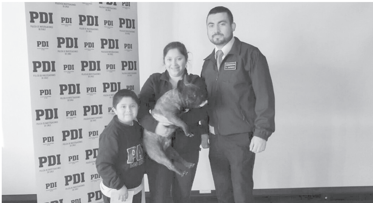
EL CAN FUE ROBADO y luego ofrecido de vuelta a cambio de 200 mil pesos.

La mujer que mantenía la mascota en su poder exigía $200 mil por su devolución.