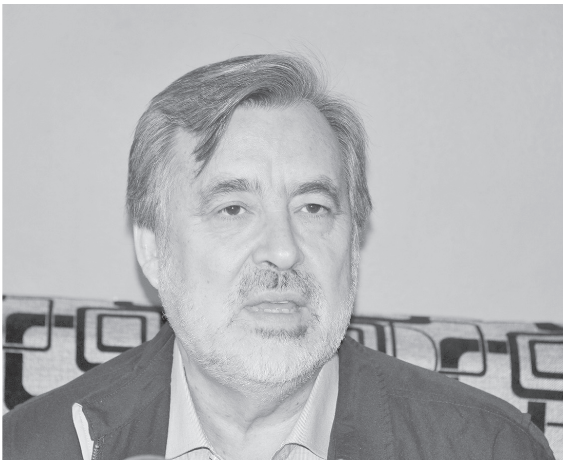
LA VOCERA DEL FA en Los Ángeles comentó que se encuentran en un periodo de análisis del programa de gobierno de Guillier.

“Nosotros como comunal (Los Ángeles) nos vamos a juntar a plantear nuestra posición, eso luego se va a la macrozona y a la mesa nacional y dentro de la mesa nacional se debate con los insumos que cada comuna le entrega”, puntualizó.