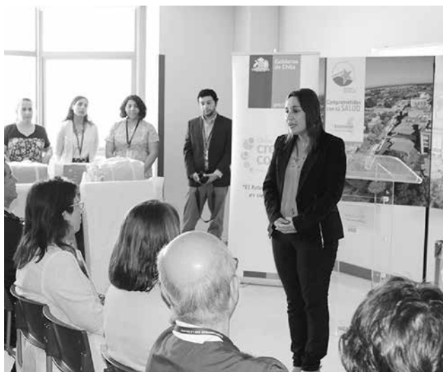
EN LA ACTIVIDAD de manera simbólica se entregaron los 4 nuevos tipos distintos de ajuares, a 4 recién nacidos y sus madres.

Servicio de Salud Biobío y Hospital de Los Ángeles conmemoraron junto a la seremi de Desarrollo Social, Paula Concha, los 10 años desde la implementación de la iniciativa.