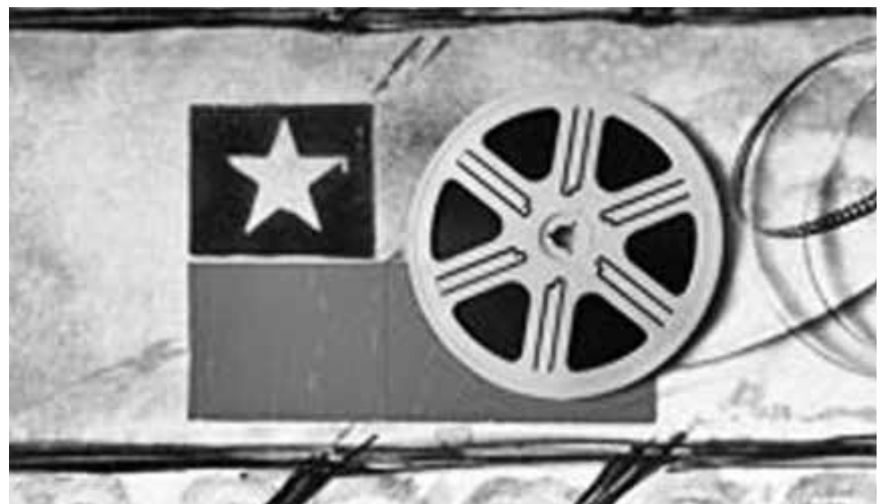
LA CCMLA presentará dos obras gratuitas este viernes 24.