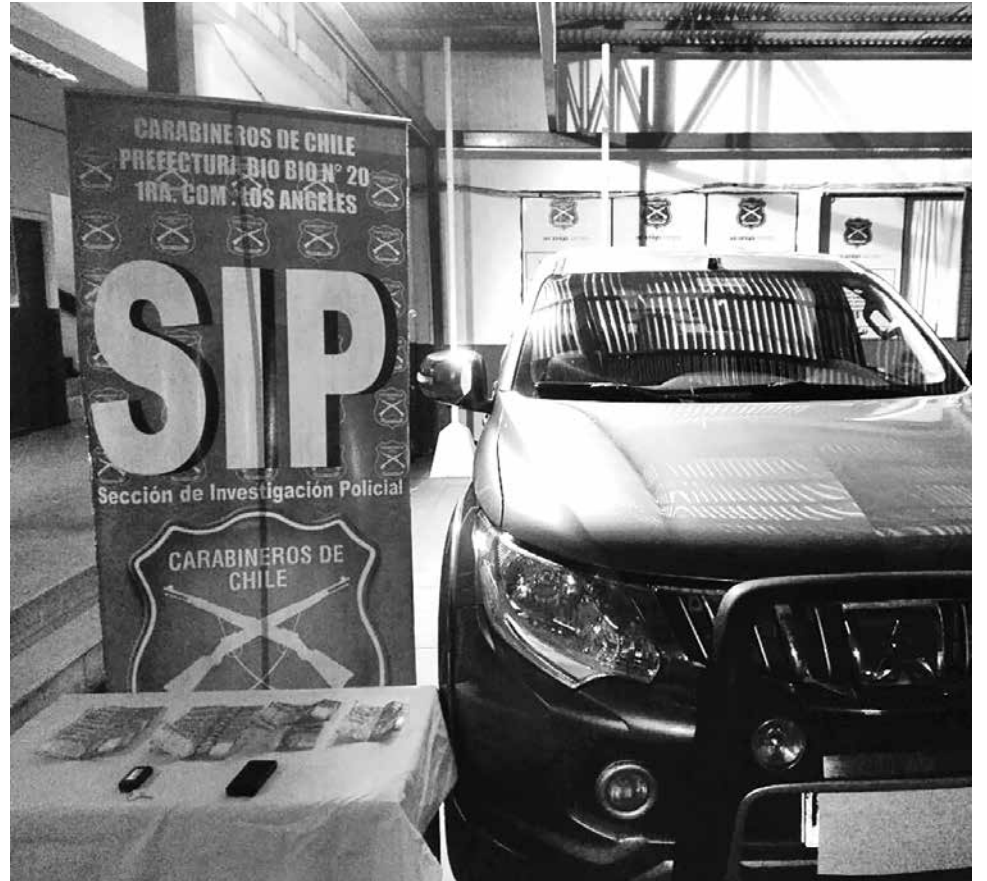
LA SITUACIÓN ALCANZÓ A SER DETECTADA por la víctima, que inmediatamente se puso en contacto con Carabineros.

que ningún miembro de la SIP sufrió lesiones producto del intento de atropello por parte de los antisociales.