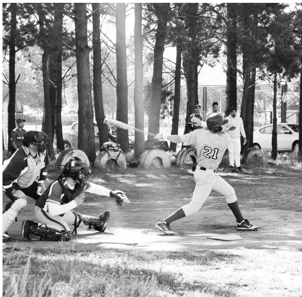
LOS PUMAS mantienen posibilidades de campeonar tanto en la LPS como en la Copa del Sur.