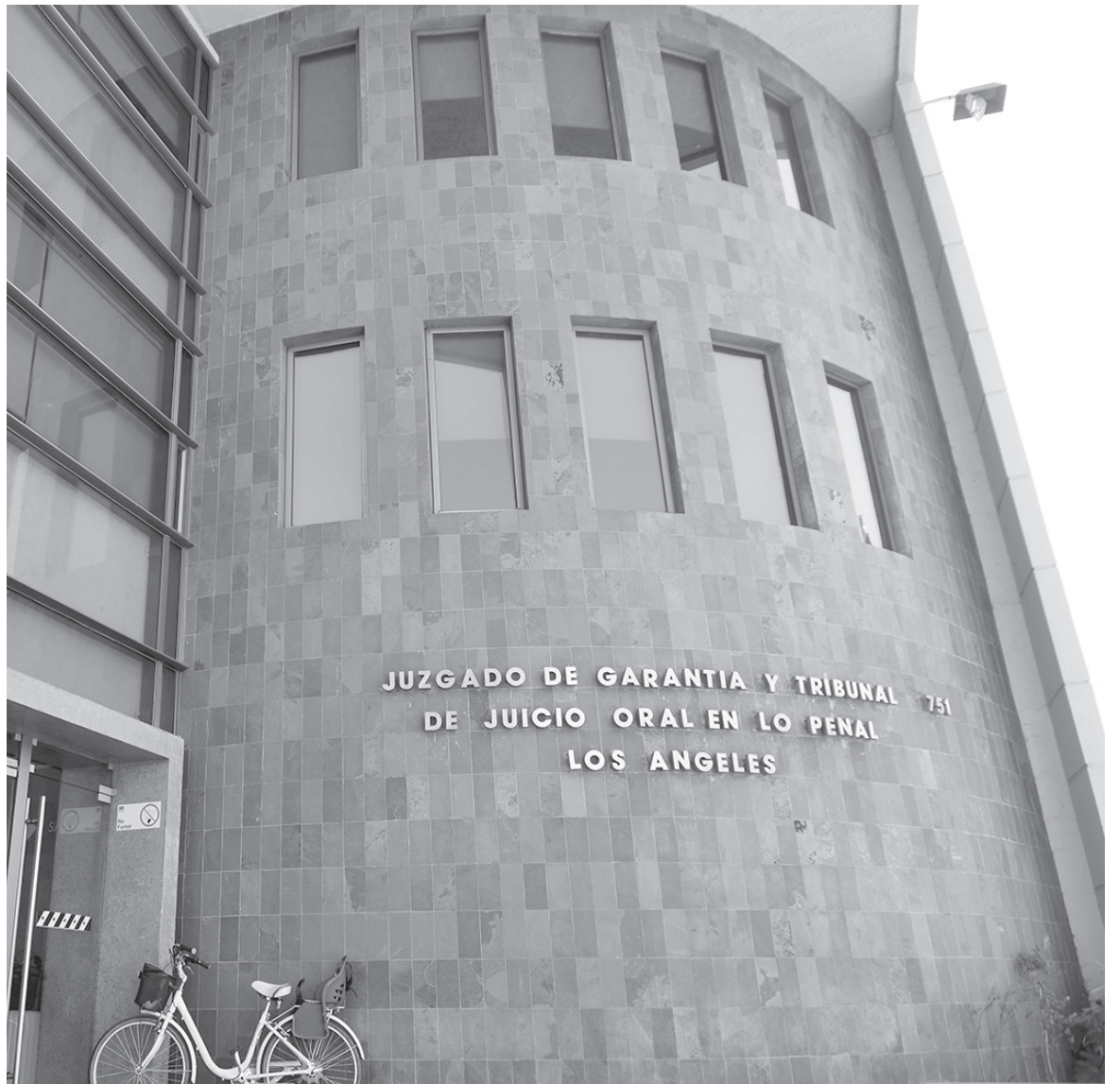
EL MINISTERIO PÚBLICO pedía 15 años de presidio para el joven.

Cabe recordar que el Ministerio Público pedía 15 años de presidio para el joven.