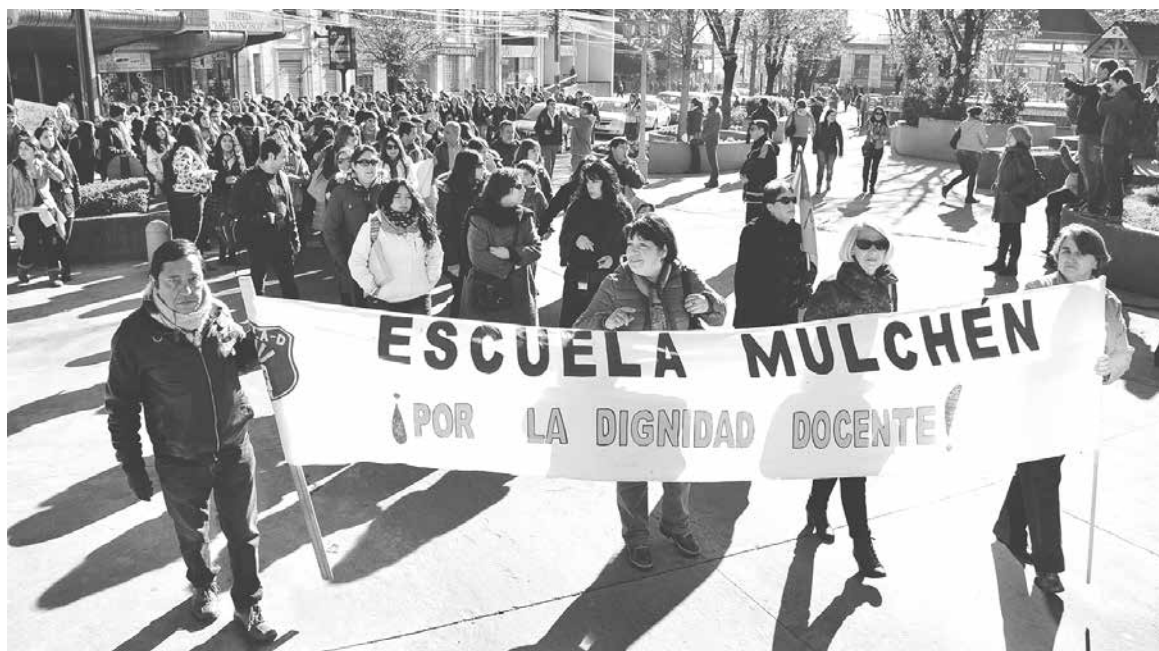
A LA FECHA LOS DOCENTES del sector municipal han interpuesto más de 250 demandas en contra de municipalidades. (Foto de archivo).

Cabe destacar que, a la fecha, los docentes del sector municipal han interpuesto más de 250 demandas en contra de municipalidades o corporaciones municipales, solicitando el pago de un supuesto aumento del bono proporcional mensual, que