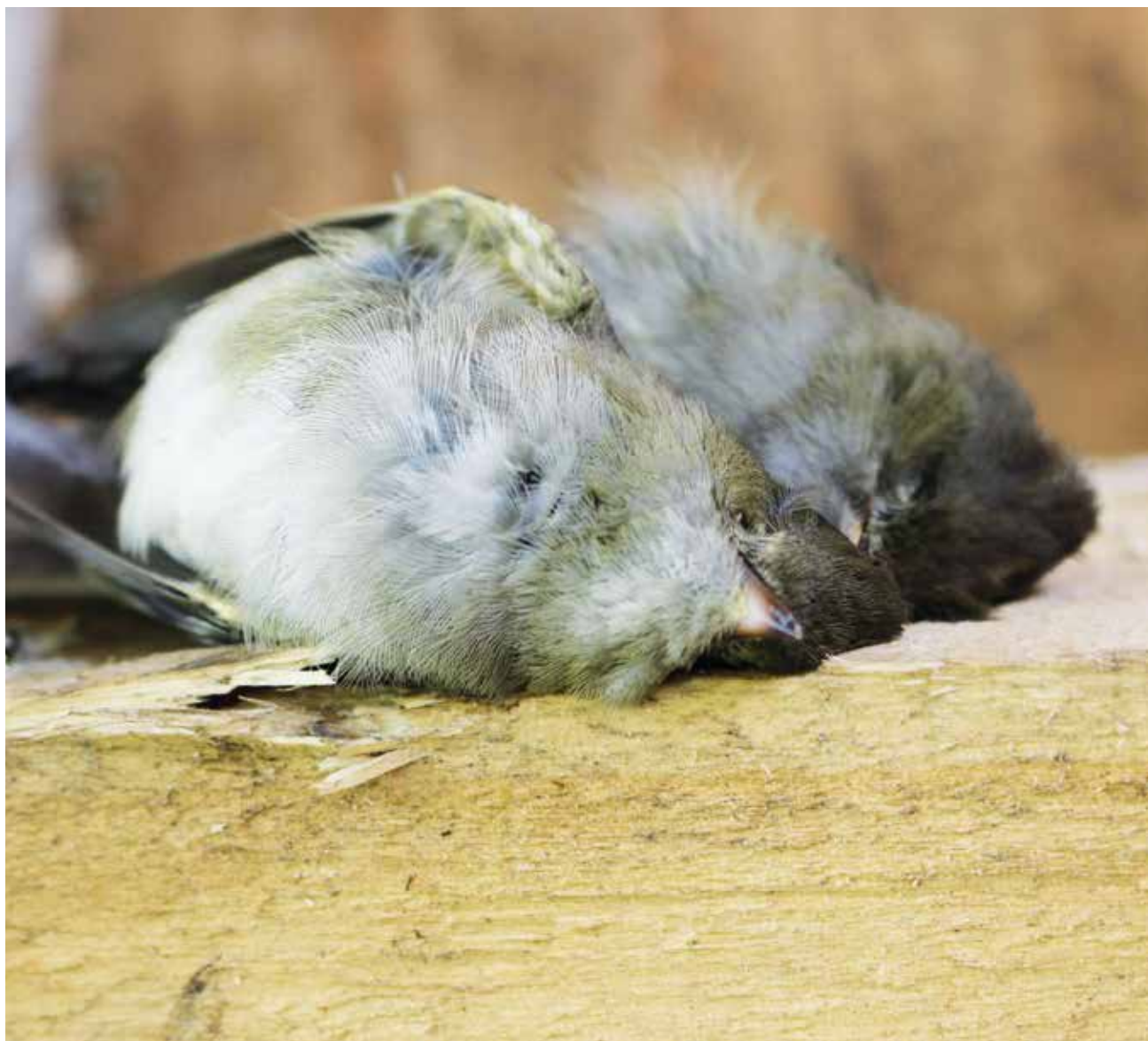
EL SAG informó que la causa de muerte de jilgueros en Biobío era probablemente por el clima.

que “me quedan dudas de qué hubiese pasado si con los resultados de un examen toxicológico”, ya que según él mismo “se podría haber logrado algo más” con una investigación de estas características, para poder determinar si es que hay responsabilidad de terceros en esta mortandad animal.