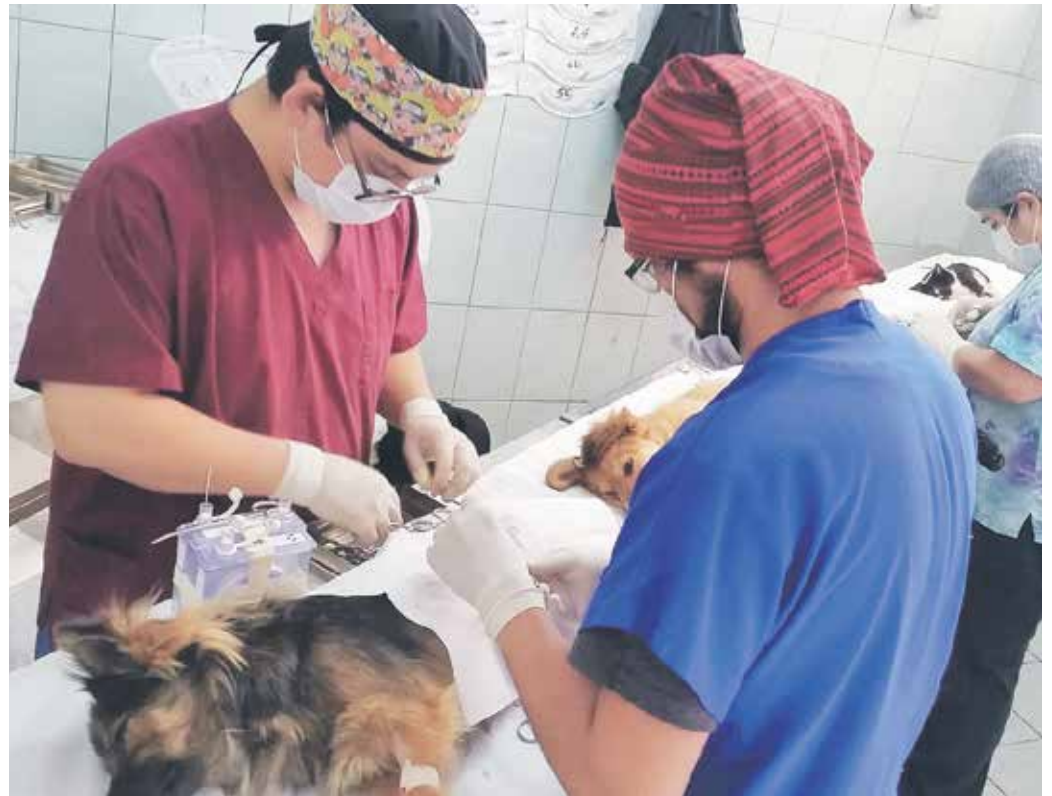
LOS FONDOS para las mil esterilizaciones se consiguieron a través de la Subdere.

Además, como parte de este programa, se han realizado desparasitaciones contra pulgas y garrapatas, además de fumigaciones en distintas zonas de la comuna bureana.