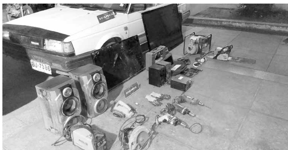
TRAS ARRANCAR LAS REJAS de protección de las ventanas, huyeron con diferentes artículos, entre ellos, una motobomba, un televisor, computador y herramientas eléctricas entre otras

Tanto ella como su pequeño hijo permanecen en reposo hasta recuperarse de lo ocurrido.