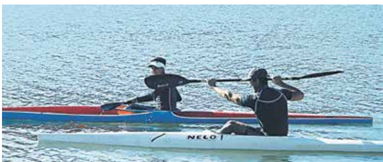
EL ATLETA SE QUEDÓ con el tercer lugar en las modalidades de K1 mil metros, K2 dos mil metros y K4 mil metros.

El lugar en donde se efectuarán las competencias de mini kayaks, kayaks olímpicos singles y dobles, y canoas singles y dobles; serán las aguas de la laguna La Señoraza, espejo de agua lajino, que se encuentra dentro de las mejores pistas del país para la práctica de esta actividad.