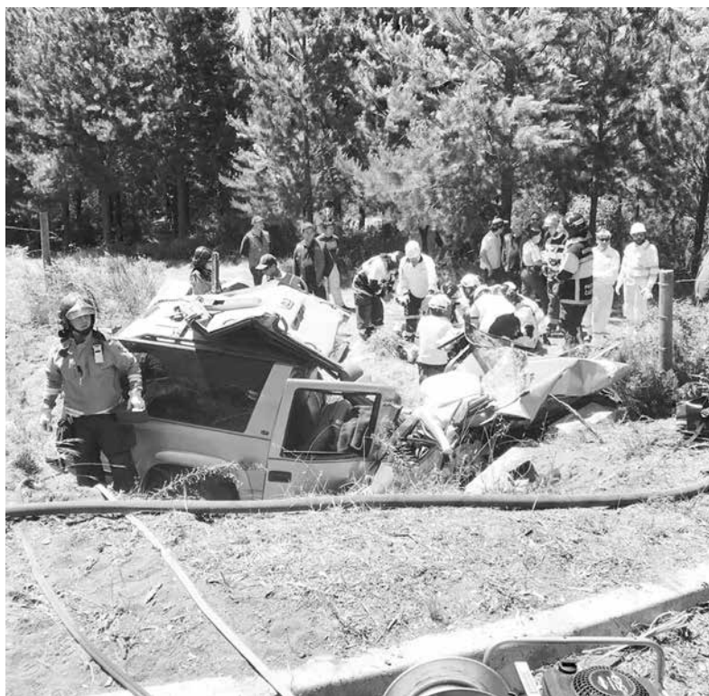
ESTE ES EL ESTADO en que quedó la camioneta.

Cabe indicar que la conductora de la camioneta se encuentra siendo atendida por personal médico, en estado de riesgo vital.