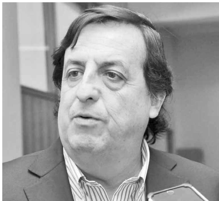
PÉREZ VARELA insistió en que la crisis del Sename se ha originado por el cuoteo político de la Nueva Mayoría.