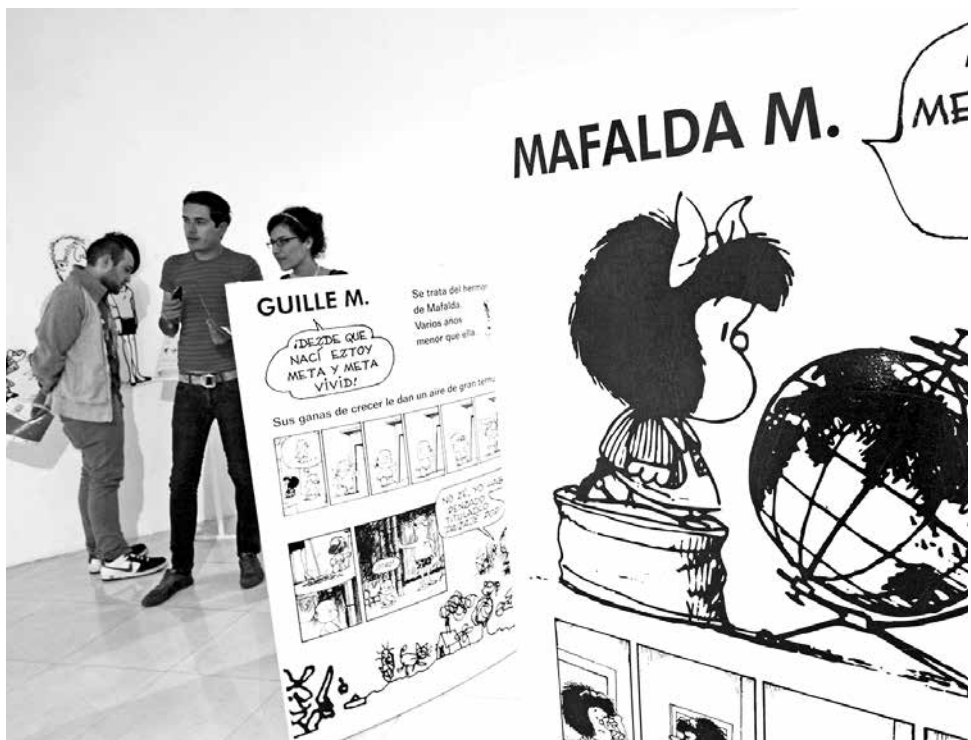
En el ámbito de la empresa estaría bien que apareciera más el síndrome de Mafalda, para que los directivos soñaran más, y no estuvieran tan pegados a la cuenta de resultados, tapados detrás de los números.

Para terminar el experto indica a Efe que existe otro síndrome interesante, como es el de Frankenstein, "que padecen tanto las organizaciones como los empleados, y que se traduce en ser unos zombis que no quieren volver a comprometerse y, dado que el compromiso es la base de la sociedad, no podemos establecer el futuro sólo desde la estrechez de las relaciones laborales".