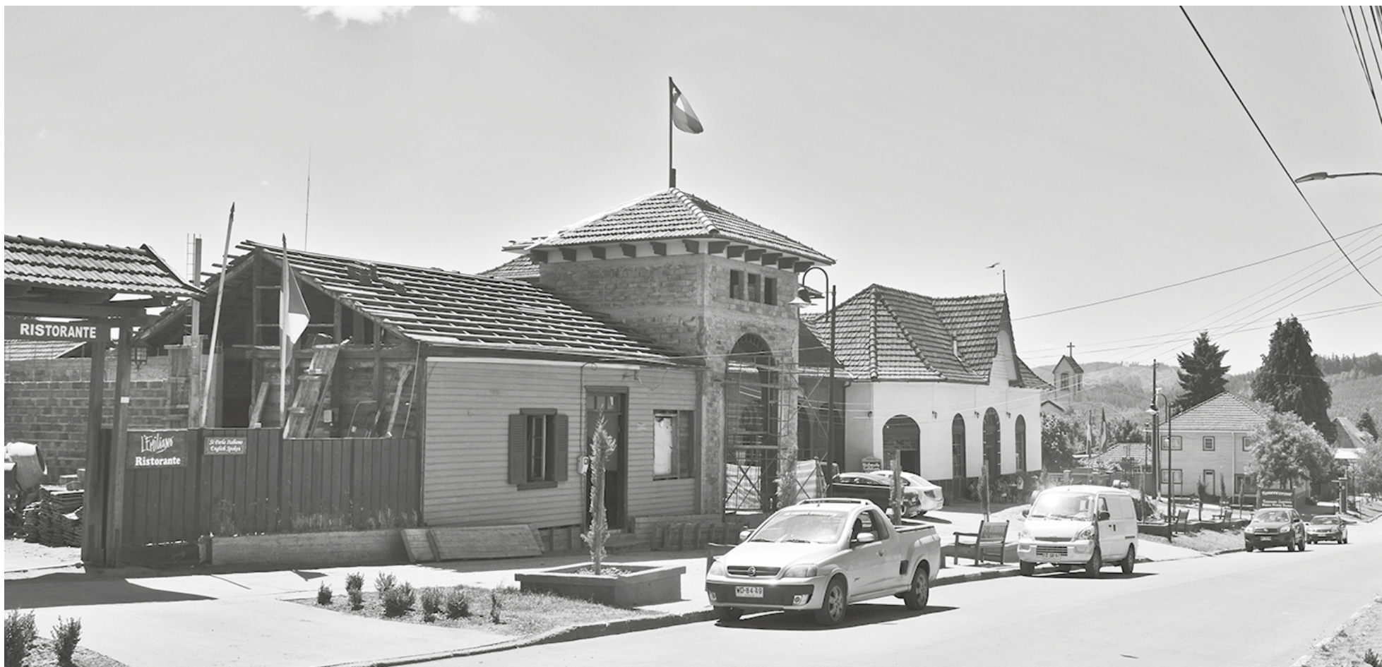
A SÓLO 2 HORAS de Los Ángeles, este maravilloso lugar.

PANORAMAS A POCOS KILÓMETROS DE LA PROVINCIA