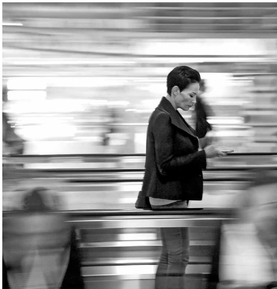
El síndrome de Grey, sin las connotaciones sexuales del libro Fifty Shades of Grey, refleja al típico jefe que necesita controlarlo todo...