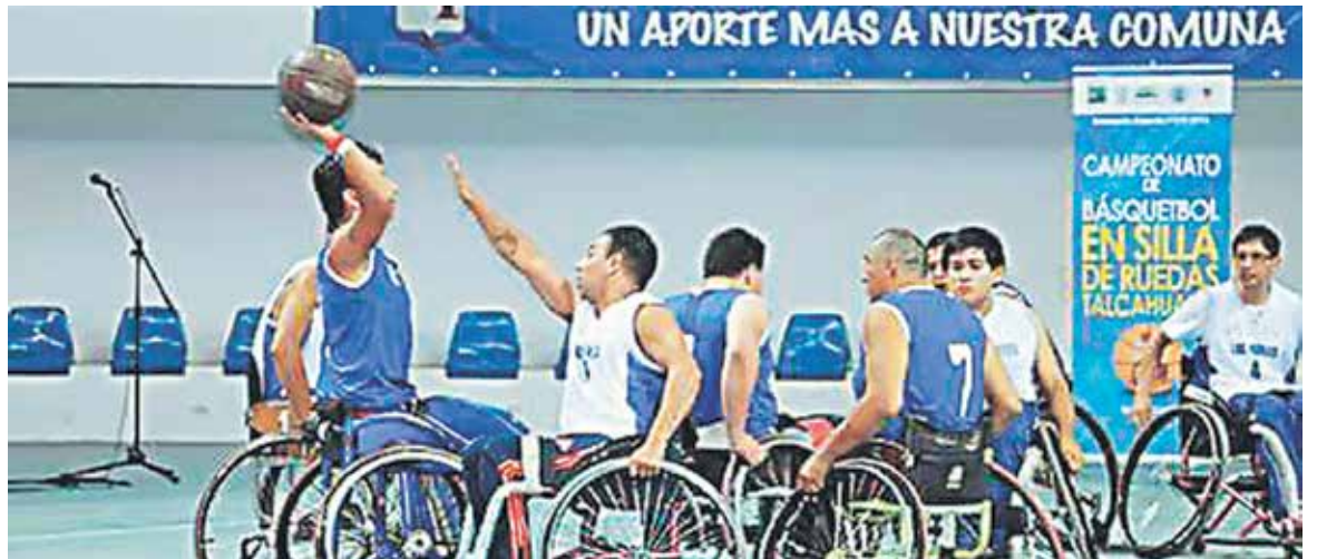
NBA INTENTARÁ quedarse con el torneo y asegurar el ascenso.

En cuanto a los rivales de turno, sostuvo que la Selección chilena femenina será el equipo más complejo al que deberán enfrentar, en ese sentido, manifestó que "uno piensa que son mujeres, pero son