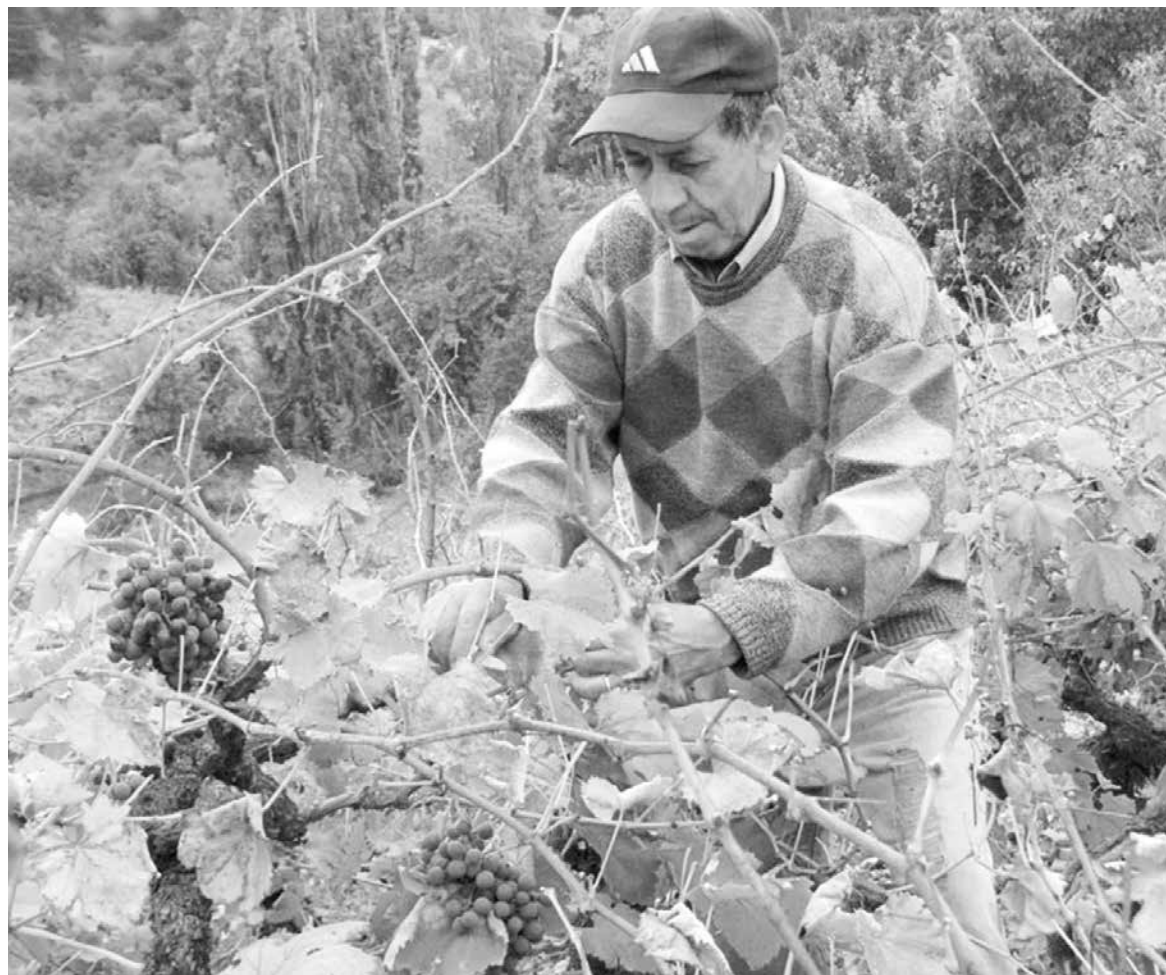
EN LA PRODUCCIÓN de los viñateros de la provincia destaca el Malbec de la zona de San Rosendo, algo de Cabernet Sauvignon y la blanca Italia, en Cabrero y Yumbel.

Finalmente, el director regional de ProChile, destacó que "el gran desafío que tenemos hoy, es cómo logramos que institu-