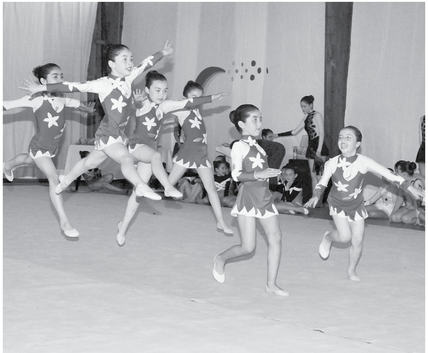
INVITACIÓN ES PARA TODA LA COMUNIDAD, a asistir y disfrutar en familia de este evento gratuito y que tendrá a 15 delegaciones de distintos lugares del país,

La actividad comenzará, específicamente, este sábado 11 de noviembre, a las 9:30 horas, para extenderse al ritmo de la buena música hasta la madrugada del domingo.