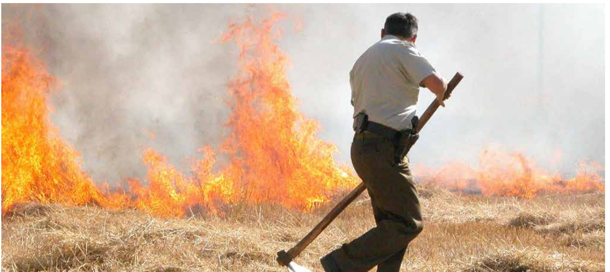
LOS INCENDIOS FORESTALES del verano de 2017 afectaron tres regiones y dejaron diez personas muertas.