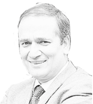
Rodrigo Díaz Wörner Intendente de la Región del Biobío

Por ahora, solo queda aconsejar a los estudiantes de nuestro país a que el día de la PSU se sientan confiados en lo que han estudiado.