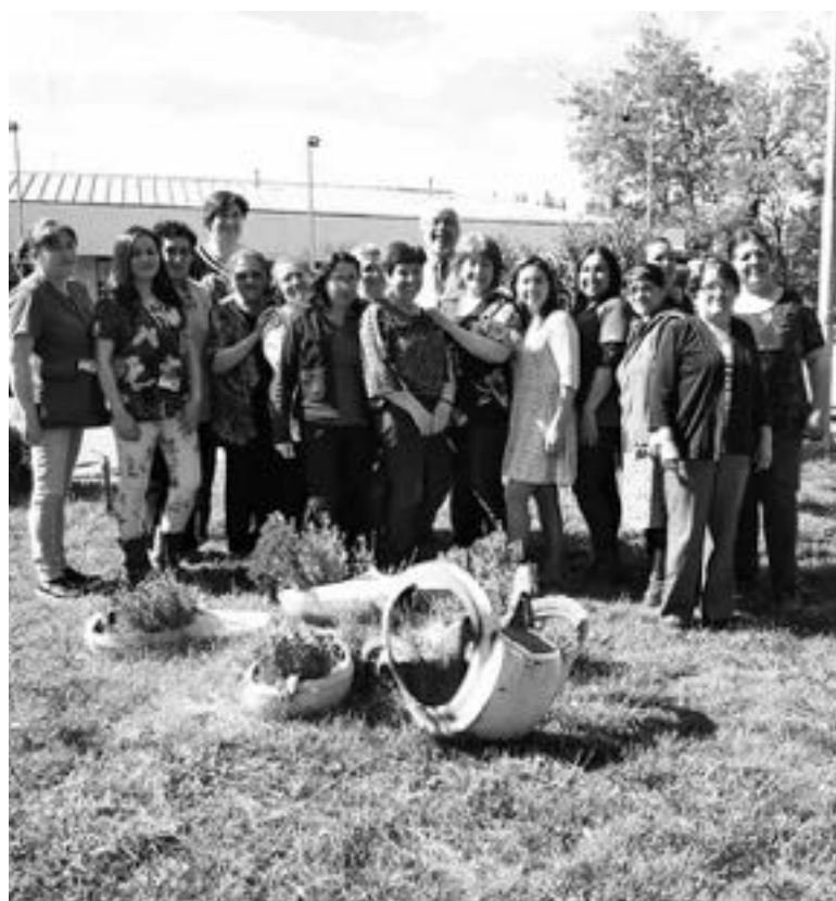
PROYECTOS COMO ESTE otorgan a la comunidad la posibilidad de complementar la medicina científica con aquella que tiene una raigambre ancestral.

Mujeres se capacitaron en productos naturales: cremas, pomadas, champús, aceites cicatrizantes, té de frutas, cojines terapéuticos, entre otras.