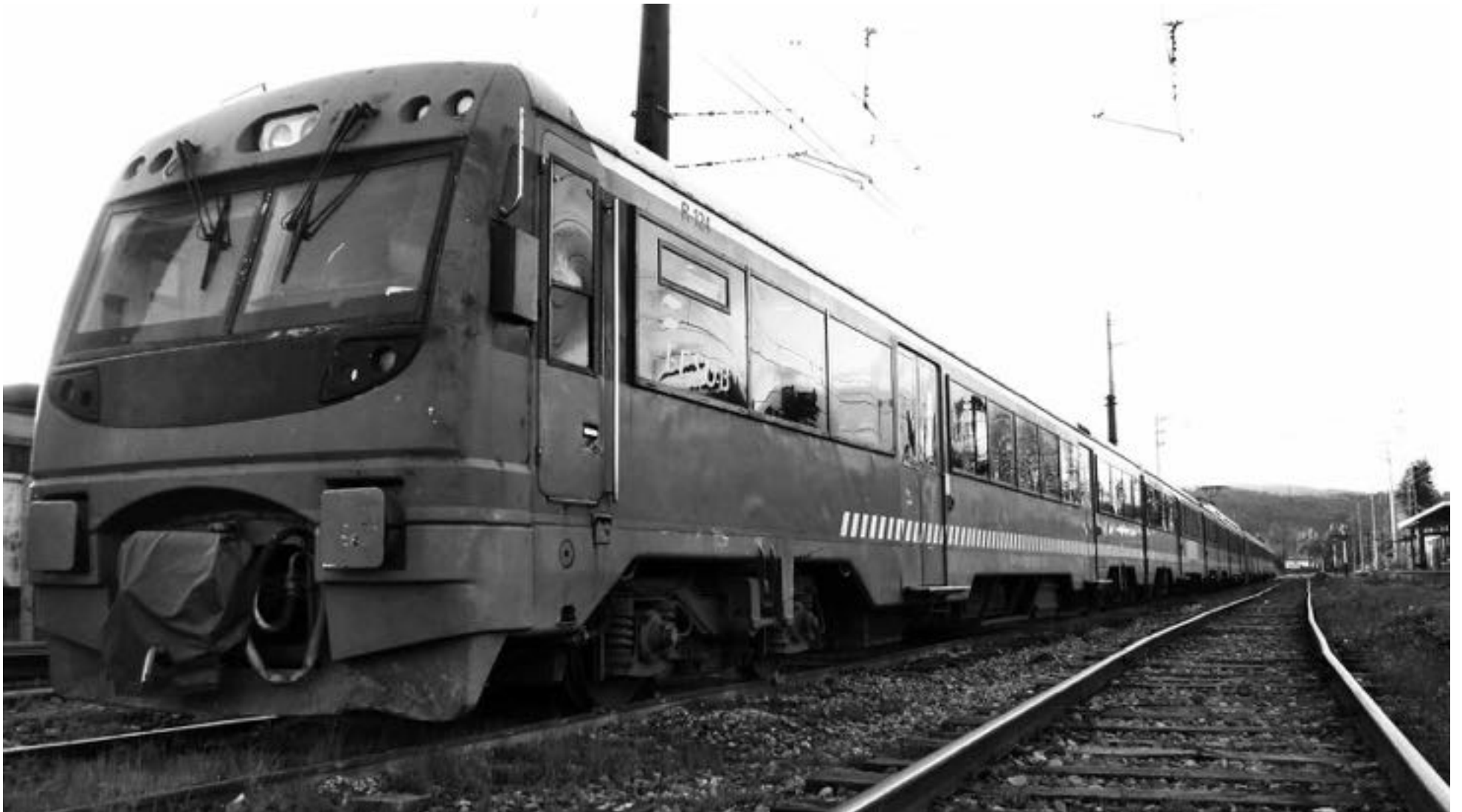
EL TREN CORTO A LAJA contará con nuevos y modernos vagones, otorgando así un viaje de mayor calidad a sus usuarios.