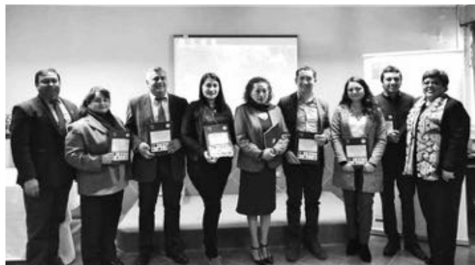
EL TEXTO SE REALIZÓ de acuerdo a la experiencia que profesionales de Los Ángeles, Laja, Nacimiento, Yumbel, Tucapel y Mulchén han vivenciado producto de su experiencia en la educación de personas jóvenes y adultas.

"Es decir, se trata de profesores que han dedicado o dedican su tiempo laboral a desarrollar la modalidad de enseñanza de personas jóvenes y adultas, y que producto de su trabajo han logrado identificar aquellos textos, tanto en la modalidad narrativa, como también en otras modalidades del género, rescatar aquellos textos que más motivan a las personas jóvenes para desarrollar el hábito lector, y también para