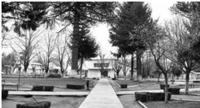
EN UN PROGRAMA de recuperación de áreas verdes, se construirá una plaza en el sector Villa Nuevo Amanecer de Tucapel. Este proyecto busca mejorar el espacio público abarcando la prevención situacional del delito.

Con el botón de pánico los conductores reportarán cualquier emergencia mediante el sistema GPS del vehículo. La plataforma central obtiene el reporte, identifica a qué cuadrante de la Policía pertenece y genera las notificaciones al más cercano. La plataforma web visualiza, mediante un mapa, la ubicación del vehículo y permite gestionar la respuesta inmediata a la emergencia.