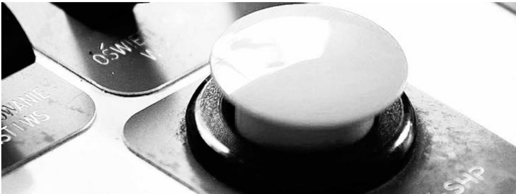
100 BOTONES de pánico se instalarán en la comuna de Tucapel, además de cámaras de vigilancia para el resguardo de la seguridad ciudadana.

Cinco proyectos de Seguridad Pública se aplicarán en la comuna de la provincia de Biobío, entre los que se incluyen la implementación de 100 botones de pánico.