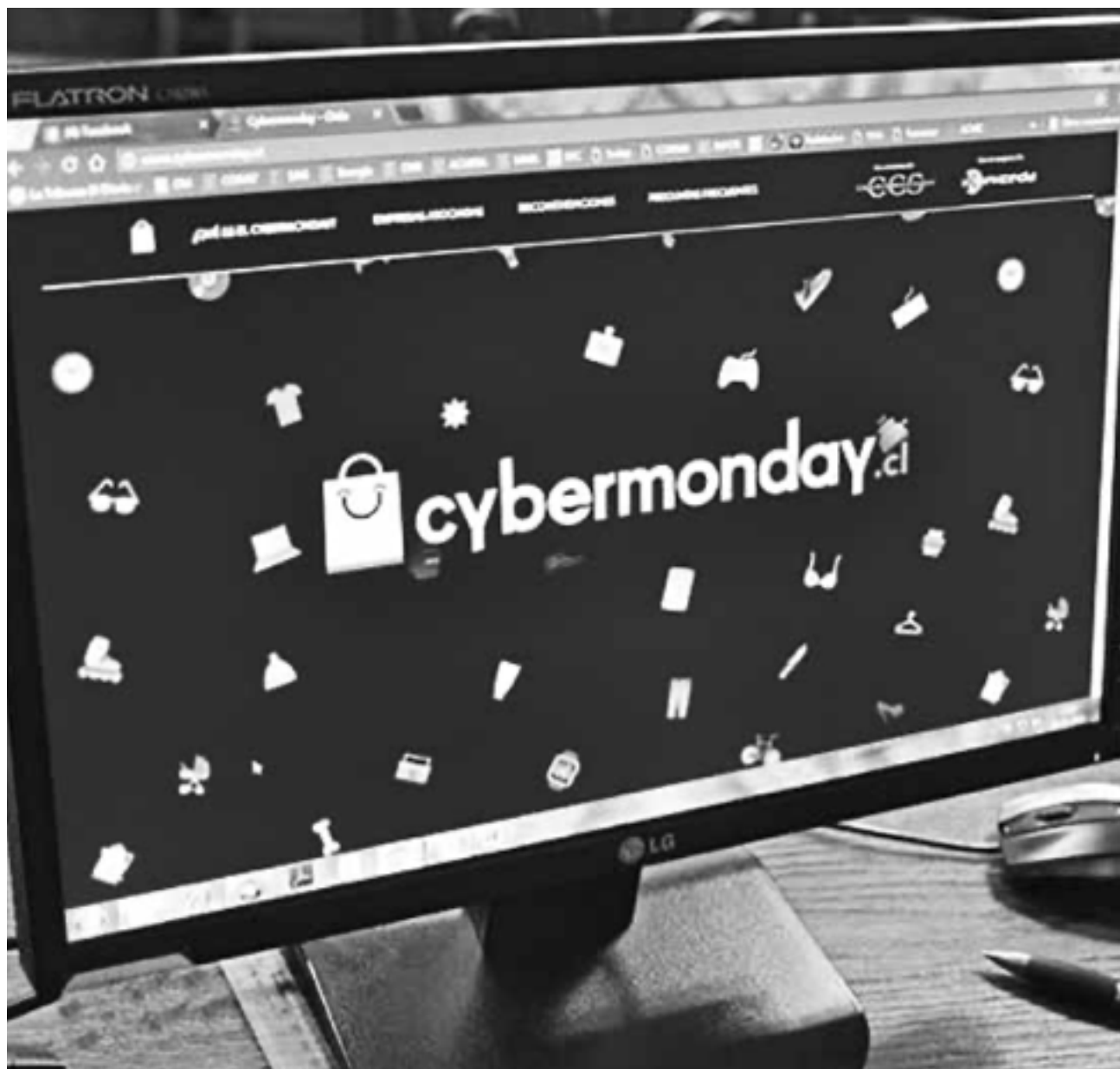
ESTA ES LA SÉPTIMA VERSIÓN que se realiza en Chile.

Además, el Servicio dispondrá del hashtag #CyberMondaySERNAC y las interacciones con su cuenta de Twitter @sernac, para realizar un monitoreo online del evento.