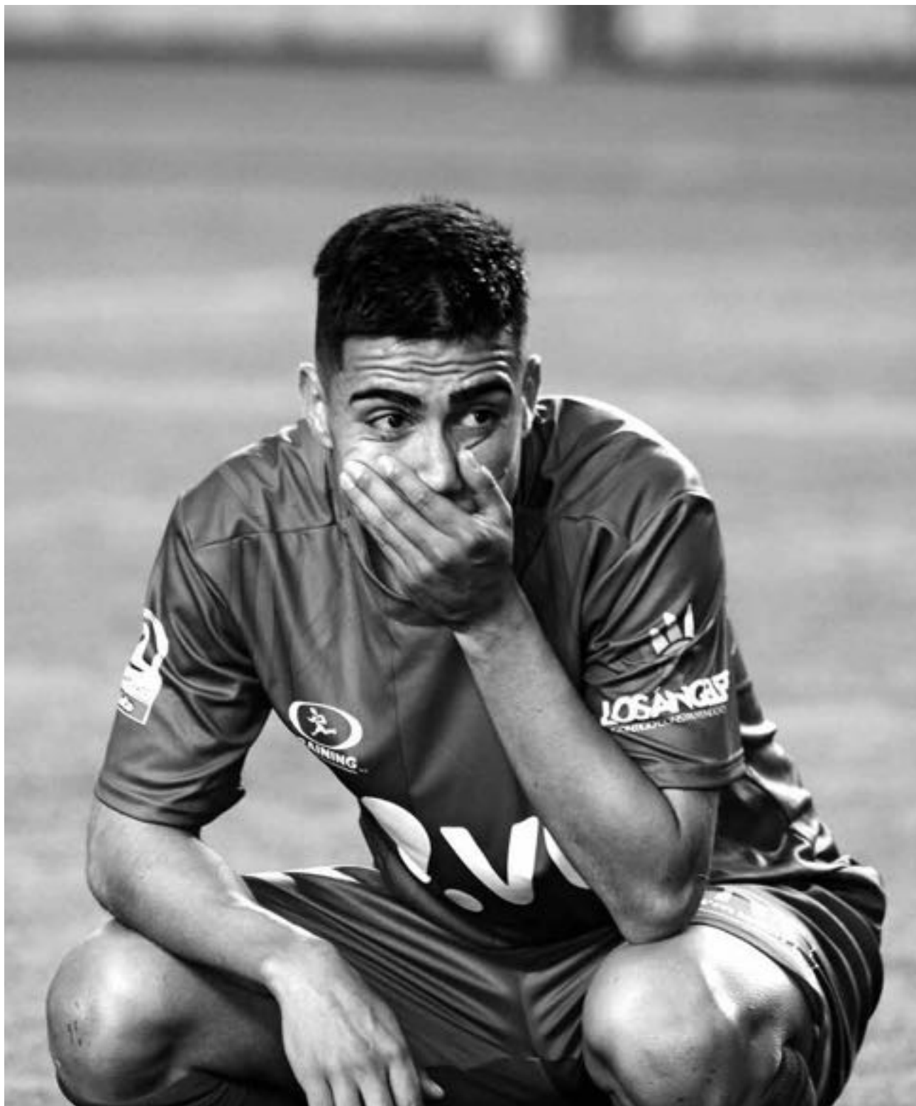
IBERIA MOSTRÓ LO PEOR de su repertorio y perdió sin apelación.

Siete minutos más tarde, Gutiérrez se pierde la más clara de Iberia.