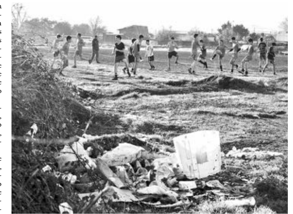
EN ESTAS condiciones trabajaba Iberia en junio de este año.