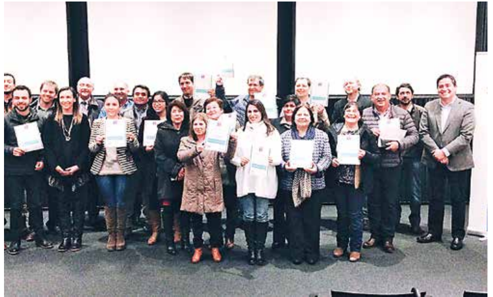
ESTE BENEFICIO favorecerá su competitividad en los mercados.