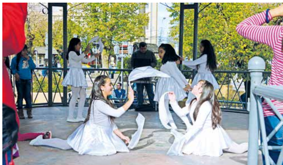
LA DIVERSIDAD CULTURAL es fundamental para el crecimiento de una sociedad, tanto local como nacional.

“Nosotros hemos tratado de hacer algo instaurando una mesa provincial de organización, en cuya primera reunión realizada en la Universidad de Concepción se habló precisamente de descentralizar las