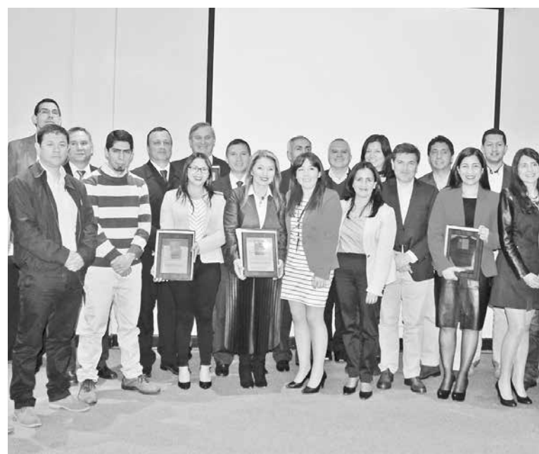
EN TOTAL PERTENECEN a la estrategia 27 empresas privadas y 8 públicas, que se han ido adhiriendo a la iniciativa.

La estrategia LTPS es parte del ámbito de la promoción de la salud, que tiene como objetivos instalar condiciones estructurales