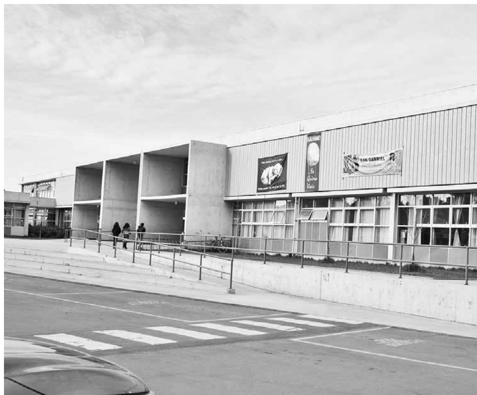
SON CUATRO SEMANAS sin clases las que los más de 6 mil alumnos de la Fundación deberán recuperar.

“los jóvenes de cuarto año medio, culminan su proceso normal por calendario escolar, la segunda semana de noviembre, terminan su etapa formal de clases para rendir la PSU,