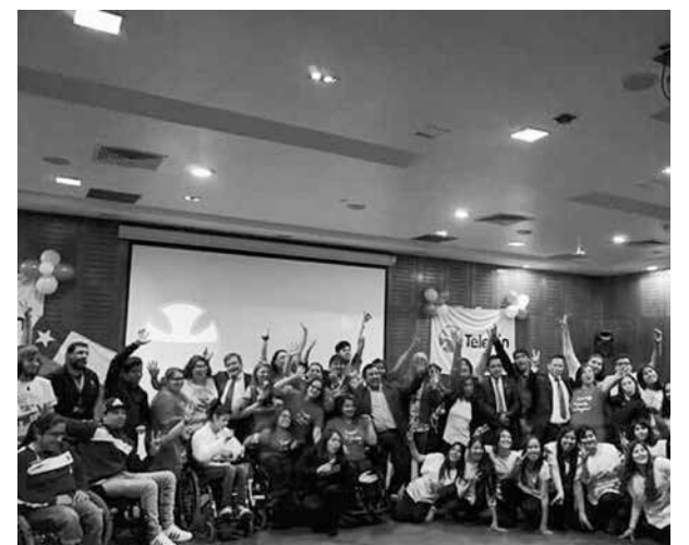
PRESENTACIÓN de campaña de la Teletón 2017 en el hotel Four Points de Los Ángeles.

Para cerrar la jornada en Los Ángeles se presentó el video de campaña grabado en la misma plaza de armas de la capital provincial, en compañía de los instructores de zumba y voluntarios. El video piden que pueda compartirse a través de las redes sociales y el link para verlo en Youtube es: https://youtu.be/p0HKloi2a5Y