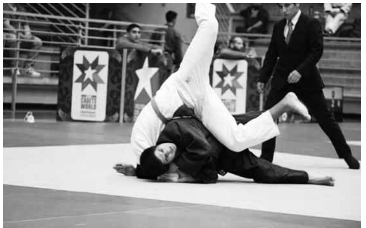
FICA AHORA VIAJA a Argentina para representar a la región en los Juegos Binacionales de La Araucanía.