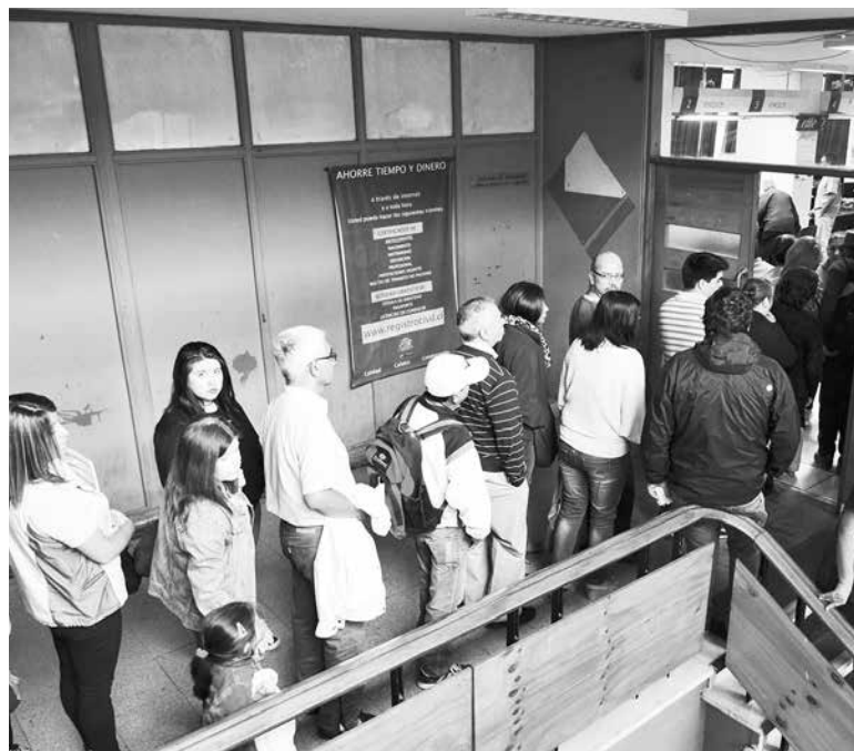
QUIENES TENGAN que realizar trámites en el Registro Civil podrán realizarlos los tres sábados previos a las elecciones del 19 de noviembre.

En Los Ángeles el organismo abrirá sus puertas durante esos tres sábados desde las 09:00 AM hasta las 14 horas, tanto para solicitudes y entrega de documentos.