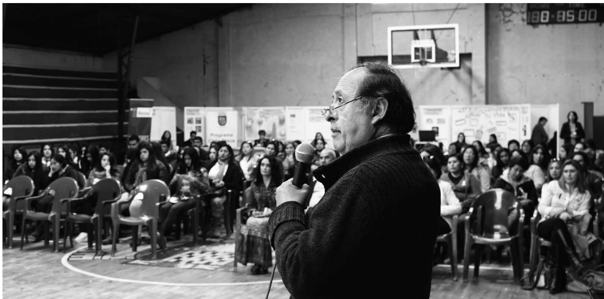
PERSONAL MÉDICO del Servicio de Salud y del Hospital de Los Ángeles, se reunieron con mujeres para poder abordar el tema.

En mujeres con riesgo muy elevado de desarrollar cáncer de mama existen varias opciones terapéuticas. La paciente, junto con su médico debe valorar las ventajas e inconvenientes de cada una de ellas y decidir qué opción es la más adecuada.