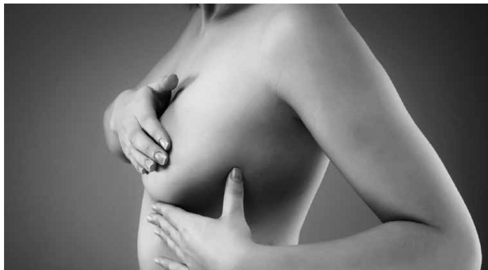
EL AUTOEXAMEN es una de las principales acciones que deben tomar las mujeres.

Hasta nuestros días, no existe un método que permita prevenir el cáncer de mamas de manera absoluta, pero sí hay medidas que las mujeres pueden tomar que podrían reducir su riesgo. Esto es especialmente útil para quienes tienen ciertos factores para el cáncer de seno, tal como las que tiene