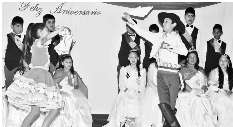
BAILES Y OTRAS actividades lúdicas se realizaron para conmemorar el cumpleaños de la escuela Santa María de Los Ángeles.

Aquel sueño ya cumple 36 años y se celebró con diversas actividades como trivias, dibujo, yincana, tirar la cuerda, penales, competencias en las redes sociales y coreografías de los años 20, 60, 80 y 90; correspondientes a cada alianza. Asimismo se premió finalmente a los abanderados de cada curso.