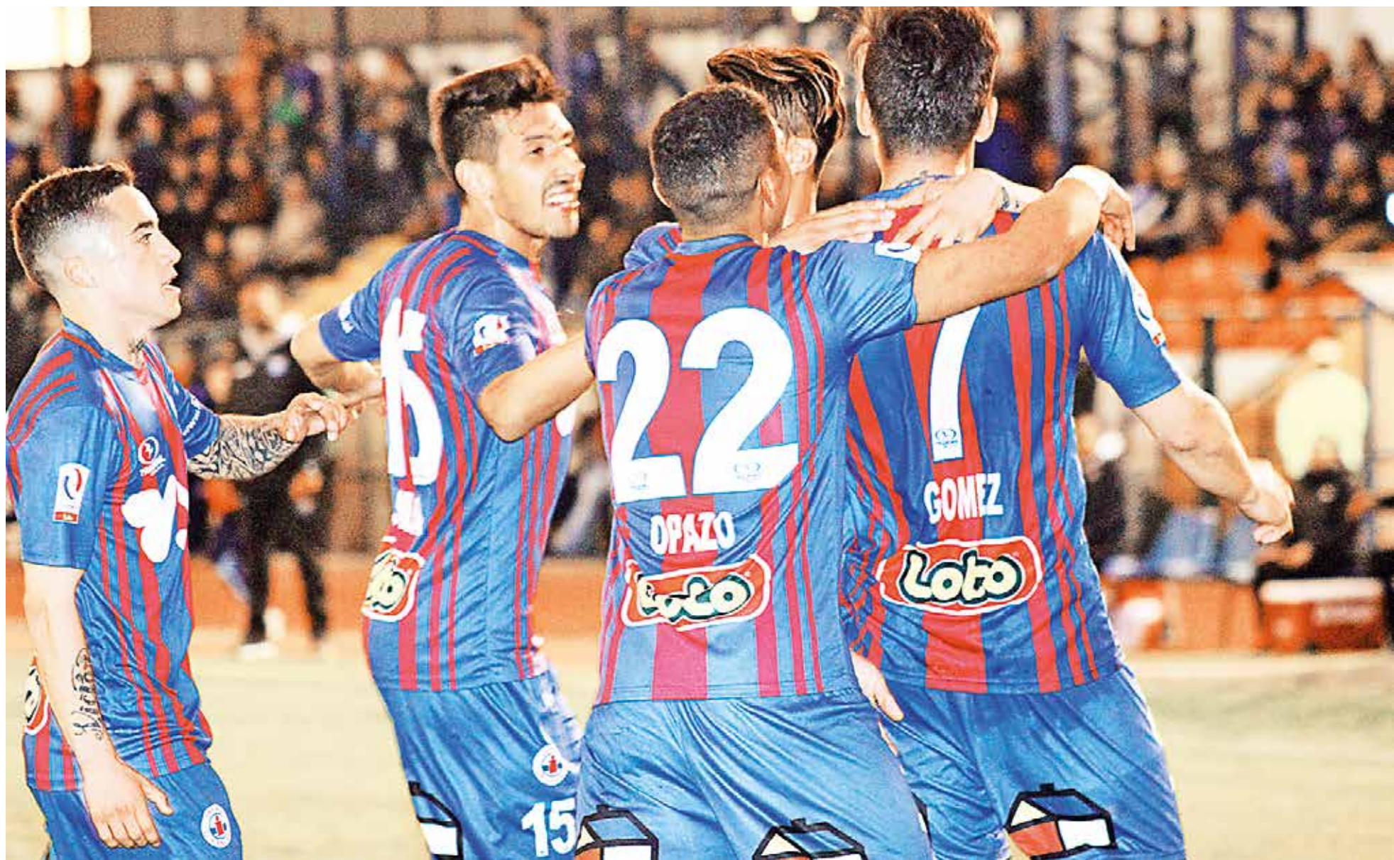
LA "AZULGRANA" no quiere pensar en la altura para medir fuerzas con Cobresal.

EN UN DUELO CLAVE POR ZAFARSE DEL DESCENSO