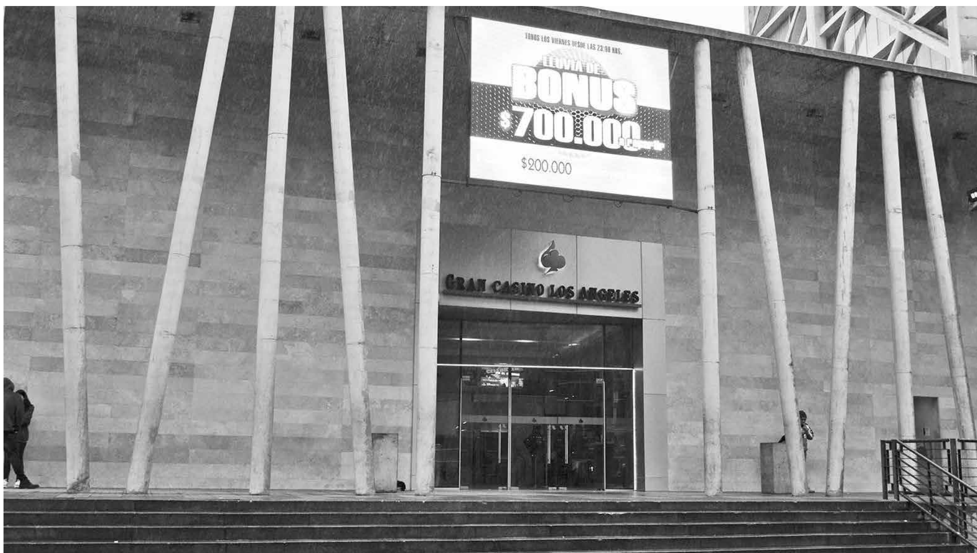
APORTES POR $41 MILLONES de pesos por concepto de entradas generó durante septiembre el Gran Casino Los Ángeles.