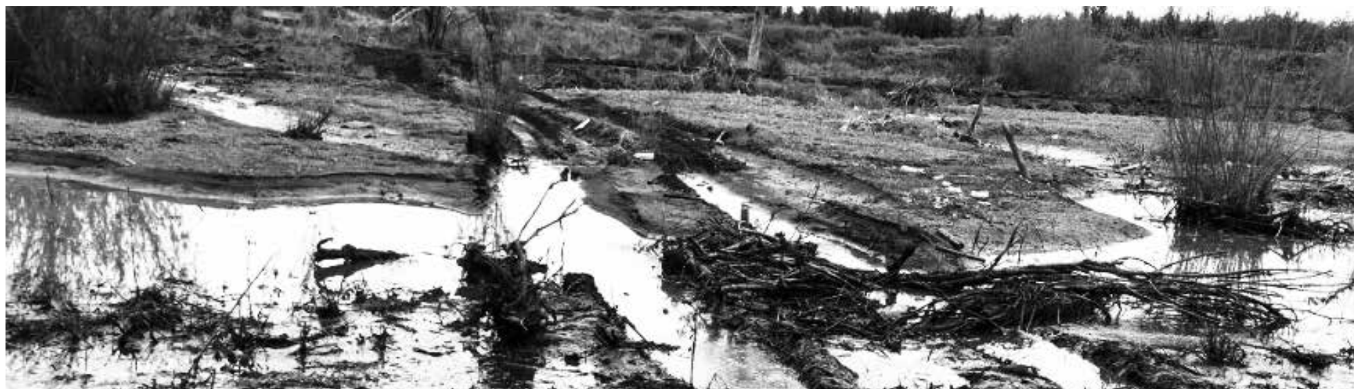
AGUAS ESTANCADAS, bancos de arena y contaminación es lo que se observa actualmente a orillas del Quilque en el sector Arrayán Las Violetas.

Vecinos del sector Arrayán Las Violetas, cuyos sitios resultaron inundados tras los últimos desbordes del estero, culpan a la Dirección de Obras Hidráulicas de la región de ejecutar una mala mantención del cauce y, con ello, de provocar perjuicios en sus propiedades. Senador Víctor Pérez visitó el lugar y acusó “indolencia” de las autoridades para tratar de brindar una solución a las familias afectadas.