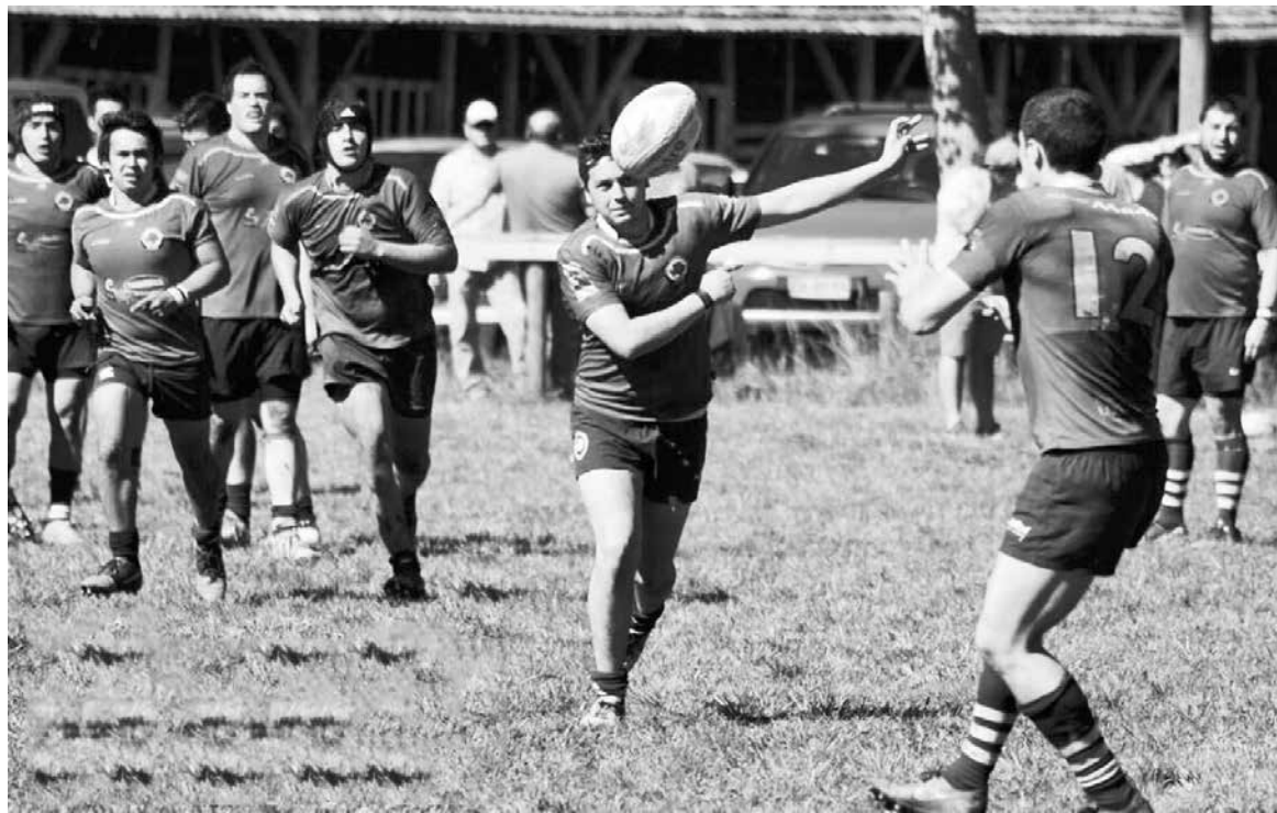
EL EQUIPO ANGELINO ya venció a la “UdeC” este campeonato y lo hizo por 38 a 31 en Los Ángeles.

Respecto a la ansiedad o nerviosismo del plantel, el capitán dejó en claro que “el equipo se compone de