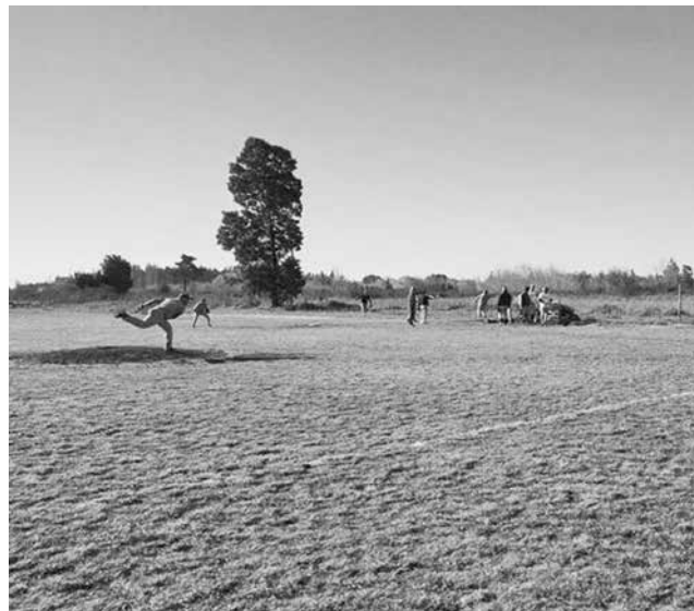
EL EQUIPO angelino se enfrentará a “Huracanes” de Temuco.

Un buen inicio de temporada es el que está teniendo el club “Pumas” de Los Ángeles en la Copa del Sur de béisbol y es que hasta el momento han ganado dos de sus tres partidos disputados en el torneo.