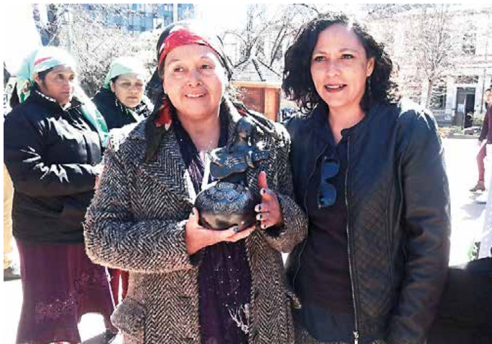
LA DIRECTORA REGIONAL de la Cultura y las Artes dijo que se está trabajando conjuntamente con las comunas para impulsar la cultura desde sus propias localidades.