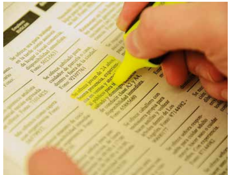
EN LOS ÁNGELES, la tasa de desocupación se situó en 7,1%.

Este martes, la ministra del Trabajo y Previsión Social Alejandra Krauss ha enfatizado que el desempleo disminuyó en 10 regiones del país, indica que la economía sigue