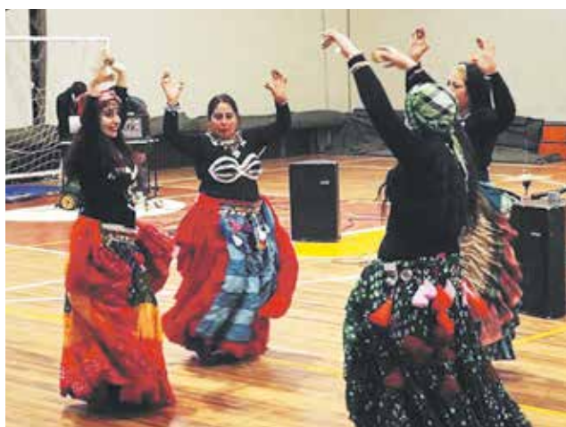
DANZAS TRIBALES interpretadas por adolescentes angelinas.

Además ofrecen presentaciones artísticas (Varieté) a la comunidad angelina, en el cual se pide una cooperación al estilo de las obras clásicas de los inicios del teatro francés. A la vez, cuentan con servicio privado de animación y entretenimiento.