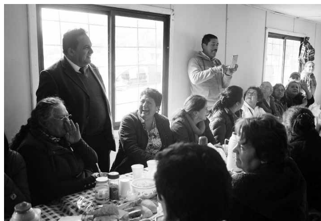
LA ACTIVIDAD SE DESARROLLÓ en dependencias del estadio de villa Las Rosas de Antuco.