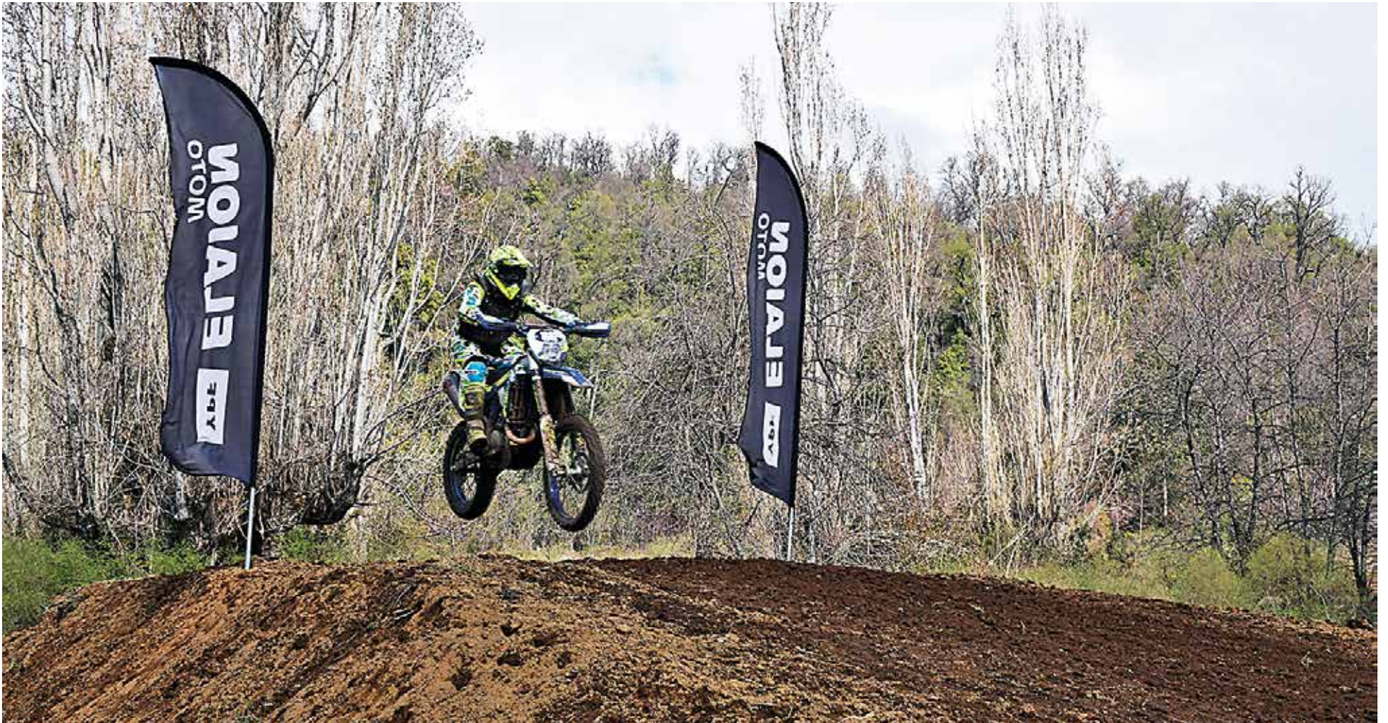
ANTUCO volverá a sentir rugir los motores y a ser testigo de los mejores pilotos del sur de Chile.