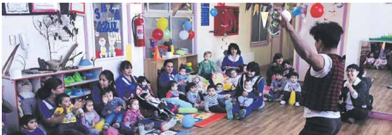
PRESENTACIONES EN JARDINES infantiles incluyen las actividades realizadas en aquel centro.