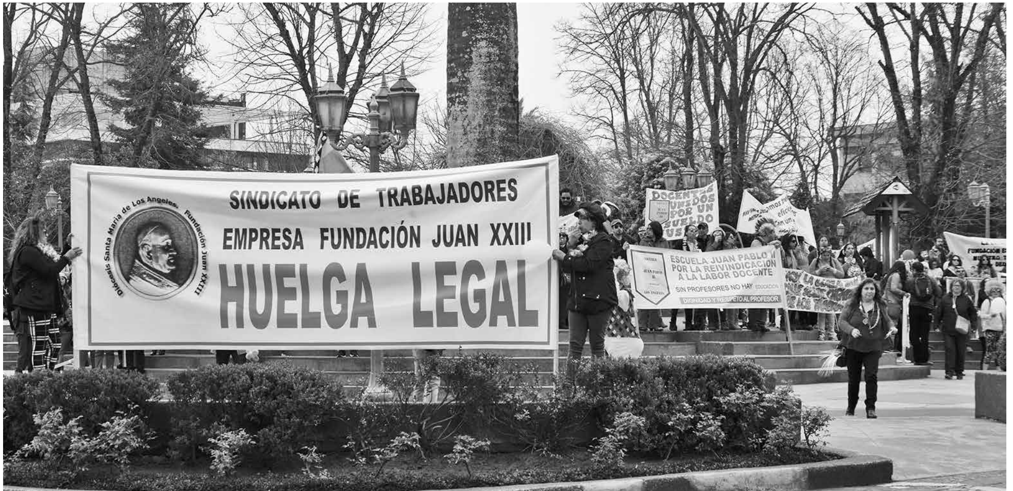
ESTE MARTES LOS ALUMNOS de los establecimientos de la fundación se incorporaron a sus clases normales. Hoy lo harán en Alto Biobío.