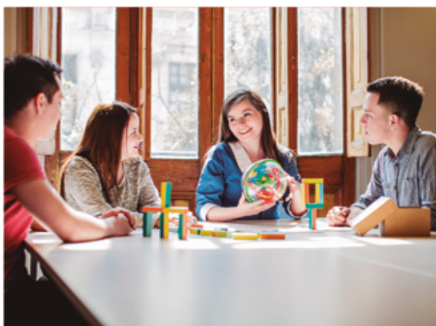
Ocho son los alumnos de Inacap que desarrollan el proyecto.

prendedores para poder luego optimizarlos; deben conectar emprendedores, grandes empresas y las universidades mismas, de modo que el conocimiento y las oportunidades fluyan; y sobre todo, deben mantenerse a sí mismas y a sus ecosistemas emprendedores en un proceso de aprendizaje permanente respecto de las prácticas requeridas en sus hábitats para el emprendimiento exitoso, que siempre son cambiantes. Sólo de esta forma lograremos ponerlos al día proveyendo equidad en la entrega de la oportunidad emprendedora para todos.