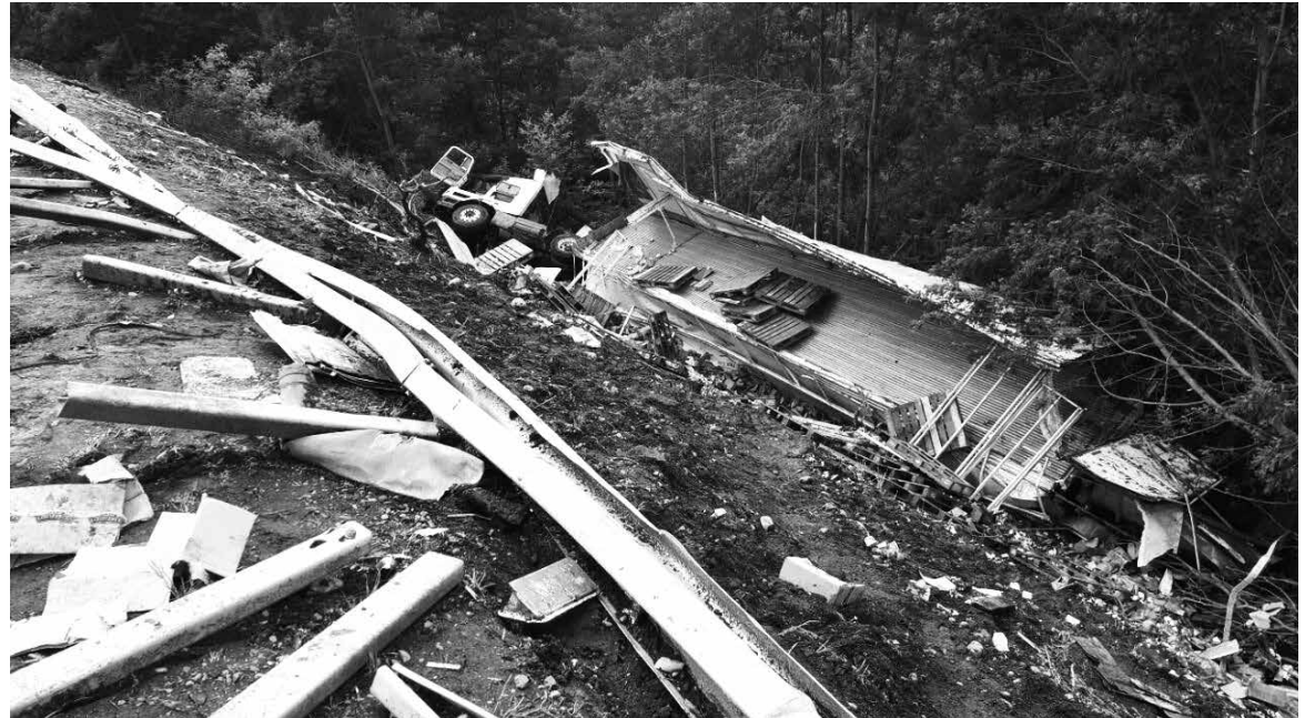
EL ACCIDENTE SE REGISTRÓ a las 23:30 horas de este martes, a la altura del kilómetro 558 de la Ruta 5 Sur.

Especialmente en estos días de lluvia, el llamado a todos quienes manejen un vehículo motorizado es a realizar un examen previo respecto a las condiciones en las que se encuentra su automóvil, considerando el estado mecánico de los neumáticos y su sistema de dirección, además de las condiciones de la vía.