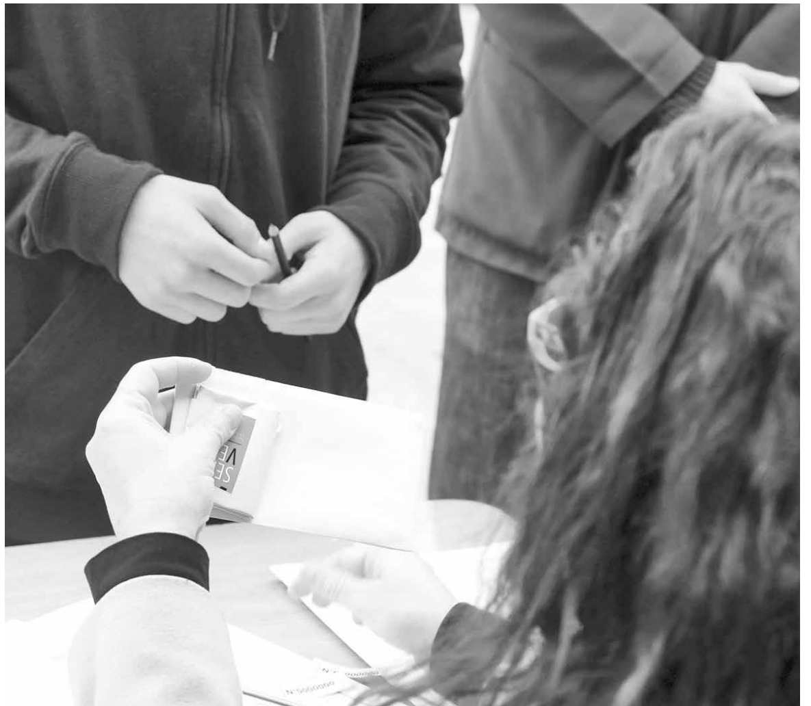
HAY PLAZO hasta el 2 de noviembre para presentar excusas, en caso que alguien esté impedida de ejercer como vocal de mesa por discapacidad.

Segundo, presentar las excusas entre el 30 de octubre y el 2 de noviembre de 2017, plazo para presentar excusas y solicitar exclusiones ante Juntas Electorales para desempeño del cargo de vocal de mesa y de miembro de Colegio Escrutador.