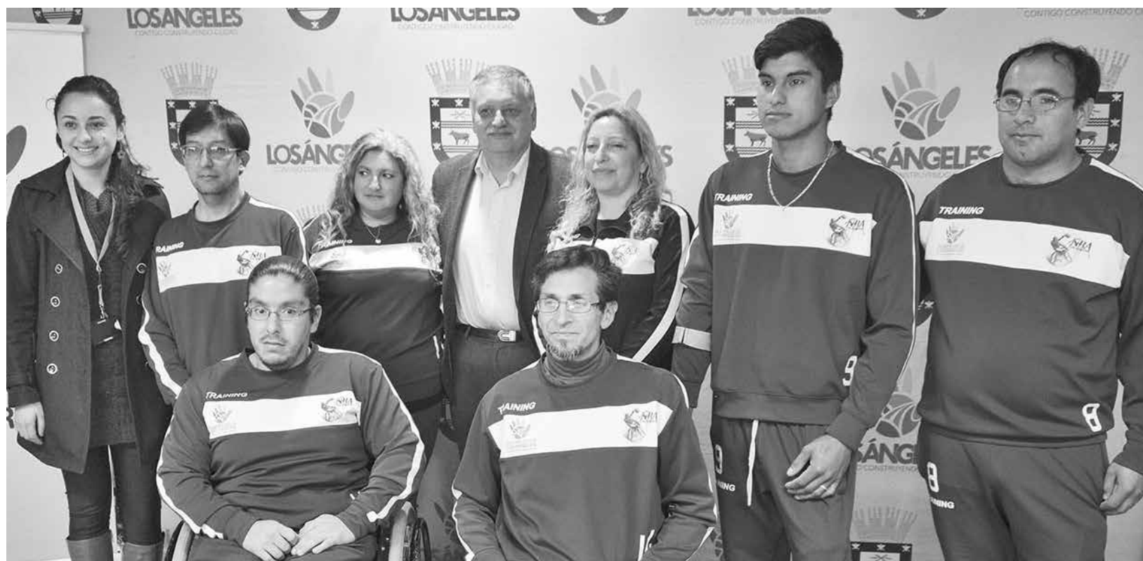
ENCARGADA DE DEPORTES, alcalde, entrenadora y deportistas dieron a conocer el evento.

equipos, que serán los que participarán en dicho campeonato. Los clasificados a esta cita son NBA Los Ángeles, la Selección chilena, Suri de Lota y Pingüinos de Puerto Montt. El campeón ascenderá a la Primera División de la liga chilena.