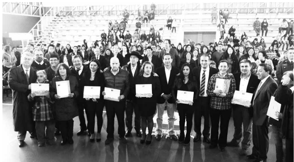
UN GRAN MARCO DE PÚBLICO y distintas autoridades locales acompañaron a los beneficiarios en este significativo acto.

El proyecto villa Las Estrellas considera obras complementarias como áreas verdes, arborización, plaza de juegos, luminarias, pavimentación de calles, pasajes y aceras y una sede social de 75 metros cuadrados.