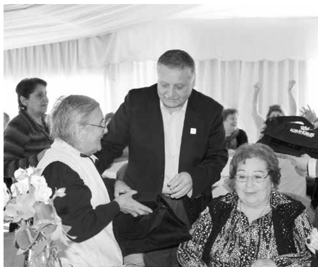
EL ALCALDE ESTEBAN KRAUSE encabezó los agasajos a las personas que asistieron al evento.

Adultos Mayores de la comuna de Los Ángeles festejaron su mes con distintas actividades de recreación. En el contexto de la celebración de la época estacionaria, para algunos la más hermosa del año, es que el Centro Integral del Adulto Mayor del municipio angelino realizó por primera vez, un encuentro con más de cuatrocientos adultos mayores, en una actividad denominada "Bienvenida Primavera", con la cual se puso fin al mes dedicado a las personas de la tercera edad.