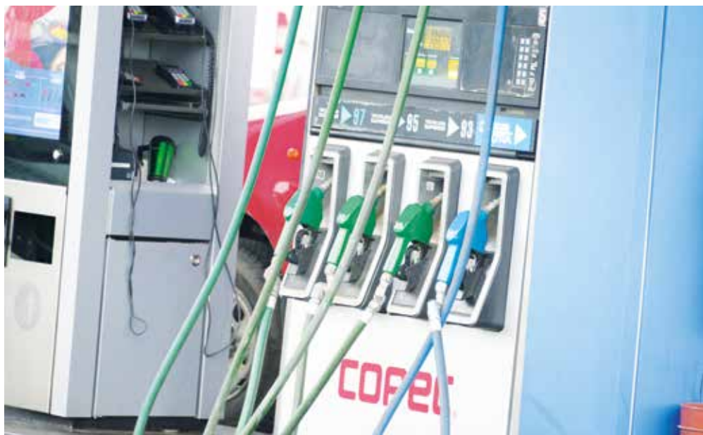
EL KEROSENE es el combustible que presentará la mayor variación de esta semana.

Finalmente, el diésel tendrá un valor de 503 pesos por litro.