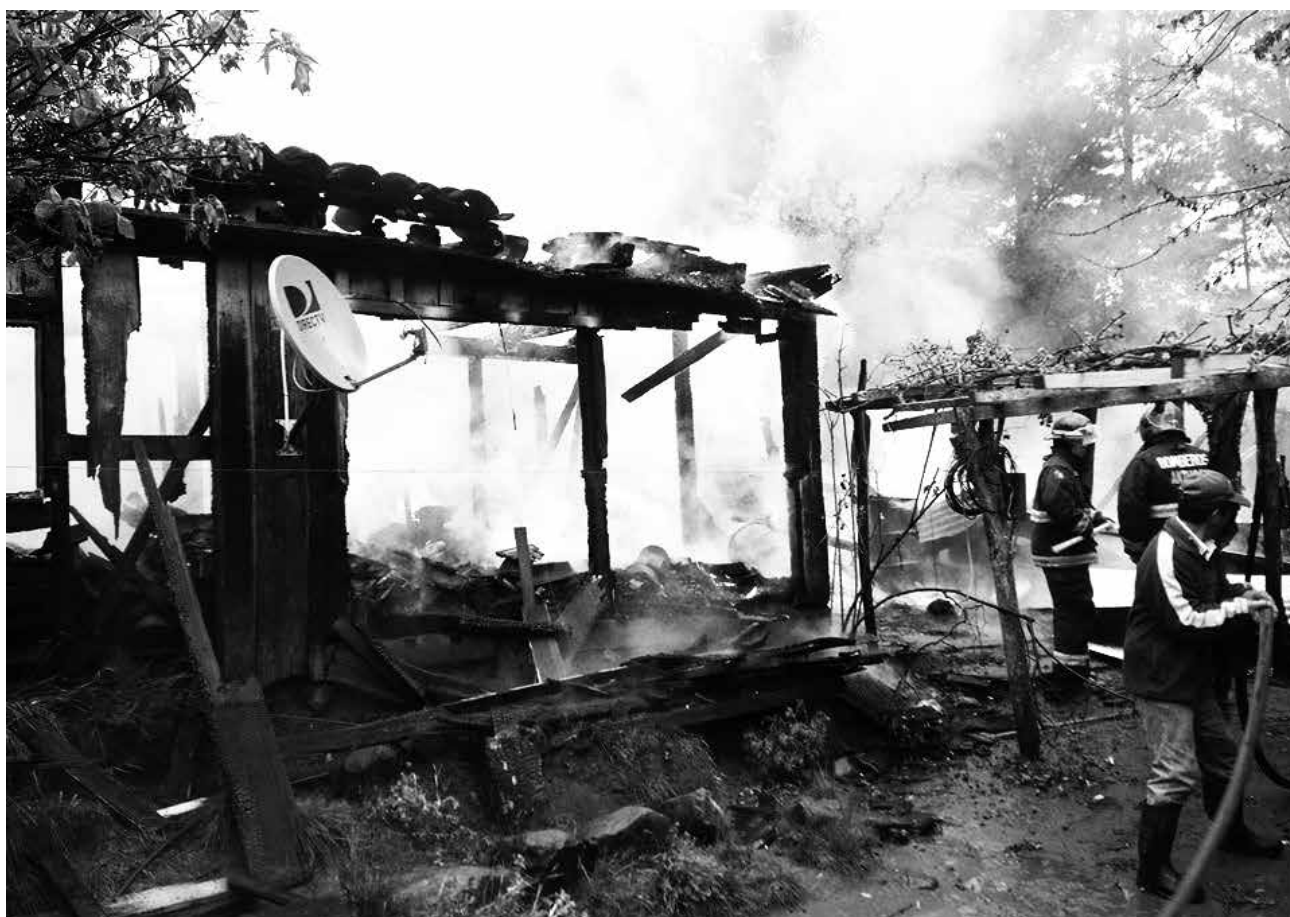
EL SINIESTRO afectó a una vivienda ubicada en el sector rural de la comuna de Antuco.

Ambas fueron albergadas en casa de familiares que residen en la misma comuna cordillerana.