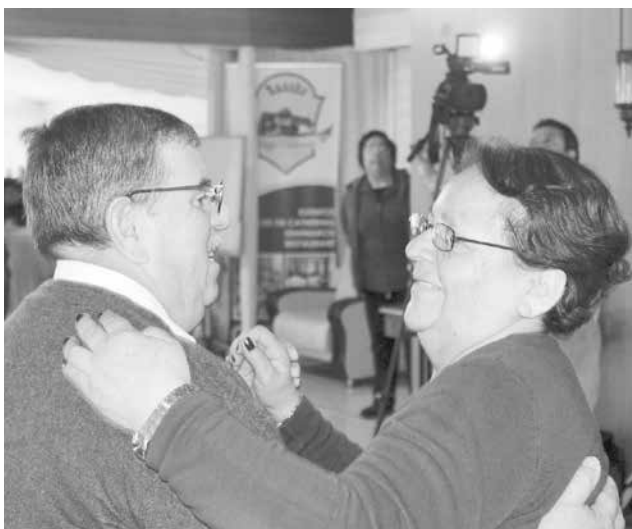
DE UNA TARDE RECREATIVA que no olvidarán disfrutaron más de 400 adultos mayores de Los Ángeles.

El Centro Integral del Adulto Mayor del municipio angelino "regaloneó" a sus integrantes con diversos espectáculos de magia, karaokes del recuerdo, charlas motivacionales, música y baile.