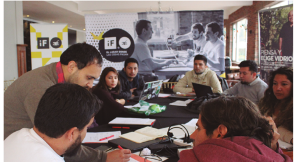
Jornada de Bootcamp previa a la gran final del Desafío Piensa y Elige Vidrio, donde los diez equipos semifinalistas recibieron acompañamiento del Centro de Emprendimiento de Inacap para mejorar sus modelos de negocio y realizar presentaciones más efectivas.

La forma adecuada de emprender en diversos entornos debe primero determinar qué prácticas emprendedoras aptas o "Premes", se requieren en cada escenario y cada etapa del proceso emprendedor y luego evaluar en qué nivel son capaces los