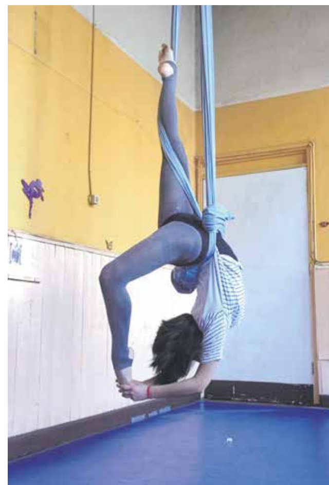
ACROBACIAS EN TELAS son parte de las destrezas practicadas.