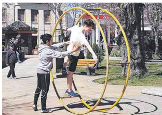
LA RUEDA ALEMANA es muy solicitada por los entusiastas inscritos en el centro cultural Espacio Arte Fusión.