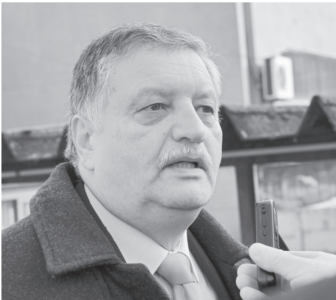
EL ALCALDE DE LOS ÁNGELES, señaló que la continuidad del profesional procesado en la Operación Huracán será evaluada en diciembre.

algunos concejales, al momento de conocerse la detención del profesional, habían solicitado prescindir de sus servicios, pero que en virtud de la ley a los ediles se les había expli-