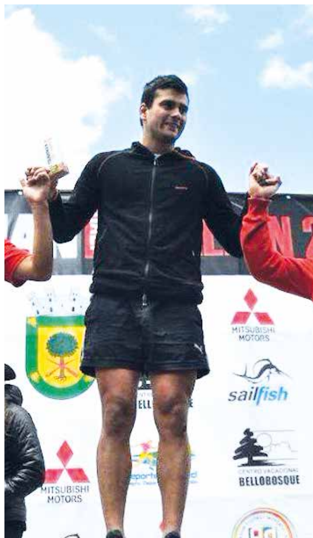
LOS DEPORTISTAS ANGELINOS hicieron un excelente papel en la comuna de Quillón.