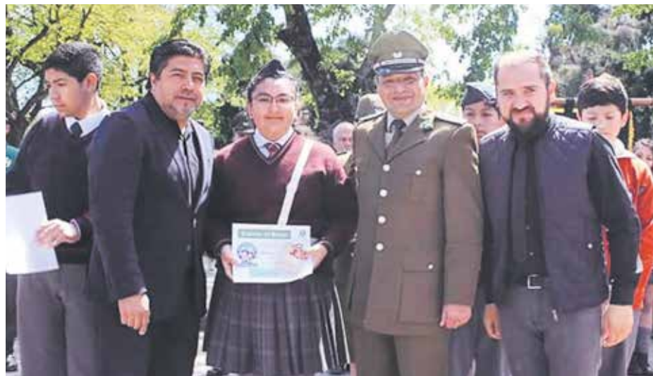
EL JURAMENTO SE REALIZÓ en la plaza de armas de la comuna del Bureo.

El oficial agregó que ésta permite que los monitores ayuden a prevenir distintos tipos de accidentes, asociados principalmente a temas de tránsito, ade-