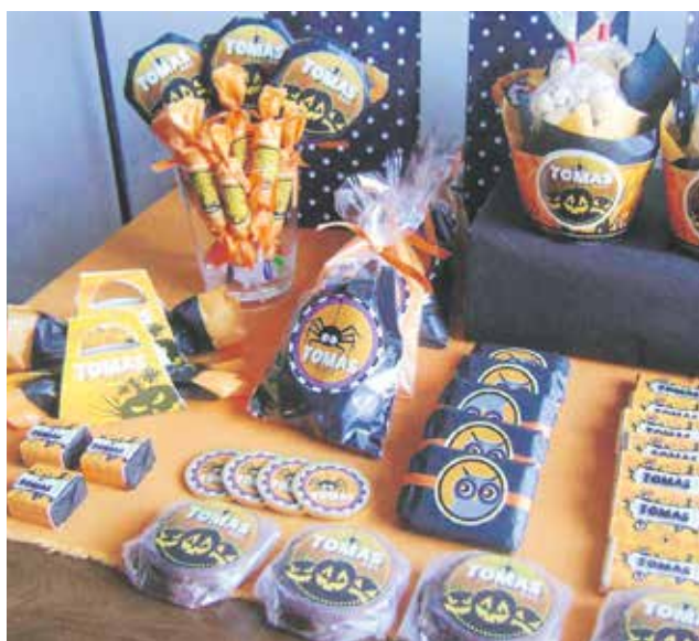
ES IMPORTANTE CONTAR con precauciones ante la alta ingesta de golosinas por parte de los niños en esta fecha.

“Lamentablemente muchas veces los padres subestiman la ingesta de calorías que se consumen en esta festividad. Por lo tanto, es recomendable reducir el consumo de azúcar otorgando alternativas saludables como brochetas y postres de frutas con formas atractivas alusivas a esta celebración. Una buena idea es cenar con los niños antes de salir a pedir golosinas, lo que permitiría tener mayor saciedad y así consumir menos dulces. Además es una buena idea aprovechar de salir a caminar en familia con la idea de realizar actividad física al momento de pedir “dulce o travesura”, destacó Salazar.