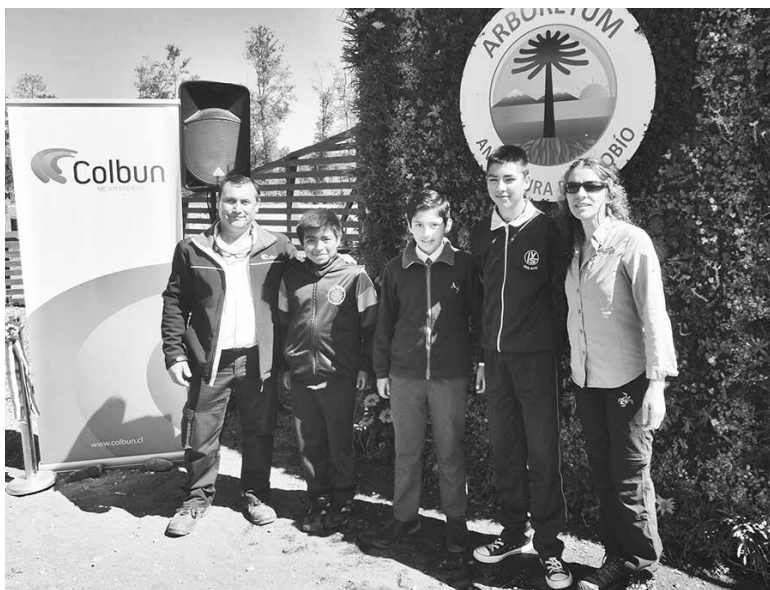
EN EL CENTRO botánico esperan que nuevo espacio contribuya a la conservación ecológica local y a la educación medioambiental.

Este jueves se inaugura oficialmente el Arboretum, un nuevo centro botánico del Parque Angostura con 4,2 hectáreas dedicadas a la conservación de la flora local y al cuidado del medioambiente, y que era uno de los compromisos adoptados por Colbún en la Resolución de Calificación Ambiental de su Central Hidroeléctrica Angostura. Con ello, el destino turístico desarrollado al alero de dicha central suma un nuevo atractivo.