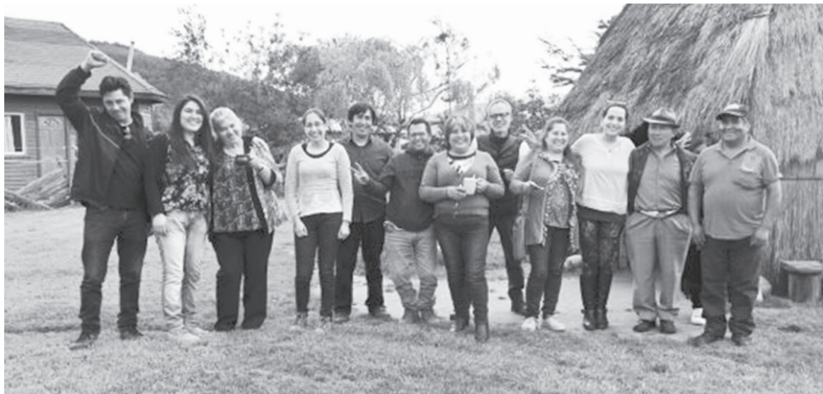
UN TOTAL DE 20 personas de las provincias de Biobío y Arauco participan del taller.

A los cursos, dictados por el destacado consultor internacional, el relator René Fisher, asisten empresarios de Nacimiento, Quilaco y Alto Biobío.