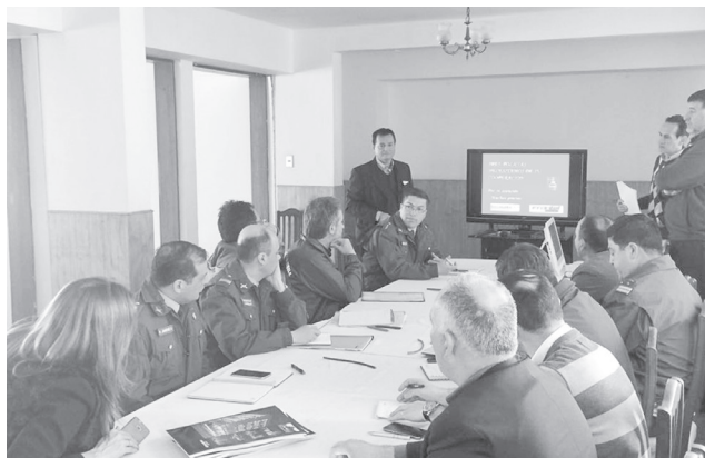
EL JUICIO por desacato está previsto que comience este lunes en dependencias del Tribunal Oral en lo Penal de Los Ángeles.

Esto contempla personas en actitudes sospechosas o vehículos desconocidos que se desplazan por el lugar donde habita ya que será necesario disponer de uno para transportar el alambre.