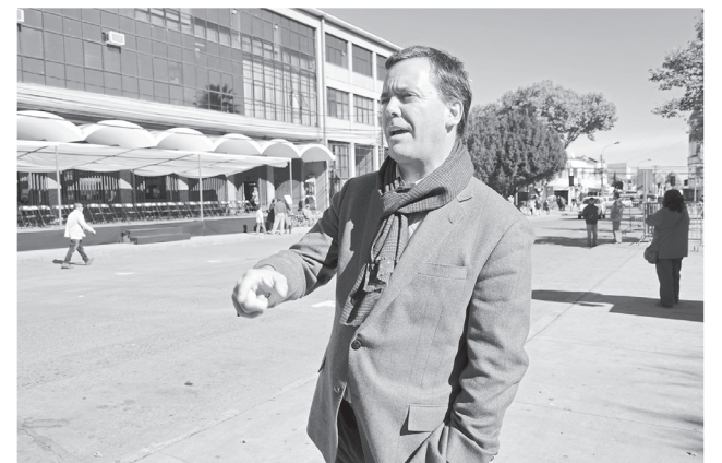
EL SENADOR HARBOE planteó que el ex presidente Piñera debería echar a quienes elaboraron su plan de infraestructura.