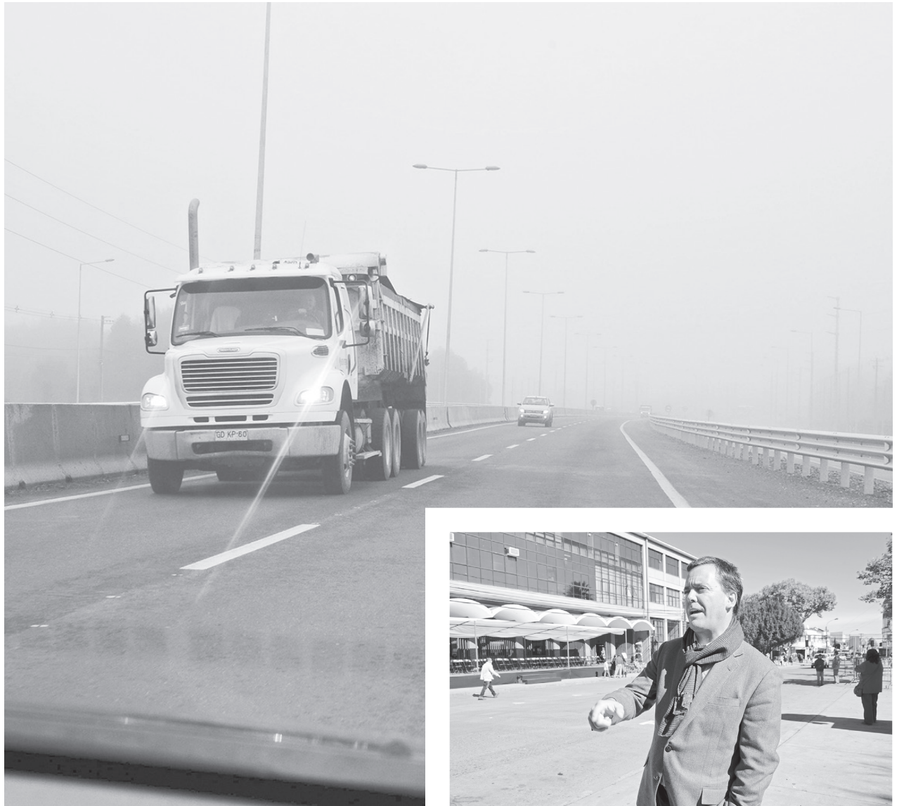
HARBOE DIJO que uno de los proyectos que aparece en el listado de proyectos es la ruta Concepción-Cabrero, la cual hace un año ya se encuentra operativa.

El programa de infraestructura fue presentado por el equipo de Sebastián Piñera este lunes 30 de octubre, producto del trabajo de veinte comisiones temáticas e incluye 745 medidas a realizarse durante 8 años, con un costo de U$14 mil millones.