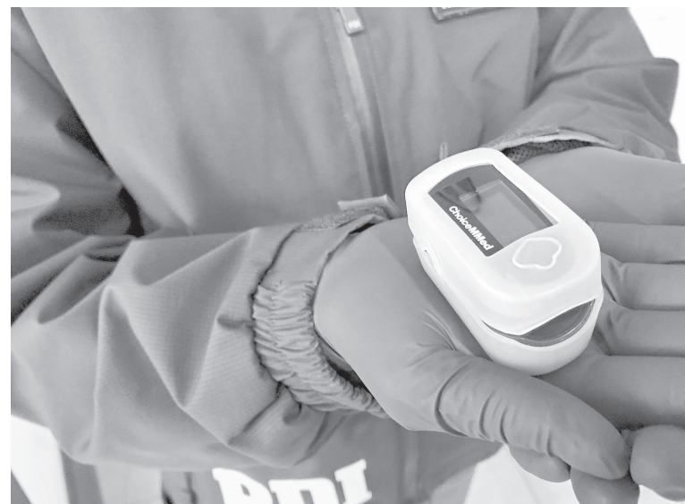
EL SATURÓMETRO recuperado fue avaluado en un monto cercano a los 50 mil pesos.

Por lo mismo, efectivos policiales le efectuaron un control de identidad