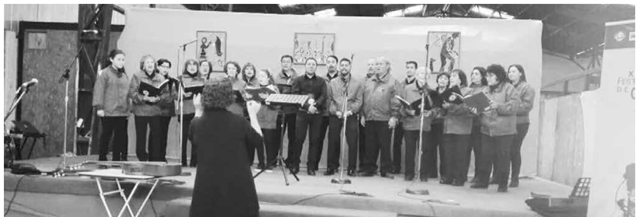
CORO DE ADULTOS de la Universidad de Santiago de Chile presentándose en la Vega techada. (Foto: Edith Cuevas).

fue una experiencia maravillosa para todos".