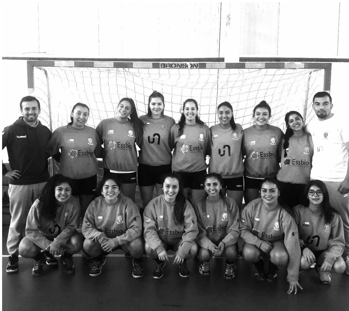
LAS JUGADORAS ahora se preparan para el nacional adulto que se llevará a cabo entre el 1 y 5 de noviembre.

El campeonato nacional de balonmano damas adulto se jugará esta semana entre el 1 al 5 de noviembre en el Centro de Entrenamiento Olímpico (CEO), ubicado en Ramón Cruz 1176, Ñuñoa Santiago y transmitido por el canal de la Liga en YouTube. El campeón representará a Chile en el Sudamericano de Clubes Femenino del año 2018.