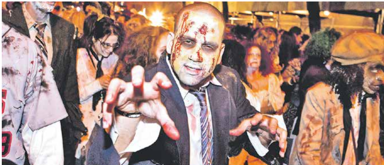
SERNAC ENTREGÓ RECOMENDACIONES a la hora de comprar máscaras y maquillajes y así no lamentar problemas de salud.

Este mismo 31, Club Urbanos ofrecerá una fiesta con entrada a 4 mil pesos y 2 mil para universitarios con TNE. Ellos anuncian sorpresas y regalos, además de un concurso donde elegirán el mejor