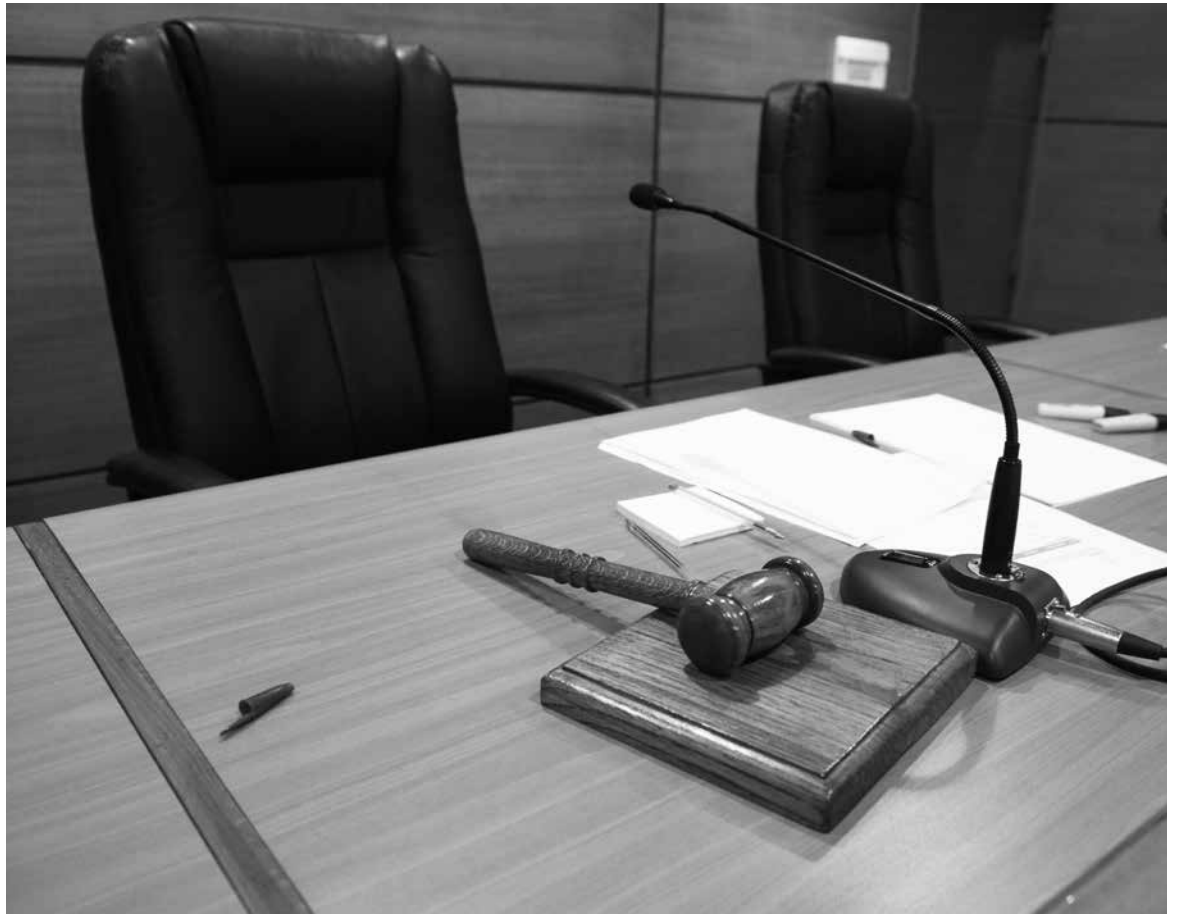
LA LECTURA DE SENTENCIA se conoció durante la tarde de este lunes en el Tribunal Oral en lo Penal de Los Ángeles.

A la condena impuesta por el tribunal se le abonará un año y cuatro días que permaneció privado de libertad al estar con las medidas cautelares de prisión preventiva e internación provisoria en un hospital psiquiátrico.