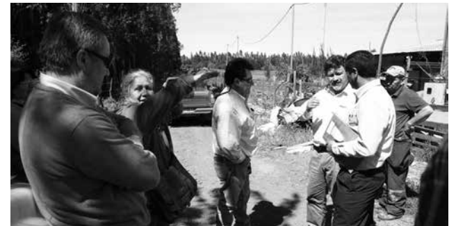
EN TERRENO la presidenta del comité y representantes del municipio y Coopelan lograron destrabar varios temas que tenían detenidas las obras.

Mediante documento facilitado por la dirigente, donde se establecieron una serie de acuerdos con las partes intervinientes en el proyecto, se menciona que Coopelan avanzará en un serie de obras necesarias para completar el proyecto, en distintos puntos donde se requieren ejecutar trabajos, como son la instalación de una subestación, la construcción de líneas interiores y la colocación de empalmes, entre otras labores, quedando a la espera de que el municipio local dé su visto bueno a “modificaciones propuestas para formalizar el reinicio de los trabajos”, según se lee.