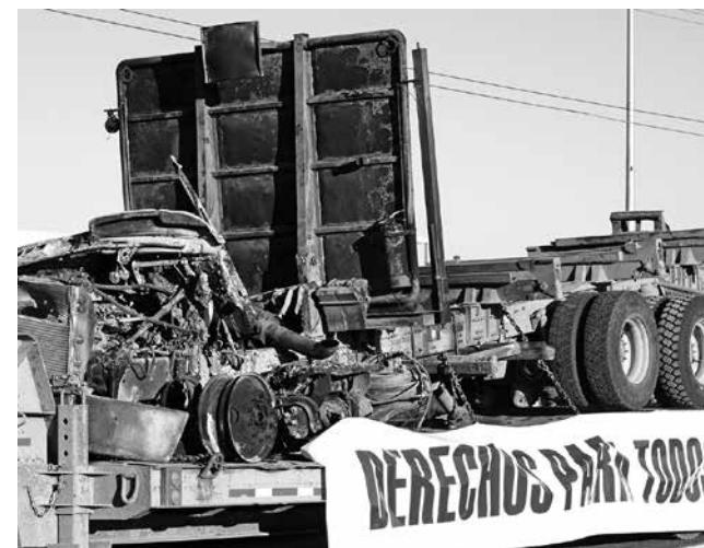
EMPRESARIOS Y TRABAJADORES recordaron lo que han hecho para pedir al gobierno que ponga mano dura en la llamada zona del conflicto Mapuche.

Archivos de prensa mencionan al ciudadano angelino detenido en el marco de la