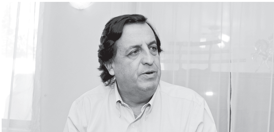
PÉREZ VARELA VALORÓ el trabajo de inteligencia realizado por las policías tras la detención de los comuneros.

vieron a caer, se debe aplicar todo el rigor de la ley y en eso esperamos que el gobierno respalde también todas las decisiones y acciones procesales