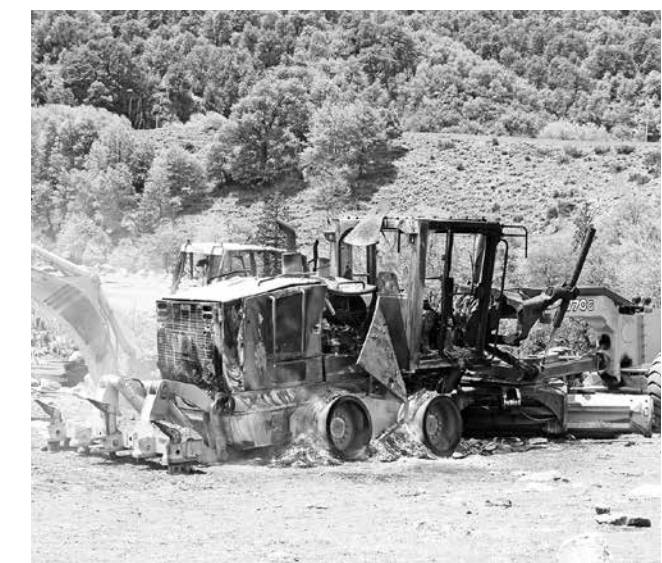
POR DELITOS DE QUEMA DE CAMIONES y otros atentados incendiarios fueron detenidos los 8 comuneros.

Al cierre de esta edición La Moneda, aún no realizaba declaraciones por la "Operación Huracán".