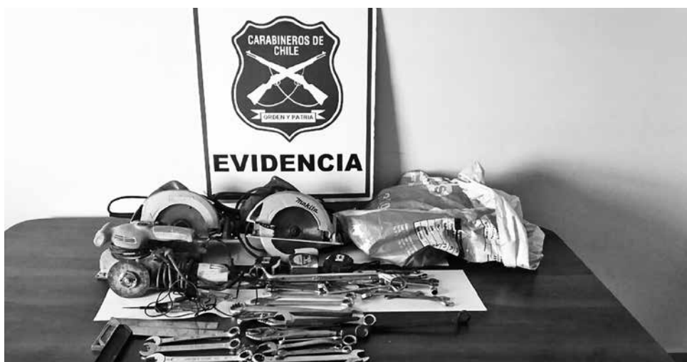
LAS HERRAMIENTAS RECUPERADAS en villa Génesis fueron avaluadas en un monto cercano a los 300 mil pesos.

Uno de ellos registraba 21 causas por delitos de receptación y violación de morada. Las tres últimas, por desacato, estaban vigentes.