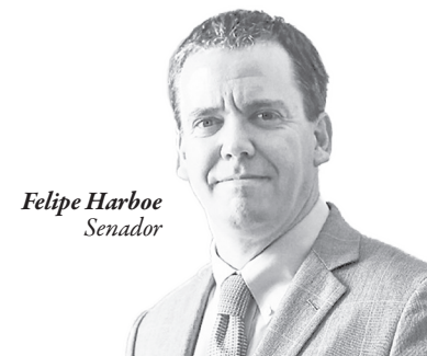
Felipe Harboe Senador

Sebastián Piñera dio a conocer su programa