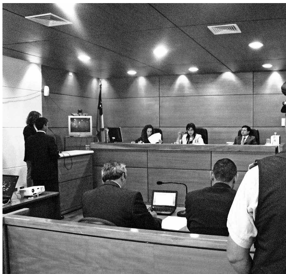
EL JUICIO SE REALIZÓ durante la jornada de este lunes en dependencias del Tribunal Oral en lo Penal de Los Ángeles. (Imagen de referencia)

El delito fue recalificado por los jueces y fueron declarados culpables por el ilícito de robo en lugar no habitado.