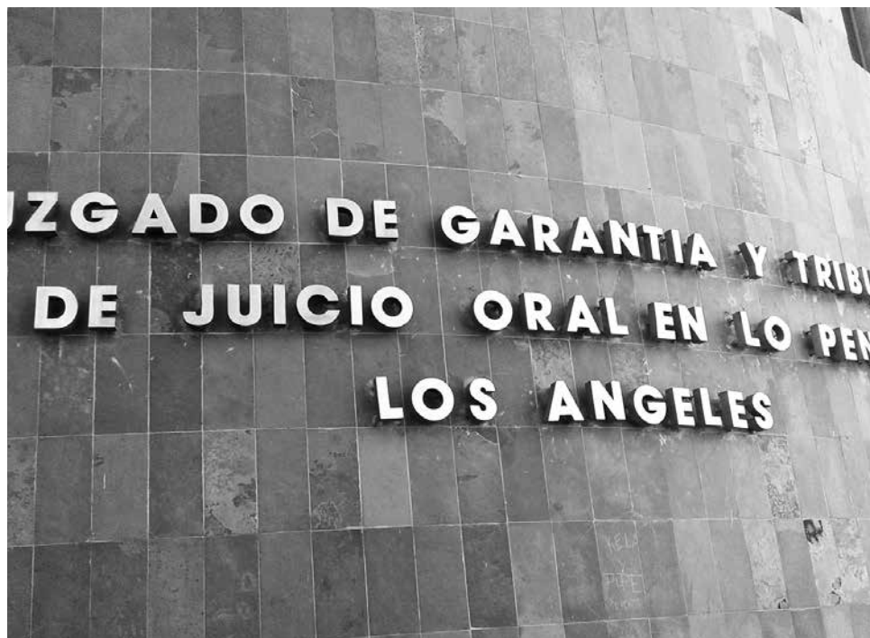
EL JUICIO EN CONTRA DE ESTOS DOS HOMBRES se espera que finalice durante la jornada de este martes.

parte de la Fiscalía Local y se espera que el juicio concluya durante este martes.