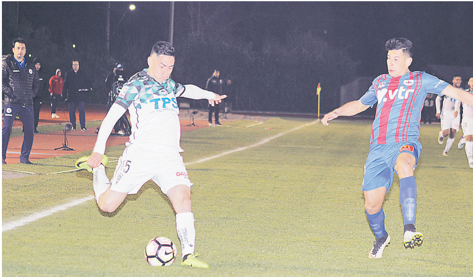
SANTIAGO WANDERERS E IBERIA se medirán este miércoles en la vuelta de los cuartos de final de la Copa Chile.