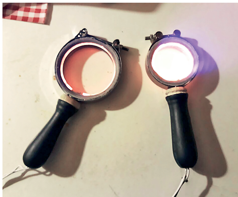
'ECO-GLASS' podría estar pronto disponible para el público, y su creador estima que su precio debería oscilar alrededor de los 20 mil pesos.