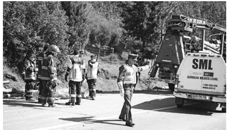
EL ACCIDENTE se registró a la altura del kilómetro 91 de la Ruta 156, en la comuna de Nacimiento.