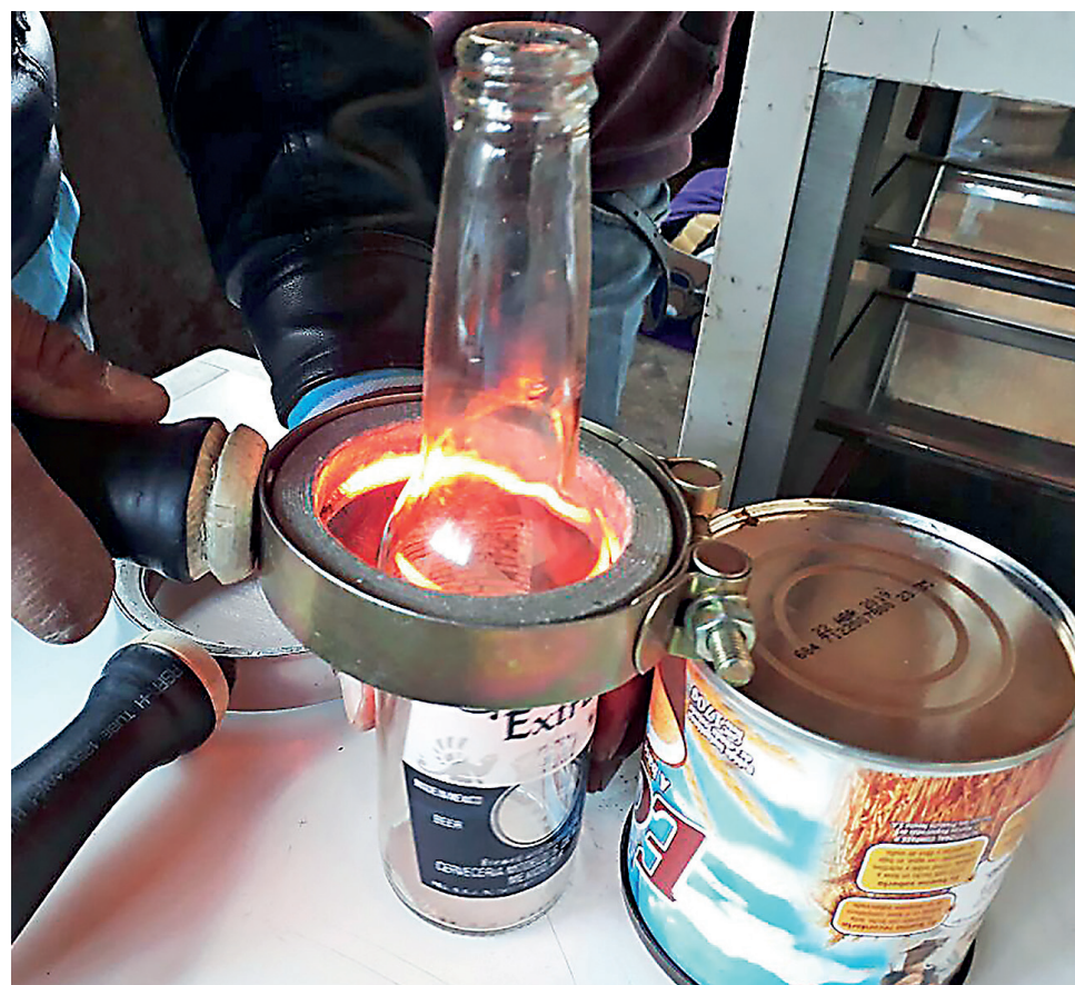
EL ARTEFACTO CREADO POR EL CONCEJAL, lo desarrolló por primera vez a los 13 años, y hoy es uno de los favoritos para ganar el concurso nacional 'Elige Vidrio' de Inacap.