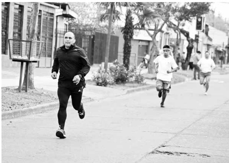
PESE A QUE LLEGARON más de 200 personas, no se pudo cumplir las expectativas de los organizadores.

La actividad era abierta a todo público, por lo que llegaron desde distintas partes de la ciudad, incluso alumnos y ex estudiantes del establecimiento.