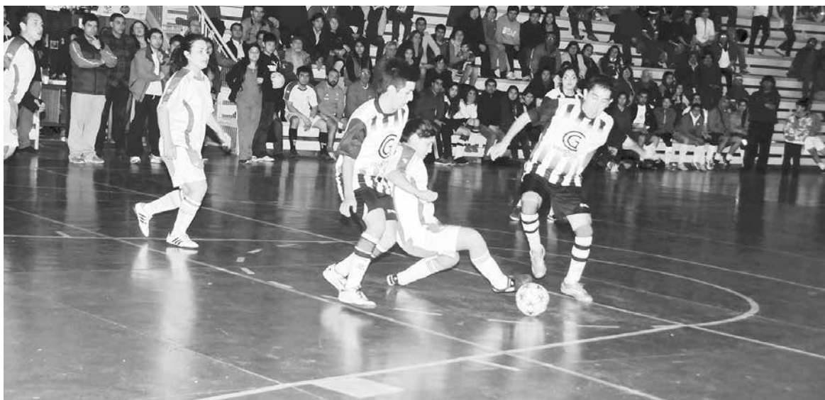
EN LA CANCHA sólo las mujeres pueden hacer goles.

Son ocho los equipos que participan en este certamen, los que se dividieron en dos grupos de cuatro elencos, jugando todos contra todos por grupos, pasando los mejores dos por zona a las semifinales del torneo. Así, este jueves se sabrá quiénes