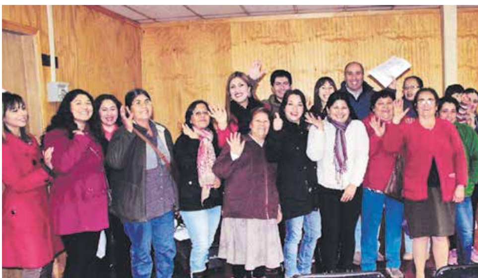
IMPORTANTES ARREGLOS y expansiones de sus viviendas podrán realizar más de medio centenar de familias en la comuna de Nacimiento.

20 familias de la villa René Hemmelmann podrán optar a 9,25 metros cuadrados de ampliación en primer piso, mientras que 31 familias de villa Los Jardines tendrán una ampliación de 16,75 metros cuadrados en un segundo piso.