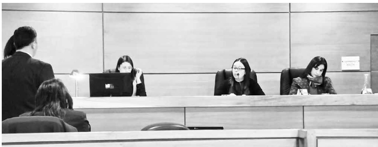
LA FISCALÍA REQUIERE se le imponga al acusado la pena de ocho años de presidio mayor en su grado mínimo. (Imagen de archivo)

El delincuente ingresó a un inmueble de Los Ángeles, siendo sorprendido por los propietarios. Se dio a la fuga del lugar con las especies en su poder.