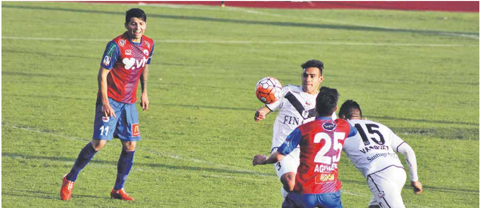
IBERIA NO PUDO romper el cero y suma 7 puntos en la tabla de colocaciones.