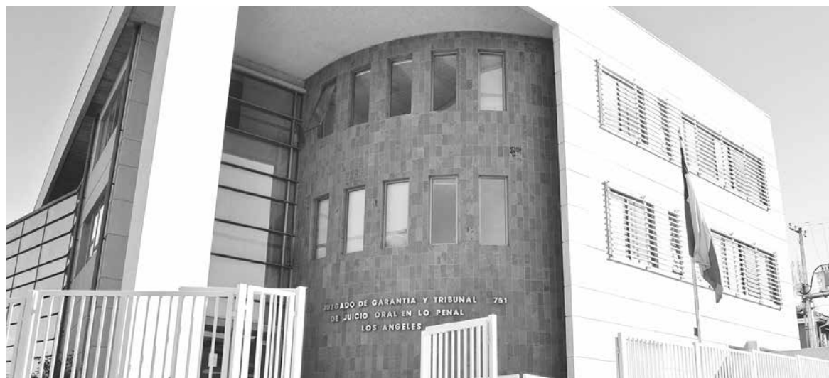
LOS IMPUTADOS fueron sorprendidos el pasado abril en nacimiento portando un arma y municiones y su juicio se efectuará en el Tribunal Oral en lo penal de Los Ángeles.

Ambos sujetos fueron sorprendidos en abril portando una escopeta y municiones sin autorización ni inscripción en la comuna de Nacimiento.