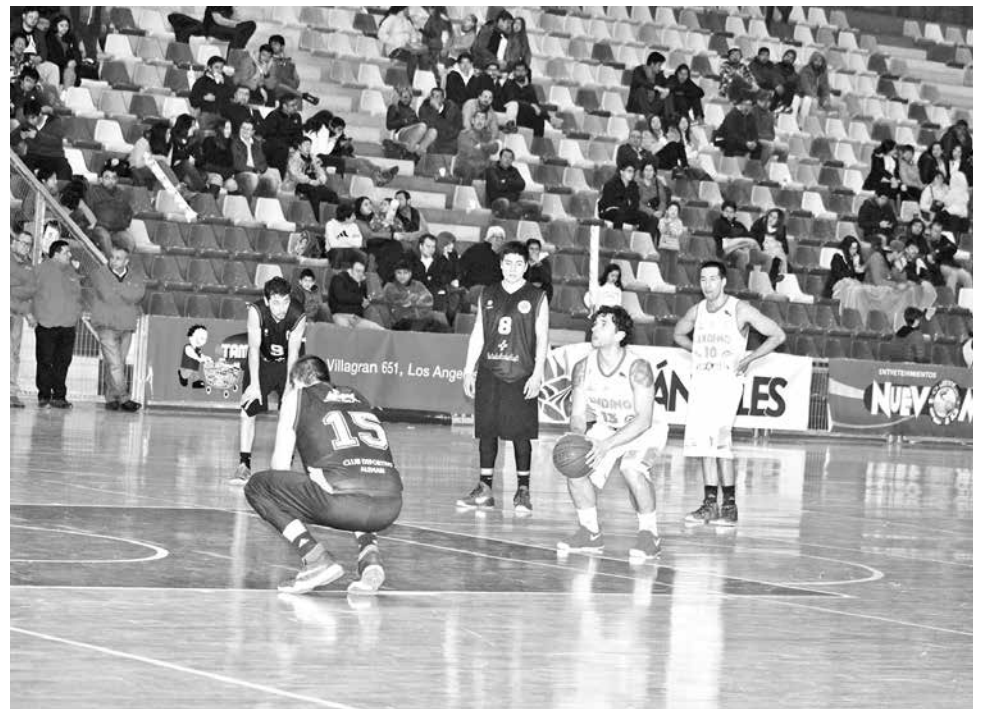
PESE A LA BUENA primera mitad de partido, Andino no pudo contra el Club Deportivo Alemán al caer por 58 a 77

Así se hizo notar desde el plantel y el entrenador.