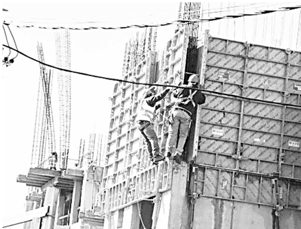
EL COMPORTAMIENTO interanual negativo que exhibió la actividad económica regional fue liderado por los sectores construcción, agropecuario y minería.

papel y cartón, Elaboración y conservación de pescado y productos de pescado y Elaboración de alimentos preparados para animales fueron las principales actividades que influyeron en la evolución de la industria regional. En tanto, Comercio, Restaurantes y Hoteles registró incidencia positiva, por aumento en la actividad del subsector Comercio, dinámica favorable explicada por el