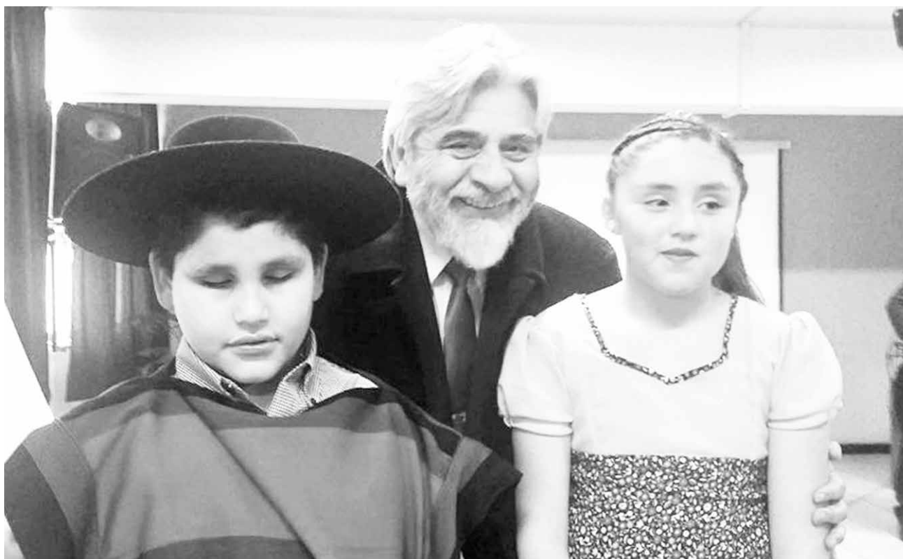
LA INICIATIVA impulsada por el diputado independiente por el distrito 47 irá en ayuda de las organizaciones angelinas CEMIVI y AMILIVI.

Fue así como el parlamentario gestionó esta demanda e inició las gestiones en San-