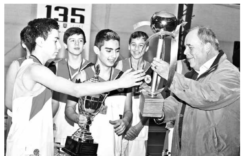
PUERTO MONTT GANÓ la final adjudicándose el campeonato y llevándose la copa.

Vejar, también destacó que "nosotros estamos participando con