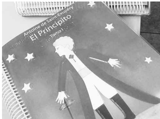
MOBY DICK, DRÁCULA, El Principito, Romeo y Julieta, 20 mil leguas de viaje submarino, entre otros, son parte de los nuevos títulos en braille que llegaron a Los Ángeles.

tiago, pero descubrió que no hay disponibilidad de textos con dichas características, por lo que debió solicitarlos a México. Luego y aunque hubo inconvenientes para su ingreso a Chile, los 95 ejemplares fueron puestos a disposición de dos entidades angelinas que sabrán sacar provecho de ellos.