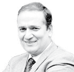
Rodrigo Díaz Wörner Intendente Región del Biobío

a guías pehuenches en materia turística; el Corto Laja; y mucho más. Y eso se hace coordinando a todos los actores, superando lo que era la tradición de estar trabajando solo provincia a provincia, sino que mostrar un paquete completo de oferta turística y mejorarla a lo largo de toda la Región.