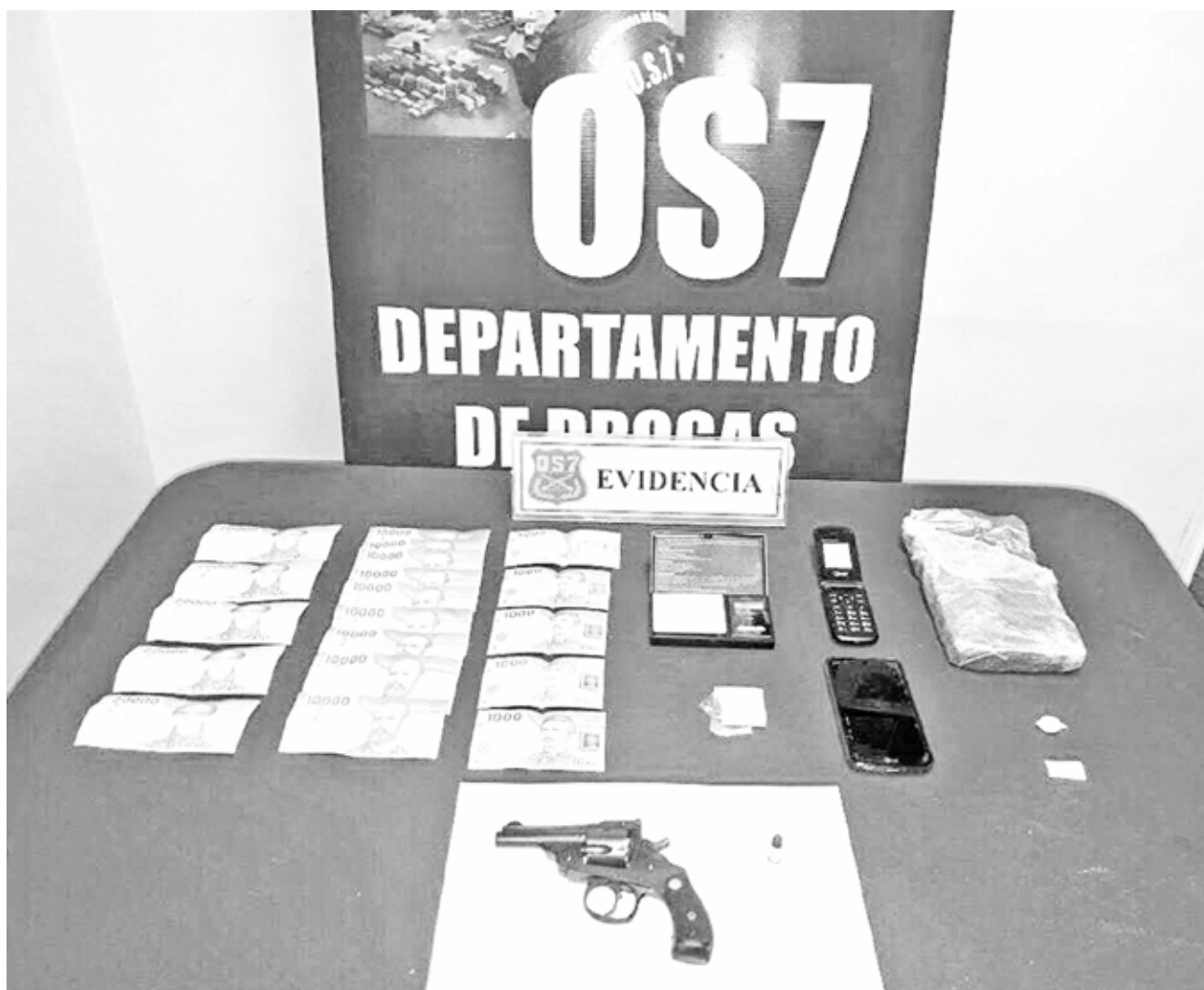
EN PLENO CENTRO de la ciudad de Los Ángeles se traficaba cocaína en un negocio de compra y venta de autos.

A raíz de estos descubrimientos, el hombre fue formalizado por el tribunal