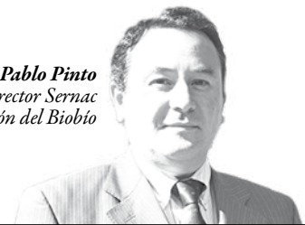
Juan Pablo Pinto Director Sernac Región del Biobío

la relación de consumo, desde la publicidad, promoción, oferta y cotización del crédito, así como durante su vigencia y al término del mismo, como también respecto de la prestación de otros productos y servicios asociados.