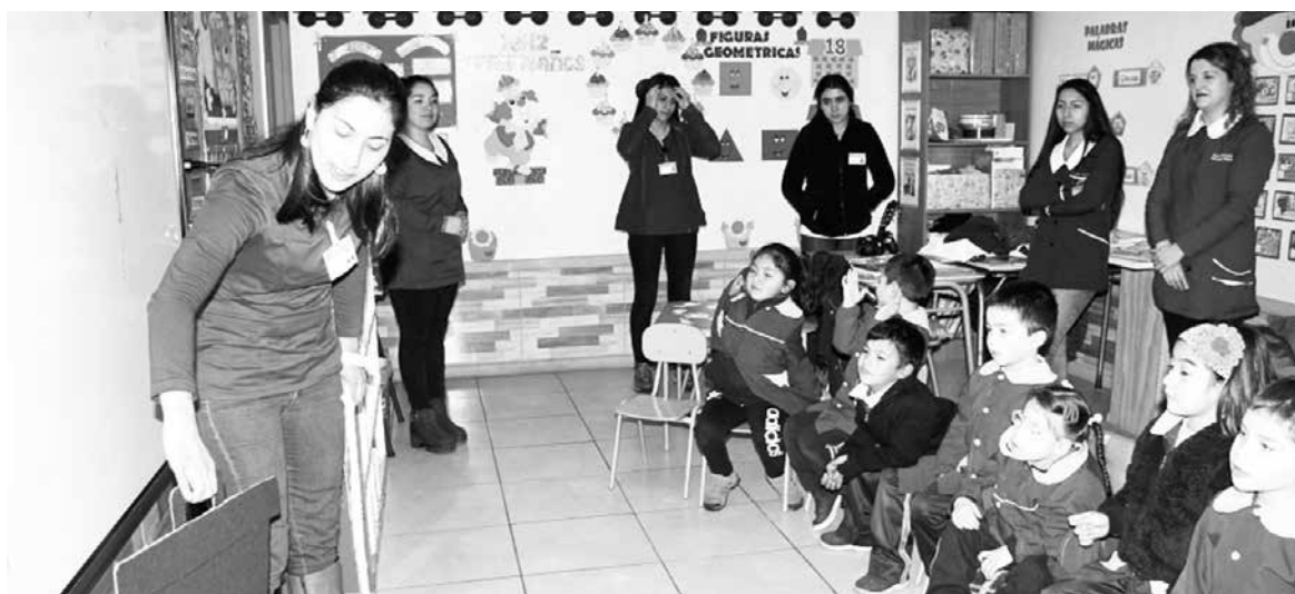
EL PROYECTO INCLUYE sesiones de nutrición “lúdicas” para que los niños asimilen la importancia de la alimentación saludable.

La iniciativa considera, en esta oportunidad, la intervención de 16 cursos preescolares –de 8 establecimientos educacionales del área de influencia del centro de salud-, beneficiando así a unos 400 menores.