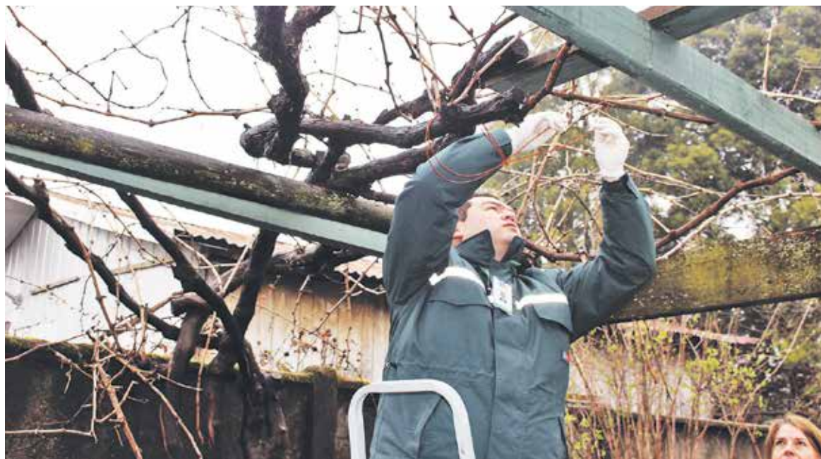
FUNCIONARIOS de SAG instalarán gratuitamente dispositivos para evitar reproducción de polilla que ataca especialmente a las uvas.