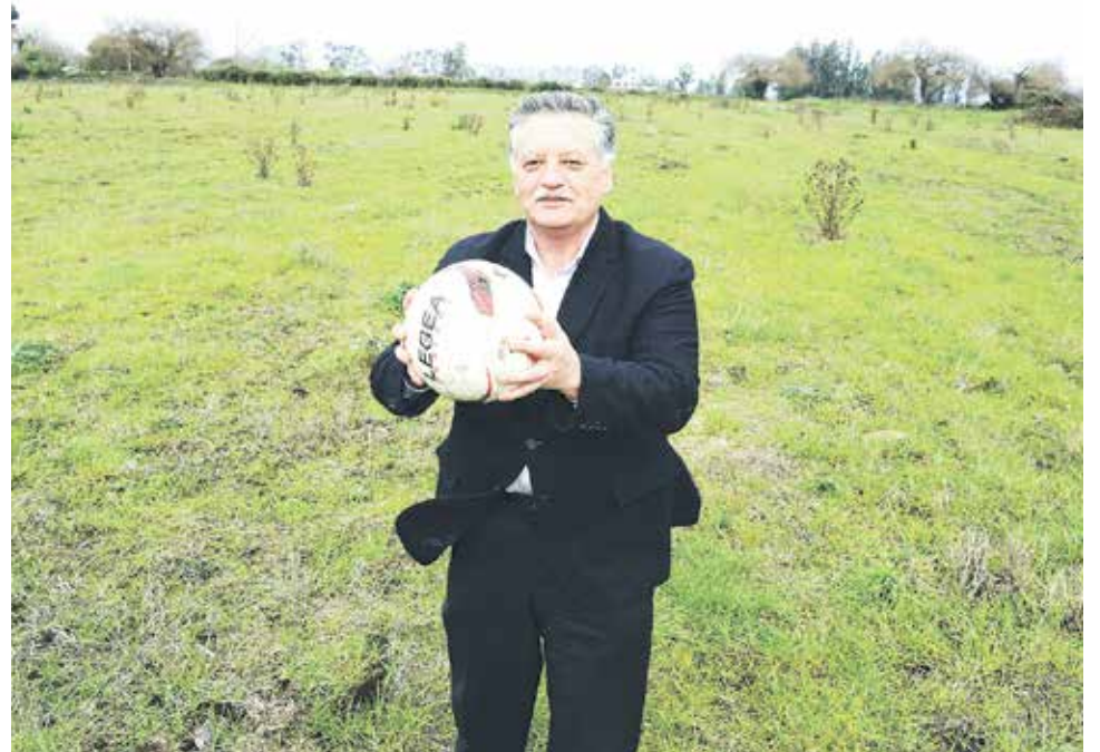
EL NUEVO ESTADIO de Los Ángeles podría comenzar a construirse el 2018 y albergará diferentes espectáculos artísticos, así como partidos oficiales de campeonatos internacionales.

Asimismo, hace algunas semanas el gobernador de la provincia de Biobío, Luis Barceló, aseguró que la promesa del estadio se cumpliría, anunciando que definitivamente este proyecto, “va en pie firme”.