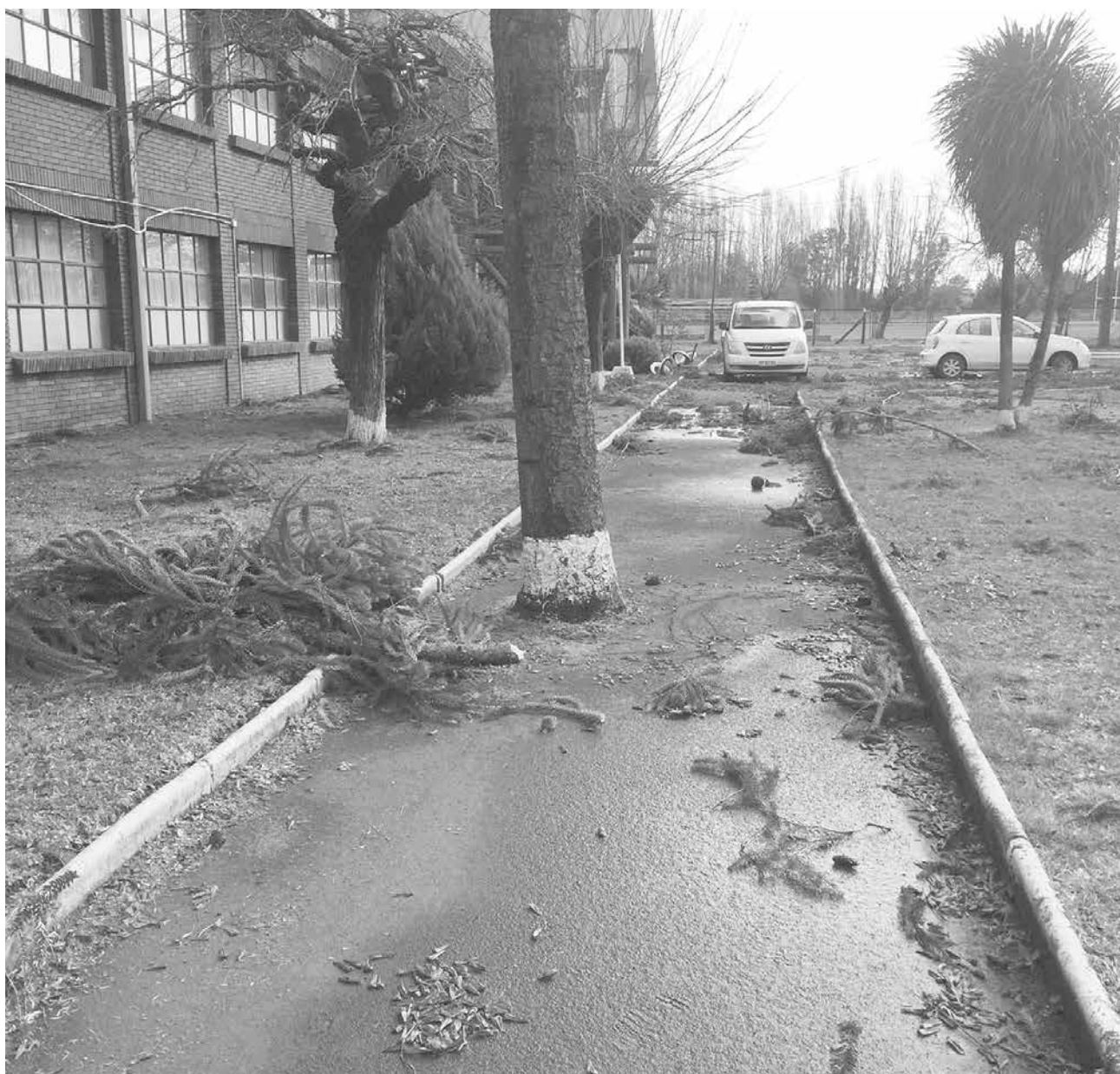
EL LICEO LLANO BLANCO la semana pasada vio interrumpido el suministro de luz.

Asimismo, la directora comunal agregó que debido al pronóstico del tiempo, durante toda la semana se estarán monitoreando los distintos establecimientos municipales para informar oportunamente a las comunidades escolares y atender las emergencias, especialmente de infraestructura y suministros de electricidad y de agua.