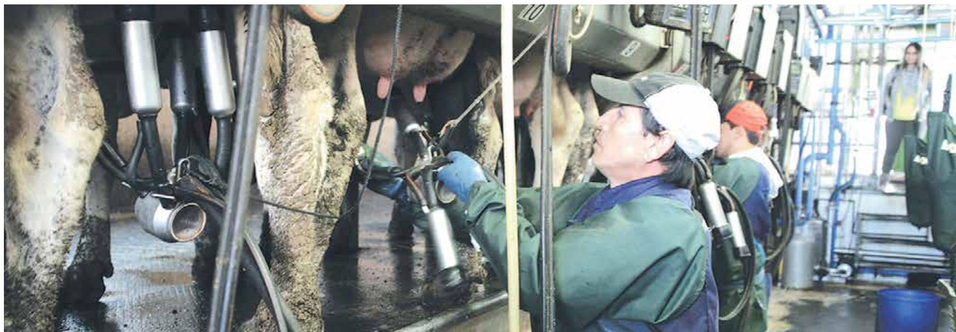
LAS ACCIONES QUE SE HAN REALIZADO por el gremio fueron parte de los planteamientos en la cita lechera que contó con la asistencia de Fedeleche.

En el marco de la Asamblea Anual de Socios, los participantes abordaron actualidad y perspectivas del sector.