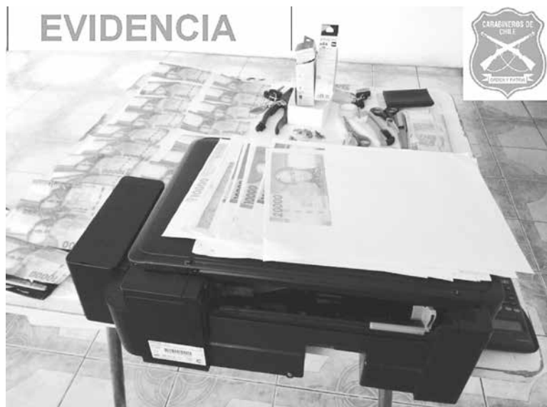
UN TOTAL DE 37 BILLETES FALSOS, además de impresoras y tintas están dentro de las especies incautadas por Carabineros.

Un control vehicular permitió dar con el vehículo en la ruta de ingreso a Yumbel, donde fueron fiscalizados y detenidos por carabineros, tras pagar el peaje y comprar en un negocio.