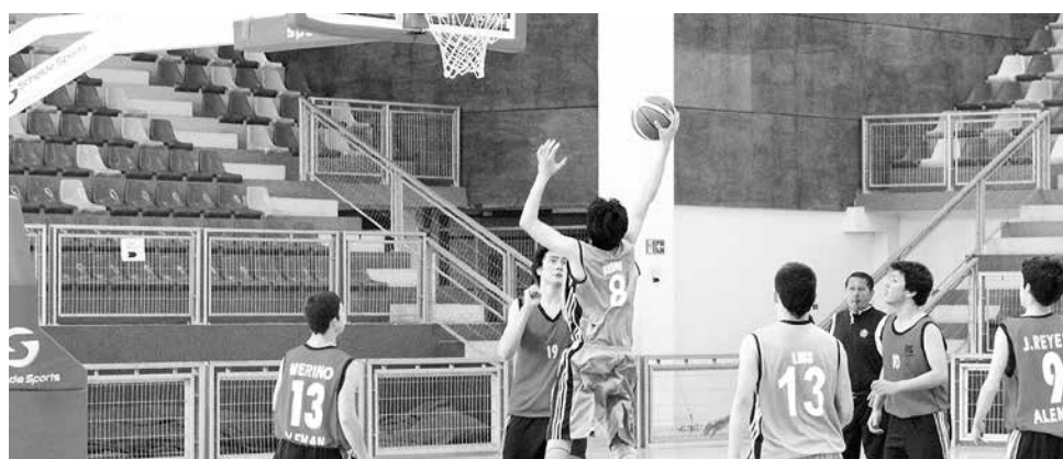
EL TENISMESISTA se adjudicó un vicecampeonato nacional en la capital de Chile, cuando ya se prepara para otra gran competencia en Chillán el próximo fin de semana.

Los encuentros se efectuarán en el gimnasio del Colegio Alemán y el Polideportivo de la capital provincial.