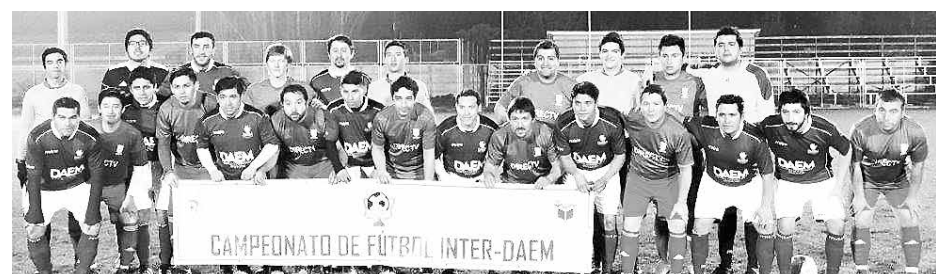
EN LOS ÁNGELES se jugará la tercera fecha del campeonato que definirá a los dos finalistas que lucharán por quedarse con la copa en la última jornada en Cabrero.

Este 23 de agosto se realizará una de las fechas de este torneo que congrega además a las direcciones municipales de educación de Yumbel y Tucapel.