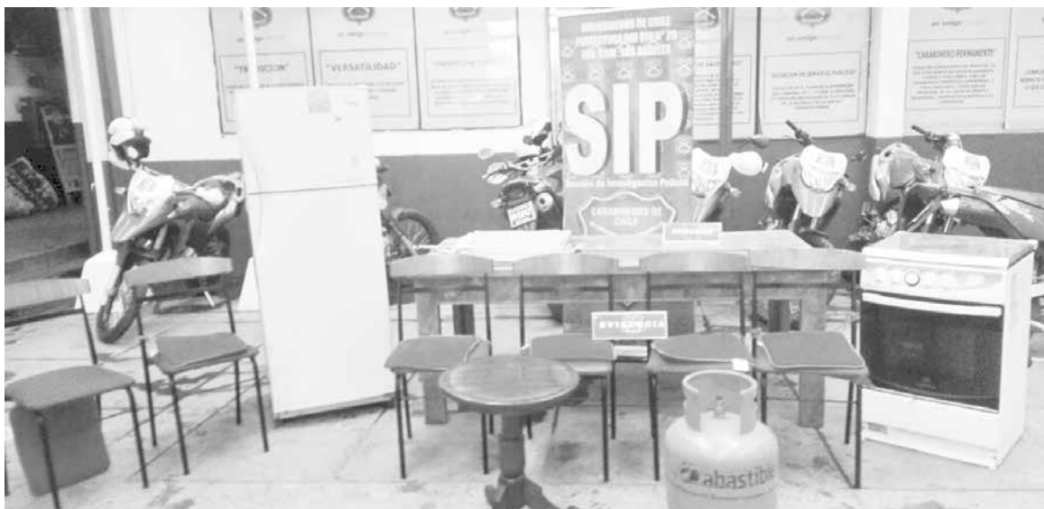
LAS ESPECIES RECUPERADAS fueron valuadas en un monto cercano al millón 500 mil pesos.

Dos de los tres detenidos habrían sido vistos trasladando especies a bordo de un camión hasta el domi-