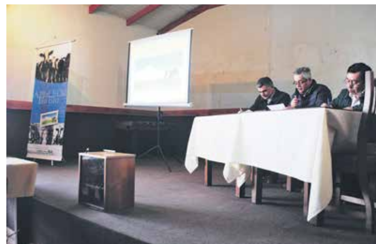
LOS PRODUCTORES se reunieron en Los Ángeles en el marco de la Asamblea Anual del rubro.