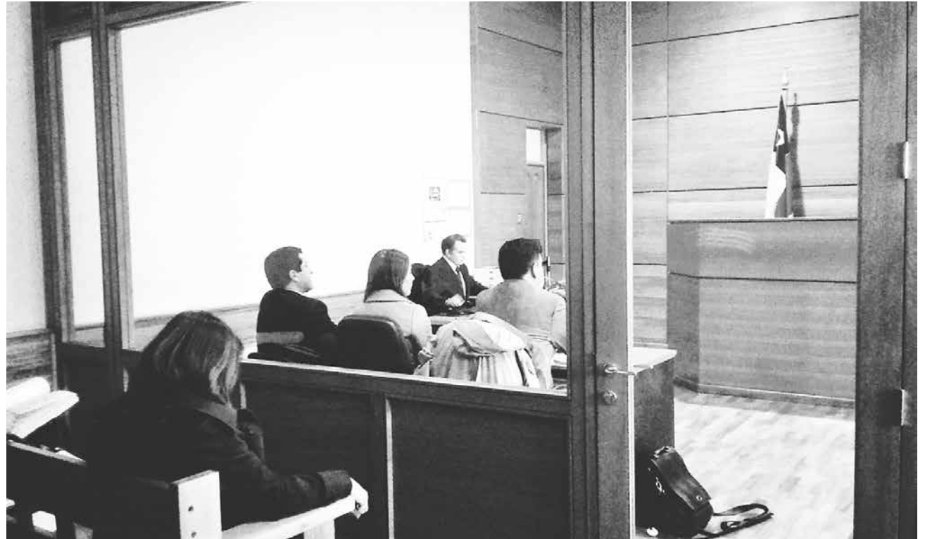
LA JORNADA DE ESTE MARTES, en el Juzgado de Letras y Garantía de Cabrero, se desarrolló la audiencia exploratoria de salida alternativa.

Esta última, aseguró que la Fiscalía Local la ha ofrecido y la ha solicitado en cientos de casos. “Nosotros pedimos