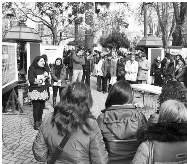
ESTE LUNES, el Tribunal Constitucional comunicó el rechazo de dos requerimientos presentados por inconstitucionalidad.

Asimismo, recalcó el trabajo encabezado por la ministra Pascual en un proceso de más de 2 años en que se debatió ampliamente en ambas Cámaras, se escuchó todas las posturas y se trabajó para que el proyecto se dé en un marco de constitucionalidad que es lo que finalmente se ha confirmado.