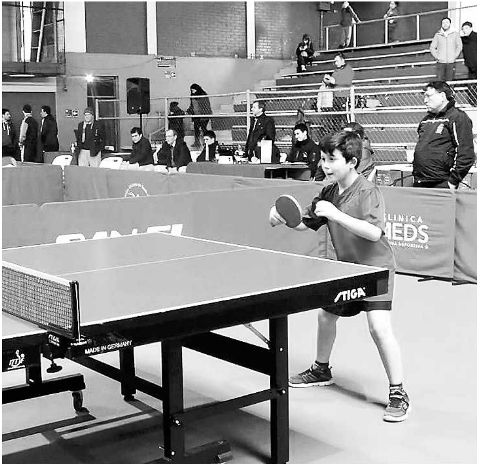
EL TENISMESISTA se adjudicó un vicecampeonato nacional en la capital de Chile, cuando ya se prepara para otra gran competencia en Chillán el próximo fin de semana.

El jugador de tan sólo 9 años ya ha alcanzado grandes triunfos Los Ángeles tanto a nivel nacional como regional, siendo una de las proyecciones chilenas del tenis de mesa, por su forma de juego y técnica.