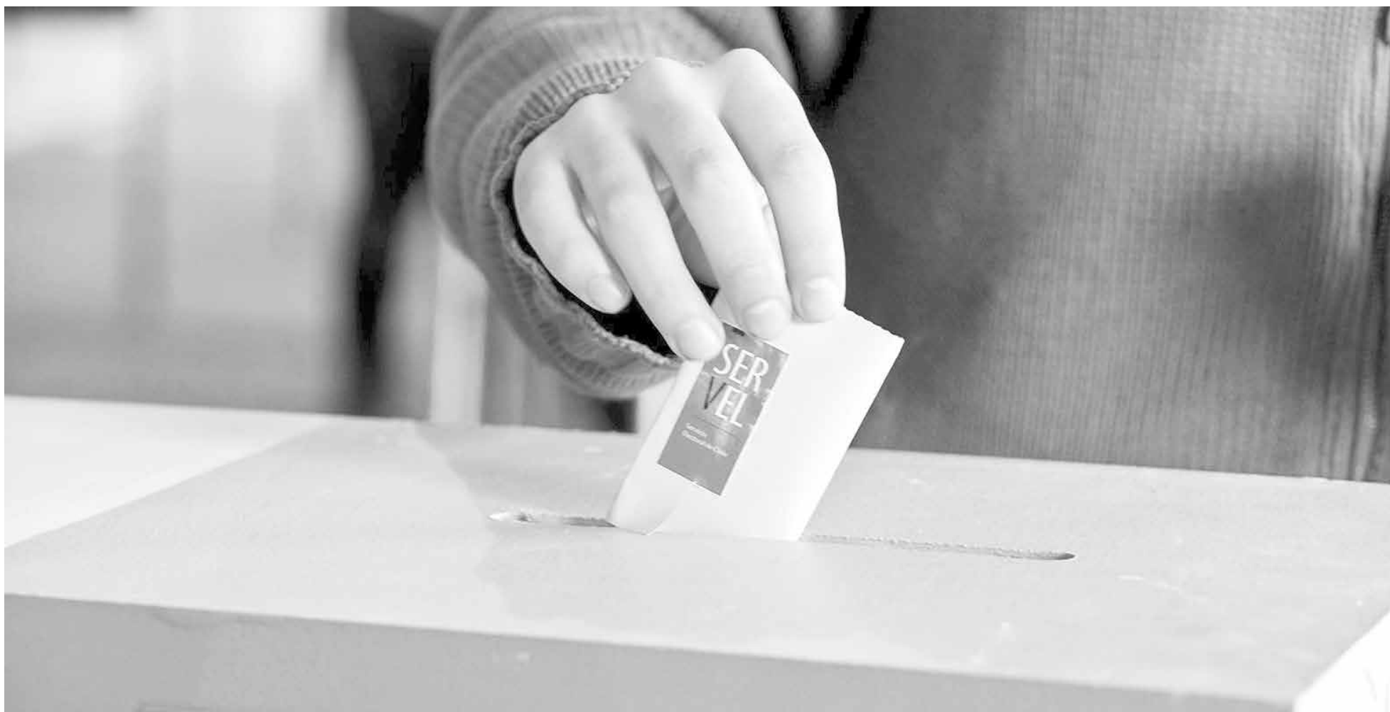
A PARTIR DE LUNES corren diez días para la declaración de aceptación o rechazo de la candidatura.

Candidatos primerizos y desconocidos para los habitantes de la Provincia figuran entre los inscritos este lunes ante el Servel, apareciendo nombres provenientes de la comuna de Lota y la provincia de Arauco.