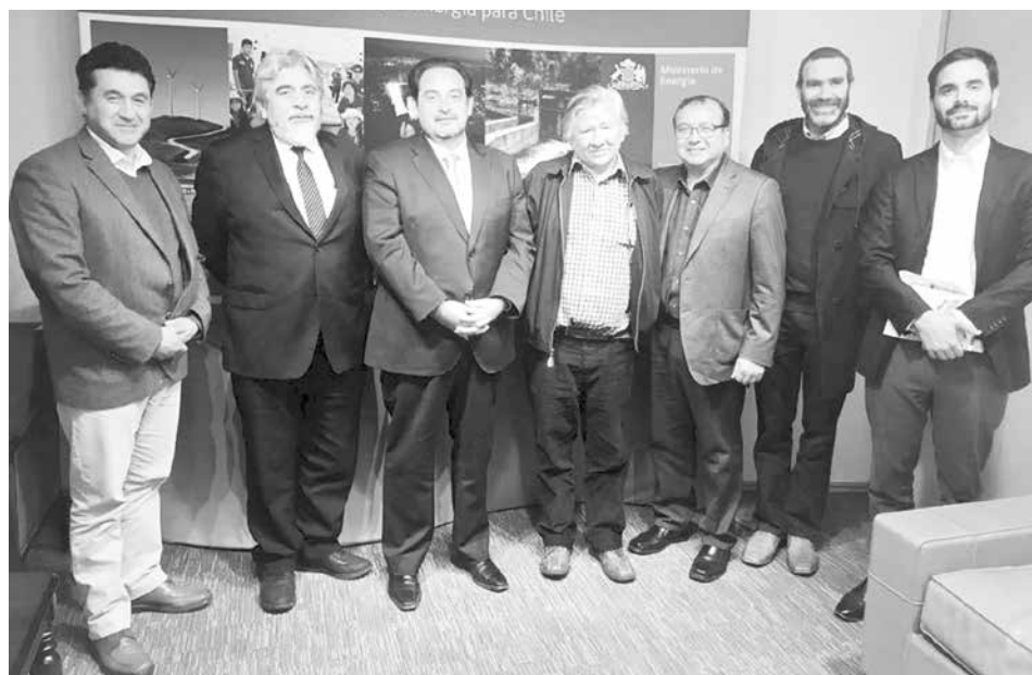
EL DIPUTADO POBLETE junto a vecinos de Santa Bárbara tras el término de la reunión que sostuvieron con el ministro de Energía.

El diputado Roberto Poblete gestionó la venida del secretario de Estado, luego de reunirse con él en Santiago acompañado por vecinos de la comuna cordillerana.