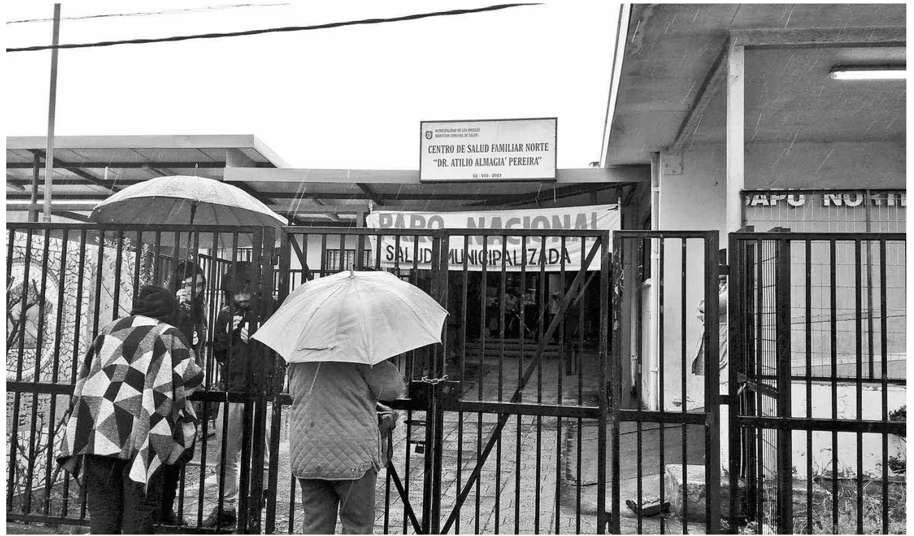
LAS CONSTANTES AGRESIONES al personal en distintos servicios de atención es la causa que ha motivado la movilización.

Del mismo modo, los turnos éticos, con atención