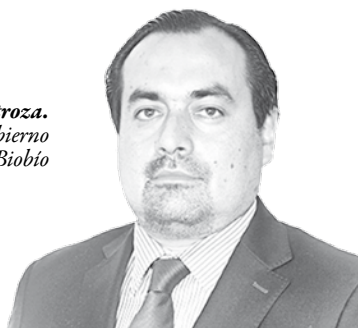
Enrique Inostroza. Seremi Gobierno Región Biobío

Luego del rechazo del Tribunal Constitucional a los requerimientos presentados en contra de la Ley que despenaliza la interrupción voluntaria del embarazo en tres causales, la iniciativa que ya fue aprobada en el Congreso está en condiciones de promulgarse como Ley.