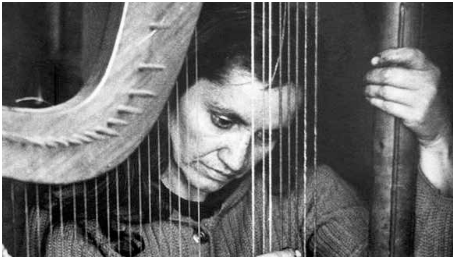
VIOLETA PARRA NACIÓ el 24 de octubre de 1917.