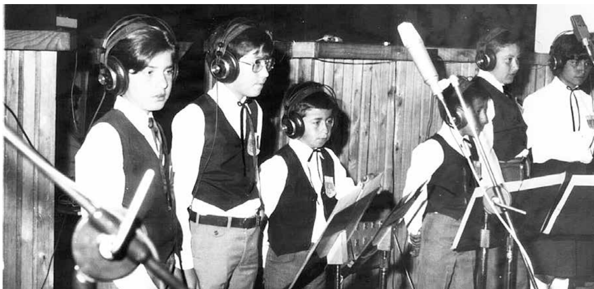
1984: Grabación Lysistrata.

En su cumpleaños número 40 de fructífera labor y para rendirles un justo homenaje, La Federación Nacional de Coros – Fedecor - y la Agrupación Social y Cultural Santa María de Los Ángeles - ASCLA – ha organizado el XXIII Festival Nacional de Coros de Chile, que tendrá lugar los días 27, 28 y 29 de octubre próximo.