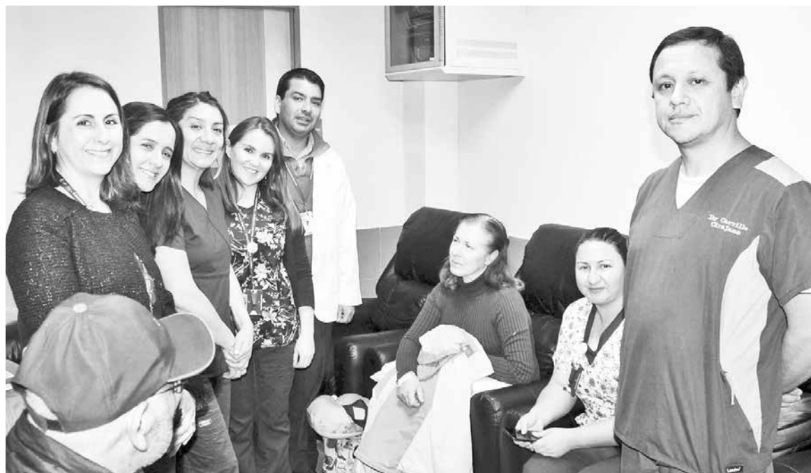
ESTO SE ENMARCA dentro de las estrategias que está realizando la Dirección del Complejo Asistencial para optimizar el recurso cama.