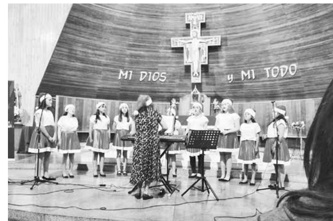
2016: Villancicos, Parroquia San Francisco.