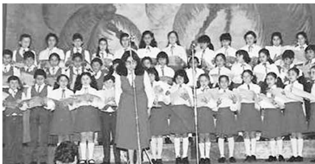
1980: Casa de la Cultura.