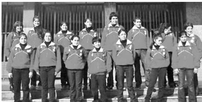
2009: Osorno. Frente Edificios Públicos.