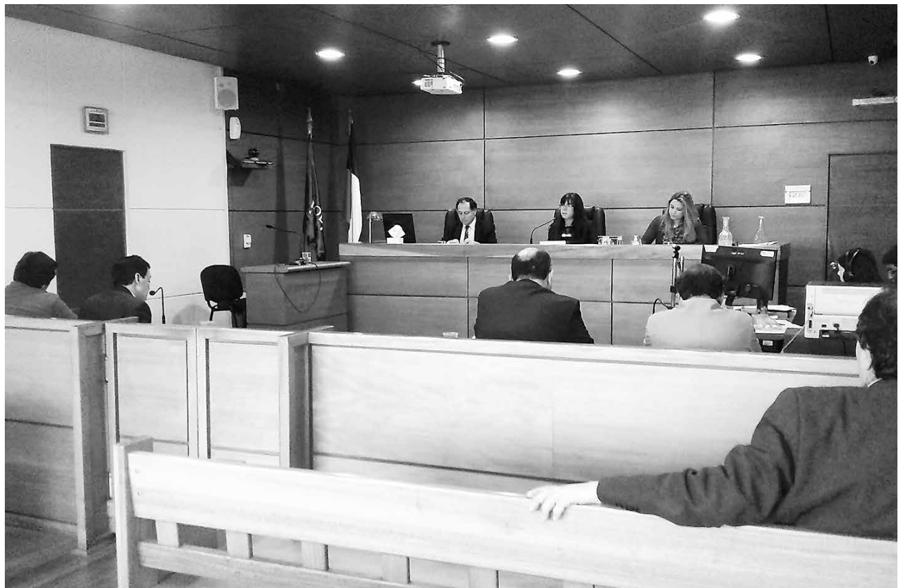
EL JUICIO EN CONTRA del hombre se realizó durante la jornada de este lunes en el Tribunal Oral en lo Penal de Los Ángeles.

Tras fiscalizarlo, Carabineros le habría encontrado un cartucho calibre 16 al interior del vehículo sin la debida autorización para ello.