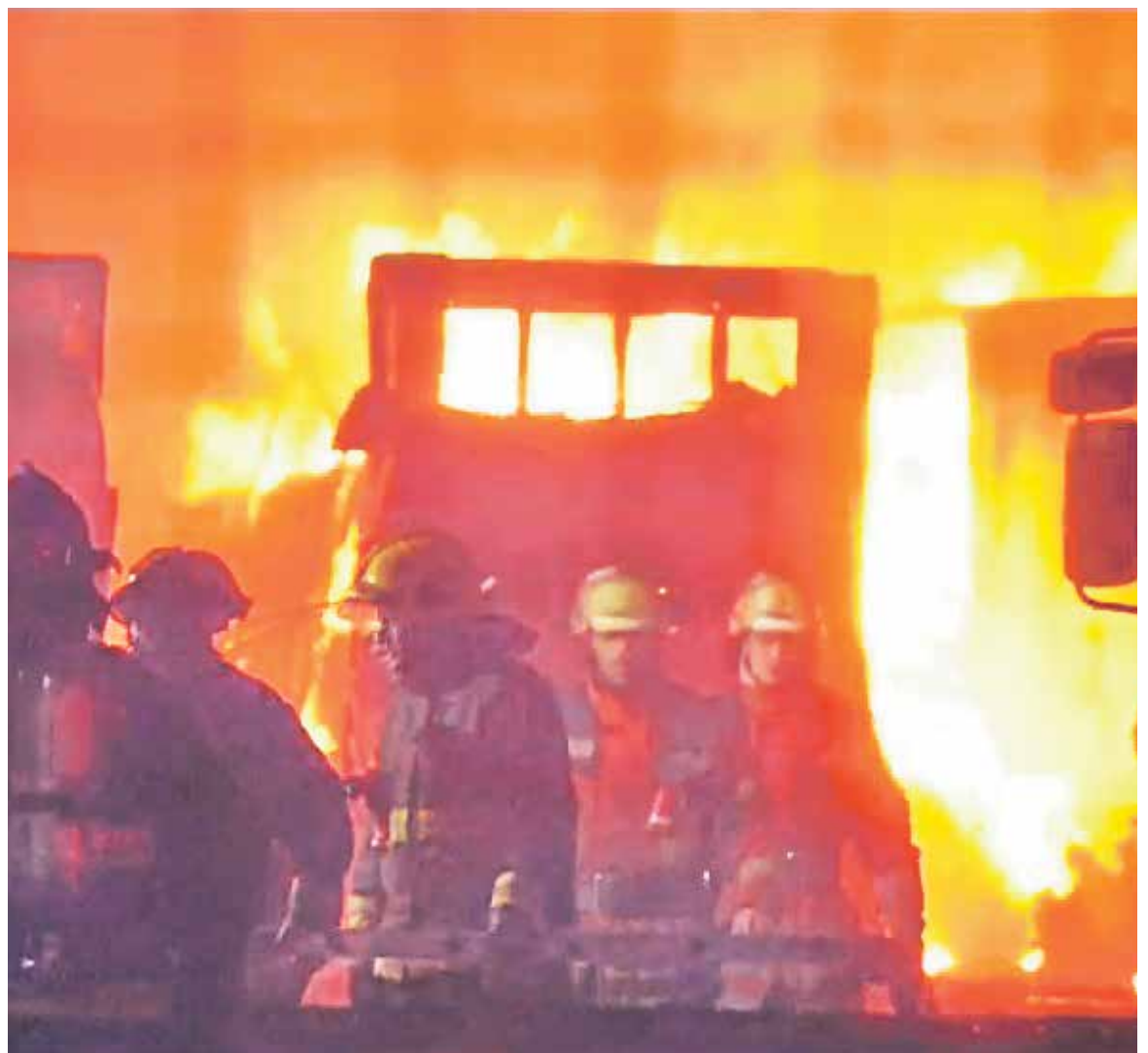
ESTA SITUACIÓN se viene a sumar a la gran cantidad de atentados que han afectado, tanto a La Araucanía como a Biobío.