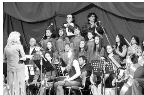
2014: Canto al Bío Bío, Teatro Municipal.