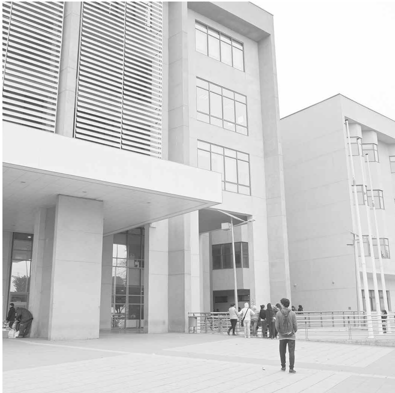
LA MUJER, de 18 años, permanece internada en el Complejo Asistencial "Dr. Víctor Ríos Ruiz" de Los Ángeles.

Serán éstas las que permitirán determinar, entre otras