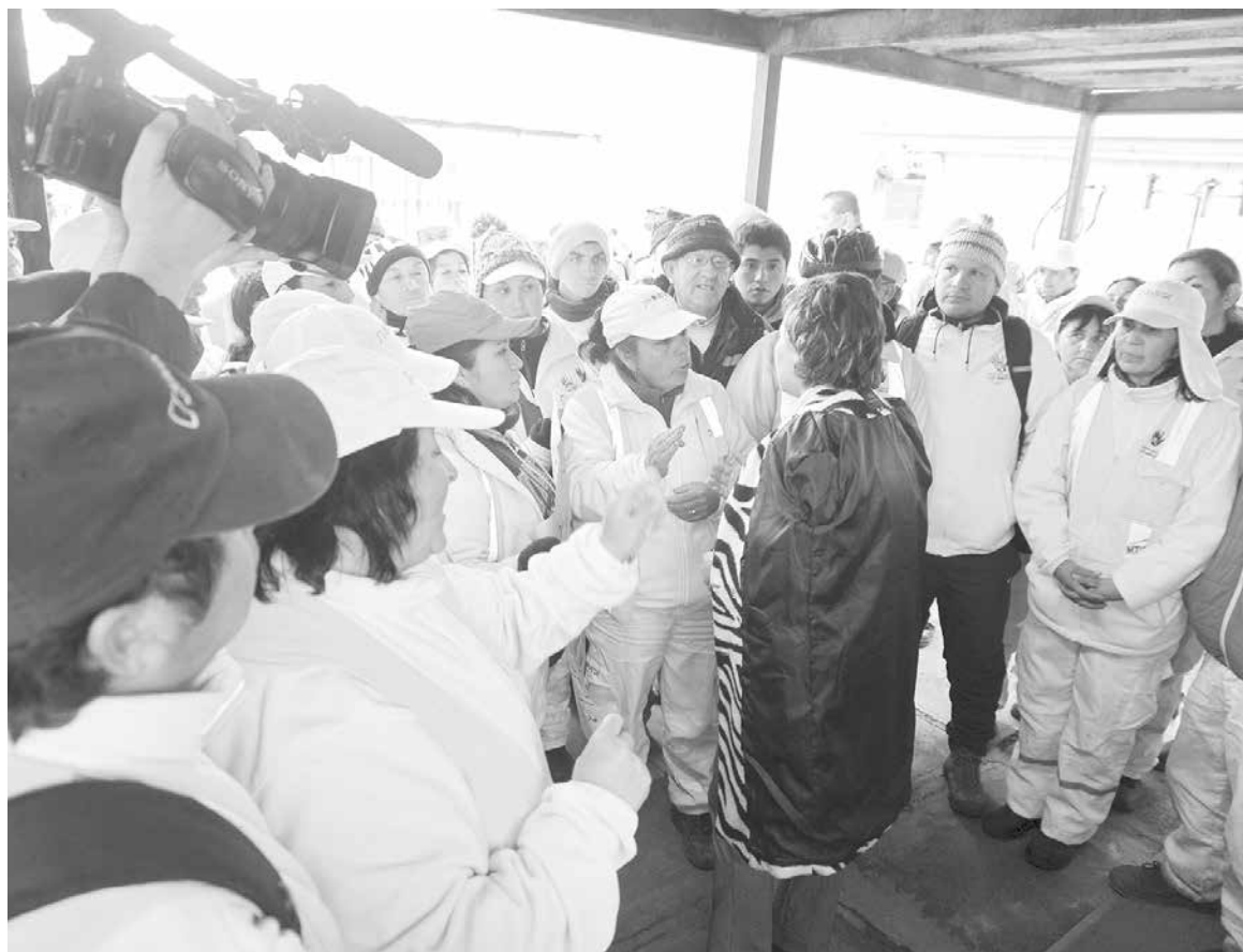
UNOS 50 TRABAJADORES de Soloverde se manifestaron en las afueras del Concejo Municipal este lunes en la Municipalidad de Los Ángeles.

“Hoy día tuvimos a trabajadores que estuvieron acá molestos por el rechazo de la licitación, pero aquí lo único que estamos haciendo como Concejo es proteger y respaldar el sueldo de ellos, porque hoy en día