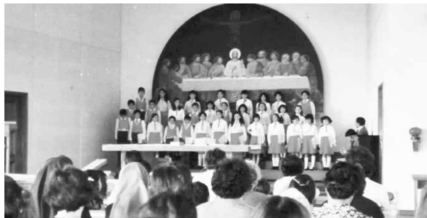
1981: Gira X Región. Concierto Parroquia Purranque.