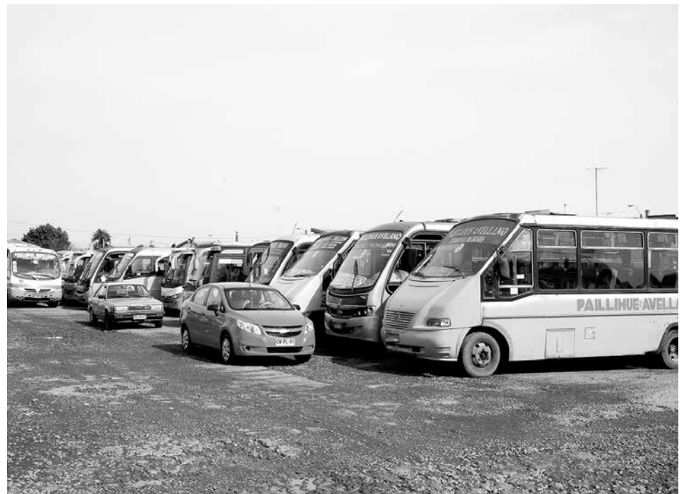
A CONTAR DE LAS 14:30 horas ninguna máquina salió desde los terminales.

también el pronunciamiento del Gobierno sobre el traslado de los adultos mayores a menor costo de parte de la Locomoción Colectiva Urbana, sin ni siquiera haber llamado a reunión para este tema”, concluyó el dirigente.