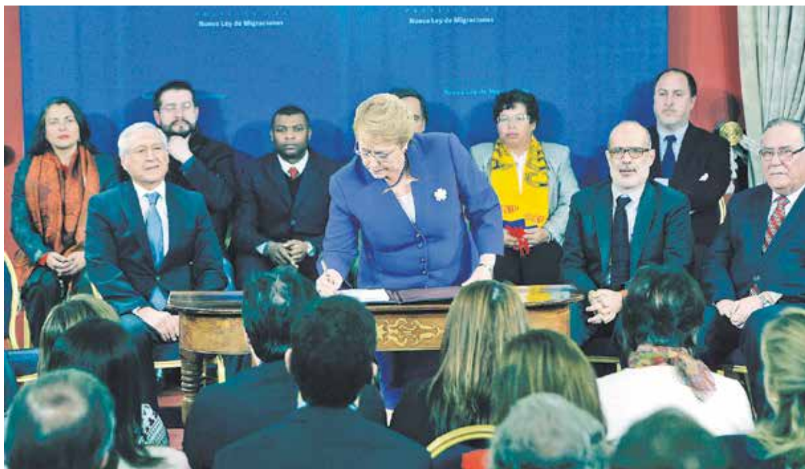
LA PRESIDENTA, MICHELLE BACHELET firmó la mañana de este lunes el Proyecto de Ley de Migraciones.

La mandataria aseguró que Chile está dando un gran paso y agregó que este cuerpo normativo no invisibiliza la realidad de nuestro país.