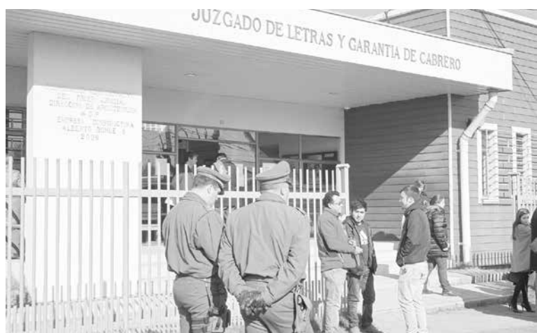
LA AUDIENCIA SE DESARROLLARÁ en dependencias del Juzgado de Garantía de Los Ángeles.

Ésta se realizará en dependencias del Juzgado de Letras y Garantía de Cabrero.