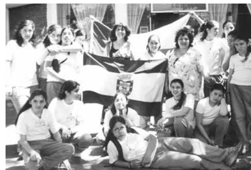
2003: Cantapueblo, Mendoza.