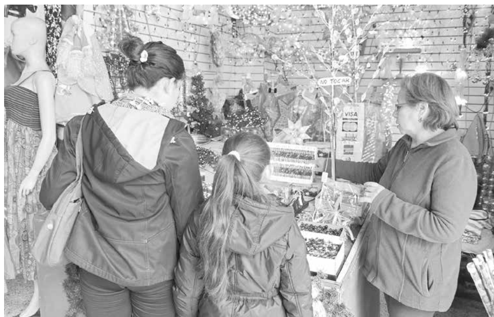
EL CURSO está dirigido a trabajadores que se desempeñan en el comercio.

Los interesados en realizar el programa a distancia deben hacerlo en www.sernac.cl . El curso es gratuito y tiene una duración de 40 horas pedagógicas.