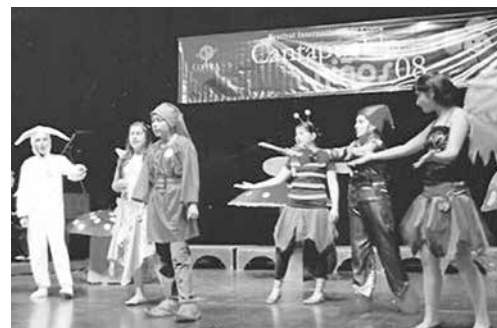
2008: Cantapueblo Niños, La ranita.