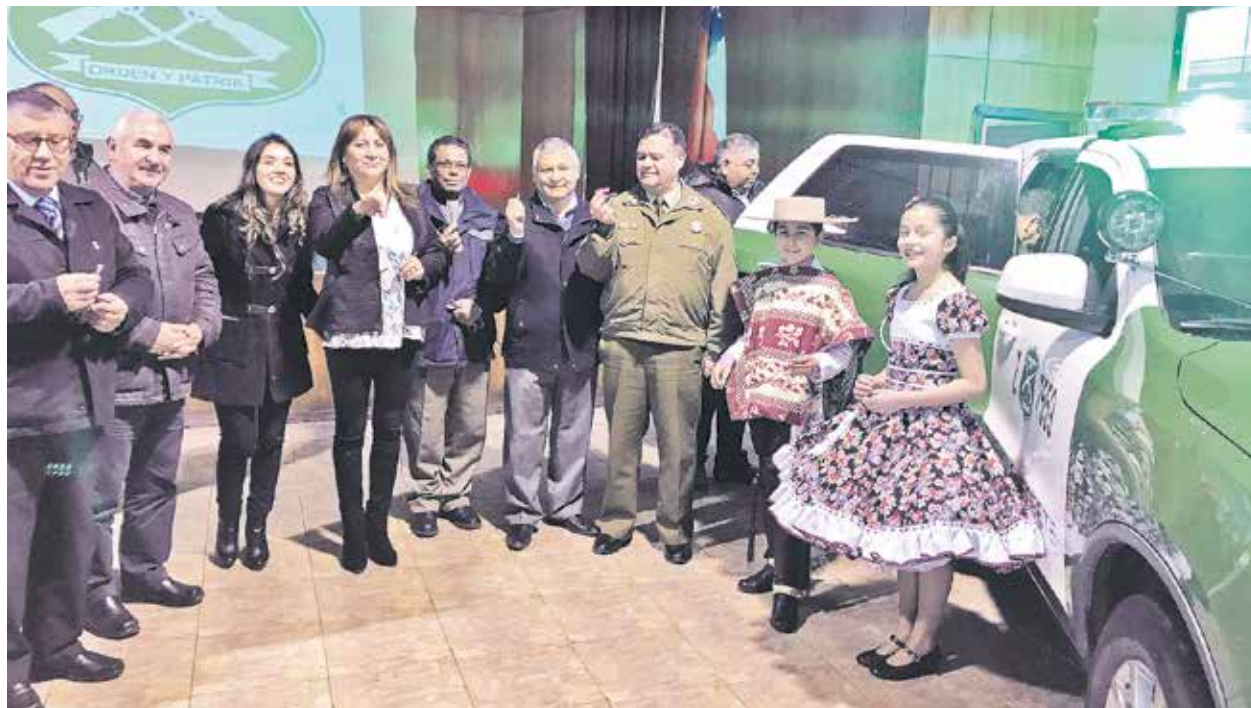
EL NUEVO AUTOMÓVIL cumplirá funciones, tanto en la zona urbana como rural de la comuna de Negrete.

Asimismo, la máxima autoridad comunal de Negrete agregó que están haciendo su parte asfaltando un buen número de caminos interiores para que los accesos, no