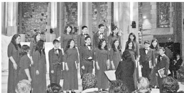
2006: Bariloche, Cita en primavera. Gala en Catedral.