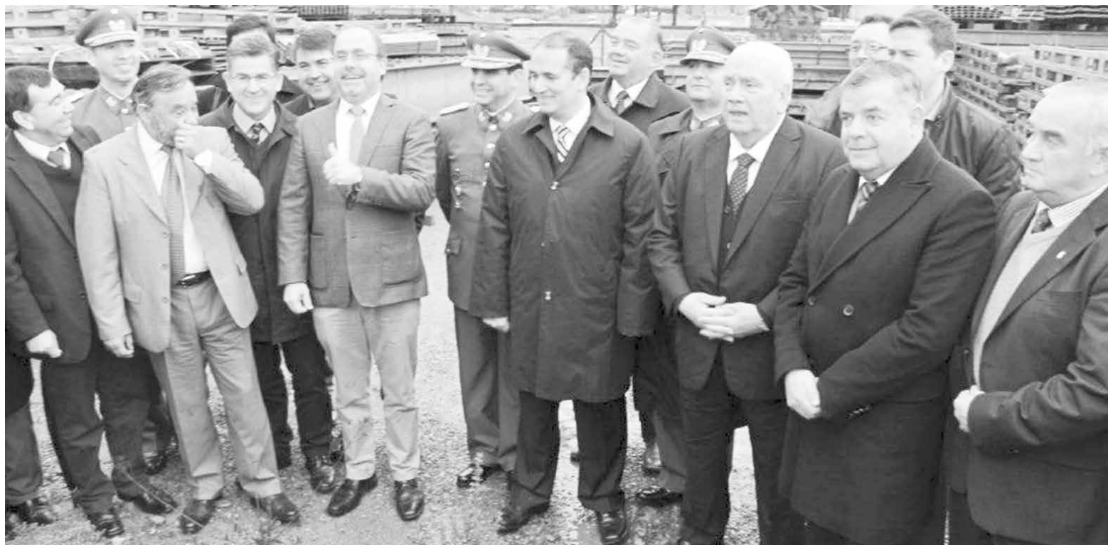
EN CONCEPCIÓN se selló el traspaso del puente mecano sobre el río Biobío desde el Ministerio de Defensa al MOP.

Cabe recordar que el Puente Mecano unió las comunas de Concepción y San Pedro de la Paz tras el terremoto ocurrido en febrero de 2010, y sólo fue desmantelado en julio de 2016, siendo destinado a 21 comunas en un total de 31 partes.