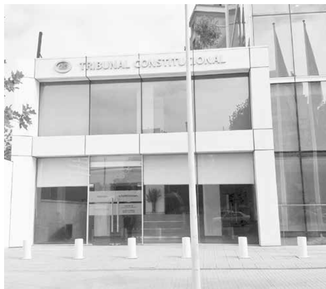
EL TC FINALMENTE rechazó los requerimientos presentados por la oposición que buscaban frenar la promulgación del proyecto de aborto

Mientras que en la UDI provincial lamentaron la decisión del TC señalando que el dictamen no se ajusta a la Constitución, desde el PS en Los Ángeles manifestaron que resolución estuvo “acorde a los tiempos”.