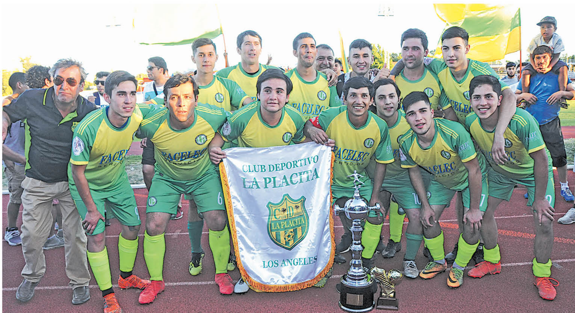
LA FECHA DE LA SÚPER COPA de Campeones debería realizarse durante las primeras semanas del mes de febrero.