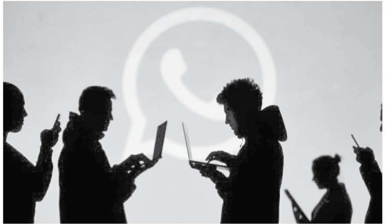
WHATSAPP IMPLEMENTÓ el PiP para los videos de YouTube, Instagram, Facebook y Streamable.

WhatsApp es una app de mensajería, que viene a ser un software para que puedas comunicarte con tus amigos y familiares con tu móvil. También se pueden mandar más contenido que un típico reporte de cómo te ha ido el día, qué te has comprado en las rebajas o si