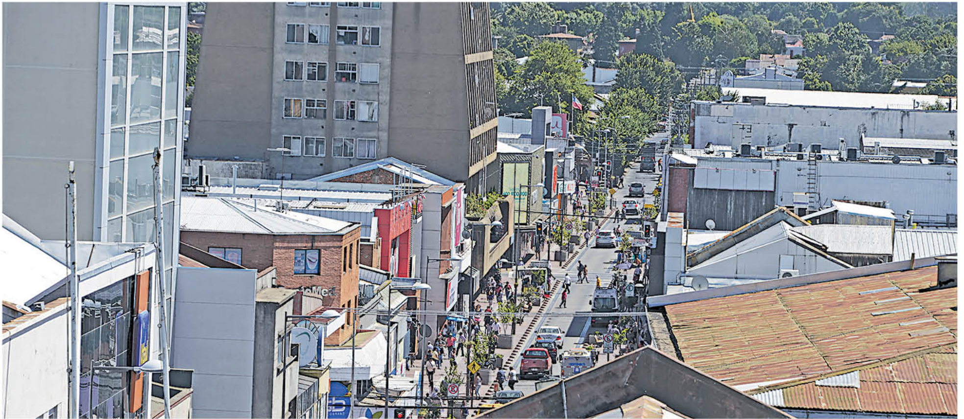
TRES ESTUDIOS GIRAN en torno a Los Ángeles vista como "La Ciudad del Futuro" y cómo esta influye en la provincia y todo el sur de Chile.