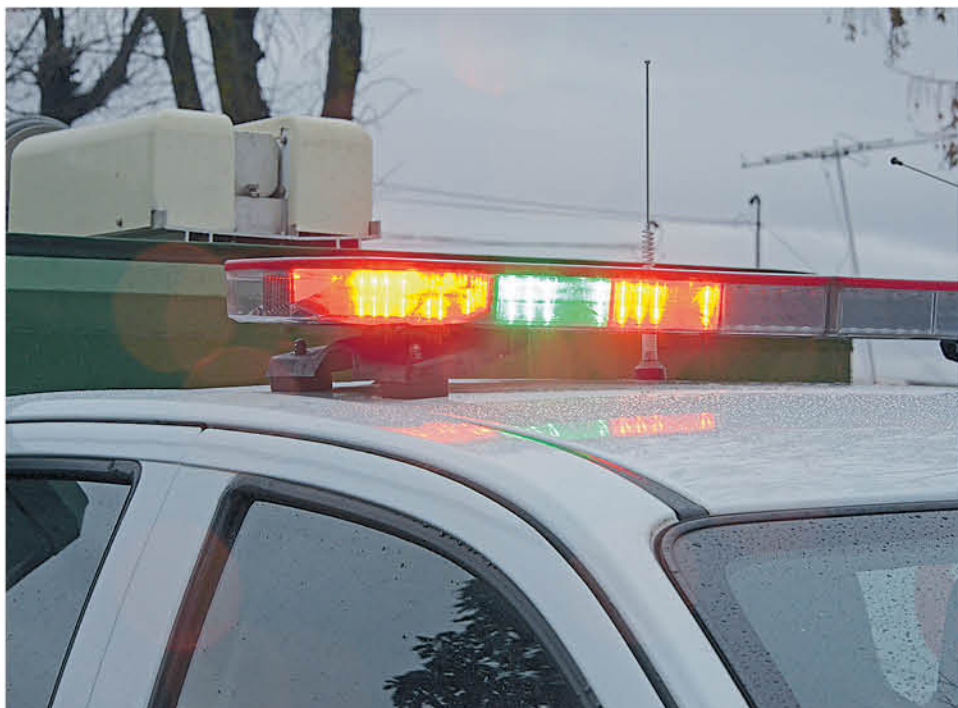
CARABINEROS se hizo presente en el lugar.

El profundo corte que sufrió el menor, hizo que este perdiera mucha sangre sufriendo un shock hipovolémico. Al llegar personal de Carabineros y SAMU al sitio del suceso procedieron a estabilizar al pequeño para posterior trasladarlo hasta el hospital, pero no se logró con éxito pues en el trayecto el niño falleció.