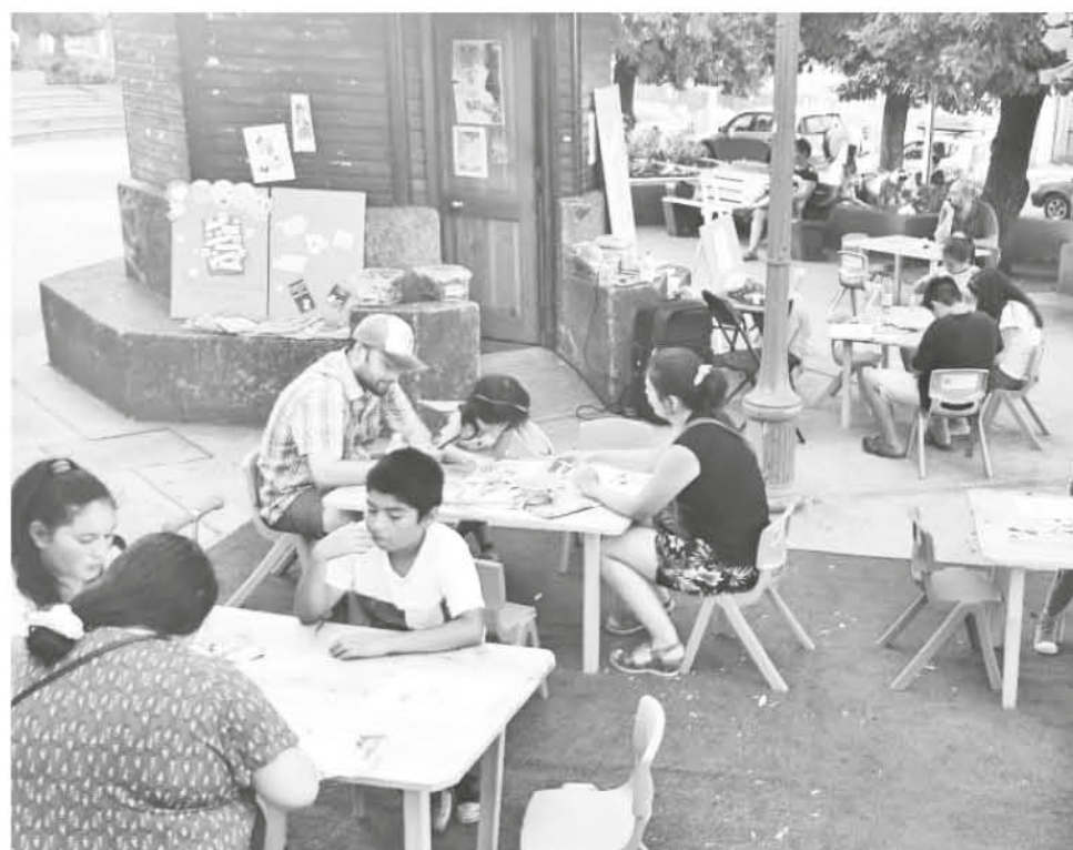
EL KIOSCO CULTURAL es una iniciativa de la Corporación Cultural Municipal de Los Ángeles, CCMLA.