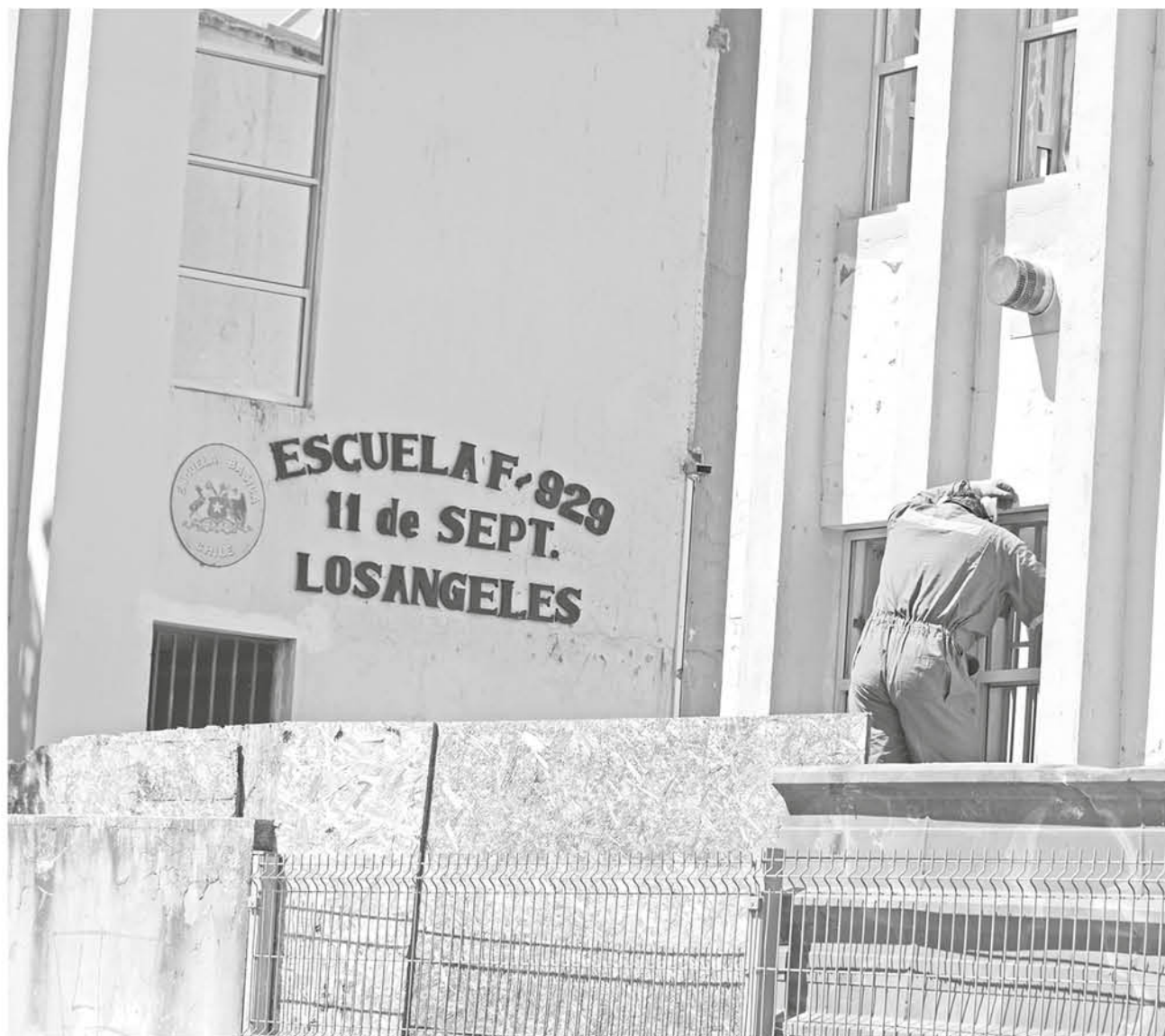
ADEMÁS DE SU REESTRUCTURACIÓN, la obra incluye una modernización del establecimiento.

En este sentido, la máxima autoridad de la capital de la provincia de Biobío, sostuvo que "la municipalidad arrendó un establecimiento en calle Mendoza, a objeto de dar ahí continuidad a nuestro proceso de enseñanza a sus alumnos, una vez que la escuela esté terminada, recibida, se van a trasladar a este nuevo establecimiento educacional. Ellos, desde la escuela