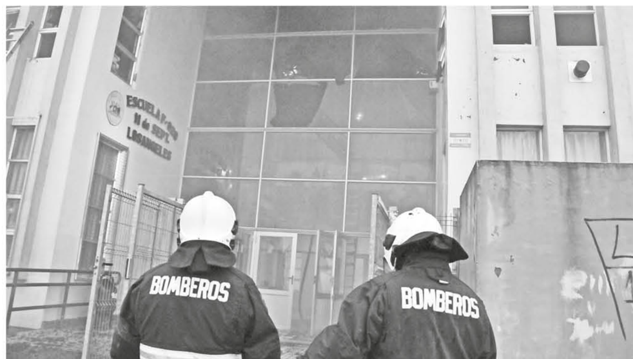
EN JUNIO DEL 2015, un incendio consumió parte importante de la Escuela 11 de Septiembre.

Afortunadamente, en ese momento no había alumnos en el establecimiento. De aquella trágica mañana han pasado más de tres años, y hoy la comunidad educativa del establecimiento educacional, está cada vez más cerca de poder volver a su edificio de origen de la Escuela 11 de Septiembre, ubicado en calle Talcahuano.