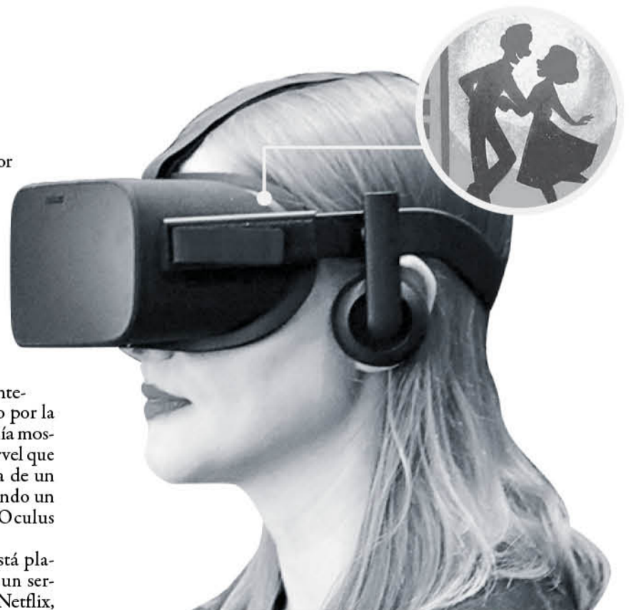
EL FILME CYCLES se basa en la historia de los abuelos del director Jeff Gipson.

La compañía además está planeando el lanzamiento de un servicio de streaming similar a Netflix, llamado Disney+.