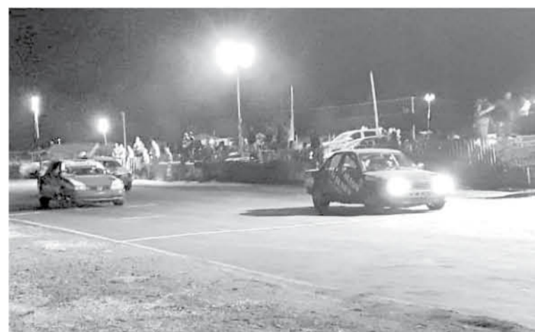
LA COMPETENCIA NOCTURNA comenzó a las 21:30 horas y se extendió hasta las 2:00 de la mañana aproximadamente.

El presidente del club de automovilismo cabrerino comentó que existe una situación compleja de varios puntos de vista en llevar a cabo esta clase de eventos, considerando que