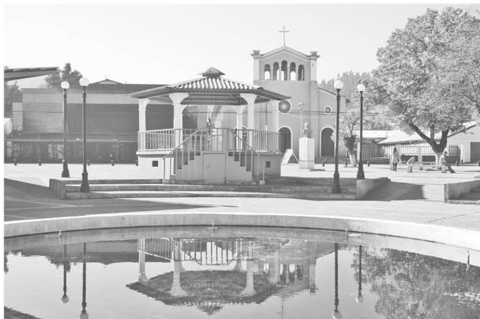
DURANTE LA MADRUGADA del lunes la comuna de San Rosendo habría sufrido un supuesto ataque.