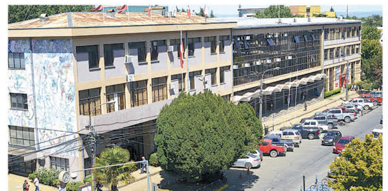
HOY NO SÓLO SE ESTUDIA a la ciudad desde el punto de vista económico, también se hace desde el punto de vista de sus habitantes.

En el caso de "Visión Ciudad" este es un trabajo encabezado por la Cámara Chilena de la Construcción y donde es acompañada por Inacap, la Municipalidad y Diario La Tribuna. Esta es una agrupación pública privada que elabora un plan maestro para hacer de la capital de la provincia de Biobío un lugar amistoso y construido a partir de la opinión de los expertos y de sus habitantes.