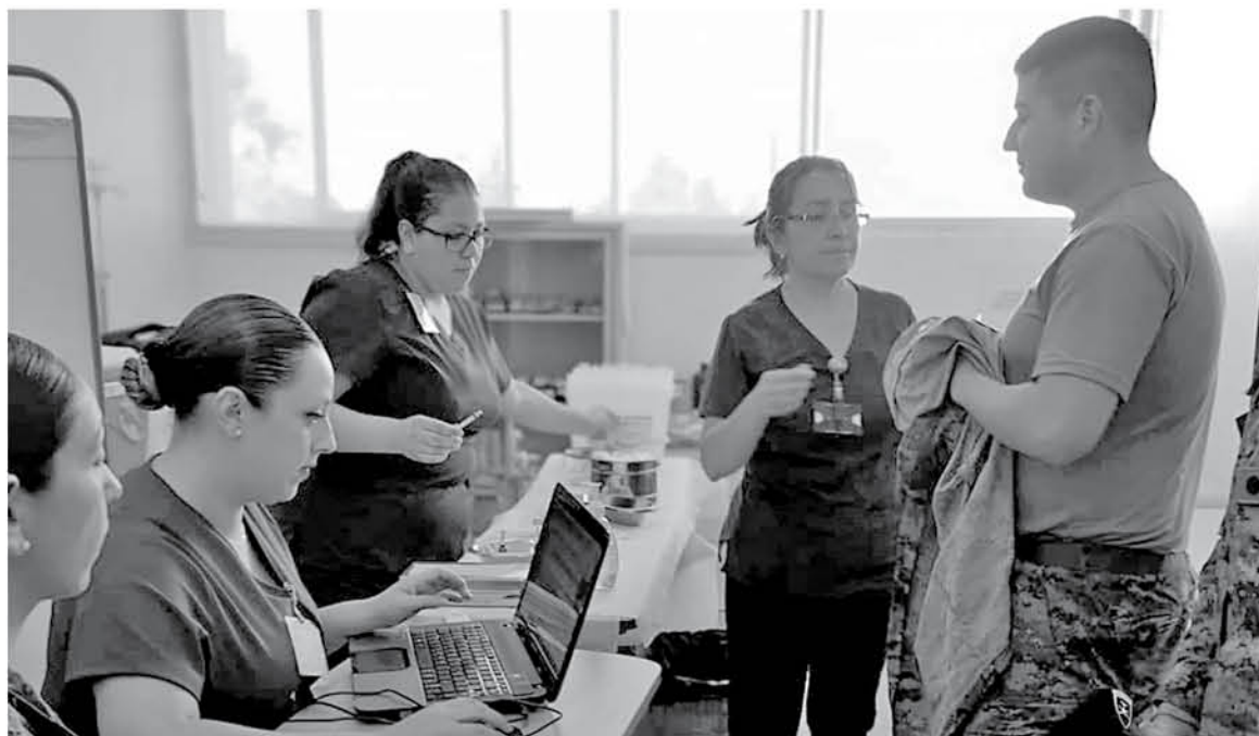
LA DURACIÓN DE ESTA CAMPAÑA está considerada hasta fines de febrero, en una primera instancia.

"Es muy bueno porque, considerando que los jóvenes se encuentran realizando su servicio militar acá, es muy bueno que lo hagan acá; aunque si fuese -a solicitud de ellos- realizarlo en el Cesfam, pueden concurrir a