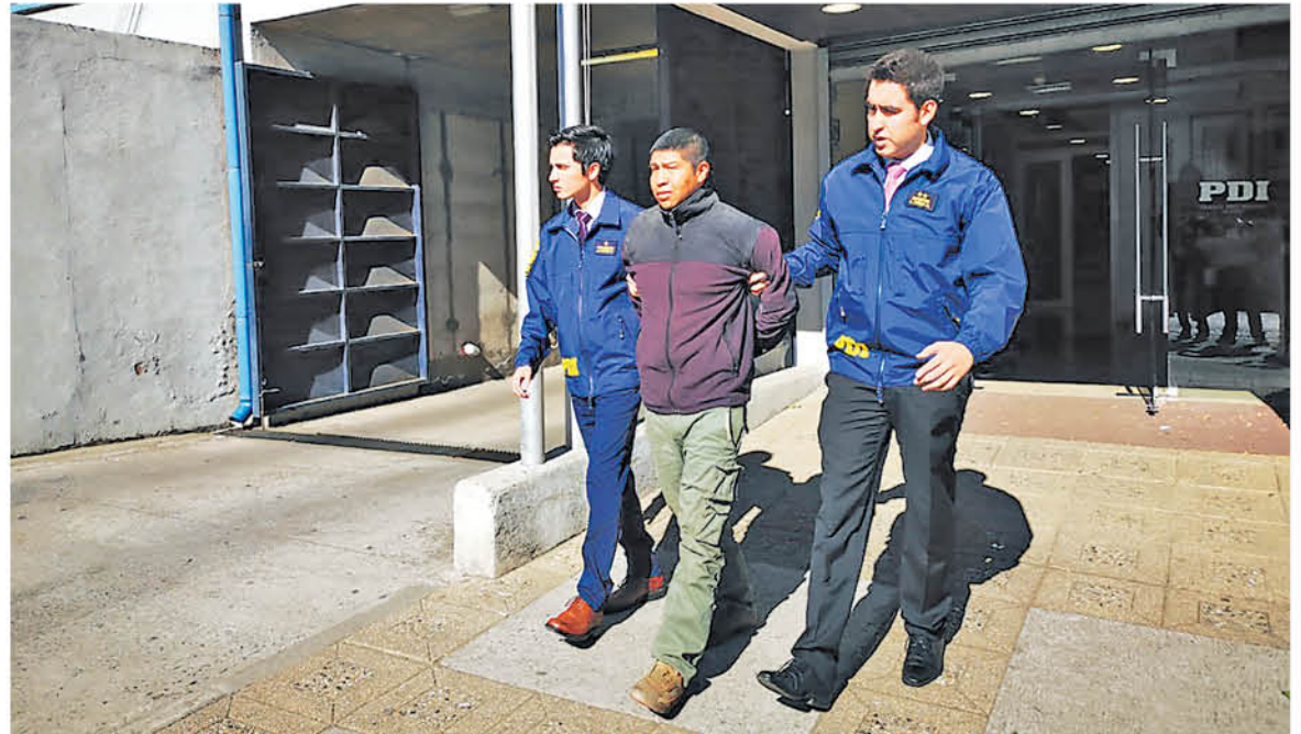
DETECTIVES DE LA BRIGADA de Investigaciones Policiales especiales (BIPE) trasladan al imputado al centro penitenciario de Mulchén.

del 2015. Esta persona se encontraba en el paradero de Alto Biobío, cuando se fiscalizó y se encontró que este sujeto portaba un revólver a fogueo modificado, más diversas municiones de distinto calibre.