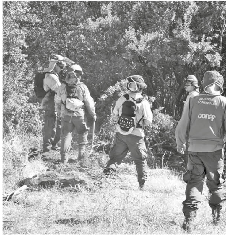
HASTA LA FECHA va un total de 4.8 hectáreas quemadas en los siete focos.

“Nosotros estamos fuertemente en esta campaña de denunciar a las personas que están haciendo incendios en forma intencional, si es que son descubiertos obviamente. Uno puede ver de repente cuando alguien en un campo se pone a quemar basu-