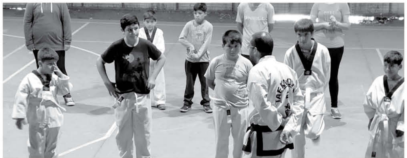
AL TALLER ASISTEN los taekwondokas de Quilleco que realizaron una sólida actuación en Puerto Montt.

do el aporte de la municipalidad que "ha implementado un gimnasio de último nivel, por lo que gracias a ese apoyo