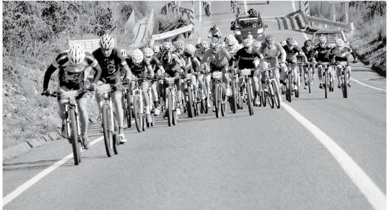
LA ORGANIZACIÓN TENDRÁ puestos de hidratación y barras de alimentación que estarán disponibles para los corredores. (Foto de contexto)

En todas las categorías la premiación constará de un trofeo para el primer lugar y medallas para la segunda y tercera posición.