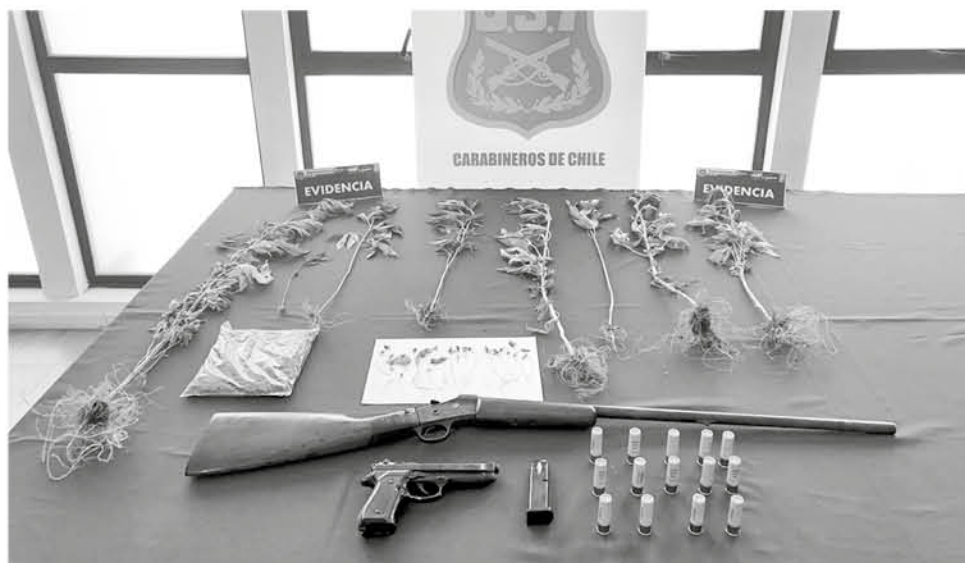
TODAS LAS SUSTANCIAS y las armas fueron presentadas como prueba ante el tribunal correspondiente.

Mediante la denuncia de terceros los efectivos dieron con el paradero del responsable, quien no mantenía antecedentes delictuales.