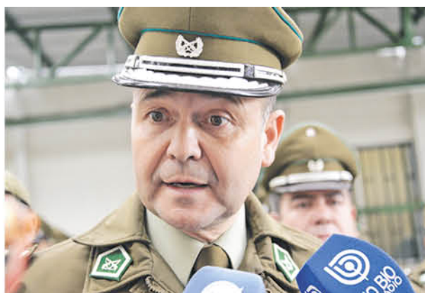
DURANTE LA ÚLTIMA SEMANA de diciembre se registró un total de 71 delitos, mientras que el 2017 a la misma fecha se registraron 79.

2018 se registró una baja de 109 casos de menos de accidentes, mientras que el delito disminuyó en diferentes proporciones durante la última semana del mes, reduciendo los actos violentos en un 17.2% hecho que deja un claro indicio de colaboración de la comunidad, según añadió el mismo prefecto.