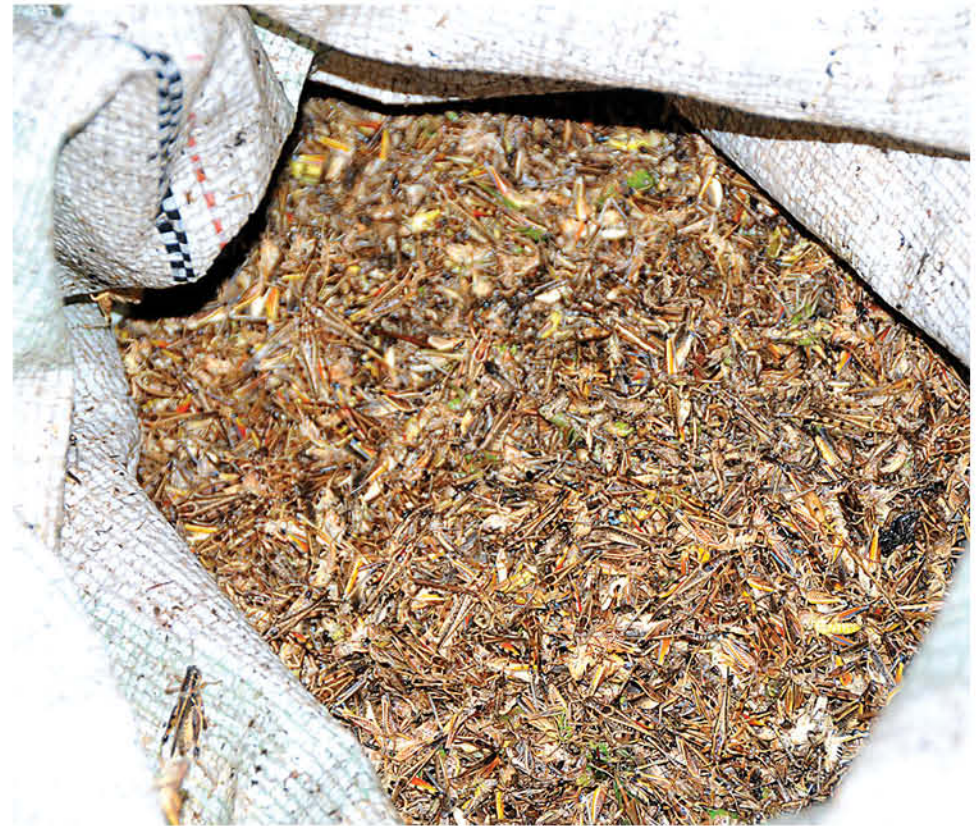
SI QUILACO ES DECLARADO zona de emergencias podrá recibir los 50 millones de pesos que necesitan para fumigar.

Si la autoridad política decide que la plaga de langostas logra el tamaño para