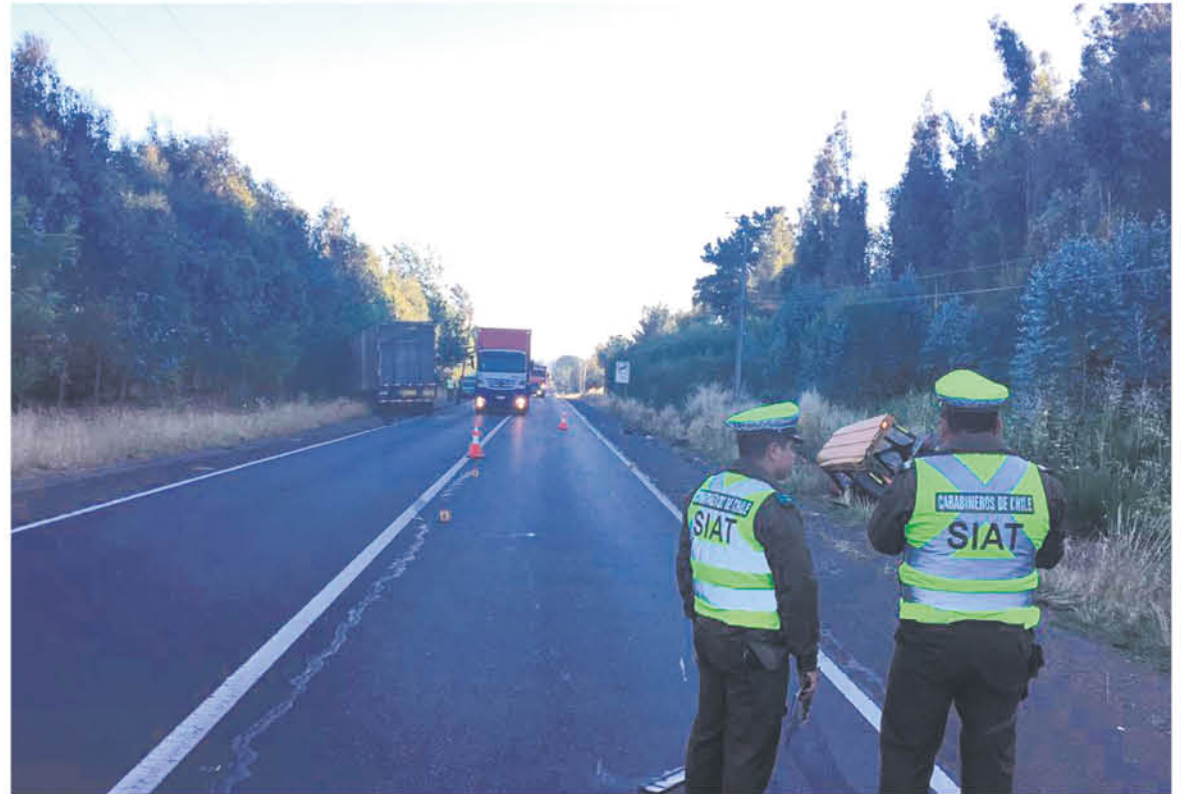
EL CONDUCTOR DEL CAMIÓN involucrado en el incidente finalmente quedó detenido por Carabineros.

En el incidente que produjo una importante congestión vehicular alrededor de las nueve de la mañana, participó personal de Bomberos de Los Ángeles, quienes acudieron a la emergencia.