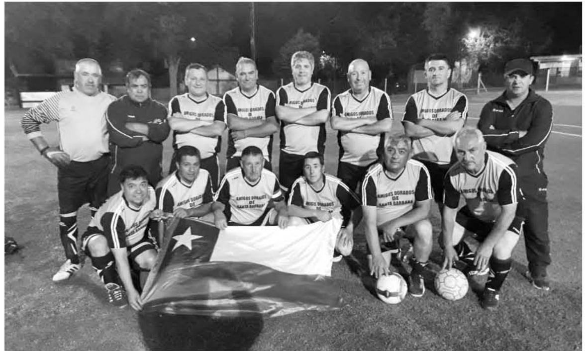
LA AGRUPACIÓN que lleva más de dos años y cuenta con personalidad jurídica está conformada por 24 integrantes.

Por otra parte, aseveró que van sumando objetivos con el pasar de los años y que a futuro “buscaremos potenciar la agrupación con más series dándole cabida a los niños, mujeres y seguir realizando actividades sociales, potenciando también el turismo de la provincia de Biobío”.