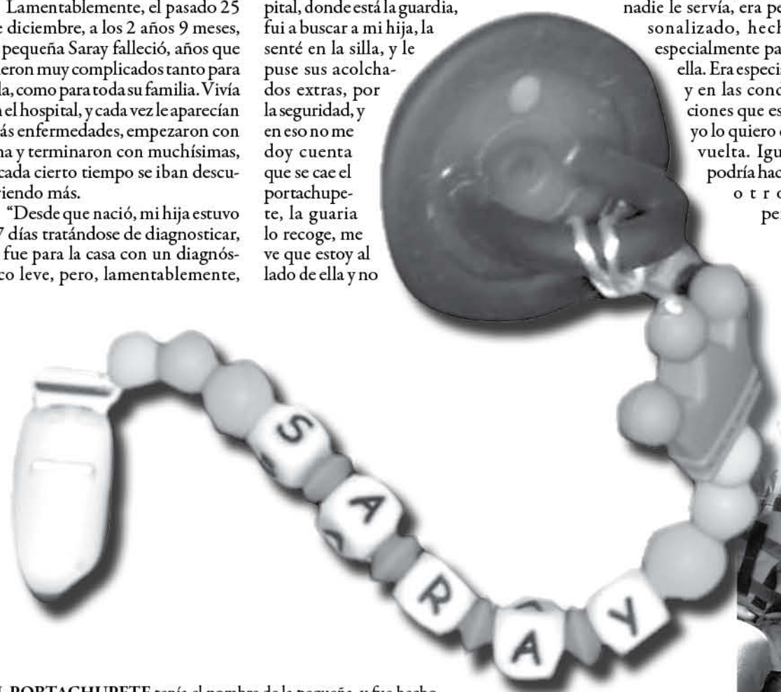
EL PORTACHUPETE tenía el nombre de la pequeña, y fue hecho exclusivamente para ella.

Finalmente, la angustiada madre subrayó que “apelo a la buena voluntad de la persona que lo tenga o quien sepa quién lo tiene, en las condiciones que esté el portachupete, necesito recuperarlo, es importante para mí, hoy es el recuerdo más importante que puedo tener de mi hija que ya no está”, puntualizó.