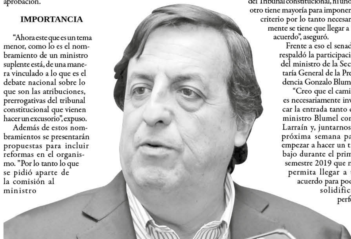
LLEGAR A ESTA INSTANCIA con acuerdo, no fue fácil aseguró el senador UDI.

La próxima semana la sala debería ser convocada para aprobar esta ardua gestión.