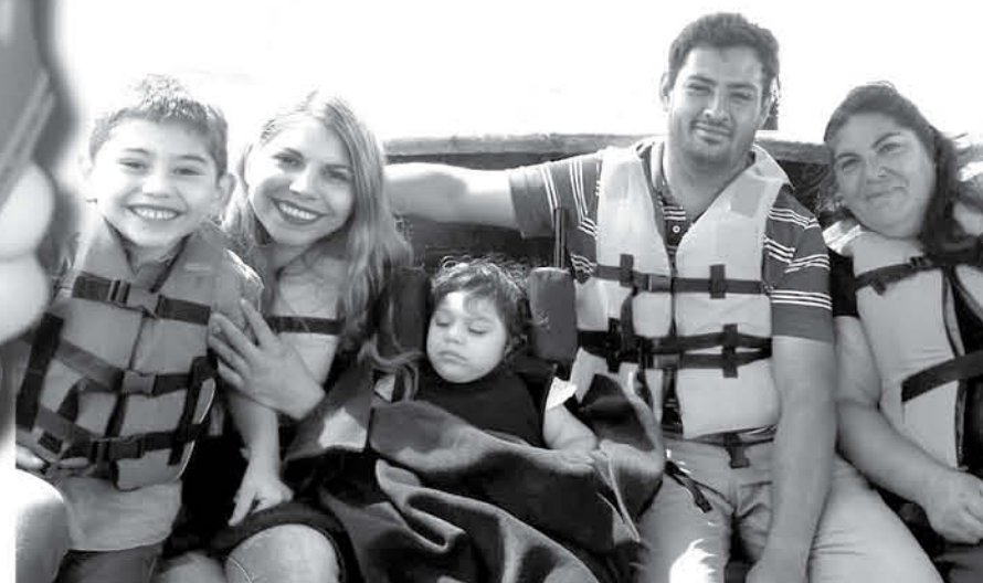
SARAY era la menor de la familia.