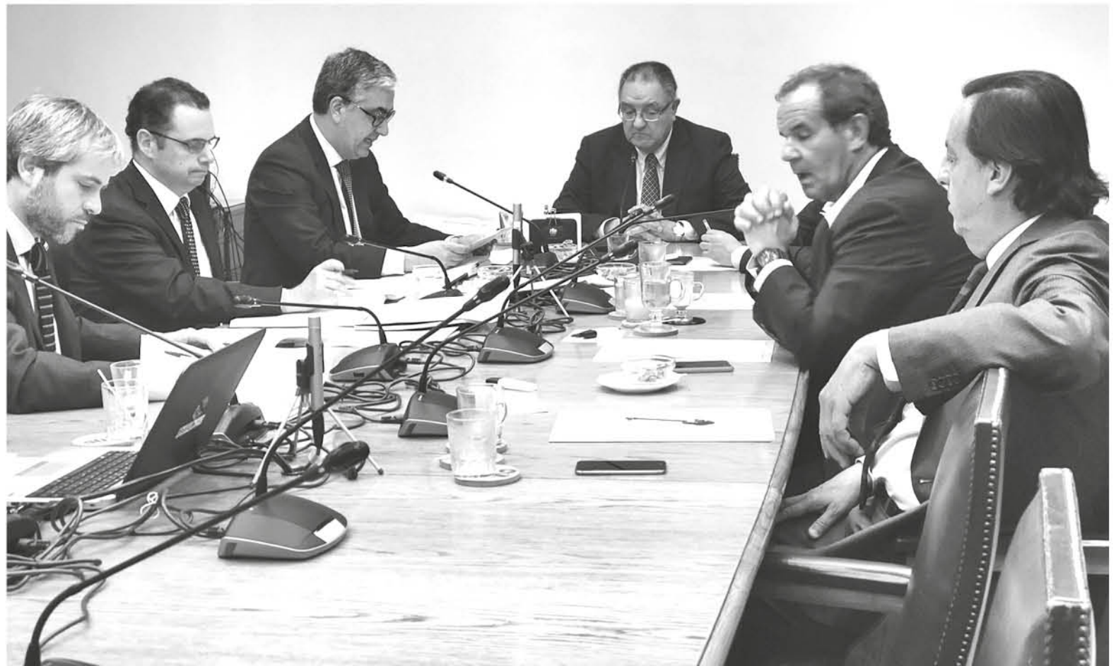
EL SENADOR PÉREZ VARELA participó en la Comisión de Constitución, junto al ministro Blumel viendo el acuerdo, solicitado por el Presidente Piñera, para nombrar como ministros suplentes del Tribunal Constitucional, por un período de tres años.