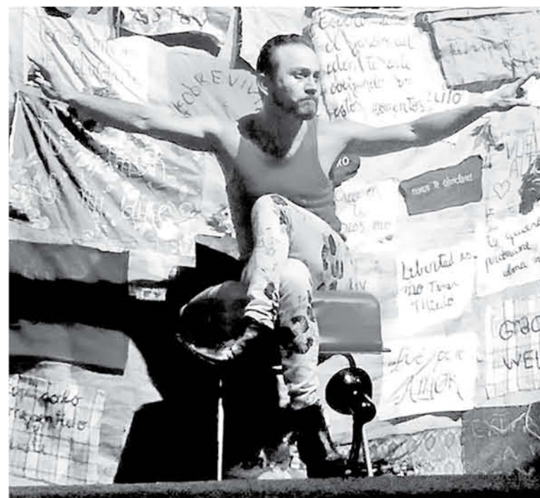
DESDE SU CREACIÓN PERFILES Y SILUETAS ha contribuido al teatro y otras artes de Biobío, hoy uno de sus proyectos estrella está en riesgo.