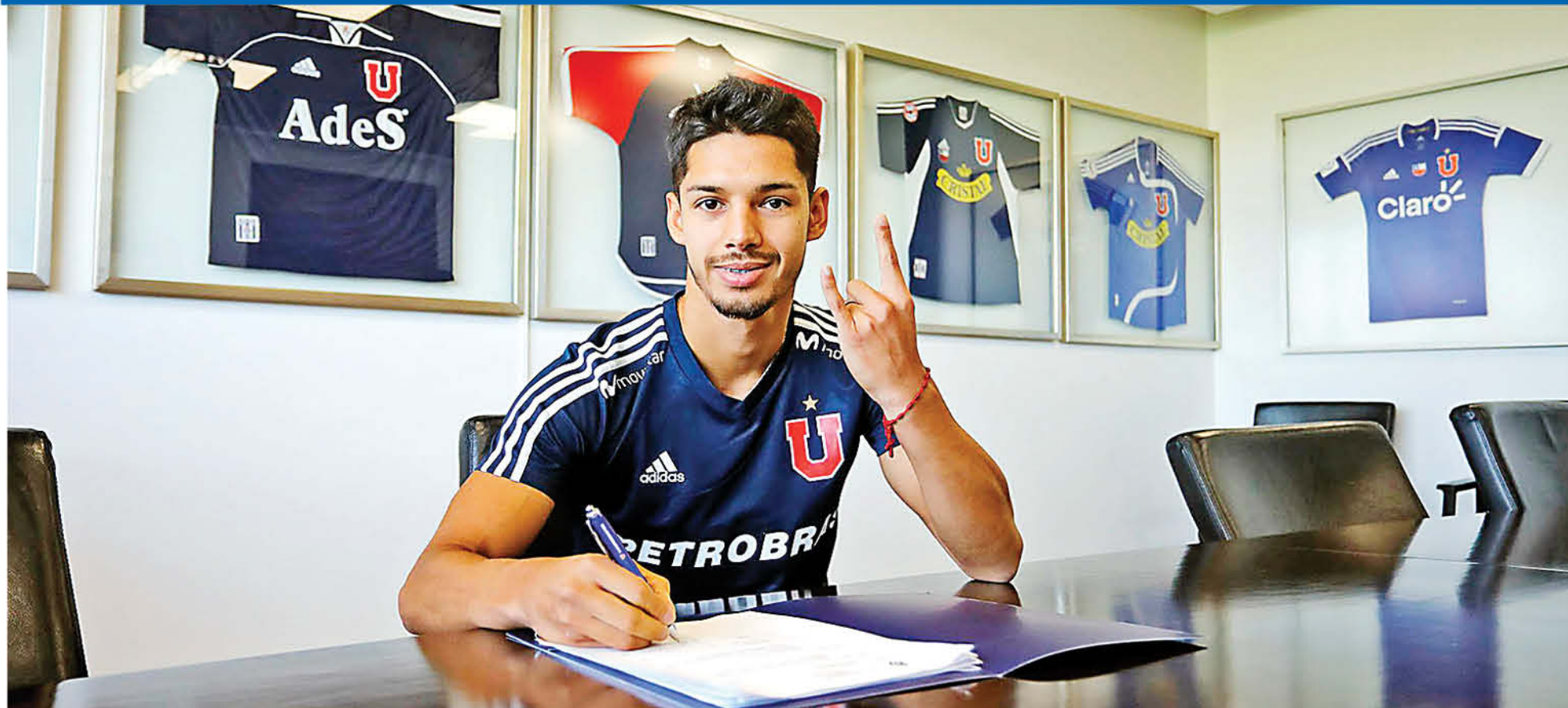
EL VOLANTE DISPUTÓ 73 partidos, anotando cinco tantos desde su debut en Talcahuano en el año 2015.