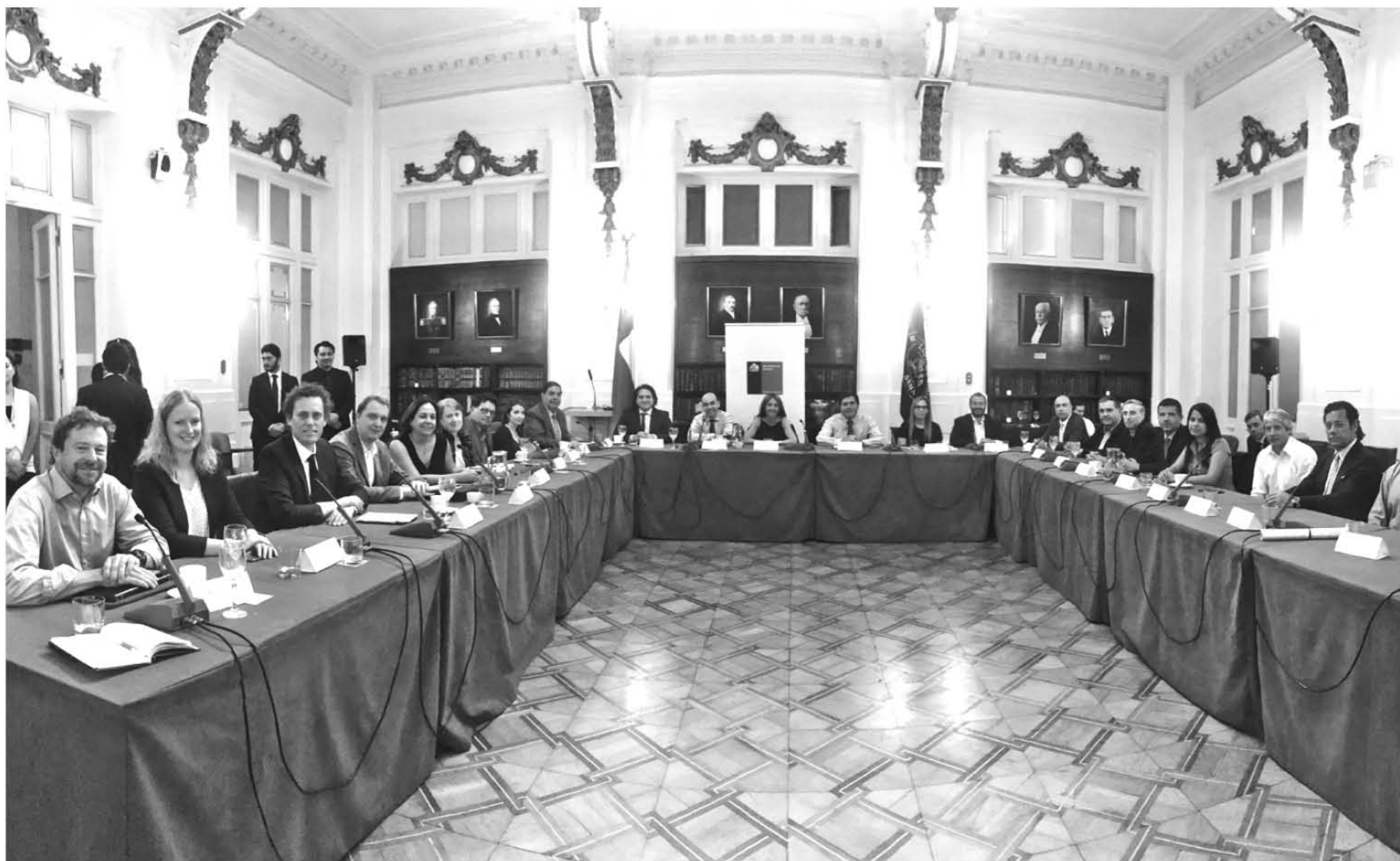
SESIÓN DE CLAUSURA de la “Mesa de Descarbonización de la Matriz Eléctrica”.

3. El Ministerio de Energía coordinará este Grupo de Trabajo al cual se invitarán a todos las instituciones relevantes en este proceso.