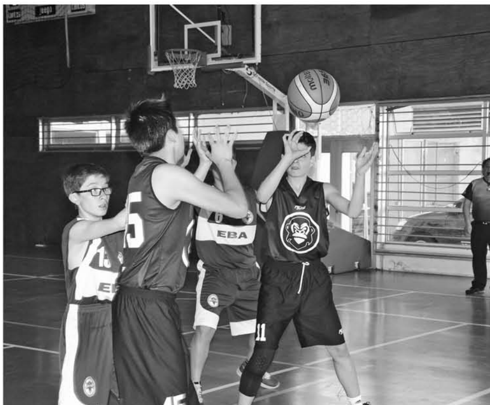
ENTRE LAS NUEVAS REGLAS figuran cambios en criterios arbitrales a la hora de señalar un avance ilegal, control de balón y otros.

Los practicantes de la disciplina, árbitros, entrenadores, monitores y profesores de educación física podrán aprender sobre los recientes cambios en las reglas del juego.