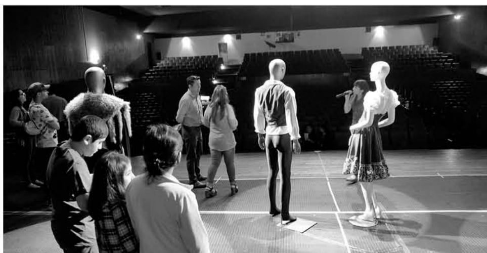
LOS GUÍAS DE LA CCMLA hablaron de los detalles de las luces, los nombres de cada lugar en el escenario, los parlantes y del trabajo necesario para presentar una obra.