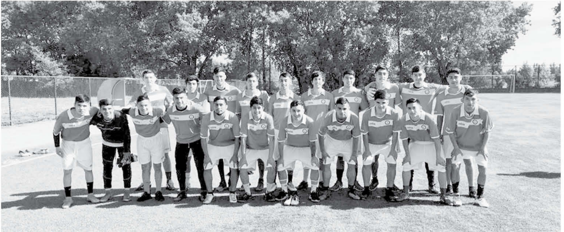
LA CAMISETA OFICIAL del conjunto podría ser de cuadros verde con blancos, similar a la de Croacia.