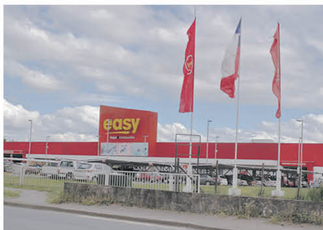
AL MOMENTO DE ser arrestado, por personal de la SIP el implicado no mantenía artículos en su poder.

En este procedimiento no se encontraron especies en poder del único involucrado, sin embargo registros de cámaras revelaron que cerca de las 21 horas, el imputado estuvo en el supermercado junto a otras personas sustrayendo cajas de cerámicas desde unos palet ubicados en el patio del recinto, las que eran