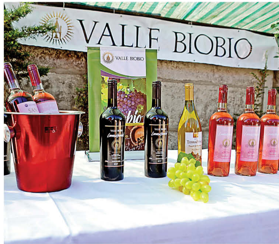
BENEFICIARÁ A PRODUCTORES de Yumbel, San Rosendo y Cabrero.

La iniciativa beneficiará a 24 productores de uva vinífera vinculados con la fabricación de vino artesanal.