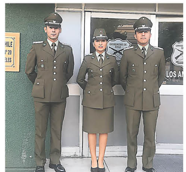
LOS NUEVOS FUNCIONARIOS comienzan a prestar servicios desde esta semana.

Estos corresponden a recién egresados de la escuela de Carabineros, quienes comenzaron sus actividades en la ciudad luego de años de estudios y donde van a desempeñar diferentes