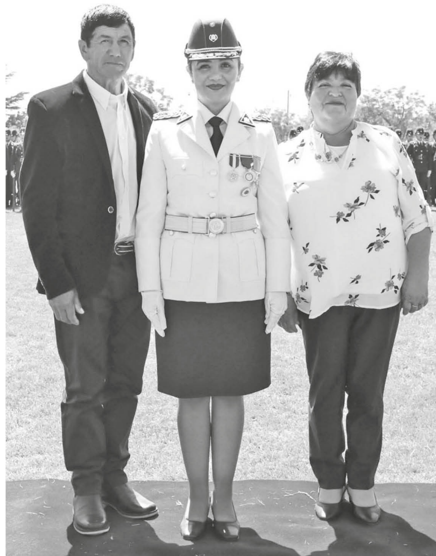
LA TENIENTE CORONEL ESPERA a futuro llegar al grado máximo o alguno importante en el resto de carrera que le queda.

Con humildes inicios en el campo del corazón de la provincia de Biobío, logró una formación integral junto a un proceso formativo destacable que le han llevado lejos en la gestión penitenciaria.