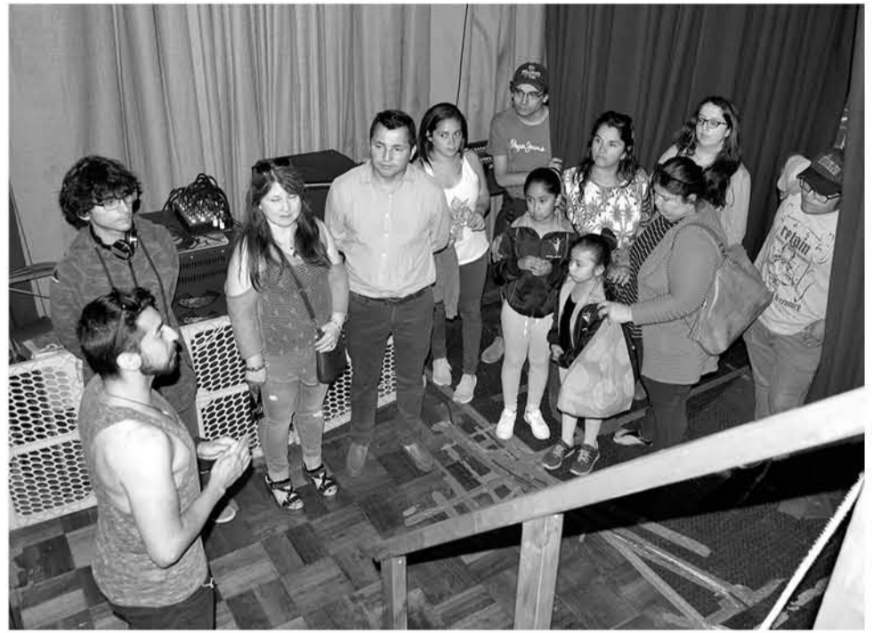
ESTAR TRAS BAMBALINAS y conocer todo lo que se hace para poner una obra en escena fue uno de los puntos relevantes del Día Patrimonial del Teatro en Los Ángeles.

Al finalizar, ya fuera de las tres estaciones, la despedida, repleta de agradecimientos por una hora gratuita de cultura entretenida sirvió para conocer la gran cantidad de actividades y talleres que se imparten durante el año en la Corporación Cultural Municipal de Los Ángeles.