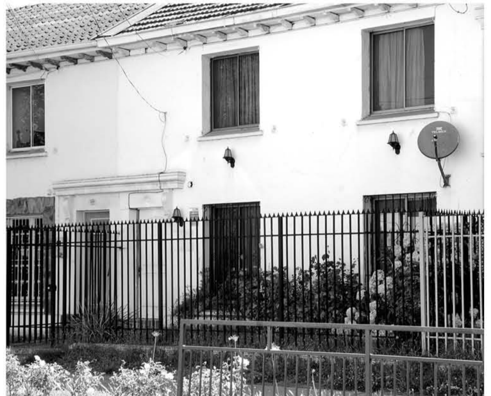
DESDE EL 1 DE ENERO cerró las puertas la oficina parlamentaria del senador Víctor Pérez Varela, quien según trascendidos abrirá en Ñuble y abarcará Biobío.

Es así como quedó la interrogante de qué pasaría con el pronto desembarco del equipo Van Rysselberghe en la zona. Al respecto, desde comunicaciones de la senadora comentaron que abrirían una oficina en Los Ángeles pero no en un futuro cercano sino más bien en algún momento del año, ya que desarmar estos recintos no era fácil en términos administrativos y aún había personas contratadas en la oficina de