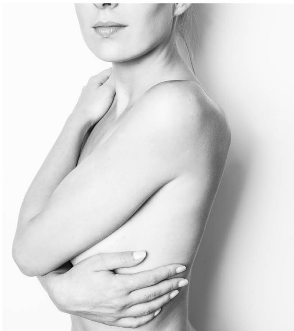
ADELGAZAR es perder volumen sobrante y no kilos.

como la cavitación, que sacude el panículo adiposo o la presoterapia, que ayuda a drenar la grasa a través del bombeo