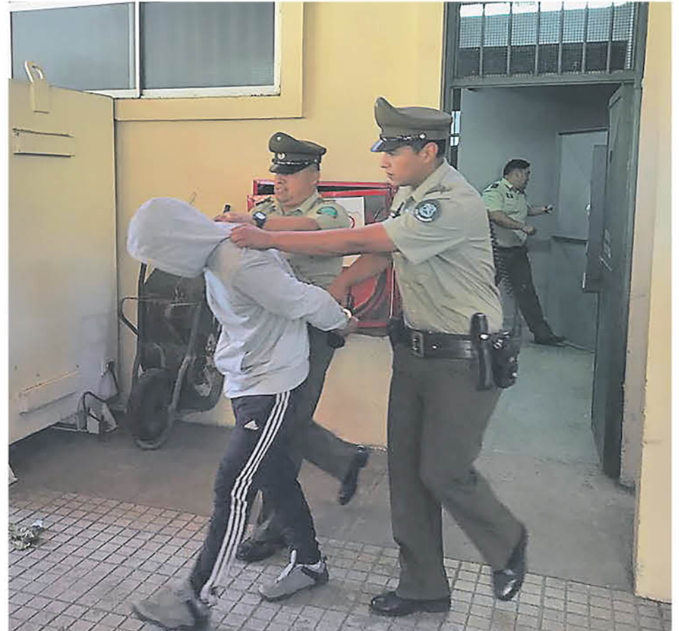
LOS INVOLUCRADOS FUERON trasladados por Carabineros de Negrete para pasar a control de detención.

En medio del procedimiento, se dio a conocer, según información policial que dos de estos sujetos mantenían órdenes vigentes por diversos delitos, registrando uno de los implicados domicilios en el sector de Paillihue.