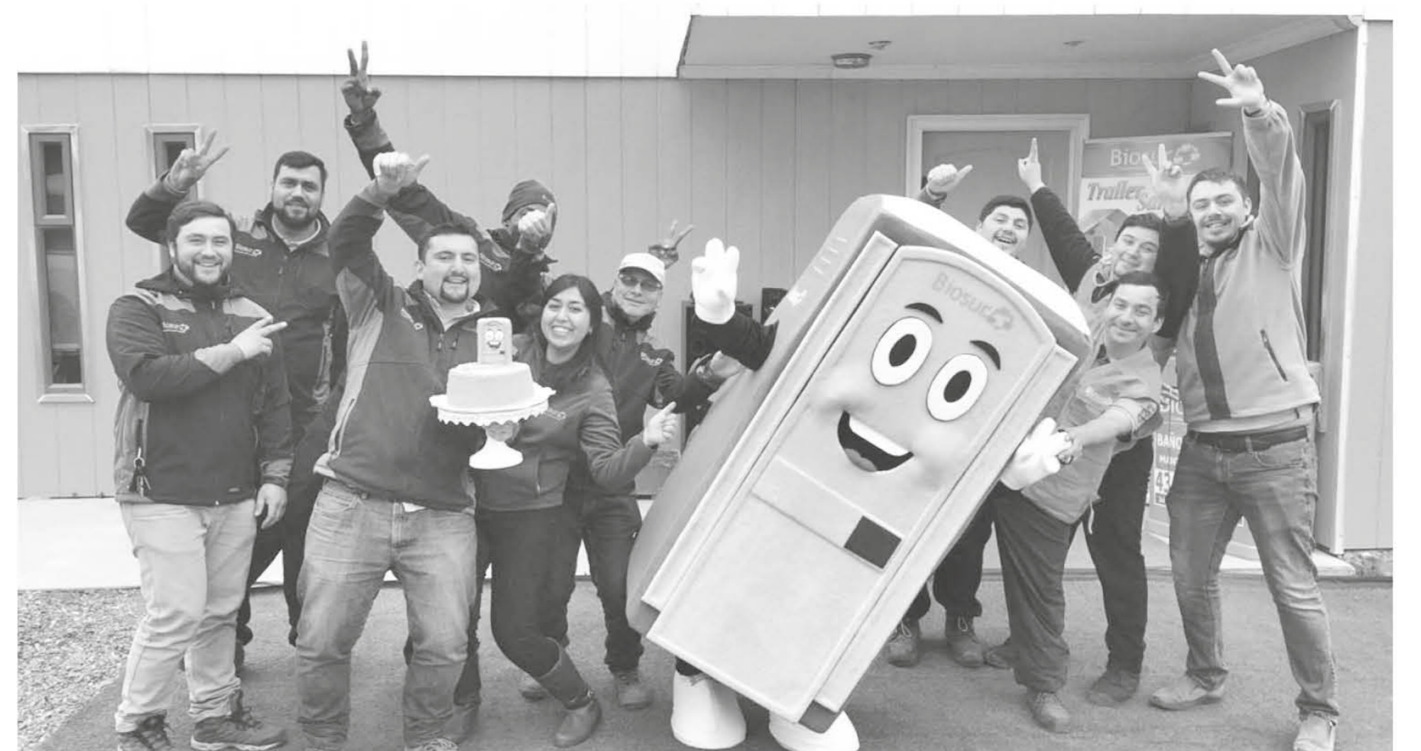
UNA DE LAS EMPRESAS BENEFICIADAS por esta normativa en la provincia es Biosur quienes actualmente verán una mejora en sus pagos.

"Con respecto al pago de los 30 días, que es una de las aristas de la ley, llega alguna forma a solucionar un gran tema que había hoy en el sector de los pagos pendientes, porque tú haces un trabajo, hay un desembolso de mano de obra, de incremento, de