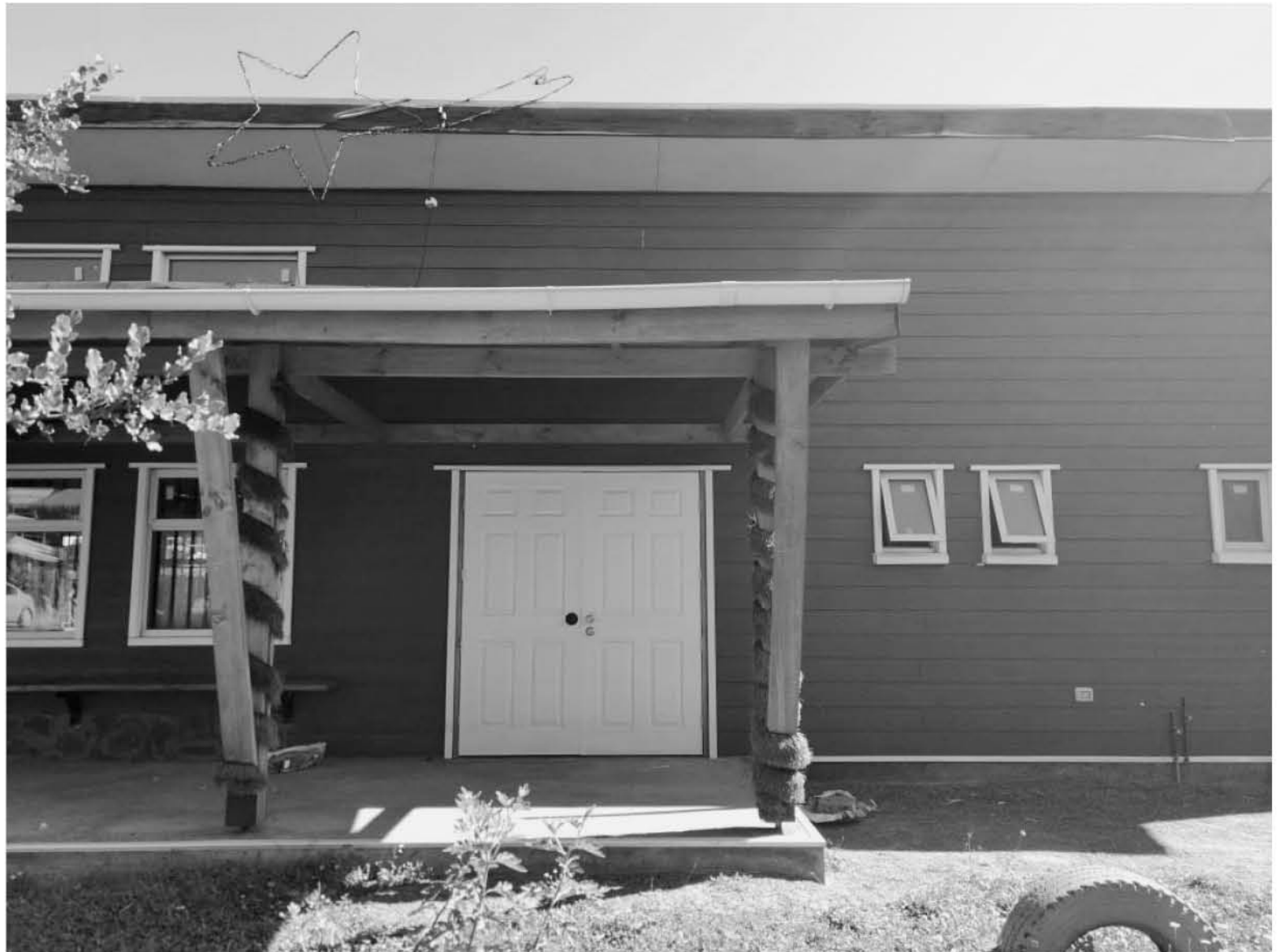
SEGÚN MANIFESTARON ciudadanos de esta comuna, este funcionario municipal mantiene antecedentes por otras irregularidades cometidas en su cargo.

En medio de esto, fueron terceros quienes alertaron a Carabineros de esta situación, por lo que se llevó a cabo la detención de este sujeto identificado con las iniciales C.C., mientras que el menor fue trasladado