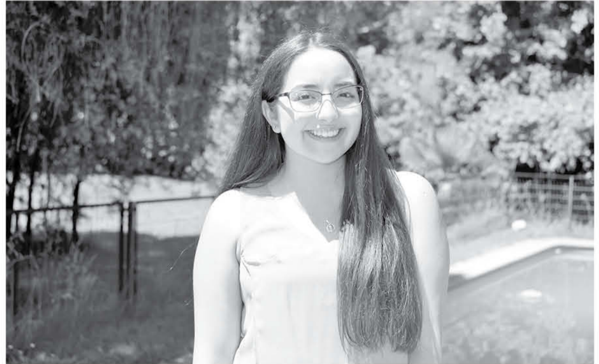
CON TAN SOLO 17 AÑOS, la joven es parte de los 211 estudiantes destacados del país.

La joven de 17 años, quien además egresó con promedio siete de cuarto medio, con este puntaje espera poder estudiar lo que siempre le