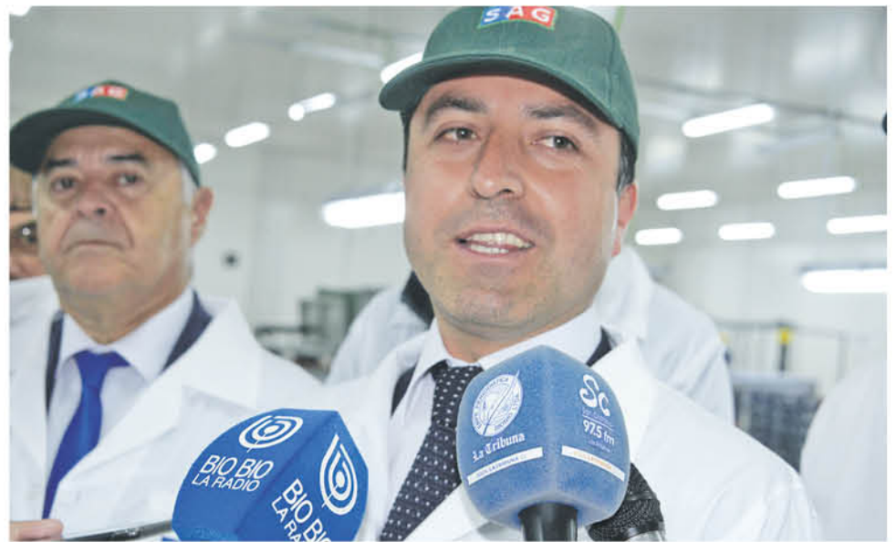
EL ALCALDE APROVECHÓ los medios de comunicación para ejercer presión del proyecto a las autoridades regionales.