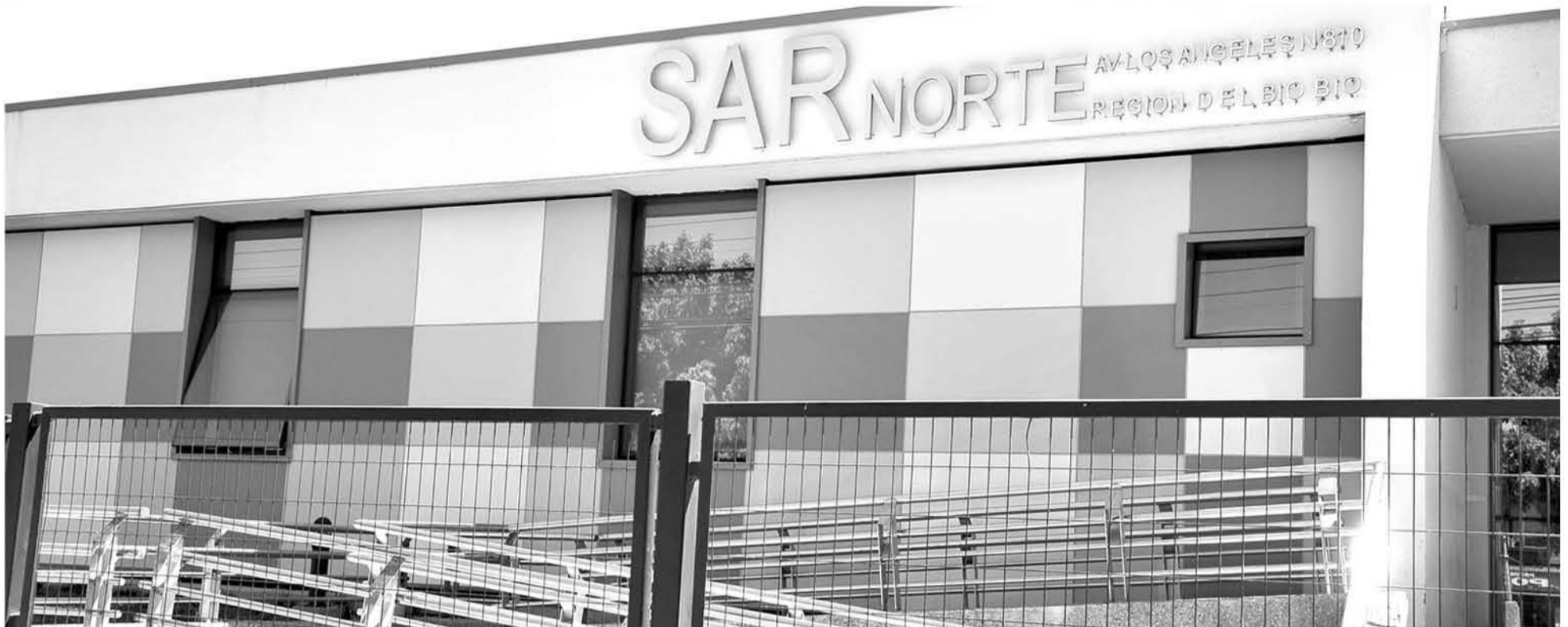
DOS SERVICIOS DE ALTA Resolutividad (SAR), 4 Servicios de Atención Primaria de Urgencia (SAPU) y 1 Servicio de Urgencia Rural (SUR) conforman la red de dispositivos de emergencia.