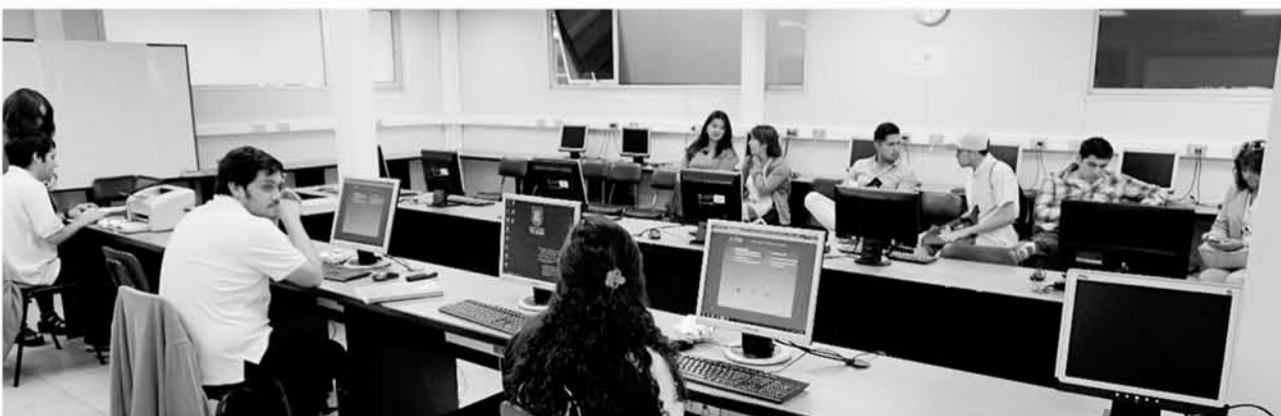
EN EL CAMPUS LOS ÁNGELES de la Universidad de Concepción funcionará a partir de las 9 horas del miércoles 26 de diciembre y las 13:00 horas del domingo 30 de diciembre de 2018 el Centro de Orientación al Postulante.

La instancia funcionará a partir de las 9 horas del miércoles 26 de diciembre y las 13:00 horas del domingo 30 de diciembre de 2018, el Centro de Orientación al Postulante