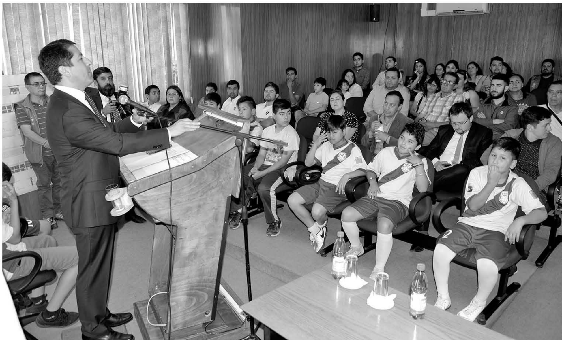
CON LA REMODELACIÓN e inversión de 1.133 millones, el estadio estará dentro de los mejores de la provincia de Biobío.