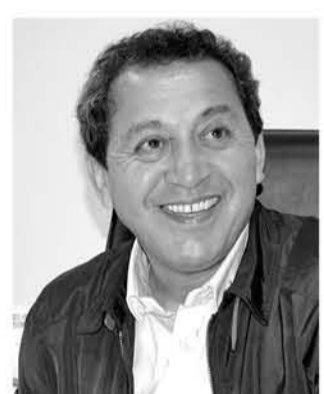
Felipe Harboe Senador

"Que durante esta Navidad nuestra fe se fortalezca y crezca en cada uno de nuestros hogares.