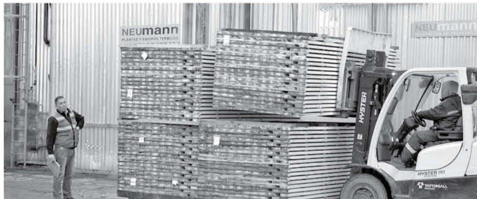
LAS PRINCIPALES INCIDENCIAS del período corresponden a los sectores Industria y Silvoagropecuario, con variaciones interanuales positivas de 45,8% y 60,6%, respectivamente.