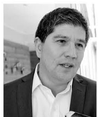
Jaime Veloso Jara Alcalde de Tucapel

"Amigos y amigos de Biobío, espero que en esta Navidad el mejor regalo sea compartir con nuestras familias el verdadero amor. Este debe ser el espacio para la solidaridad, pero también para renovar nuestro compromiso por un territorio cada vez más unido, feliz y en paz. Son mis sinceros deseos para ustedes."