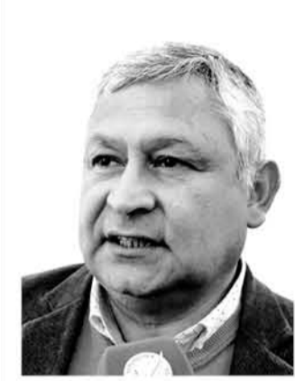
Cristóbal Urruticochea Diputado de la República

"Les saludo con especial afecto a todas las personas de Biobío, para que junto a sus familias en estas fiestas, el nacimiento del niño Jesús llene de amor, fe y esperanza su hogar."