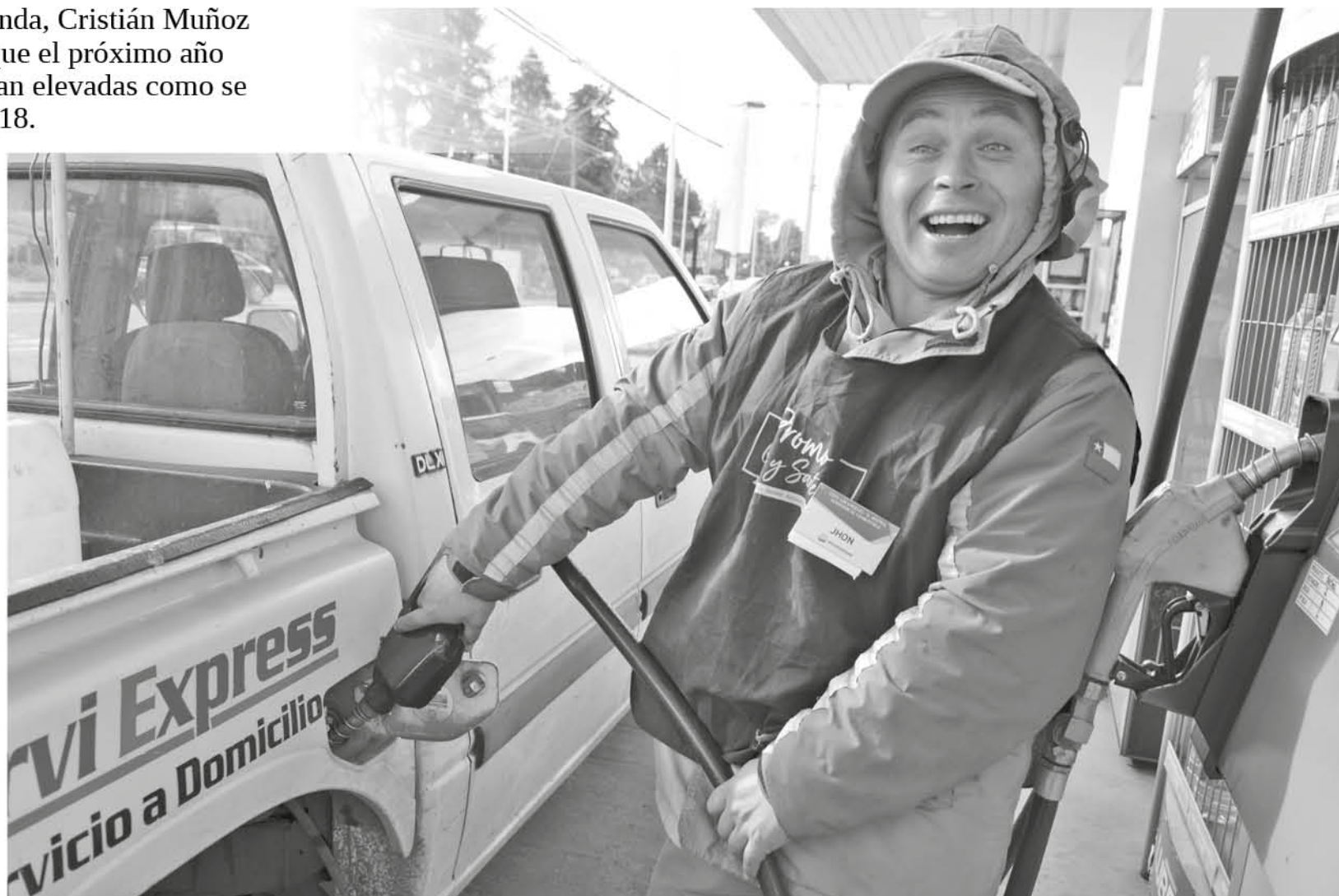
LA GASOLINA de 93 octanos ya bajó de los 800 pesos.