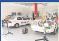
Taller de Mecánica