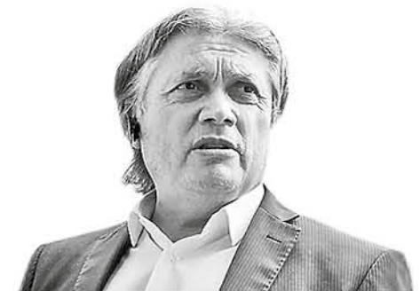
Alejandro Navarro, senador de la República.

Si bien se ha informado que la Conaf contará con 40 aeronaves y 222 brigadas para la temporada de incendios y con 32 vehículos aéreos licitados para este programa, las altas temperaturas asociadas a un 30% de humedad en el ambiente y 30 nudos de velocidad en el viento, podría crear una condición que los expertos consideran extrema, ante la aparición