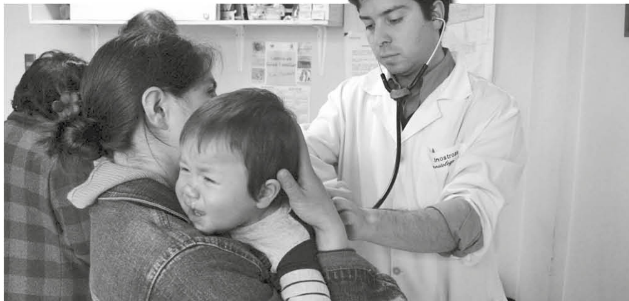
EN LA PROVINCIA DE BIOBÍO se han registrado 200 casos, que corresponden a una tasa de 50,1 casos por cada 100 mil habitantes.

“La provincia del Biobío presenta 200 casos, que corresponden al 12,5% de los casos de la región, siendo su registro más bajo que las comunas bajo jurisdicción del Servicio de Salud Concepción y Talcahuano, pero más alto que la recientemente creada