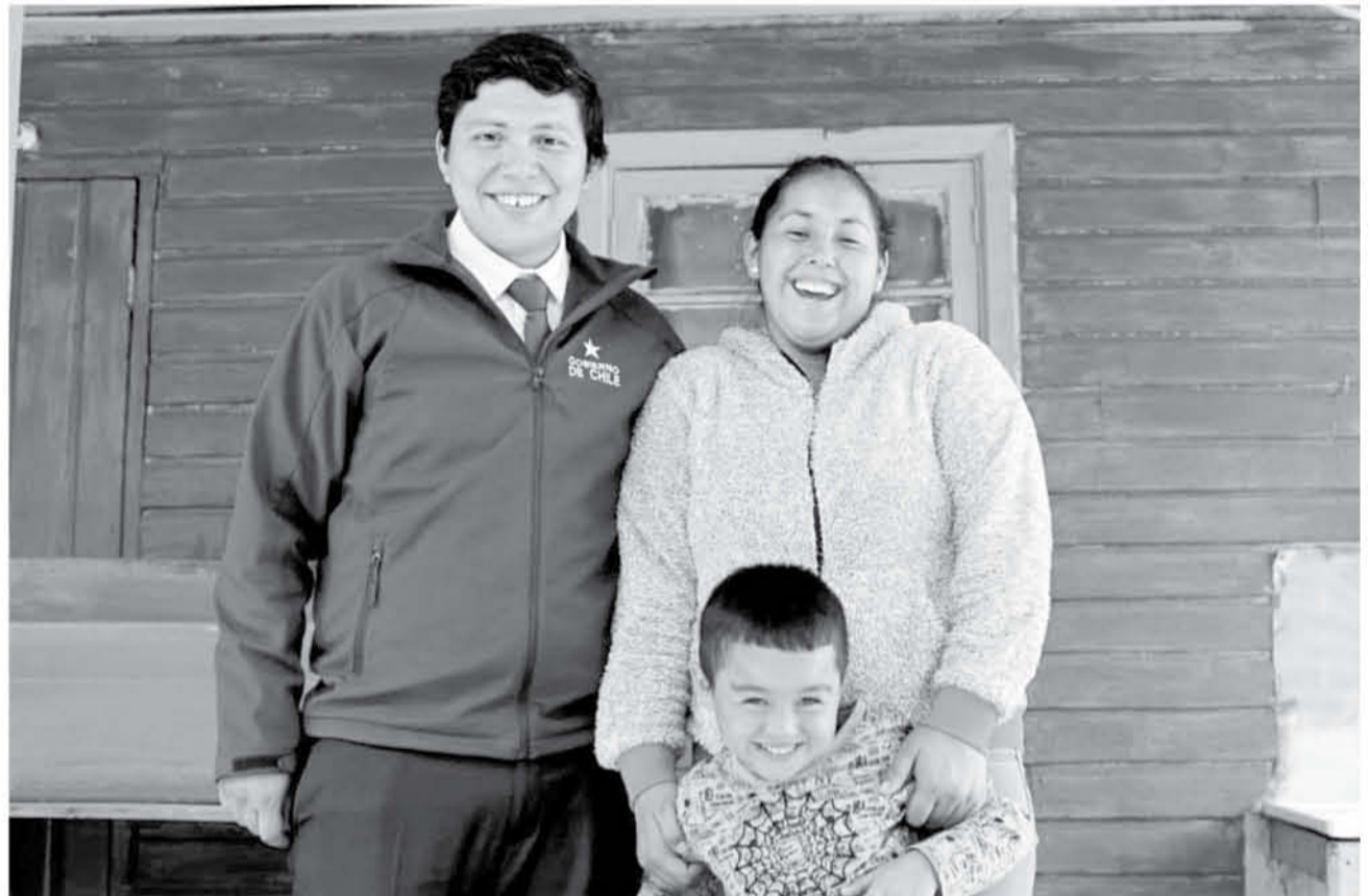
EL GOBERNADOR Ignacio Fica llegó hasta la puerta de la vivienda que habita Scarlett para darle la mejor noticia: ya tiene su casa nueva.

Muy emocionada, Scarlett relató que su pequeño Máximo tiene apenas 5 años. “No ha sido fácil” comentó con la voz quebrada. “He tenido algunos apoyos de