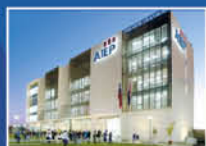
AIEP San Joaquín