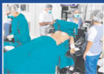
Pabellones de Práctica