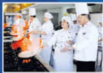
Taller de Gastronomía