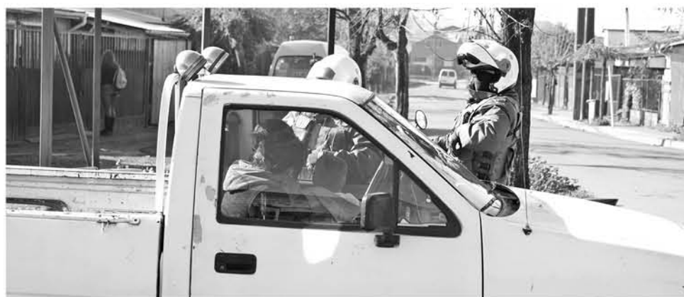
CABE DESTACAR que durante las fiestas navideñas no se registraron acontecimientos mayores.

A menos de una semana de cerrar el año las fiestas marcan la víspera y con ello los excesos, hecho real que exige que las autoridades estén preparadas ante posibles emergencias