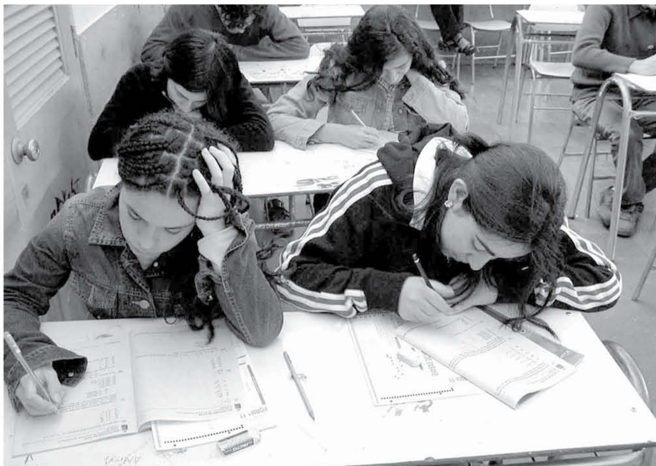
MÁS DE 6 MIL estudiantes rindieron la PSU este 2018 en la provincia.

En entrevista con La Tribuna, los tres destacados jóvenes de la provincia, contaron cómo recibieron la noticia, y la carrera que quieren seguir.