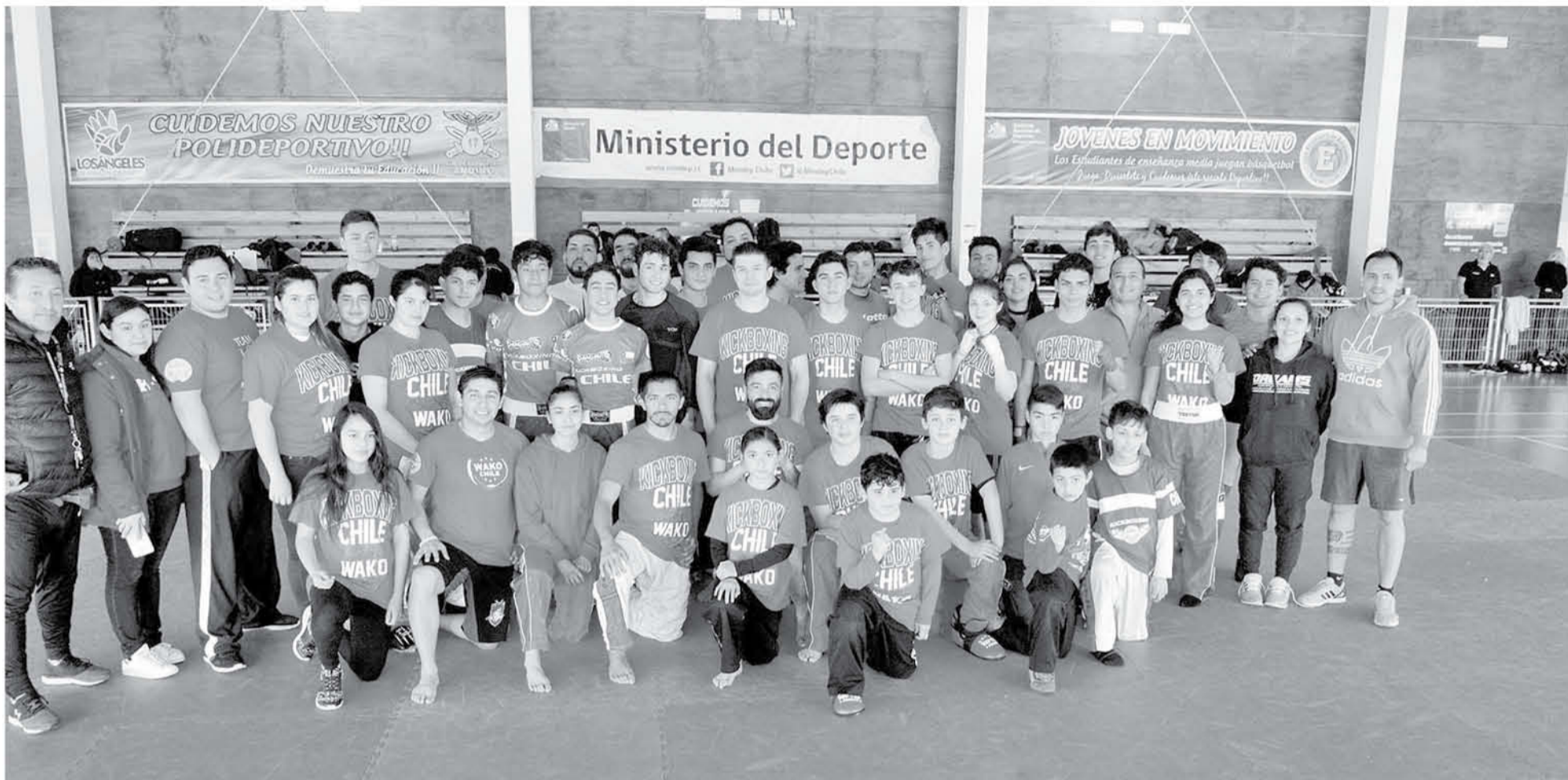
EL INSTRUCTOR ASEVERÓ que su principal objetivo es potenciar a sus alumnos asegurando que “con mi experiencia sé que podemos conseguir más”.