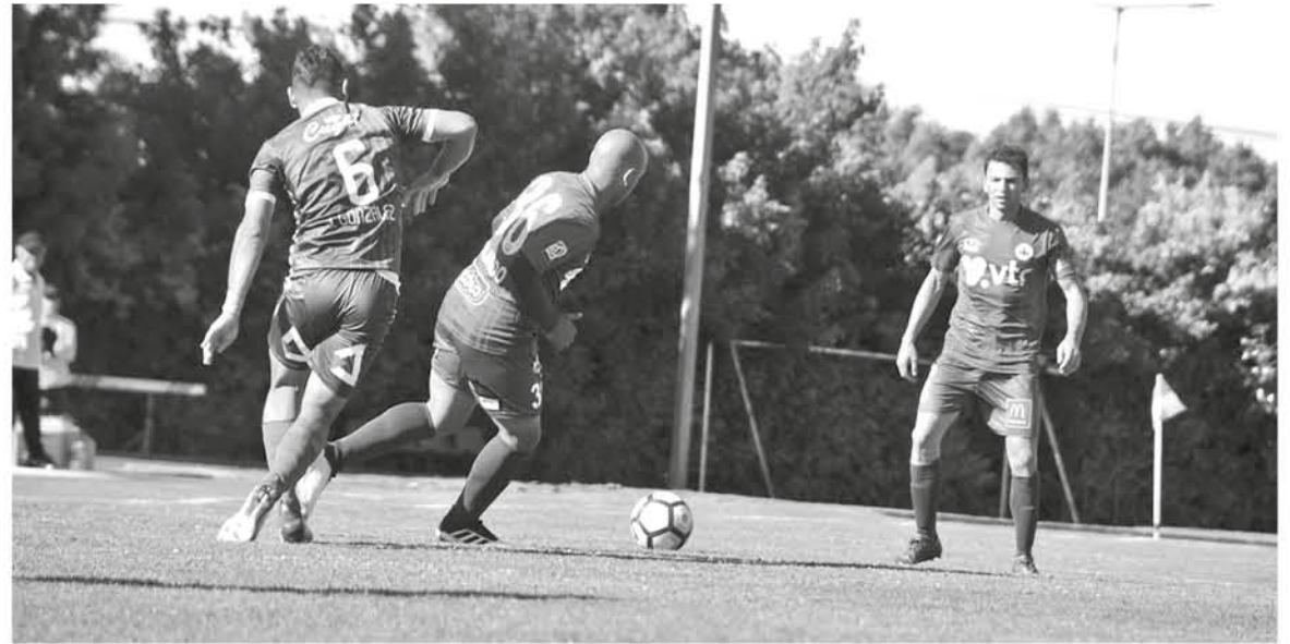
DESDE COMUNICACIONES TAMBIÉN comentaron que podrían enviar a confeccionar una camiseta “B” para la azulgrana.

“Hasta el momento la recepción ha sido excelente, hemos recibido 20 diseños, buenísimos algunos”, aseguraron desde las comunicaciones azulgrana.