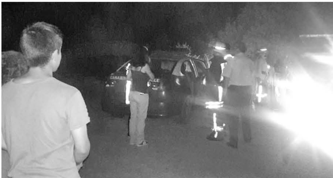
PERSONAL DE BOMBEROS TRABAJÓ por más de dos horas en este procedimiento para rescatar desde el otro extremo del río a los afectados.

Hay que destacar que ambos jóvenes quedaron atrapados en el lecho de este río aproximadamente a unos 10 metros bajo el nivel de rescate, donde no podían avanzar ni retroceder, ya que esto significaba un riesgo para la vida de ambos, puesto que la