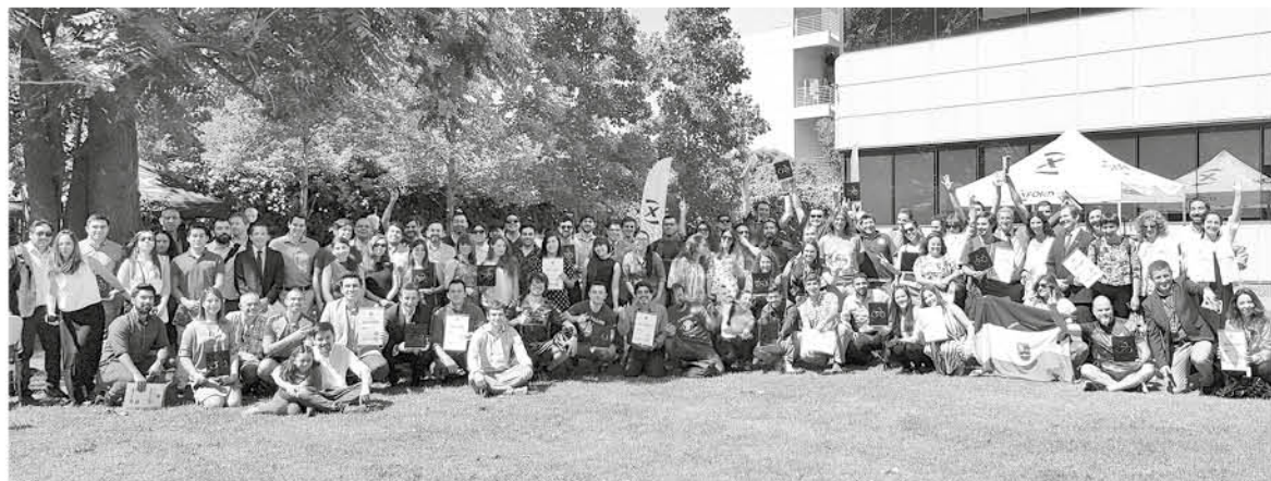
CADA EMPRESA PARTICIPANTE recibió además un completo reporte de impacto ambiental, datos que les permiten visualizar mejor los impactos positivos del uso de la bicicleta en sus trabajadores.