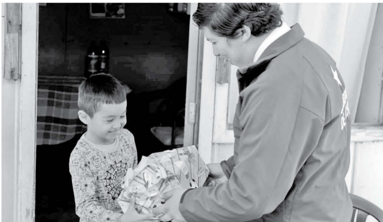
LAS BUENAS NOTICIAS durante la Navidad se transforman en verdaderos milagros.

triste pero fue parte de su vida, que es parte de la historia que dejará atrás una vez que cruce el umbral de la casa. Su casa.