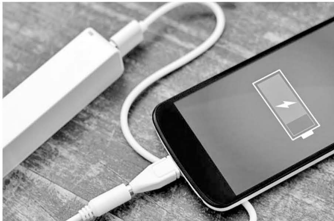
SE TRABAJA para crear nuevo prototipo de batería.

Ni que decir tiene ya que hay muchas empresas y startups enfocadas a investigar las baterías. El silicio es uno de los materiales con los que