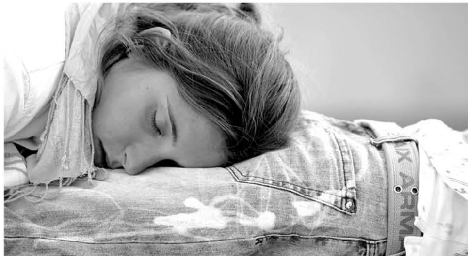
Actualmente dormimos unas 6 horas y media frente a las 9 horas de sueño de los años 70 del pasado siglo.

En este estudio realizado junto con los investigadores Richa Saxena y Frank Scheer de la Universidad de Harvard, para el que se están reclutando mil personas que cenar tarde, “estamos observando que la genética juega un papel crucial en el efecto de la cena tardía sobre nuestro metabolismo”, concluye la experta.