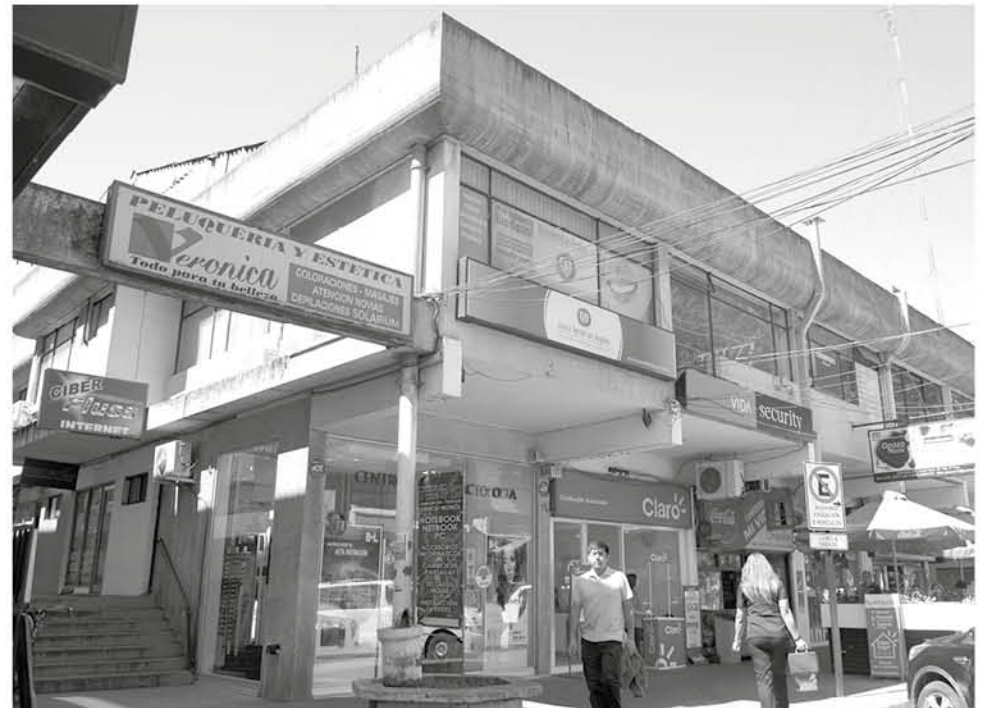
EL BANCO DE CONCEPCIÓN vendió departamentos a los cuales le faltaba pintura y estaban sin terminar, pero de todas formas se podían habitar.

El espacio urbano delimitado por calles Colo Colo, Colón, Valdivia y Rengo, en un principio aspiró estar unido entre sí y hasta peatonalmente con la plaza.