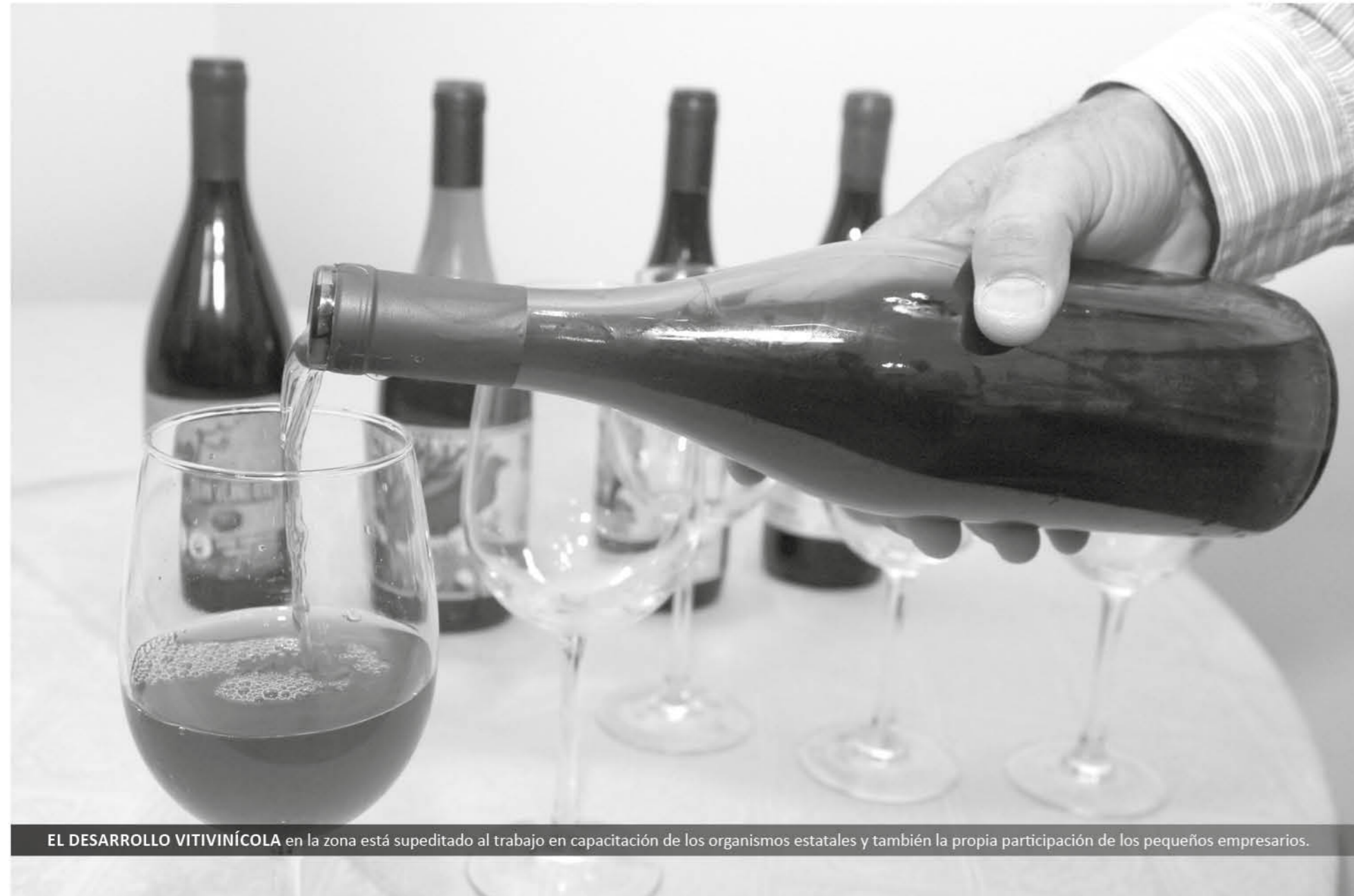
EL DESARROLLO VITIVINÍCOLA en la zona está supeditado al trabajo en capacitación de los organismos estatales y también la propia participación de los pequeños empresarios.