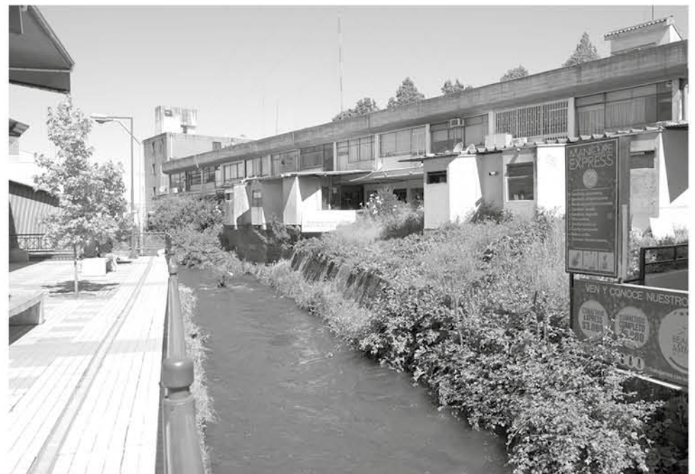
EL ESTERO QUILQUE desde un principio pretendió tener un puente que le conectara con la Galería España.