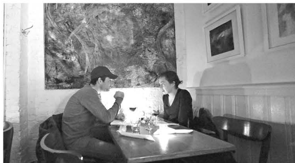
Los investigadores relacionan las horas en las que comemos con problemas metabólicos y obesidad.

“Un ritmo diario amplio, que sube y baja, es un ritmo saludable y se asocia a menos obesidad y a más salud. Pero hemos observado que ese ritmo se aplana, disminuye, se estropea al dormir poco o cuando nos acostamos muy tarde”, apunta Garaulet, quien concluye: “Aquellos que duermen nueve