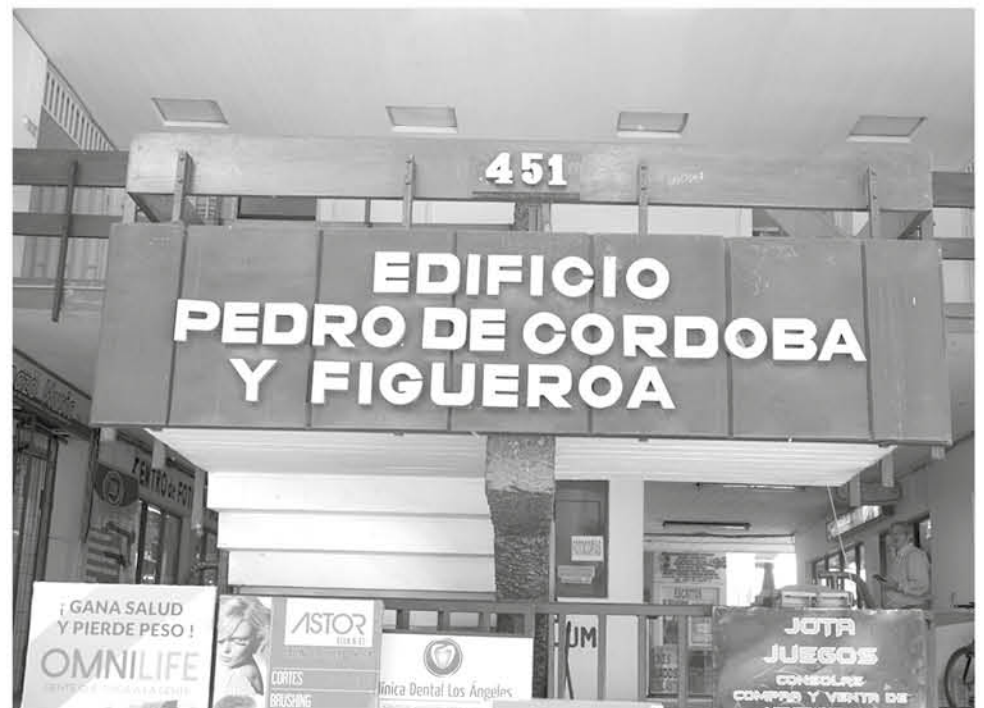
EL ARQUITECTO ANGELINO comentó que compró su oficina en el edificio Pedro de Córdoba Figueroa en 1977.