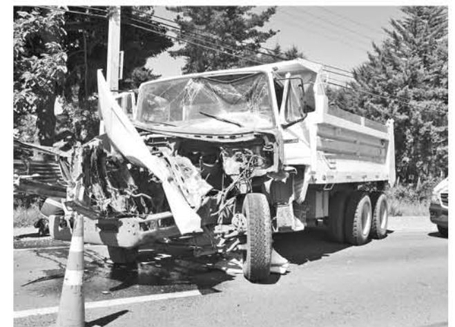
POR EL MOMENTO SE INVESTIGAN las causas de esta colisión que terminó con considerables daños para los conductores.

Al respecto del conductor lesionado -quien manejaba un camión con arena-, este fue rescatado del vehículo por los mismos transeúntes—hecho que se debe realizar según explicaciones de Bomberos-, “sin embargo posterior a ello se continuó con el procedi-