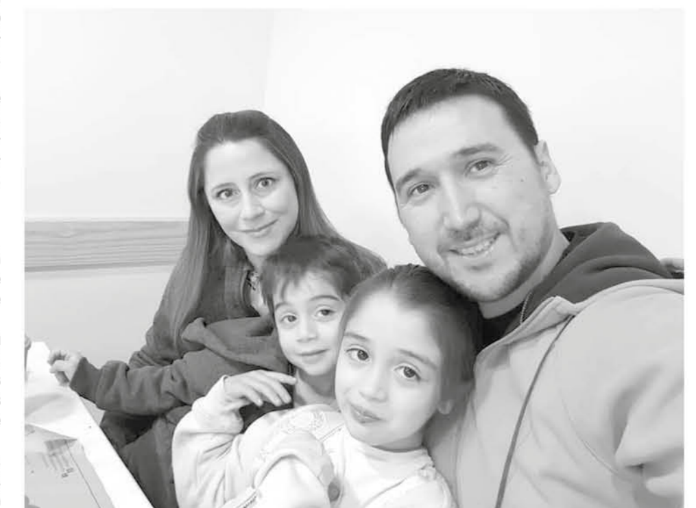
PESE A QUE HA TENIDO que cambiar estudios por vacaciones siempre tiene tiempo para su familia.

Para finalizar, comentó que sus pasatiempos junto a sus actividades en su tiempo libre son ir al cine, salir a bailar y compartir con amigos, pero el fútbol puntualizó que es una de sus grandes pasiones.