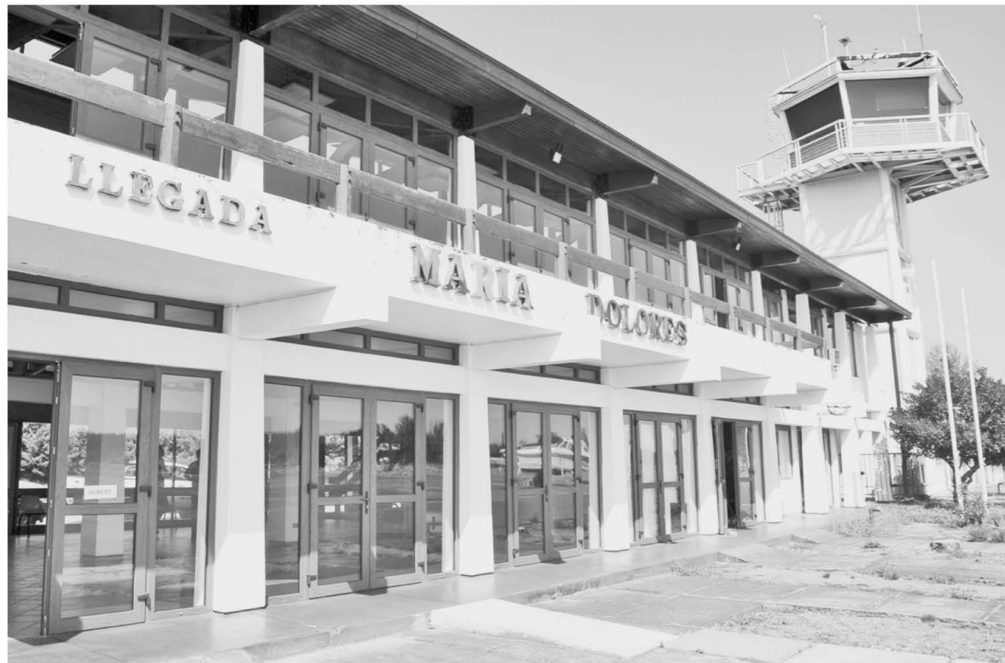
EL AEROPUERTO se mantiene aún a la espera de un proyecto.

Gremios locales de la zona se mostraron disconformes con la demora en los avances de la iniciativa que según los dichos del propio seremi del MOP no están contemplados en ningún presupuesto a corto plazo.