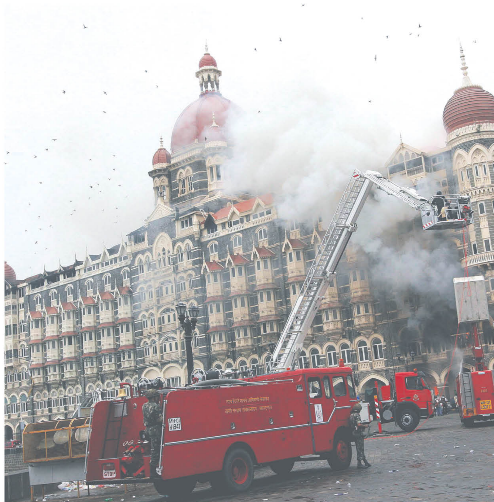
BOMBAY (INDIA) 29.11.08.- Bomberos indios apagan el fuego del hotel Taj Mahal mientras continúan los disparos entre los terroristas y los miembros del cuerpo de seguridad en Bombay, India.

"No puedes llegar allí y comenzar a disparar", defendió.