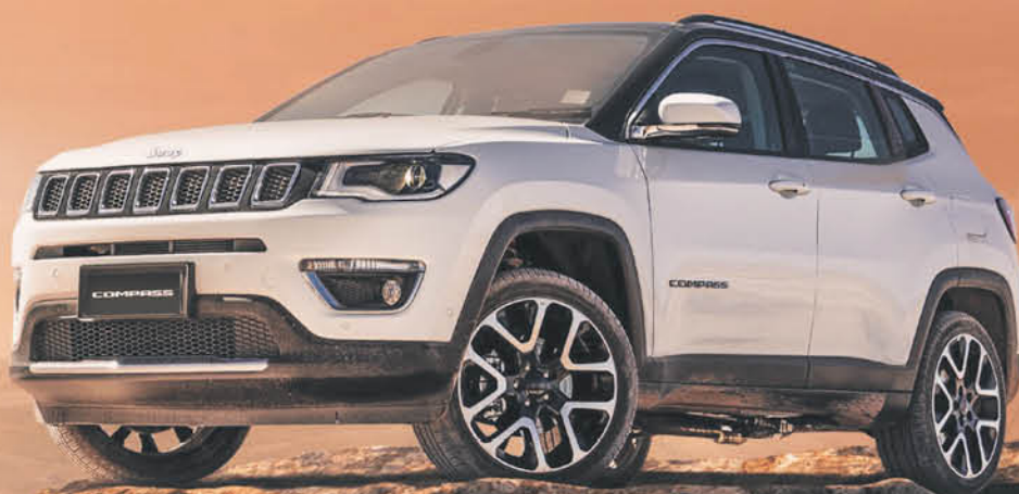
Fotografía corresponde a Jeep Compass Limited. Precio lista $26.990.000