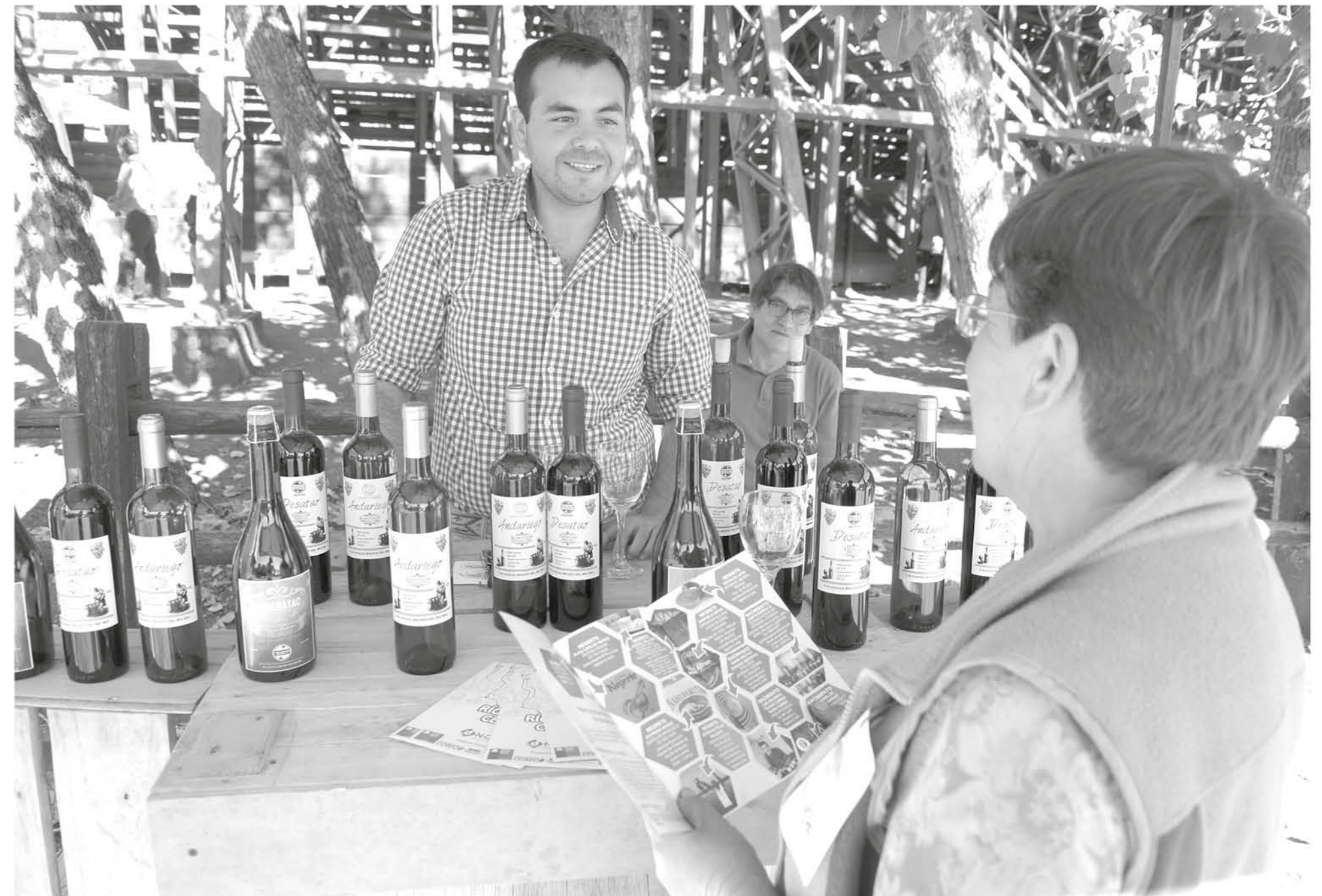
CAVAS LADERAS DEL BÍO BÍO es una empresa familiar que produce vinos, sangrías y espumantes con cepajes del Gran Valle del Bío Bío con vides de más de 150 años de antigüedad.

El portal web "biobío indómito" es un operador turístico que abarca diversas rutas de entretenimiento entre las comunas de Nacimiento, Negrete, Laja y Los Ángeles, en las que aparecen los vinos centenarios. Allí se pueden ver dos viñas