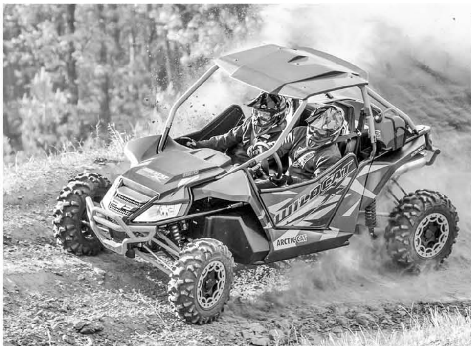
LA ORGANIZACIÓN SEGUIRÁ DESARROLLANDO estos eventos extremos similares al Nitro Circus en Estados Unidos.

Este será el segundo evento de la temporada Rider Attack donde tendrán protagonismo las poderosas ATV y UTV coloquialmente conocidas como Cuadrimotos y Boggis.