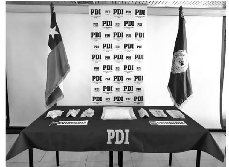
LA BRIGADA ANTINARCÓTICOS informó que los hombres detenidos trasladaban la droga dentro de un taxi.

Dentro de los detenidos de 42 y 26 años, uno de ellos presentaba antecedentes delictuales y fueron puestos a disposición del Juzgado de Garantía de Nacimiento para el respectivo control de detención.