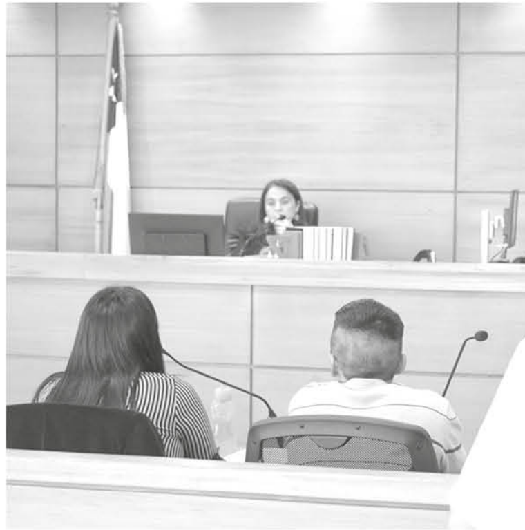
EL SOSPECHOSO FUE LIBERADO la tarde del martes tras pasar un día de medida cautelar.

A demás de esto, el fiscal Vargas expuso que "en esta etapa procesal nosotros estamos convencidos que al autor hay que formalizarlo de