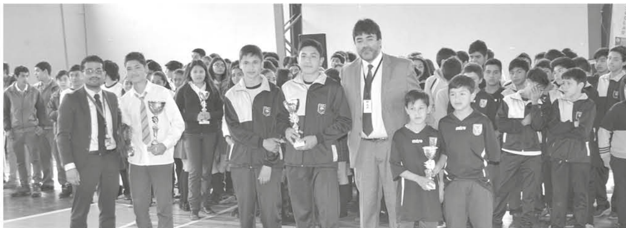
EN LOS JUEGOS DEPORTIVOS Escolares hay etapa comunal, provincial, regional y nacional que comenzarán el próximo año.

Ahora los jóvenes deberán entrenar para la convocatoria que se realiza a través del Fondo Nacional de Desarrollo Regional de carácter Deportivo de Gore Biobío.