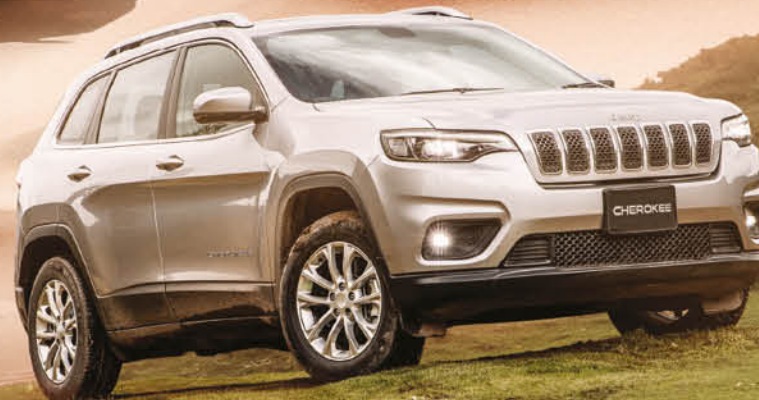
ALL NEW JEEP CHEROKEE DESDE