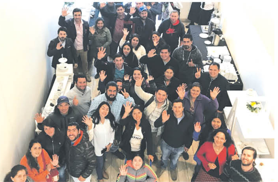
EN LA OCASIÓN se dieron a conocer experiencias exitosas de jóvenes productores agrícolas, quienes con el apoyo de Indap han logrado sacar adelante iniciativas.

que "sin duda lo más relevante de este primer encuentro fue poder conformar la Mesa Regional de Jóvenes Rurales, porque es una instancia que les permite conocerse, formar redes y relacionarse con Indap y otras instituciones de fomento productivo".