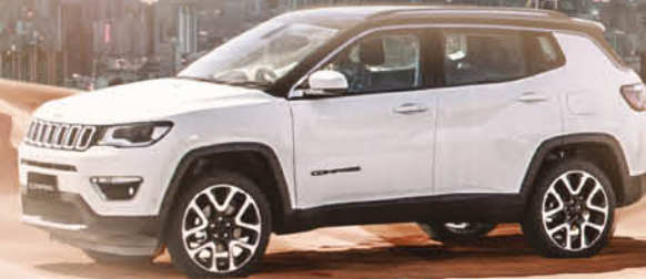
ALL NEW JEEP COMPASS AHORA DESDE