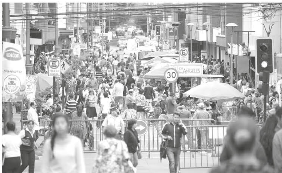
CON ESTO SE OBSERVA un aumento en la tendencia, donde la población está optando por una cultura de guardar dinero principalmente para cubrir emergencias o imprevistos.

El 65% de este ahorro, se realiza a través de depósitos a plazo, el 25% en depósitos a la vista y solamente el 10% en cuentas individuales.