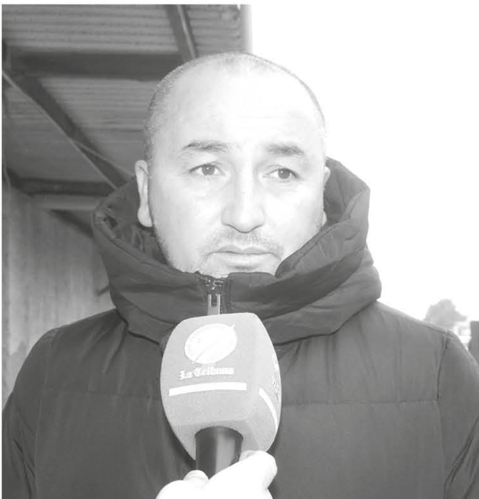
LA DIRECTIVA AZULGRANA se reunirá finalizada la liguilla para comenzar a barajar el nombre del nuevo estratega y plantel.