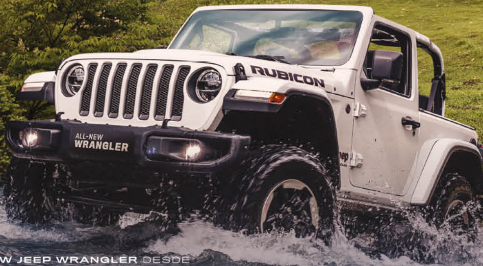
ALL-NEW JEEP WRANGLER DESDE