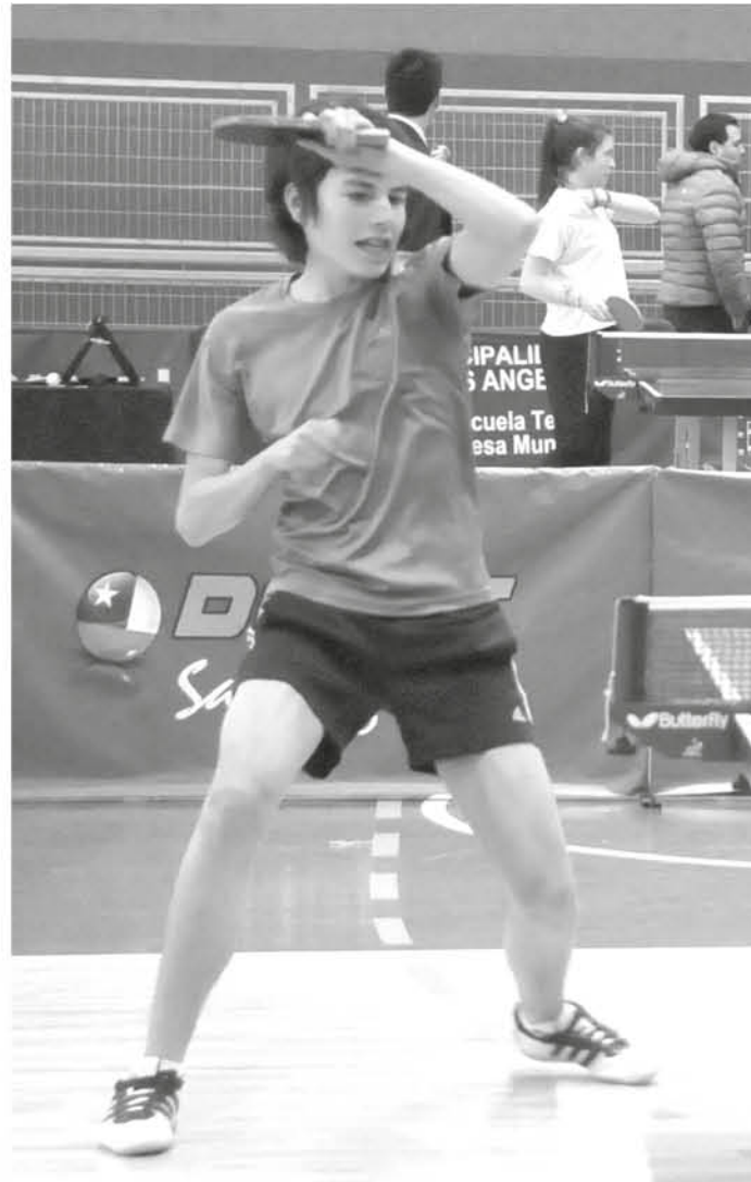
EL CAMPEONATO tiene expectativas más ambiciosas y espera crecer para unir más regiones a su convocatoria.

El evento que congrega a diversas instituciones educativas comunales, provinciales y regionales será de entrada liberada y los que deseen inscribirse para medirse frente a sus similares, deberán llegar a las 9:00 de la mañana mientras se realiza la ceremonia para dar comienzo al campeonato a las 10:00 horas.