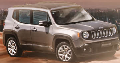
NEW JEEP RENEGADE AHORA DESDE