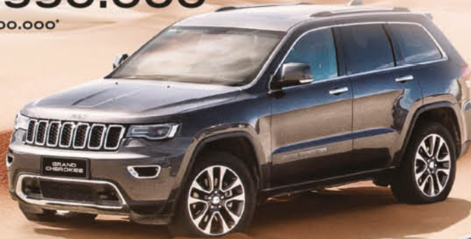
JEEP GRAND CHEROKEE DESDE