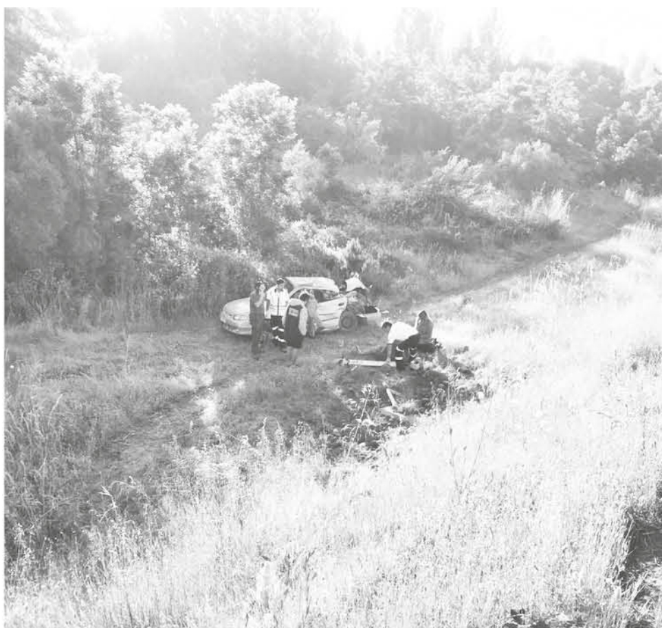
A LA HORA DEL INCIDENTE el conductor del minibús se trasladaba sin pasajeros.

En tanto el incidente está siendo investigado por Carabineros para corroborar la responsabilidad de los involucrados en el suceso.