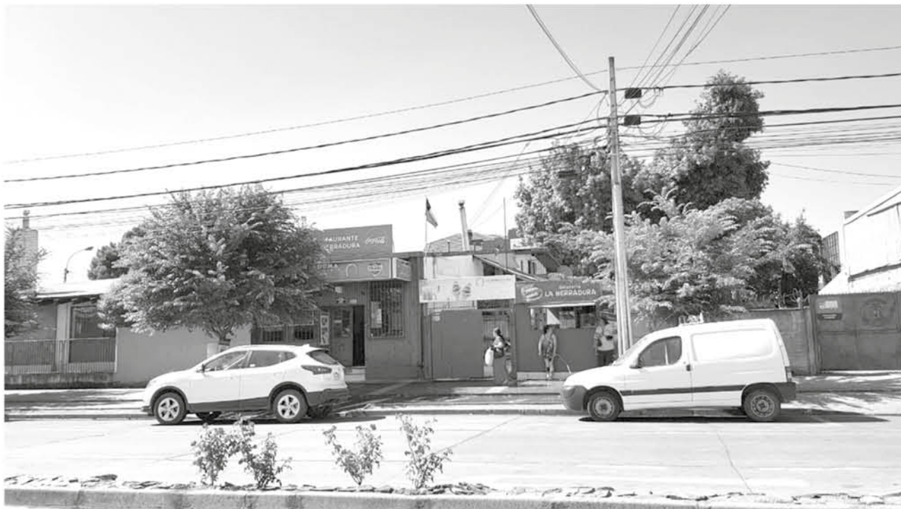
AMBOS MENORES quedaron a disposición de la fiscalía.

Ambos implicados de tan sólo 15 años fueron descubiertos por personal de la SIP de Carabineros cuando ingresaban a este negocio.