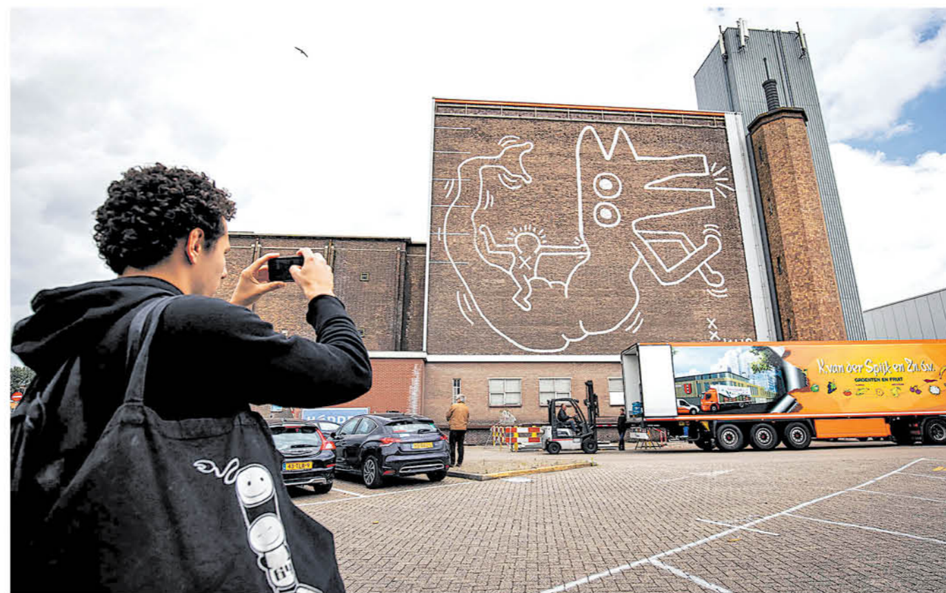
VISTA DEL ENORME MURAL pintado por el artista estadounidense Keith Haring en 1986 en la pared del antiguo depósito del Stedelijk Museum Amsterdam, en Amsterdam, Países Bajos.

"Obviamente el trabajo hay que pagarlo, sino solo tendrías vandalismo hecho por empleados a media jornada y niños ricos", dijo el artista. "Pero es complicado, cuando sacas provecho de una imagen que has puesto en la pared, mágicamente se transforma en publicidad. Si el grafiti no es criminal, pierde casi toda su inocencia", añadía.