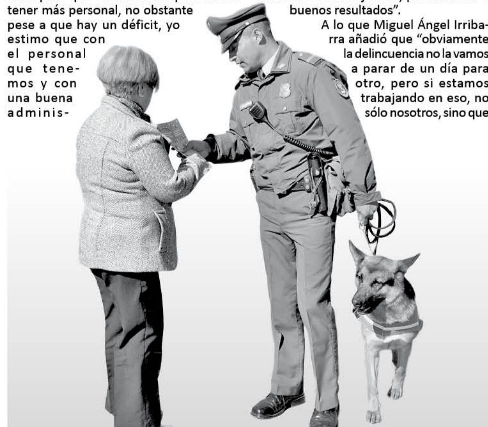
LA CERCANÍA CON LOS VECINOS, también ha sido de suma importancia para el trabajo de disminución de la delincuencia.