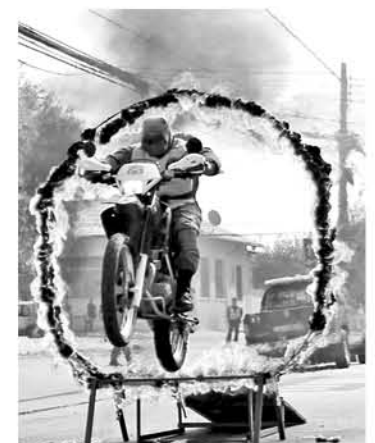
LOS EFECTIVOS DE CARABINEROS también se tomaron fotografías y compartieron con los pequeños de la comuna del santo.

"La actividad fue muy bonita porque le gustó a los niños, también a muchas personas adultas que fueron a ver, por lo tanto, tuvo el impacto que queríamos generar en la comunidad", aseguó el capitán.