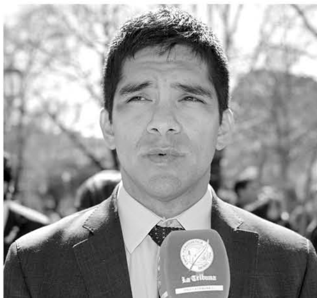
EL SEREMI DE DEPORTES Juan Pablo Sporer dijo que se destinan 200 millones de pesos al año a deportistas destacados.

Las federaciones presentan un plan de trabajo y el ministerio presenta recursos para que ellos puedan llevar a cabo este plan de trabajo y apoyar a sus competencias federación.