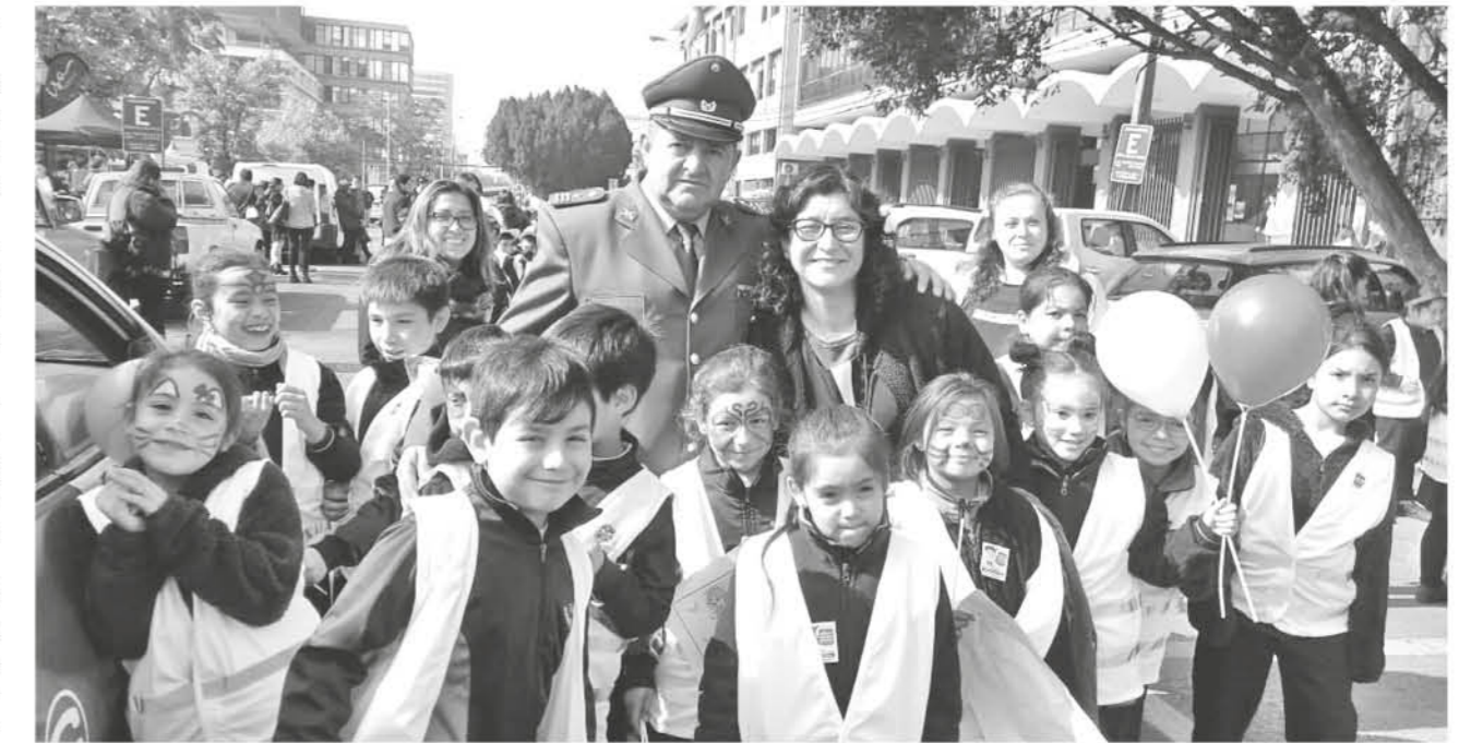
LA COMUNIDAD le tiene mucha estima al oficial y es conocido y querido en la provincia de Biobío.

Entre lo malo destacó la muerte de personas en