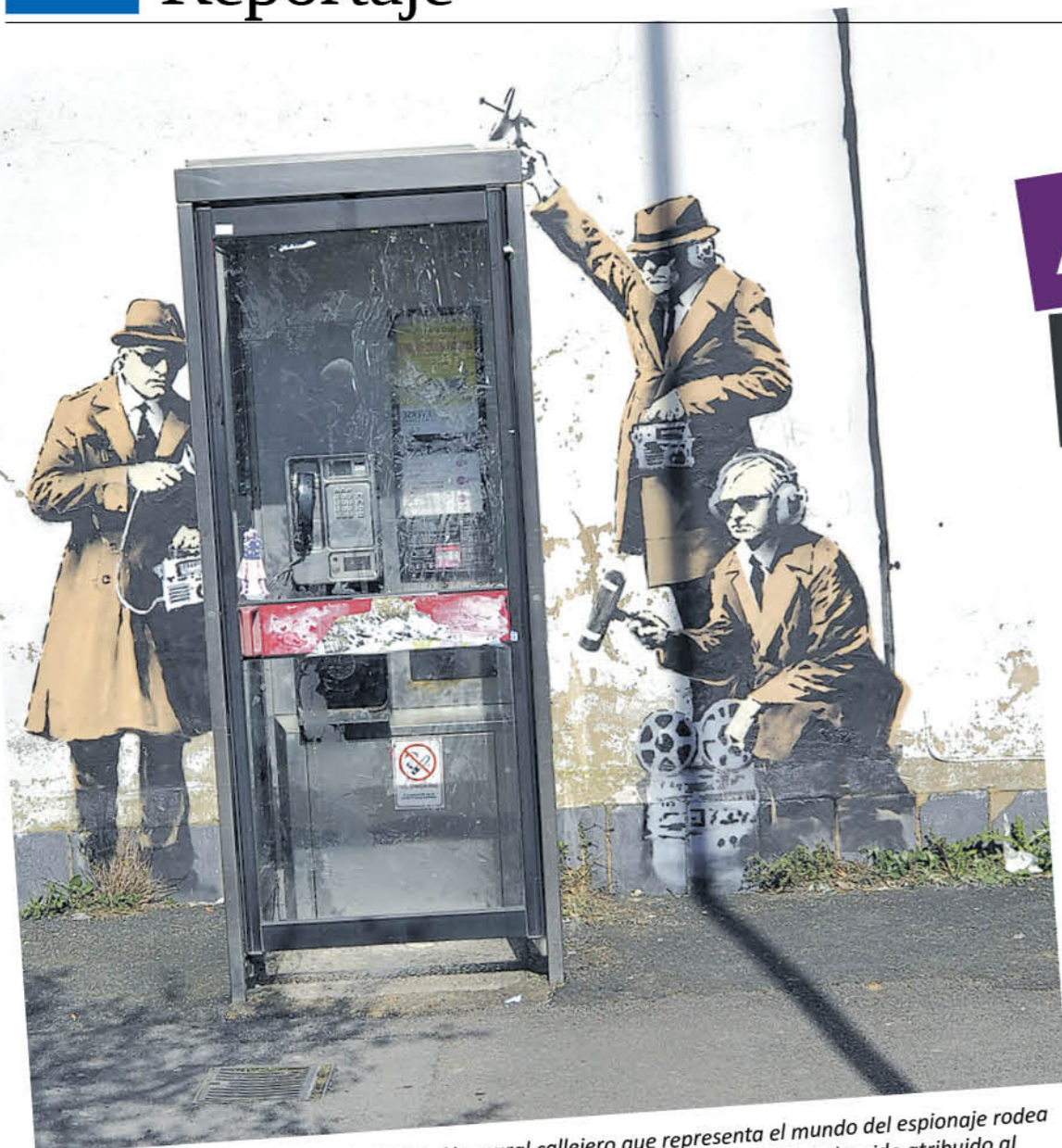
CHELTHENHAM (REINO UNIDO) 15/04/2014.- Un mural callejero que representa el mundo del espionaje rodea una cabina telefónica en una calle residencial de Cheltenham (Reino Unido). El dibujo ha sido atribuido al artista Banksy. El mural muestra a tres hombres vestidos con gabardinas y sombreros, el típico perfil del espía de los pasados años cincuenta, junto a una cabina de la compañía de telecomunicaciones BT y portando unos cables con los que intentan escuchar una conversación telefónica.

Democratizar el arte. Usarlo como arma. Despojarlo del privilegio de unos pocos para convertirlo en el derecho de muchos. Estas son algunas premisas de las que parte la expresión artística calificada como "urbana". Comenzó como acciones clandestinas enraizadas en guerrillas contraculturales y reivindicativas en los sesenta y se popularizó en los setenta y los ochenta. En la actualidad, los artistas urbanos son reconocidos y venerados.