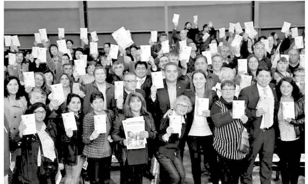
LA GUÍA LA RECIBIERON los dirigentes vecinales representantes de las catorce comunas de la Provincia de Biobío.

Del mismo modo, el gobernador de la provincia de Biobío, Ignacio Fica, enfatizó que “en esta actividad le entregamos a los dirigentes sociales, algo que es una guía, por así decirlo, una guía de oro, porque les indica cuáles son todos los fondos que entrega el Estado a través de sus diferentes organismos y servicios, indicándoles cuáles son las rutas para postular a ellos”.