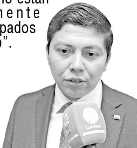
Ignacio Fica, gobernador de la provincia de Biobío.

“Fui testigo de la alegría y la emoción de más de 200 dirigentes sociales de nuestra provincia, que hoy sienten que el Estado y nuestro Gobierno están realmente preocupados por ello”.