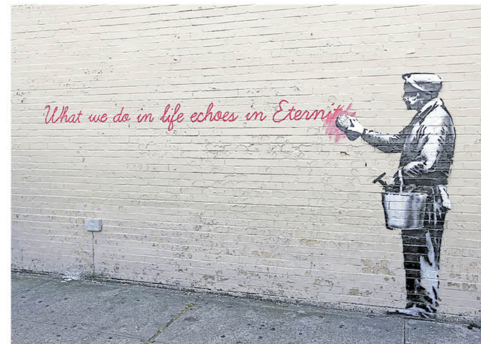
VISTA DE UN GRAFFITI del artista callejero británico "Banksy", en Queens, Nueva York, Estados Unidos, en octubre de 2013.

Por ejemplo, la firma francesa Lacoste acaba de lanzar una colección con los diseños de Haring y otras grandes compañías también usan este tipo de arte en sus campañas de publicidad.