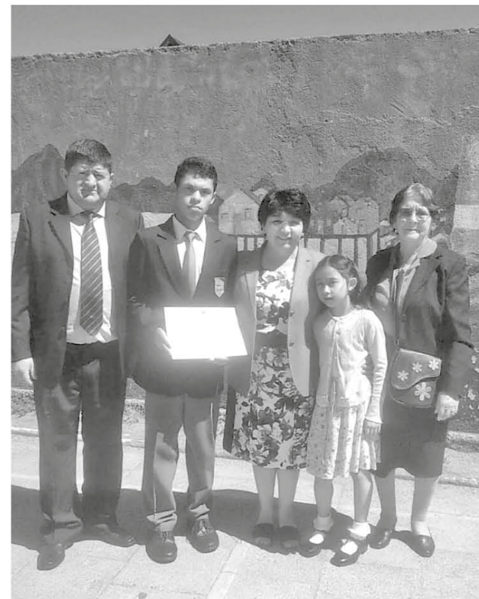
SUS HIJOS estudian en el Colegio San George de Los Ángeles, donde el carabinero ya tiene su vida establecida.