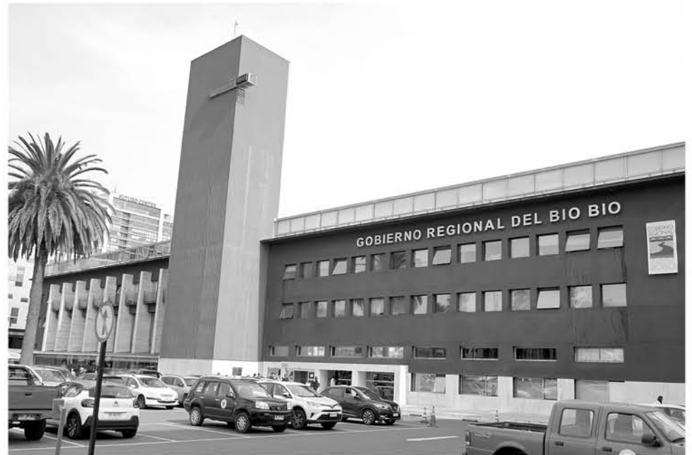
EL GOBIERNO REGIONAL del Biobío es una de las partes de la mesa de financiamiento compartido del deporte.