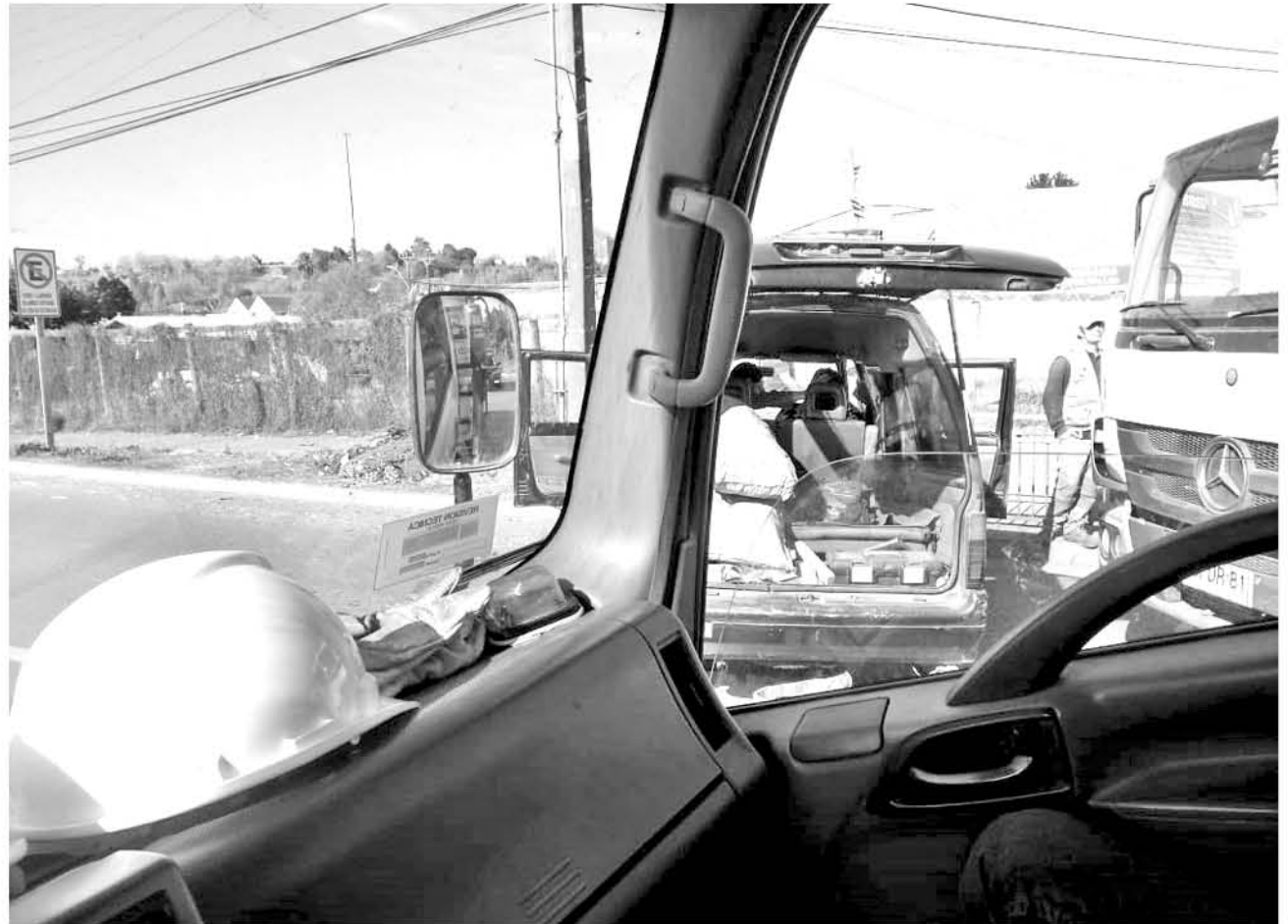
LA COLISIÓN dejó como saldo un hombre con daño en el pulmón.

Respecto a la persona que manejaba el camión fue dejado en libertad, ya que los antecedentes fueron entregados a la Fiscalía de Los Ángeles, indicó el capitán.