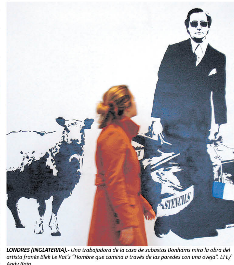
LONDRES (INGLATERRA).- Una trabajadora de la casa de subastas Bonhams mira la obra del artista francés Blek Le Rat's "Hombre que camina a través de las paredes con una oveja".