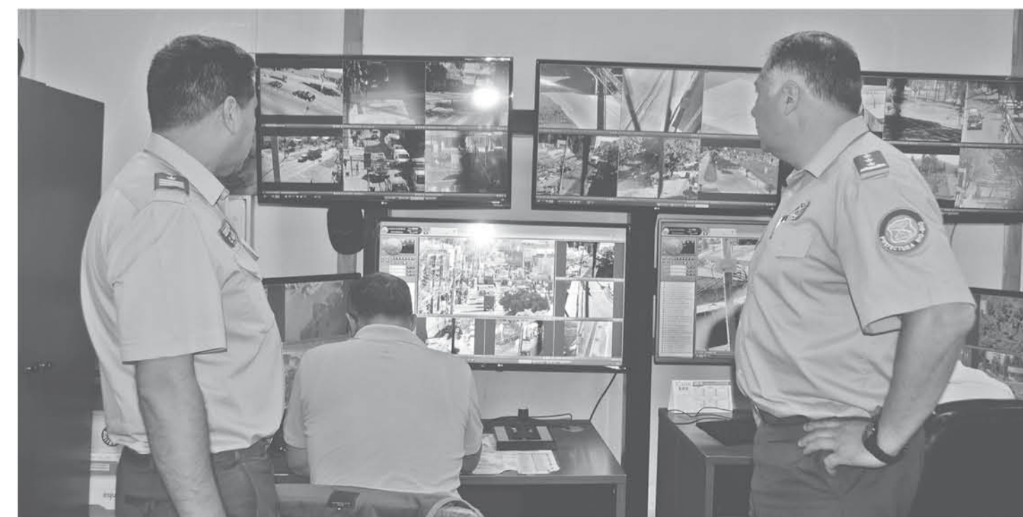
LA TAREA CLARA para el personal de la Prefectura de Biobío es no quedarse estancados e ir mejorando día a día.

Especificando que más que dar algún consejo a la ciudadanía, "son agradecimientos solamente en este nuevo aniversario, y que uno lo siente en todas las actividades que están relacionadas con estos 92 años de vida que tiene Carabineros de Chile. Y que sigan confiando en nosotros, para eso trabajamos, porque a medida que la gente confía en nosotros es más la información que nos llega y es más lo que nosotros podemos hacer en la parte profesional", concluyó el prefecto de Carabineros de Biobío.