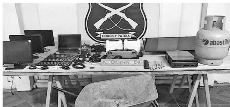
LAS ESPECIES SUSTRÁIDAS fueron avaluadas en más de un millón y medio de pesos.

El imputado fue trasladado hasta la Subcomisaría de Carabineros de Cabrero para continuar con el procedimiento, el que finalmente pasó a control de detención, quedando, esta vez, en prisión preventiva.