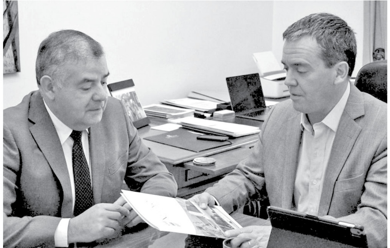
LA REUNIÓN CONCENTRÓ temas de trabajo que son de interés de la comuna de Nacimiento y apuestan por mejorar su calidad de vida.

Finalmente, Felipe Harboe dio a conocer las gestiones ante General Director