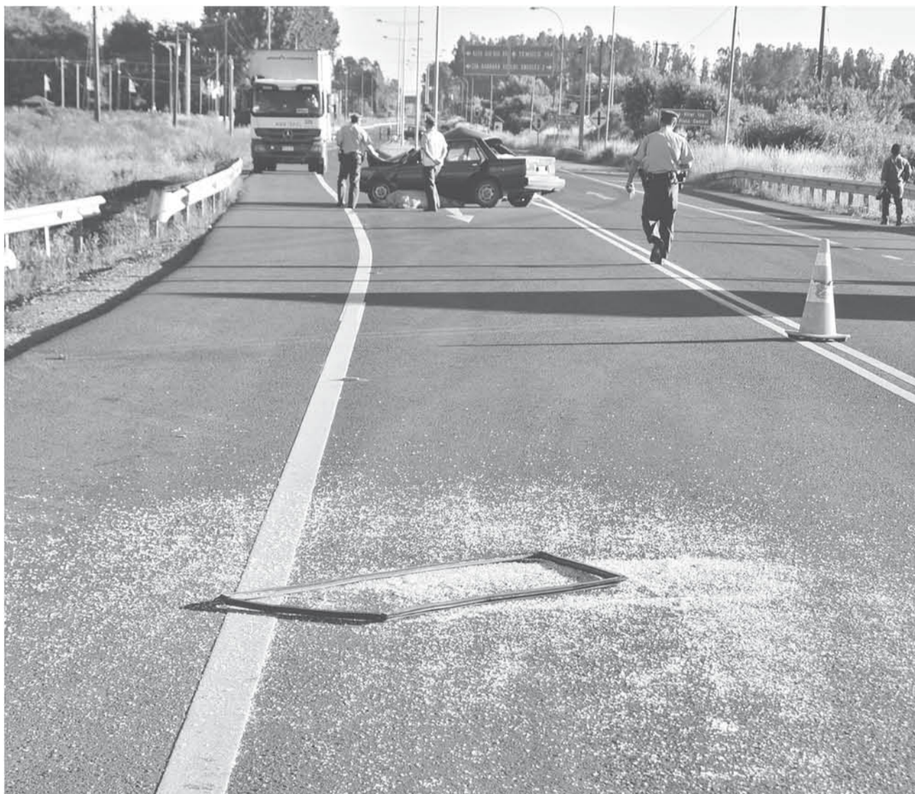
EN MENOS DE UN MES en este punto de la ciudad han fallecido una mujer y dos hombres.

Sobre la realidad de estos hechos, una agrupación que se mantiene al tanto es Aprovat, quienes trabajan con sobrevivientes de estas tragedias o con familiares que atraviesan la pérdida de un ser querido.