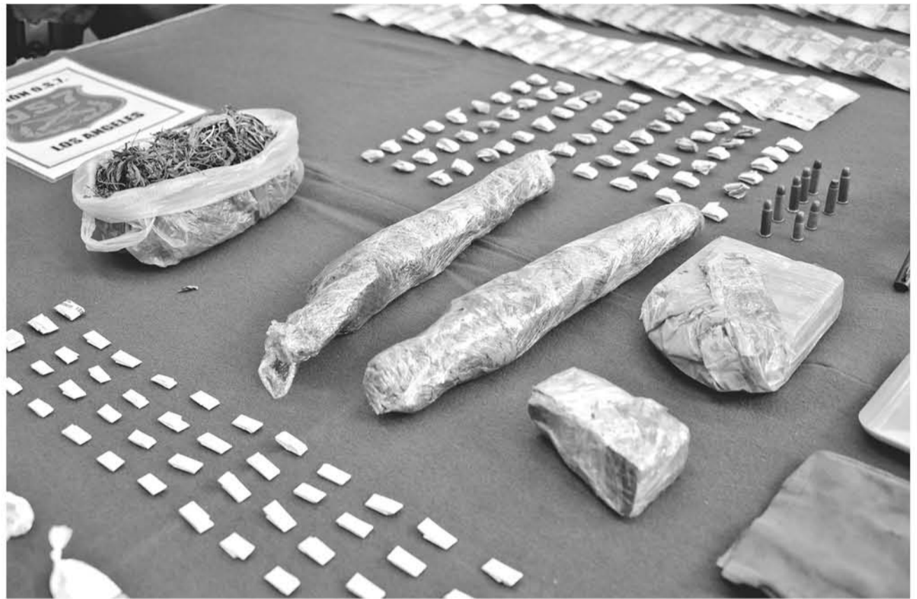
DICHAS CIFRAS CORRESPONDEN sólo al trabajo efectuado por personal del OS7 (foto de contexto).

Sobre la cantidad de decomisos realizados, en este proceso en más detalles, el capitán