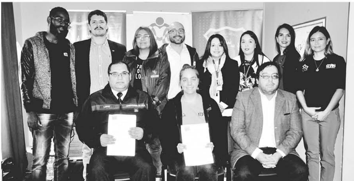
TRAS ESTA FIRMA USUARIOS de diferentes recintos penitenciarios podrían cumplir condena alternativa en este lugar.

Como una manera de contribuir a la comunidad, aquellos usuarios de penas menores va a realizar actividades de colaboración en este centro de apoyo a migrantes.