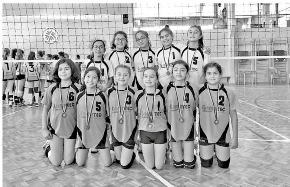
EN LA PRIMERA FECHA de la serie sub 12 Liname, las damas del conjunto obtuvieron el tercer lugar.