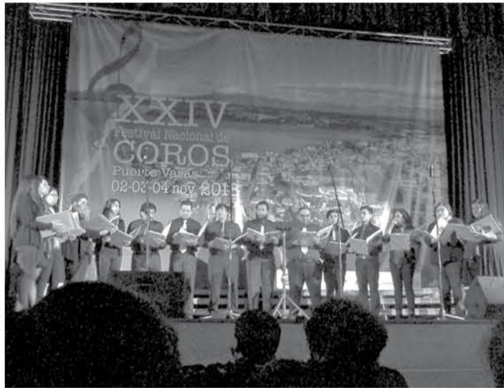
EL CORO ENSEMBLE LUX AETERNA será uno de los números que se presentará esta noche en la Parroquia San Francisco.

Tres coros de excelencia se presentarán esta noche en la Parroquia San Francisco. Destaca el tradicional coro de voces blancas Santa María de Los Ángeles, que tiene más de 40 años de existencia y es uno de los más antiguos del país.