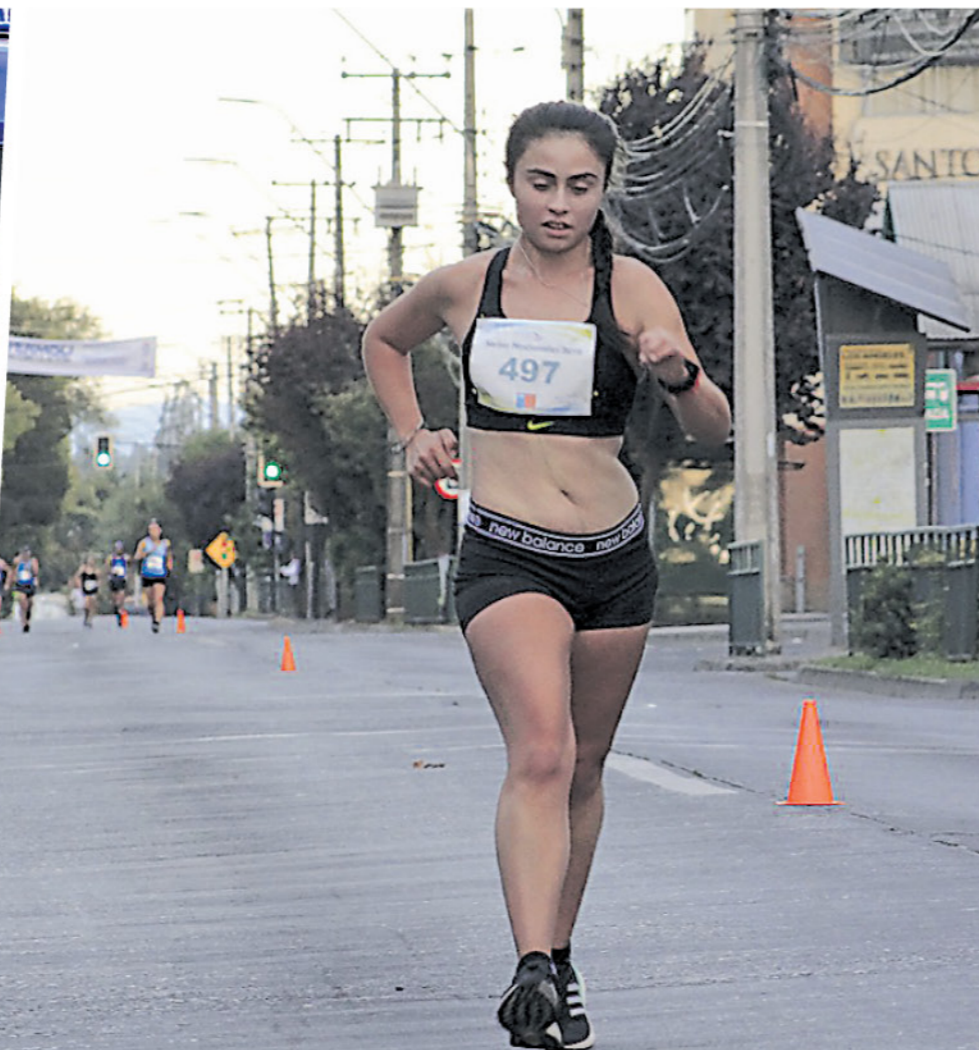
AHORA DEBERÁN HACER frente a los mejores de la región en el campeonato selectivo a fines de abril.