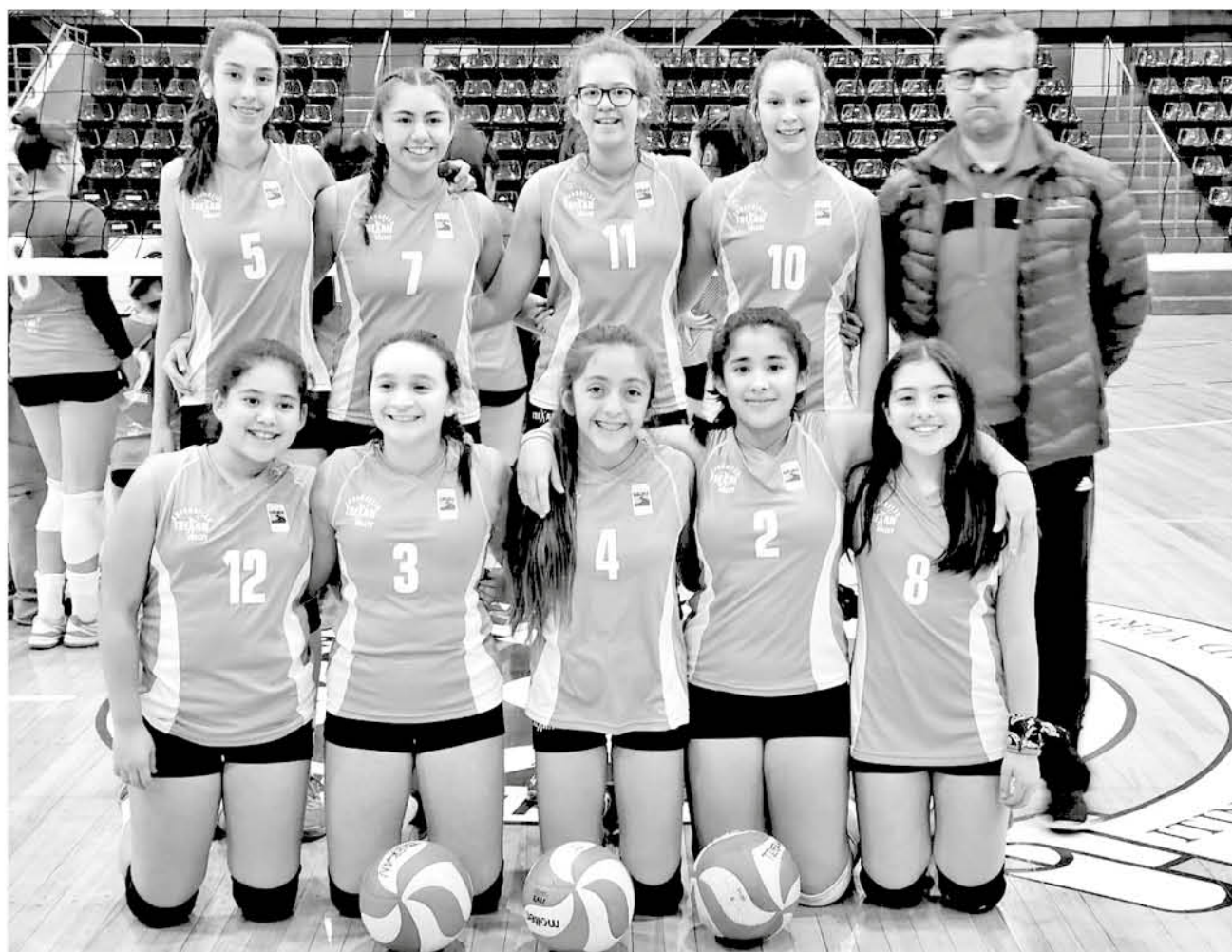
TREKAN SE ENFOCARÁ durante la temporada en ubicarse dentro de los cuatro mejores equipos del país con la sub 14.

El club angelino que compite con todas sus categorías en la máxima convocatoria nacional de la disciplina, logró un acontecimiento histórico fichando en la serie más competitiva.