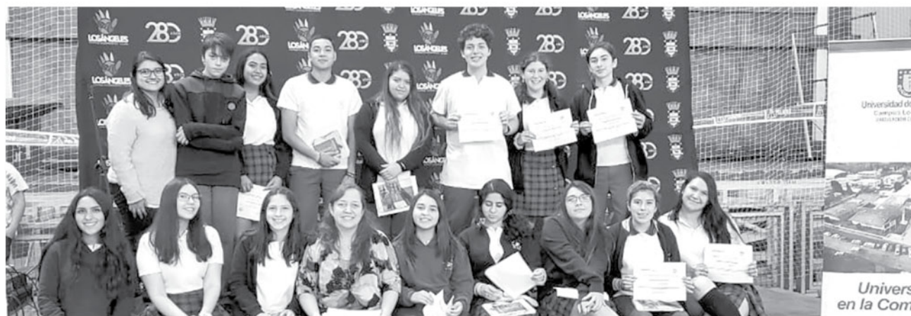
LOS ESTUDIANTES DEJARON a Los Ángeles con el primer lugar en la categoría infantil y juvenil.

“El video tiene relación a la unidad, decena y centena, es decir el valor posicional, y lo grabamos y presentamos, y ahora estamos sorprendidos por lo que hemos obtenido”.