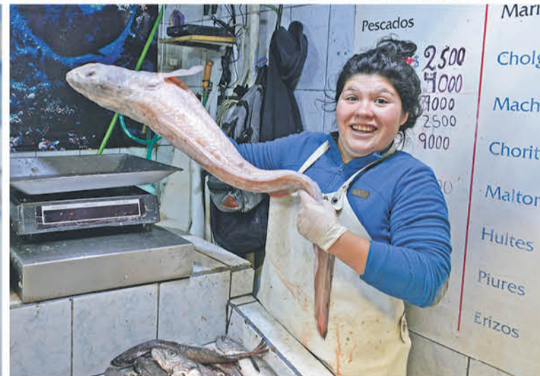
HAY OPTIMISMO entre las comerciantes del Terminal Pesquero de Los Angeles.

Un movimiento ascendente de público se registra en el Terminal Pesquero de Los Angeles de cara al fin de semana santo, que trae consigo un notorio aumento en las ventas de pescados y mariscos.