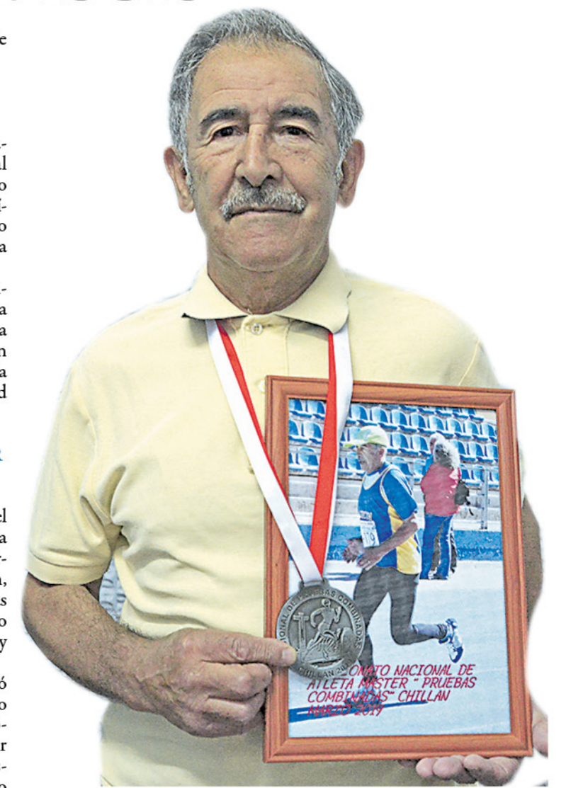
EL ATLETA COMENTÓ que sus carreras favoritas son las de vallas porque "es muy bonito cuando pasa uno, pasa el otro y así sucesivamente".

Para cerrar, el corredor, aseguró que pese a obtener títulos a lo largo de su carrera nacional e internacionalmente, donde ha logrado asistir costeando personalmente sus gastos, al no tener auspiciador, "quiero competir hasta que no me den más las piernas".