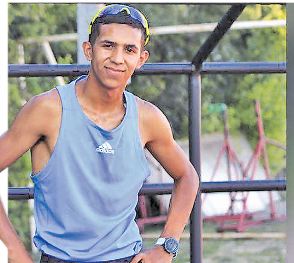
EL ATLETA ANGELINO sumó otras marcas nacionales, figurando como uno de los mejores del continente.

Fue una competencia dura, donde la contaminación era el enemigo a derrotar e impidió la obtención