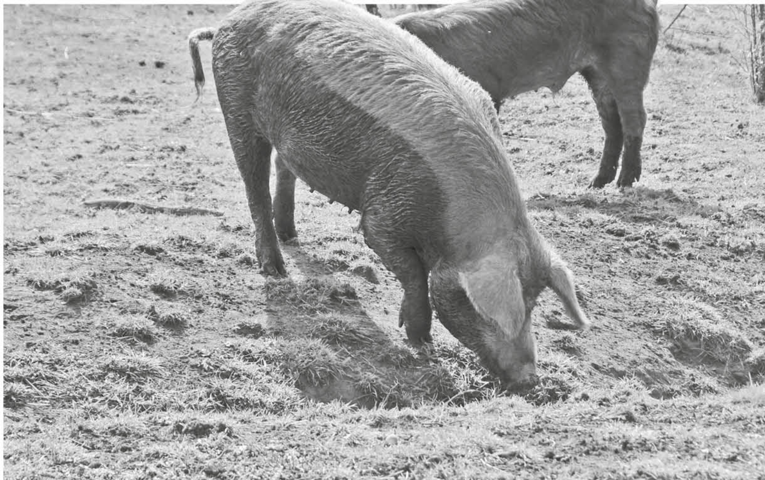
ASIMISMO, DESDE EL MUNICIPIO se informó que se seguirá realizando las denuncias correspondientes ante cada episodio de malos olores.

Además se pudo constatar que no se estaban efectuando un manejo correcto de las heces de los animales, lo que sumado a la temperatura en el verano habría provocado olores molestos que afectaron a sectores poblacionales más allá de los límites del criadero.