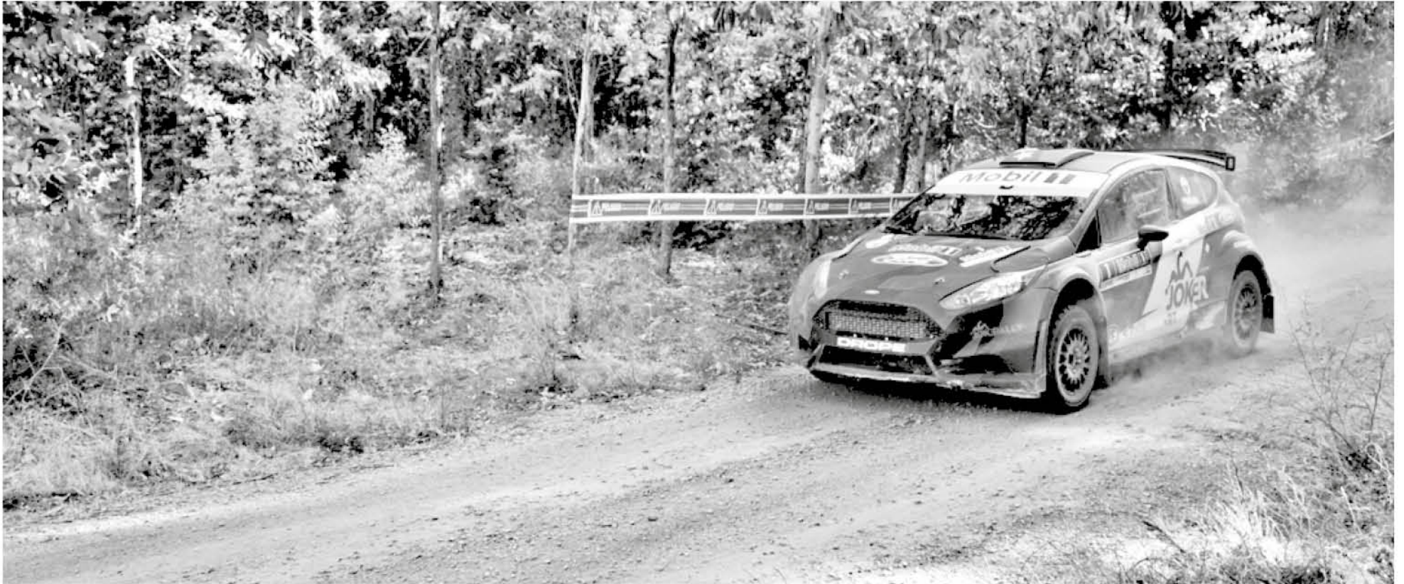
LOS ÁNGELES ABRIÓ LA TEMPORADA XX DEL RALLYMOBIL y fue antesala de la sexta fecha del Campeonato Mundial de Rally (WRC).