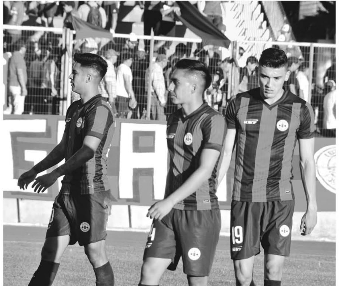
ENTRE OTROS ENCUENTROS interesantes de la jornada, Independiente de Cauquenes fue goleado por 4-0 ante Colchagua.

Dentro de la segunda parte del cotejo, la azulgrana intentó nuevamente lograr una anotación para mostrar respeto en casa, pero no terminó convenciendo; poco claros y sin definición de juego frente a un contrincante al que le expulsaron su capitán, por lo que jugó con un hombre menos en cancha.