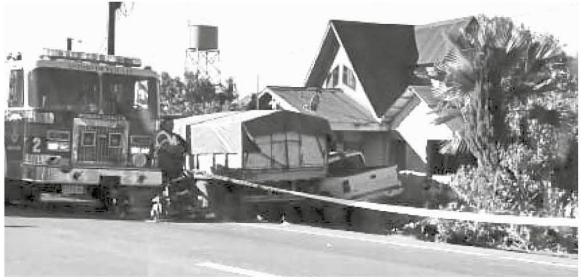
ACCIDENTE DE TRÁNSITO en la ruta a Angol, sector Estación Rihue, se produjo la tarde del domingo.

La identidad de la víctima no fue revelada por Carabineros hasta el cierre de la edición.