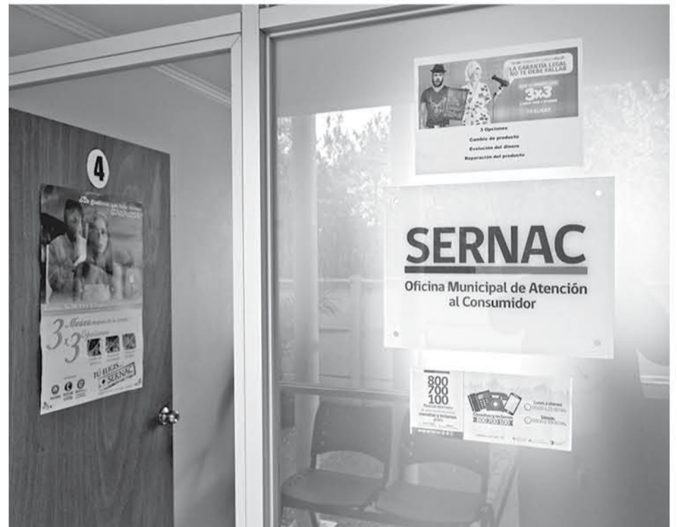
EN LOS ÁNGELES, en convenio con Sernac, existe un equipo municipal que recepciona los reclamos.

falla o corte es negligencia de la empresa, es esta la que arriesga, además de las compensaciones a los consumidores, una multa de hasta 36 millones de pesos”, dijo Pinto.