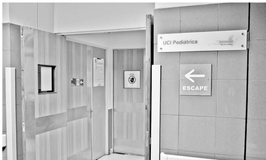
EL MENOR cayó a una puntera sin agua alrededor de las 3 de la tarde del viernes pasado.

Las causas del accidente son investigadas por la Brigada de Homicidios.