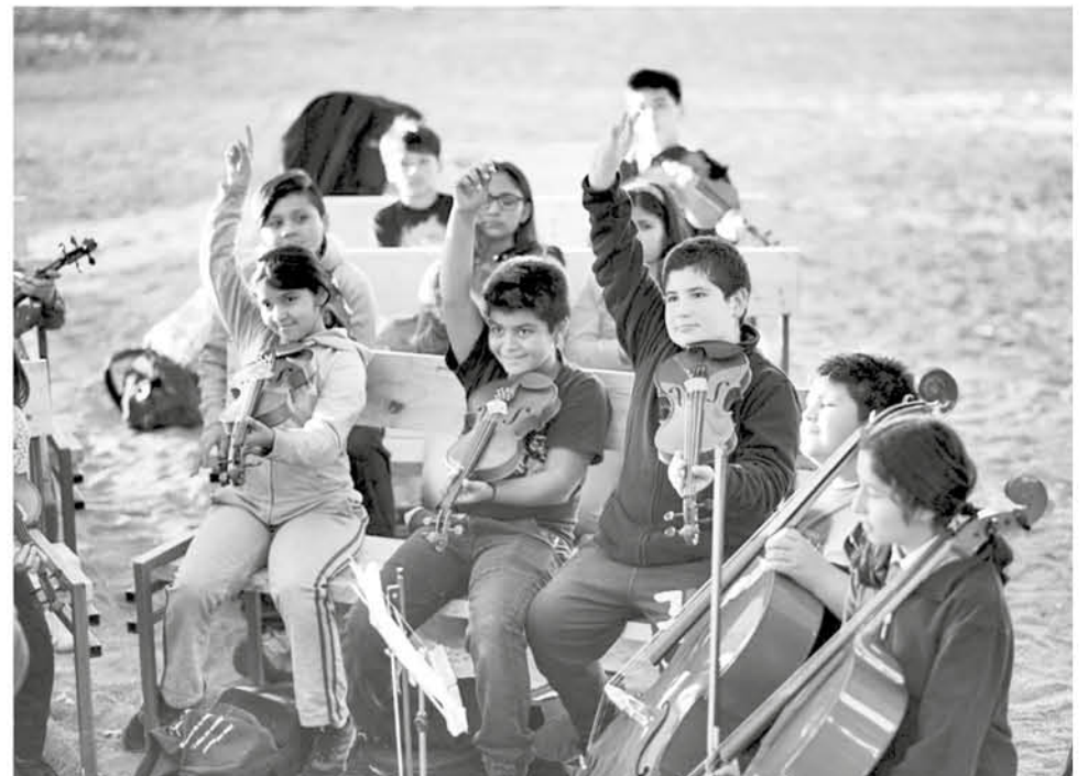
GRACIAS A LA PARTICIPACIÓN de jóvenes de Yumbel Pueblo, Estación Yumbel y Río Claro en el taller de música, se conformó la primera orquesta social de cuerdas de la zona.

de las Culturas, las Artes y el Patrimonio, el patrocinio de FEPASA y la colaboración de la Municipalidad de Yumbel, Grupo EFE y FESUR.