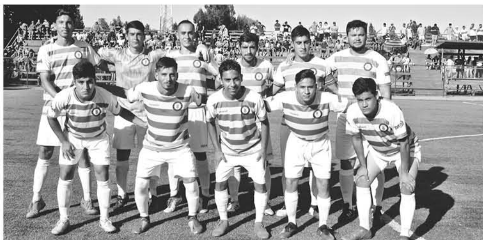
NACIMIENTO CDSC fue fundado el 13 de abril del 2018 y su primer objetivo era competir en Tercera División.