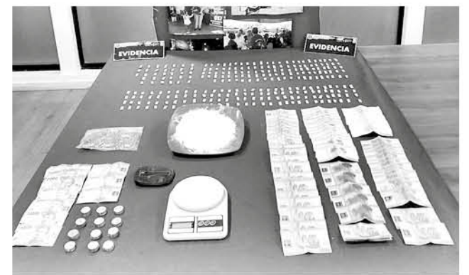
SE INCAUTÓ marihuana elaborada, pasta base, armamento, dinero en efectivo y diferentes elementos asociados a estos ilícitos.