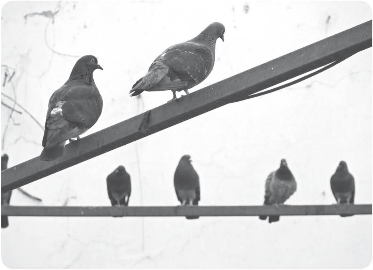
Zazil-Ha Troncoso - Quietud.