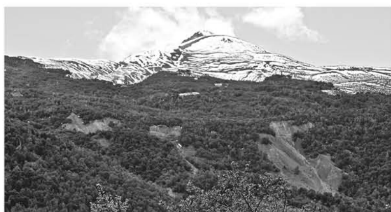
INFORMAN DE ALERTA AMARILLA para el volcán Copahue.