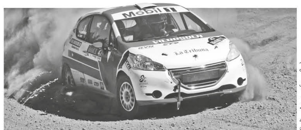
EL PILOTO ANGELINO demostró que su experiencia podría ser de categoría mundial al sortear con maestría el circuito de 33,9 km (Rucamanque-Rucamanque).

Con ello, "Drope" quedó con el camino despejado para quedarse con la jornada sabati-