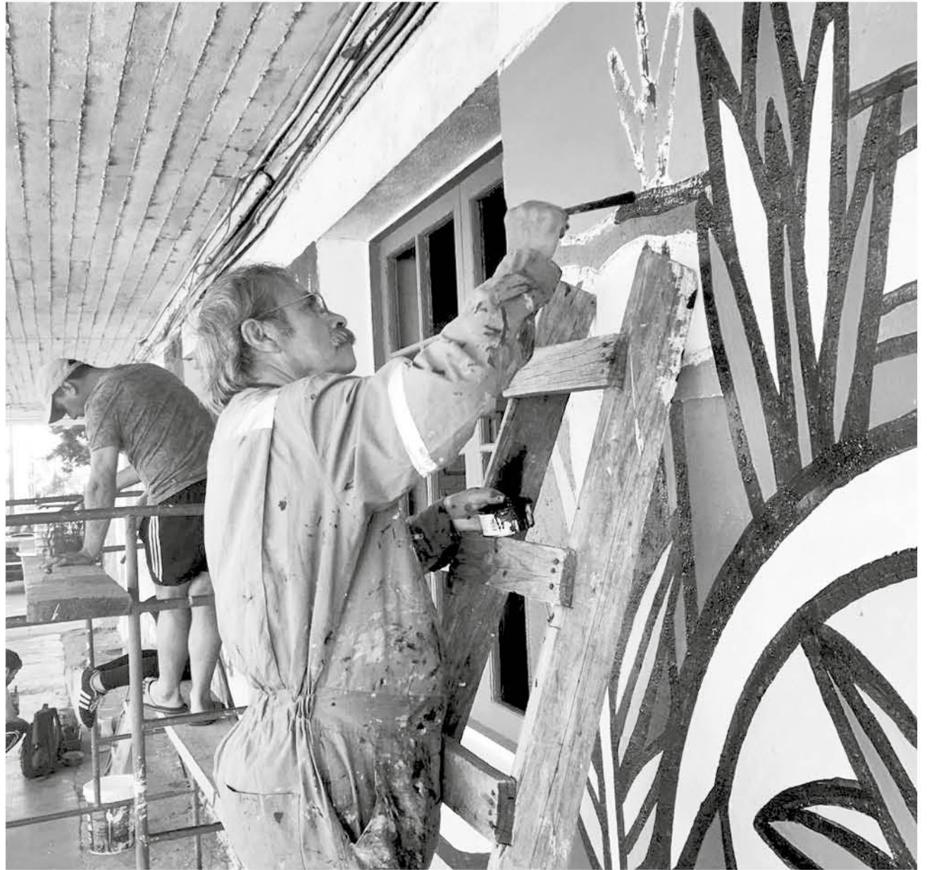
EL CENTRO CULTURAL ITINERANTE TRENZANDO logró sumar a más de mil 300 yumbelinos a su quehacer cultural.

Asimismo, los miembros del taller de hip hop realiza-