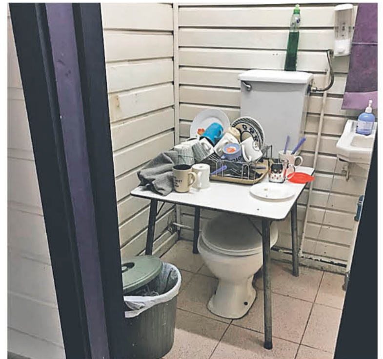
IMAGEN DENUNCIA aportada por AFDEM.

Añadió que "yo creo que son cosas que se deben observar con más cuidado; sostuvimos un diálogo con el director de la escuela, que también lamenta esta mala ocurrencia que los colegas hayan optado, de motu propio, pensar siquiera que un baño puede cumplir estas funciones".