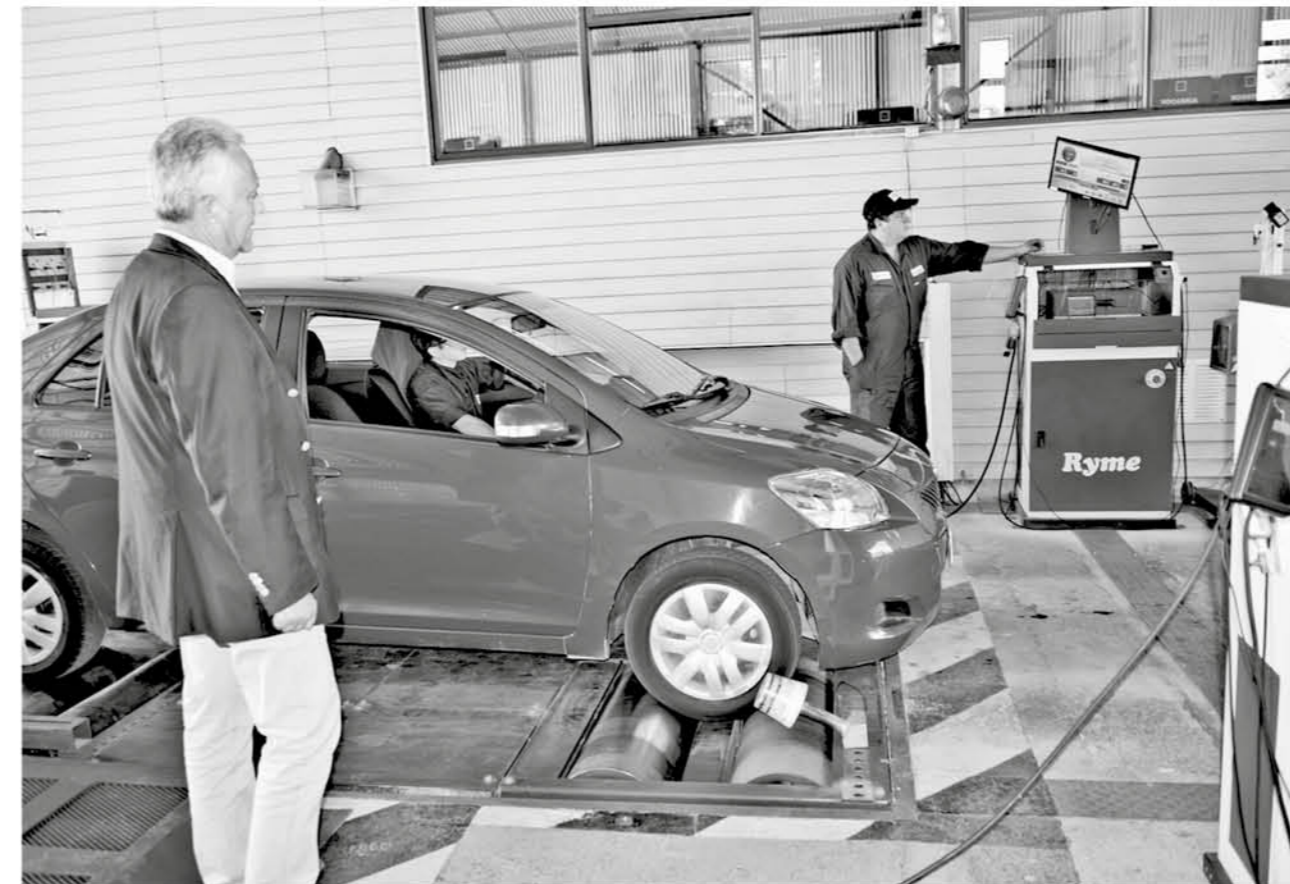
EN LAS PLANTAS de revisión técnica se abordan las nuevas tecnologías.

Planteó además ciertas dudas que deben ser conside-