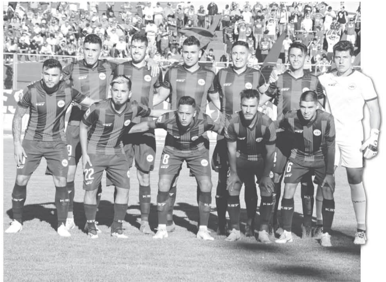
LA APERTURA DE PUERTAS DEL RECINTO se realizará a las 2:30 de la tarde para ver el debut azulgrana que buscará arremeter contra el rival.

Para ingresar a este encuentro válido por la primera fecha del campeonato, el ingreso al Estadio se hará por avenida Los Ángeles -entrada principal- para galería y calle Los Tilos (portón lateral) para tribuna no techada-abonados. En tanto, el público visitante deberá hacerlo por calle Colo Colo.