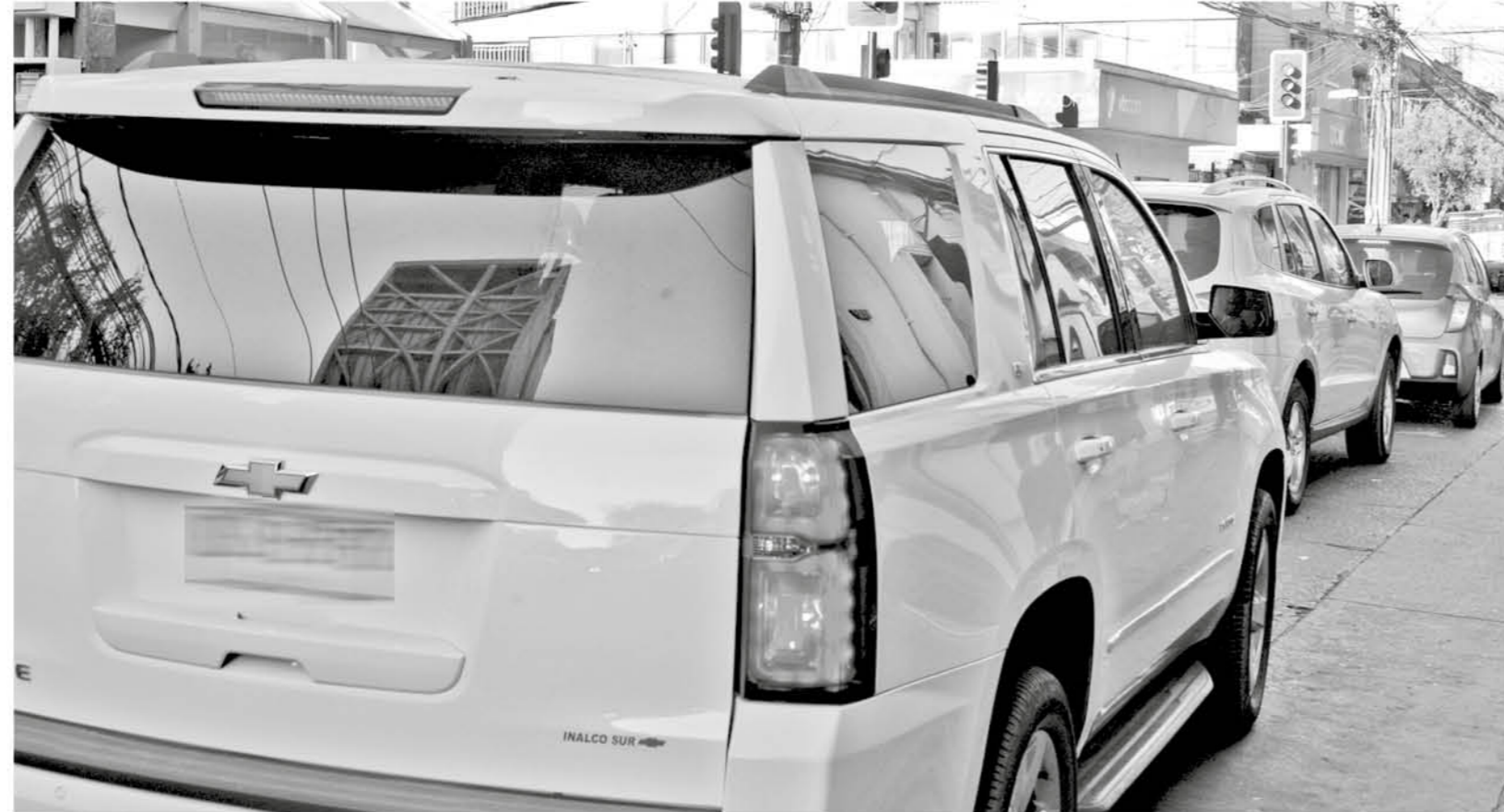
LA NUEVA NORMATIVA establece la legalidad de usar vidrios tintados, aunque apeándose al reglamento que define el Ministerio de Transporte.

Las especificaciones de la nueva Ley de Vidrios Polarizados