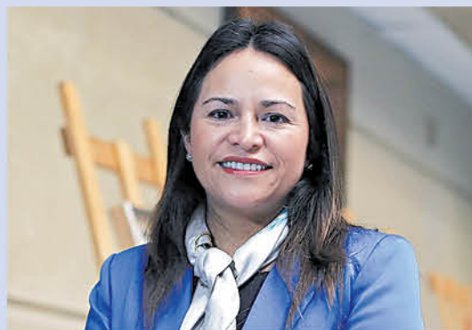
JOANNA PÉREZ, DIPUTADA DC

"No tengo ningún reparo en que se pueda realizar a las distintas autoridades, pero siento que estas medidas son muy populistas; creo que el tema es mayor, son las campañas que tienen que hacer con los jóvenes más allá del tema de las autoridades, destinar más recursos para salud mental, apoyo de las familias, entonces creo que es una campaña que sí se trata de una señal, estoy de acuerdo, pero creo que tiene que haber un compromiso mayor en las políticas públicas, y eso creo que no es atacar el problema de fondo. Tiene que haber mucho más compromiso para sacar estos temas, para decir, más que un eslogan, que los niños están primero, ver su integridad, cómo están hoy en la infancia en sí, en la adolescencia, cómo los estamos tratando, y creo que por ahí deberíamos apuntar a algo mucho más integral que a medidas que son aisladas".