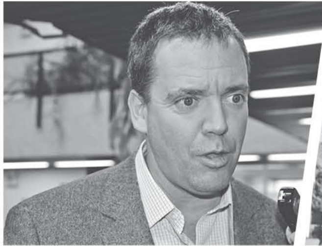
AMBAS FIGURAS POLÍTICAS comentaron que se muestran a favor de interponer un castigo para estos actos.

“La iniciativa va en la dirección justamente correcta. Pero también hay que reconocer que nuestro país debe programas de trabajo en forma de educación a los conductores y futuros conductores, con el fin de poder siempre cumplir con las velocidades que cada calle debe tener”, puntualizó.