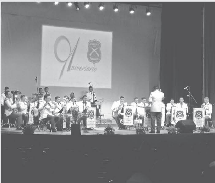
LAS ACTIVIDADES SE VAN A LLEVAR A CABO en el contexto del mes de Carabineros, que se realiza en abril.