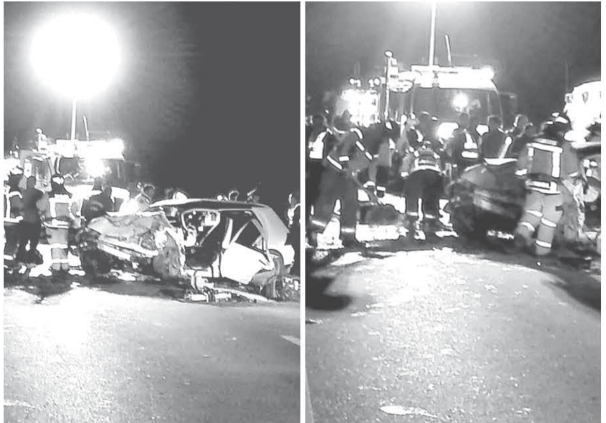
ESTAS FOTOS CORRESPONDEN al accidente ocurrido el pasado 31 de diciembre de 2018.