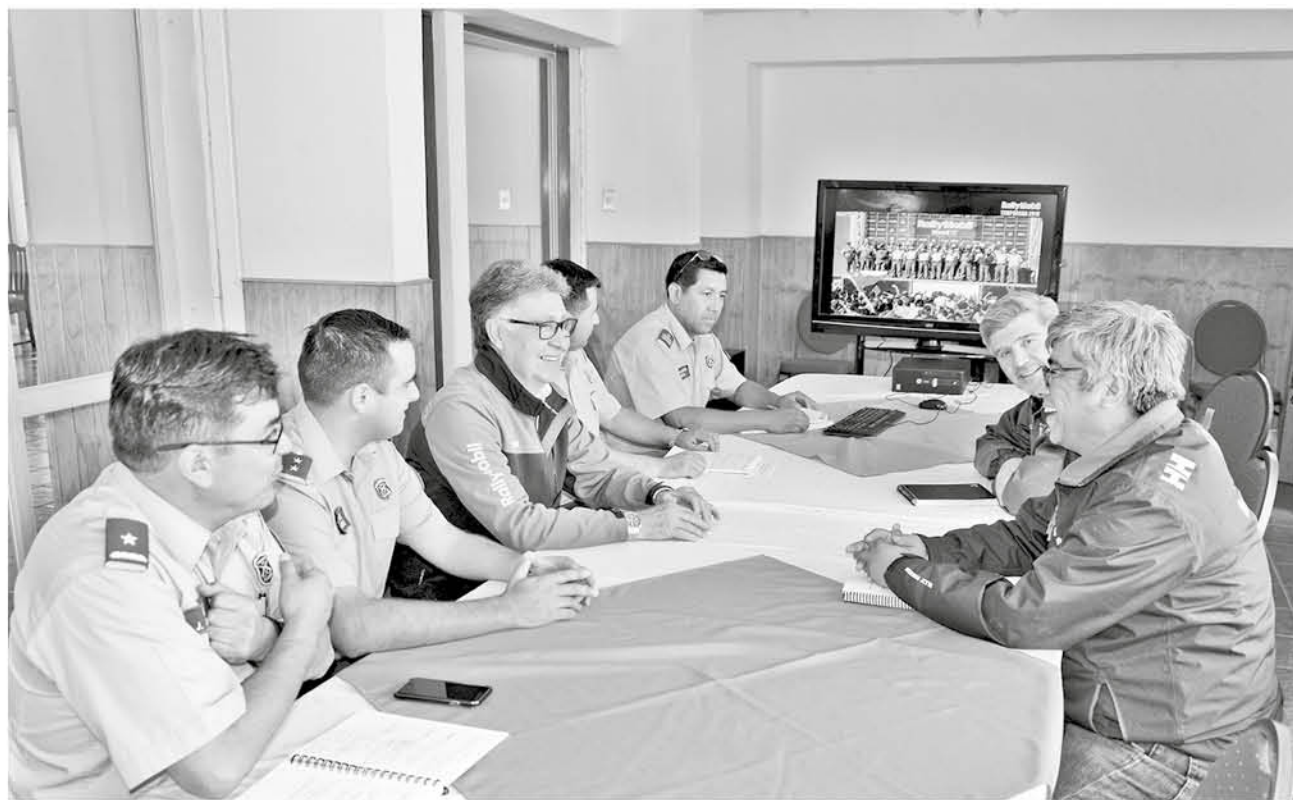
LOS ORGANIZADORES Y CARABINEROS afinaron los últimos detalles para la seguridad vial de la carrera.

Carabineros de la primera comisaría de Los Ángeles son los responsables de la coordinación de la seguridad en