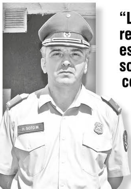
Mayor Héctor Soto, comisario de Los Ángeles.

En el caso de Marconi, el tránsito será suspendido entre las avenidas Gabriela Mistral y Alemania. “El Polideportivo también será resguardado en Gabriela Mistral con Marconi, donde habrá corte, a diferencia de Marconi con avenida Alemania, donde solo habrá regulación del tránsito”.