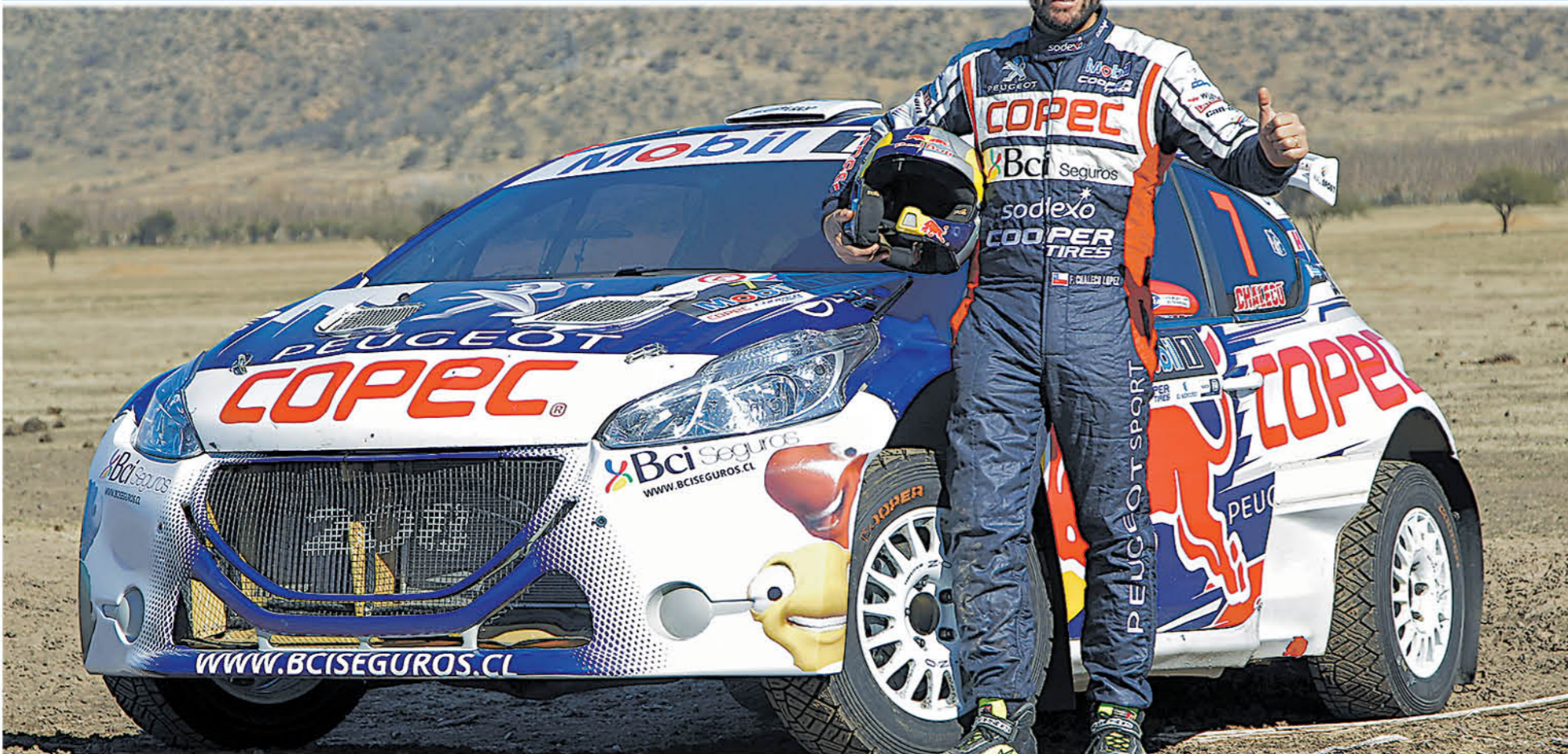
FRANCISCO "CHALECO" López arrancará con su Peugeot R5 con el título del Dakar 2019 en mano.