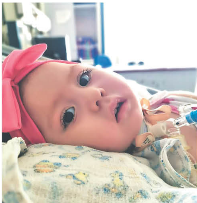
ANTES DE CINCO MESES, la pequeña debe comenzar con su tratamiento.

Finalmente, Morales aclaró que el baño, si bien no era utilizado como comedor o cocina, los docentes sí lo utilizaban para lavar la loza, y eso es lo que se puede ver en la imagen.