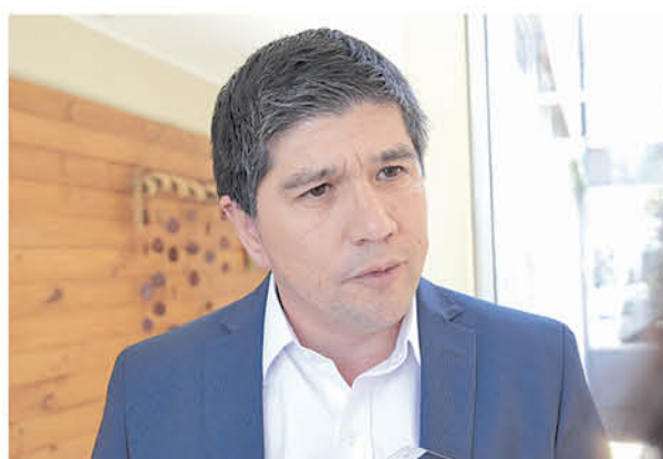
MANUEL MONSALVE, DIPUTADO PS

"Estoy completamente de acuerdo en legislar en ese sentido. A mí me parece que hay que resguardar la absoluta y total independencia de las autoridades a la hora de tomar decisiones, de manera que siempre privilegien el bien común y estén ajenos a otras presiones. El consumo de drogas y eventualmente la adicción al consumo de drogas pudiera hacer perder la imparcialidad y autonomía a las autoridades a la hora de tomar decisiones. En segundo lugar, creo que es indispensable que un test de esta naturaleza sea exigible a todas las autoridades que tomen decisiones de políticas públicas importantes para Chile, pero también de aquellas autoridades que administran y toman decisiones respecto a la administración de recursos públicos".