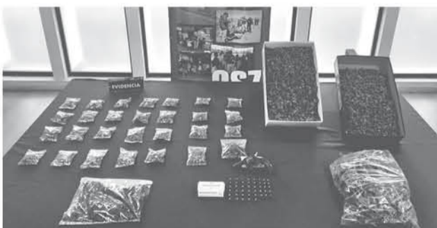
AMBOS DECOMISOS se realizaron en una temporada que es conocida por la cosecha de estas sustancias.

El procedimiento policial se realizó en el sector de Lo Nieve, en donde se detuvo a dos hombres.