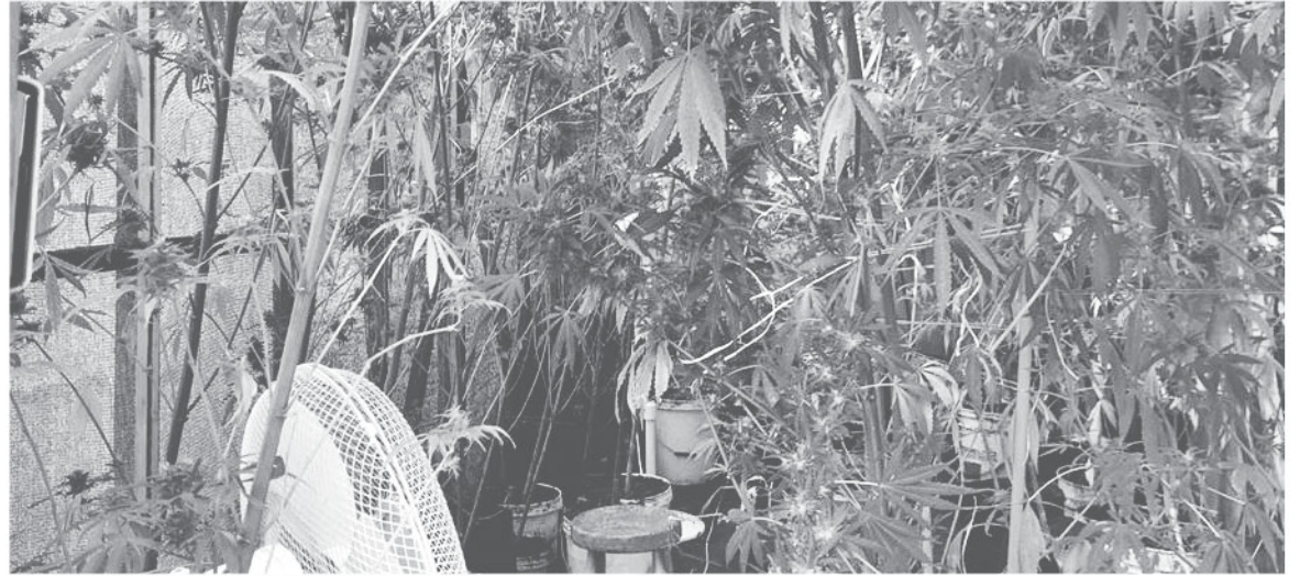
AL INTERIOR DE ESTE INVERNADERO se mantenían dichas plantas y sustancias.