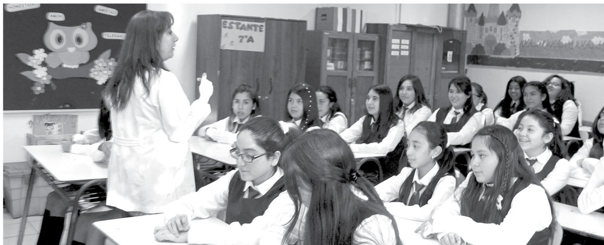
ÚNICAMENTE SEIS docentes obtuvieron un resultado insatisfactorio.