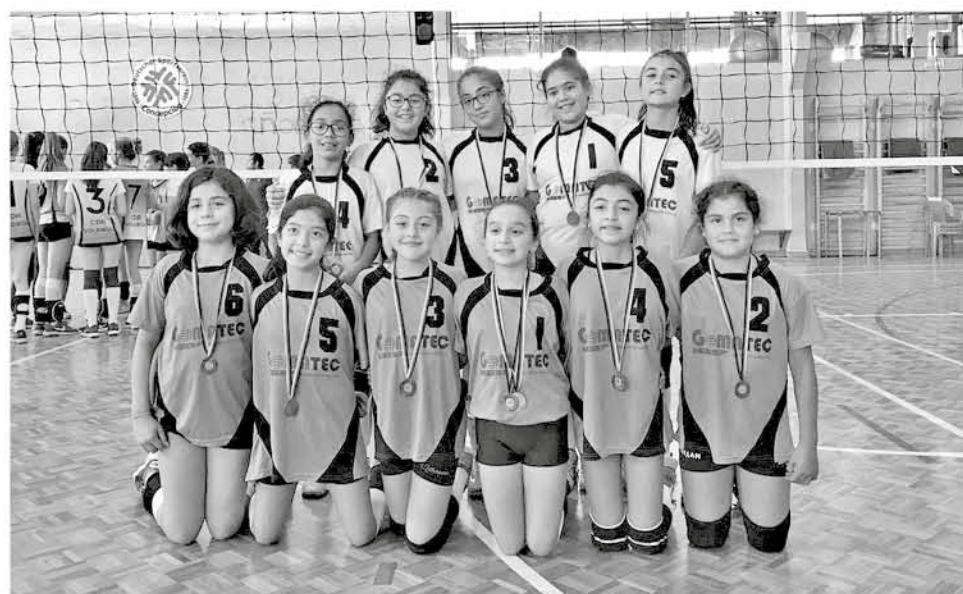
ENTRE OTROS DESAFÍOS DEL CLUB ANGELINO, se encuentra llevar al conjunto a un nivel competitivo internacional.