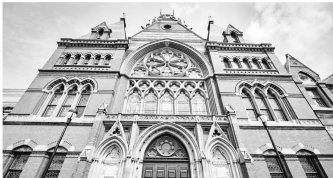
LA UNIVERSIDAD DE HARVARD dice que usar bien ciertas funciones de Excel puede ser clave para ganar tiempo y productividad.

¿Cómo ejecutarlo?: ejecuta el comando con Ctrl + Abajo para llegar al final de documento, o desplázate por él con las flechas. También te servirá para seleccionar datos en segundos y maximizar tu productividad.