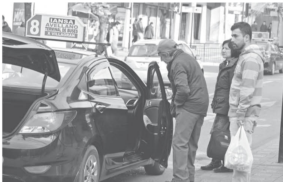
ACTUALMENTE EN LA COMUNA de Los Ángeles transitan diecinueve líneas según dio a conocer seremi de Transportes.

Es por ello que el pasaje podría subir sus precios entre los 50 y 100 pesos a contar desde el 14 de abril del mes en