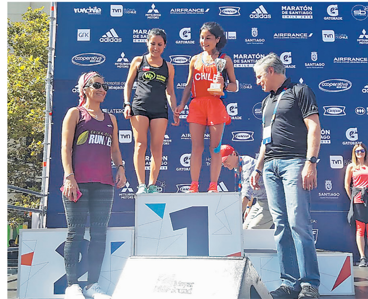
CON PERSEVERANCIA, tras sufrir una lesión, la atleta logró recuperarse y ser la primera chilena en llegar a la meta en la capital.

“Nosotros necesitamos auspicio porque unas zapatillas nos duran un mes o dos máximo, porque si la sigues usando te lesionas y ellos -la farándula- lo tienen todo, ni siquiera hacen una gota de deporte algunos”.