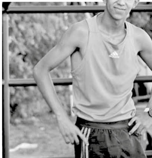
LA MARCA LE PERMITE estar actualmente como el número uno del ranking Sudamericano y el quinto a nivel mundial en la categoría Sub 18.