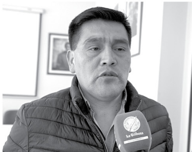
NIVALDO PIÑALEO , alcalde de Alto Biobío.