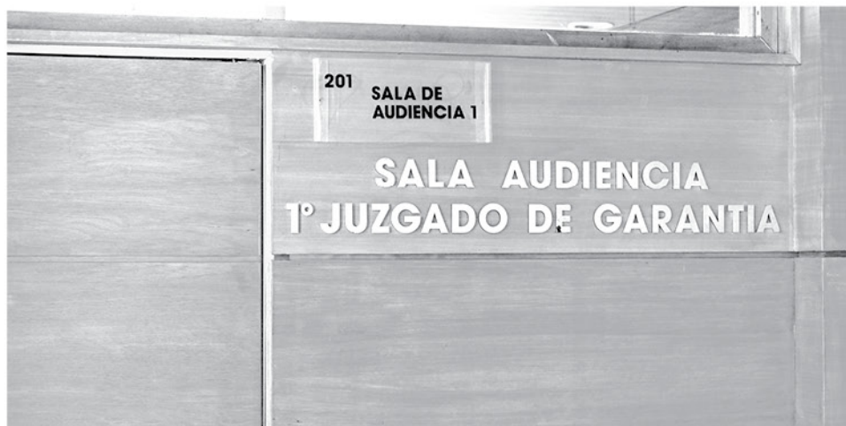
SE INVESTIGA RENCILLAS entre ambos involucrados.

“No quedamos conformes ya que mi cliente manifiesta no tener relación y niega su participación en los hechos por lo que va a apelar y pedir a Fiscalía que realice diligencias para esclarecer los hechos”, comentó.