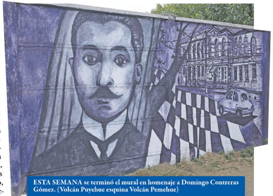
ESTA SEMANA se terminó el mural en homenaje a Domingo Contreras Gómez. (Volcán Puyehue esquina Volcán Pemehue)

Más tarde la "Contreras Gómez" recibió a las familias provenientes de los campamentos La Feria, ubicado frente al actual Easy y del campamen-