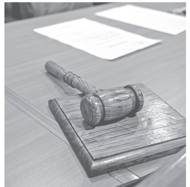
CABE RECORDAR que la familia de la víctima manifestó además que el acusado sería un hombre que causaba temor a la comunidad.