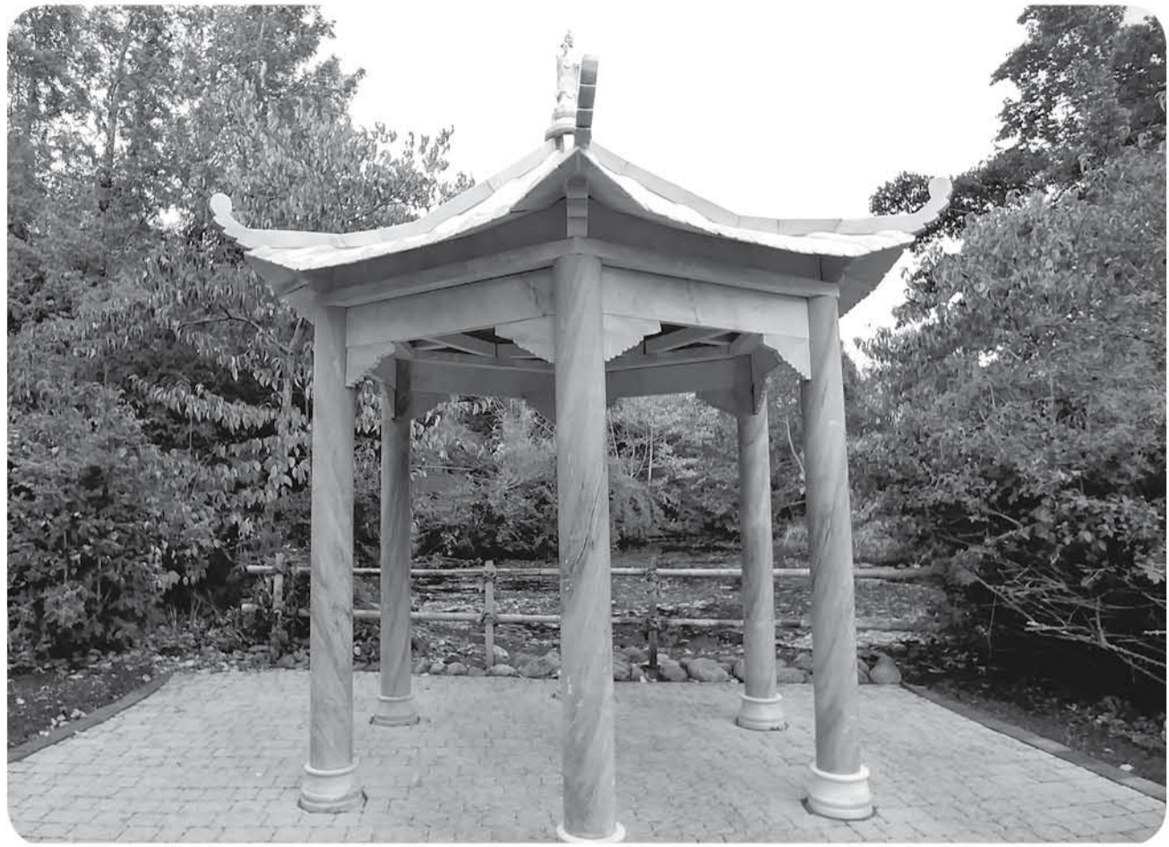
Felipe Sepúlveda Merino - Estructura oriental.