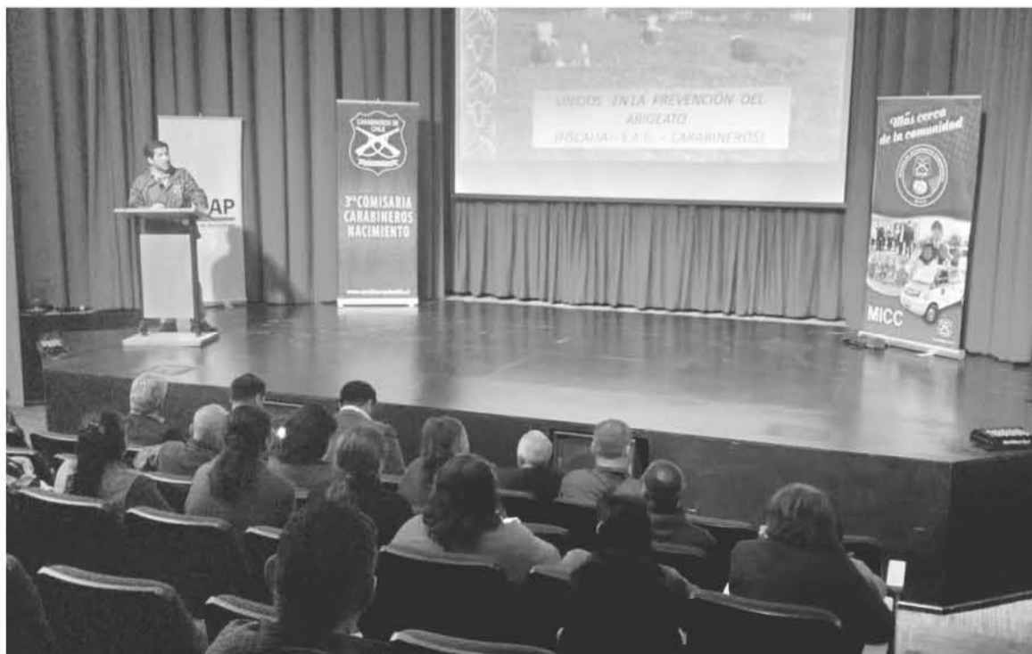
UNO DE LOS PUNTOS IMPORTANTES se basó en los robos de madera que se producen en esta temporada.

PARTICIPARON CERCA DE 100 PERSONAS EN NACIMIENTO