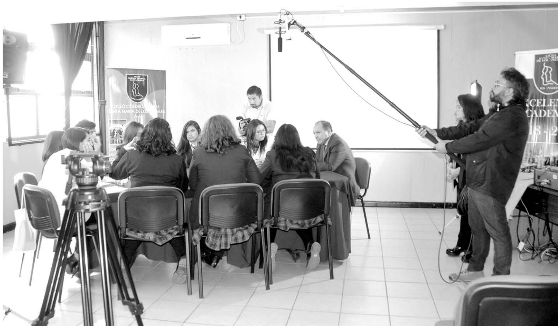
UN EQUIPO AUDIOVISUAL grabó por dos días todo el quehacer de la unidad educativa a fin de producir un video que será compartido como ejemplo en el país.