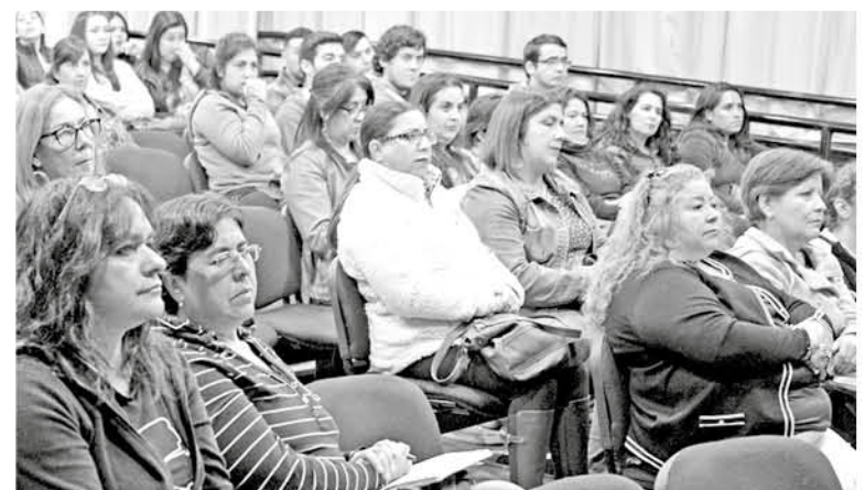
SE ABORDARON las inquietudes de emprendedores angelinos, ansiosos de mejorar en sus respectivos rubros.

También los participantes plantearon inquietudes que fueron respondidas por el relator, que además entregó tips y sugerencias ante las dudas expuestas durante la jornada de ayer.