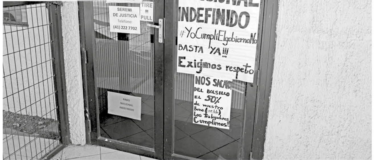
ESTE VIERNES se analizará un protocolo de acuerdo entre representantes de los funcionarios en paro y del Ministerio de Justicia.

poración de Asistencia Judicial de la región del Biobío iniciaron la paralización indefinida el lunes 25 de marzo, al reclamar el pago del llamado "bono marzo" para los funcionarios desde Ñuble hasta Aysén, por lo que todas las oficinas de la CAJ se plegaron a la convocatoria.