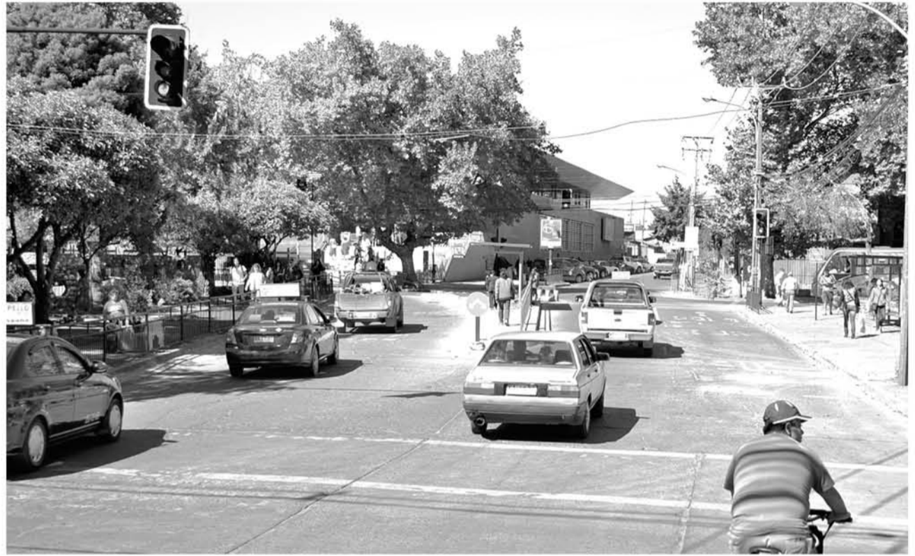
SE ESPERA QUE LOS NUEVOS PRECIOS de los colectivos comiencen a aplicarse a partir del 14 de abril.