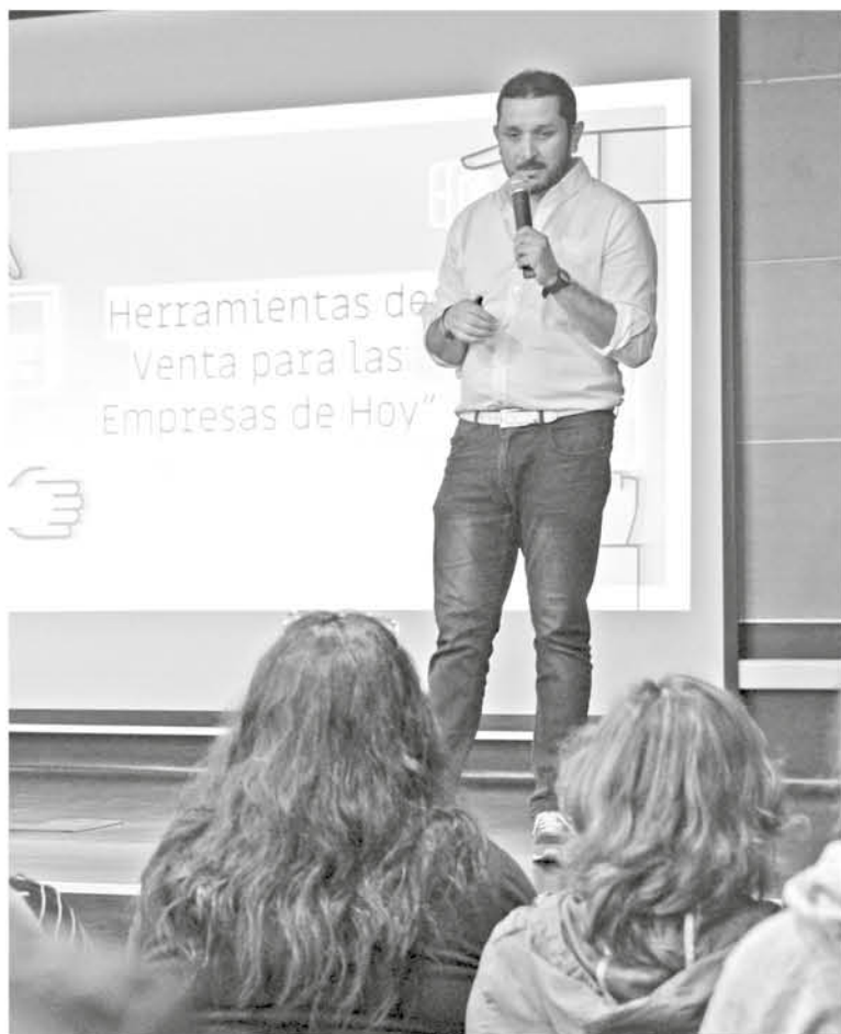
EN LA JORNADA se analizaron herramientas de venta para el consumidor actual.