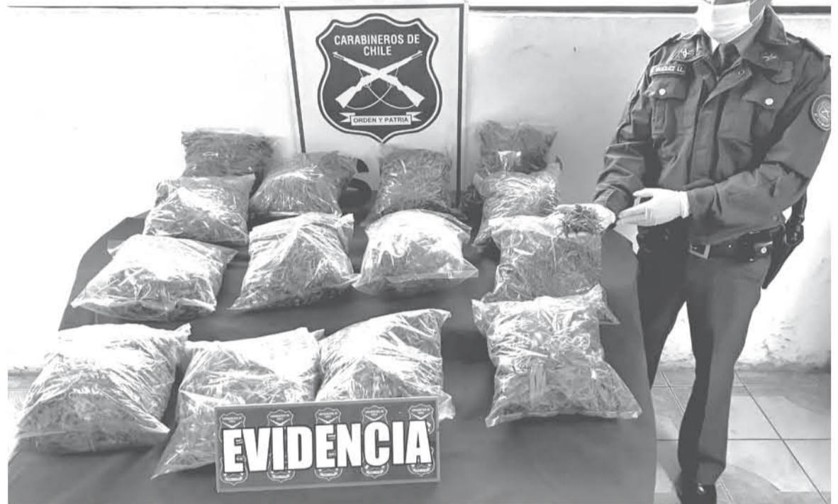
ESTOS DECOMISOS SE SUMAN a otros realizados en la provincia donde se han incautado sumas similares.

Según agregó el comisario Pérez, en lo que va de este año se han realizado siete decomisos en estas circunstancias, con ocho detenidos,