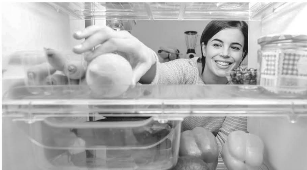
EL NUEVO PRODUCTO podría minimizar el impacto medioambiental.

Junto a las ventajas de los cristales plásticos como refrigerantes, el equipo de Li también reconoce algunas limitaciones importantes. La misma maleabilidad que les hace sensibles a leves presiones hace que mecánicamente sean muy blandos y no los convierta en materiales ideales para crear un sistema de refrigeración duradero.