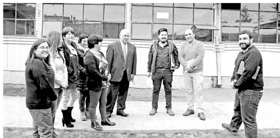
TRAS ESTAS OBRAS se debe continuar con el proceso de normalización que tiene que ver con la ampliación de su biblioteca, la creación de una sala multitaller y a futuro un patio techado.