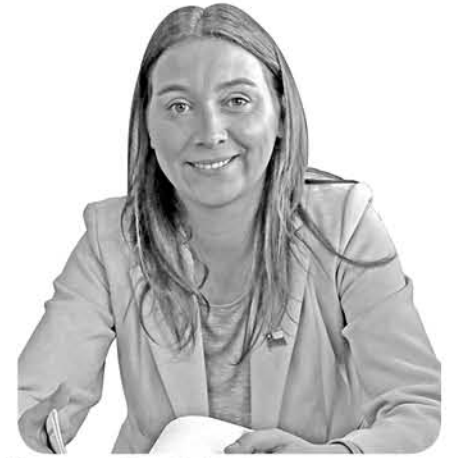
Francesca Parodi Opplinger Seremi de Gobierno

Pero para mejorar la seguridad ciudadana lo esencial es hacerse cargo del fondo.