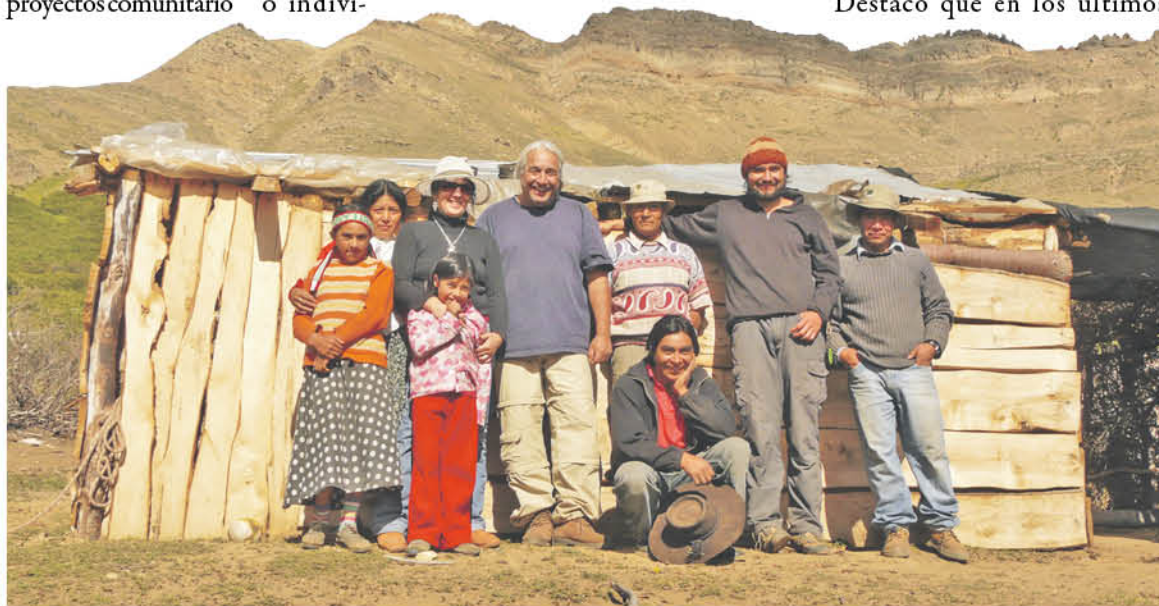
LAS ACTIVIDADES pensadas en los visitantes se mantienen durante todo el año.

Cauñicú y Pitiril. Guías, artesanas, cocineras, dueños de camping y cabañas, propietarios de caballos, forman parte de la organización, que se suma al Programa Sendero de Chile, que promueve rutas de ecoturismo en territorio ancestral. Realizan cabalgatas por huellas que conducen hacia las veranadas o zonas de pastoreo, conversaciones con el guía o "la ñaña" (abuela), cruzando majestuosas montañas e imponentes paisajes, con la posibilidad de sumarse a las labores cotidianas, mientras se comparte un mate o se prepara el pan.