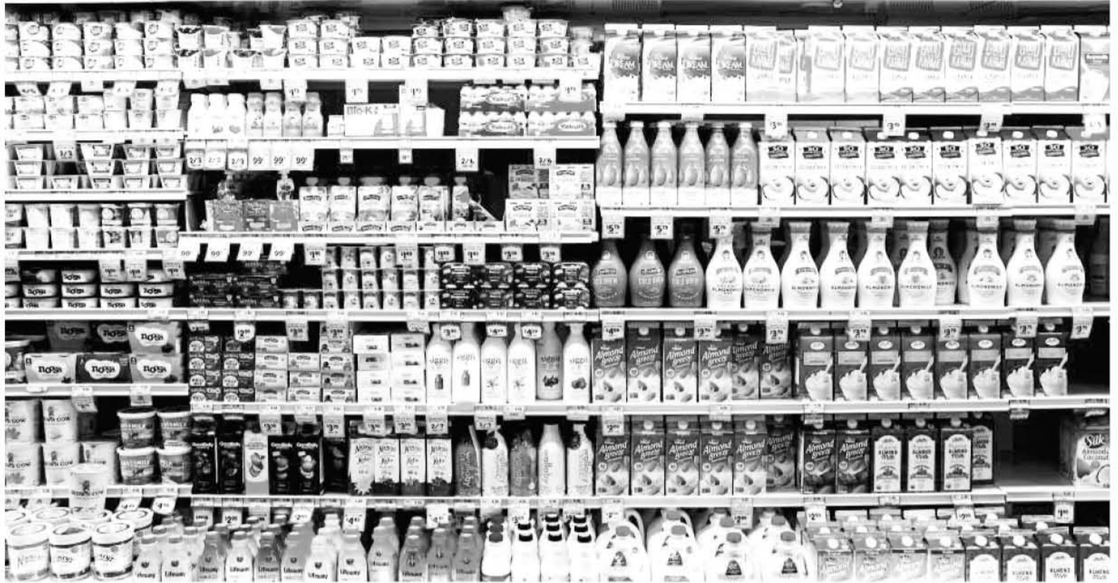
CONSERVAR ALIMENTOS EN FRÍO tiene un enorme coste energético.

Para entender la propuesta de los científicos chinos, en primer lugar es necesario conocer cómo funcionan sistemas de refrigeración estándar como los de las neveras. Básicamente, requieren cuatro pasos. En el primero se contrae el gas, que aumenta de temperatura. Después, se extrae ese calor del gas comprimido y al volverlo a descomprimir pierde temperatura y queda más frío que el