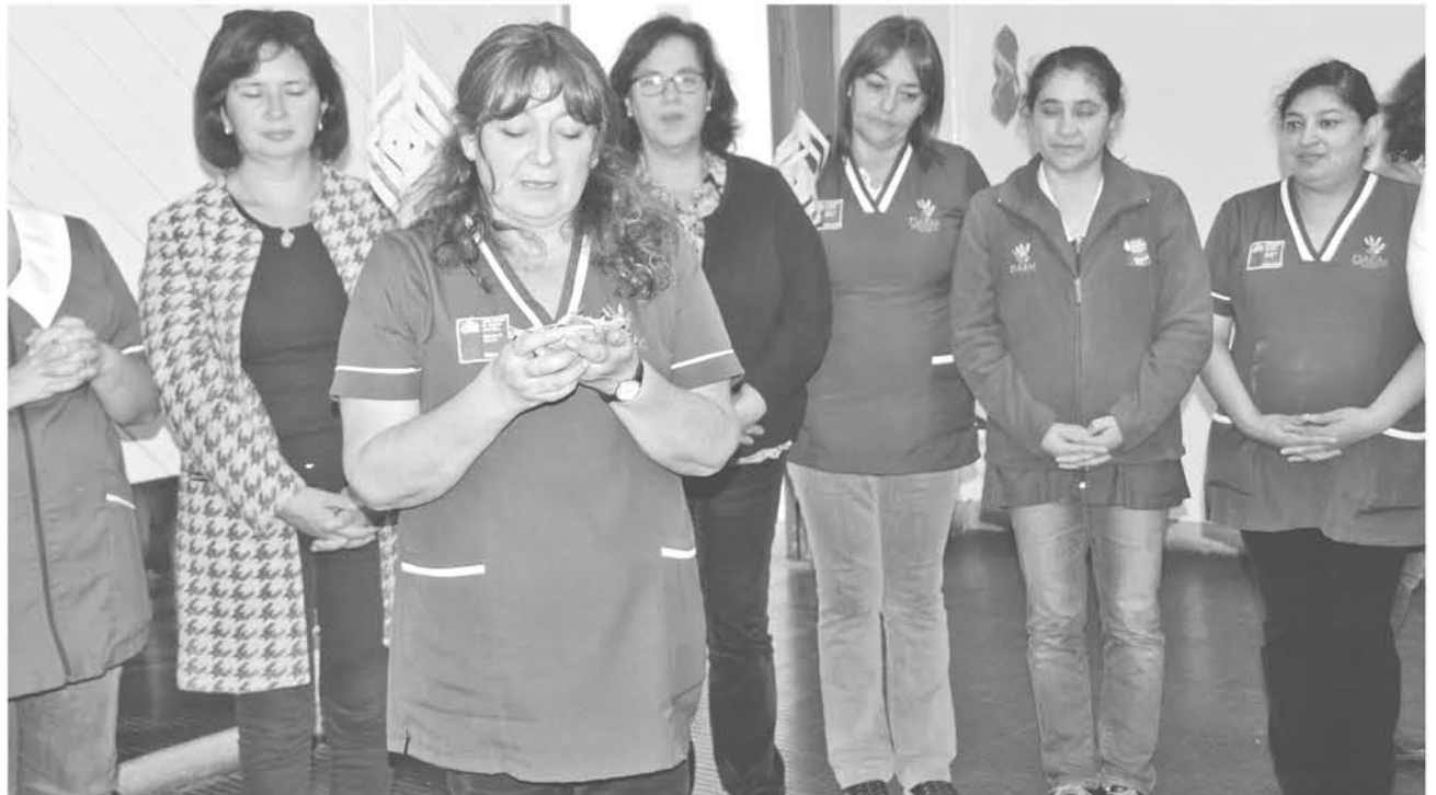
CON UN HERMOSO NÚMERO musical se dio el vamos oficial a la “Red de Jardines Infantiles Sustentables” en Los Ángeles

Finalmente la educadora directiva destacó que si bien es cierto son 14 jardines la influencia en la comunidad será bastante.