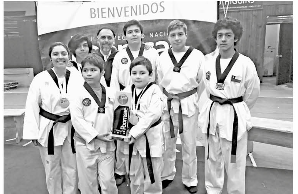
LA DELEGACIÓN ANGELINA se trajo de Temuco 6 medallas de oro y una de bronce.