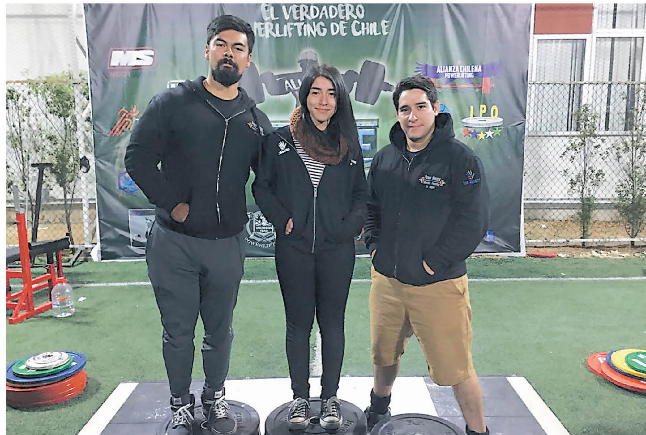
LOS PODEROSOS LEVANTADORES tuvieron un 2018 brillante con records nacionales que siguen consolidando esta temporada.

Ahora las filas de Power Menace se preparan para el clasificatorio al Mundial de Brasil que se realizará en Quirihue en julio los días 6 y 7.