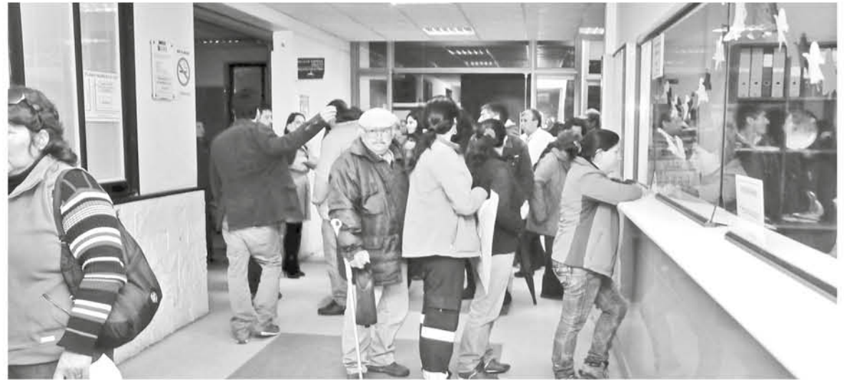
LOS USUARIOS dieron una baja calificación a la salud pública.

Del mismo modo, manifestó que todavía queda mucho por mejorar y que este tema es uno de los principales compromisos que tiene este Gobierno.