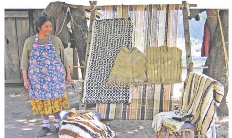
LOS EMPRENDEDORES desarrollan proyectos donde los visitantes tienen la posibilidad de compartir las labores cotidianas que se mantienen en la alta frontera.