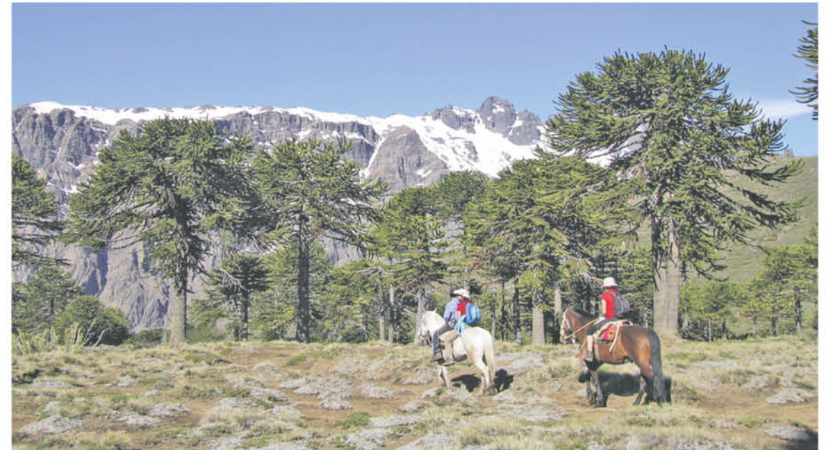
ALTO BIOBÍO invita a explorar los milenarios bosques de araucarias.