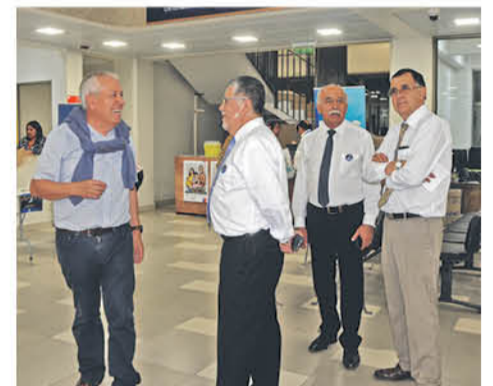
FUERON ONCE LAS OFICINAS de la municipalidad que atendieron público.