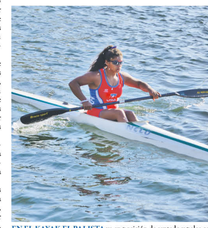
EN EL KAYAK EL PALISTA va en posición de sentado y palea con una pala de dos hojas.

"Todas estas son caras nuevas y el talento se ve en todos ellos, lo único que hay que trabajar, es en desarrollar su potencial, porque lo tienen. Este va a ser el tercer año y los muchachos han hecho más de 10 medallas en campeonatos sudamericanos".