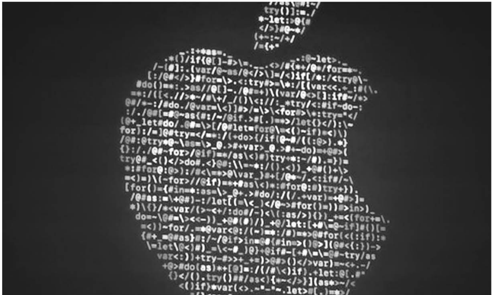
FOTOGRAFÍA DE ARCHIVO DEL 13 DE JUNIO DE 2016 del logo de Apple en una pantalla de la Conferencia Mundial de Desarrolladores de Apple en el auditorio cívico Bill Graham en San Francisco.