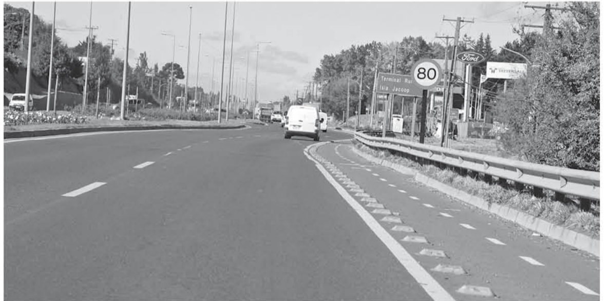
SEGÚN AÑADIÓ EL SEREMI DE TRANSPORTES la extensión de esta ruta no debería ser de ochenta kilómetros, debería estar dividida en tramos.

Al respecto, el seremi Aravena dijo que "el alcalde sabe perfectamente que él no tiene atribuciones para aumentar por sí solo la velocidad en una vía sin el visto bueno o pronunciamiento del Ministerio de Transportes y eso se lo hicimos ver tanto al director