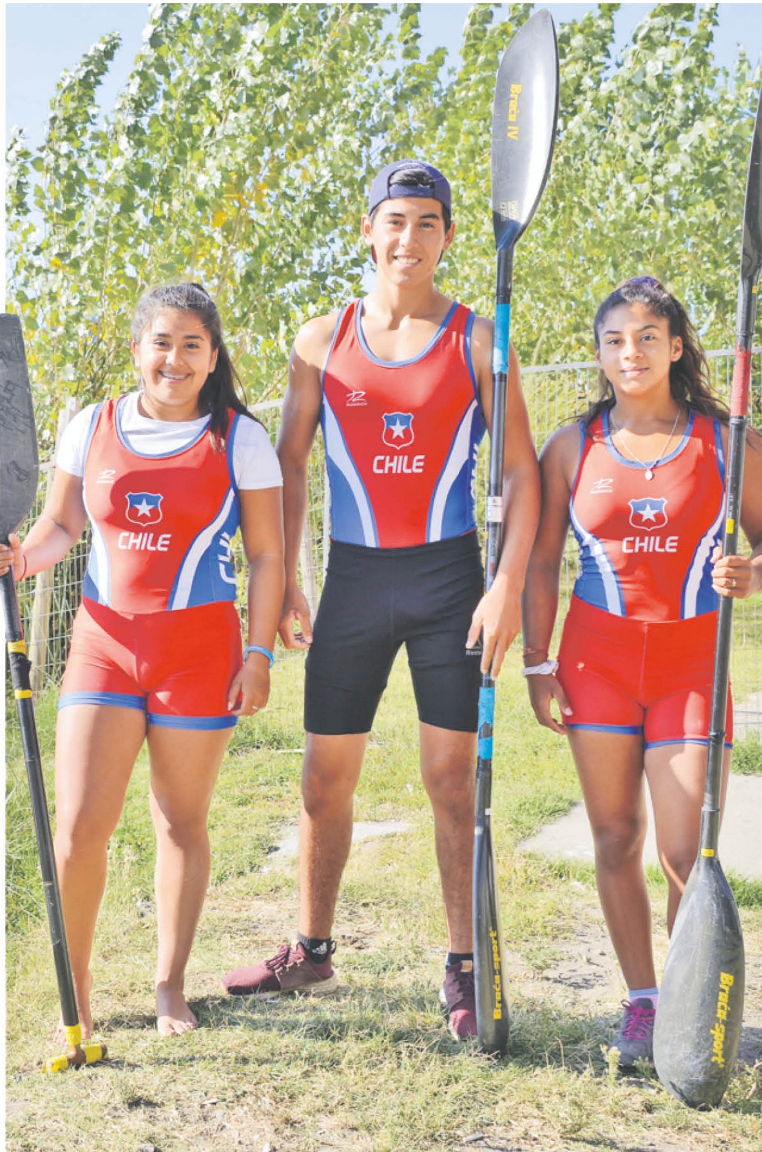
EN SERIE JUNIOR TRES PIRAGÜISTAS aseguraron además, un puesto en la Olimpiada mexicana, a disputarse en mayo.