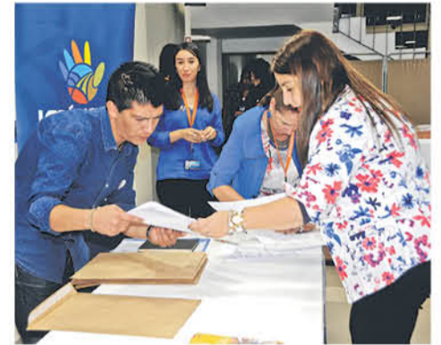
LA INICIATIVA BUSCA que nadie quede fuera de poder hacer sus trámites.