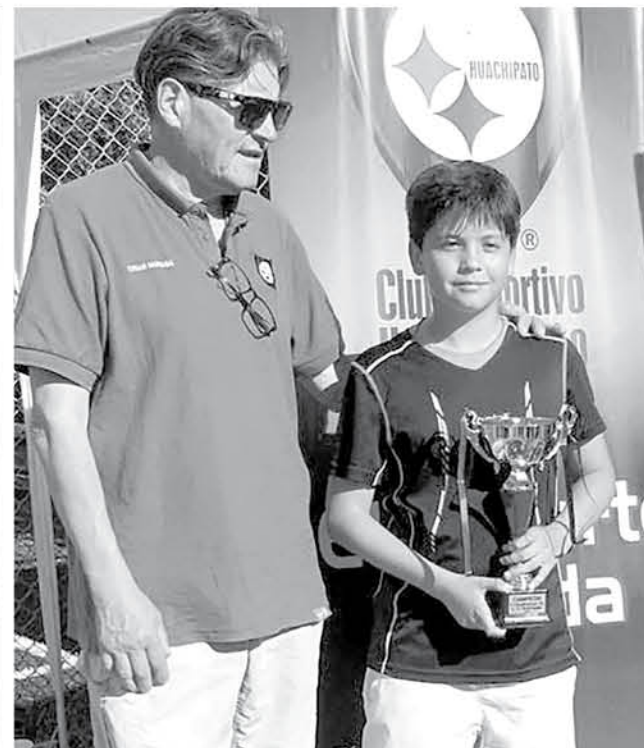
SE ESPERA QUE, POR SU ALTO NIVEL competitivo, los tenistas logren lidiar a nivel sudamericano.

semana, viajando y dejando de lado sus amigos por competir".