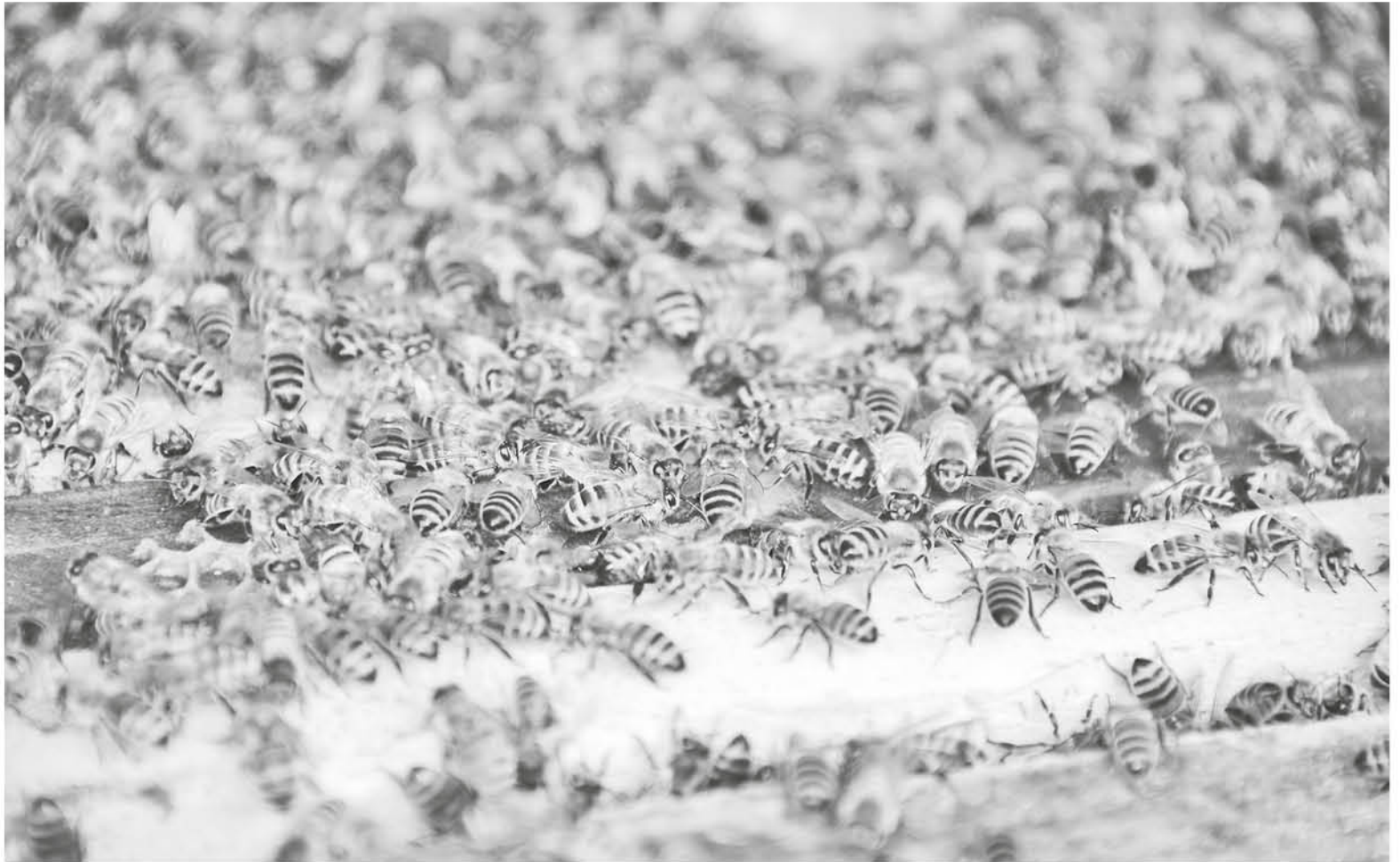
ESTA TEMPORADA, a diferencia de otros años, el cierre de la temporada no arroja un buen balance para los apicultores.

radio San Cristóbal y diario La Tribuna, el dirigente de Apilang manifestó que ahora preparan a sus colmenas para enfrentar meses complicados, siendo el desafío fortalecerlas para la etapa de la polinización. “Se nos viene el invierno por delante y una nueva primavera, que implica estar con las abejas en buenas condiciones para las polinizaciones. En lo inmediato, es un tema que nos mantiene muy preocupados”.