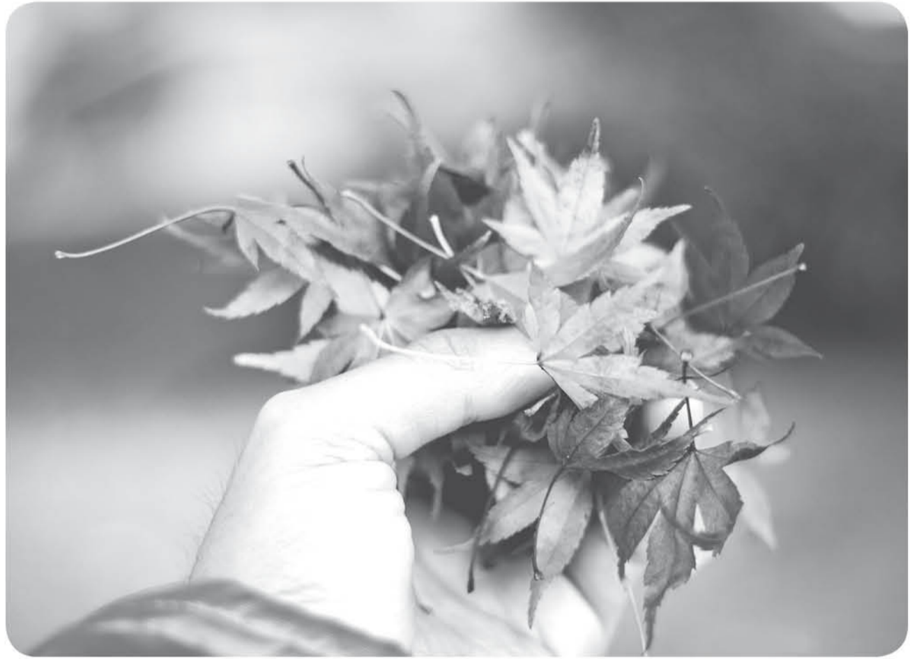
Elvis Pincheira Vidal - Bienvenido Otoño.