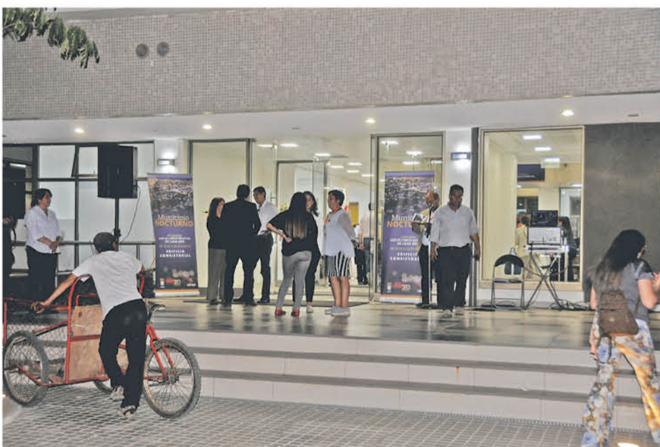
LOS ÚLTIMOS MARTES de cada mes, desde las 18 a 21 horas es el horario de atención nocturna.