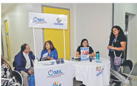
LA PRÓXIMA ATENCIÓN nocturna será el 30 de abril.