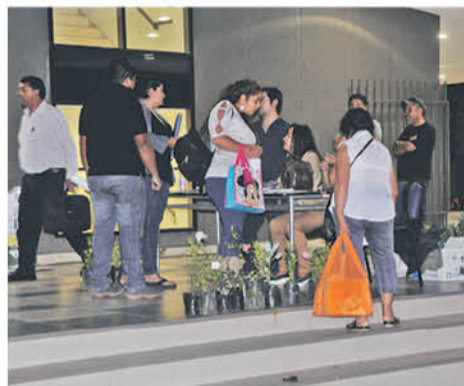
FUERON MÁS DE 400 PERSONAS las que llegaron a hacer sus trámites.