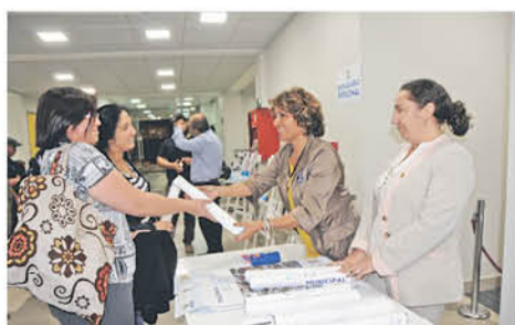
LA IDEA ES IR POTENCIANDO el servicio con más atenciones y, a lo mejor, más veces al mes.