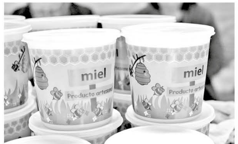
ACTUALMENTE se entrega a las abejas alimentación artificial para enfrentar una mejor temporada no sólo en la producción de miel, sino que además para conseguir una mejor polinización.

En tal sentido, llamó a diversos organismos vinculados a la actividad productiva a generar medidas que permitan minimizar el impacto, “y ojalá las autoridades tomen cartas en el asunto, en atención a las necesidades que hay de respaldarnos y apoyarnos por lo útil que son las abejas para