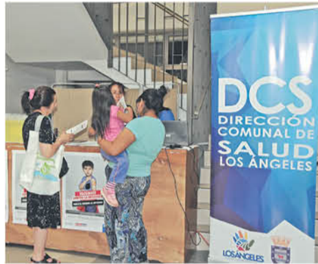
INCLUSIVE ALGUNOS PUDIERON vacunarse contra la influenza.