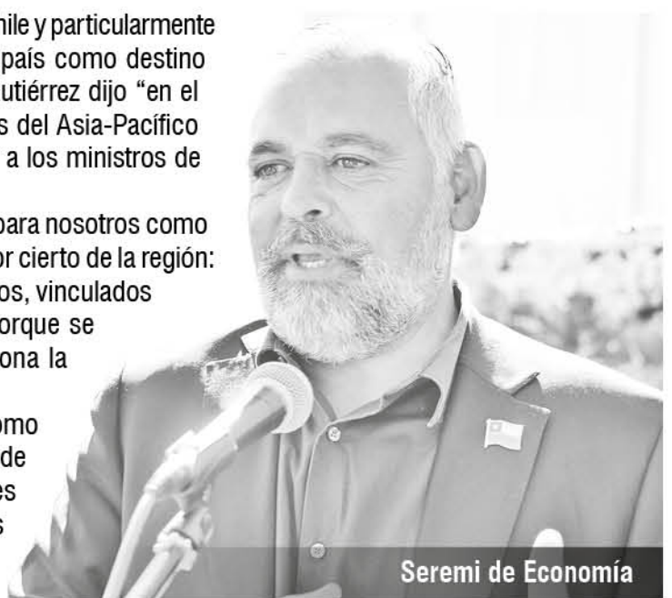
Seremi de Economía

En otro orden destacó las proyecciones para el turismo y la hotelería, "Como ministerio estamos muy expectantes de lo que podamos lograr en términos de turismo. Va a aumentar la tasa de ocupación por pernoctaciones en hoteles de la región y por cierto, en la provincia de Biobío. Va a aumentar, y esa es la apuesta que siempre hacemos con Sernatur, de posicionar la imagen de marca de la región del Biobío. Esos son retornos que vienen de largo plazo".