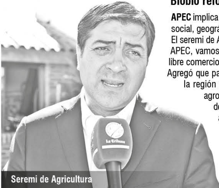
Seremi de Agricultura

Agregó que para su sector se tendrá como objetivo mostrar el potencial de la región y de la provincia de Biobío como productora y exportadora agroalimentaria. "Como ejemplo, ya tuvimos 500 millones de dólares de exportación, donde frutas como los arándanos constituyen un aporte predominante de la provincia de Biobío. Además vamos a comunicar y coordinar a los productores y los empresarios con las actividades APEC con el objeto de mostrar a la región hacia mercados internacionales". Además destacó el rol de la Corporación "Desarrolla Biobío" y de ProChile y su director regional, Gino Mosso, respecto de la realización del seminario agroalimentario en la provincia de Biobío.