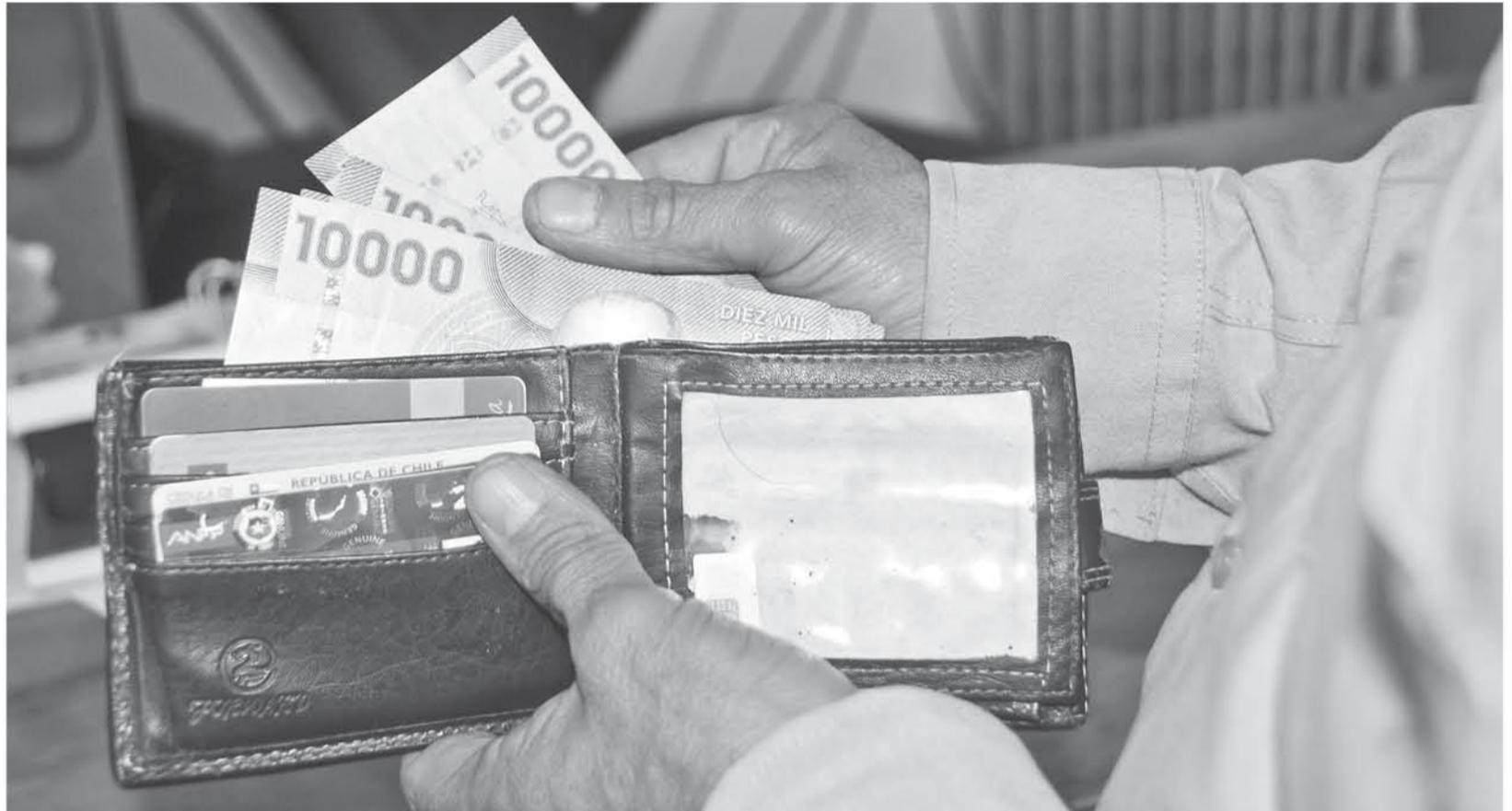
LA MEDIDA ESTÁ DIRIGIDA a mujeres mayores de 60 años, y hombres sobre los 65.

Agregando que se debería hacer algo al respecto, considerando que ya no se recibe el mismo ingreso cuando se estaba trabajando y las contribu-