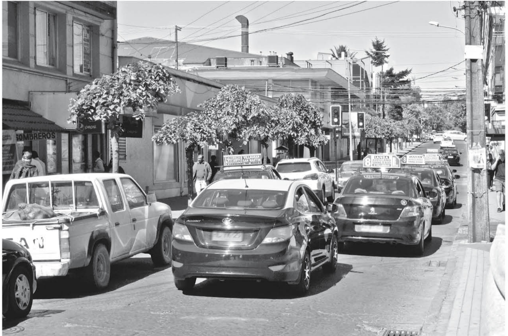
ESTA ENCUESTA VIENE A SER lo más próximo y concreto en el proceso de mejorar en el transporte público.

Por lo pronto, lo más próximo y concreto que se viene en este proceso de reingeniería local es la participación en una