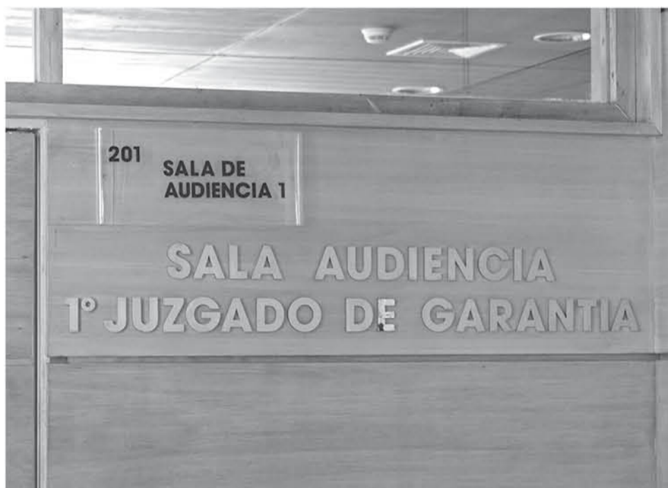
EL ACUSADO SERÍA UN HOMBRE con amplio prontuario policial, quien se mantendría en detención.