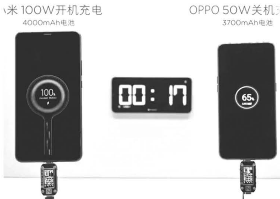
EL CARGADOR DE 100W logró vencer todos los récords.