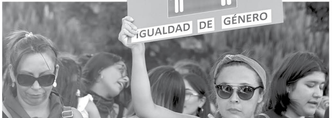
LA NOVEDAD DE LOS CARTELES fue lo que marcó la marcha este año.