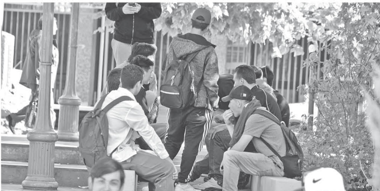
LOS ADOLESCENTES NECESITAN contar con educación sexual para cuidarse de enfermedades o embarazos no deseados.

Sin duda estos temas pueden resultar abrumador para los padres, debido a que la mayoría de ellos se crió en tiempos de analfabetismo que ha imperado en el campo de la sexualidad, pero es fundamental por el bienestar de las nuevas generaciones, que los progenitores asuman su responsabilidad y entiendan que la educación sexual es para toda la vida.