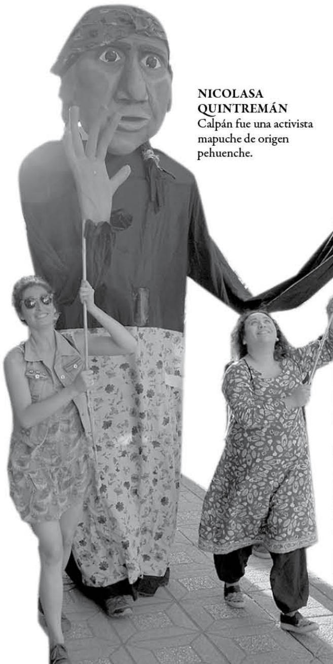
NICOLASA QUINTREMÁN Calpán fue una activista mapuche de origen pehuenche.