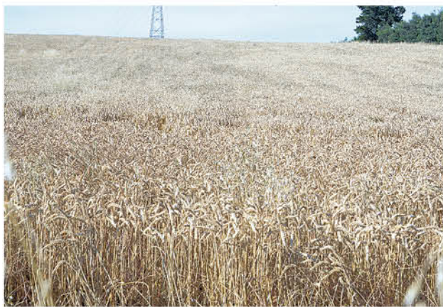
TRIGO, AVENA Y RAPS marcaron el cierre de su temporada de cosecha 2019.