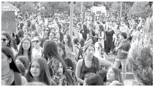
EN LOS ÁNGELES cerca de 600 caminaron por las calles de la comuna.

Reportaje: María Paz Rivera Arévalo