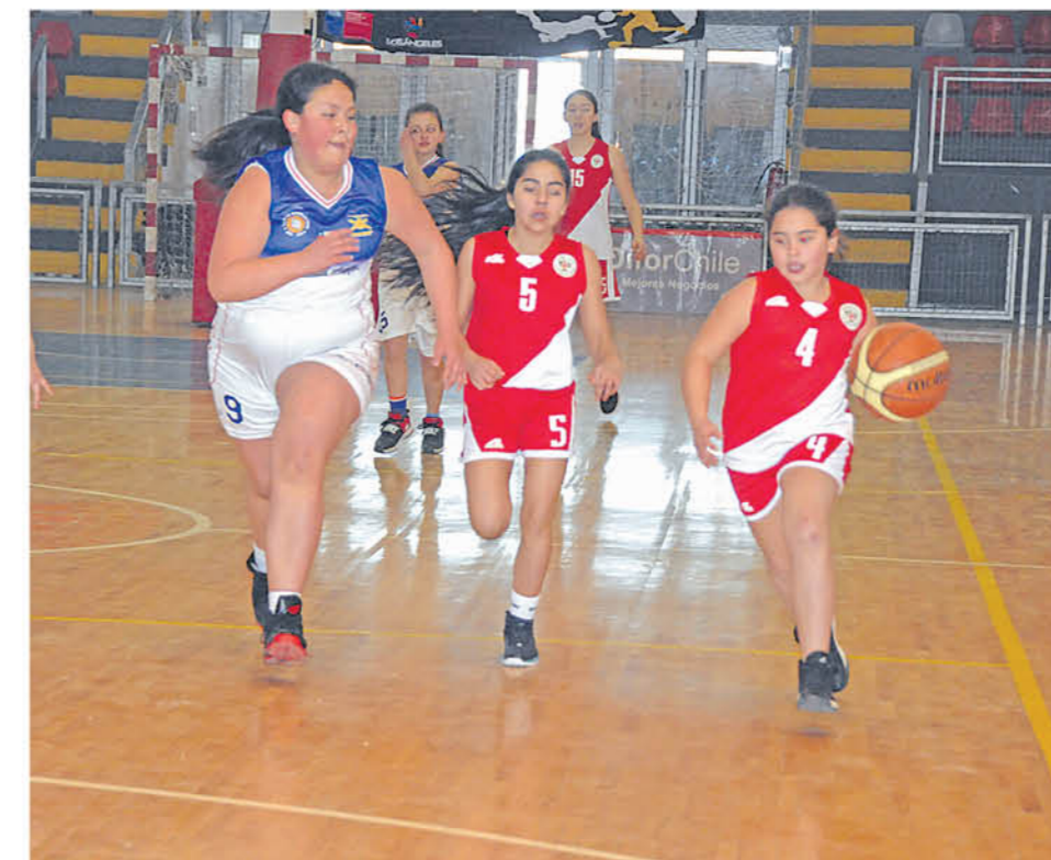
LAS CATEGORÍAS DEL BALONCESTO en la provincia van desde escolares hasta divisiones adultas.

abrirá fuegos; el martes 19 de marzo con las disputas en Categoría Senior; 21, Adulto Varones Todo Competitory el domingo 24 a las diferentes categorías. Y pese a tener el fixture listo, zanjen las directrices de una campaña para obtener un nuevo recinto deportivo, con la consigna de revolucionar el baloncesto en la zona.