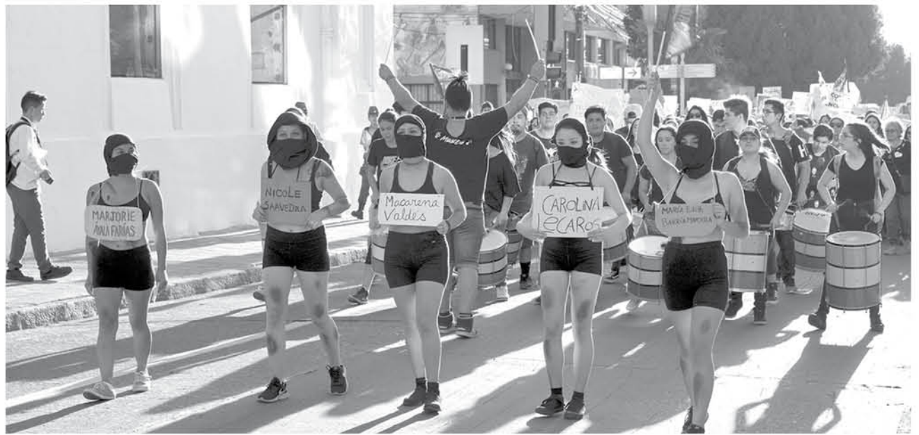
COMO YA ES COSTUMBRE se recordó a mujeres que han muerto por femicidios.