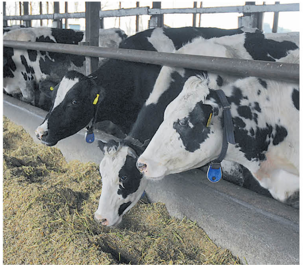
LOS PRODUCTORES ESPERAN que las plantas compradoras mejoren las condiciones de precio para el sector lácteo.

El presidente de Socabío resaltó también el aporte de la zona a la producción nacional. "Acá hay lecherías grandes y medianas, que están haciendo un aporte importante respecto de la producción nacional. Yo creo que cercano al 10% en la producción nacional y eso hace que seamos importantes respecto de lo que se produce también en invierno. Nuestras lecherías locales tienen una producción pareja durante todo el año, y eso para las plantas es muy beneficioso porque no nos olvidemos que para la zona sur, la producción