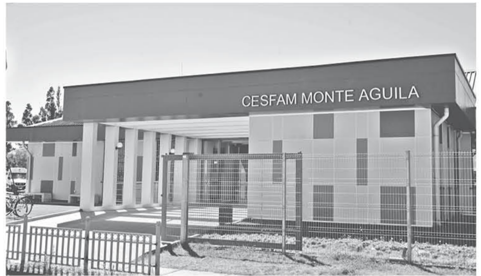
EL CENTRO DE SALUD FAMILIAR DE MONTEÁGUILA es por ahora el epicentro de una árida polémica laboral.

El concejal González realizó también una presentación a Contraloría en noviembre del 2018 donde señala claramente que existen más funcionarias afectadas por “reiterados episodios que pueden ser cata-