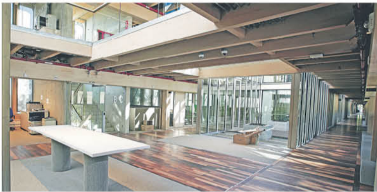
EL EDIFICIO DE LA CMPC está ubicado en acceso norte de Los Ángeles.

en calle Pedro Stark de avenida Las Industrias, que tiene más de cinco mil 500 metros cuadrados de oficinas y una capacidad de 470 puestos de trabajo. Además está diseñado de forma amigable con el medio ambiente y cuenta con certificaciones internacionales en la materia.