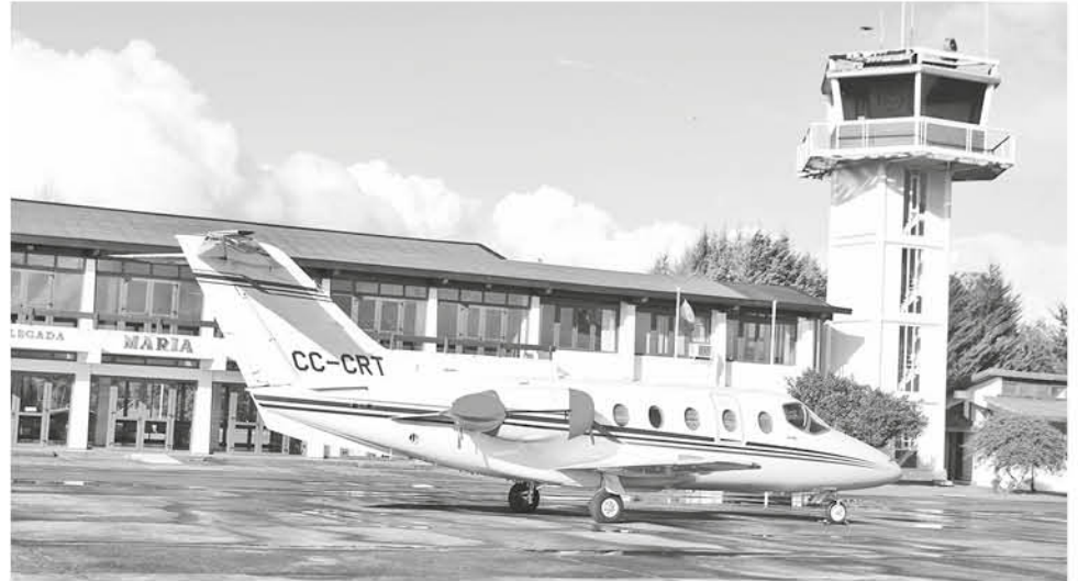
TODAS LAS FUENTES consultadas por La Tribuna coinciden en la necesidad de unir fuerzas para lograr la reapertura comercial de María Dolores.