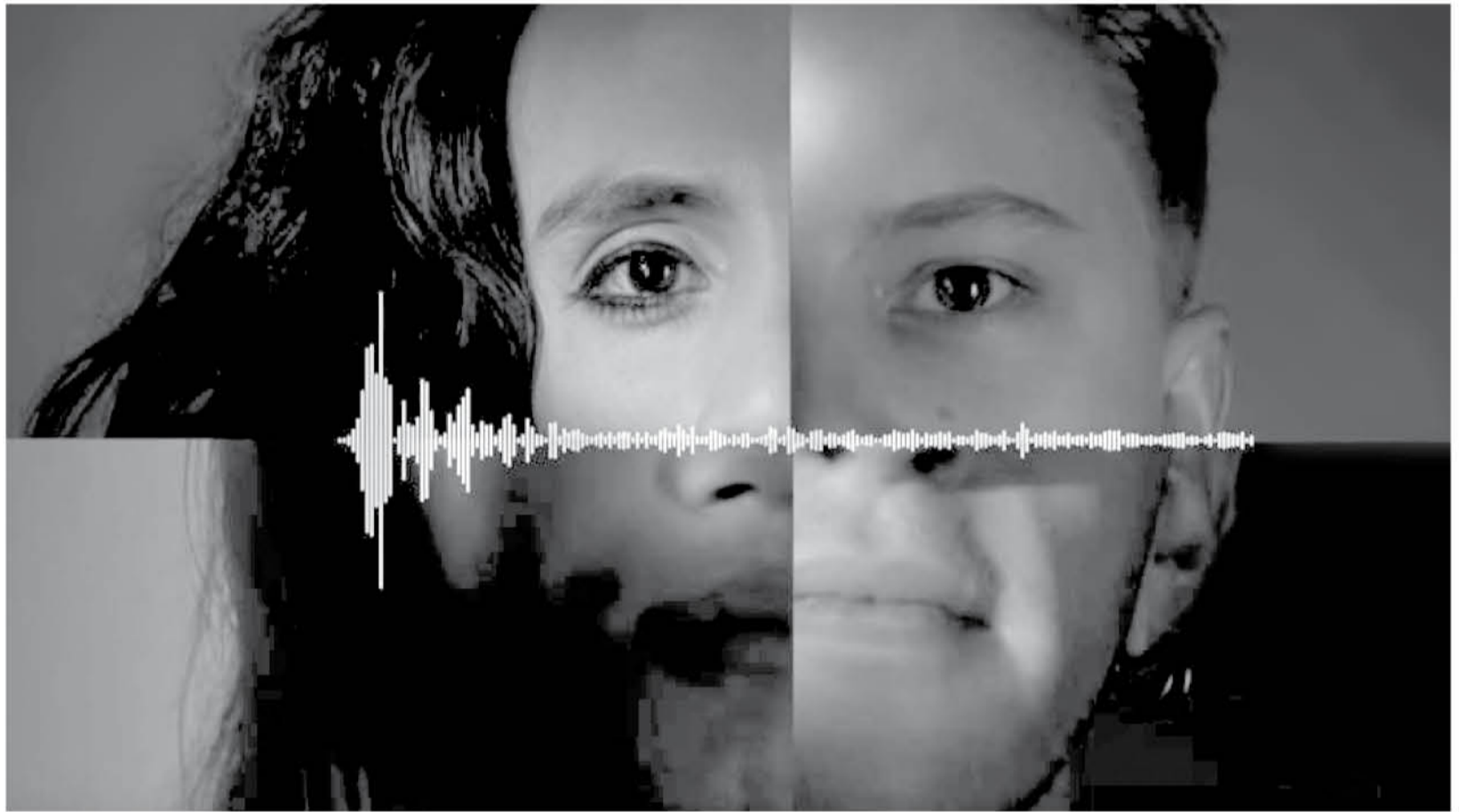
EL PROGRAMA HA SIDO CREADO para eliminar los prejuicios de género en la tecnología.