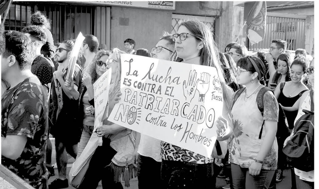
DISTINTAS CIUDADES del país fueron puntos de encuentro para la marcha feminista que se realizó el 8M.