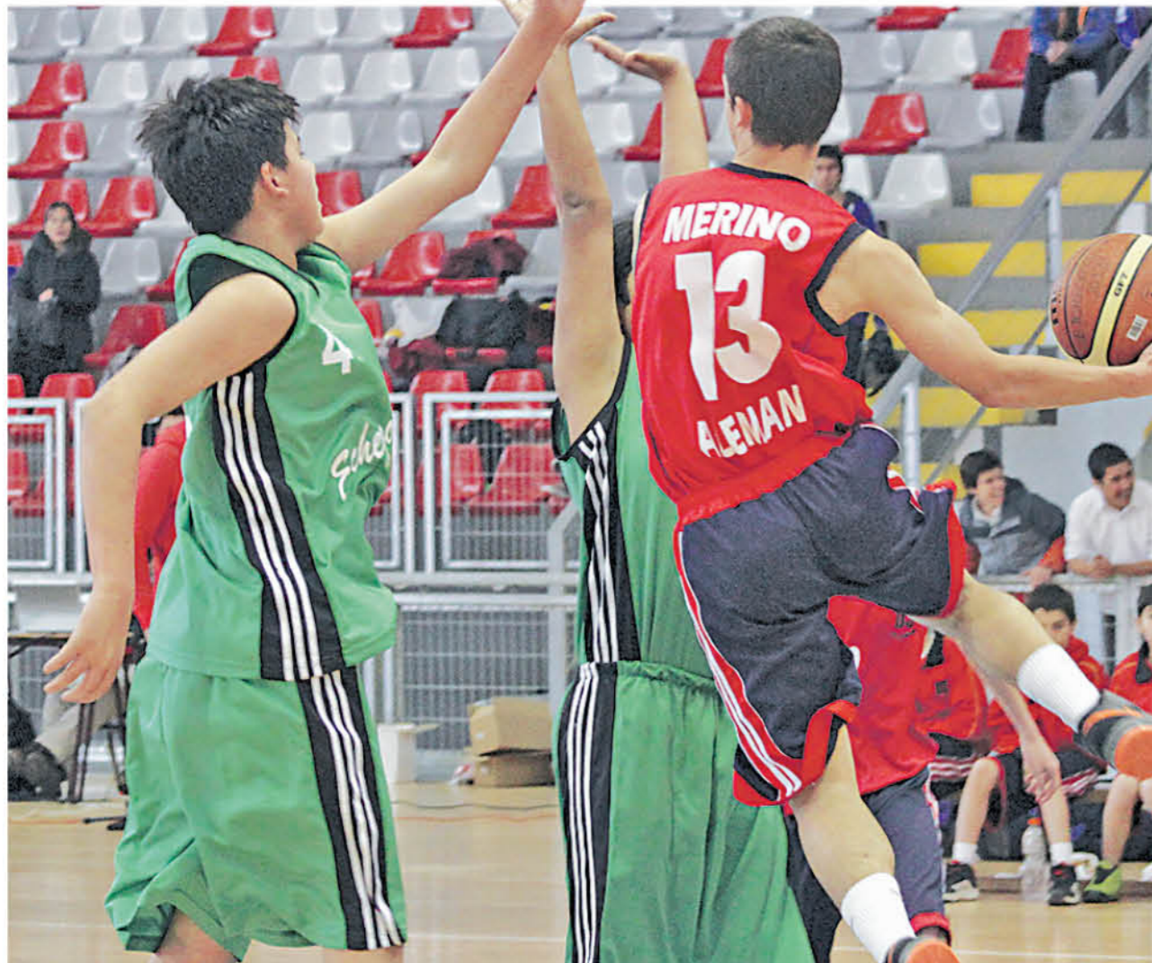
TODAS LAS LIGAS se jugarán en paralelo. La VIP los sábados, Biobío domingo, y estudiantil martes junto a jueves.