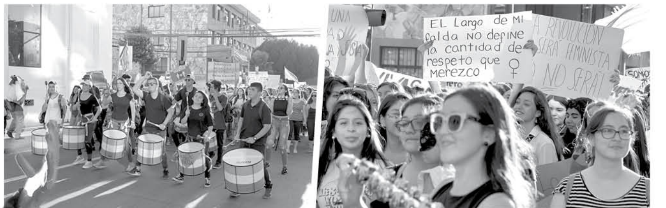
DISTINTAS ACTIVIDADES se realizaron durante el desarrollo de la manifestación.