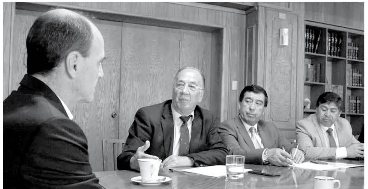
UNA EXITOSA REUNIÓN que finalizó con buenas noticias para los ansiosos socios del comité habitacional Las Maravillas.