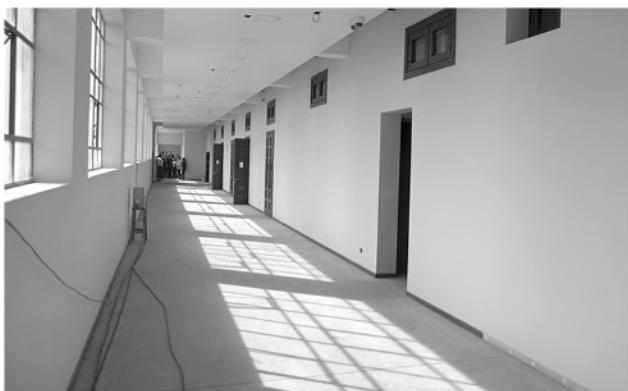
EN EL SEGUNDO PISO estará la Escuela de Ballet que albergará a 120 alumnas y alumnos.