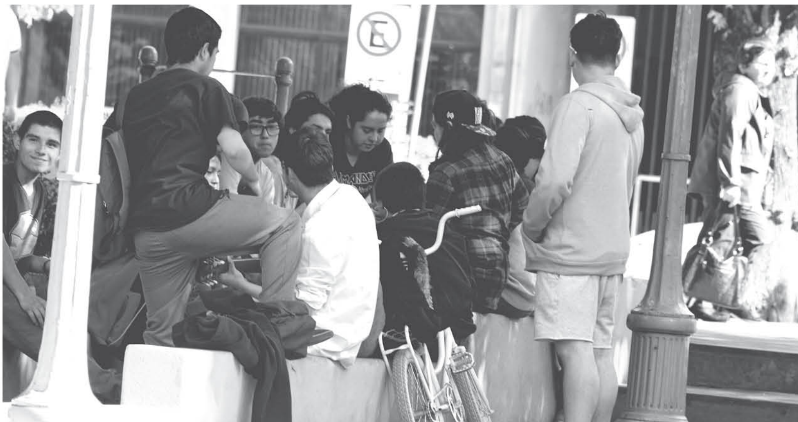
EL CONTROL DE IDENTIDAD se aplicaría a menores desde los 14 años.