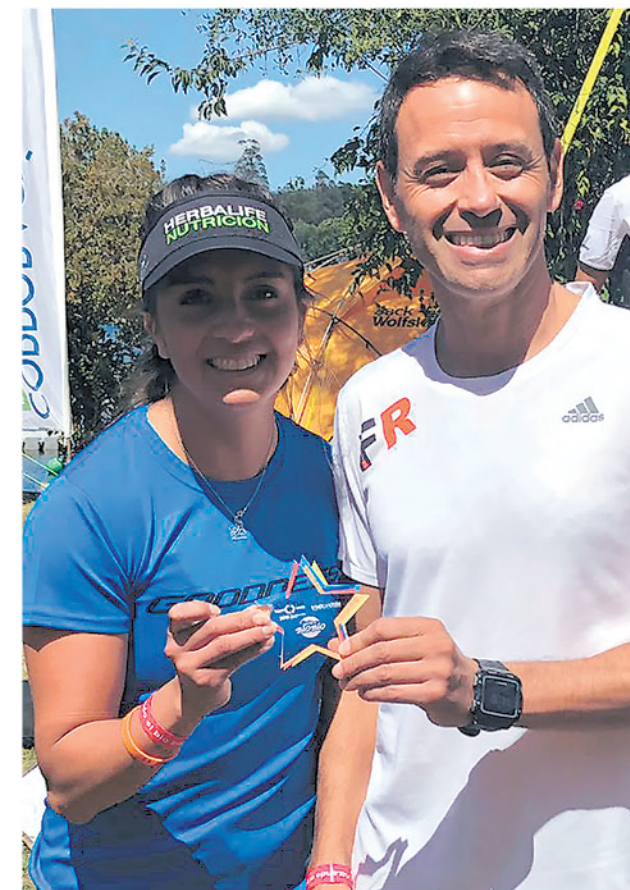
AMBOS ATLETAS BUSCARÁN finalizar la convocatoria mundial y finalizar dentro de los 50 mejores.

llar, enfocada en lo que fue la prueba más difícil de triatlón el país: el IronMan 70.3.