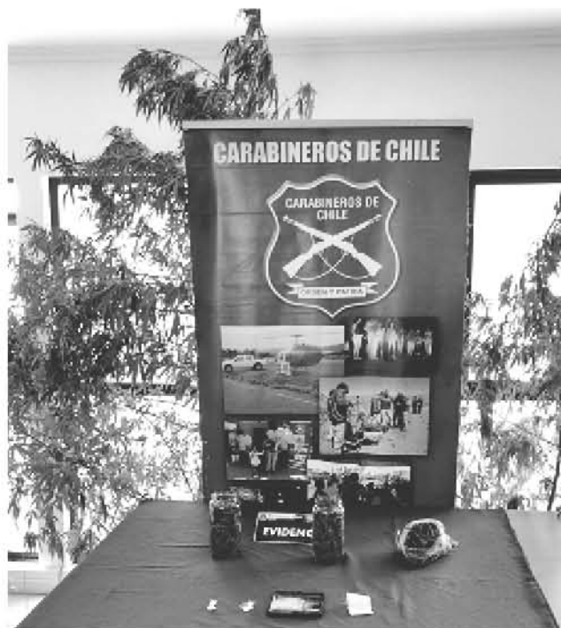
INCAUTACIÓN DE DROGA por el OS7 de Los Ángeles.

El llamado de las autoridades en torno a estos fonos es de atreverse a denunciar, ya que ambos números tanto el de OS7 de Carabineros son completamente anónimos.