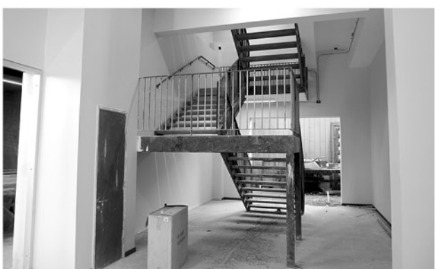
HASTA HOY, EXISTEN dos pisos aprobados para remodelación y se trabaja para lograr fondos del tercero.