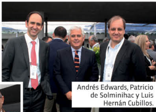
Andrés Edwards, Patricio de Solminihac y Luis Hernán Cubillos.