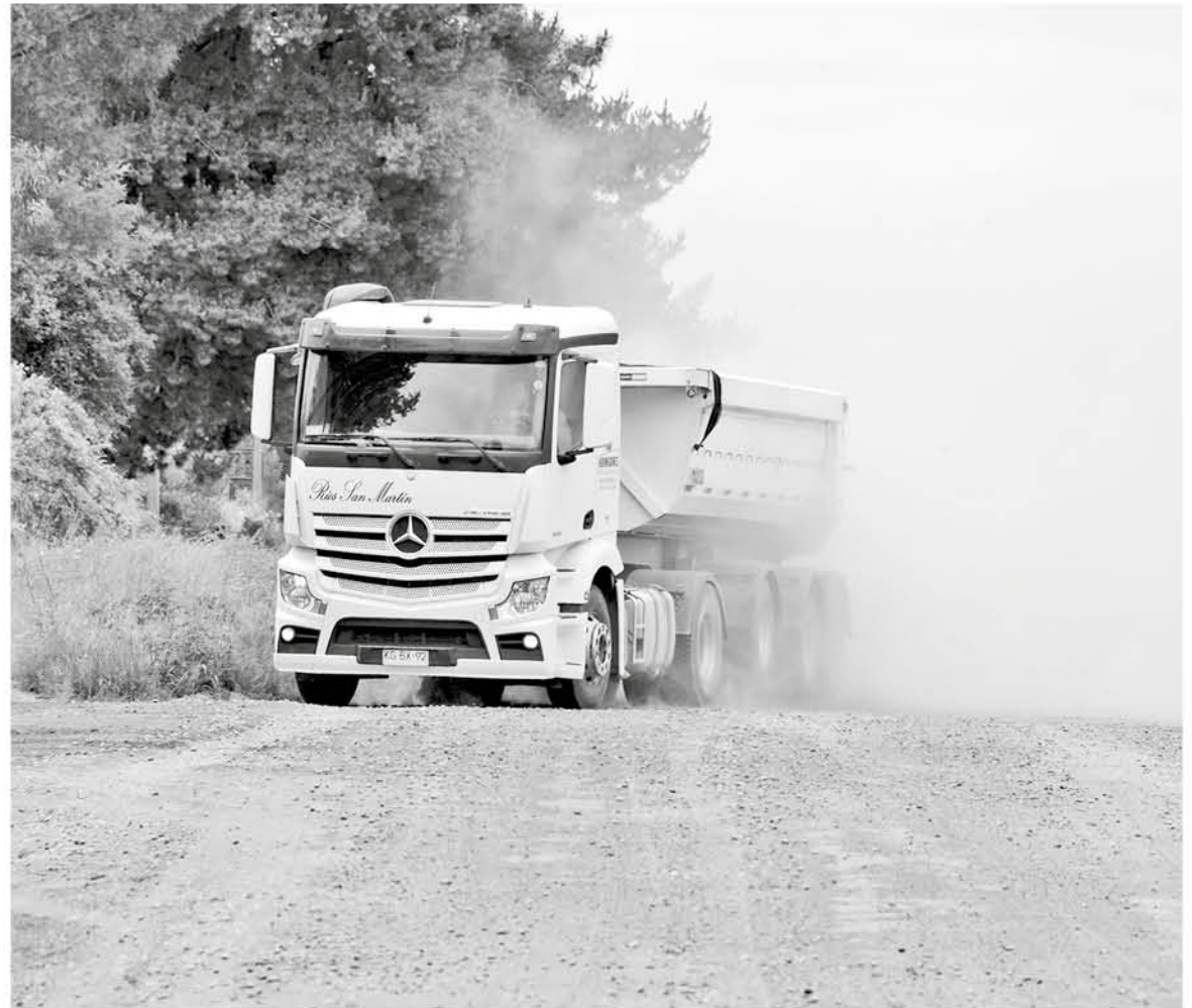
SI BIEN EN LA INDUSTRIA reconocen que la construcción de un edificio resulta incómoda para los vecinos, el problema está lejos de solucionarse.

A ello agregó que igualmente toda obra trae algún impacto, “eso no lo vamos a poder evitar, así es que pedirle a los constructores y vecinos que de alguna manera puedan permitirse