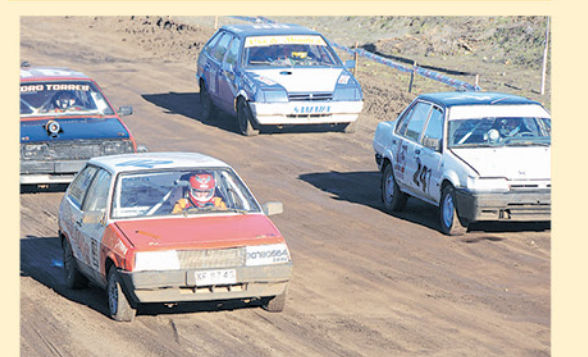
LA PRÓXIMA FECHA está programada para el 14 de abril del presente año.