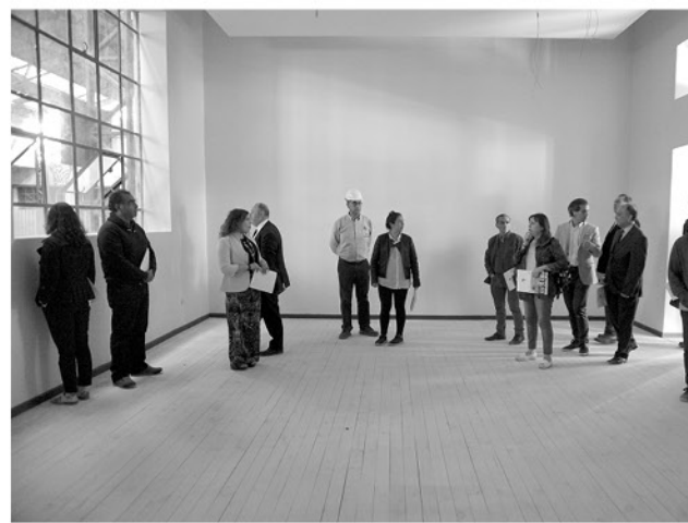
LA SALA DE AUDIO está lista en su estructura. Ahora debe ser trabajada por los ingenieros en sonido para darle un correcto funcionamiento.