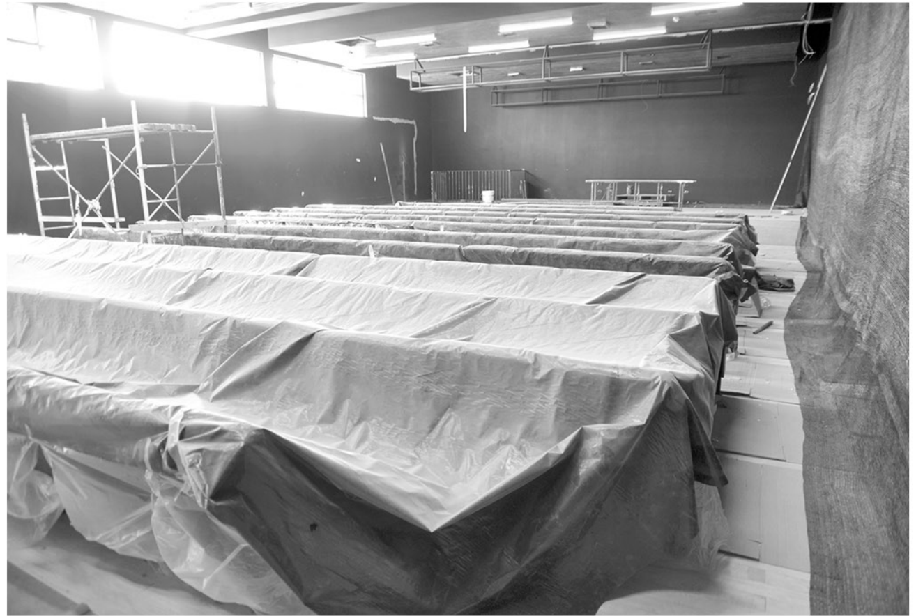
LA SALA MULTIUSO DE TEATRO está casi lista, sólo falta el tema de la iluminación. Capacidad 120 personas.