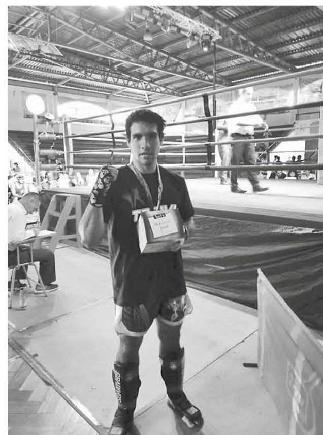
EL EXPONENTE que ahora viste la tricota de El Constructor, se coronó campeón panamericano en México, cinturones todo color - 86 kg.