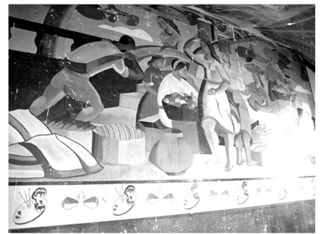
LOS MURALES DE ANARKOS BERMEDO deberán ser tratados de forma cuidadosa pues hay daños estructurales importantes