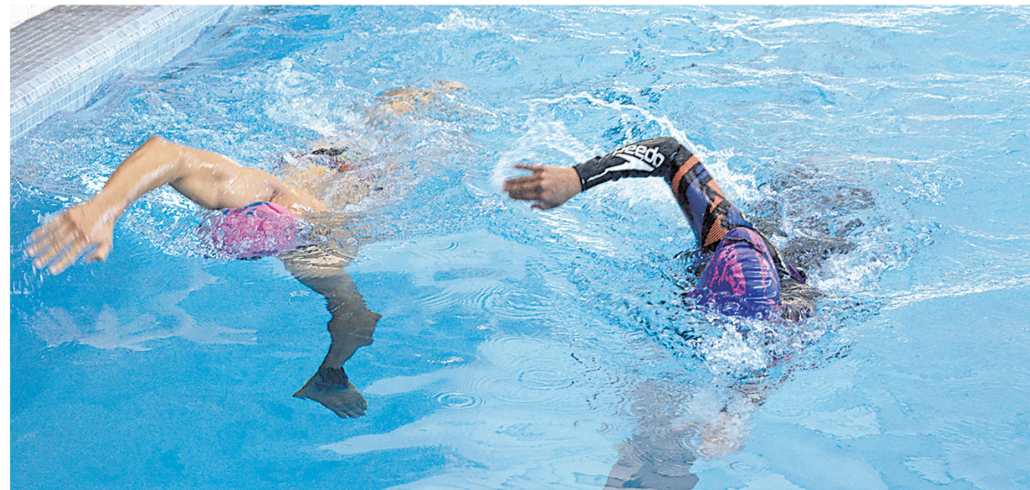
EN EL MUNDIAL, los angelinos deberán hacer frente a miles de triatletas, 800 de ellos españoles.

El entrenamiento de la atleta comenzó el 2018, con resultados positivos en las pruebas de Quillón y Fruti-