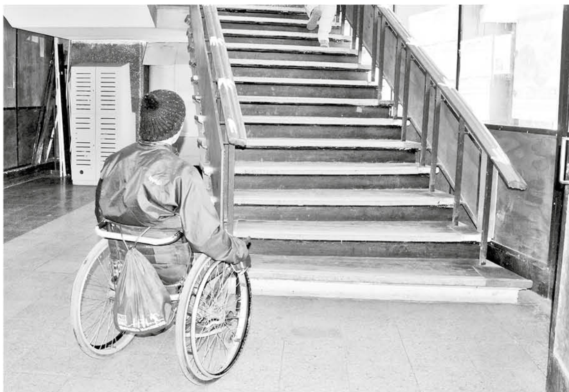
LA NORMATIVA entró en vigencia el 4 de marzo del 2016.

"Yo creo que la accesibilidad en general es un tema donde como sociedad nos falta mucho por avanzar y -precisamente- este es uno de los temas donde se ha avanzado, pero queda mucho por avanzar también, yo creo que hay que ser honesto y transparentar que en este caso se entiende que un edificio es accesible,