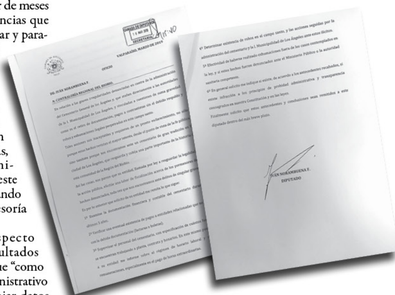
LOS DOCUMENTOS INGRESADOS al organismo nacional.