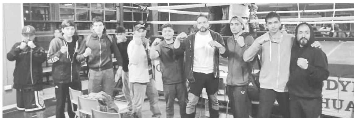
LOS BOXEADORES se subieron al ring en la comuna de Hualpén, demostrando que fueron superiores, pese al veredicto.

De todas formas, el entrenador destacó que "ganar o perder no es lo importante, lo que realmente nuestro club busca, es sacar adelante a muchos jóvenes que quieran cambiar su estilo de vida y practicar el boxeo amateur".