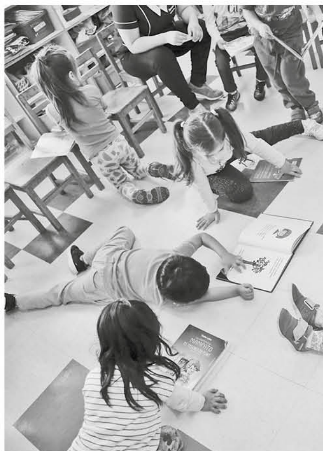
LA ACTIVIDAD busca ser un agente facilitador de la lectura.

al respecto las pueden hacer directamente en el municipio, en la OIRS de la página web de la seremi de Salud, en la oficina de la autoridad sanitaria, ubicada en avda. Ricardo Vicuña 371, además de la Superintendencia del Medio Ambiente –SMA–.