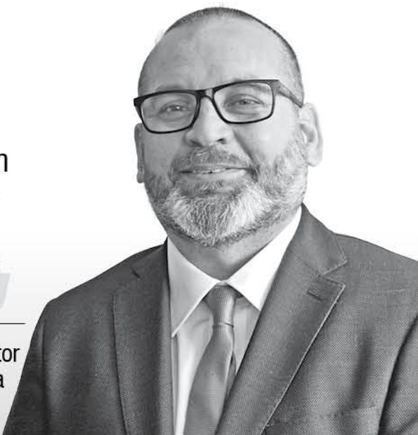
ACADÉMICO CON EXPERIENCIA en temas judiciales y forenses.