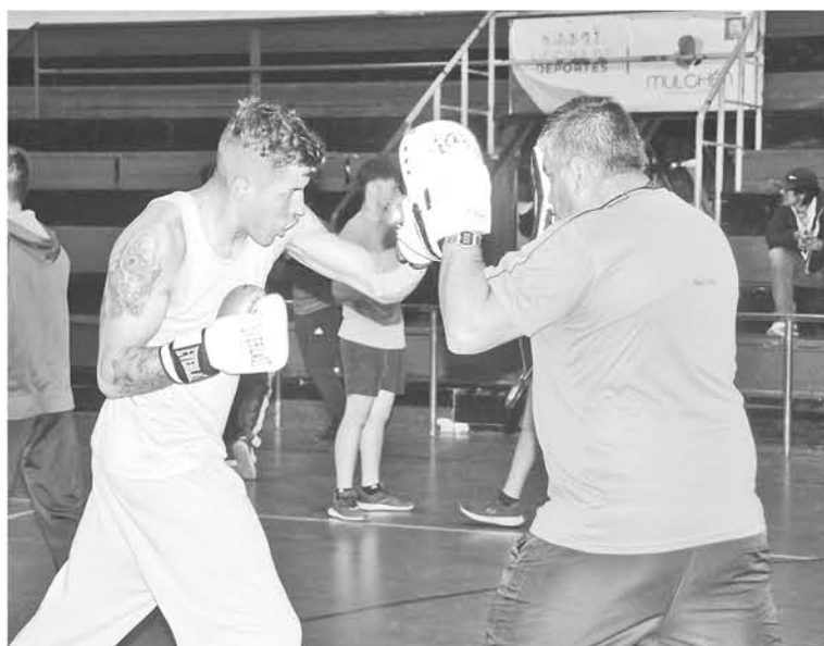
LA PRÓXIMA VELADA PUGILÍSTICA, buscarán realizarla dentro de la provincia de Biobío, en Santa Bárbara.

provinciales, no fue una velada triunfal, ya que los luchadores no pudieron cerrar todos sus combates con éxito.