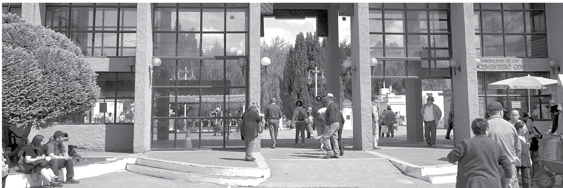
EL CEMENTERIO GENERAL de Los Ángeles, está a cargo del municipio angelino y se ha mantenido permanentemente cuestionado por su capacidad y además por sus servicios.