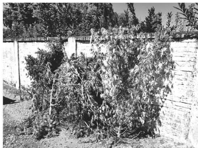
DECOMISO DE PLANTAS de marihuana en Negrete.