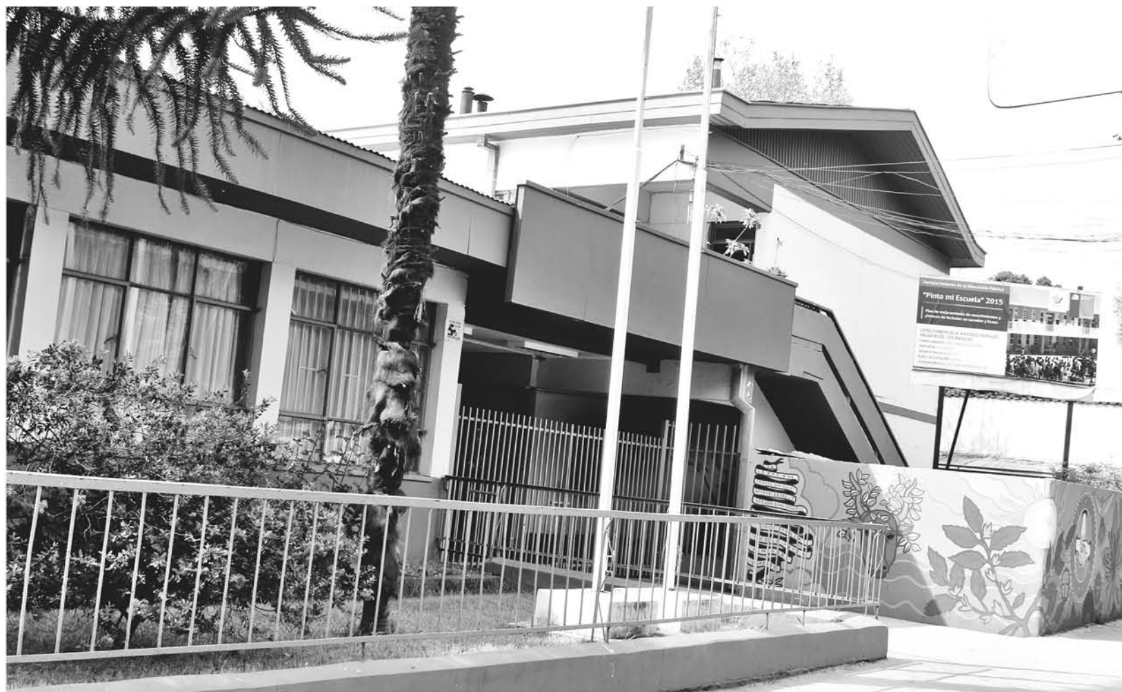
PROFESORES DE LAS LLAMADAS ENTIDADES EVALUADORAS de liceos como el Comercial, Industrial, entre otros, se encuentran con honorarios impagos.

Los profesores de enseñanza media, no quisieron entregar sus identidades, ya que prefieren proteger sus nombres para no ser víctimas de discriminación por exponer públicamente