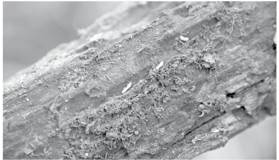
LAS TERMITAS HAN PROVOCADO problemas desde hace ya varios años.

Igualmente, Inostroza recordó que “las termitas llevan años, se han ido proli-