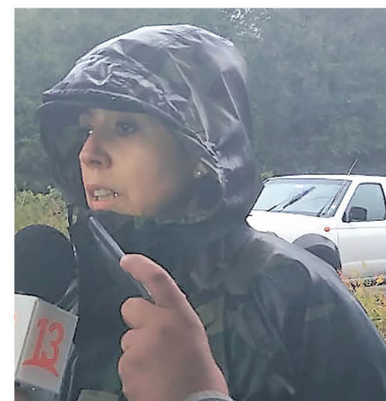
LA FISCAL MATORANA se trasladó hasta el lugar para realizar las primeras indagaciones

no tiene riesgo vital; además de otra persona con una aparente contusión lumbar, que no sabemos qué tipo de lesión es". Junto a ello, dejó en claro que ninguna de las tres personas presenta riesgo vital "hasta el minuto".