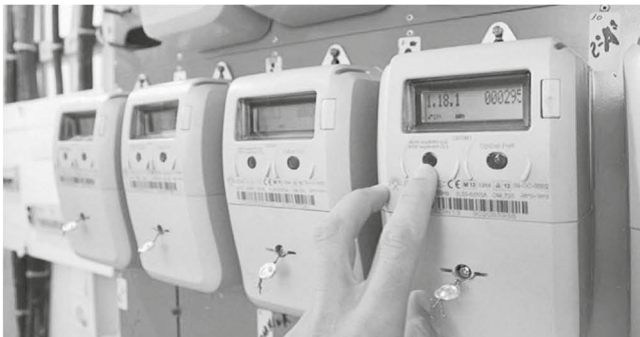
LOS MEDIDORES INTELIGENTES ya comenzaron a reemplazar a los análogos, y se espera que al 2025 todo Chile posea este aparato.

“Es un medidor digital, este sistema va a controlar el consumo minuto a minuto, primero nosotros vamos a saber cómo nos estamos com-