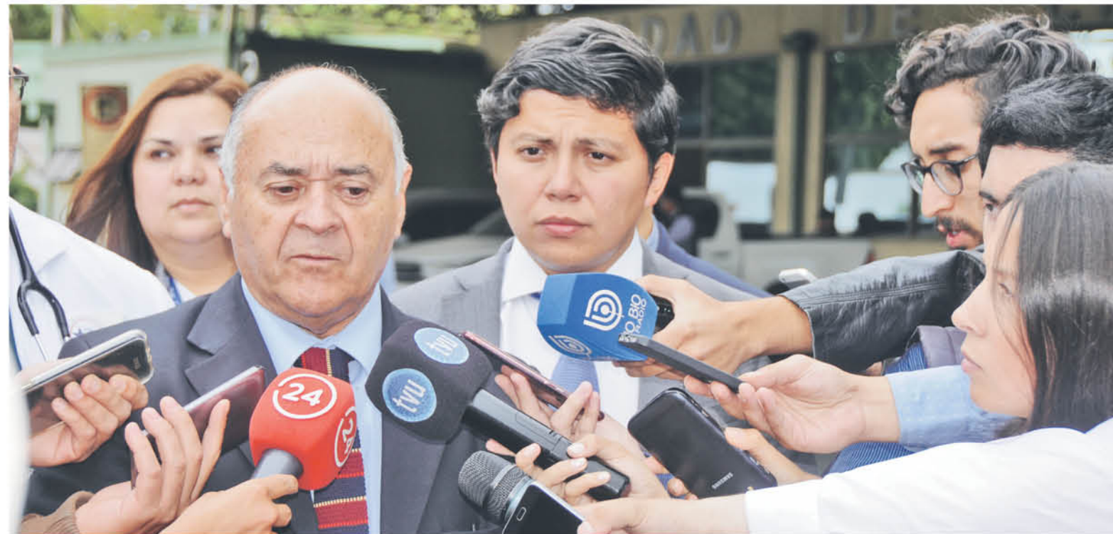
AUTORIDADES REGIONALES se trasladaron hasta el hospital base de Los Ángeles para entregar la información oficial.

Una vez que el fallo quede ejecutoriado, el tribunal dispuso que se proceda a la toma de muestras biológicas del sentenciado para determinar su huella genética e inclusión en el registro nacional de ADN de condenados.