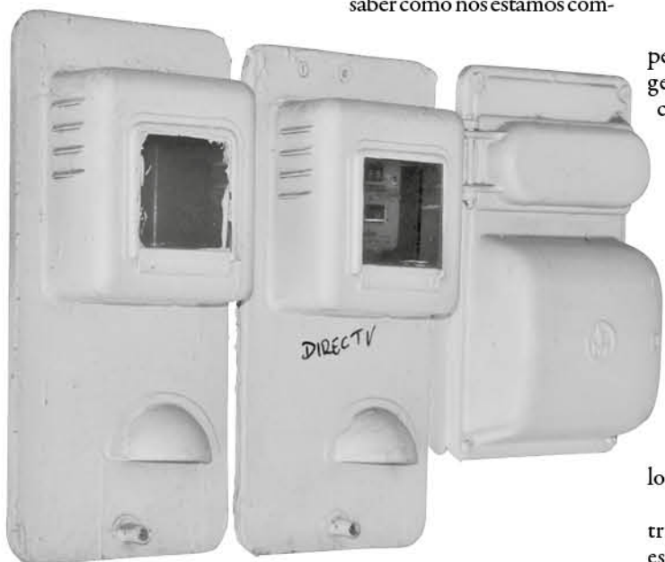
EL ACTUAL MEDIDOR no permite “descotar” la energía que se autogenera por paneles solares en el hogar.

Se pagará en promedio de 200 a 300 pesos más en los gastos fijos pero será la empresa la que esté obligada a reparaciones, cambios y la instalación.