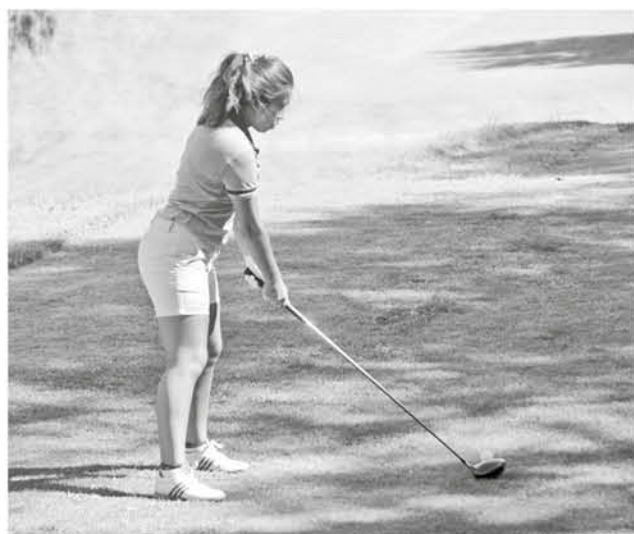
ESTAS INSTANCIAS DE GOLF son especiales para que los novatos puedan aprender de los mejores dentro del circuito nacional.

Con más de 70 jugadores de Golf que arribaron desde los clubes de Temuco, Chillán, Concepción y Los Ángeles dieron el primer golpe desde el hoyo uno, al "Campeonato de Apertura Golf 7-Ríos", dentro de una de las canchas más importantes en el país de la especialidad, pertenecientes al Club de Golf 7 Ríos