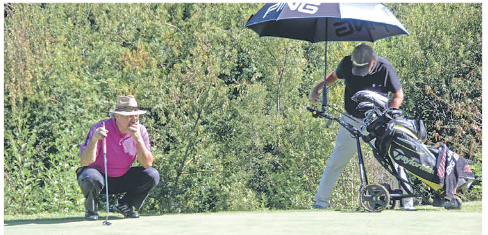
LOS NERVIOS POR GANAR la primera partida se hizo latente durante toda la jornada del torneo.