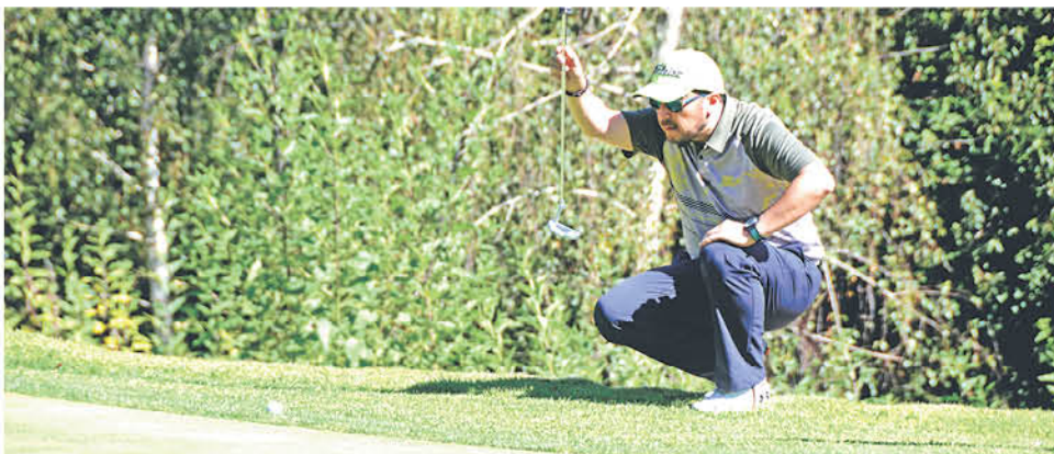
CERCA DE 50 PERSONAS asistieron a la inauguración de la temporada 2019.