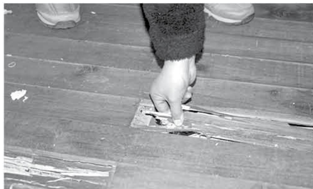
SON CERCA DE 1.400 las viviendas afectadas por el insecto.

ferando en distintos sectores, recordemos que hace poco más de un año, según un diagnóstico que hicimos en todo el sector industrial de las mil