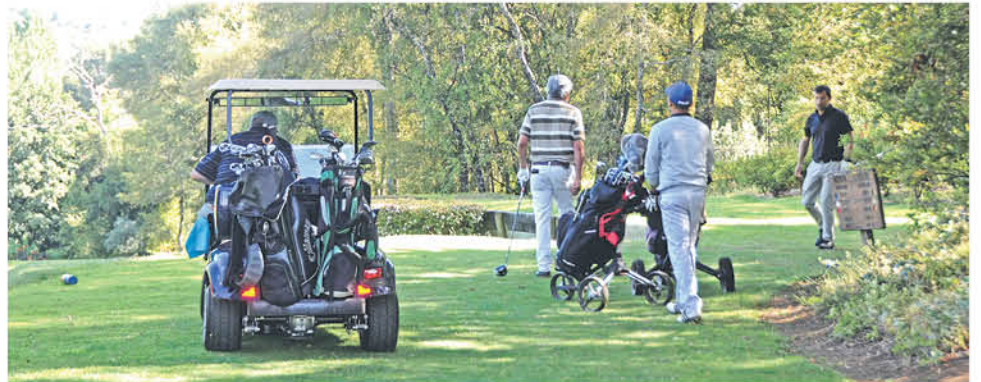
REFERENTE A LA TEMPORADA, el director del club 7 Ríos comentó que esta temporada tendrá grandes novedades.