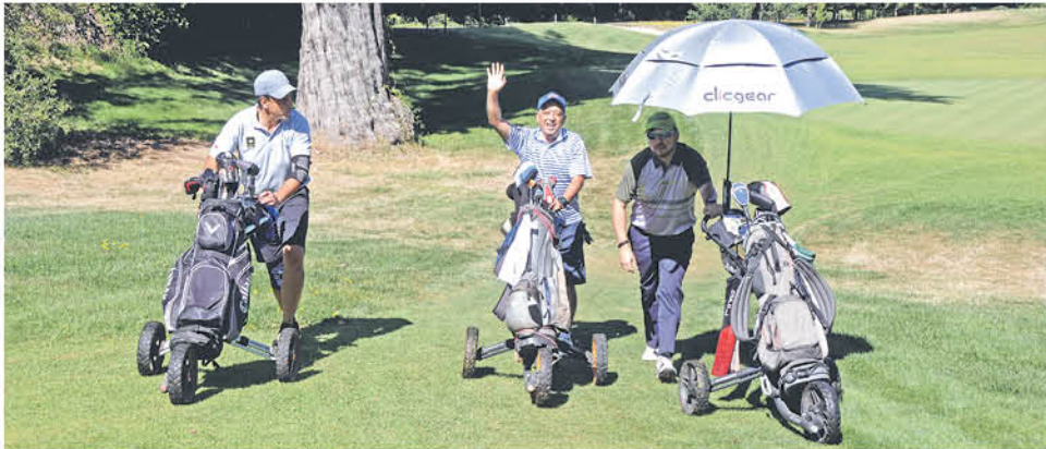
DEPORTISTAS DE TODO EL PAÍS llegaron por el fin de semana con sus familias para sortear las diversas dificultades que les presentó este circuito.