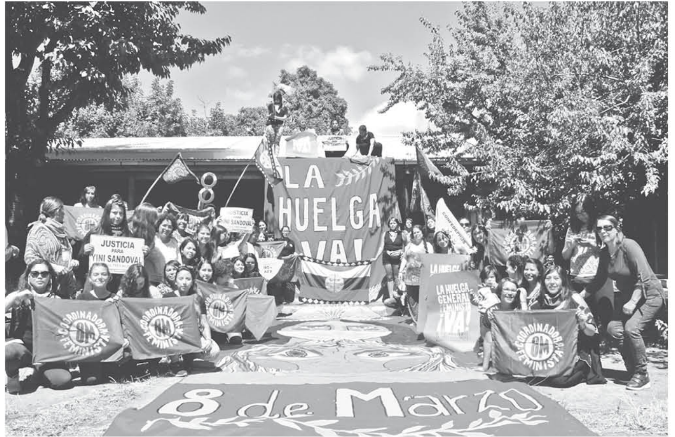
A ESTA ACTIVIDAD SE ESPERA que sumen colectivos y personas de toda la provincia de Biobío.

“la marcha parte a las 6:30 en la Plaza de Armas, las mujeres van a ir delante y luego de esto va el bloque mixto, posterior a ello, se van a realizar la lectura del discurso a nivel nacional y a ello se suma el discurso a nivel territorial a lo que se suman las presentaciones artísticas de diferentes mujeres como danzas tribales, Eva Luna y otras presentacio-