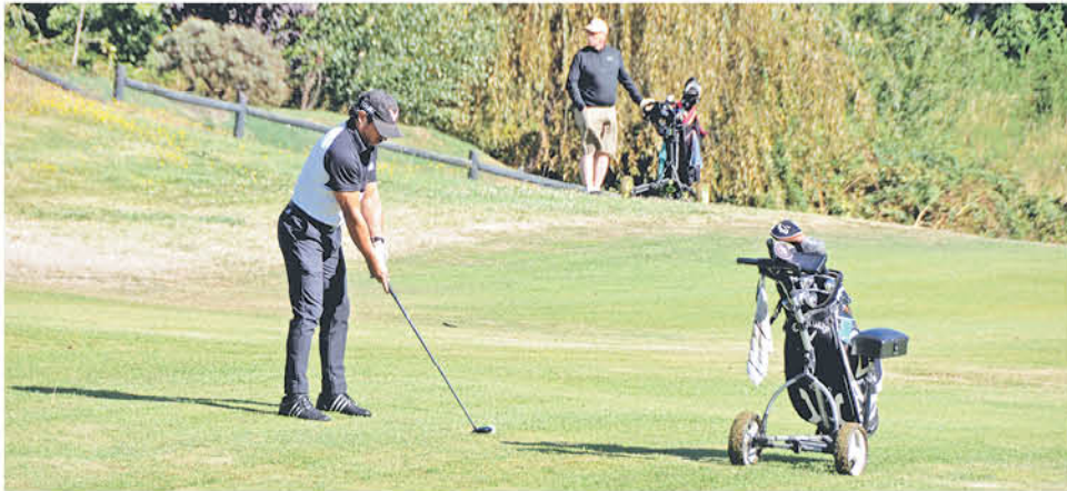
LOS GOLFISTAS DIERON el primer golpe de la temporada el pasado fin de semana a eso de las 9:00 horas.