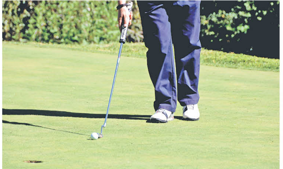
EN UNA DE LAS CANCHAS DE GOLF más naturales e imponentes de la provincia de Biobío se dio inicio a la nueva temporada de golf.