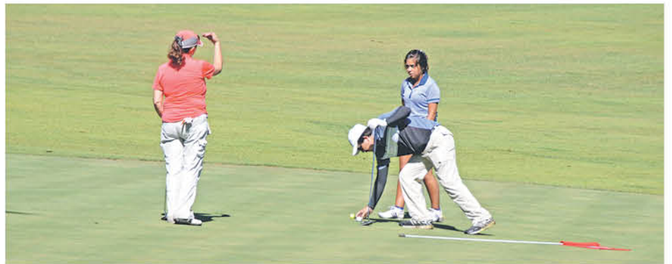
EN ESTA TEMPORADA la disciplina será fundamental para poder tener éxito durante los torneos futuros.