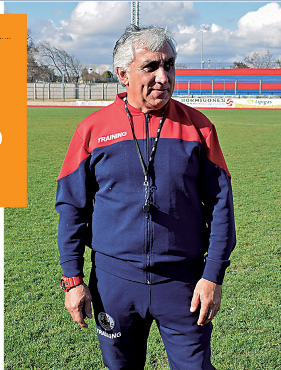
EL ESTRATEGA ENFATIZÓ que realizarán un férreo trabajo en las instalaciones de Siete Ríos y Ormpello esta semana.