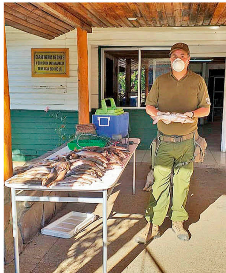
MÁS DE 200 ESPECIES SALMONÍDEAS fueron decomisadas por Carabineros en plena veda.

La ley es clara, expresa categóricamente