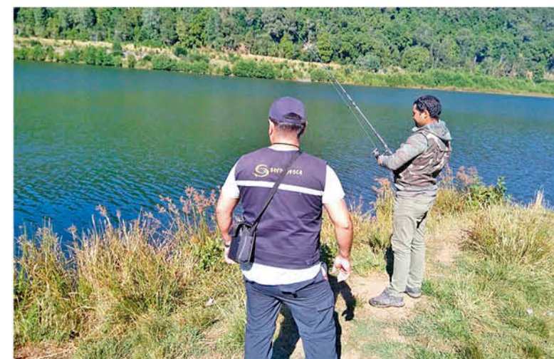
SE BUSCA RESGUARDAR las especies y ecosistemas de aguas continentales.