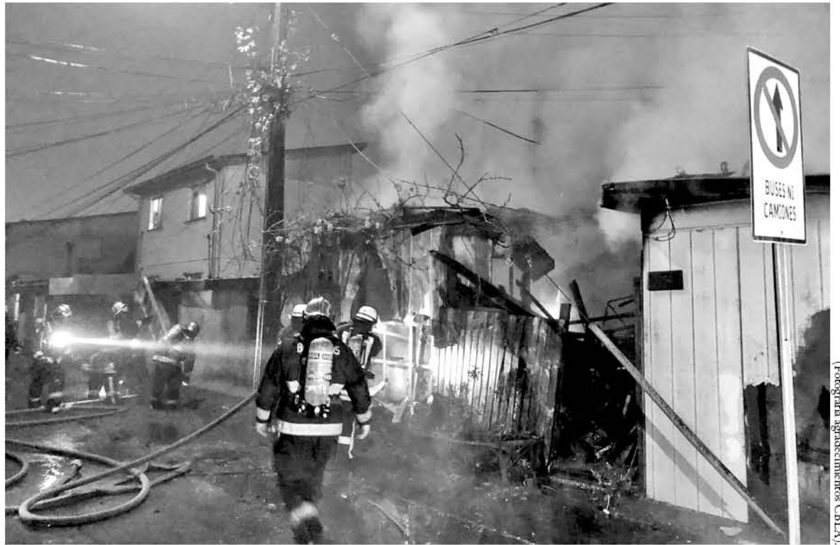
LOS VOLUNTARIOS trabajaron por más de dos horas para extinguir las llamas en este lugar.