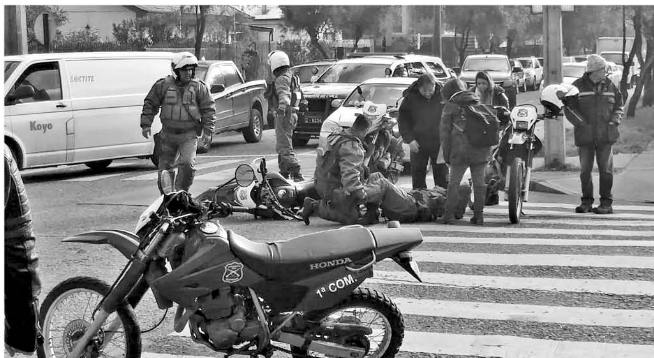
LA INVESTIGACIÓN va a determinar en qué condiciones se encontraba este conductor.

Cerca de las once de la mañana se registró el hecho donde se vio afectado el funcionario de la Primera comisaría de Los Ángeles.