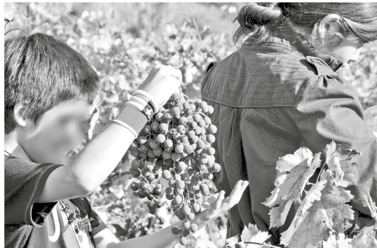
EN BIOBÍO, representado por la zona macrocentro, son 48 mil niños y niñas trabajando.

Si bien no existen cifras específicas de la cantidad de menores que están insertos en este mundo, en base a encuentros y conversatorios con niños, niñas, jóvenes y diversos actores locales, se ha podido analizar, en cierto modo, el panorama local.