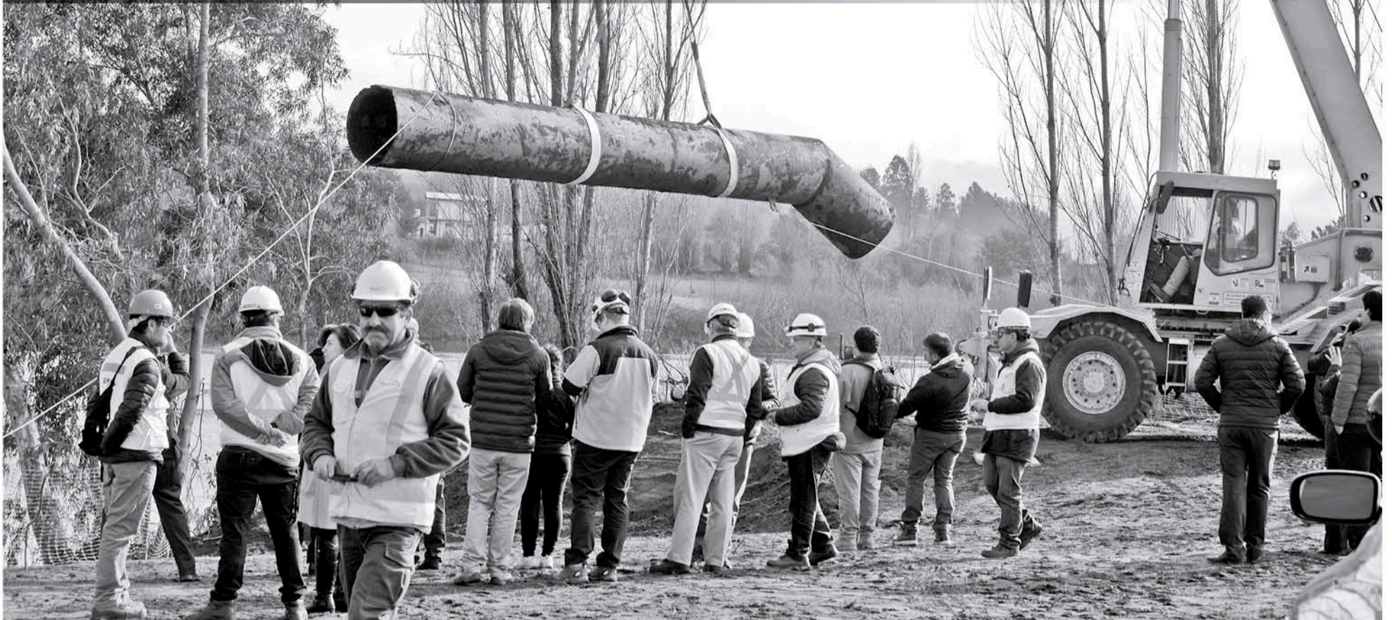
DESPUÉS DE AÑOS el ducto fue extraído asegurando que ya no hay llegada de agua a este río.

Durante el día martes se clausuró la salida de agua de la empresa ex Inforsa que durante años desembocó en el río Vergara y generaba gran preocupación a la comunidad.