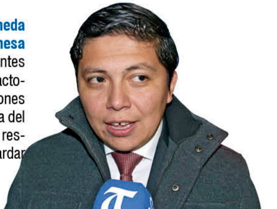
Ignacio Fica, gobernador de Biobío.

Tal como hemos hecho con la leña húmeda y de origen nativo, crearemos una mesa de fiscalización de la pesca furtiva con diferentes servicios públicos, los municipios, Carabineros y actores privados. Esto en el marco de las prohibiciones existentes sobre la pesca deportiva en esta época del año. Es por lo mismo que hacemos un llamado a respetar la normativa vigente, como también salvaguardar nuestra fauna y su ecosistema".