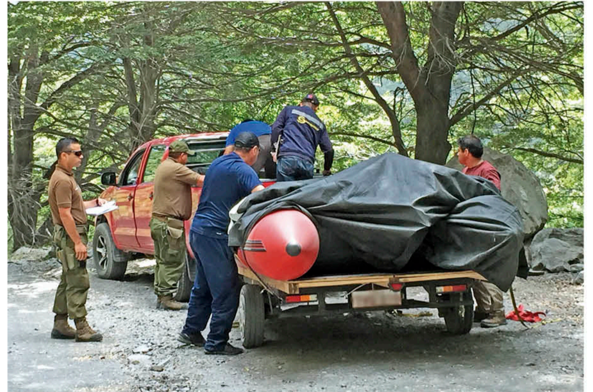
LA VEDA SE MANTENDRÁ HASTA EL MES DE NOVIEMBRE, por lo que Carabineros dispone de diversos medios para desarrollar los operativos en coordinación con Sernapesca y Conaf.

co el presidente de la Asociación de Pesca y Caza, al argumentar que la normativa permite requisar todo lo que sea utilizado en la pesca, "y eso conlleva a que se puede decomisar no solamente las cañas, sino que tam-