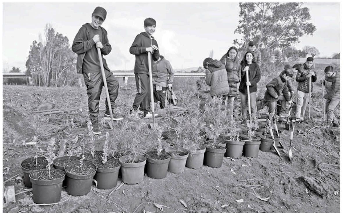
EN MEDIO DE LA ACTIVIDAD se realizó la plantación de árboles.

Como cierre de este ciclo, además, una serie de niños de la Escuela de Fútbol "Talento de Barrio" del sector Estación acompañaron a las autoridades en la plantación de árboles nativos que fueron donados por la empresa CMPC.