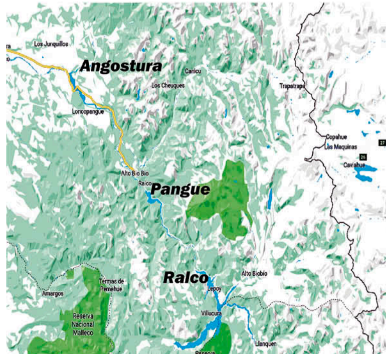
LA LLAMADA ZONA DE CORDÓN DE LAGOS figura como lugar vulnerable a la pesca ilegal, según se advierte.

La Corporación Nacional Forestal del Biobío -Conaf- entregó capacitación y nombró a tres funcionarios