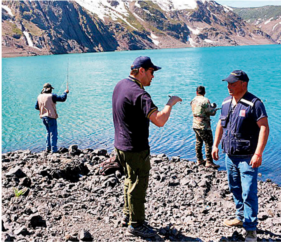
CON FISCALIZACIONES Y CONTROLES se combate la pesca ilegal en la provincia de Biobío.

De manera paralela a la fiscalización que desarrolla Sernapesca, se acordó capacitar a funcionarios de Carabineros en la Ley de Pesca Recreativa, sumando a funcionarios de Conaf como inspectores ad honorem, explicó el director