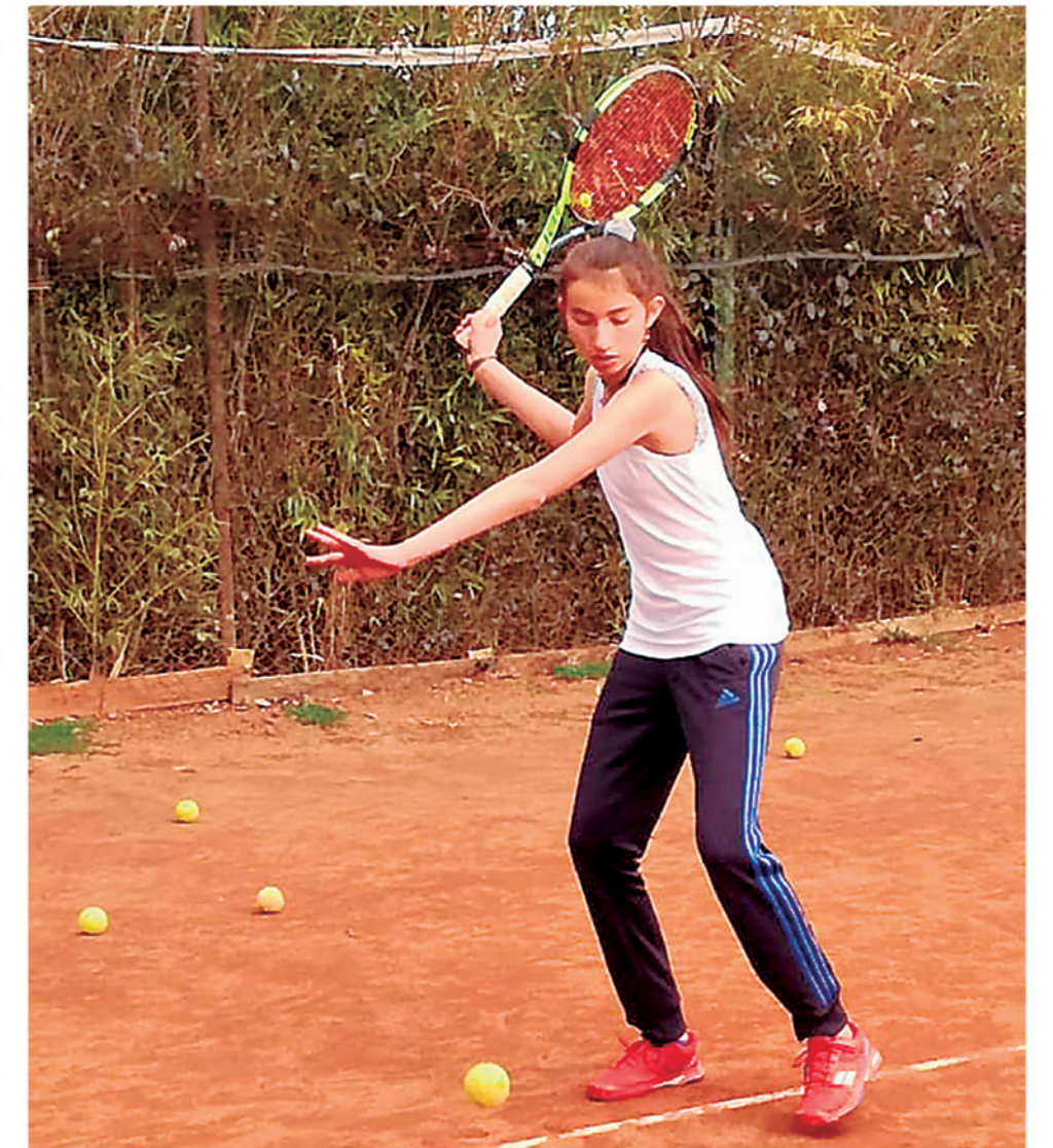
LA JOVEN PROMESA del "deporte blanco", será la única que defenderá al "Avellanito" en la convocatoria nacional.

Actualmente la promesa del tenis nacional sólo se encuentra auspiciada y apoyada por la Clínica Kinésica de la Universidad Santo Tomás, sede Los Ángeles, la cual le brinda apoyo por medio de terapias de recuperación de lesiones y desgaste físico, por lo tanto, el resto de los gastos asociados a su actividad los tiene que sortear de manera particular