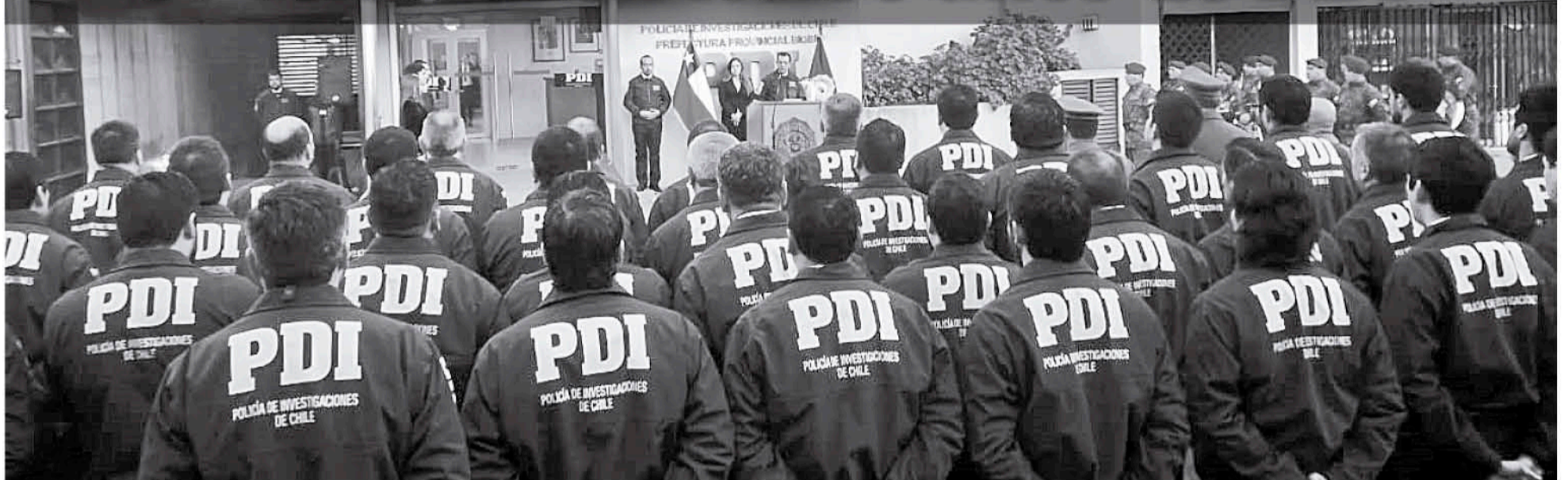
COMO CADA 19 DE JUNIO, los funcionarios se reunieron para el izamiento de la bandera.

En la capital provincial se llevó a cabo la ceremonia de izamiento de pabellón nacional, además, se realizó la confirmación de los espacios necesarios para ampliar las funciones.