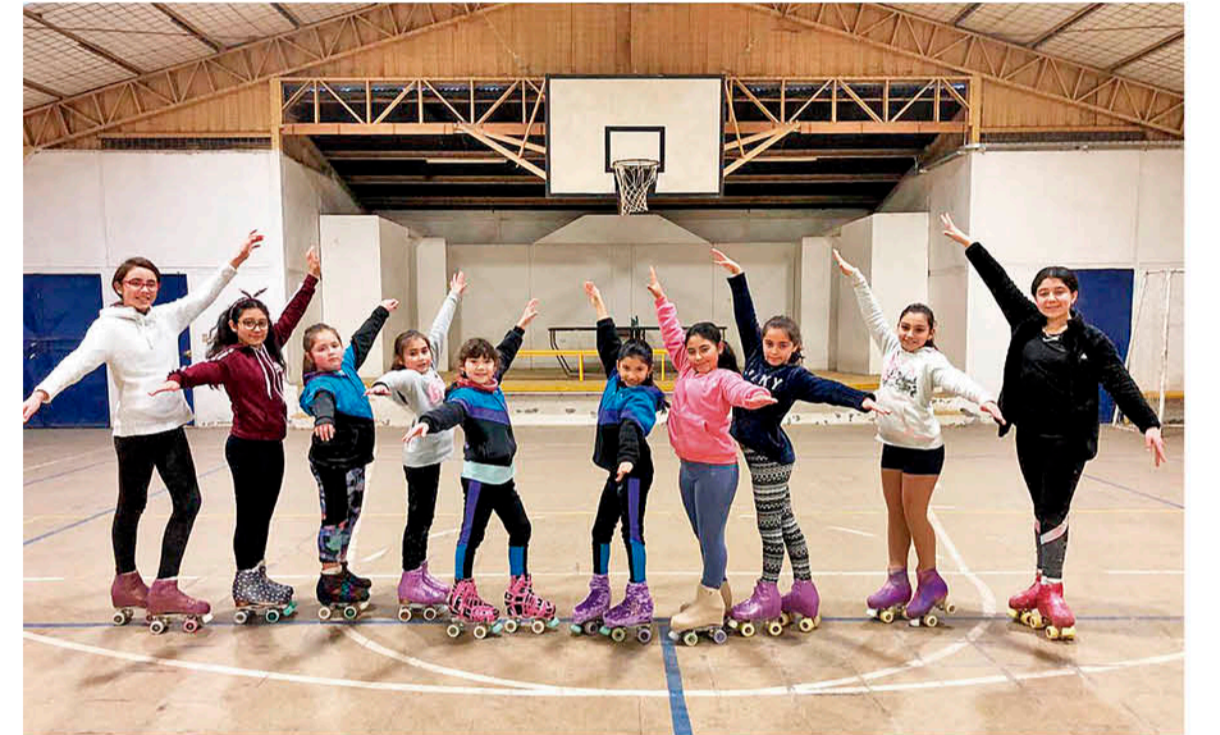
LA INSTRUCTORA DEL CLUB, enfatizó que "para mí, el patinaje es algo súper bonito, un deporte muy completo".

nes antiguos y está enfocado en las deportistas que sientan pasión por el arte, ya que se baila sobre patines, realizan presentaciones individuales junto a grupales, entre otras.