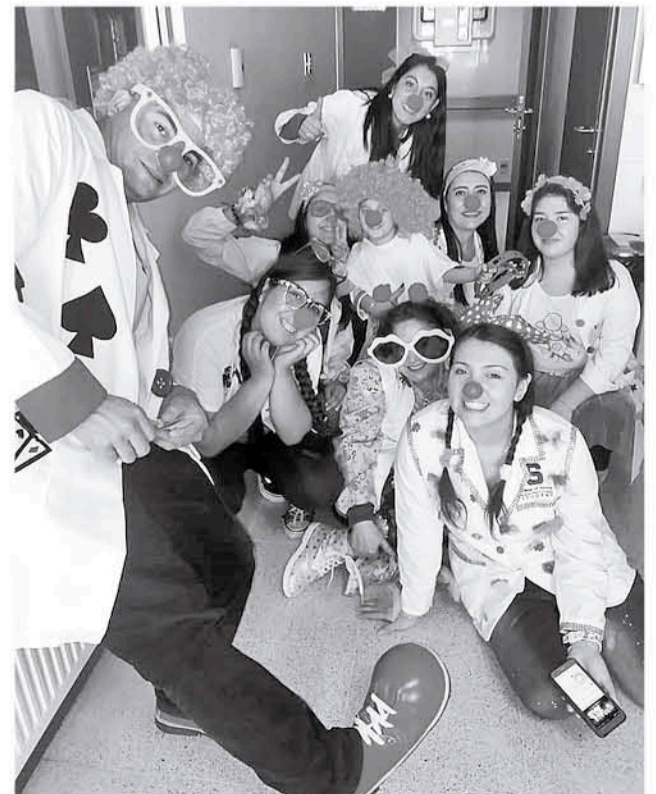
EN SU INTERVENCIÓN todos participan.

A ellos, agregó que “recién tenemos nuestra persona jurídica, estamos en proceso de eso, afinando algunos detalles y así también postular a algunos proyectos, para capacitarnos, comprar nuestra vestimenta y accesorios, con el objetivo de seguir consolidándonos, seguir sacando sonrisas, alegrando al usuario hospitalario, tanto como a sus familiares”, concluyó.