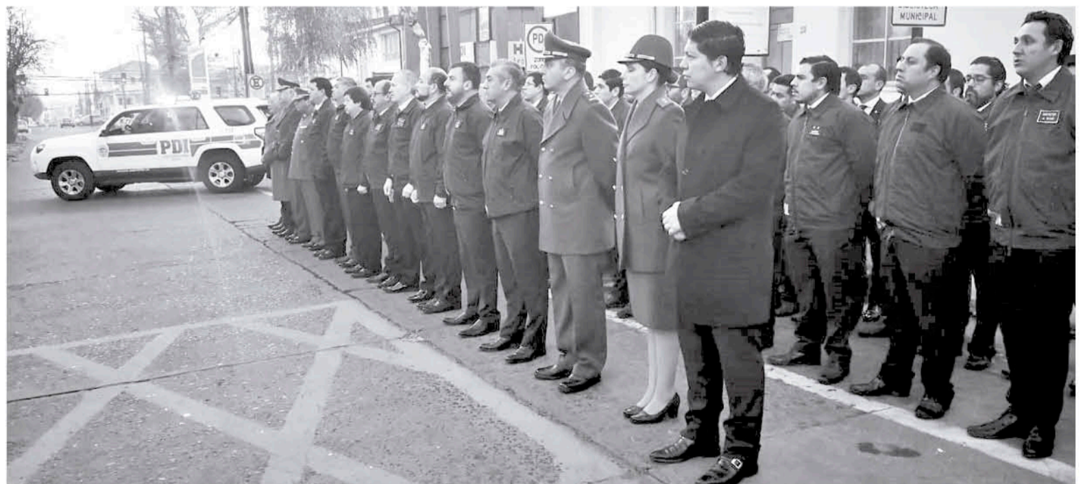
ADEMÁS, EN LA CEREMONIA participaron autoridades y funcionarios de esta institución.

A esto se sumó el gobernador de la provincia de Biobío, Ignacio Fica, quien participó y manifestó: "Son 86 años de agradecimiento por todas las labores que ellos realizan, estuvimos en las actividades que ellos efectuaron en este día. Por ello, estamos felices en virtud de agradecer todo el trabajo que todos sus funcionarios cumple día a día en sus trabajos de fiscalización e investigación".