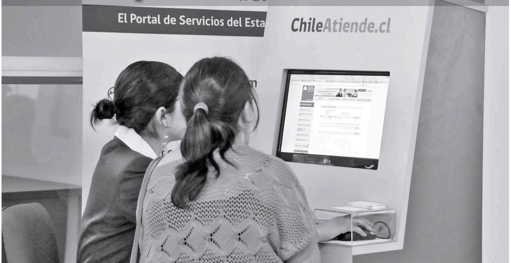
EL SERVICIO ya está disponible en la plataforma.

La iniciativa fue implementada por ChileAtiende, y se puede realizar desde su página web www.chileatiende.cl .