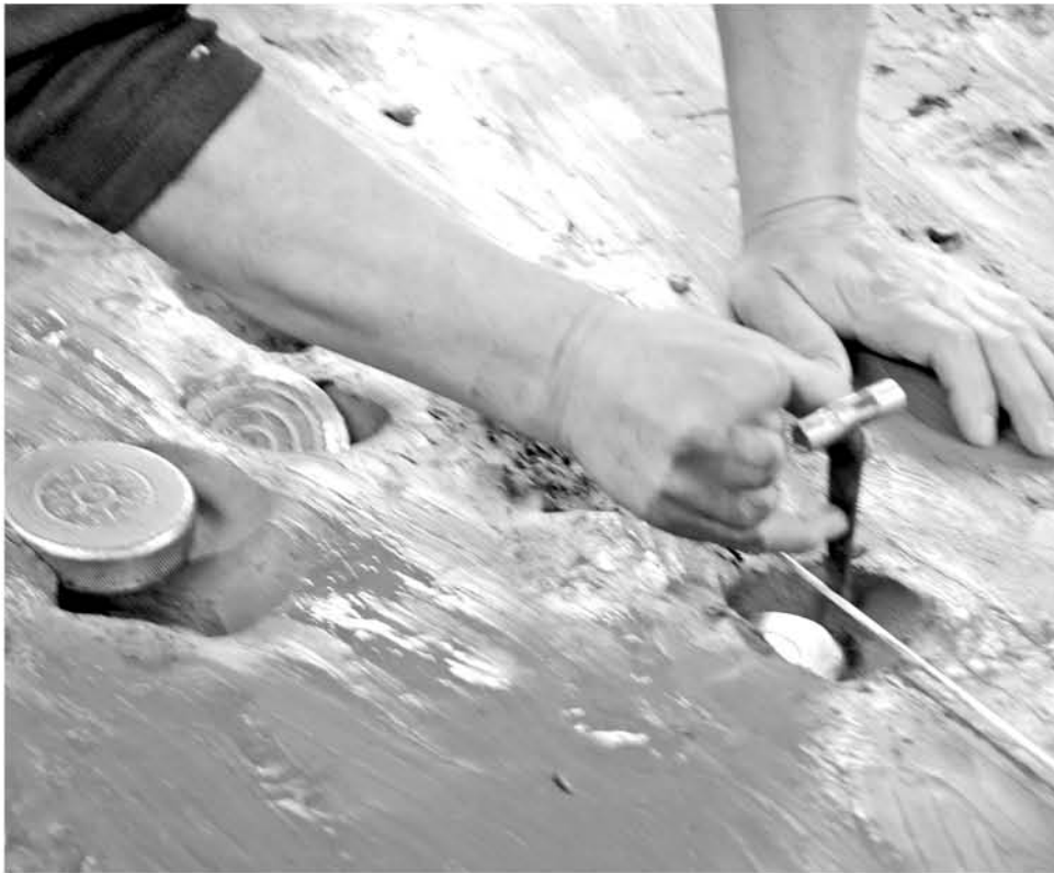
LA PARTE OFICIAL DE LA ESPECIALIDAD rural que arribó a la comuna angelina, es jugada sagradamente todos los fines de semana.

Tras la victoria de Orompello ante Bernardo O'Higgins y de Colo-Colo ante El Sauce, las posiciones del torneo de tejo en la capital provincial cambian nuevamente, pero el líder sigue sumando ostentosamente.