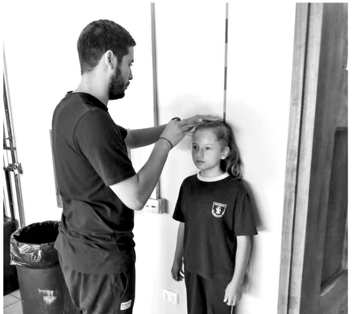
EL PROYECTO realiza un análisis personalizado a cada miembro de la comunidad escolar.

Esta iniciativa podría ser trascendental en mejorar la salud de los más pequeños, reduciendo el más del 60% de niños que tienen sobrepeso y obesidad. Una cifra alarmante.