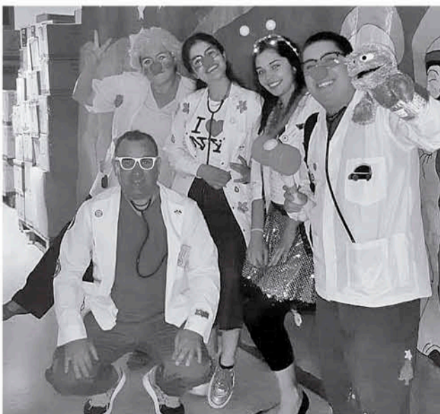
DENTRO DEL GRUPO DE TODO: hay quienes se dedican a la globoflexia, otros a la magia, otros al humor, y así van complementado el equipo con las distintas actividades que realizan.