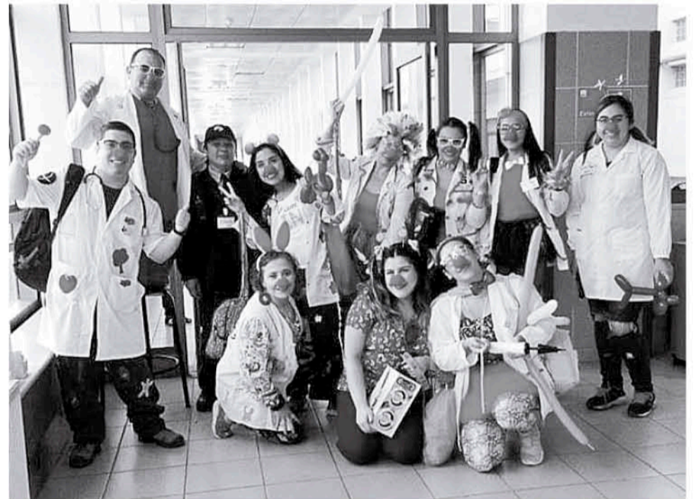
LA AGRUPACIÓN HOY es integrada por veinte personas.

De la misma forma, el presidente de la asociación manifestó que “esta es una medicina alternativa como la llamamos nosotros, a partir de la risa se producen cambios químicos en el cuerpo, que aporta e influyen en recuperarse a las personas en cuanto al estado de ánimo y la psicología de estar ahí, porque recordemos que cuando uno está en el hospital aparte de la enfermedad física también está la mental, donde no