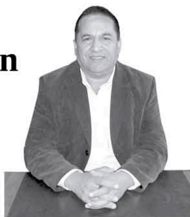
Miguel Abuter León Alcalde de Antuco

La comuna de Antuco ha construido su historia y su cultura con una profunda vocación cordillerana, arraigada en las viejas tradiciones y relatos de los arrieros. Con esas historias nos fuimos empapando –poco a poco– de la mística de la montaña, como también con la posibilidad de surcarlas en busca de tierras más prósperas.