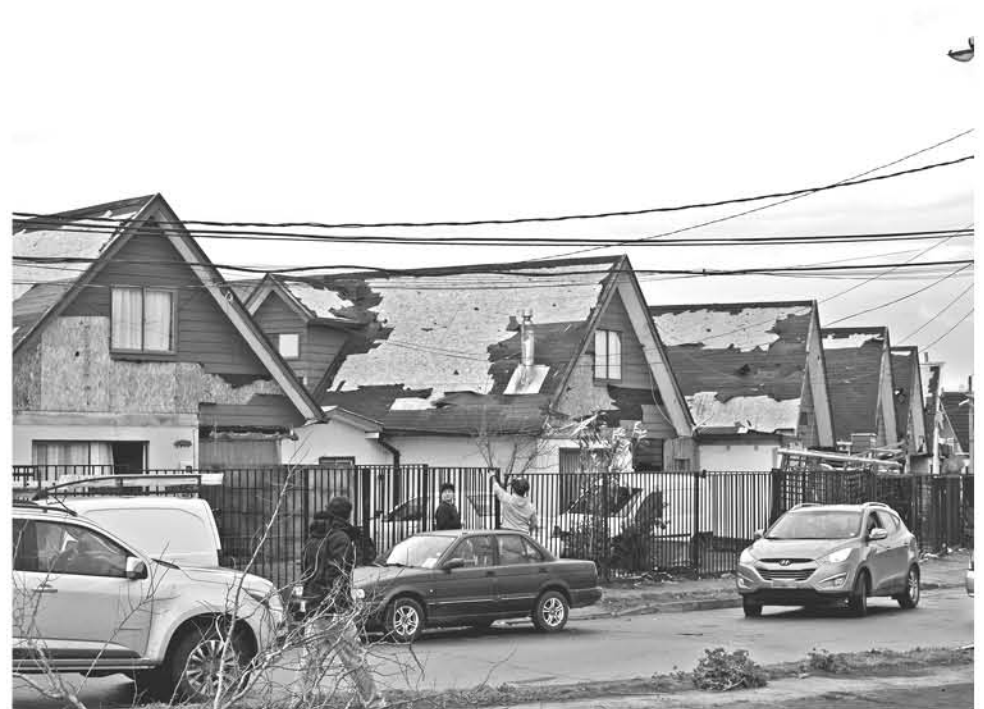
PARA ESTE LUNES se esperaba lograr visitar a 15 familias.

Consultada sobre la fecha en la que se podría comenzar a asignar los subsidios, Paul detalló que no es necesario terminar el catastro para la asignación de subsidios. “A medida que vamos teniendo los datos de un sector, por