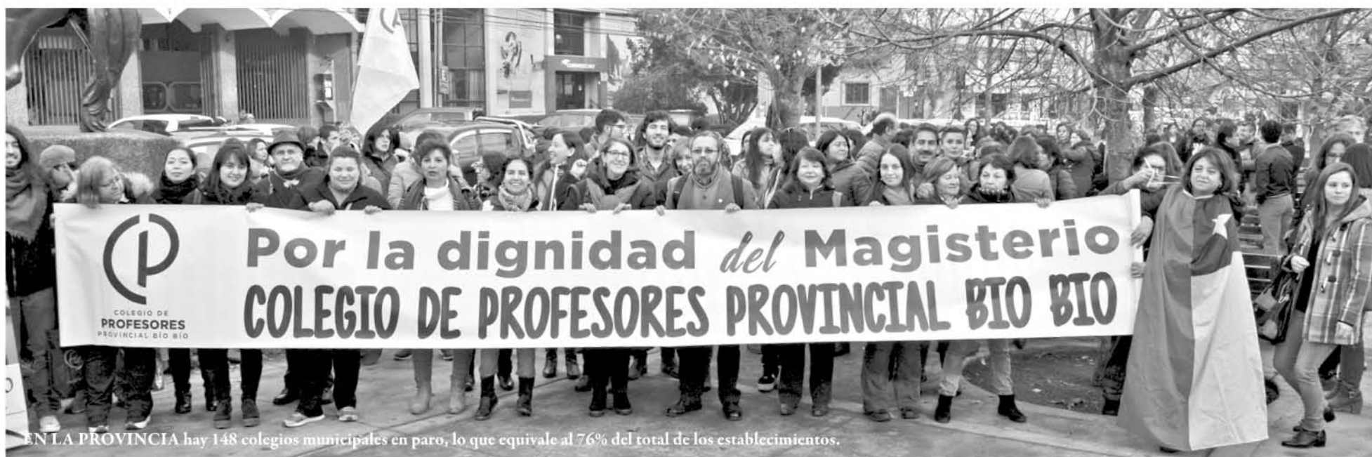
EN LA PROVINCIA hay 148 colegios municipales en paro, lo que equivale al 76% del total de los establecimientos.