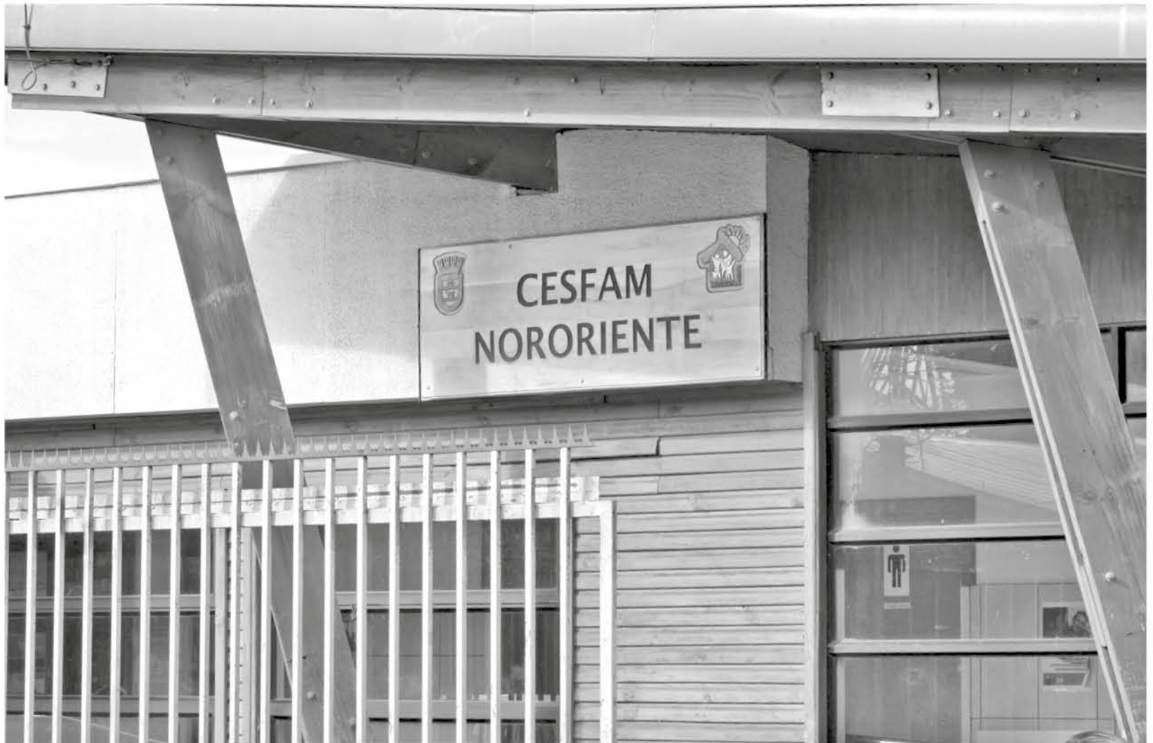
ACTUALMENTE el Cesfam Nororiente está atendiendo prestancias en esta índole.

Sobre ello, la profesional comentó que "debido a este fenómeno climatológico, se llevó a cabo en primera instan-