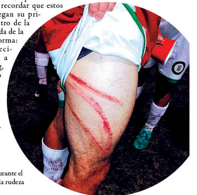
UN JUEGO INTENSO y disputado fue la tónica durante el partido. Como muestra, dos imágenes que hablan de la rudeza del juego.

Hay que recordar que estos equipos juegan su primer encuentro de la segunda rueda de la siguiente forma: Cabrero recibe de local a Tomas Greig, en tanto Nacimiento deberá viajar a la zona de Los Ríos para enfrentar a Provincial Rancho.