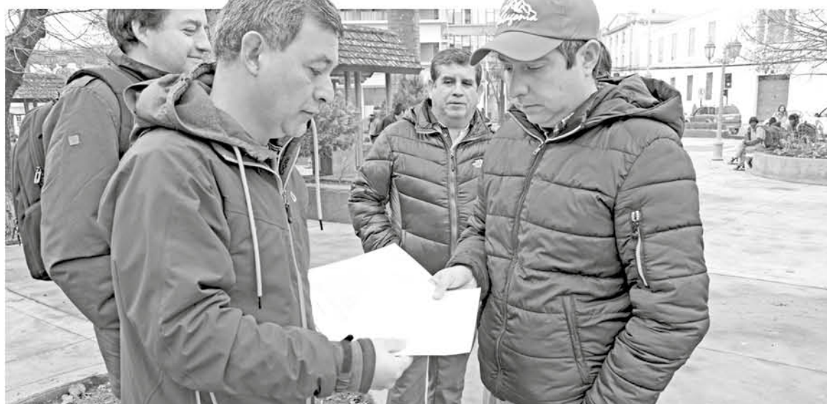
LOS DOCENTES se congregaron en la Plaza de Armas de Los Ángeles.