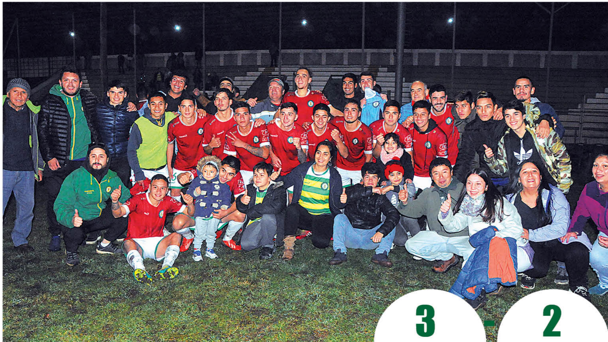
PLANTEL DEPORTES Nacimiento junto a familias y amigos.