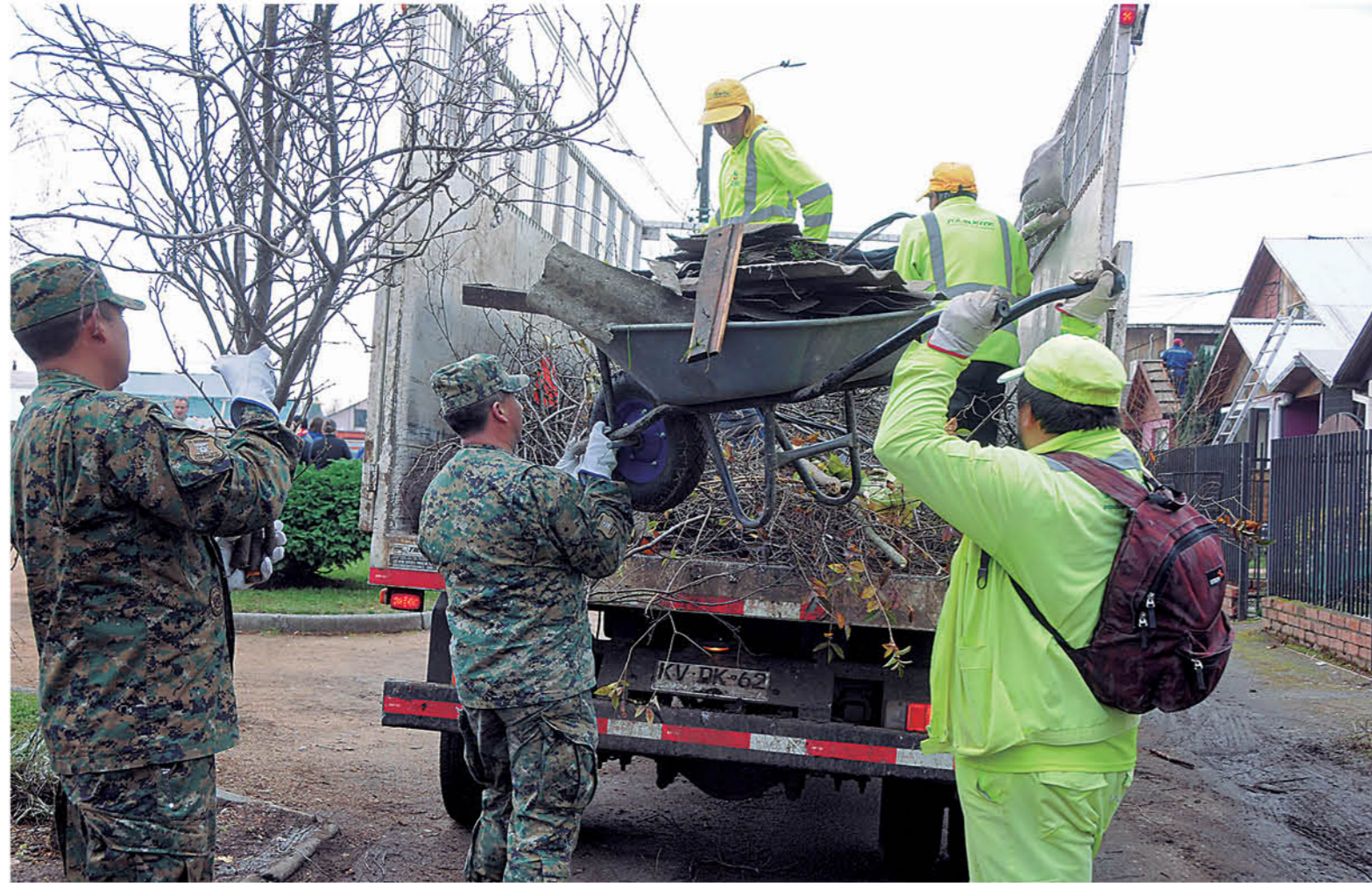
LOS PUNTOS DE ACOPIO se mantienen en villa Francia. Según el último reporte, han sido retiradas 130 toneladas de escombros de la Zona Cero.

En su balance provincial, el gobernador (s) Sergio Vallejos informó