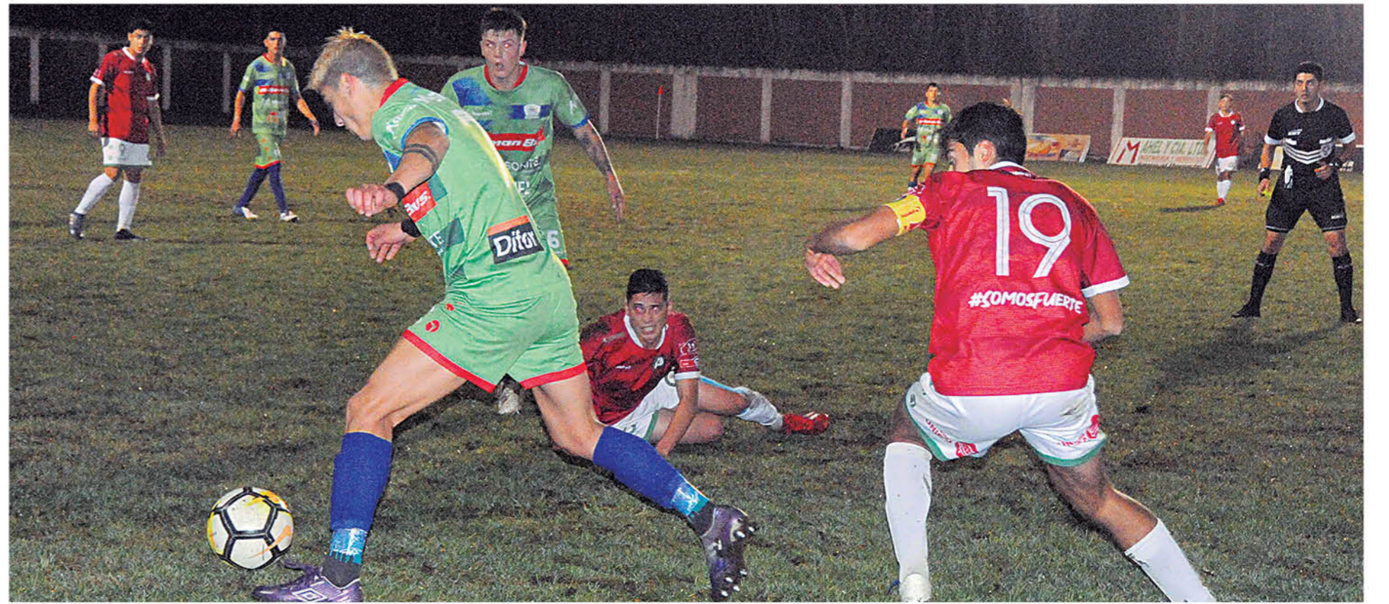
COMUNAL CABRERO ante un lapidario 3-2 jugando de local.

Manteniendo un juego extremadamente intenso por ambas partes