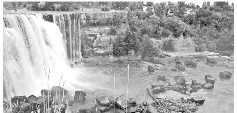
LA AUTORIDAD REGIONAL comentó que esperan que el 2020 puedan contar con el estudio para realizar un ordenamiento territorial en Saltos del Laja.

Respecto a las gestiones que dicha secretaria regional se encuentra realizando señaló que “nosotros detectamos esta situación hace aproximadamente un mes, no solamente respecto del río Laja sino que también de otros ríos de relevancia regional y estamos formulando un proyecto para obtener financiamiento del Gobierno Regional y central para poder financiar uno de los insumos técnicos claves en este proceso de fijación de deslindes que es un informe de obras fluviales, sin ese informe nosotros no podemos hacer los deslindes de los cauces y por lo tanto establecer claramente hasta dónde