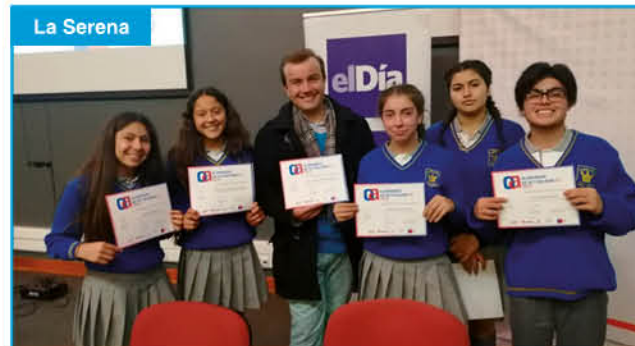
Sigue las competencias en www.olimpiadasdeactualidad.cl y en redes sociales con el #OlimpiadasActualidad2019.

Aquí algunas fotos de las competencias desarrolladas en las sedes de Inacap de cada capital regional. Felicidades a todos!