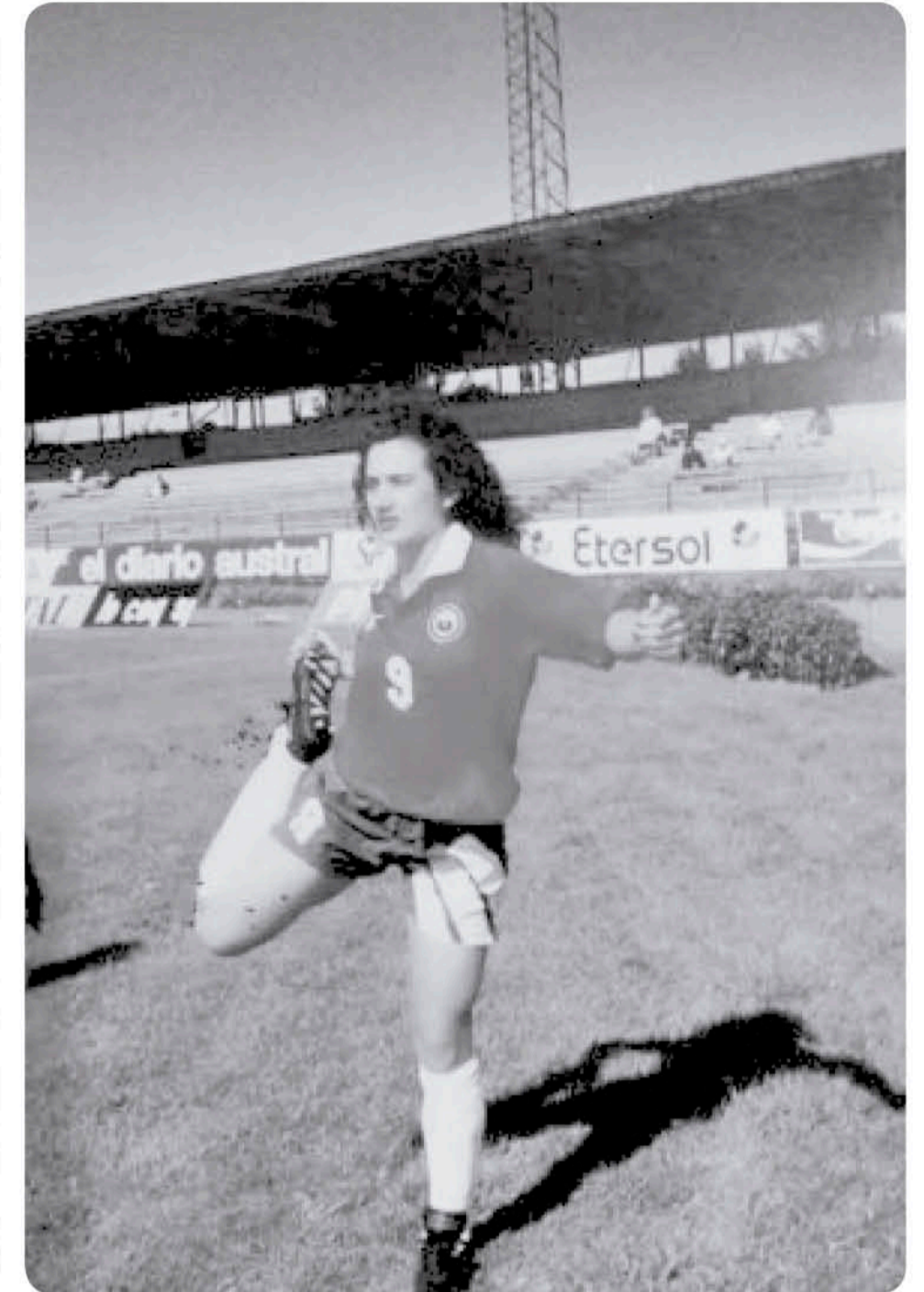
LA FUTBOLISTA PARTICIPARÁ del competitivo por último año y espera tener una gran despedida de las canchas, debido a su gran trayectoria en el balompié.

al equipo de sus comienzos, el "Dávila", logrando dejar todo en cancha, mojando la camiseta con demasía y salir tricampeonas.