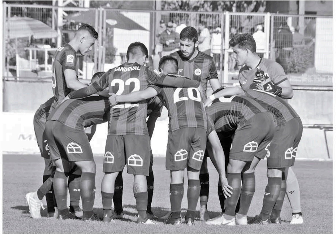
EN LA PRIMERA RUEDA, la azulgrana jugó con maestría y goleó al cuadro de Colchagua.

Pese a que el equipo la tendrá difícil ante el elenco de la "Herradura", prepararon su juego para hacerse fuertes en el municipal angelino, bajo las instrucciones de Alejandro Saavedra.