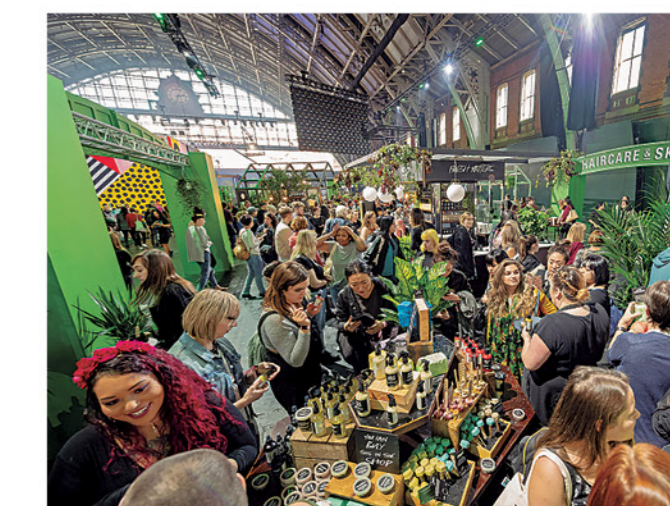
PRESENTACIÓN DE PRODUCTOS sólidos de baño y belleza. Cada vez más personas se interesan por estos nuevos formatos que huyen del plástico.

Las empresas buscan alternativas. “En los últimos 13 años, las ventas de nuestros champús sólidos HAN SUPUESTO EL AHORRO DE 110 MILLONES DE BOTELLAS DE PLÁSTICO, LO QUE SUPONEN 3.000 TONELADAS DE PLÁSTICO QUE NO SE HAN TENIDO QUE FABRICAR ”, explican a Efe desde la marca de cosméticos Lush.