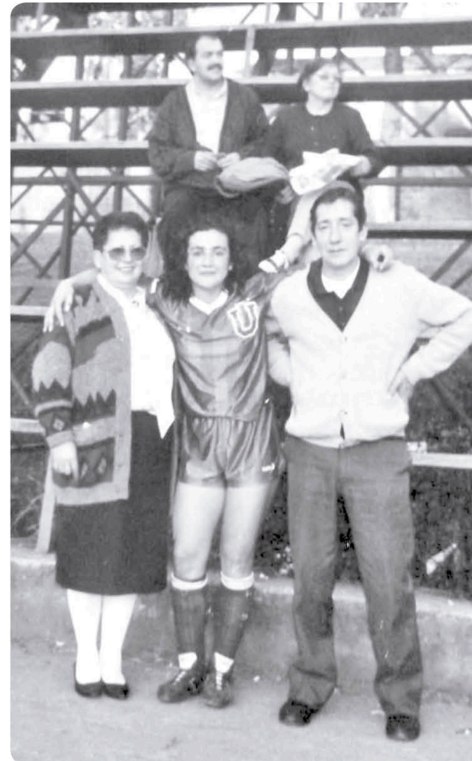
SU CARRERA DEPORTIVA ha tenido paso por distintos clubes, sumando una experiencia que desea compartir con nuevas generaciones.

Más tarde, estudió en la universidad logrando egresar con el título de contador