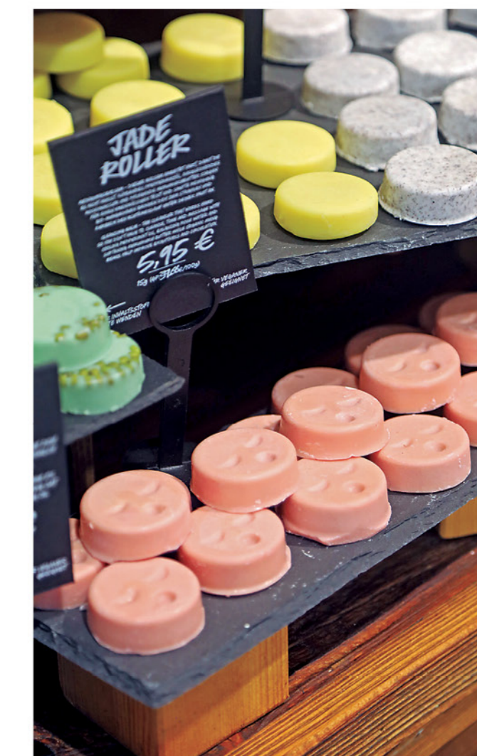
LOS PRODUCTOS DE BELLEZA y baño están tomando forma sólida para evitar los envases de plástico. En la imagen algunos tintes sólidos.