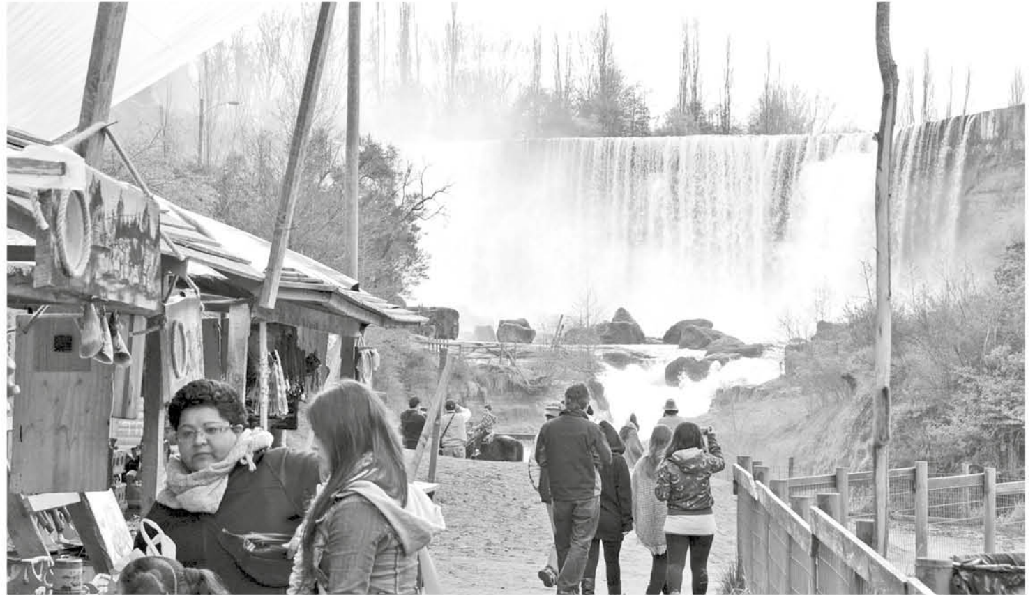
LOS SALTOS DEL LAJA, o Salto del Laja, son cuatro cascadas del río de La Laja, ubicadas en la Región del Biobío en Chile. Está ubicado 25 km al norte de la ciudad de Los Ángeles, siendo el límite de ésta con la comuna de Cabrero.

Además en detalle agregó que “porque el cauce del río hasta sus deslindes que están ubicados hasta la línea de cauce máximo histórico como bien nacional de uso público le corresponde la administración al municipio de Cabrero, estando ubicada esta zona en el municipio de Cabrero.