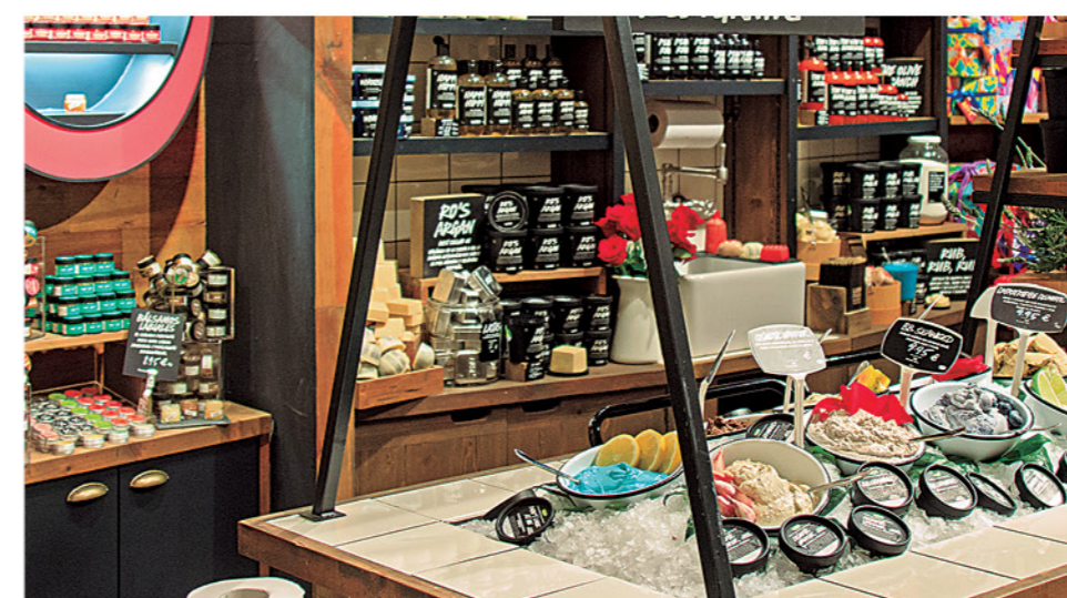
DIVERSOS PRODUCTOS de baño y belleza en formato sólido.

¿La particularidad de esta marca? Llevan años apostando por productos en formato sólido (tienen tres tiendas, en Milán, Berlín y Manchester; que solo venden su stock sin enva-