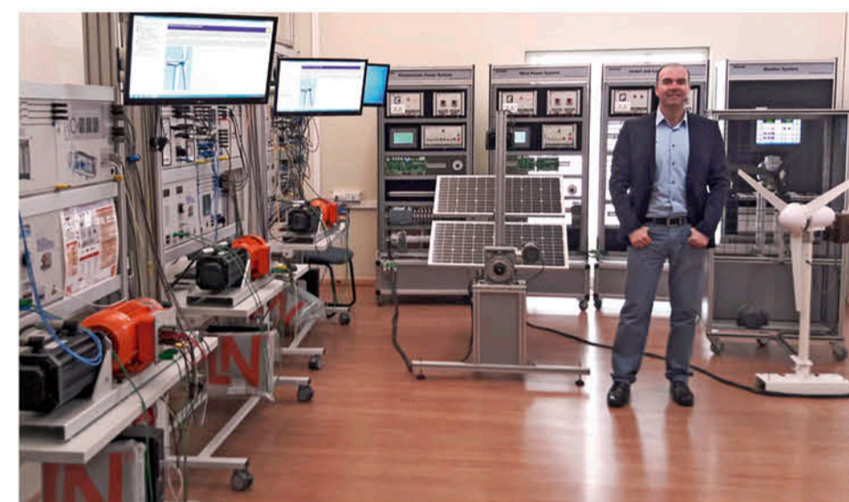
EL DOCENTE VISITÓ aplicaciones de Energías Renovables en España.