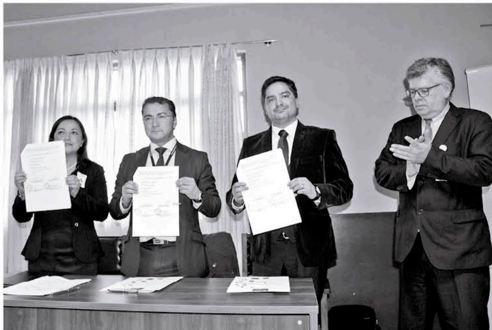
SE REALIZÓ UNA CEREMONIA de traspaso de mando que contó con la participación de autoridades, funcionarios y funcionarias de la institución y la comunidad.