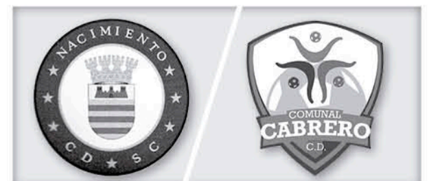
LOS ENCUENTROS son transmitidos vía Facebook, por distintos portales deportivos de la zona.

Los cabrerinos pelearán férreamente el segundo lugar con Republica Independiente de Hualqui, quienes poseen 23 puntos, esperando que, el líder, Corporación Lota Schwager, no se escape, ya que posee 26 unidades.