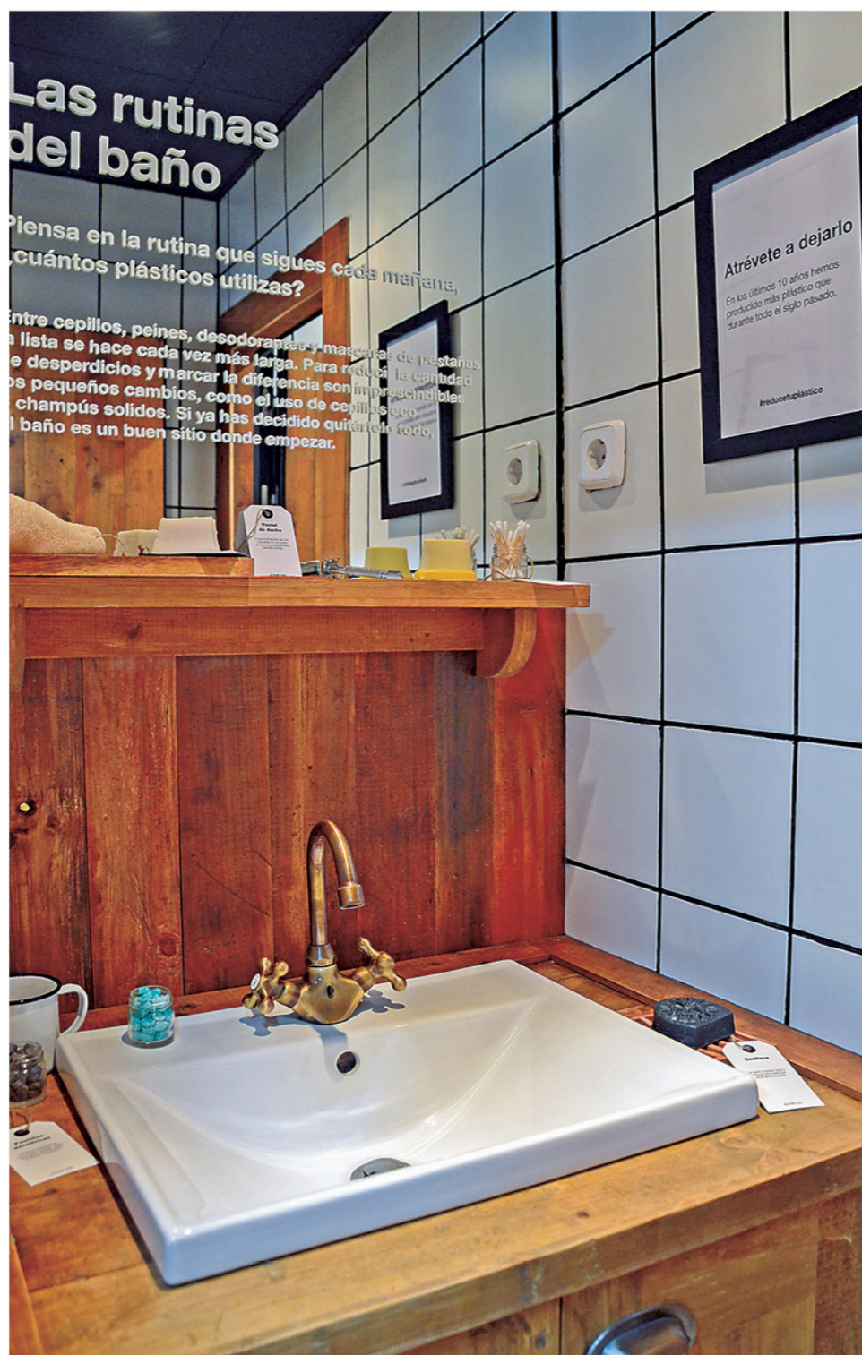
LAS RUTINAS DEL BAÑO están cambiando hacia una menor repercusión en el medio ambiente.

Desde WWF explican que el 18% de las poblaciones de peces espada y atunes contienen plástico