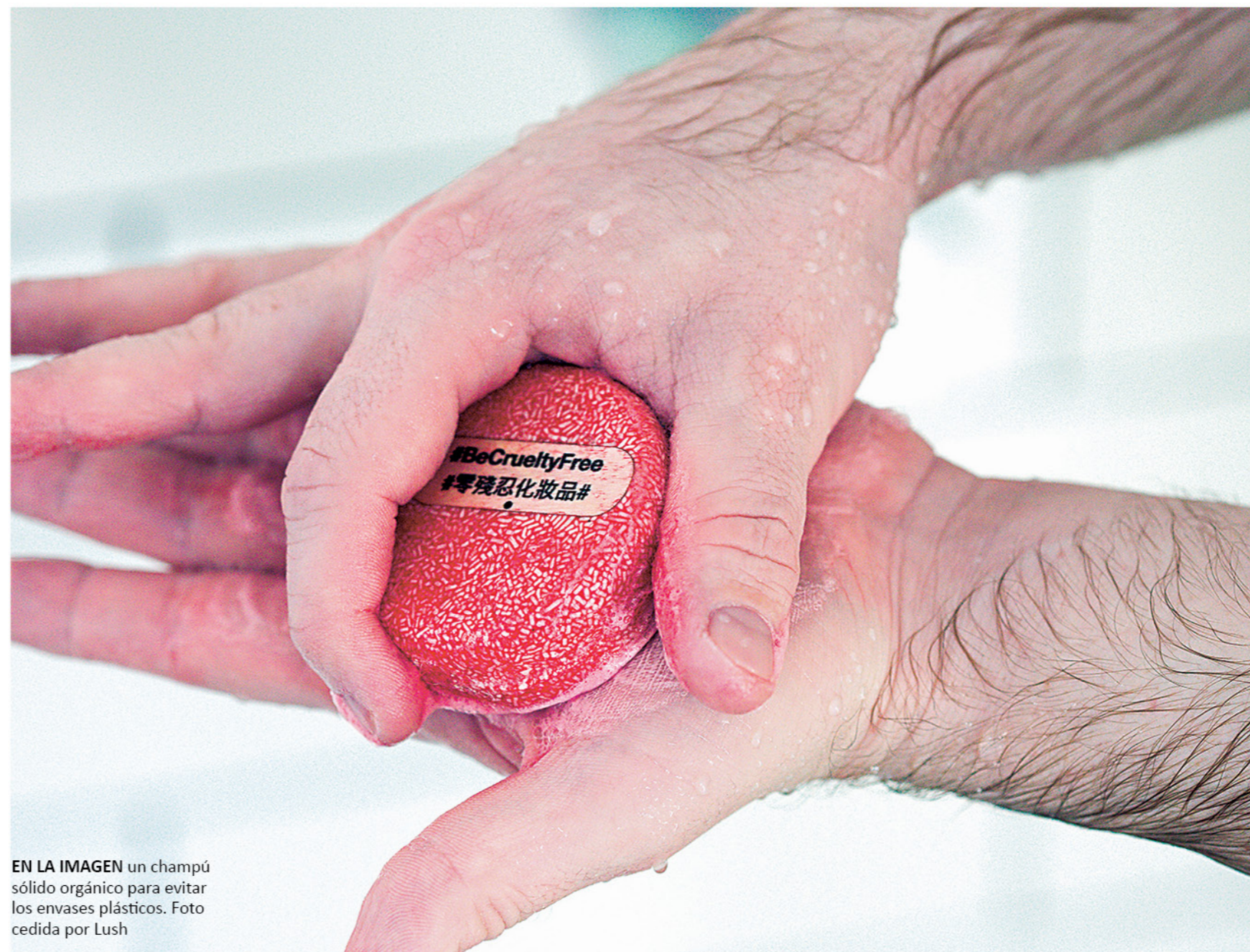
EN LA IMAGEN un champú sólido orgánico para evitar los envases plásticos.

Y es que, según la política Mary Creagh, presidenta del Comité de Auditoría Ambiental multipartidista