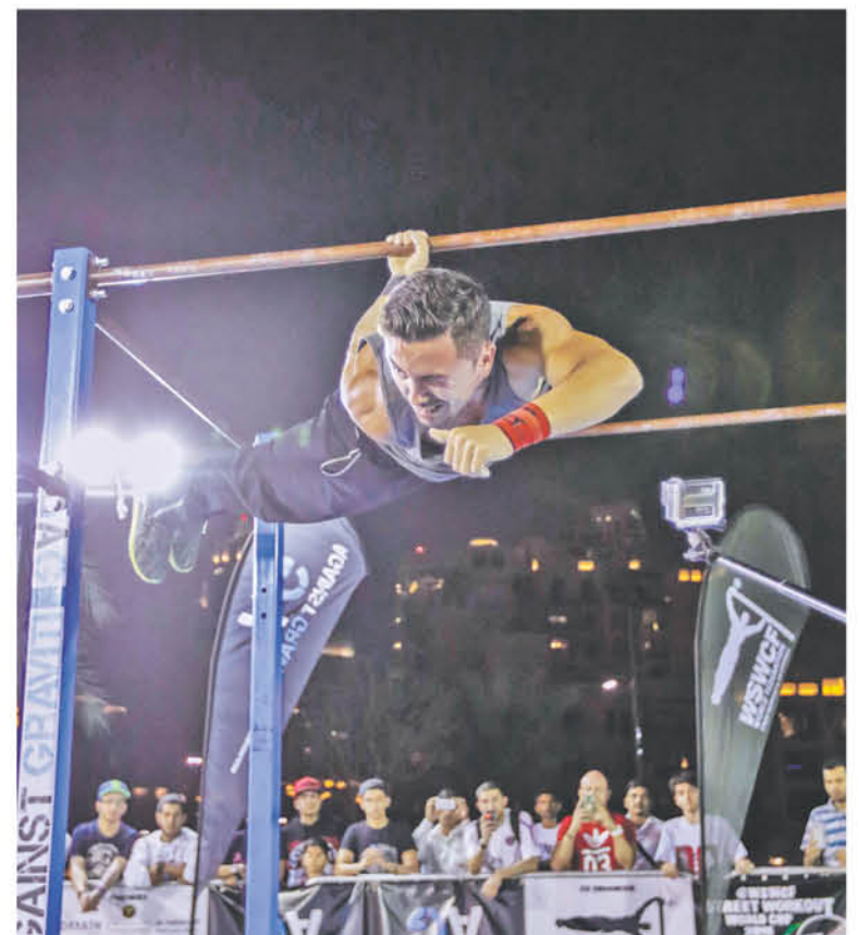
ESTA DISCIPLINA DEPORTIVA es una de las pocas que en su método de entrenamiento en donde se aplica el propio peso corporal.

se llevará de forma continuada, el resto de la competencia hasta cerrar con la premiación a las 18:30 horas. La instancia deportiva estará abierta a toda la comunidad que desee conocer más sobre este creciente deporte que espera paulatinamente consagrarse en el país.