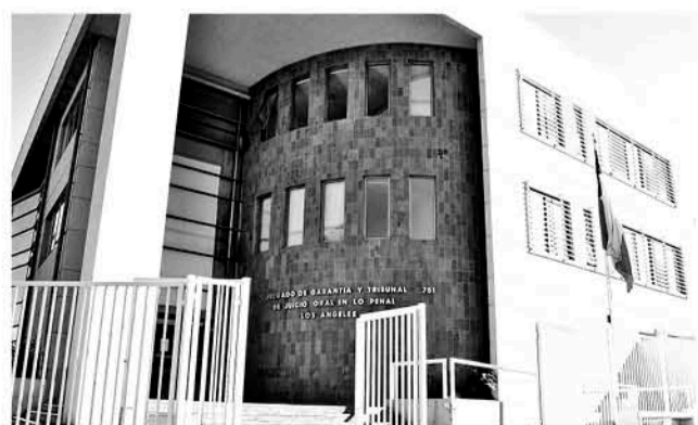
TRIBUNAL DE JUICIO ORAL en lo Penal de Los Ángeles.

En este juicio- que debería durar un mínimo de tres días- está considerado que declaren 37 personas, entre testigos y peritos. Además se espera que se presenten 95 pruebas documentales. La instancia será transmitida por el canal judicial vía streaming a todo el país a través de su señal web.