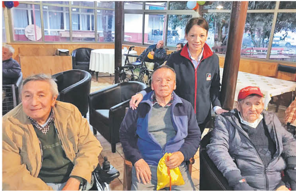
LA ACTIVIDAD TUVO MÚSICA , canto y la entrega de varios presentes que recibieron con mucho aprecio y gratitud los residentes del hogar.

música, canto y la entrega de varios presentes que recibieron con mucho aprecio y gratitud, entre ellos, calcetines y bufandas de lana, todo esto en medio de la celebración de una once.