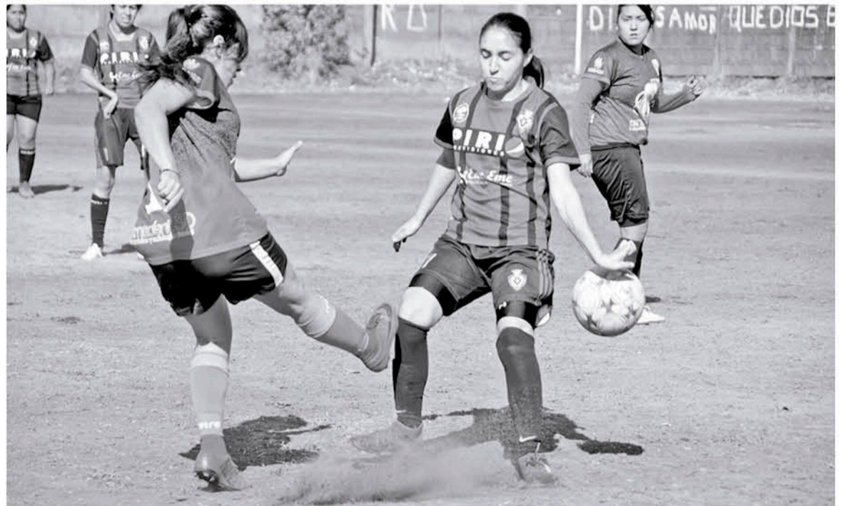
LA ORGANIZACIÓN DE LA LIGA comentó que buscarán dar un cierre simbólico de campeonato.

Otro de los conjuntos que podrían obtener un lugar en el podio, si logran arremeter frente a sus rivales en sus próximos encuentros, es el elenco de Afrodita, las cuales con sus 39 unidades, tienen la posibilidad de situarse dentro de las mejores de la convocatoria femenina disputada en Los Ángeles.