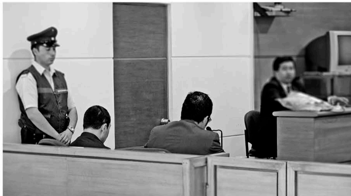
(Fotografía de contexto)

En este contexto se desarrollaron los alegatos de apertura correspon-