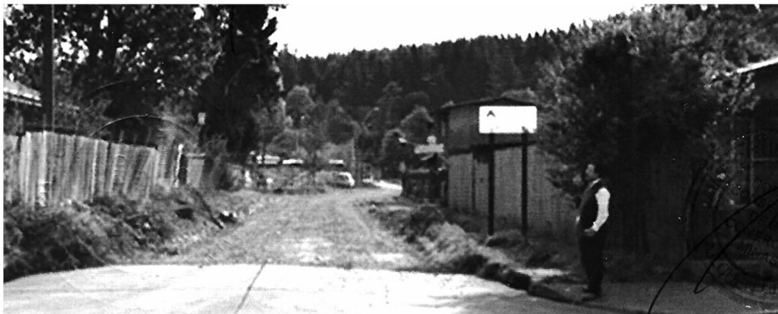
HASTA EL MOMENTO se mantiene en espera la citación de los involucrados por el caso.

En base a esto, el jefe comunal agregó que deben revisar esta demanda, para llevar a cabo la defensa, hecho que requiere una investigación de estos terrenos para conocer la realidad de estos espacios.