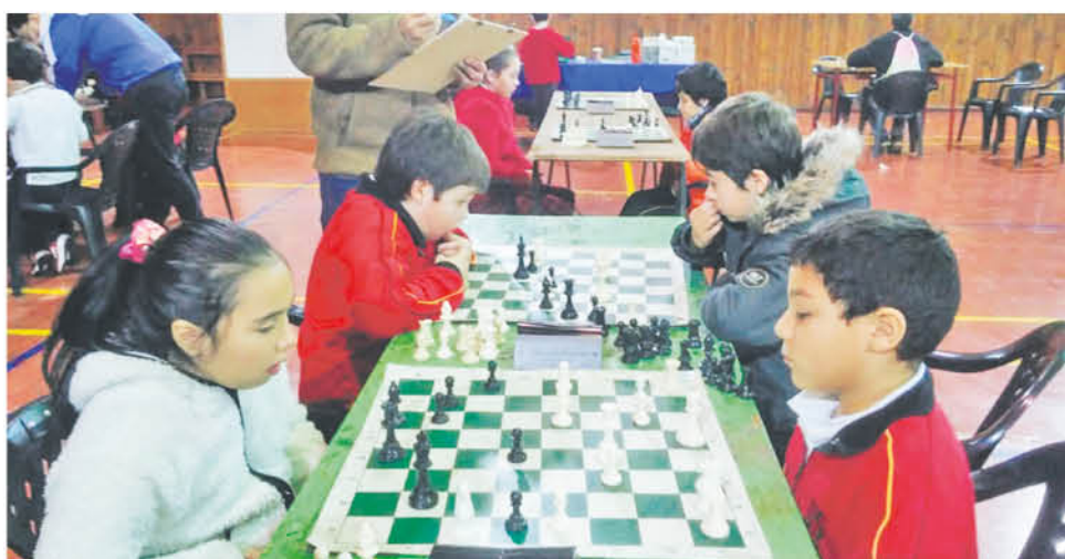
EN BIOBÍO existe un semillero de ajedrecistas que pese su corta edad, han hecho frente a exponentes mayores y ha obtenido la victoria.

El torneo se regirá por las Leyes del Ajedrez vigentes de la FIDE y será válido para ELO Nacional ENF y FIDE. Se jugará a 6 rondas de 30 minutos más 30 segundos de incremento por cada movimiento. Los criterios de desempates son: Resultados entre empatados, Progresivo, Arranz, Mayor cantidad de victorias, Mayor cantidad partidas con negras, Rating Performance. Las inscripciones en línea se realizarán por el sitio web https://www.ajefech.cl en línea o previo al torneo, confirmando entre: 09:30 a 10:00 horas.