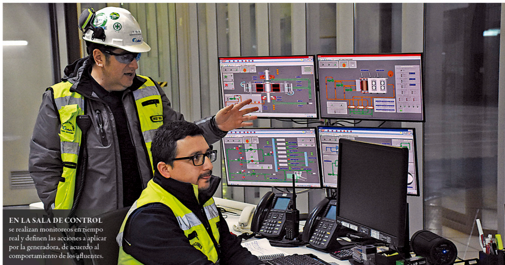
EN LA SALA DE CONTROL se realizan monitoreos en tiempo real y definen las acciones a aplicar por la generadora, de acuerdo al comportamiento de los afluentes.

La central tiene capacidad de generar 700 metros cúbicos por segundo, “y cualquier superación de este caudal deriva en abrir gradualmente las compuertas para mantener la cota del embalse”.