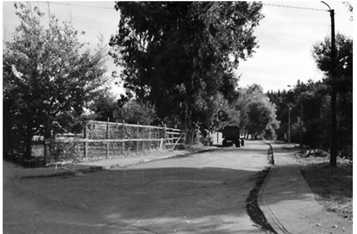
ESTE SERÍA EL SITIO donde se mantienen edificaciones municipales colindantes con el río Bureo.