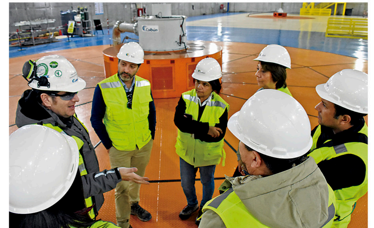
LA CAVERNA DE MÁQUINAS es la más grande en su tipo en el país. En su interior, se mantiene el equipamiento encapsulado y las unidades generadoras.