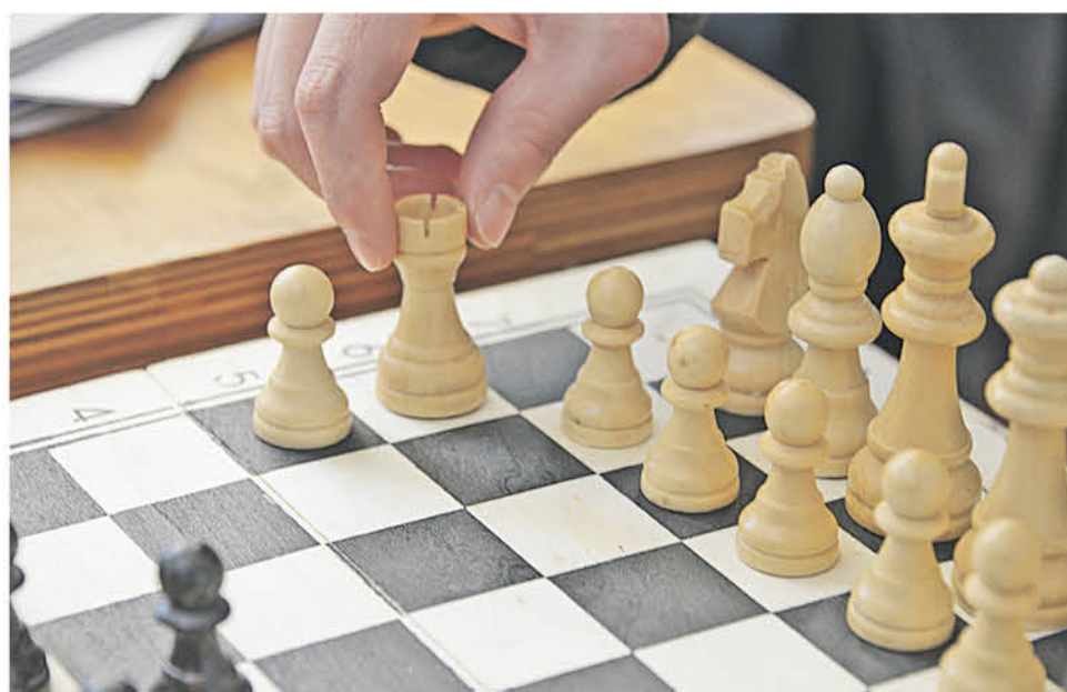
EL SUEÑO de que algún día un exponente provincial logre el título de campeón chileno absoluto, ya sea en series infantiles y juveniles, sigue vigente.

Hoy como director de torneos y proyectos del Club Círculo Ajedrecistas Los Ángeles y coordinador general del Circuito de Ajedrez Federado