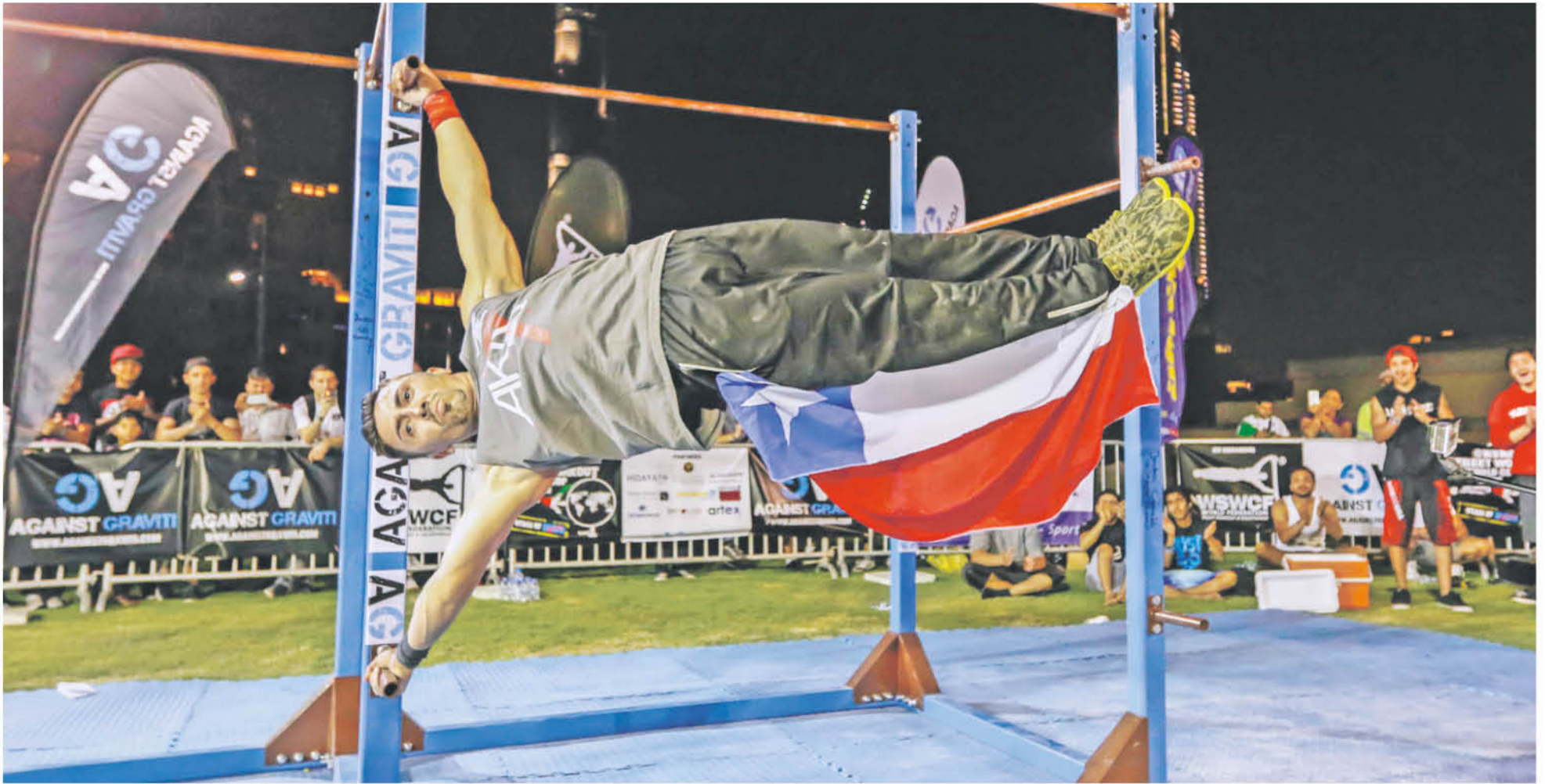
EL EX CAMPEÓN MUNDIAL de calistenia Miguel Mayorga en el marco de una de sus últimas competencias.

En la instancia se peleará un cupo directo a la séptima edición del campeonato nacional Street Workout & Street Lifting.