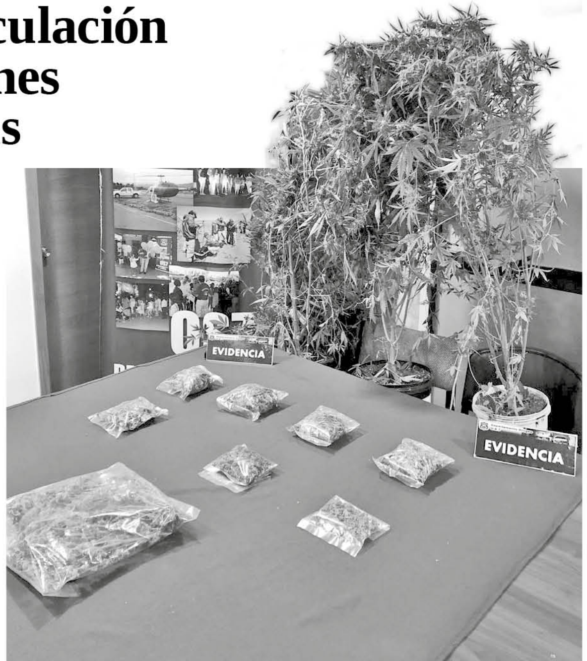
LAS SUSTANCIAS fueron requisadas para ser sacadas de circulación por los oficiales.

Debido a estos actos, sobre los detenidos, se dio a conocer en horas de la tarde que el implicado de Yumbel pasó a control de detención, mientras que el hombre de Los Ángeles quedó en libertad en espera de citación por este acto.