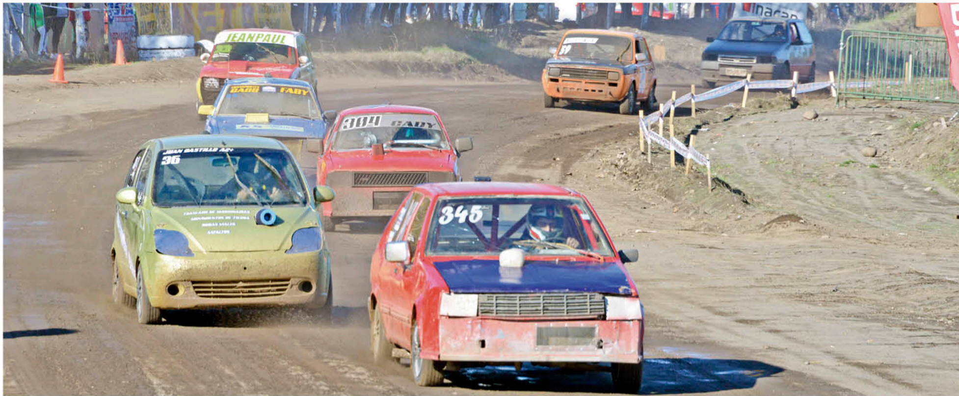
TRAS ESTA MITAD DE CAMPEONATO, Calasac junto a producción preparan la próxima fecha que se realizará el 11 de agosto.