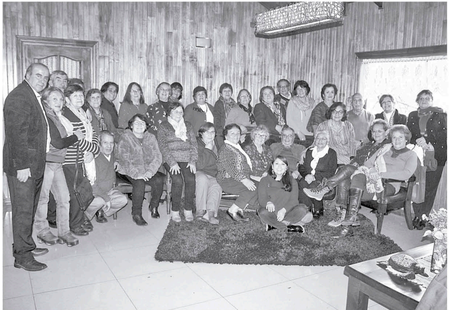
LOS INTEGRANTES de la Unión Comunal de Adultos Mayores en el marco de su última reunión.

La Corporación Cultural Municipal de Los Ángeles prevé inaugurar sus nuevas instalaciones antes de fin de año. En la renovada edificación