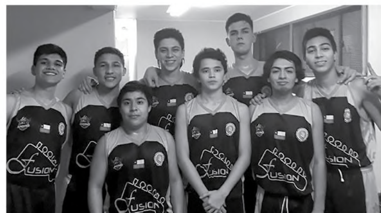
CLUB FUSIÓN Music Los Ángeles.