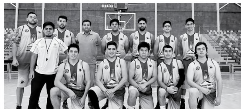
CLUB EL CONSTRUCTOR Los Ángeles.