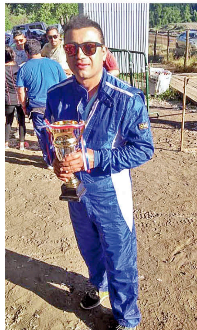
LOS PILOTOS ANGELINOS enfrentaron automóviles con más de dos décadas de diferencia.

Cabe destacar que la Promocional 1150 cc sigue sorprendiendo con el arribo de pilotos desde Chillán, junto