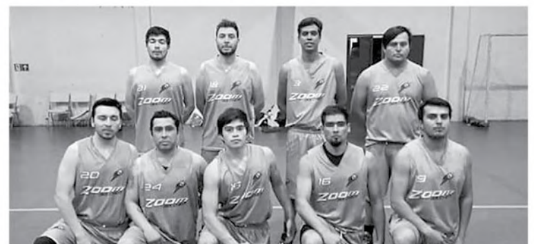
CLUB ZOOM de Mulchén.