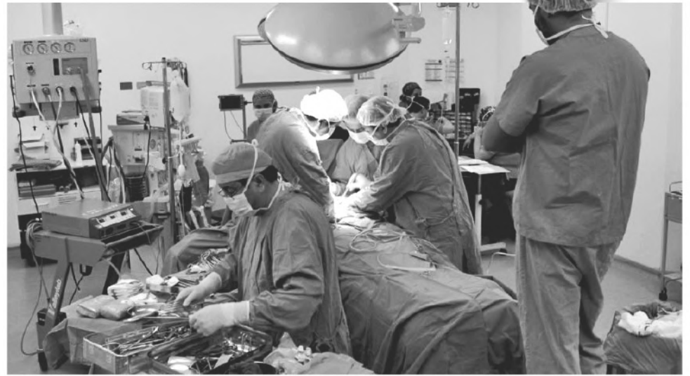
EN CHILE HAY DOS FORMAS DE DONAR ÓRGANOS, cuando se extrae para un familiar un riñón, médula ósea o sangre. O la donación cadavérica o de donante muerto. (Imagen de contexto)

En la instancia, la enfermera se refirió a los mitos más comunes que atemorizan a la población; entre ellos, “el hecho de creer que extraen los órganos antes de que la persona esté fallecida o que, si eres donante, te dejan morir para usar tus órganos. También dicen que se venden los órganos en el mercado negro o que el cuerpo del donante queda en mal estado y que la familia no puede hacer el funeral. La gente cree además que no se pueden arrepentir de ser donante y que la lista de espera se puede manipular para favorecer a quienes tienen