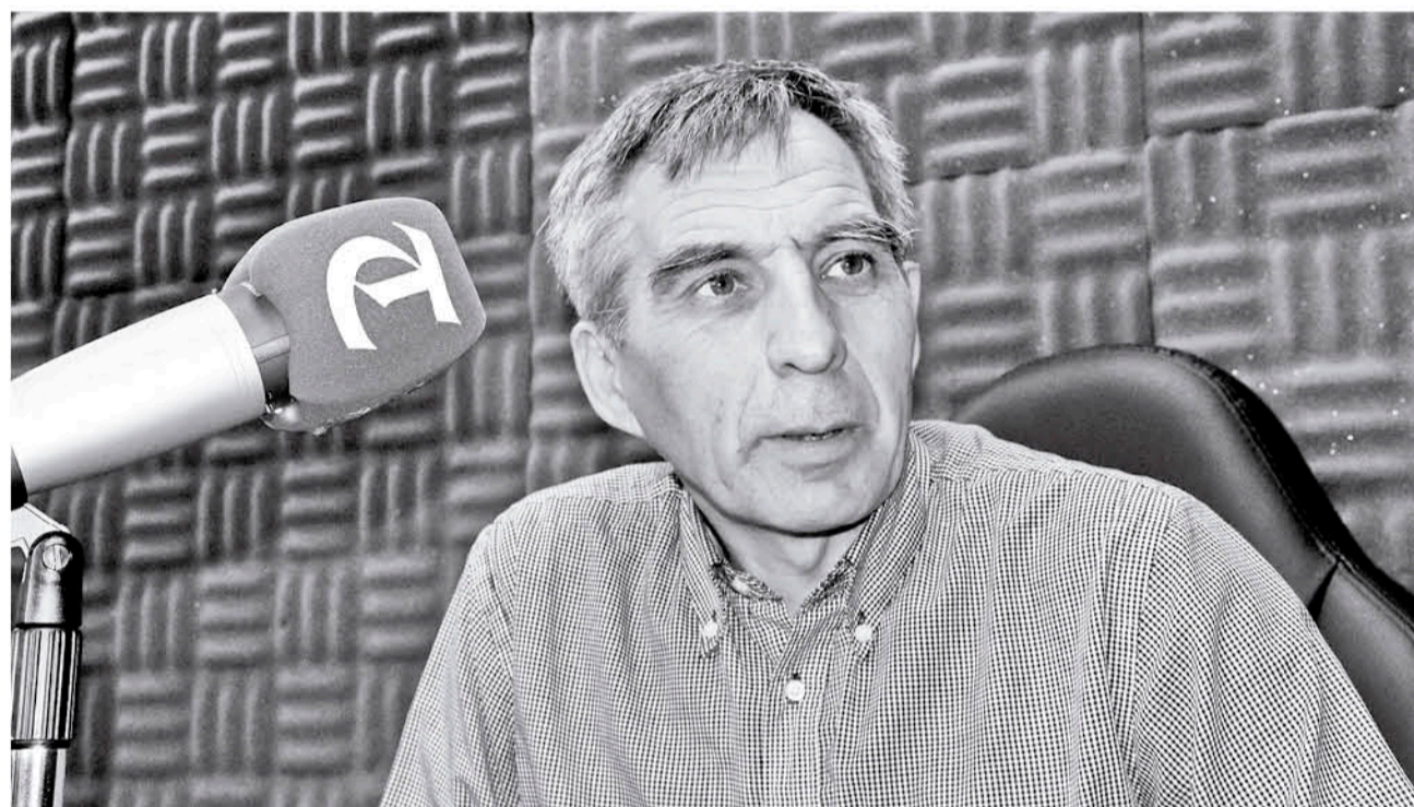
EL COMANDANTE DE BOMBEROS, Raúl Márquez dijo que la prevención es imprescindible al momento de evitar situaciones de riesgo.

“Para ser mucho más claros, cuando nos referimos a acciones previas estamos hablando de efectuar una adecuada mantención y limpieza del equipo de calefacción,