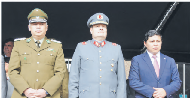
Prefecto Miguel Ángel Irribarra; general de brigada, Rubén Segura y gobernador Ignacio Fica.