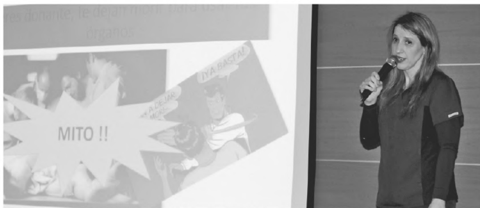
LA PROFESIONAL ahondó sobre la nueva Ley 19.451 de trasplante y donación de órganos en Chile.

Otro de los mitos más comunes resulta de la creencia de que, si el paciente es donante, lo dejan morir para donar sus órganos, “es decir que cuando tu ingresas a un servicio de urgencia grave y se fijan que eres donante, para poder tener tus órganos, no te prestan el auxilio necesario. Eso es falso, porque el equipo de salud en general, incluso a veces en demasía, busca la forma de salvar a los pacientes, ya sea en el prehospitalario, en la calle o cuando llegan al servicio de urgencia y hacen lo que sea por tratar de salvar a su paciente. Se agota hasta el último recurso y es frustrante para el equipo de salud, cuando se hizo de todo para tratar de salvar una vida y no se logró” relató la académica.