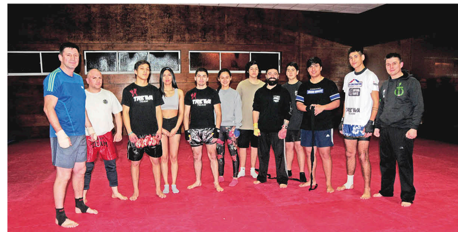
EL INSTRUCTOR, COMENTÓ que su trabajo seguirá con seriedad y responsabilidad, especialmente, para juntar los recursos de cara al Sudamericano.

Concuerne a los entrenamientos, el instructor comentó que “van bastante bien, estamos enfocados con los muchachos porque la idea de competir harto y lleguen de buena forma al Sudamericano”.