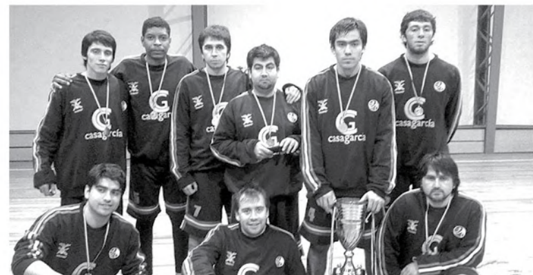
CLUB ANDINO Los Ángeles.