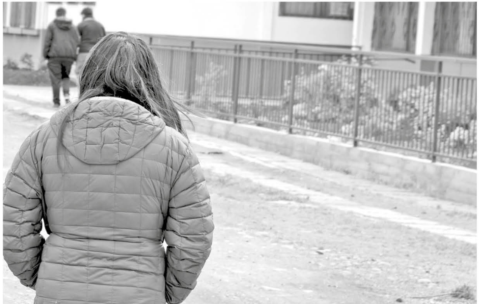
CIENTOS DE MENORES ACTUALMENTE requieren servicios de Salud en variados ámbitos sobre todo psicológico, cuando atraviesan un

“Para nosotros esto es un paso súper importante, basado en rea-