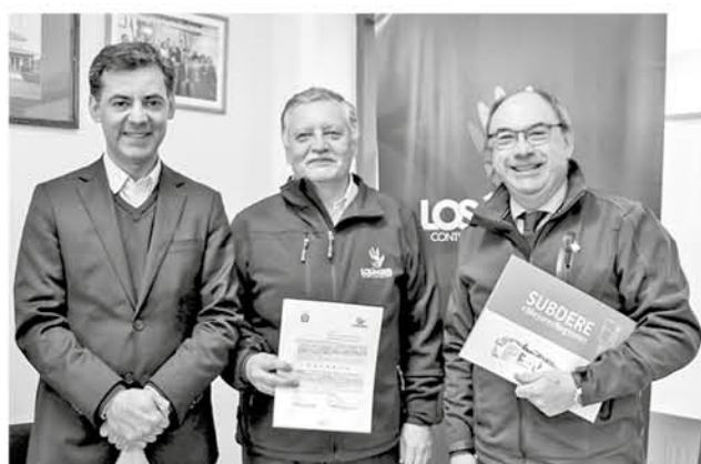
FIRMAN ACUERDO para cambiar 18 mil luminarias de la comuna en espacio de un año, aproximadamente.

El cambio beneficiará al área urbana y la rural de la comuna y se desarrollará en espacio de un año.