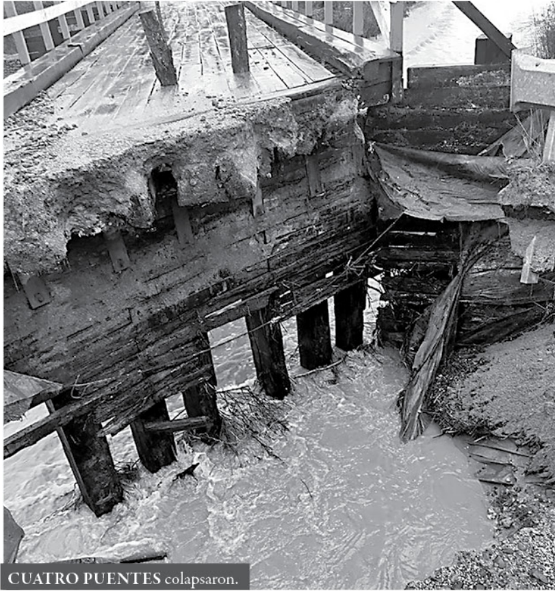
CUATRO PUENTES colapsaron.