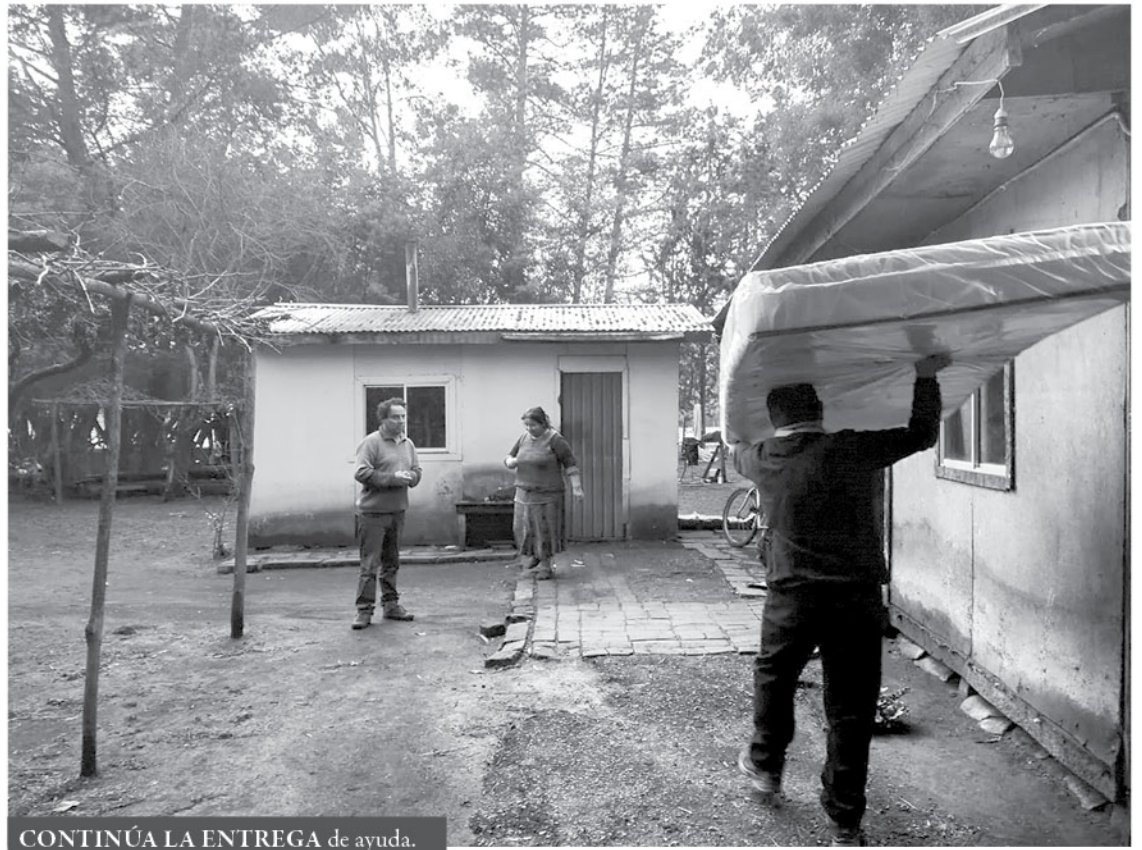
CONTINÚA LA ENTREGA de ayuda.