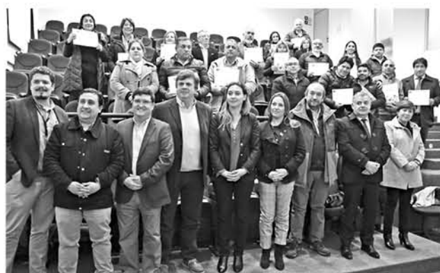
LA SEREMI DE GOBIERNO entregó los recursos a representantes de medios de comunicación de la provincia que adjudicaron iniciativas.

Cabe destacar, que durante el verano la Seremi de Gobierno del Biobío, realizó capacitaciones en todas las provincias para entregar las herramientas necesarias a los medios de comunicación social para que postularan de manera más informada y en igualdad de condiciones.