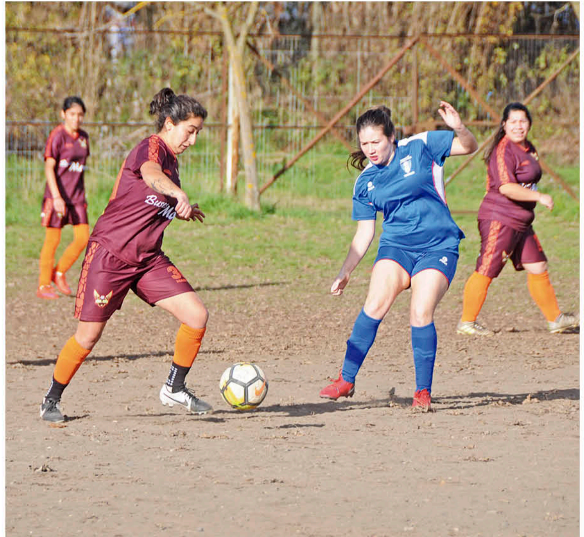
EN EL TORNEO DE FÚTBOL FEMENINO sigue una férrea batalla entre Dávila Femenino con 43 unidades y Las Vegas, quienes ostentan 42.

Posterior al acuerdo unánime en la directiva del torneo de balón pic categoría damas, debido al temporal, se suspendieron los partidos del pasado fin de semana, por lo tanto, la programación de catorceava fecha, se jugará el próximo fin de semana.