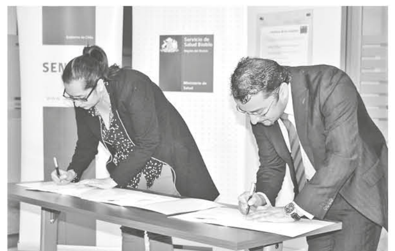
LA FIRMA DEL CONVENIO sella parte de los proyectos de la Red Sename, desde el año 2014.

Hay que destacar que estos proyectos de vinculación, se definen como un proceso donde hay que garantizar la entrega de prestaciones básicas a nivel primario, donde participan niños, niñas y jóvenes además en la provincia de Biobío.