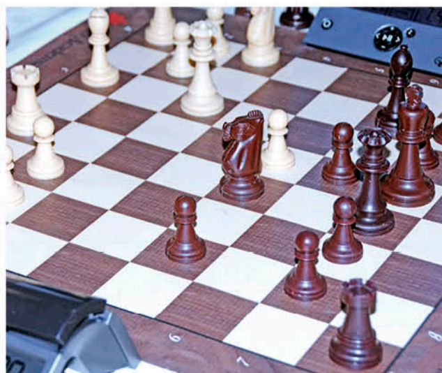
EL MIÉRCOLES 10 DE JULIO se realizará una exhibición de ajedrez en Biblioteca ViVa, donde los tableros provinciales seguirán puliendo su habilidad.

Tras el inicio del ciclo anual de jaque mate, los exponentes del deporte ciencia angelinos, lograron un cupo para representar a Biobío en la máxima cita nacional.