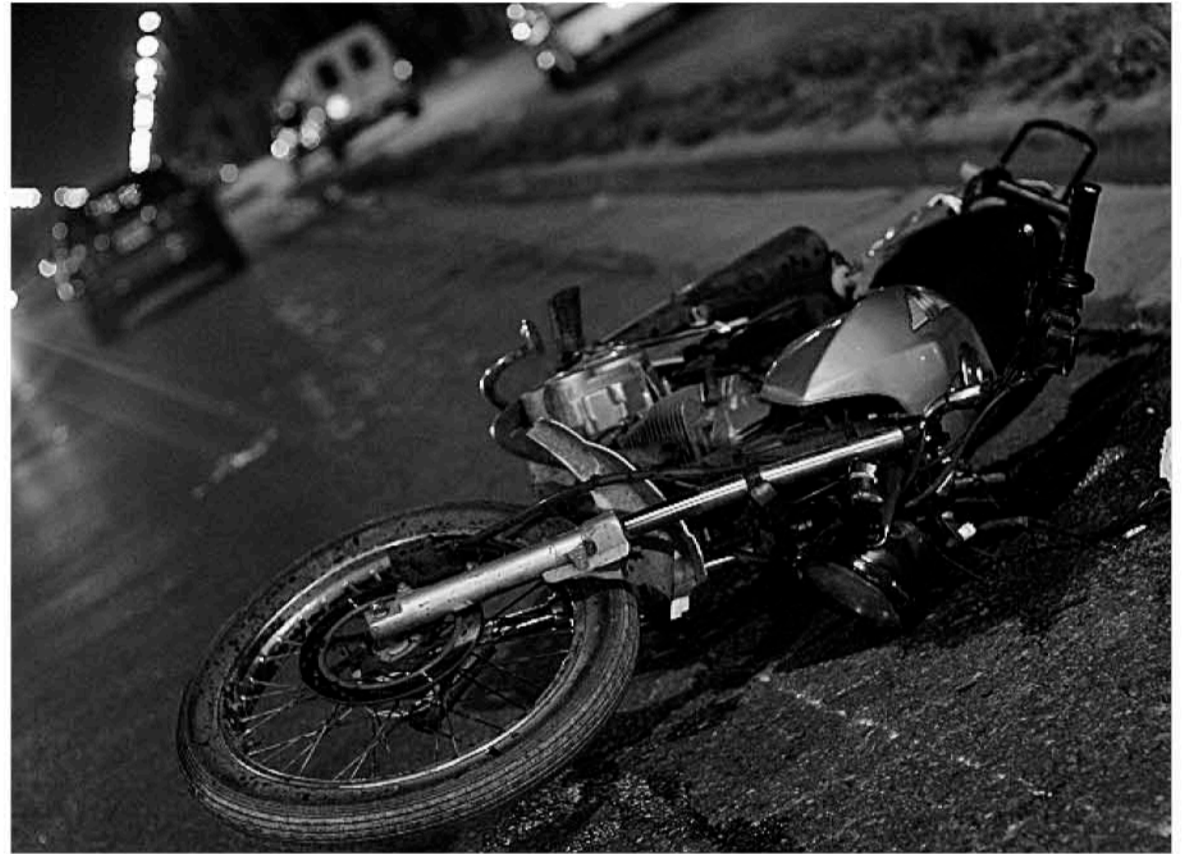
LAS CAUSAS DE ESTE HECHO se mantiene en investigación. (Fotografía de contexto)