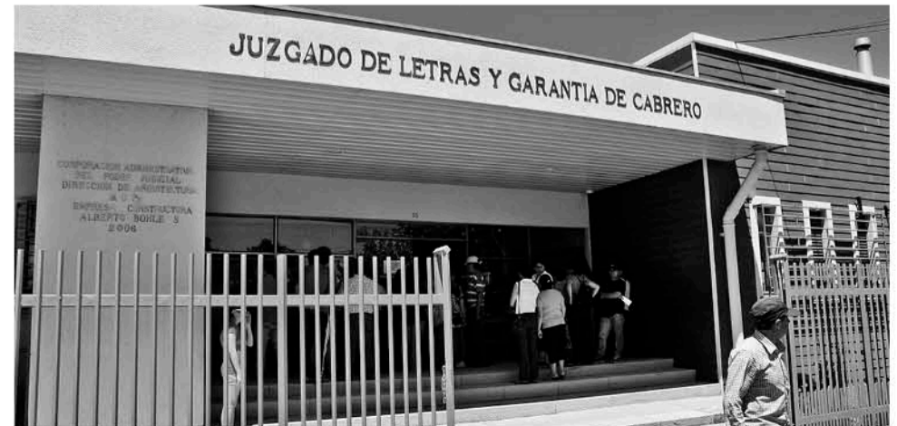
EN LA INSTANCIA se va a llevar a cabo la presentación de dichos antecedentes.

Cabe destacar que el ex juez había sido removido del poder judicial el año 2017, luego de obtener calificaciones deficientes en años anteriores.