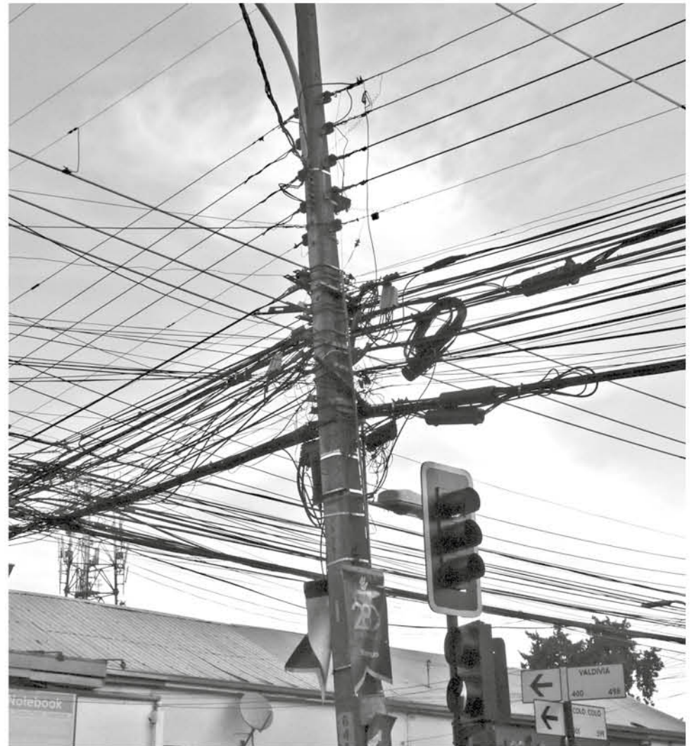
TENDIDO ELÉCTRICO en centro angelino.

lizado por Subtel Biobío destaca el retiro de desechos aéreos que se ha logrado en comunas como Concepción, Penco y Chiguayante, entre otras. “Actualmente tenemos mesas de trabajo operativas en Cañete, Laja, Lebu y Lota. Con Talcahuano, estamos