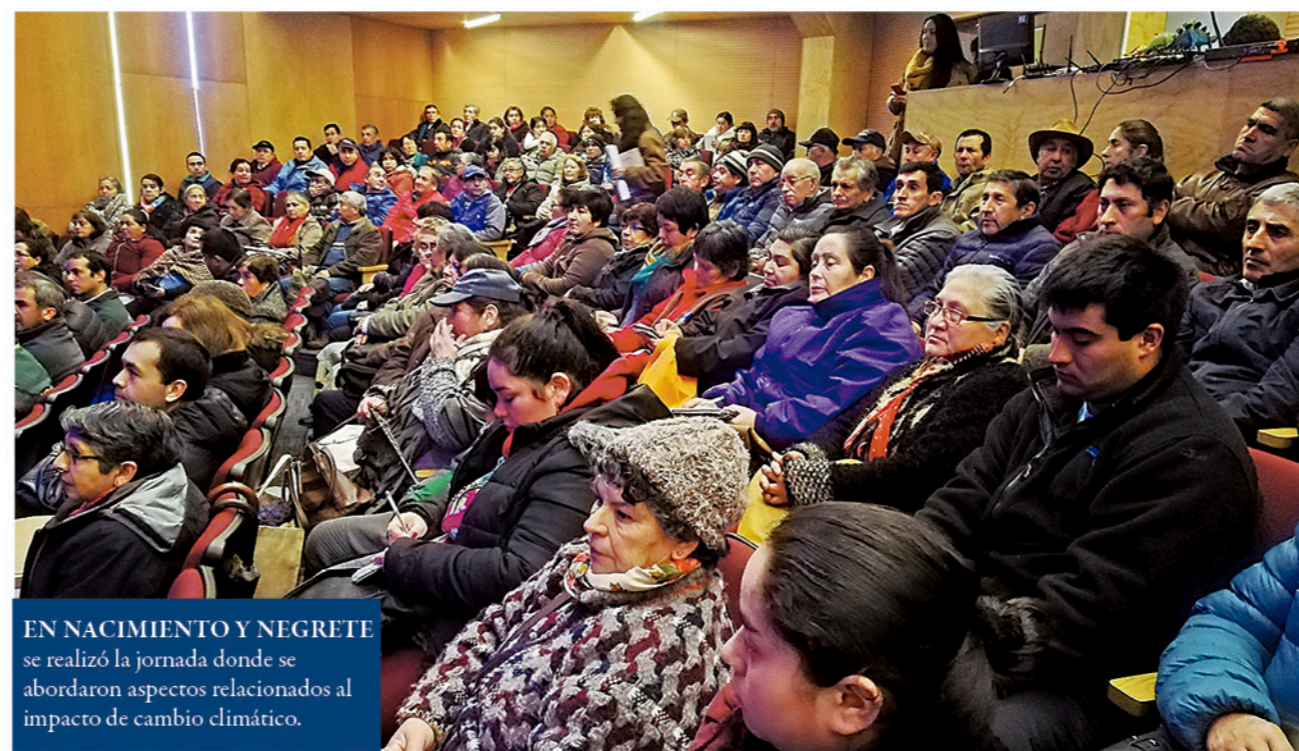
EN NACIMIENTO Y NEGRETE se realizó la jornada donde se abordaron aspectos relacionados al impacto de cambio climático.

La región del Biobío actualmente aumenta su superficie de frutales,