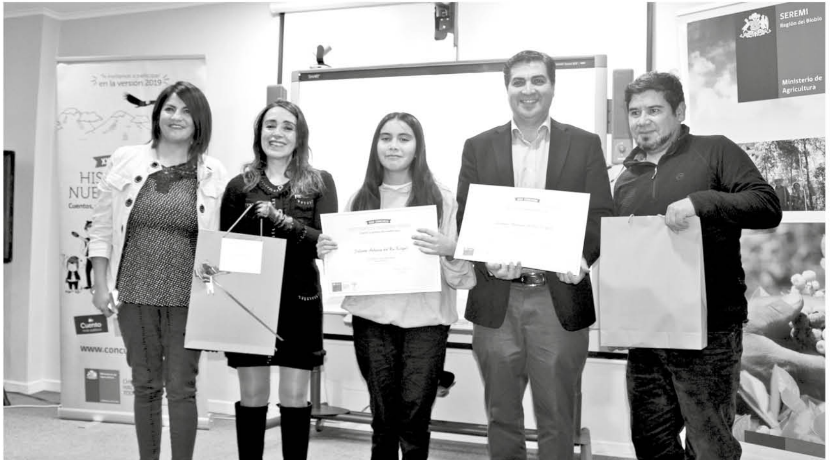
LA ESTUDIANTE del Colegio Teresiano de Nacimiento se sumó al concurso literario consiguiendo destacar entre 400 concursantes.

En la región fueron premiadas las mejores nueve obras de la vigesimosexta versión del certamen donde participaron cerca de 400 niños, jóvenes y adultos. Por categoría fueron