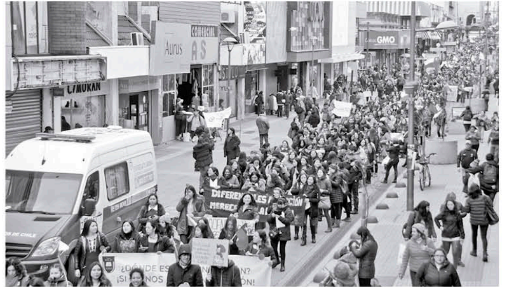
EN LOS ÁNGELES SE REGISTRÓ otra masiva movilización este miércoles en apoyo al paro de los profesores.

“El alcalde tomó esa medida basado en que es el empleador de todos los profesores de la comuna. Ahora yo estoy despachando la aprobación del calendario para que mañana mismo se paguen esos días”, comentó San Martín.