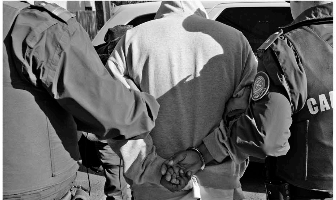
AMBOS HERMANOS TENDRÁN que dar cuenta por este delito que se mantiene en investigación. (Foto de contexto)

El hecho desembocó en que este hombre presentara diversas lesiones en el cuerpo como en su cara, brazos que lo mantienen en riesgo vital