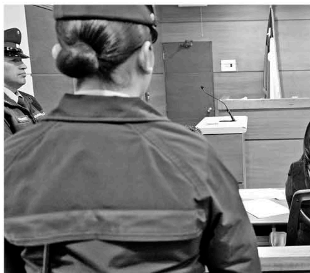
CERCA DE CATORCE TESTIGOS se presentaron a declarar en este lamentable ataque reiterado.

Asimismo, el Juzgado de Familia de Los Ángeles rechazó que participaran en el proceso de susceptibilidad de adopción de la niña, menor que el 20 de junio recién pasado fue entregada a otra familia de acogida para mantener los cuidados correspondientes a la pequeña.