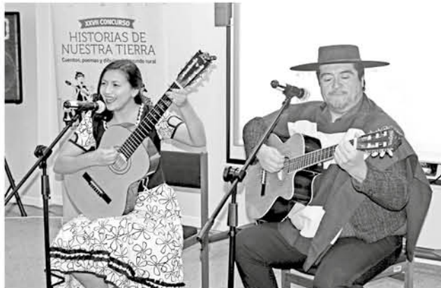
EN LA PREMIACIÓN se rescataron las tradiciones y el patrimonio cultural de la región.

Las obras para este año podrán ser enviadas hasta el 30 de agosto a través del sitio www.concursosocuentos.cl .