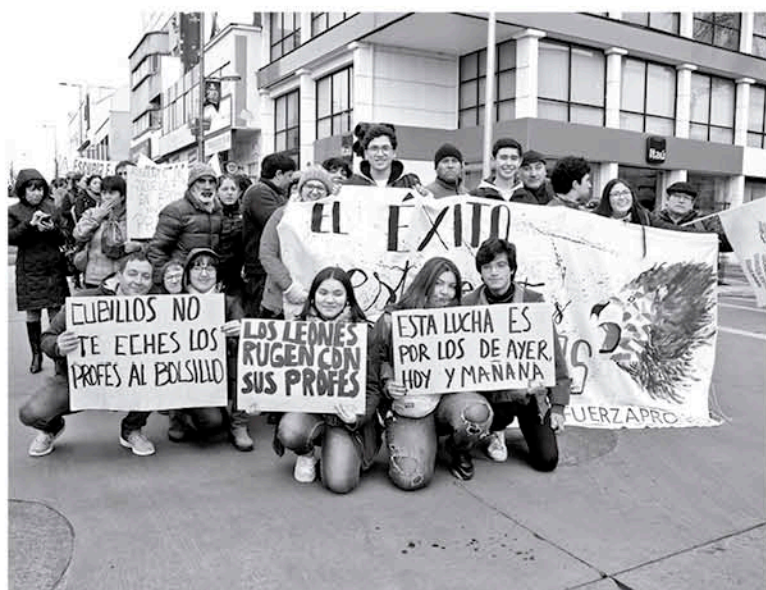
LOS DOCENTES CENTRARON sus críticas en la falta de diálogo con la ministra Marcela Cubillos.