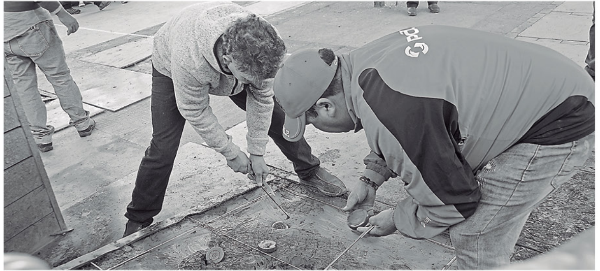
LA RAYUELA se juega sagradamente todos los domingos, donde se espera 15 minutos a los elencos, si no se presentan se considera abandono.

ahora escolta del Toqui, será trascendental para ubicarse dentro de los líderes.