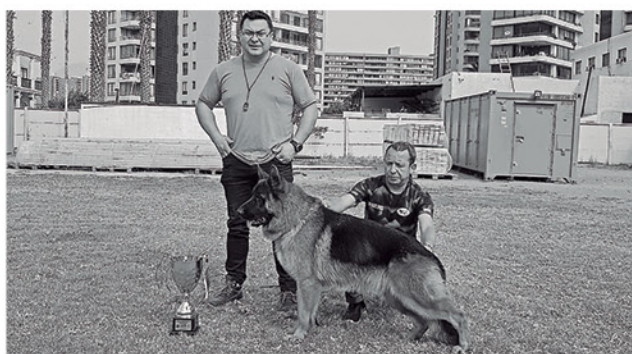
A LA EXPOSICIÓN viajaron ejemplares de todo Chile, sumando en total cincuenta ejemplares en competencia.

Los sabuesos del corazón provincial lograron sumar nuevamente unidades, en una competencia donde siguen captando las miradas y ganando respeto a nivel nacional.