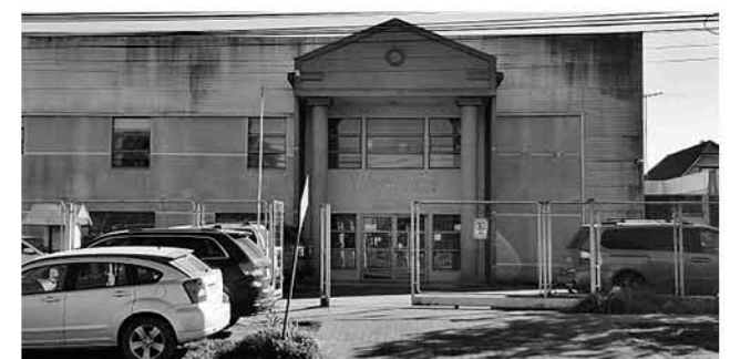
LA MENOR SE MANTIENE con otra familia guardadora hasta la fecha.