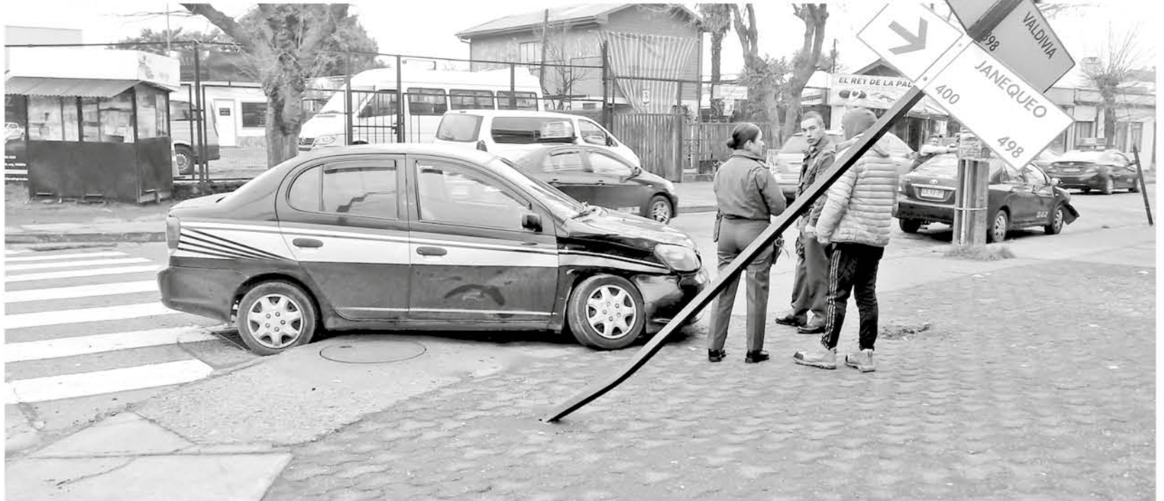
ESTE ES EL PANORAMA HABITUAL de los vecinos de este sector, donde solicitan la urgencia de medidas de seguridad.

Afectados y con temor por la constante serie de accidentes vehiculares declararon sentirse los vecinos y comerciantes que habitan actualmente a pocos metros de la intersección de las calles Valdivia con Janequeo, la que ha llamado "la esquina de la muerte".