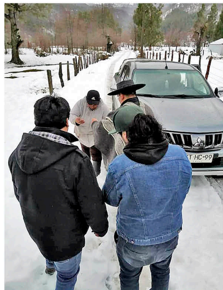
EN LA ZONA CORDILLERANA se ha logrado establecer comunicación con familias del valle del Biobío. Por el Queuco, se mantiene el aislamiento.

Ángeles, es muy distinto a hacerlo con la mirada de quién está en Alto Biobío. Yo como peñi, como pehuenche me comunico directamente con las familias. La comunicación es de boca en boca. No tenemos teléfonos en las comunidades. No hay líneas porque está todo muy complicado".