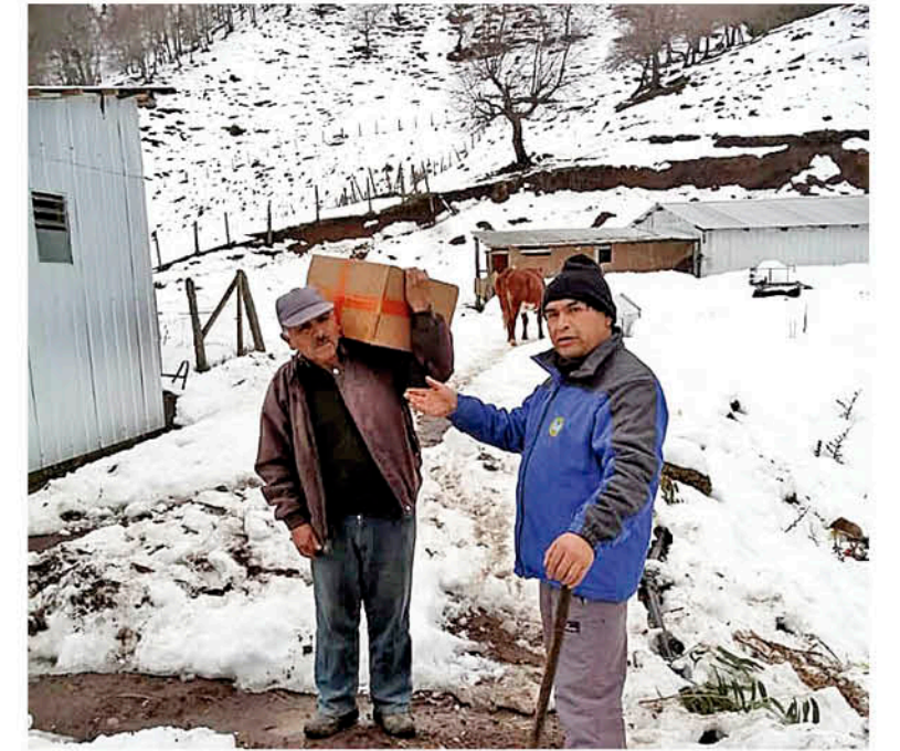
POR EL BIOBÍO SE HA LLEGADO con ayuda en agua potable y alimentos para las familias.

El parlamentario solicitó "al presidente y al ministro del Interior que decreten de manera urgente la alerta roja para la comuna".