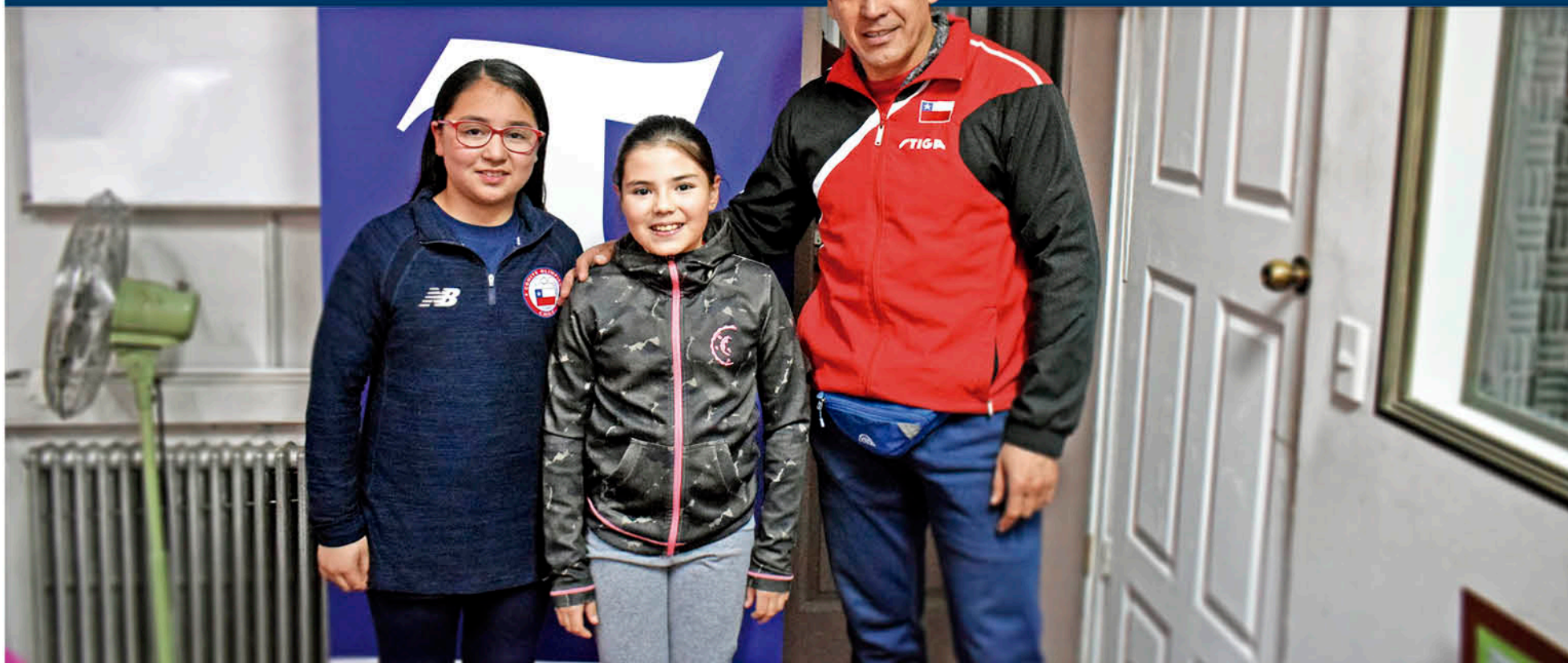
POSTERIOR A SUS CONVOCATORIAS, las poderosas paletas de Biobío, comienzan a preparar su siguiente actuación para mantenerse en lo máximo del ranking.