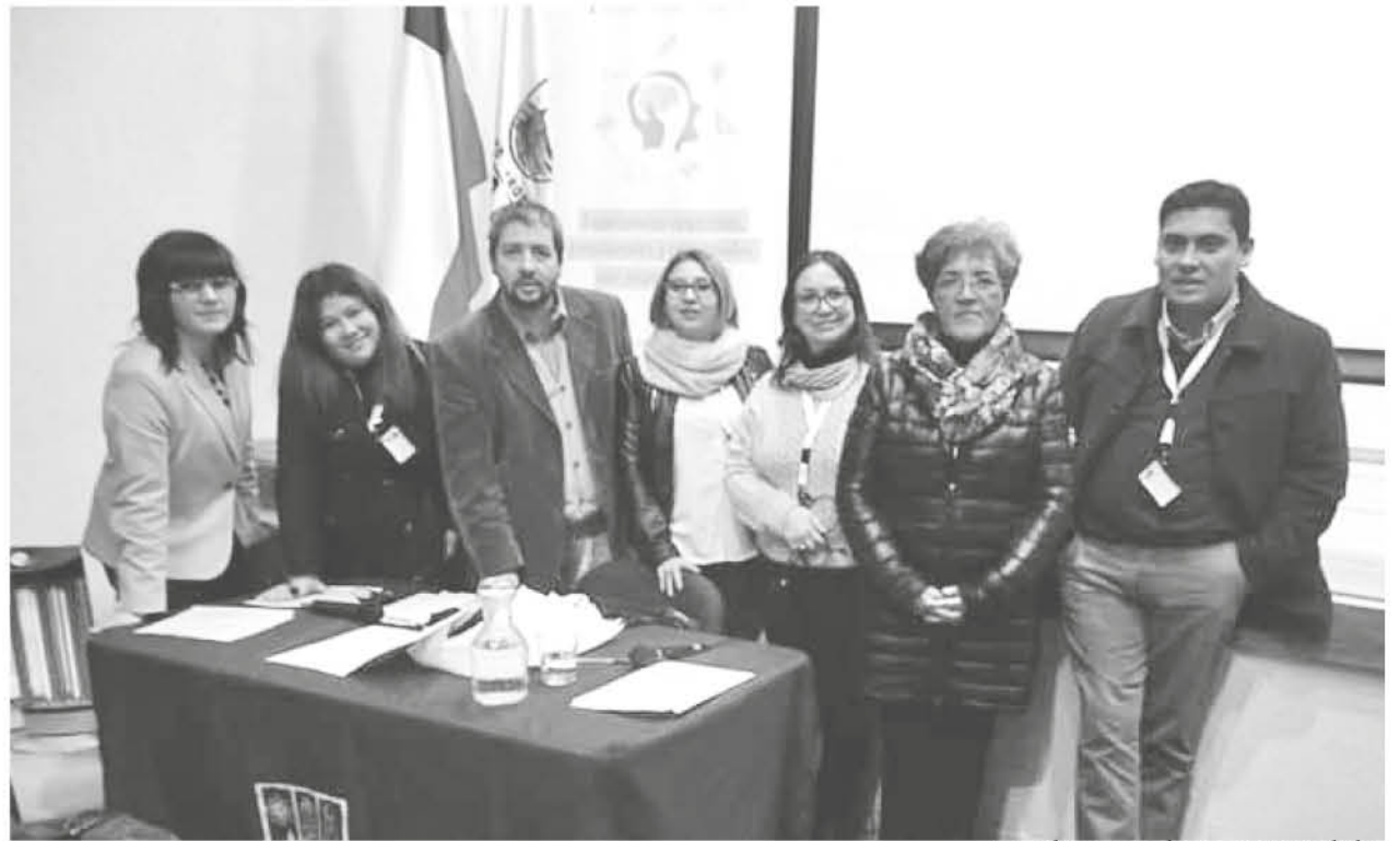
EQUIPO DE PROFESIONALES que compone la Fundación Simonne Romain.