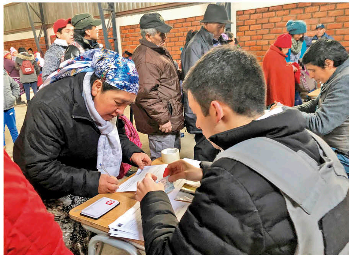
DESDE APARTADAS COMUNIDADES llegaron familias a pagarse de sus pensiones.