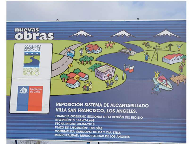
AÚN ESTÁ en pie el cartel de la obra.