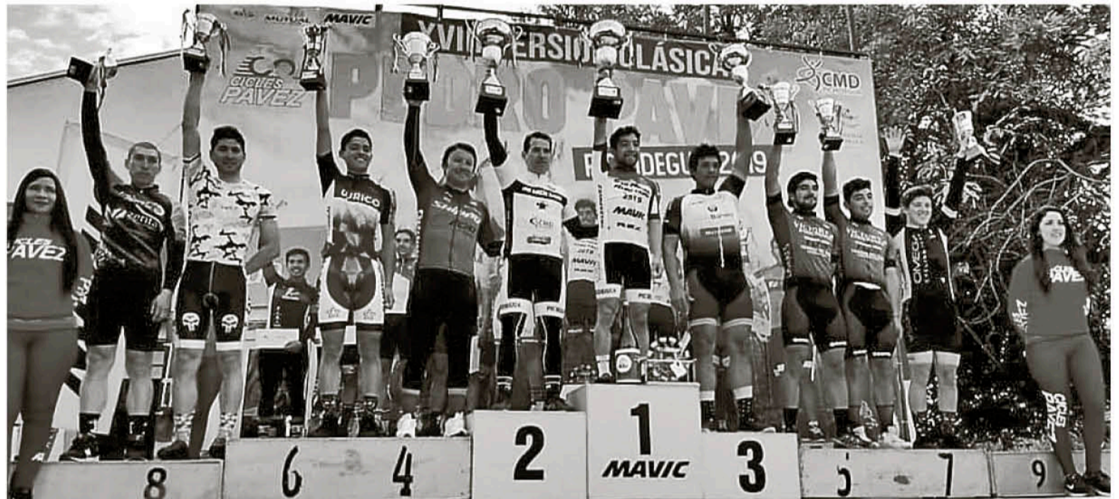
EN LA VERSIÓN ANTERIOR de la gran prueba ciclista, el exponente angelino también logró ser monarca subiéndose al máximo podio.

Nuevamente la comuna de Pichidegua destacó en la región de O'Higgins siendo sede de una convocatoria pedaletera situada entre las más competitivas de Chile, válida por la XVIII versión de la Clásica de Ciclismo Pedro Pavez.