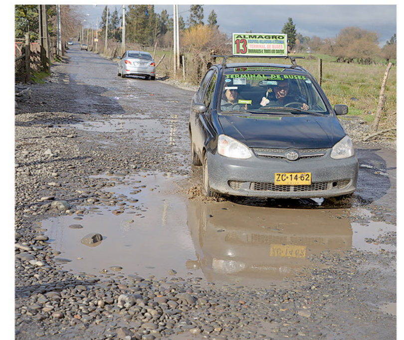
LA LÍNEA 13 son los únicos que llegan al lugar.