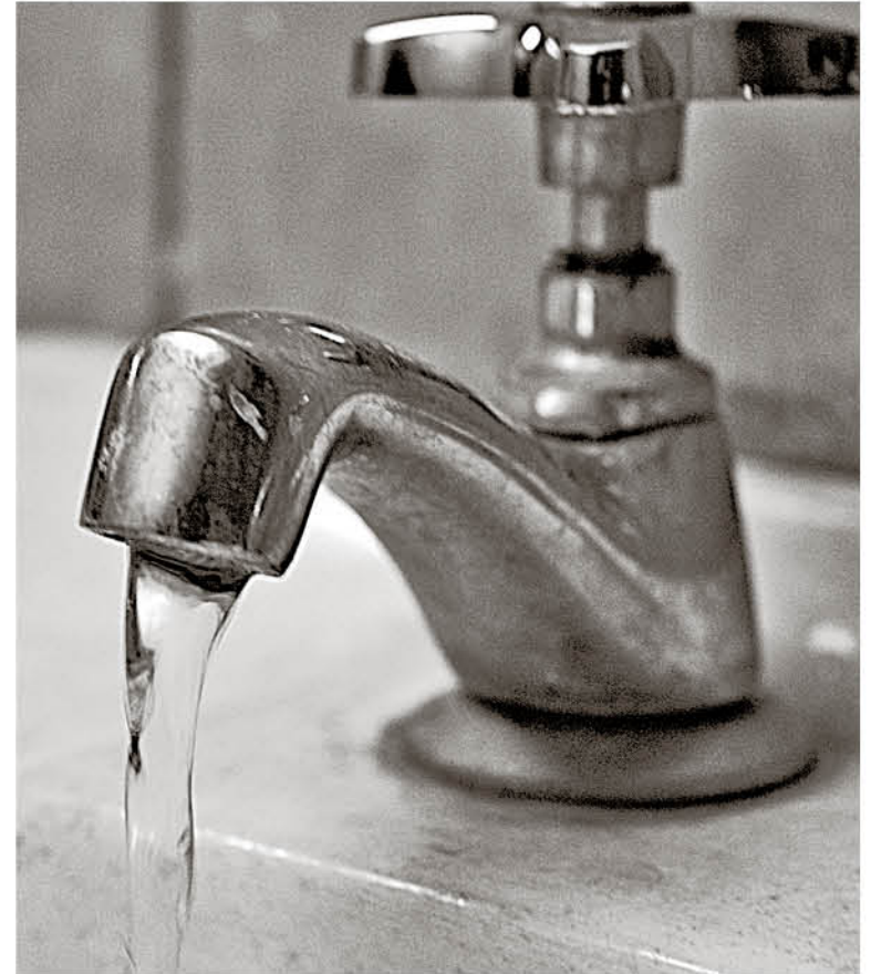
EN EL CONGRESO SE ABORDÓ el tema a raíz de la crisis sanitaria que se vivió en Osorno.

Al profundizar en los cuestionamientos realizados por el parlamentario, aseveró que “la Superintendencia todos los meses, tiene un proceso de fiscalización donde las empresas sanitarias, remiten los controles que se hacen a los efluentes