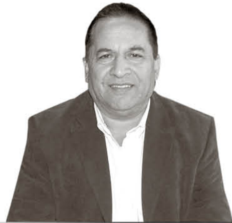
Miguel Abuter León Alcalde de Antuco

Los humanos somos los principales causantes de las emisiones contaminantes, que retienen el calor y provocan este desastroso efecto invernadero, por ello también la solución comienza por nosotros.