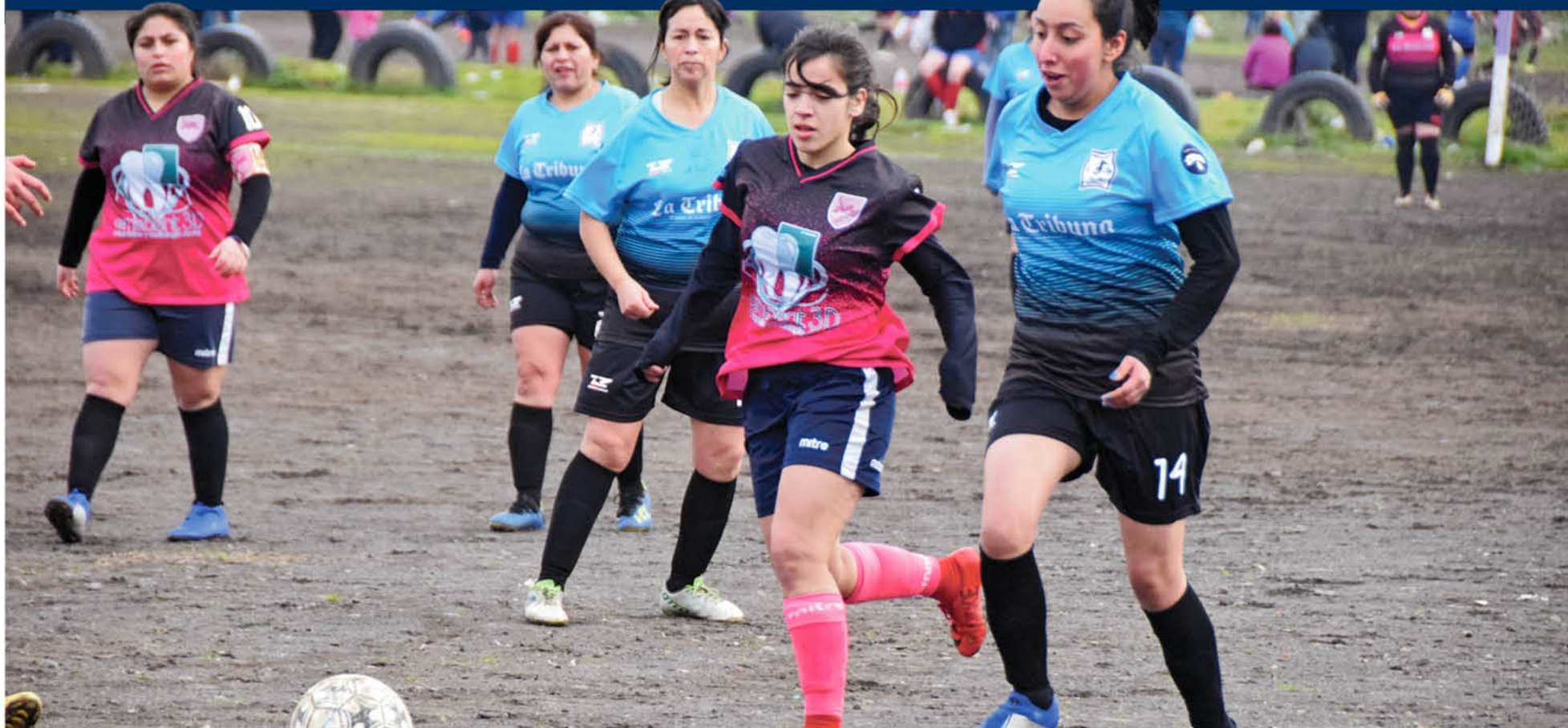
EN LA FASE DE APERTURA, válida por el torneo de fútbol femenina el Club Dávila se coronó con el fêretro, tras sumar lo suficiente en su cuenta de ahorro.