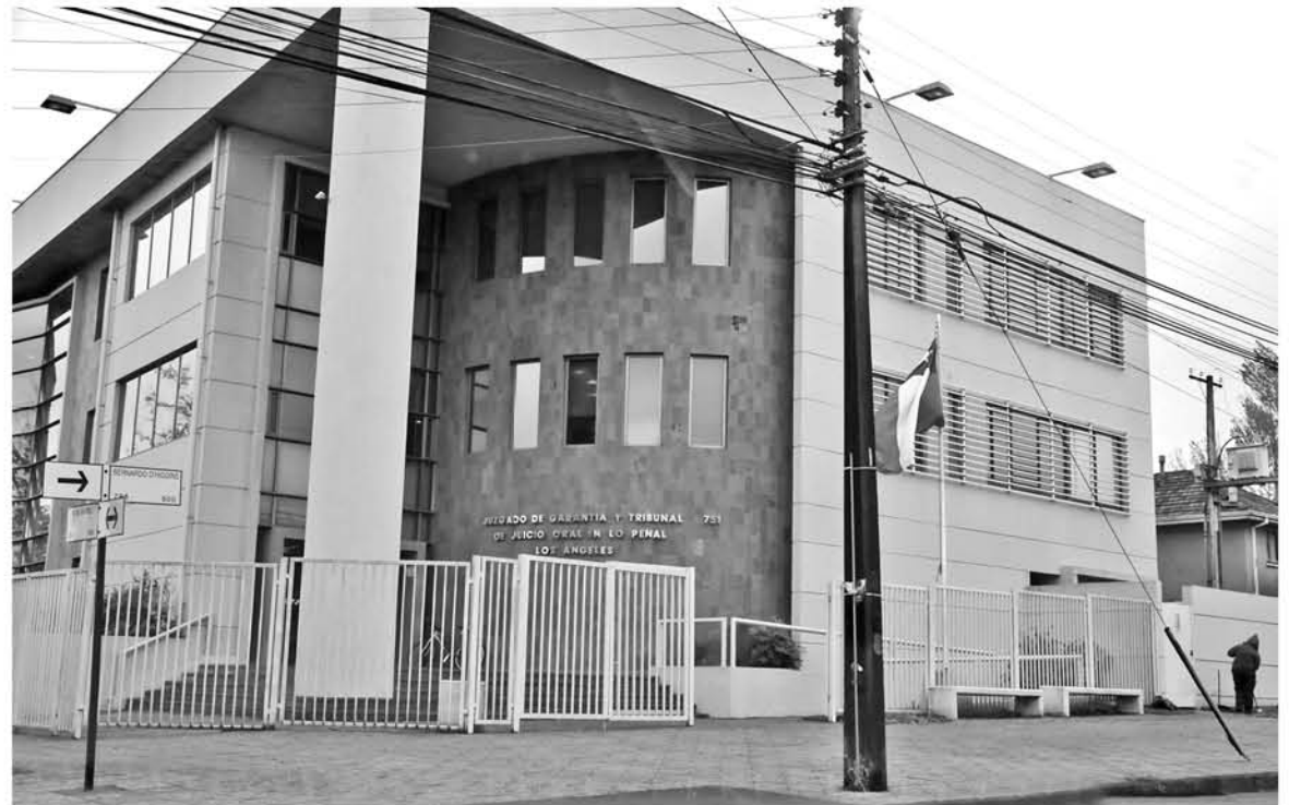
EL IMPLICADO tendría irreprochable conducta anterior.