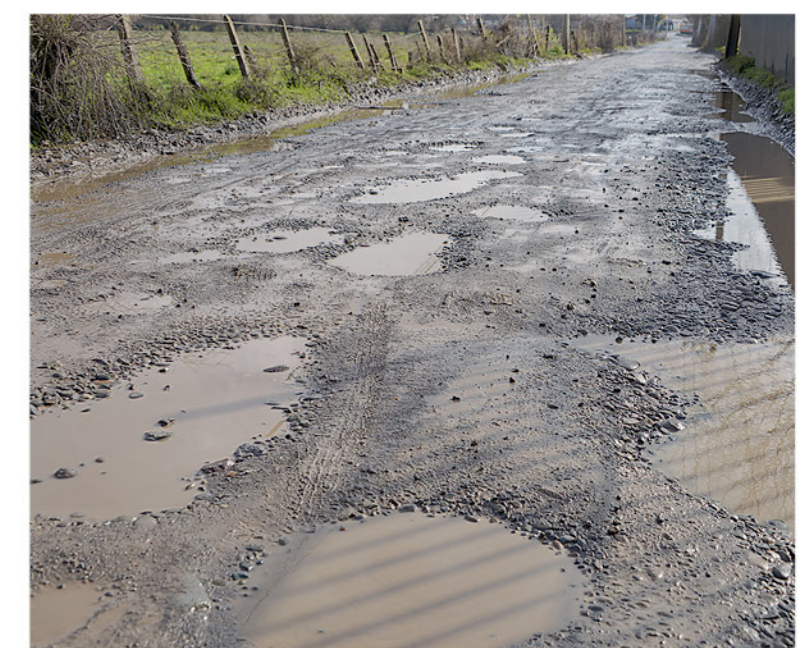
ASÍ ESTÁ EL CAMINO de acceso hacia villa San Francisco.