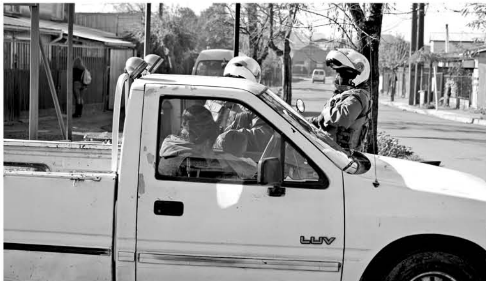
A NIVEL REGIONAL se llevó a cabo la detención de 273 personas.

Al ser consultado sobre la cantidad de reincidentes, el prefecto manifestó que muchos delincuentes ya han sido sorprendidos por otro tipo de delito. “Ahora hay que ver de todas estas personas cuantas quedaron en prisión preventiva y cuantas con medidas cautelares y otras quedaron en libertad, yo creo que esa respuesta habría que tenerla una vez que se verifique con tribunales”, manifestó.