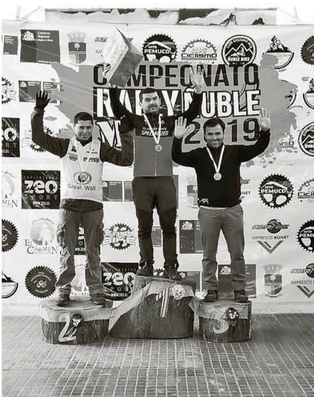
A LA CARRERA ASISTIERON más de 200 corredores para disputar la primera de seis fechas que compondrán el desafío en Ñuble.

El desafío para el combinado ciclista cabrerino será seguir en la batalla por la distinción dentro de la prueba en Ñuble, la cual se disputará en Quirihue.