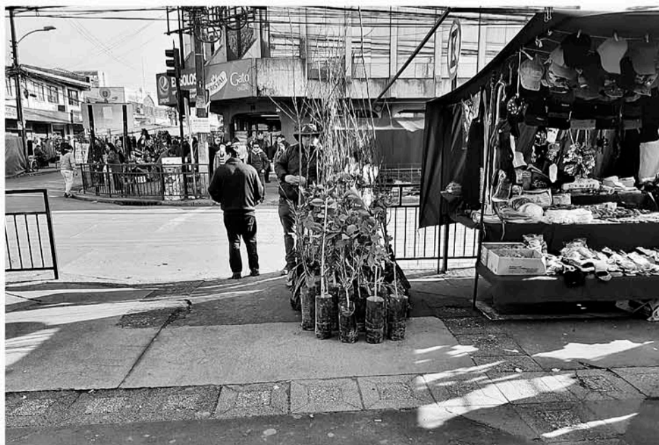
EL COMERCIANTE en el puesto designado que le corresponde según su permiso Municipal.

Actualmente la Municipalidad se encuentra gestionando en conjunto con la comunidad de frutas y verduras el plan “Full Vega”, que pretende obras para el desarrollo de mejor iluminación y aseo, apuntando a un crecimiento gradual del entorno comercial de Los Ángeles.