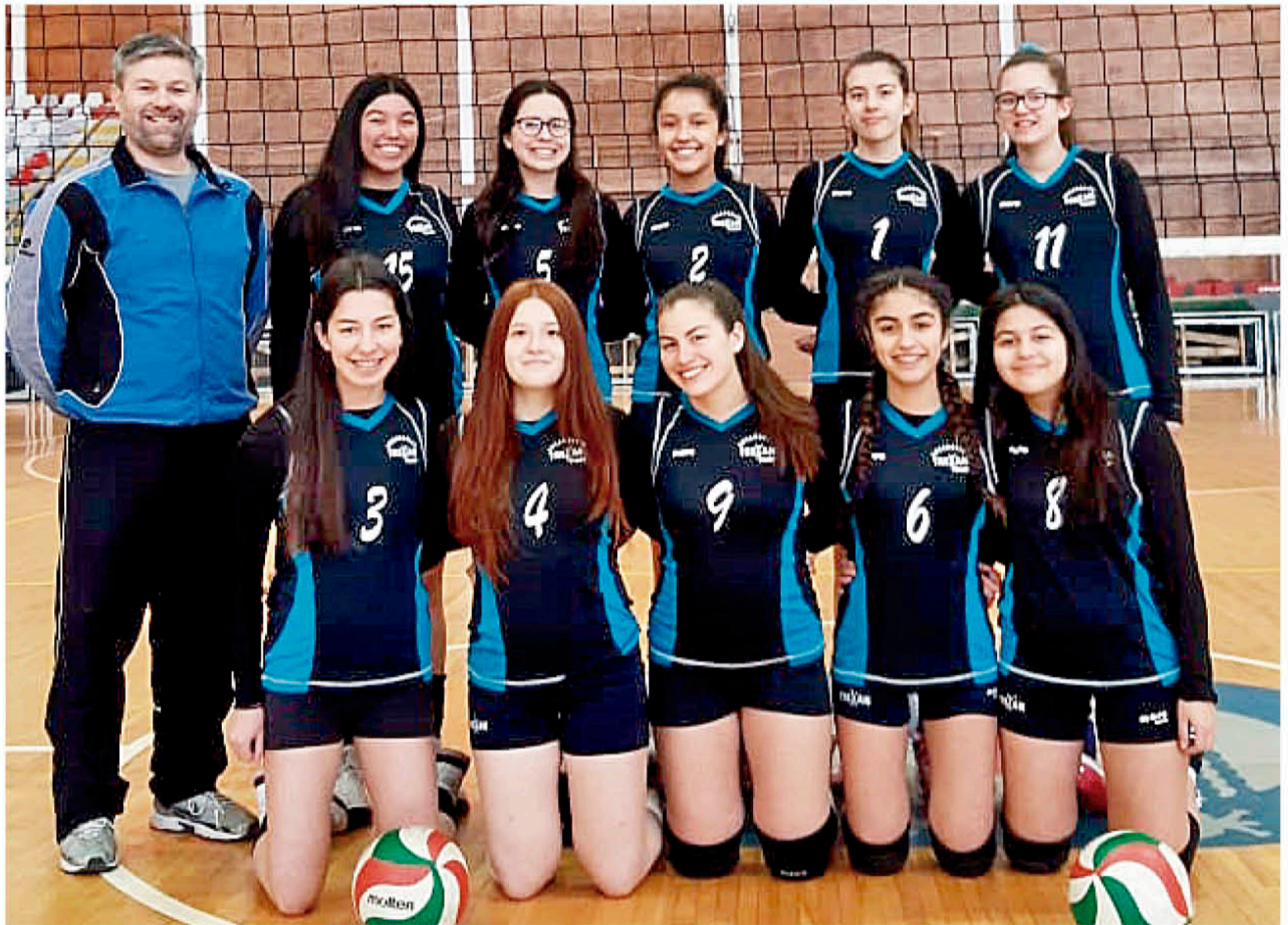
PLANTEL DEL CLUB TREKAN en el marco de su participación en Copa Confraternidad de Vóleybol Femenino 2019.

El equipo angelino se midió ante combinados representantes de Colombia y Perú. Cabe destacar que siendo esta su primera experiencia fuera del país ante potencias de este deporte a nivel Sudamericano, lograron un gran desempeño, tomando en cuenta de referencia el nivel de la Provincia de