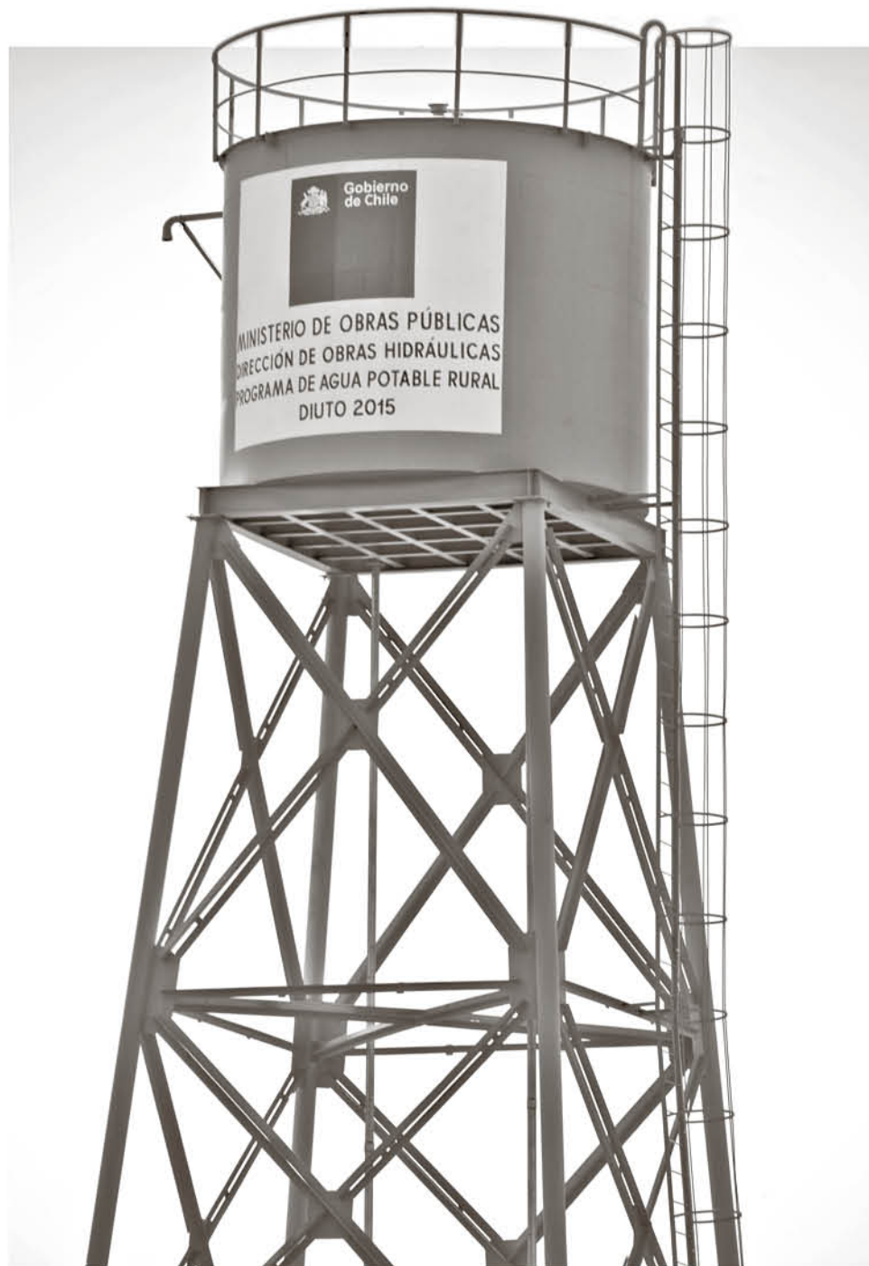
ENTRE LOS PROYECTOS MÁS URGENTES se encuentran agua potable rural y edificaciones para la comunidad.