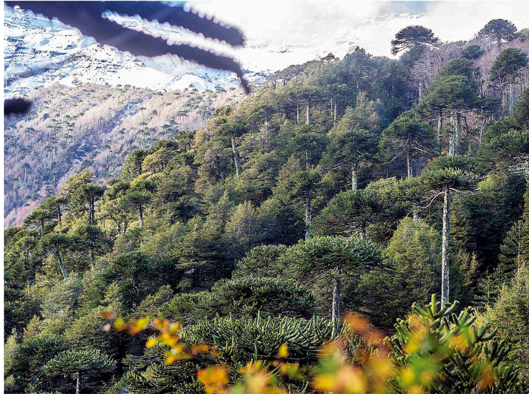
DESDE HACE 450 AÑOS se mantiene una merma en los bosques de araucarias.

El investigador sostiene que existen diferentes hipótesis respecto de la merma en los bosques de araucarias,