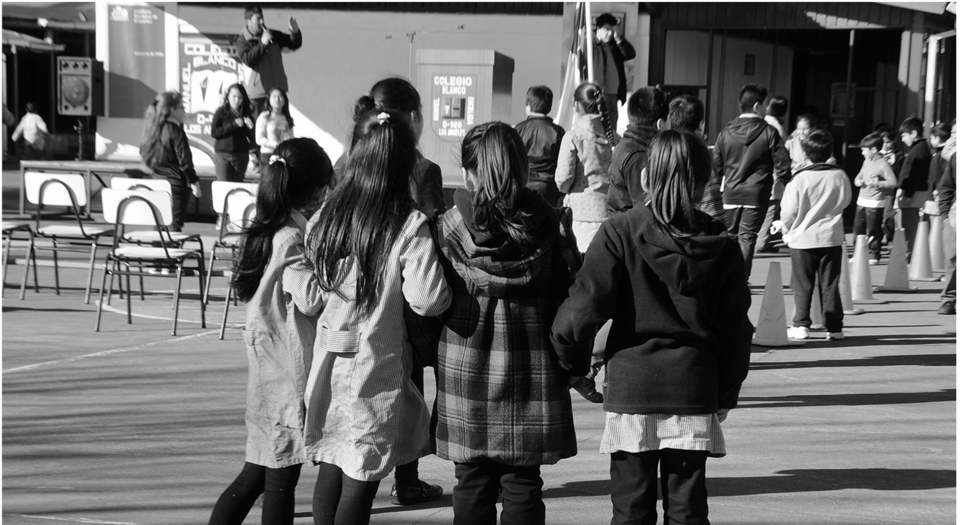
LA VUELTA A CLASES a lo largo de todo Chile se efectuará oficialmente el próximo lunes 29 de julio.