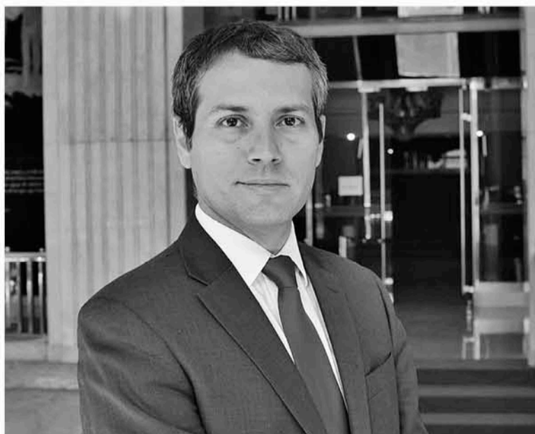
RODRIGO YÁÑEZ, subsecretario de Relaciones Económicas Internacionales de la Cancillería afirmó que para la región del Biobío las oportunidades serán múltiples de aprobarse el acuerdo con economías mundiales.

Sobre las Pymes aseveró que se trata del primer tratado de libre comercio que incorpora un capítulo sobre ese rubro económico, “cuyo propósito es hacer más expedita la internacionalización de estas empresas en la zona del Asia-Pacífico las que, debido a su tamaño, debilidad productiva y elevados costos, no han podido participar a su máximo potencial en el comercio exterior”.