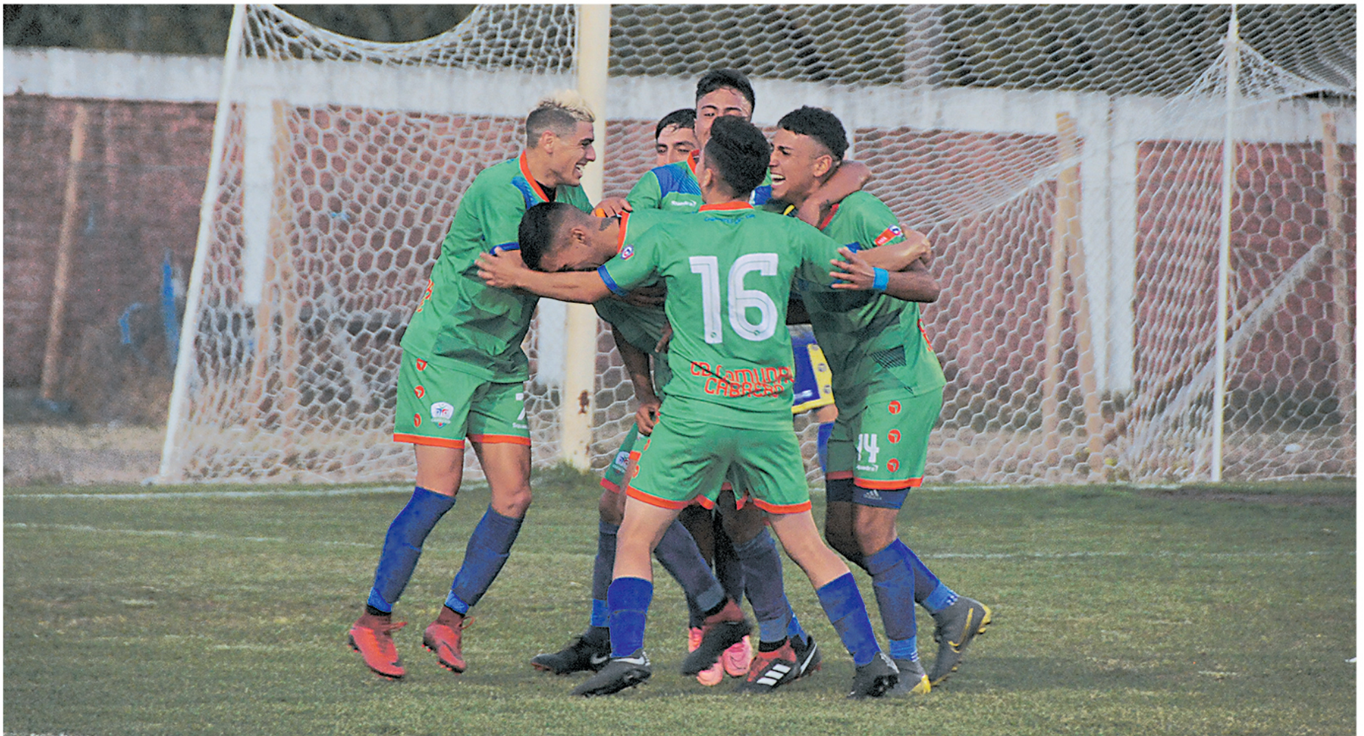
COMUNAL CABRERO deberá enfrentar a la escolta del líder, Chimbarongo FC, este fin de semana en calidad de