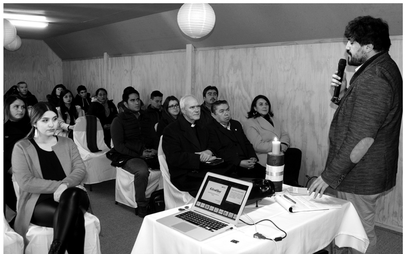
EL ANIVERSARIO NÚMERO 12 de este recinto fue celebrado por autoridades locales y sus integrantes, además de jóvenes que buscan superar este problema.

“En este centro me han ayudado como mi madre, quien nunca ha bajado los brazos. Sé que fue doloroso, pero no se dio por vencida y gracias a ello, acá estoy, luchando cada día con más ganas y más proyectos” puntualizó joven quien terminó su educación media y hoy fija otro objetivo, estudiar mecánica industrial.