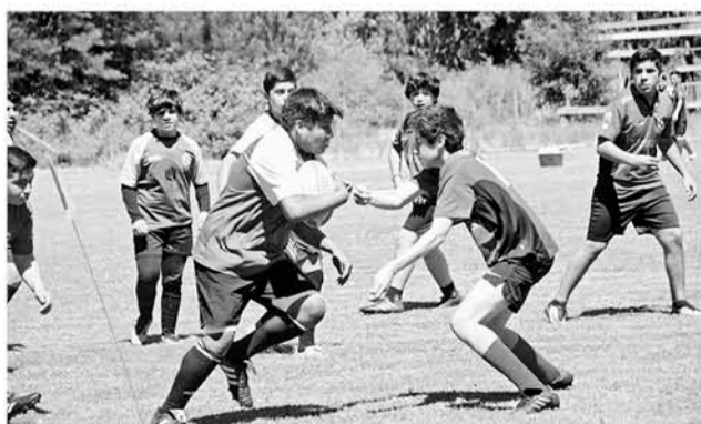
LAS NUEVAS FILAS se medirán ante las inferiores de los elencos que enfrenta la división adulta de Callaquén.

Desde la asociación rugbista angelina, hacen la invitación a los jóvenes para que formen parte de una gran familia deportiva.