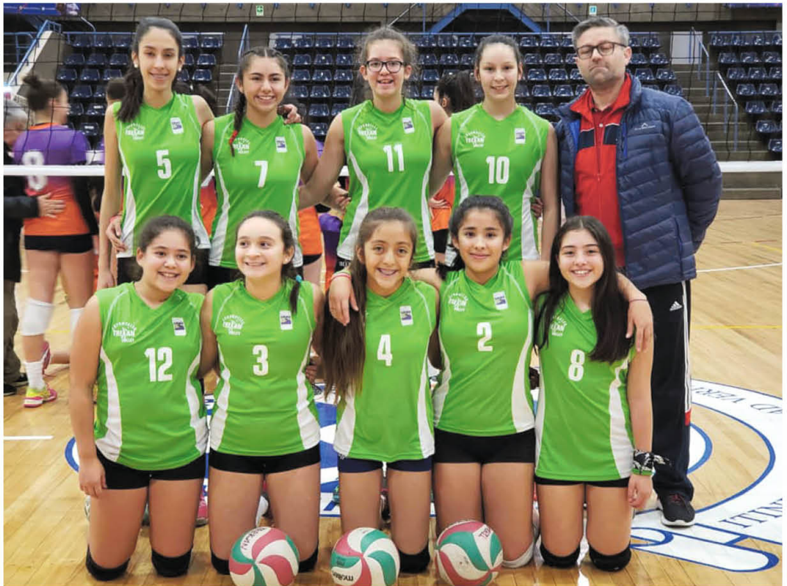
CLUB TREKAN en el marco de una de sus últimas competencias.

Con la tenacidad como emblema para estar entre los mejores equipos,