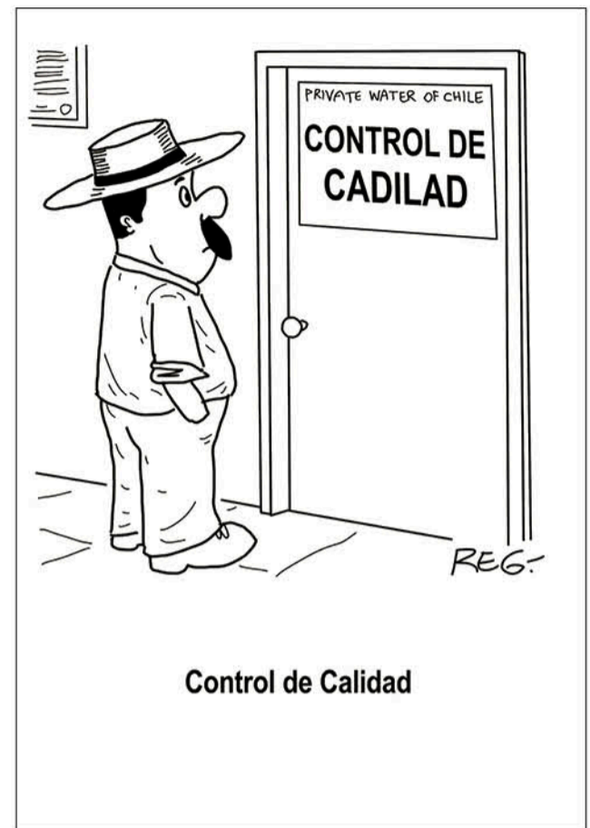
Control de Calidad