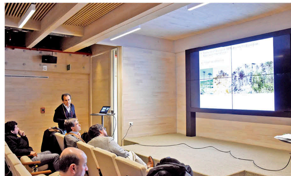
EL SEMINARIO SE REALIZÓ en Los Ángeles y participaron periodistas de la Facultad de Comunicaciones de la Pontificia Universidad Católica de Chile.