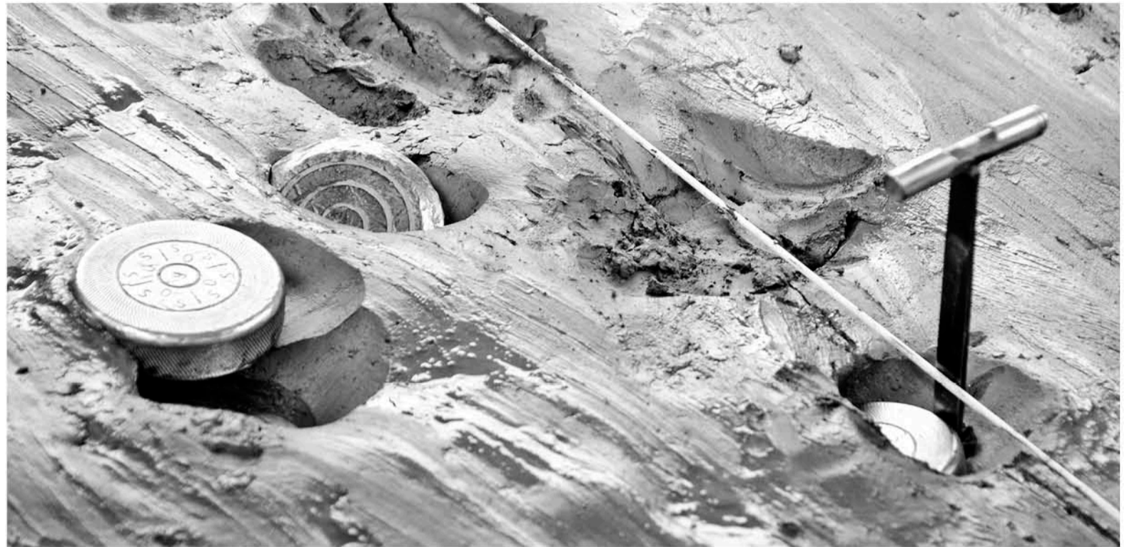
EL TORNEO DE TEJO se disputa todos los domingos, si es que el tiempo lo permite, en distintos recintos dentro de la capital provincial.

Posterior a la última convocatoria en la fase oficial del Campeonato de Rayuela 2019, la batalla por mantenerse firmes dentro de las primeras posiciones sigue su curso.