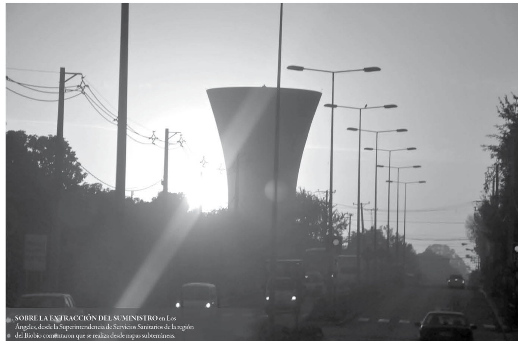
SOBRE LA EXTRACCIÓN DEL SUMINISTRO en Los Ángeles, desde la Superintendencia de Servicios Sanitarios de la región del Biobío comentaron que se realiza desde napas subterráneas.

Con esta dura crítica el subsecretario se refirió a la situación, destacando que