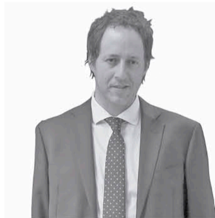
Cristóbal Urruticoechea Diputado RN

La idea es modificar la Ley 18.695, que contiene la orgánica constitucional de municipalidades. Las condiciones para llamar a un plebiscito deben perfeccionarse y también los requisitos para que la opinión de los participantes sea vinculante.