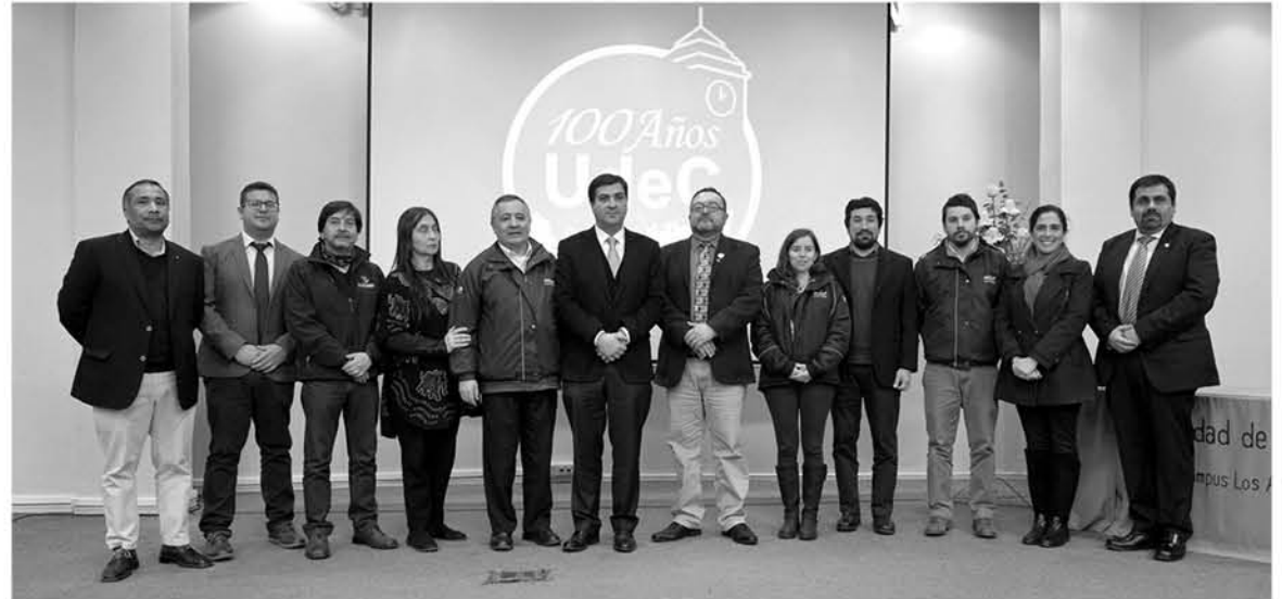
CEREMONIA DE CIERRE DE LA INVESTIGACIÓN "Determinación del origen floral de miel natural de abeja de la región geográfica Biobío Cordillera".

Los apicultores locales que participaron activamente en el desarrollo de este proyecto recibieron un gran punto de apoyo para conocer la com-