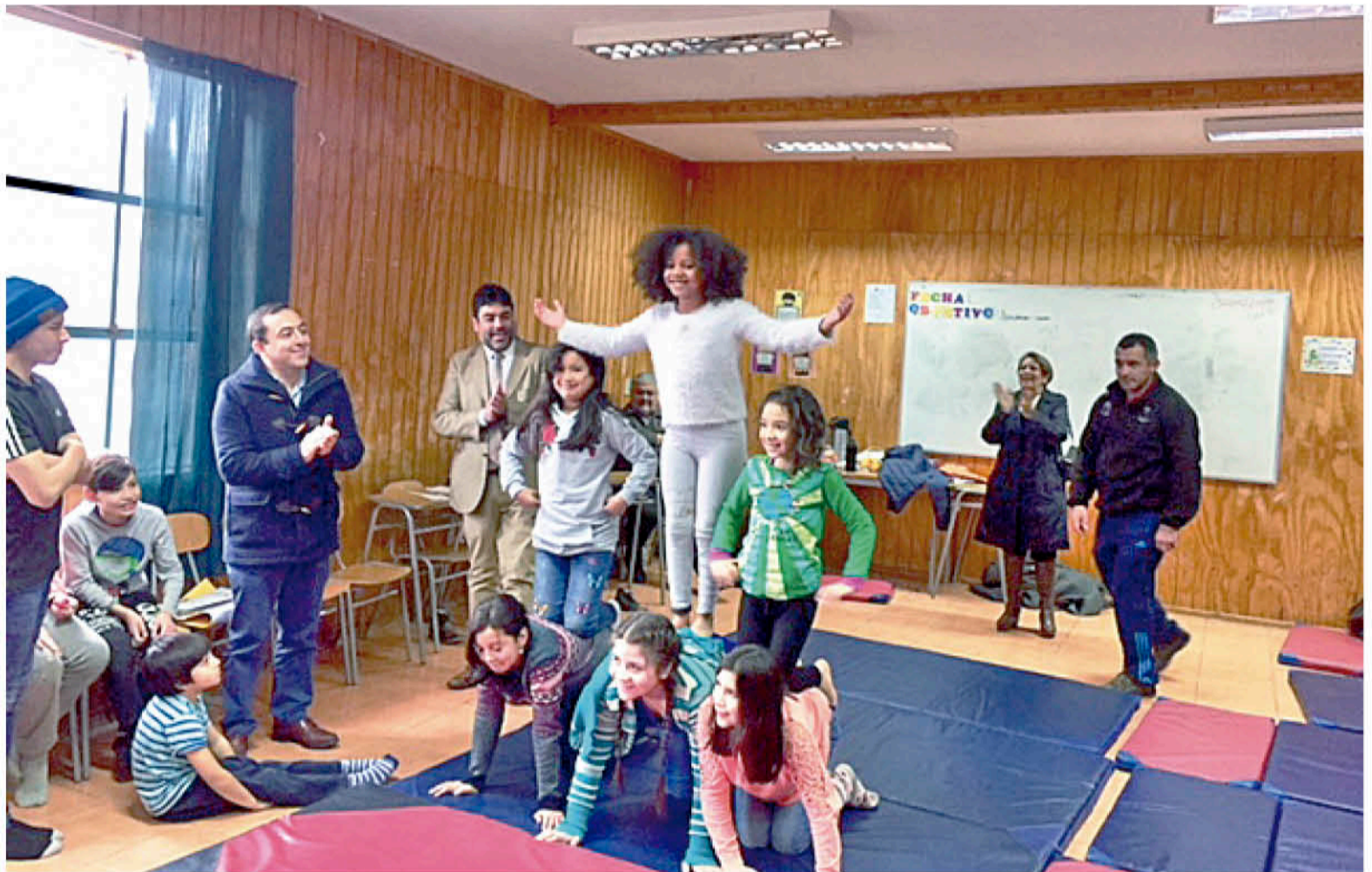
EL CAMPAMENTO recreativo trabaja y potencia la afectividad, la creatividad, la autonomía personal y la formación en valores.

Cabe destacar que el programa Campamentos Recreativos de Invierno, perteneciente al área de Salud del Estudiante de Junaeb, son financiados por la institución y ejecutados por los departamentos de educación municipales y ONG; se realizan en el periodo de vacaciones con actividades integrales, deportivas, artísticas y culturales, guiadas por monitores que ayudan a los estudiantes a tener acceso a espacios con diversas actividades que fomentan los estilos de vida saludable, el buen uso del tiempo libre y la buena convivencia, ade-