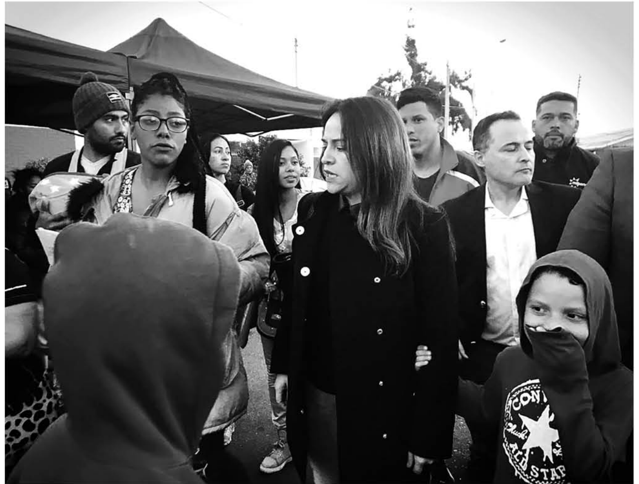
LA DIPUTADA JOANNA PÉREZ viajó a Tacna para conocer de cerca el estado de los migrantes venezolanos.

La parlamentaria añadió que se ha cambiado el discurso desde el gobierno con respecto a los migrantes venezolanos que buscan escapar de la grave situación humanitaria que vive su país.