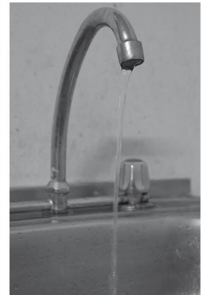
ACTUALMENTE LA COMUNA de Osorno se encuentra con una reposición completa en la zona y con anuncio de compensaciones a la comunidad.

"Essal tiene la concesión del agua potabilizada apta