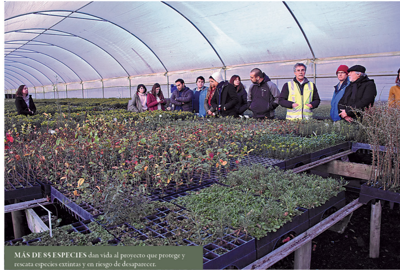
MÁS DE 85 ESPECIES dan vida al proyecto que protege y rescata especies extintas y en riesgo de desaparecer.

En tal sentido, la iniciativa surgió a partir del año 2016, cuando una situación inusual comenzó a afectar el follaje de las araucarias, emplazadas en localidades de la cordillera de Nahuelbuta; se trataba de necrosis en hojas y ramas, diagnóstico que ocasionó que algunas de estas especies murieran. Dicho escenario también se manifestó en plantaciones ubicadas en algunos