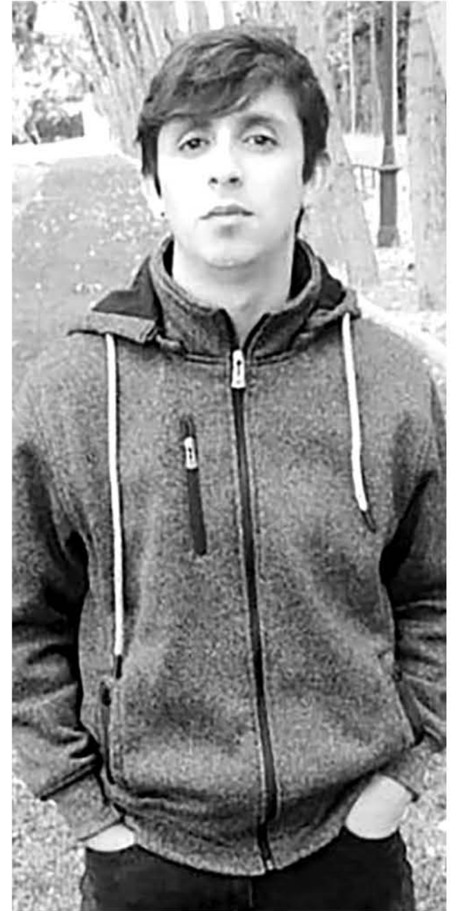
EL JOVEN SE ENCONTRABA de vacaciones en La Paz junto a su novia, quien es de nacionalidad boliviana.

Sobre la fecha de repatriación de este joven, se dio a conocer que en este momento se mantiene en proceso de preparación y en los últimos trámites, los que se encontrarían avanzados, por lo que según se ha informado al alcalde en contacto directo con el cónsul en dicho país, posiblemente el cuerpo de este joven tucapelino podría ser trasladado el próximo martes.