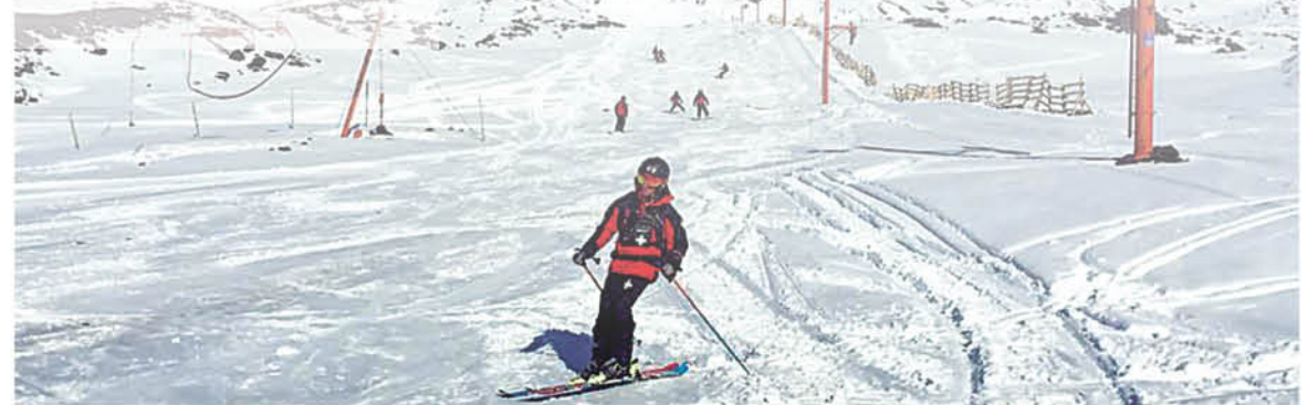
EL CENTRO DE ESQUÍ VOLCÁN Antuco es un lugar idóneo para el desarrollo del deporte blanco y las rutas turísticas guiadas.

En este ámbito, la provincia de Biobío se alza como uno de los puntos fuertes, donde se destacan grandes paisajes cordilleranos, y predomina la nieve y la frondosidad de sus bosques, siendo un lugar ideal para mezclar el deporte y el turismo.