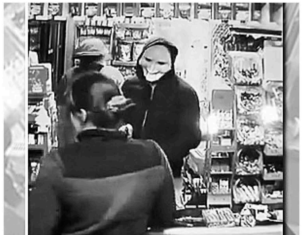
LOS ASALTANTES HUYERON con aproximadamente 40 mil pesos y dos botellas de Jack Daniel's.

Al consultar al dueño de este inmueble –quien prefirió mantener su identidad en reserva– sobre dicha situación, comentó al medio que por el momento está al margen de la situación, sin referirse al respecto, puesto que se mantiene una investigación por este hecho del que no quieren