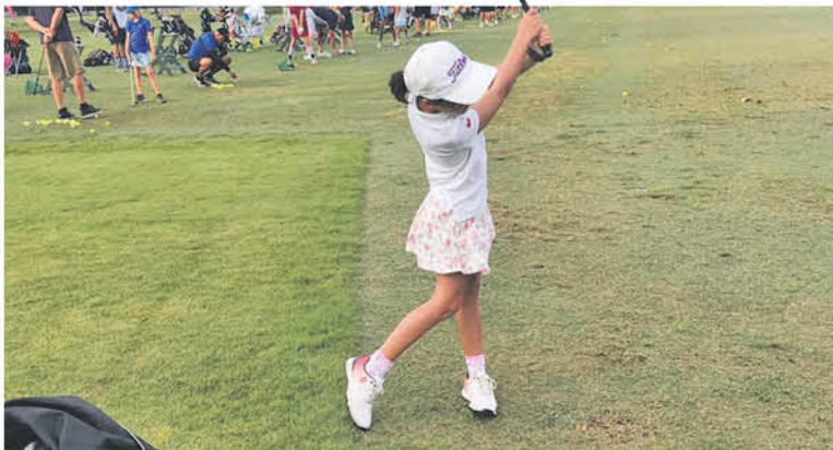
SEGÚN LOS ENTENDIDOS , su mayor fortaleza es la pegada larga y la concentración.