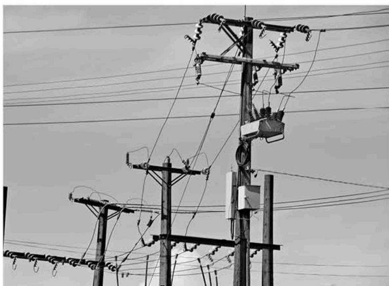
MULCHÉN ES UNA de las comunas más afectadas por estos robos durante este año 2019.

Este material mantuvo a decenas de familias sin el suministro durante la tarde del día martes, donde personal de la empresa Frontel trabajó para reponer el sistema.