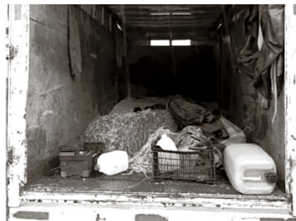
ESTE CAMIÓN APARECE COMO SOSPECHOSO y fue fotografiado por vecinos en un descuido de sus propietarios.

Dejar currículum en Avenida Alemania #355 - 2do piso Los Ángeles, además indicar pretensiones de sueldo.