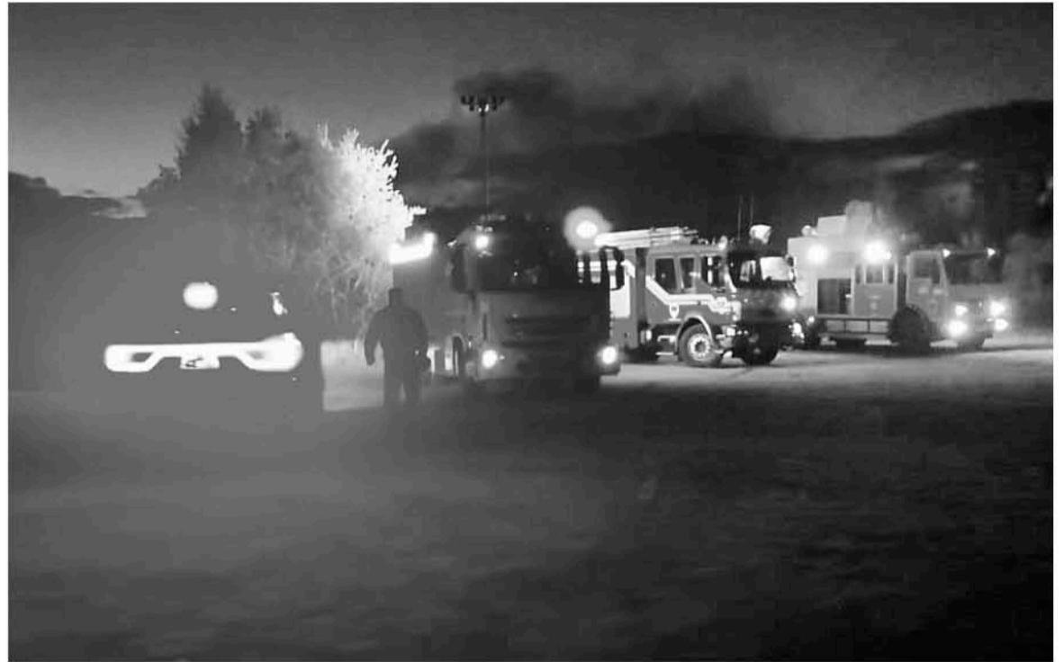
EN LA EMERGENCIA TRABAJÓ personal de Bomberos y Carabineros quienes resguardaron el lugar tras dicha tragedia.

Sin embargo a los pocos minutos, la máxima autoridad confirmó la muerte del piloto quien se encon-