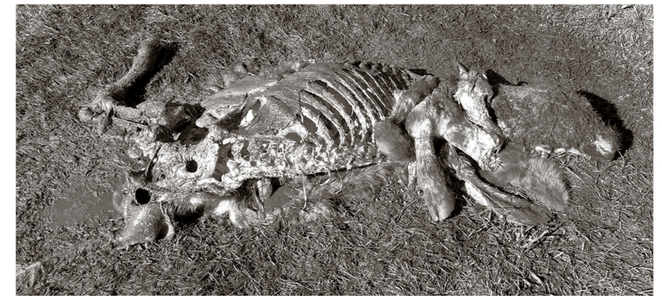
LOS ANIMALES FAENADOS son dejados en los mismos potreros donde se alimentaron a diario.

les, da lo mismo una gallina o un vacuno, da lo mismo si es una yunta de bueyes.