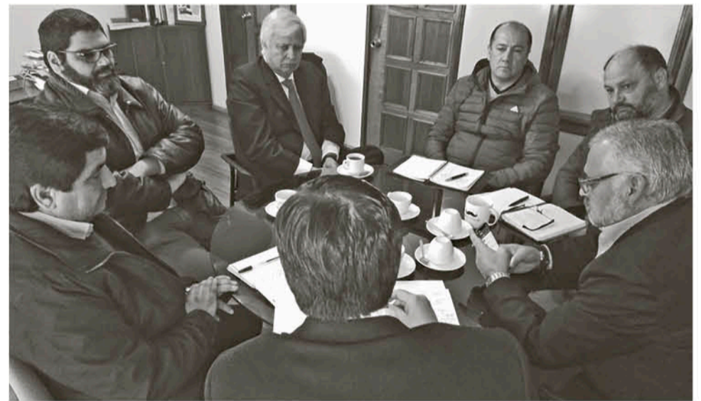
EN LA REUNIÓN se comprometieron a tener respuestas a mediados de mes.

Los participantes además tuvieron oportunidad de conocer el modelo de formación dual del Liceo Yungay, enfocado en la retención de jóvenes profesionales