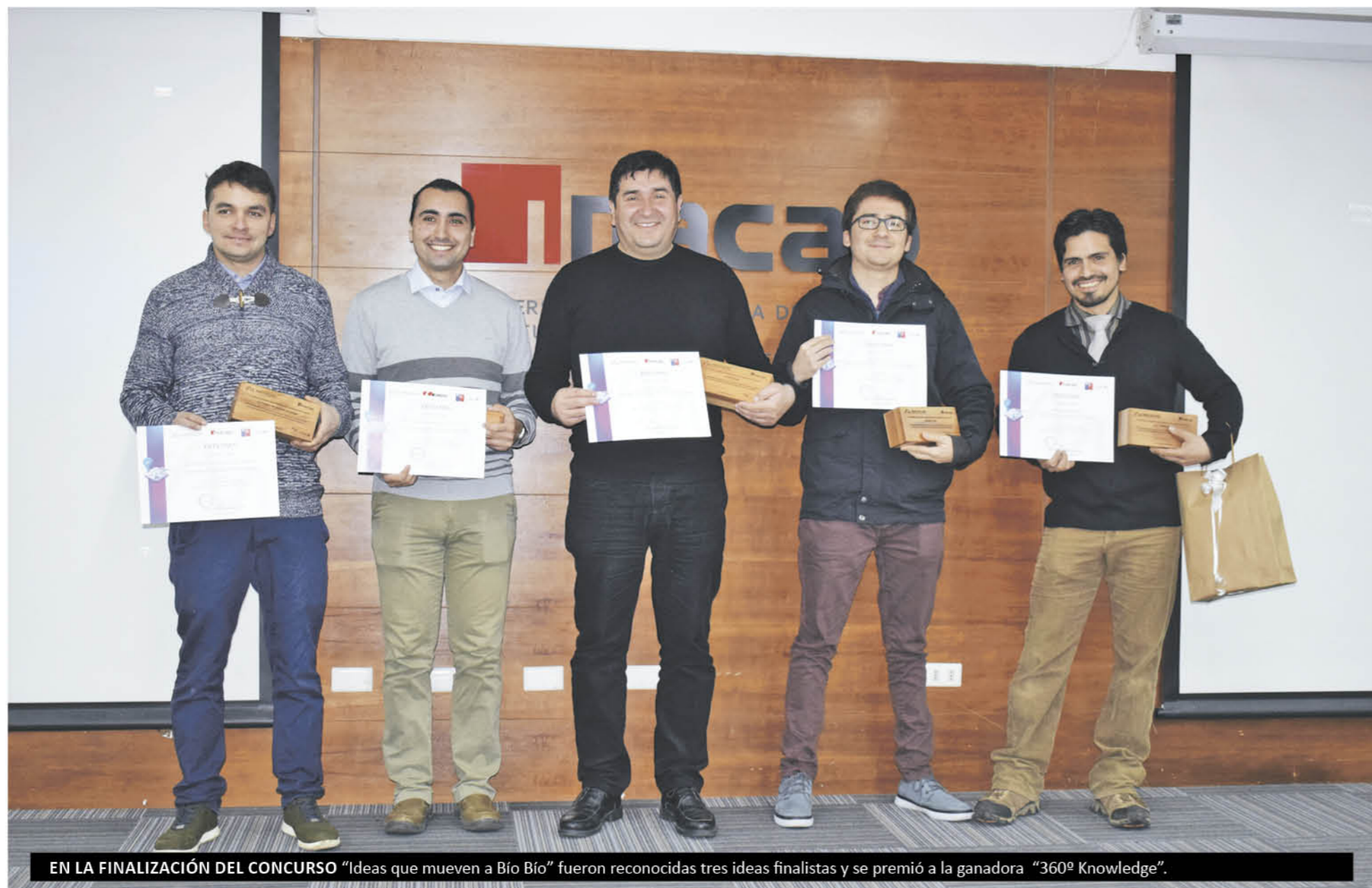
EN LA FINALIZACIÓN DEL CONCURSO "Ideas que mueven a Bío Bío" fueron reconocidas tres ideas finalistas y se premió a la ganadora "360º Knowledge".