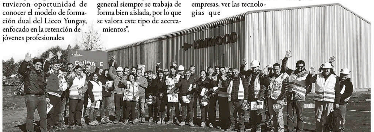
REGISTRO DE LA VISITA de los pequeños empresarios de la madera en las plantas Kimwood y Arauco.