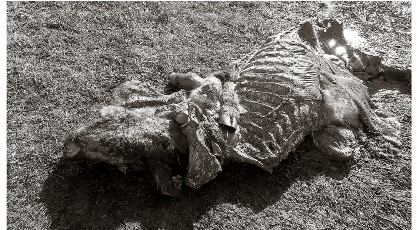
LOS RESTOS SON DEVORADOS por los jotes y muchas veces son encontrados gracias a estas aves.