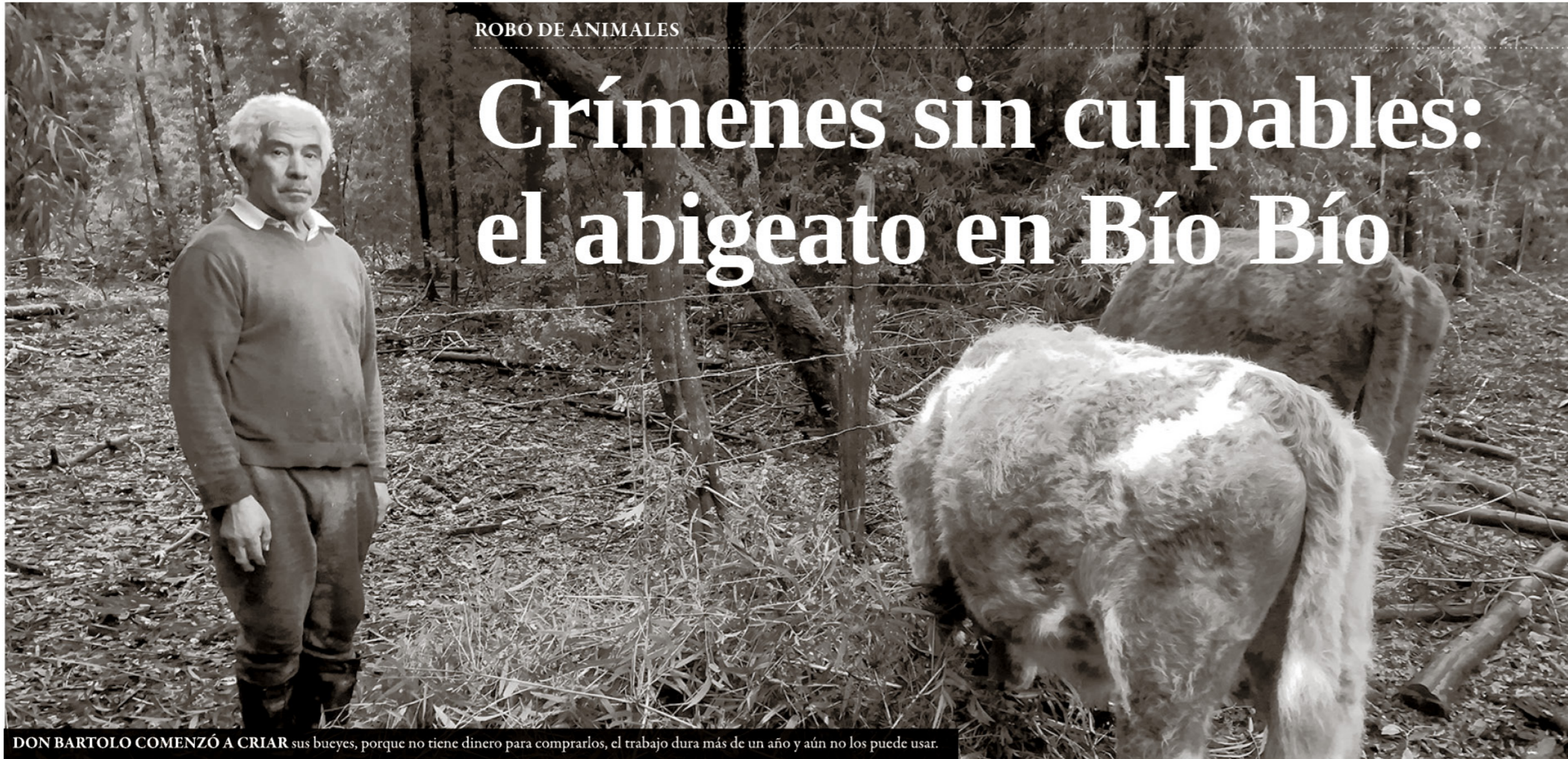
DON BARTOLO COMENZÓ A CRIAR sus bueyes, porque no tiene dinero para comprarlos, el trabajo dura más de un año y aún no los puede usar.

El mercado de la carne robada mueve varios millones de pesos al año y, aunque no hay certeza de bandas organizadas, lo cierto es que las víctimas identifican a los asesinos de sus animales con nombres, lugares donde viven y vehículos en los que se trasladan.