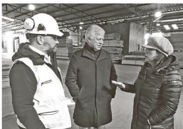
EL CONGRESISTA DEL PS pide que el gobierno intervenga.

Estos momentos de unión ante la adversidad del mercado son más que importantes, considerando que desde el año 2016 a la fecha son 35 las pymes madereras cerradas en la región.